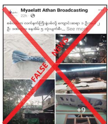
လိုအပ်သည့် နယ်မြေခံလုံခြုံရေးလုပ်ငန်း များ ဆောင်ရွက်နေစဉ်အကြမ်းဖက်သမား များက လုံခြုံရေးတပ်ဖွဲ့ဝင်များအား ထိခိုက်စေရန်နှင့် နယ်မြေတည်ငြိမ်

နေပြည်တော် ဇန်နဝါရီ ၁၇ စစ်ကိုင်းတိုင်းဒေသကြီး ယင်းမာပင် မြို့နယ် ကျောက်မှော်ကျေးရွာတွင် လုံခြုံ ရေးတပ်ဖွဲ့များက ဇန်နဝါရီ ၁၅ ရက်တွင် လက်နက်ကြီးဖြင့် ပစ်ခတ်မှုကြောင့် ပြည်သူ နှစ်ဦး ထိခိုက်ဒဏ်ရာရရှိပြီး နေအိမ် ငါးလုံး ပျက်စီးခဲ့သည်ဟု တရားမဝင် ပြည်ဖျက် မီဒီယာများက မဟုတ်မမှန် သတင်းတု၊ သတင်းအမှားများ ရေးသားဖြန့်ဝေလျက် ရှိကြောင်း တွေ့ရှိရသည်။ အဆိုပါသတင်းနှင့် ပတ်သက်၍ နယ်မြေခံလုံခြုံရေးတာဝန်ရှိသူ တစ်ဦးနှင့် ဆက်သွယ်မေးမြန်းချက်အရ လုံခြုံရေး တပ်ဖွဲ့ဝင်များအနေဖြင့် အဆိုပါမြို့နယ် အတွင်း တည်ငြိမ်အေးချမ်းမှုရရှိစေရေး