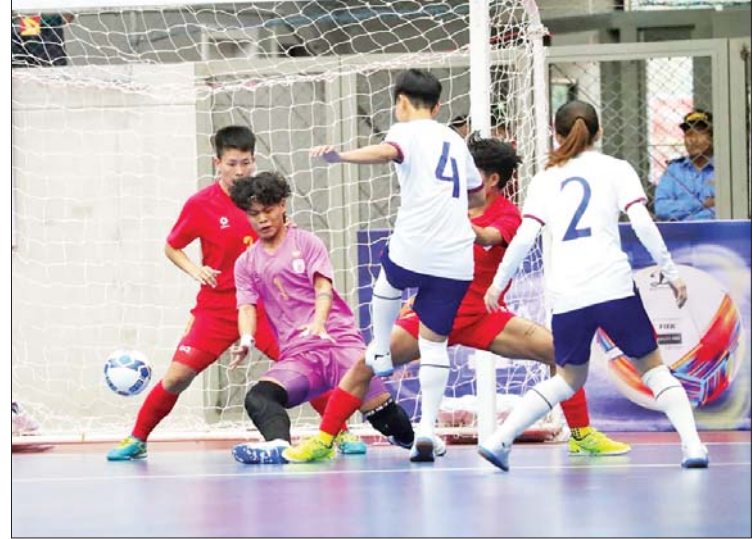
မြန်မာအသင်းနှင့် တရုတ်(တိုင်ပေ)အသင်းတို့ ယှဉ်ပြိုင်ကစားကြစဉ်။