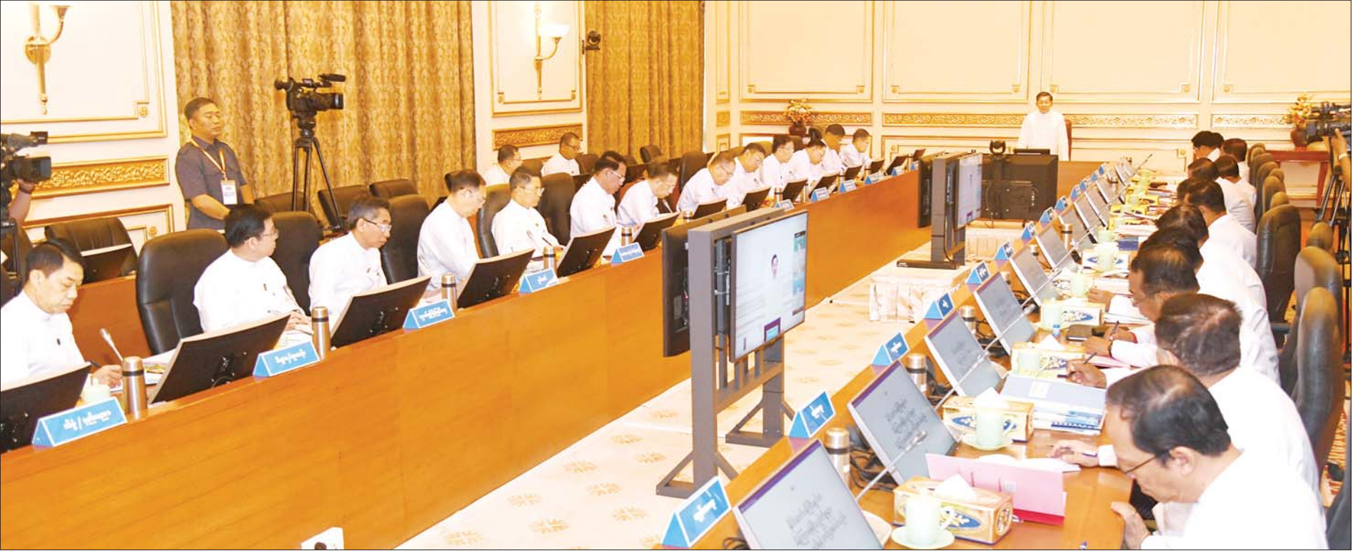
နိုင်ငံတော်စီမံအုပ်ချုပ်ရေးကောင်စီဥက္ကဋ္ဌ နိုင်ငံတော်ဝန်ကြီးချုပ် ဗိုလ်ချုပ်မှူးကြီးမင်းအောင်လှိုင် ပြည်ထောင်စုအစိုးရအဖွဲ့အစည်းအဝေးတွင် အမှာစကားပြောကြားစဉ်။

နိုင်ငံတော်စီမံအုပ်ချုပ်ရေးကောင်စီဥက္ကဋ္ဌ နိုင်ငံတော်ဝန်ကြီးချုပ် ဗိုလ်ချုပ်မှူးကြီးမင်းအောင်လှိုင် ပြည်ထောင်စုအစိုးရအဖွဲ့အစည်းအဝေးသို့ တက်ရောက်အမှာစကားပြောကြား အကြမ်းဖက်သမားများ၏ တိုက်ခိုက်မှုများကြောင့် ယာယီနေရပ်စွန့်ခွာနေကြရသည့် ပြည်သူများအတွက် အမျိုးသားသဘာဝဘေးအန္တရာယ်ဆိုင်ရာစီမံခန့်ခွဲရေးရန်ပုံငွေမှ လိုအပ်သည့်ထောက်ပံ့မှုများဆောင်ရွက်ပေးရန် စီစဉ်ဆောင်ရွက်