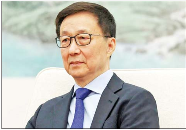
သောဆက်ဆံရေးကို ထူထောင်ရန် ရည်ရွယ်လျက်ရှိကြောင်း လေ့လာသူများက ပြောသည်။

ထရမ်၏ “အမေရိကန်သည်သာ ပထမ” ဟူသည့် မူဝါဒကို လက်ကိုင်ထားသည့် ဒေါ်နယ်ထရမ် ဦးဆောင်မည့် အစိုးရသစ်နှင့် ကုန်သွယ်ရေးဆိုင်ရာ သဘောထားကွဲလွဲမှုများ တိုးမြှင့်လာမည်အပေါ် စိုးရိမ်မှုများ မြင့်တက်လျက်ရှိသည်။ တရုတ်နိုင်ငံသည် အမေရိကန်နှင့် တည်ငြိမ်