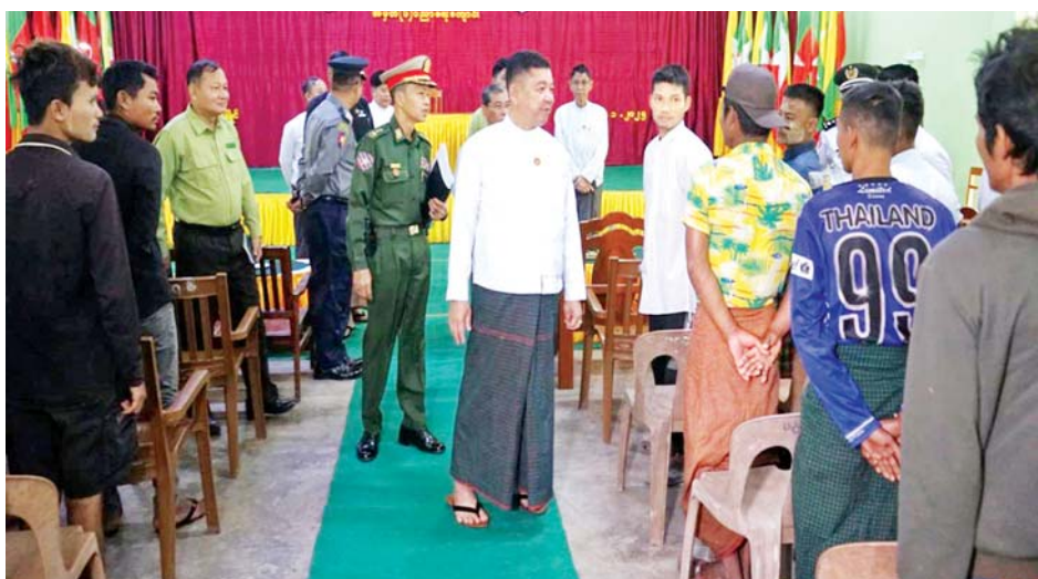
မွန်ပြည်နယ်ဝန်ကြီးချုပ် ဦးအောင်ကြည်သိန်း ပြည်သူ့စစ်မှုထမ်းသင်တန်းအမှတ်စဉ် (၉/၂၀၂၄) သို့ တက်ရောက်မည့် သင်တန်းသားများအား တွေ့ဆုံအားပေးစကားပြောကြားစဉ်။

တွေ့ဆုံစဉ် ပြည်နယ်ဝန်ကြီးချုပ်က အမှာစကားပြောကြားပြီး ပြည်သူ့စစ်မှုထမ်းသင်တန်းအမှတ်စဉ် (၉/၂၀၂၄)သို့ တက်ရောက်မည့် နိုင်ငံသားကောင်း ရတနာများအတွက် ဂုဏ်ပြုချီးမြှင့်ငွေများပေးအပ်သည်။ ထို့နောက် ပြည်နယ်