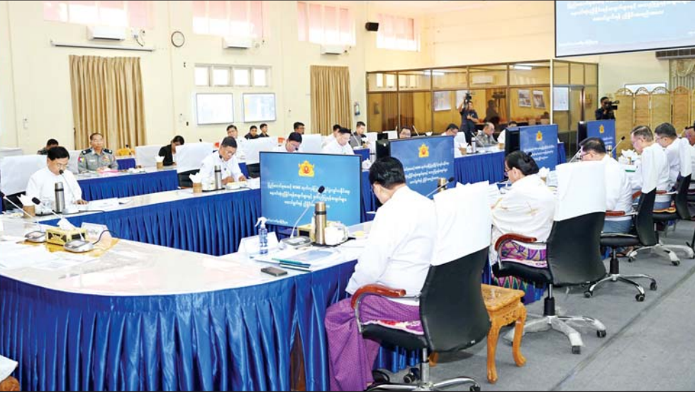
နိုင်ငံတော်စီမံအုပ်ချုပ်ရေးကောင်စီဒုတိယဥက္ကဋ္ဌ ဒုတိယဝန်ကြီးချုပ် ဒုတိယဗိုလ်ချုပ်မှူးကြီး စိုးဝင်း ပြည်ထောင်စုအဆင့် MSME ထုတ်ကုန်ပြပွဲနှင့် ပြိုင်ပွဲ ကျင်းပနိုင်ရေး ညှိနှိုင်းအစည်းအဝေးတွင် အမှာစကားပြောကြားစဉ်။