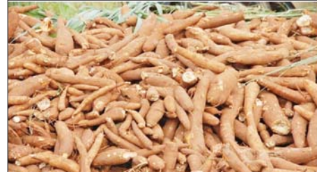
ဆောင်းပါး စာမျက်နှာ » ၈

ပီလောပီနံနှင့် အစာအဆိပ်သင့်ခြင်း အကြောင်း သိကောင်းစရာ