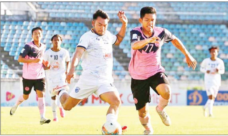
Dagon Port အသင်းနှင့် မဟာယူနိုက်တက်အသင်းတို့ ယှဉ်ပြိုင်ကစားကြစဉ်။

၂၀၂၄-၂၀၂၅ ရာသီ MNL အမှတ်ပေး ပြိုင်ပွဲ ပွဲစဉ် (၁၆) ပထမနေ့ကို ဇန်နဝါရီ ၁၇ ရက်က သုဝဏ္ဏကွင်း၌ ကျင်းပရာ Dagon Port အသင်းက မဟာယူနိုက်တက် တက်အသင်းကို သုံးဂိုး-နှစ်ဂိုးဖြင့် အနိုင် ရခဲ့သည်။