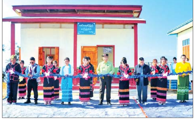
မြို့နယ်(ပြန်/ဆက်)

အမှာစကားပြောကြား ထို့နောက် မြို့နယ်စီမံအုပ်ချုပ်ရေးအဖွဲ့ ဥက္ကဋ္ဌ ဦးလှမျိုးက အမှာစကားပြောကြားပြီး မြို့နယ်ပြန်ကြားရေးနှင့် ပြည်သူ့