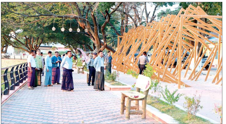
ညနေပိုင်းတွင် အများပြည်သူ အပန်းဖြေနေရာအဖြစ် အား လိုအပ်သည်များ လမ်းညွှန်မှာကြားခဲ့ကြောင်း တည်ဆောက်ထားသည့် ပြည်မြို့ ကမ်းနားလမ်းကို သိရသည်။ သွားရောက်ကြည့်ရှုစစ်ဆေးပြီး တာဝန်ရှိသူများ တိုင်းဒေသကြီး(ပြန်/ဆက်)

ဆက်လက်၍ တိုင်းဒေသကြီး ဝန်ကြီးချုပ်သည် တိုင်းဒေသကြီးအစိုးရအဖွဲ့ အစီအစဉ်ဖြင့် ပြည်မြို့ MSMEs ဒေသထွက်ကုန်များ အရောင်းစင်တာသို့ သွားရောက်ကြည့်ရှုအားပေးပြီး ဒေသအလိုက် ထွက်ကုန်များ မူရင်းဈေးအတိုင်း အမယ်စုံရောင်းချသွားနိုင်ရေး လမ်းညွှန်မှာကြားခဲ့သည်။ ယင်းနောက် တိုင်းဒေသကြီး ဝန်ကြီးချုပ်သည်