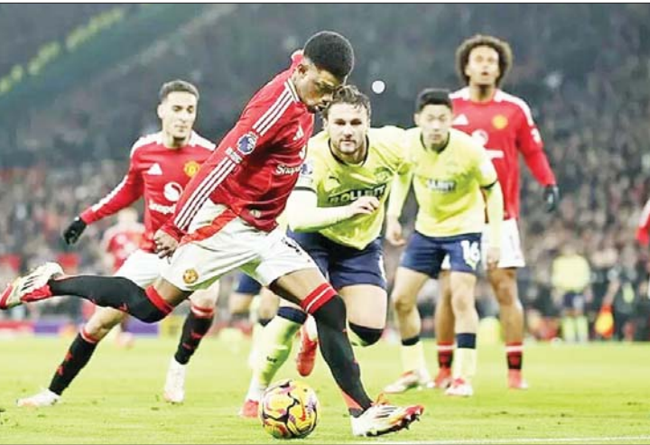
ဆောက်သမ်တန်အသင်းနှင့် မန်ယူအသင်းတို့ ယှဉ်ပြိုင်ကစားကြစဉ်။

မန်ယူအသင်းနဲ့ ဆောက်သမ်တန် အသင်းတို့ ဇန်နဝါရီ ၁၇ ရက်နံနက်ပိုင်းက ယှဉ်ပြိုင်ကစားခဲ့တဲ့ ပရီမီယာလိဂ်ပွဲစဉ်မှာ မန်ယူအသင်းက အိမ်ကွင်းဖြစ်တဲ့ အိုးထရက်ဖို့ဒ်မှာ သုံးဂိုး-တစ်ဂိုးဖြင့် အနိုင်ရရှိခဲ့ပါတယ်။ အဲဒီပွဲစဉ်မှာ မန်ယူအသင်းအတွက် သွင်းဂိုးတွေကို အာမက်ဒီယာလို တစ်ဦး တည်းက ဒုတိယပိုင်းပွဲကစားချိန် ၈၂ မိနစ်၊ မိနစ် ၉၀ နဲ့ သာမန်ပွဲကစားချိန်အပြီး နာကျင်အချိန်ပို လေးမိနစ်တို့မှာ ဟက်ထရစ် သွင်းယူပေးခဲ့တာဖြစ် ပြီး ဆောက်သမ်တန်အသင်းကတော့ စာမျက်နှာ ၁၂ ကော်လံ ၁ သို့ *