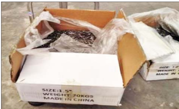
မြန်မာ့စက်မှုဆိပ်ကမ်း၌ သိမ်းဆည်းရမိမှု။

ထို့အတူ မကွေးတိုင်းဒေသကြီး တရားမဝင်ကုန်သွယ်မှုတိုက်ဖျက်ရေးအထူးအဖွဲ့၏ စီမံခန့်ခွဲမှုဖြင့် တာဝန်ကျပူးပေါင်းအဖွဲ့များက