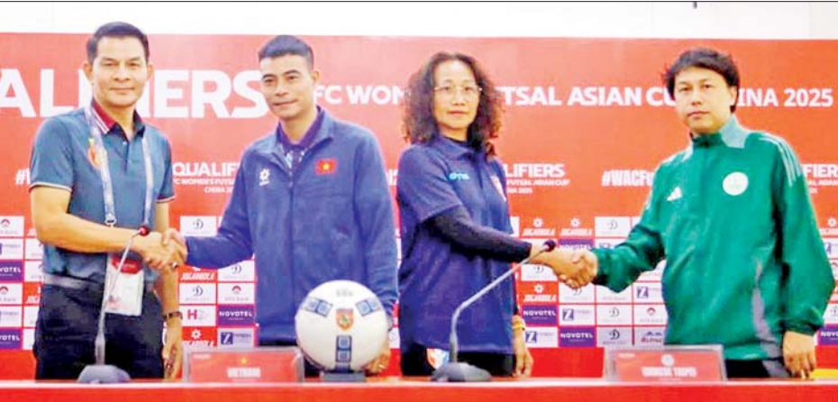
ခြေစစ်ပွဲ အုပ်စု(D)၌ ပါဝင်သော မြန်မာ၊ ဗီယက်နမ်၊ တရုတ်(တိုင်ပေ)နှင့် မကာအိုအသင်းတို့မှ နည်းပြချုပ်များကို တွေ့ရစဉ်။