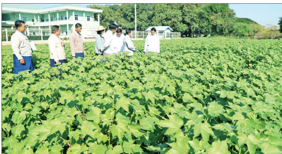
ဖြစ်သည့် ရွှေတောင်(၈)၊ ရွှေတောင်(၁၀) နှင့် ငွေချည်(၁၁) မျိုးသုံးမျိုး စုစုပေါင်း မျိုးခြောက်မျိုး ယှဉ်ပြိုင်စမ်းသပ်စိုက်ပျိုးထားရှိမှုတို့ကို အသေးစိတ်ကြည့်ရှုစစ်ဆေးပြီး လိုအပ်သည်များကို မှာကြားသည်။ မွေးမြူရေးသိပ္ပံကျောင်း၌ ယှဉ်ပြိုင်စမ်းသပ်

နေပြည်တော် ဇန်နဝါရီ ၁၄ စိုက်ပျိုးရေး၊ မွေးမြူရေးနှင့် ဆည်မြောင်းဝန်ကြီးဌာန ပြည်ထောင်စုဝန်ကြီးဦးမင်းနောင်သည် ယနေ့နံနက်ပိုင်းတွင် နေပြည်တော် ပျဉ်းမနားမြို့ရှိ စိုက်ပျိုးရေးနှင့် မွေးမြူရေးသိပ္ပံကျောင်း၌ ၂၀၂၅ ခုနှစ် မျိုးစေ့ပြပွဲကျင်းပရန် ပြင်ဆင်ဆောင်ရွက်နေမှုများကို ကြည့်ရှုစစ်ဆေးသည်။