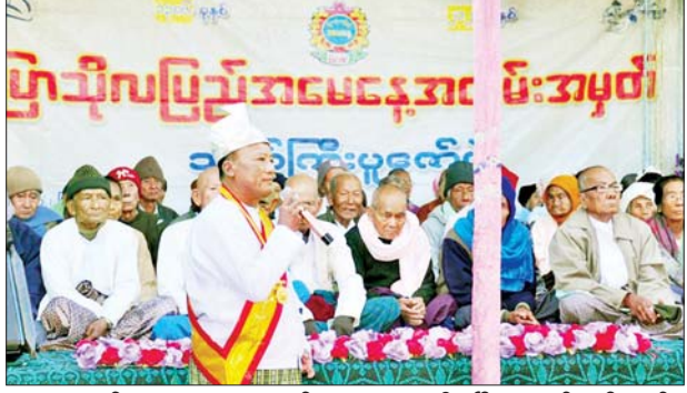
ဆရာတော်များအား ဆွမ်း၊ တံတားဦး၊ မြို့ဟောင်း၊ သီးကုန်း၊ ဘောဇဉ်နှင့်လှူဖွယ်များ ဆက်ကပ်အင်းပေါင်(တောင်ရွာ)၊ အင်းပေါင်လှူဒါန်းသည်။ ယင်းနောက် (မြောက်ရွာ)၊ ဝါးရုံတော(အရှေ့ရွာ)၊ မြို့လှတိုက်နယ်အတွင်းရှိ မြို့လှ၊ ဝါးရုံတော(အနောက်ရွာ)၊ သရက်

ရမည်းသင်း ဇန်နဝါရီ ၁၄ မန္တလေးတိုင်းဒေသကြီး ရမည်းသင်းမြို့နယ် မြို့လှကျေးရွာ၌ ပြာသိုလ်ပြည့်အမေနေ့ သက်ကြီးပူဇော်ပွဲအခမ်းအနားကို ယနေ့နံနက် ၈ နာရီခန့်က မြို့လှတောင်ကျောင်းတိုက်၌ စည်ကားသိုက်မြိုက်စွာ ကျင်းပသည်။ လှူဖွယ်များဆက်ကပ် ဦးစွာ မြို့လှတောင်ကျောင်းတိုက်အတွင်းရှိ ဒက္ခိဏရာမမဟာ မုနိဘုရားကြီးရှေ့တွင် ခင်ပွန်းကြီး ဆယ်ပါး ကန်တော့ပွဲကျင်းပပြီး