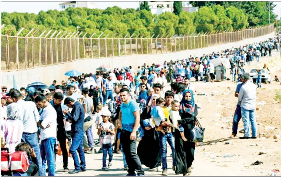
နိုင်ငံတစ်စတီပြိုကွဲပြီး အိုးမဲ့အိမ်မဲ့ဖြစ်ခဲ့ရသည့် ဆီးရီးယားပြည်သူများ။

ဆီးရီးယားပြိုကွဲခြင်းအကြောင်းရင်းမှာ အစိုးရ ဆန့်ကျင်ဘက် HTS အဖွဲ့က တော်လှန်လို့လည်း