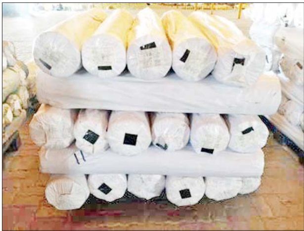
သီလဝါဆိပ်ကမ်း၌ ဖမ်းဆီးရမိမှု။

ဇန်နဝါရီ ၁၃ ရက်တွင် အကောက်ခွန်ဦးစီးဌာန၏ စီမံခန့်ခွဲမှုဖြင့် တာဝန်ကျပူးပေါင်းအဖွဲ့များက စစ်ဆေးမှုများဆောင်ရွက်ခဲ့ရာ မြန်မာ့စက်မှုဆိပ်ကမ်း၌ ကုန်သေတ္တာနှစ်လုံးအတွင်းမှ တရားဝင်စာရွက်စာတမ်း အထောက်အထား တင်ပြနိုင်ခြင်းမရှိသည့် လုပ်ငန်းသုံးပစ္စည်းငါးမျိုး (ခန့်မှန်းတန်ဖိုးငွေ ၃၇၅၂၄၇၅၂ ကျပ်) ကိုလည်းကောင်း၊ သီလဝါဆိပ်ကမ်း၌ ကုန်သေတ္တာတစ်လုံးအတွင်းမှ တရားဝင်စာရွက်စာတမ်း အထောက်အထား တင်ပြနိုင်ခြင်းမရှိသည့် လုပ်ငန်းသုံးပစ္စည်းတစ်မျိုး (ခန့်မှန်းတန်ဖိုးငွေကျပ် ၁၆၅၃၇၆၈၀၀) ကိုလည်းကောင်း၊ မရမ်းချောင်းမြစ်တစ်ဖက်စစ်ဆေးရေးစခန်း၌ ကျိုက်ထိုမြို့မှ ရန်ကုန်မြို့သို့ မောင်းနှင်လာသော ယာဉ်တစ်စီးပေါ်မှ တရားဝင်စာရွက်စာတမ်း အထောက်အထား တင်ပြနိုင်ခြင်းမရှိသည့် စားသောက်ကုန်ပစ္စည်းတစ်မျိုး (ခန့်မှန်းတန်ဖိုးငွေကျပ် ၆၃၈၄၀၀၀)နှင့် အဆိုပါပစ္စည်းများတင်ဆောင်လာသည့် Yutong Bus တစ်စီး (ခန့်မှန်းတန်ဖိုးငွေကျပ် ၆၀၀၀၀၀၀) ကိုလည်းကောင်း စုစုပေါင်း ခန့်မှန်းတန်ဖိုးငွေ ၂၆၂၅၅၅၅၅၂ ကျပ်ကို သိမ်းဆည်းရမိခဲ့ပြီး အကောက်ခွန်လုပ်ထုံးလုပ်နည်းများနှင့်အညီ အရေးယူဆောင်ရွက်လျက်ရှိသည်။