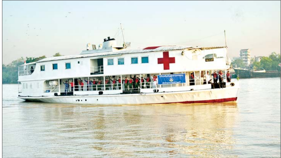
တပ်မတော်မြစ်တွင်းသွားဆေးရုံရေယာဉ်(ရွှေပုဇွန်) ကျန်းမာရေးစောင့်ရှောက်မှုလုပ်ငန်းများ ဆောင်ရွက်ပေးရန် ရန်ကုန်မြို့မှ ထွက်ခွာစဉ်။

အလားတူ တပ်မတော်အထူးကုဆေးအဖွဲ့ဝင်များ ပါဝင်သည့် တပ်မတော်ပင်လယ်သွား ဆေးရုံရေယာဉ်(သံလွင်)ဖြင့် ၂၀၁၆ ခုနှစ်မှစ၍ မြန်မာ့ပင်လယ်ကမ်းရိုးတန်းဒေသများနှင့် ပတ်ဝန်းကျင်ကျေးရွာများရှိ ဒေသခံပြည်သူများအား ကျန်းမာရေးစောင့်ရှောက်မှုလုပ်ငန်းများ ဆောင်ရွက်ပေးလျက်ရှိရာ ယခုခရီးစဉ်သည် (၁၈)ကြိမ်မြောက်ဖြစ်ပြီး (၁၇)ကြိမ်မြောက်အထိ ဒေသခံပြည်သူစုစုပေါင်း ၁၅၇၀၈၇ ဦးတို့ကို ကျန်းမာရေးစောင့်ရှောက်မှုလုပ်ငန်းများ ဆောင်ရွက်ပေးနိုင်ခဲ့ကာ ဆေးရုံရေယာဉ်ပေါ်ရှိသားဖွားခန်း၌ ကိုယ်ဝန်ဆောင်မိခင် ၂၁ ဦးတို့အား အောင်မြင်စွာ မွေးဖွားပေးနိုင်ခဲ့ကြောင်း သိရသည်။ သတင်းစဉ်