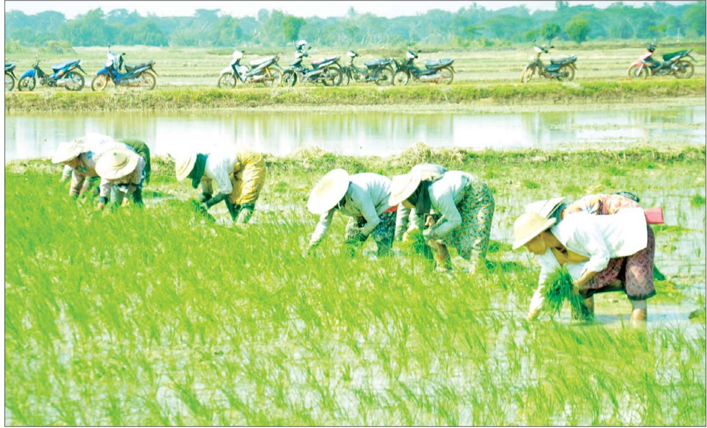
ထန်းတပင်မြို့နယ်၌ နွေစပါးစိုက်ပျိုးနေမှုကို တွေ့ရစဉ်။