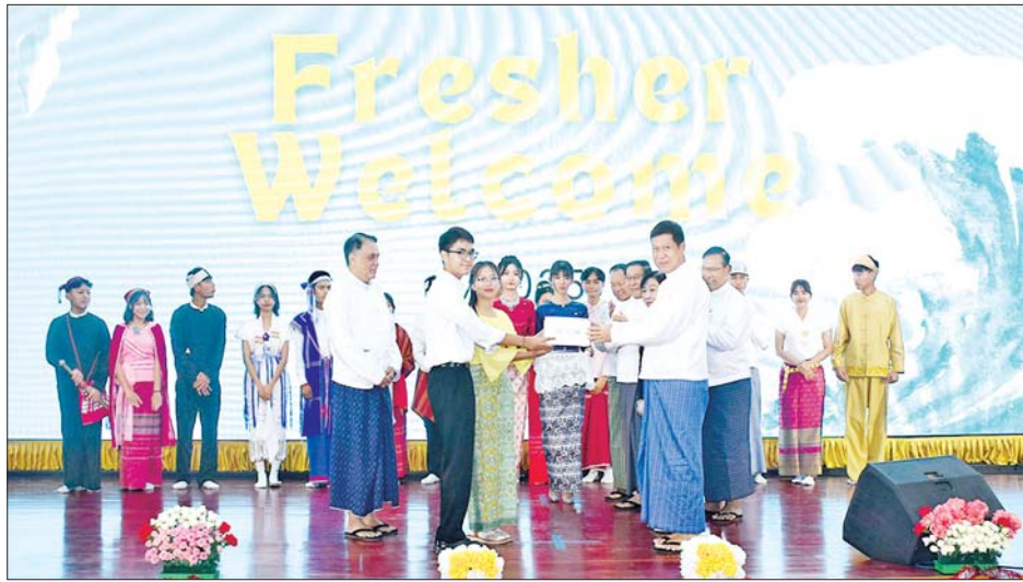
အမြစ်များ ဖွံ့ဖြိုးတိုးတက်ရေးအတွက် ကဏ္ဍပေါင်းစုံ၊ သက်ဆိုင်သည့်အတတ်ပညာရှင် အလုပ်ဖြစ်ပါကြောင်း၊ ဆေးပညာတတ်ကျွမ်းမှုတစ်ခုတည်းနှင့် မလုံလောက်ဘဲ ခံယူချက်သဘောထားမှန်ကန်၍ ဆေးပညာရှင်များသည် လူသားတို့၏အသက်နှင့်

မန္တလေး ဇန်နဝါရီ ၁၄ ဆေးတက္ကသိုလ်(မန္တလေး) ဆေးပညာပထမနှစ် (၁/၂၀၂၅)တွင် ပညာသင်ကြားနေသော ကျောင်းသား ကျောင်းသူများ၏ မောင်မယ်သစ်လွင်ကြိုဆိုပွဲ အခမ်းအနားကို ယနေ့နံနက်ပိုင်းက ချမ်းအေးသာစံ မြို့နယ်ရှိ ဆေးတက္ကသိုလ်(မန္တလေး) ဇီဝကခန်းမ (မန်းရတနာပုံ)၌ ကျင်းပသည်။ အခမ်းအနားသို့ မန္တလေးတိုင်းဒေသကြီးဝန်ကြီးချုပ် ဦးမျိုးအောင်၊ တိုင်းဒေသကြီး တရားလွှတ်တော်တရားသူကြီးချုပ်၊ တိုင်းဒေသကြီးဝန်ကြီးများနှင့် တာဝန်ရှိသူများ၊ ဆေးတက္ကသိုလ်(မန္တလေး) ပါမောက္ခချုပ်နှင့်ဆေးနိုး နွယ်တက္ကသိုလ်များမှ ပါမောက္ခချုပ်များ၊ ဆရာ ဆရာမများ၊ ကျောင်းသား ကျောင်းသူများနှင့် ဖိတ်ကြားထားသည့် ဧည့်ပရိသတ်များတက်ရောက်ကြသည်။