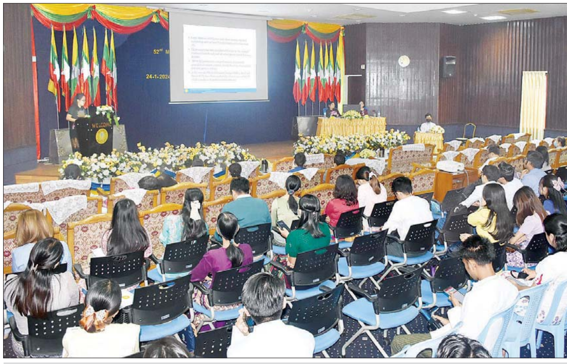
(၅၃)ကြိမ်မြောက် မြန်မာနိုင်ငံ ကျန်းမာရေးဆိုင်ရာသုတေသနညီလာခံ ကျင်းပစဉ်။

ကျန်းမာရေးဝန်ကြီးဌာနက ကြီးမှူး၍ “သုတေသနညီလာခံများ အစဉ်အလာ မပျက် ကျင်းပခြင်းအားဖြင့် ကျန်းမာ ရေးဆိုင်ရာအသိပညာများ တိုးတက်လာ ပြီး ကျန်းမာရေးစောင့်ရှောက်မှုအဆင့် အတန်းမြင့်မားလာစေရန်” နှင့် “သုတေ သနတွေ့ရှိချက်များကို လက်တွေ့အသုံးချ မည့်ကျန်းမာရေးပညာရှင်များ သိရှိ ဆွေးနွေးနိုင်စေရန်” စသည့် ရည်ရွယ် ချက်များဖြင့် “(၅၃)ကြိမ်မြောက် မြန်မာ နိုင်ငံကျန်းမာရေးဆိုင်ရာ သုတေသန ညီလာခံ” ကို ၂၀၂၅ ခုနှစ် ဇန်နဝါရီလ ၂၀ ရက်နေ့မှ ၂၄ ရက်နေ့အထိ ရန်ကင်းမြို့၊ ဒဂုံမြို့နယ် အမှတ်-၅ ဇီဝက လမ်းရှိ ဆေးသုတေသနဦးစီးဌာန (ရုံးချုပ်)တွင် ကျင်းပမည်ဖြစ်ပါသည်။ မြန်မာ့သုတေသီများ၏ ကျန်းမာရေး သုတေသနလုပ်ငန်းများမှ တွေ့ရှိချက် ရလဒ်များကို သုတေသနစာတမ်းများဖြင့် ဖတ်ကြားတင်သွင်းခြင်း၊ ပိုစတာများ ပြသခြင်းတို့ဖြင့် ညီလာခံကို ကျင်းပ ဆောင်ရွက်သွားမည်ဖြစ်ပါသည်။