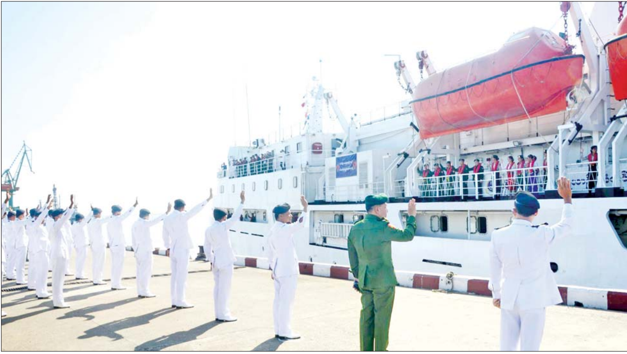
တပ်မတော်ပင်လယ်သွားဆေးရုံရေယာဉ်(သံလွင်) ကျန်းမာရေးစောင့်ရှောက်မှုလုပ်ငန်းများ ဆောင်ရွက်ပေးရန် ရန်ကုန်မြို့မှ ထွက်ခွာစဉ်။