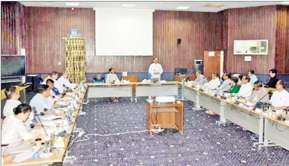
အဖွဲ့ဝင်အသစ်များ ရွေးချယ် မိမိတို့ ဆေးပညာရပ်ပိုင်းဆိုင်ရာများကို သွေးရမည်ဖြစ်ရာ မြန်မာနိုင်ငံ အကျိုးအတွက် ကျေပွန်စွာ ကြရန်ဖြစ်ကြောင်း၊ မြန်မာနိုင်ငံ ဆေးကောင်စီအနေဖြင့် ဆရာဝန်

ရန်ကုန် ဇန်နဝါရီ ၁၂ ကျန်းမာရေး ဝန်ကြီးဌာန ပြည်ထောင်စုဝန်ကြီး ဒေါက်တာ သက်ဆိုင်ဝင်းသည် ယနေ့နံနက်ပိုင်းတွင် ရန်ကုန်မြို့ ဆေးသုတေသန ဦးစီးဌာန၌ ကျင်းပသော မြန်မာနိုင်ငံဆေးကောင်စီ အလုပ်အမှုဆောင်အဖွဲ့ အစည်းအဝေး (၁/၂၀၂၅)သို့ တက်ရောက်သည်။ အစည်းအဝေးတွင်ပြည်ထောင်စုဝန်ကြီးက မြန်မာနိုင်ငံဆေးကောင်စီ၏ လက်ရှိအလုပ်အမှုဆောင်အဖွဲ့အနေဖြင့် ဒုတိယလေးနှစ်တာသက်တမ်း ကုန်ဆုံးတော့မည်ဖြစ်သဖြင့် မကြာမီကာလအတွင်း တတိယလေးနှစ်တာကာလ အလုပ်အမှုဆောင်