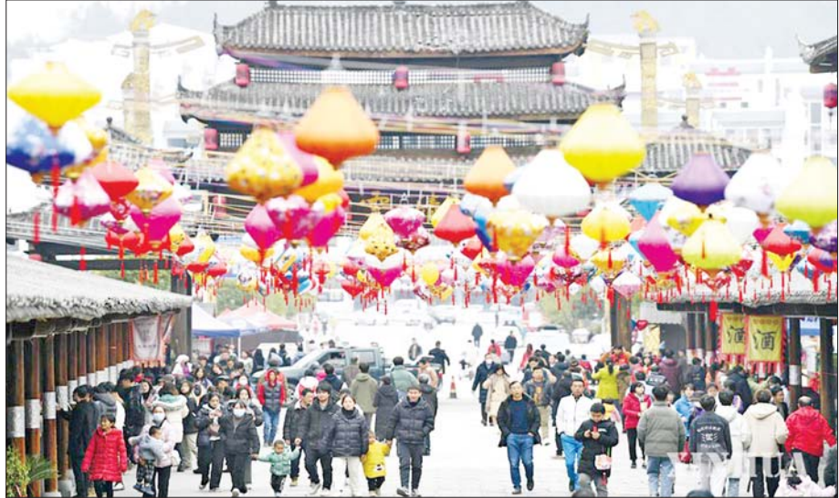
တရုတ်နိုင်ငံအနောက်တောင်ပိုင်း ကွေကျိုးပြည်နယ် Jiuzhou ရေးဟောင်းမြို့သို့ လာရောက်လည်ပတ်သူများကို တွေ့ရစဉ်။

ခရီးသွားလုပ်ငန်း ပြန်လည်ဖွံ့ဖြိုးတိုးတက်လာ သည့်အပြင် ကမ္ဘာ့စီးပွား၏ ဖွံ့ဖြိုးတိုးတက်မှုမြှင့်တက် လာမည်ဖြစ်သည်။ ။ ကိုးကား-ဆင်ဟွာ