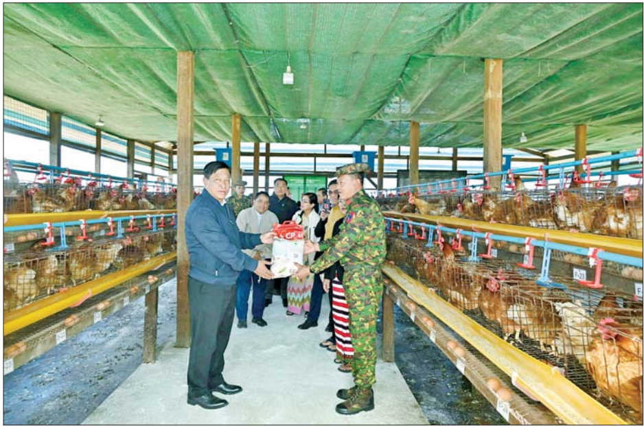
နိုင်ငံတော်စီမံအုပ်ချုပ်ရေးကောင်စီအဖွဲ့ဝင် ဒုတိယဝန်ကြီးချုပ်နှင့် ပြည်ထောင်စုဝန်ကြီး ဗိုလ်ချုပ်ကြီး တင်အောင်စန်း ပူတာအိုမြို့နယ်အတွင်းရှိ တပ်နယ် ဧက ၅၀၀ ဘက်စုံစိုက်ပျိုးမွေးမြူရေးခြံ (နမ့်တာလဲ) တွင် မွေးမြူရေးအထောက်အကူပြုဆေးဝါးများနှင့် စွမ်းအားပြည့် ဖြည့်စွက်အစာအိတ်များ ပေးအပ်စဉ်။

များ၊ ဒေသခံပြည်သူများနှင့်တွေ့ဆုံ ပွဲအခမ်းအနားသို့ တက်ရောက် သည်။ ထိုသို့တွေ့ဆုံစဉ် ခရိုင်စီမံ အုပ်ချုပ်ရေးအဖွဲ့ဥက္ကဋ္ဌ ဦးစိုးထွန်း က ပူတာအိုဒေသဆိုင်ရာ အချက် အလက်များကို လည်းကောင်း၊ မြို့မိ မြို့ဖများ၊ တိုင်းရင်းသားရိုးရာ ယဉ်ကျေးမှုအဖွဲ့ ခေါင်းဆောင်များ က ဒေသဖွံ့ဖြိုးတိုးတက်ရေးဆိုင်ရာ လိုအပ်ချက်များကို လည်းကောင်း တင်ပြကြရာ သက်ဆိုင်ရာကဏ္ဍ အလိုက် ခရိုင်အဆင့်ဌာနဆိုင်ရာ တာဝန်ရှိသူများက ပြန်လည် ရှင်းလင်းဆွေးနွေးကြသည်။ စာမျက်နှာ ၄ သို့ ❦