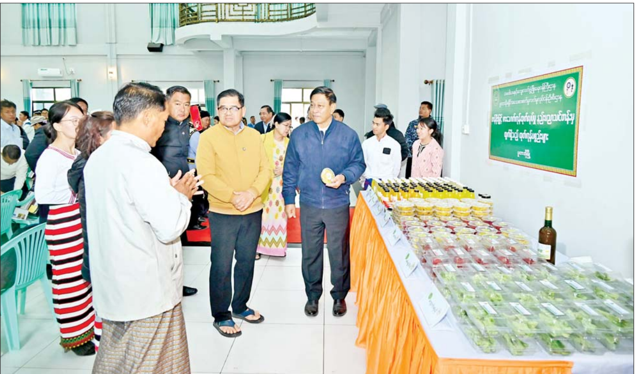
နိုင်ငံတော်စီမံအုပ်ချုပ်ရေးကောင်စီအဖွဲ့ဝင် ဒုတိယဝန်ကြီးချုပ်နှင့် ပြည်ထောင်စုဝန်ကြီး ဗိုလ်ချုပ်ကြီးတင်အောင်စန်းနှင့် အဖွဲ့ဝင်များ ပူတာအိုမြို့ ဖုန်ကန်ရာဇီခန်းမ၌ ခင်းကျင်းပြသထားသည့် ဒေသထွက် အသင့်စားထုတ်ကုန်ပစ္စည်းများကို ကြည့်ရှုအားပေးစဉ်။

ယင်းနောက် ဒုတိယဝန်ကြီးချုပ် နှင့် ပြည်ထောင်စုဝန်ကြီး ဗိုလ်ချုပ် ကြီးတင်အောင်စန်းနှင့် အဖွဲ့ဝင်များသည် ဘာသာရေးအဖွဲ့ ၁၃ ဖွဲ့အတွက် ဂုဏ်ပြုချီးမြှင့်ငွေများ၊ ဝန်ထမ်းများအတွက် အခြေခံစားသောက်ကုန်များ၊ ပူတာအိုမြို့နယ်နှင့် မချမ်းဘောမြို့နယ် ပြည်သူ့လုံခြုံရေးနှင့် အကြမ်းဖက်နှိမ်နင်းရေးအဖွဲ့များအတွက် ချီးမြှင့်ငွေများ၊ စာပေနှင့် ယဉ်ကျေးမှုအဖွဲ့များအတွက် DTH စလောင်းအစုံ ၃၀၊ တောင်သူများအတွက် အစေ့ထုတ်ပြောင်းနှင့် ဟင်းသီးဟင်းရွက်မျိုးစေ့အိတ်များ၊ အိမ်သုံး ဆိုလာအစုံ ၅၀၊ နိုင်ငံတော်မှ အခမဲ့ပေးအပ်သည့် ကျောင်းသုံးဗလာစာအုပ်များ ချီးမြှင့်ပေးအပ်ကြပြီး ခန်းမအတွင်း ခင်းကျင်းပြသထားသည့် ဒေသထွက် အသင့်စားထုတ်ကုန်ပစ္စည်းများကို ကြည့်ရှုအားပေးကြသည်။ ဆက်လက်၍ ပူတာအိုမြို့မရပ်ကွက်အတွင်းရှိ နယ်စပ်ရေးရာဝန်ကြီးဌာန ပညာရေးနှင့် လေ့ကျင့်ရေးဦးစီးဌာန နယ်စပ်ဒေသ ဆရာ ဆရာမများ၊ ကျောင်းသားတိုင်းရင်းသားလူငယ်များ ဖွံ့ဖြိုးရေးသင်တန်းကျောင်း (ပူတာအို)၌