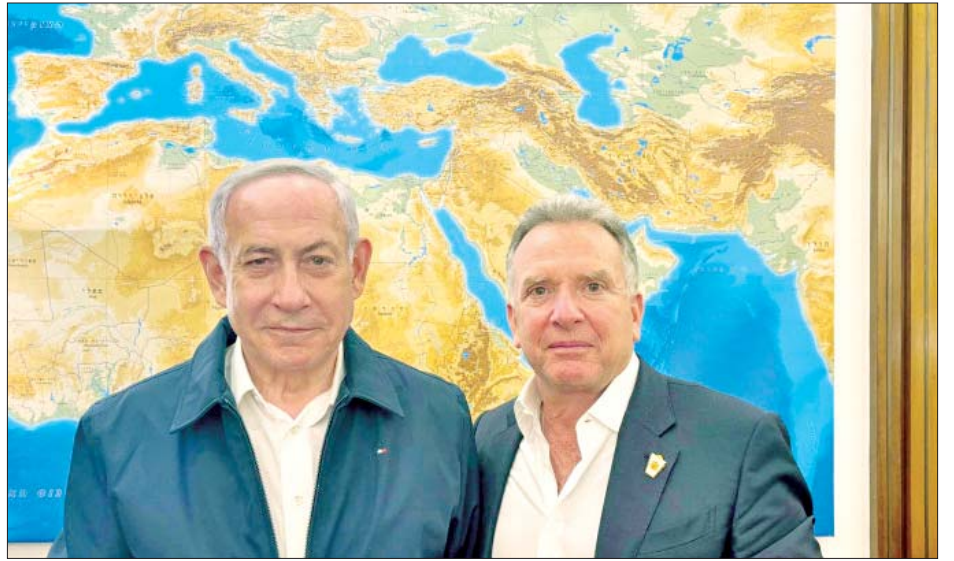
ဖြစ်ကြောင်း သတင်းရင်းမြစ်များကို ကိုးကား၍ ဦးအထိ ရိုလာကြောင်း ဒေသန္တရကျန်းမာရေးအရာရှိ ပြည်တွင်းမီဒီယာများက သတင်းဖော်ပြသည်။ များက ပြောကြားသည်။ ဂါဇာ၌ ၂၀၂၃ ခုနှစ် အောက်တိုဘာလမှစတင်၍ လက်ရှိအချိန်အထိ သေဆုံးသူအရေအတွက် ၄၆၅၃၇ ကိုးကား - အင်န်အိတ်ချ်ကော့စ် ဘာသာပြန် - အောင်ကျော်ကျော်

အစွဲအမတ်ကြီးချုပ်ရုံးက ပြောကြားသည်။ ပြောကြား ရွေးကောက်ခံသမ္မတ ဒေါ်နယ်ထရမ် ရာထူး တာဝန်များ ထမ်းဆောင်ရန် ကျမ်းသစ္စာကျိန်ဆိုမည့် ဇန်နဝါရီ ၂၀ ရက်မတိုင်မီ ဟားမတ်စ်က ဓားစာခံများ ကို လွှတ်ပေးခြင်းမရှိပါက ကြီးမားသောပေးဆပ်မှုနှင့် ရင်ဆိုင်ရမည်ဖြစ်ကြောင်း ရွေးကောက်ခံသမ္မတ ဒေါ်နယ်ထရမ်က မကြာသေးမီက ပြောကြားခဲ့သည်။ နေတန်ယာဟုက မော့ဆက်ထောက်လှမ်းရေး အေဂျင်စီအကြီးအကဲနှင့် အခြားအရာရှိများကို ကာတာနိုင်ငံသို့ စေလွှတ်ထားကြောင်းလည်း အစွဲအမတ်ကြီးချုပ်ရုံးက ပြောကြားသည်။ စေ့စပ်ညှိနှိုင်းမှုတွင် တိုးတက်မှုအချို့ရှိနေပြီ