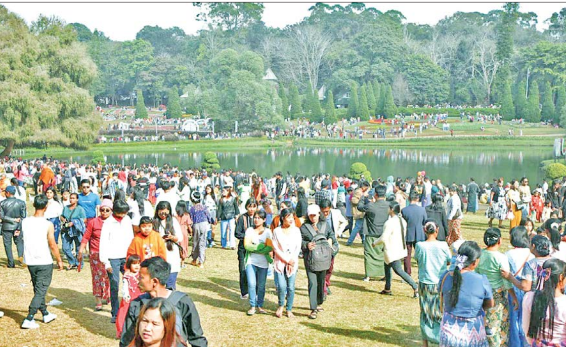
ပြင်ဦးလွင်မြို့ အမျိုးသားကန်တော်ကြီးဥယျာဉ်သို့ လာရောက်လည်ပတ်ကြသူများကို တွေ့ရစဉ်။

မန္တလေး ဇန်နဝါရီ ၁၂ ပြင်ဦးလွင်မြို့ရှိ အမျိုးသားကန်တော်ကြီးဥယျာဉ်၏ နှစ်(၁၀၀)ပြည့် အထိမ်းအမှတ် (၁၇)ကြိမ်မြောက် ပန်းပွဲတော်(Floral Fantasia 2024)သို့ ပြည်တွင်းပြည်ပမှ ခရီးသွားဧည့်သည်များ အေးချမ်းပျော်ရွှင်စွာ လာရောက်အပန်းဖြေသူများဖြင့် နေ့စဉ်စည်ကားလျက်ရှိကြောင်း သိရသည်။