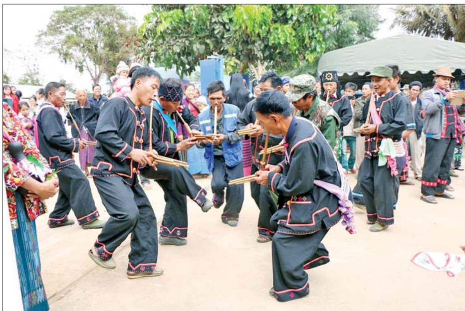
အကအဖွဲ့များက အဖွဲ့လိုက် သက်ကြီးဝါကြီးနှင့် အကြည်ညိုခံ ပုဂ္ဂိုလ်တို့အား ရိုးရာလက်ဆေး မင်္ဂလာကျင်းပကြသည်။ လားဟူ တိုင်းရင်းသားများသည် ရာသီနှစ်တစ်နှစ်တာအား တိရစ္ဆာန်အကောင် ၁၂ ကောင်တို့ဖြင့် သတ်မှတ်ထားရှိရာ ယခင်နှစ် ၂၀၂၄ ခုနှစ် ယုန်နှစ်မှ ယခုနှစ်

တာလေ ဇန်နဝါရီ ၁၂ လားဟူတိုင်းရင်းသားများ၏ ရိုးရာဓလေ့ထုံးတမ်းအစဉ်အလာများနှင့်အညီ ရှေးအစဉ်အဆက်က နှစ်သစ်ကူးပွဲတော်များကို မိမိတို့ နေထိုင်ရာ တောင်ပေါ်၊ မြေပြန့် ဒေသအလိုက် နှစ်စဉ်အစဉ်အလာ မပျက် ကျင်းပပြုလုပ်ရာ လားဟူနှစ်သစ်ကူးပွဲတော်ကို ရှမ်းပြည်နယ် (အရှေ့ပိုင်း) တာချီလိတ်မြို့နယ် မိုင်းကိုးကျေးရွာအုပ်စု မော်ဝန်းရွာ၌ ဇန်နဝါရီ ၁၁ ရက် မွန်းလွဲပိုင်းက ကျင်းပသည်။