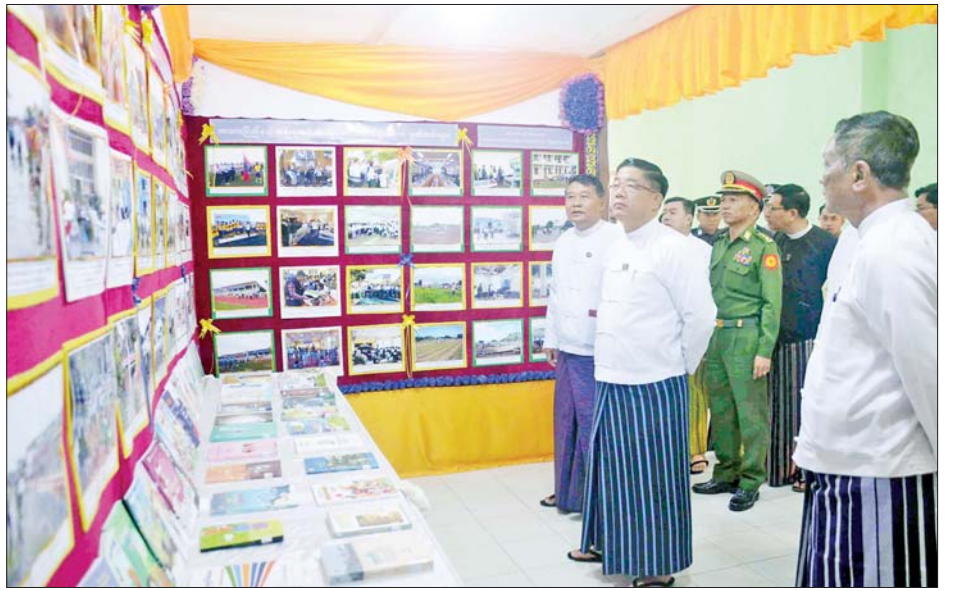
ရိုးရာ အစားအစာနှင့် ရိုးရာအဝတ်အထည်အရောင်း တစ်လျှောက် နေ့စဉ်ခင်းကျင်းပြသသွားမည်ဖြစ် ဆိုင်တို့အား ခင်းကျင်းပြသလျက်ရှိပြီး ပွဲတော်ကာလ ကြောင်း သိရသည်။ ပြည်နယ်(ပြန်/ဆက်)

(၇၃)နှစ်မြောက် ကယားပြည်နယ်နေ့ အထိမ်းအမှတ် ဌာနဆိုင်ရာနှင့် MSME ပြခန်း ၁၆ ခန်း၊ ကယား