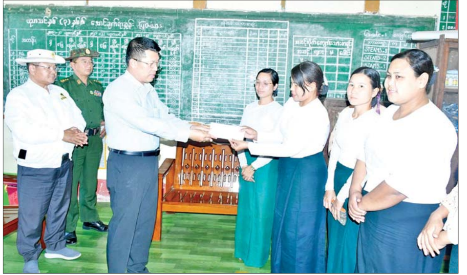
ပုသိမ်-ရှေ့ပြာ-ချောင်းသာလမ်း ၁၈/၀ မိုင်မှ ၃၅/၀ မိုင်အတွင်း ပေ ၄၀ အကျယ် လမ်းတာပေါင်ချုံ့ခြင်း၊ ၂၄ ပေအကျယ် ကတ္တရာခင်းခြင်းလမ်းအဆင့်မြှင့်တင် ခြင်းလုပ်ငန်းဆောင်ရွက်နေမှုများကို ကြည့်ရှု