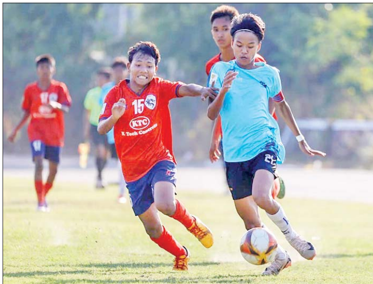
Mar Rein အသင်းနှင့် Yangon Focus အသင်းတို့ ယှဉ်ပြိုင်ကစားကြစဉ်။

နှစ်ပွဲဆက်အနိုင်ရ ဒုတိယနေ့တွင် Mar Rein အသင်းက Yangon Focus အသင်းကို ငါးဂိုး-တစ်ဂိုး၊ အာသာဝတီအသင်းက ရွှေပြည်သာ ယူနိုက်တက်အသင်းကို သုံးဂိုး-တစ်ဂိုးဖြင့် အနိုင်ရခဲ့သည်။ ပွဲစဉ်(၂)အပြီးတွင် Mar Rein အသင်းနှင့် ရွှင်ရယ်ရန်ကုန်အသင်း သာ နှစ်ပွဲဆက်အနိုင်ရခဲ့သည်။ စာမျက်နှာ ၂၆ ကော်လံ ၁ သို့ ○