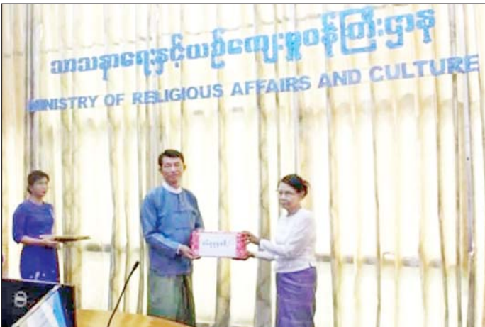
ရှေးဟောင်းဝတ္ထုပစ္စည်းများအပ်နှံခြင်းအတွက် ဆုကြေးငွေနှင့် ဂုဏ်ပြုမှတ်တမ်းလွှာများ ပေးအပ်စဉ်။