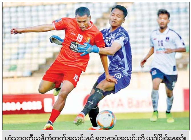
ဟံသာဝတီယူနိုက်တက်အသင်းနှင့် ရတနာပုံအသင်းတို့ ယှဉ်ပြိုင်နေစဉ်။