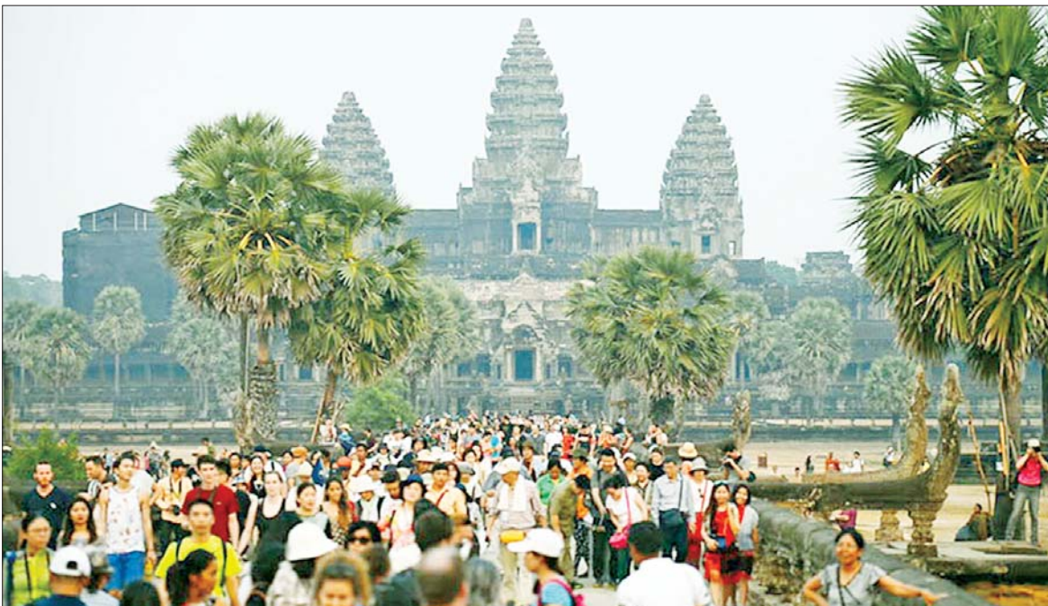
ကမ္ဘာ့စီးပွားနိုင်ငံ အန်ကောဝပ် ဘုရားကျောင်းသို့ လာရောက်လည်ပတ်သည့် ပြည်တွင်း ပြည်ပခရီးသွားများကို တွေ့ရစဉ်။

တရုတ်နိုင်ငံ ပေကျင်းမြို့တော် အပြည်ပြည်ဆိုင်ရာလေဆိပ်နှင့် ပေကျင်း ဒိုက်ဇင်အပြည်ပြည်ဆိုင်ရာလေဆိပ်များတွင် ပြည်ပခရီးသွားများအတွက် ယခုနှစ်မှစတင်၍ ဝန်ဆောင်မှုပေးသည့် ကောင်တာများ ဖွင့်လှစ်ခဲ့ကြောင်း သိရသည်။