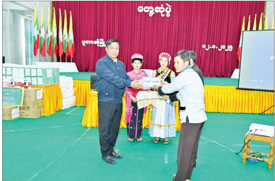
နိုင်ငံတော်စီမံအုပ်ချုပ်ရေးကောင်စီအဖွဲ့ဝင် ဒုတိယဝန်ကြီးချုပ်နှင့် ပြည်ထောင်စုဝန်ကြီး ဗိုလ်ချုပ်ကြီး တင်အောင်စန်း ဘာသာရေးအဖွဲ့ ၁၃ ဖွဲ့အတွက် ဂုဏ်ပြုချီးမြှင့်ငွေများ ပေးအပ်စဉ်။