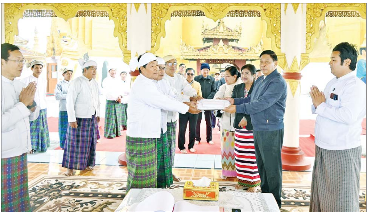
နိုင်ငံတော်စီမံအုပ်ချုပ်ရေးကောင်စီအဖွဲ့ဝင် ဒုတိယဝန်ကြီးချုပ်နှင့် ပြည်ထောင်စုဝန်ကြီး ဗိုလ်ချုပ်ကြီးတင်အောင်စန်း မချမ်းဘောမြို့နယ် အတွင်း တည်ထားကိုးကွယ်သော ရှေးဟောင်းသမိုင်းဝင်ကောင်းမှုလှူစေတီတော် ဘက်စုံပြုပြင်မွမ်းမံနိုင်ရေးအတွက် အလှူငွေများ ပေးအပ် လှူဒါန်းစဉ်။

စေတီတော်သို့ သွားရောက်ဖူးမြော် ကြည့်ညိပြီး စေတီတော်ဘက်စုံ ပြုပြင် မွမ်းမံနိုင်ရေးအတွက် အလှူငွေများ ပေးအပ်လှူဒါန်း သည်။ ထို့နောက် ပူတာအိုမြို့နယ် အတွင်းရှိ တပ်နယ် ဧက ၅၀၀ ဘက်စုံ စိုက်ပျိုးမွေးမြူရေးခြံ (နမ့်တာလဲ)၌ သီးပင်စားပင် စိုက်ပျိုးထားရှိမှု၊ ဥစားကြက်နှင့် အသားတိုးဝက်များ မွေးမြူထားရှိ မှုကို လှည့်လည်ကြည့်ရှုစစ်ဆေး ပြီး စိုက်ပျိုးဆောင်ရွက်နိုင်မှုနှင့် ဒေသတွင်း ပြန်လည်ရောင်းချပေး နိုင်သည့် အခြေအနေများကို မေးမြန်းဆွေးနွေးကာ မွေးမြူရေး အထောက်အကူပြု ဆေးဝါးများ နှင့် စွမ်းအားပြည့် ဖြည့်စွက် အစာအိတ်များကို ပေးအပ်သည်။ ယင်းနောက် ဒုတိယဝန်ကြီးချုပ် နှင့် ပြည်ထောင်စုဝန်ကြီး ဗိုလ်ချုပ်ကြီးတင်အောင်စန်းသည် အဖွဲ့ဝင်များနှင့်အတူ ပူတာအိုမြို့ ဖုန်ကန်ရာဇီခန်းမ၌ ကျင်းပသည့် ခရိုင်အဆင့် ဌာနဆိုင်ရာများ၊ မြို့မိ မြို့ဖများ၊ တိုင်းရင်းသား စာပေနှင့် ယဉ်ကျေးမှုအသင်းအဖွဲ့