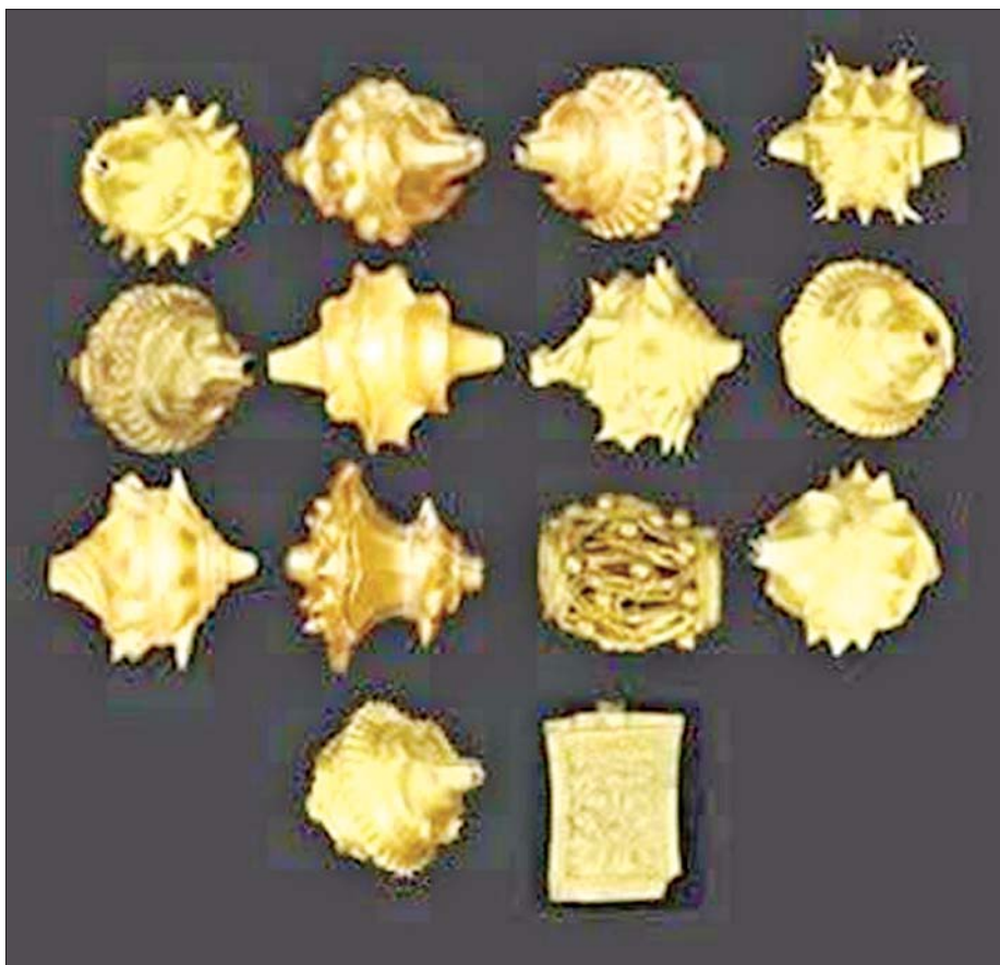
၂၀၁၈ ခုနှစ်တွင် စစ်ကိုင်းတိုင်းဒေသကြီး မြောင်မြို့နယ် ကျောက်ဖြူကျေးရွာ အနောက်ဘက် ပေ ၁၀၀၀ ခန့်အကွာရှိ ချောင်းကမ်းပါးပြိုကျရာမှတွေ့ရှိခဲ့ပြီး ဦးစီးဌာနသို့ အပ်နှံခဲ့သည့် ပျူခေတ်လက်ရာ ရွှေပုတီးစေ့နှင့် ရွှေပြား။

နှင့် အမျိုးသားပြတိုက်ဦးစီးဌာနသို့ လာရောက်အပ်နှံ ပါက လွှဲပြောင်းအပ်နှံသူကို အကျိုးခံစားခွင့်ရှိသူ အဖြစ် သတ်မှတ်၍ အပ်နှံသည့်ဝတ္ထုပစ္စည်း၏ မူလ တန်ဖိုး၊ ခေတ်ကာလတန်ဖိုး၊ ခေတ်လက်ရာတန်ဖိုး အပြင် ရှားပါး၍အနုလက်ရာပြောင်မြောက်သည့် ဝတ္ထုပစ္စည်းများဖြစ်ပါက ထပ်ဆောင်းတန်ဖိုးကိုပါ ထပ်တိုးတွက်ချက်ပြီး သာသနာရေးနှင့် ယဉ်ကျေးမှု ဝန်ကြီးဌာနက ထိုက်ထိုက်တန်တန် ဂုဏ်ပြုချီးမြှင့် ငွေများ ပေးအပ်လျက်ရှိပါသည်။