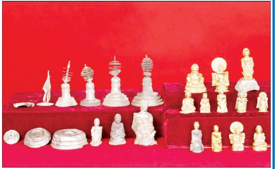
၂၀၀၅ ခုနှစ်တွင် မိုင်းမောကျေးရွာ အရှေ့တောင်ဘက် ကင်းတားဆည်လက်တံဖောက်လုပ်ရာမှ တွေ့ရှိခဲ့ပြီး ဦးစီးဌာနသို့ အပ်နှံခဲ့သည့် ပျူခေတ်ဗုဒ္ဓဆင်းတုတော်များနှင့် ငွေစေတီများ။