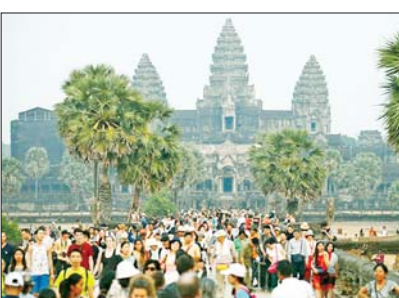
နိုင်ငံတကာ ဆောင်းပါးစာမျက်နှာ » ၁၂

အသင်းဟောင်းကို ဒုတိယအကြိမ် ပြန်လည်ကိုင်တွယ်တဲ့ နည်းပြတွေထဲမှာ ဘယ်နည်းပြတွေ အောင်မြင်မှုရပြီး ဘယ်နည်းပြတွေ ရှုံးနိမ့်မှုနဲ့ ရင်ဆိုင်ခဲ့ရသလဲ