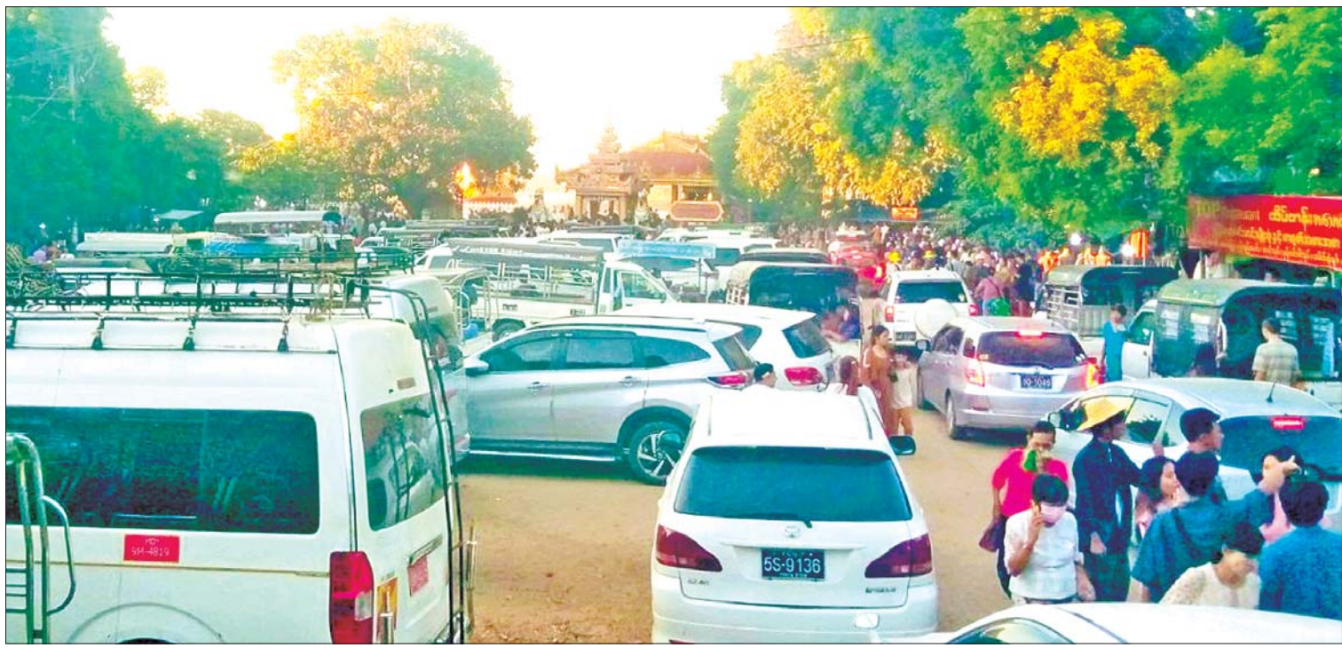
ပုဂံရှေးဟောင်းယဉ်ကျေးမှုနယ်မြေသို့ လာရောက်ကြသည့် ဘုရားဖူးကားများကို တွေ့ရစဉ်။

ရန်ကုန် ဇန်နဝါရီ ၁၂ ပုဂံရှေးဟောင်းယဉ်ကျေးမှု ဒေသ တွင် နှစ်စဉ်ပြာသိုလ်ပြည့်နေ့၌ ကျင်းပ သည့် အာနန္ဒာဘုရားဗုဒ္ဓပူဇော်ပွဲတော်သို့ အနယ်နယ်အရပ်ရပ်မှ ဘုရားဖူးများနှင့် ပြည်ပခရီးသွားများ အများအပြား ဝင်ရောက်လျက်ရှိကြောင်း သိရသည်။ ဘုရားဖူးပြည်သူများဖြင့် စည်ကား အာနန္ဒာဘုရားပွဲတော်၏ (၉၃၄)ကြိမ် မြောက် ဗုဒ္ဓပူဇော်ပွဲတော်ကို အဖိတ်၊ လပြည့်နေ့နှင့် လဆုတ်(၁)ရက်တို့တွင် ကျင်းပလေ့ရှိပြီး လယ်ယာထွက်ကုန် ပစ္စည်းများ၊ လယ်ယာသုံးစက်ပစ္စည်း ဆိုင်များ၊ ပုဂံဒေသထွက်ကုန်ပစ္စည်းများ၊ စားသောက်ကုန်များ၊ ရေထွက်ကုန် ပစ္စည်းဆိုင်နှင့် အဝတ်အထည်ဆိုင်များ စသည်ဖြင့် ဈေးဆိုင်ခန်းပေါင်း ၁၂၀ ပါဝင် ရောင်းချလျက်ရှိရာ ဘုရားဖူးပြည်သူများ ဖြင့် စည်ကားလျက်ရှိသည်။ စာမျက်နှာ ၄ ကော်လံ ၁ သို့ ★