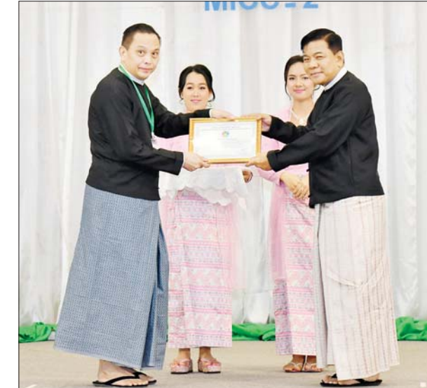
နိုင်ငံတော်စီမံအုပ်ချုပ်ရေးကောင်စီအဖွဲ့ဝင် ဒုတိယ ဝန်ကြီးချုပ်နှင့် ပြည်ထောင်စုဝန်ကြီး ဗိုလ်ချုပ်ကြီး မောင်မောင်အေးက စာတမ်းရှင်များကိုယ်စား စာတမ်းရှင်တစ်ဦးအား ဂုဏ်ပြုလက်မှတ် ပေးအပ်ချီးမြှင့်စဉ်။