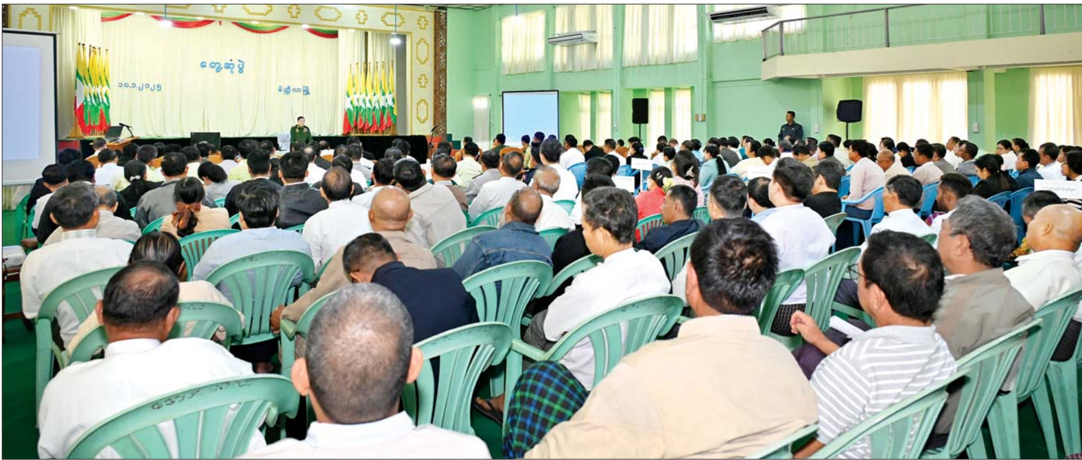
နိုင်ငံတော်စီမံအုပ်ချုပ်ရေးကောင်စီဥက္ကဋ္ဌ နိုင်ငံတော်ဝန်ကြီးချုပ် ဗိုလ်ချုပ်မှူးကြီးမင်းအောင်လှိုင် မိတ္ထီလာခရိုင်အတွင်းရှိ ခရိုင်၊ မြို့နယ်အဆင့် ဌာနဆိုင်ရာတာဝန်ရှိသူများ၊ အသေးစား၊ အငယ်စားနှင့် အလတ်စား စီးပွားရေး(MSME) လုပ်ငန်းရှင်များအား တွေ့ဆုံ၍ ဒေသဖွံ့ဖြိုးရေးဆိုင်ရာများ ဆွေးနွေးပြောကြားစဉ်။

နေပြည်တော် ဇန်နဝါရီ ၁၀ - နိုင်ငံတော် စီမံအုပ်ချုပ်ရေးကောင်စီဥက္ကဋ္ဌ နိုင်ငံတော်ဝန်ကြီးချုပ် ဗိုလ်ချုပ်မှူးကြီးမင်းအောင်လှိုင်သည် ယနေ့ မွန်းလွဲပိုင်းတွင် မန္တလေးတိုင်းဒေသကြီး မိတ္ထီလာခရိုင်အတွင်းရှိ ခရိုင်၊ မြို့နယ်အဆင့် ဌာနဆိုင်ရာ ဝန်ထမ်းများ၊ အသေးစား၊ အငယ်စားနှင့် အလတ်စား စီးပွားရေး (MSME) လုပ်ငန်းရှင်များအား မိတ္ထီလာမြို့ ကန်တော်မင်္ဂလာခန်းမ၌ တွေ့ဆုံ၍ ဒေသဖွံ့ဖြိုးတိုးတက်ရေး ဆိုင်ရာများနှင့် စီးပွားရေးလုပ်ငန်း ဖွံ့ဖြိုးတိုးတက်ရေးဆိုင်ရာများကို ဆွေးနွေးပြောကြားသည်။