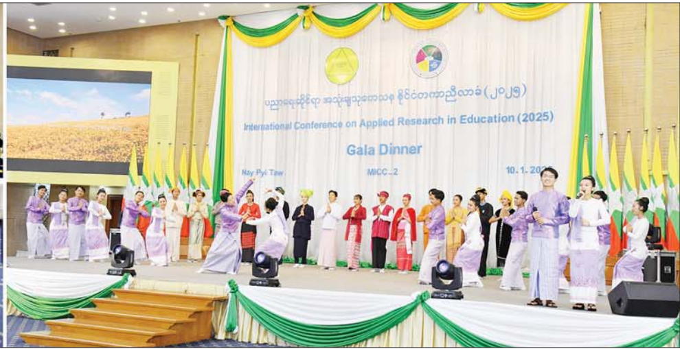
နိုင်ငံတော်စီမံအုပ်ချုပ်ရေးကောင်စီဒုတိယဥက္ကဋ္ဌ ဒုတိယဝန်ကြီးချုပ် ဒုတိယဗိုလ်ချုပ်မှူးကြီးစိုးဝင်း ပညာရေးဆိုင်ရာအသုံးချသုတေသန နိုင်ငံတကာညီလာခံ (၂၀၂၅) ဂုဏ်ပြုညစာစားပွဲအခမ်းအနားသို့ တက်ရောက်လာကြသူများနှင့်အတူ အနုပညာရှင်များ၏ အကအလှများဖြင့် သီဆိုကပြဖျော်ဖြေမှုကို ကြည့်ရှုအားပေးစဉ်။