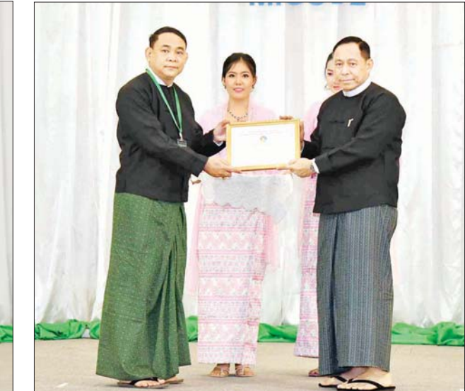
နိုင်ငံတော်စီမံအုပ်ချုပ်ရေးကောင်စီအဖွဲ့ဝင် ပြည်ထောင်စု ဝန်ကြီး ဒုတိယဗိုလ်ချုပ်ကြီးရာပြည့်က စာတမ်းရှင်များကိုယ်စား စာတမ်းရှင်တစ်ဦးအား ဂုဏ်ပြုလက်မှတ်ပေးအပ်ချီးမြှင့်စဉ်။