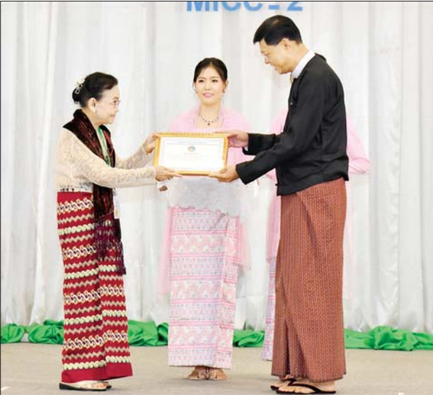
နိုင်ငံတော်စီမံအုပ်ချုပ်ရေးကောင်စီအဖွဲ့ဝင် ဒုတိယဝန်ကြီးချုပ် နှင့် ပြည်ထောင်စုဝန်ကြီး ဗိုလ်ချုပ်ကြီး မြထွန်းဦးက စာတမ်း ဖတ်ပွဲတွင် ပါဝင်ဆောင်ရွက်ခဲ့ကြသည့် ကိုယ်စားလှယ်တစ်ဦးအား ဂုဏ်ပြုလက်မှတ် ပေးအပ်ချီးမြှင့်စဉ်။

ကောင်စီ ဒုတိယဥက္ကဋ္ဌ ဒုတိယ ဝန်ကြီးချုပ်သည် ဖျော်ဖြေ တက်ရောက် လာကြသူများအား တင်ဆက်ခဲ့ကြသူများကို ဂုဏ်ပြု ရင်းရင်းနှီးနှီးနုတ် ဆက်ခဲ့ကြောင်း ပန်းခြင်းနှင့် ဂုဏ်ပြုချီးမြှင့်ငွေ သိရသည်။ သတင်းစဉ်