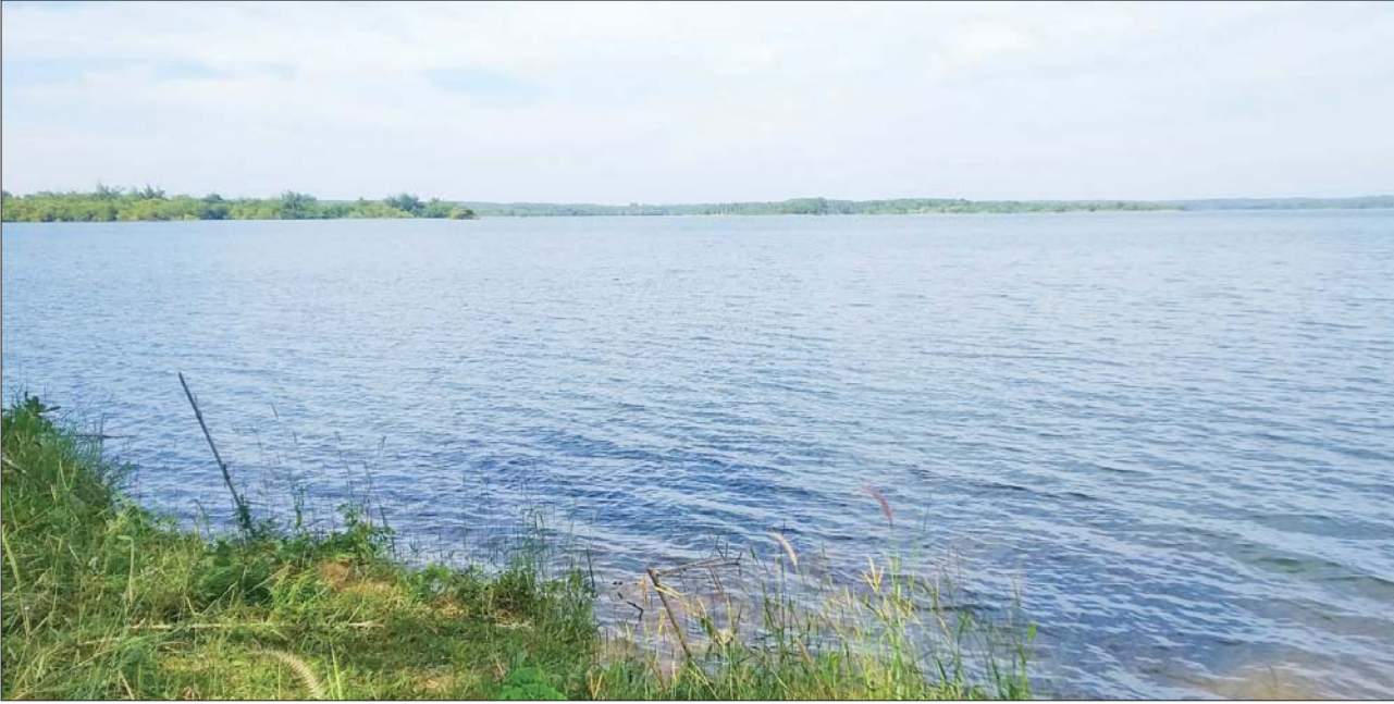
ပဲခူးတိုင်းဒေသကြီး ရေဝပ်ရေလျှံမှုကို ကာကွယ်ထိန်းညှိပေးနေသည့် ဆည်တစ်ခုမှာတွင် တစ်ခုအပါအဝင်ဖြစ်သည့် မဇင်းဆည်တစ်ခုကိုတွေ့ရစဉ်။

တည်ဆောက်ထားတဲ့ ဆည်တစ်ခုက တောင်သူနဲ့ ပြည်သူတွေအတွက် အကျိုးကျေးဇူးများစွာ ရရှိနေပါတယ်။ မိုးတွင်းကာလမှာဆိုရင် ဆည်တစ်ခုဟာ မိုးရေကိုထိန်းသိမ်းထားတဲ့ အတွက် ရေကြီးရေလျှံမှုတွေကို ကာကွယ်ပေးပြီး နွေရာသီဆိုရင် နွေစပါးစိုက်ခင်းအတွက် ရေပေးဝေတာကြောင့် နိုင်ငံအတွက်လည်း အကျိုးကျေးဇူးရရှိစေပါတယ်။ ဆည်တစ်ခုတွေမရှိဘူးဆိုရင် နွေစပါးအတွက် အခက်အခဲရှိပြီး ရေလှောင်တစ်ခုက ရေပေးဝေနိုင်မှသာ စိုက်ပျိုးမှုအဆင်ပြေစေပါတယ်။