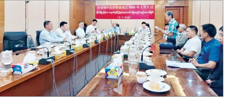
ခွဲများဖွဲ့စည်း၍ မြန်မာ-တရုတ်ချစ်ကြည်ရေး အသင်းဖွဲ့စည်းရေးအတွက် ရေလုပ်ငန်းဆိုင်ရာ အကျိုးတူပူးပေါင်းဆောင်ရွက်ရေး အပါအဝင် မြန်မာ-တရုတ်ချစ်ကြည်ရေးအသင်းခွဲ (မြိတ်) ဖွဲ့စည်းနိုင်ရေးကိစ္စရပ်များကို ရှင်းလင်း ဆွေးနွေးခဲ့ပြီး မြန်မာ-တရုတ်ချစ်ကြည်ရေးအသင်းခွဲ (မြိတ်)ကို စတင်ဖွဲ့စည်းခဲ့ကြောင်း သိရသည်။ သတင်းစဉ်

မွေးမြူနိုင်သောနေရာဒေသများနှင့် အစာချက်စက်ရုံ နေရာများ၊ ငါးလေလံဈေးကွက် တည်ဆောက်ထားရှိ သည့်နေရာများကို လှည့်လည်ပြသခဲ့ကြသည်။ ယင်းနောက် တရုတ်နိုင်ငံရေလုပ်ငန်းပညာရှင် များအဖွဲ့သည် တနင်္သာရီတိုင်းဒေသကြီး ဝန်ကြီးချုပ် ဦးမြတ်ကိုအား သွားရောက်ဂါရဝပြုတွေ့ဆုံခဲ့ပြီး မြိတ်မြို့ဒေသဖွံ့ဖြိုးရေးတွင် ပူးပေါင်းပါဝင် ဆောင်ရွက်ရေးဆိုင်ရာကိစ္စရပ်များကို ဆွေးနွေး ခဲ့ကာ မြိတ်အများပိုင်ကော်ပိုရေးရှင်းဥက္ကဋ္ဌနှင့်အဖွဲ့က တည်ခင်းဆောင်ရွက်စားပွဲသို့ တက်ရောက် ခဲ့ကြသည်။ ဆက်လက်၍ မြန်မာ-တရုတ်ချစ်ကြည်ရေး အသင်း(ဗဟို) ဥက္ကဋ္ဌသည် မြိတ်ဒေသခံ တရုတ်ဘုံ ကျောင်းမှ တာဝန်ရှိသူများ၊ စိတ်ဝင်စားသူဒေသခံ များနှင့်တွေ့ဆုံ၍ အသင်း၏ရည်ရွယ်ချက်၊ အသင်း