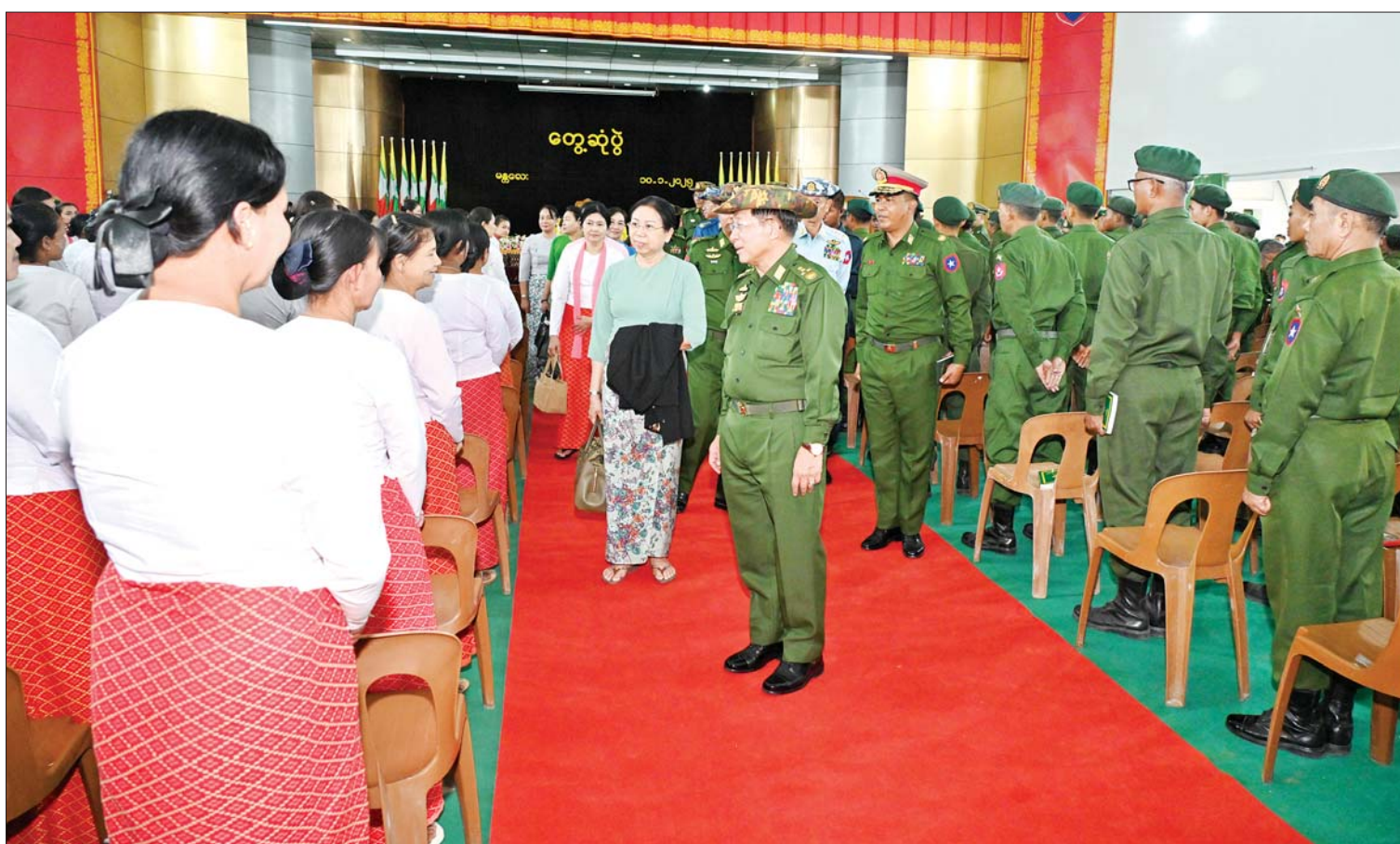
နိုင်ငံတော်စီမံအုပ်ချုပ်ရေးကောင်စီဥက္ကဋ္ဌ တပ်မတော်ကာကွယ်ရေးဦးစီးချုပ် ဗိုလ်ချုပ်မှူးကြီးမင်းအောင်လှိုင်နှင့်ဇနီး ဒေါ်ကြူကြူလှ မန္တလေးတပ်နယ်ရှိ အရာရှိ၊ စစ်သည်၊ မိသားစုများအား ရင်းရင်းနှီးနှီးနှုတ်ဆက်စဉ်။

နေပြည်တော် ဇန်နဝါရီ ၁၀ နိုင်ငံတော်စီမံအုပ်ချုပ်ရေးကောင်စီ ဥက္ကဋ္ဌ တပ်မတော်ကာကွယ်ရေးဦးစီးချုပ် ဗိုလ်ချုပ်မှူးကြီး မင်းအောင်လှိုင်သည် ယနေ့နံနက်ပိုင်းတွင် အလယ်ပိုင်းတိုင်းစစ်ဌာနချုပ်၊ မိတ္ထီလာတပ်နယ်နှင့် မန္တလေးတပ်နယ်တို့ရှိ အရာရှိ၊ စစ်သည်၊ မိသားစုများအား နယ်မြေခံတပ်ဌာနချုပ် ခန်းမများ၌ သီးခြားစီတွေ့ဆုံအမှာစကား ပြောကြားသည်။