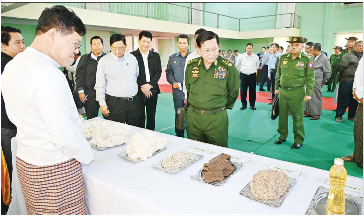
နိုင်ငံတော်စီမံအုပ်ချုပ်ရေးကောင်စီဥက္ကဋ္ဌ နိုင်ငံတော်ဝန်ကြီးချုပ် ဗိုလ်ချုပ်မှူးကြီးမင်းအောင်လှိုင် ခင်းကျင်းပြသထားသည့် ဝါသီးနှံထုတ်ကုန် ပစ္စည်းများကို ကြည့်ရှုစဉ်။

စိုက်ပျိုးရေး လုပ်ငန်းတွင် ပန်းတိုင် ရည်မှန်းချက်များ ပေးထားခြင်းသည် အမှန်တကယ် ထွက်ရှိနိုင်မှုအပေါ်တွင် အခြေခံ၍ တွက်ချက်ထားရှိခြင်းပင် ဖြစ် ကြောင်း၊ မြေ၊ ရေနှင့်စိုက်ပျိုးရေး စနစ်များအပေါ်တွင် မူတည်၍ အထွက်နှုန်းများ ကွာခြားခြင်းပင် ဖြစ်သဖြင့် သီးနှံများထွက်ရှိမှု ပန်းတိုင်ရည်မှန်းချက်မပြည့်မီခြင်း အပေါ် သုံးသပ်ဆောင်ရွက်သွား ရမည်ဖြစ်ကြောင်း၊ မိတ္ထီလာခရိုင် အတွင်း၌ စိုက်ပျိုးမြေ၏ ၁၀ ရာခိုင်နှုန်းကျော်ကိုသာ စိုက်ပျိုးရေး ပေးဝေနိုင်သည်ဟု သိရကြောင်း၊ အခက်အခဲများ ရှိမည်ဖြစ်သော် လည်း နည်းလမ်းရှာ၍လုပ်မည် ဆိုပါက အောင်မြင်နိုင်မည်ဖြစ် ကြောင်း၊ စိုက်ပျိုးရေးနှင့်ပတ်သက် ၍ နည်းလမ်း လေးသွယ်ရှိပြီး မျိုးများကောင်းမွန်ရန်၊ မြေပြုပြင် ခြင်းနှင့် သွင်းအားစုများ မှန်မှန် ကန်ကန်ထည့်သွင်းရန်၊ စိုက်ပျိုးရေး လုံလောက်စွာရရှိရန်နှင့် စိုက်ပျိုးရေး စနစ်များ မှန်ကန်မှုရှိရန်တို့ပင် ဖြစ်ကြောင်း၊ မိတ္ထီလာခရိုင်အတွင်း စိုက်ပျိုးမြေများ ကောင်းမွန်မှုမရှိ သဖြင့် အထွက်နှုန်းနည်းရခြင်း ဖြစ်သည်ဟုသိရှိရပြီး လိုအပ်သည့် သွင်းအားစုများကို ပြည့်မီအောင် ထည့်သွင်းခြင်း၊ ပိုက်ဆံလျှော် စိုက်ပျိုးခြင်း၊ သဘာဝမြေဩဇာ များ ထည့်သွင်းခြင်းတို့အပါအဝင် နည်းလမ်းများရှာဖွေ၍ မြေဆီ မြေလွှာ ကောင်းမွန်လာအောင် ဆောင်ရွက်ခြင်းတို့ဖြင့် မြေပြုပြင် ခြင်းများ ဆောင်ရွက်သွားရန်လို ကြောင်း၊ စိုက်ပျိုးရေးလုပ်ငန်းများ ဖွံ့ဖြိုးလာမှုနှင့်အတူ မွေးမြူရေး လုပ်ငန်းများသည်လည်း တိုးတက် လာမည်ဖြစ်ကာ ဒေသ၏လူမှုစီးပွား