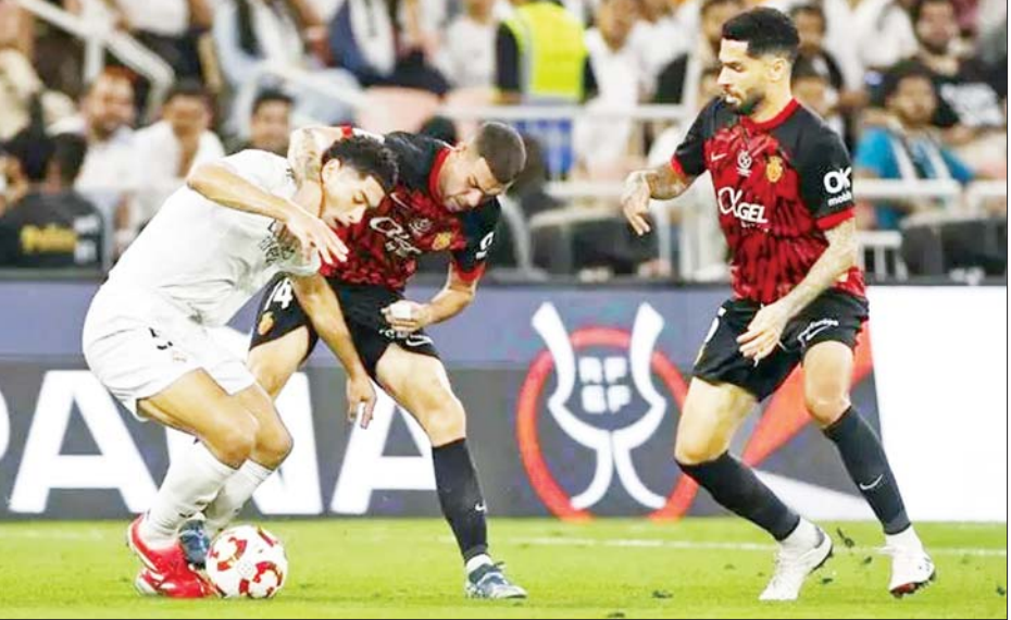
ရီးယဲလ်မက်ဒရစ်အသင်းနှင့် မာယော့ကာအသင်းတို့ ယှဉ်ပြိုင်ကစားကြစဉ်။