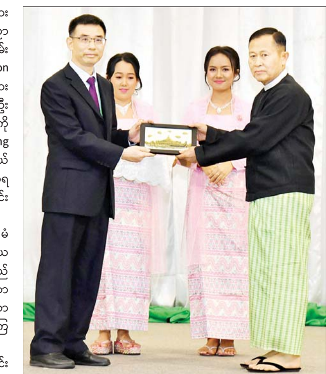
နိုင်ငံတော်စီမံအုပ်ချုပ်ရေးကောင်စီဒုတိယဥက္ကဋ္ဌ ဒုတိယ ဝန်ကြီးချုပ် ဒုတိယဗိုလ်ချုပ်မှူးကြီးစိုးဝင်း ပညာရေးဆိုင်ရာ အသုံးချသုတေသန နိုင်ငံတကာညီလာခံ (၂၀၂၅) တွင် ပါဝင်ဆောင် ရွက်ပေးခဲ့သော နိုင်ငံတကာအဖွဲ့အစည်းများမှ ကိုယ်စားလှယ်တစ်ဦး အား ဂုဏ်ပြုလက်ဆောင်ပေးအပ်ချီးမြှင့်စဉ်။

ကြီး ရာပြည့်က ဘာသာစကား အရင်းအမြစ်နှင့် နည်းပညာ စာတမ်းရှင်များကိုယ်စား စာတမ်း ရှင်တစ်ဦးနှင့် Young Generation Scientists စာတမ်းရှင်များ ကိုယ်စား စာတမ်းရှင်တစ်ဦး တို့အား ဂုဏ်ပြုလက်မှတ်များကို လည်းကောင်း၊ Organizing Committee ကိုယ်စားလှယ် အမှတ်တရ လက်ဆောင်ကို လည်းကောင်း ပေးအပ်ချီးမြှင့်ကြသည်။ ယင်းနောက် နိုင်ငံတော်စီမံ အုပ်ချုပ်ရေးကောင်စီ ဒုတိယ ဥက္ကဋ္ဌ ဒုတိယဝန်ကြီးချုပ်သည် အခမ်းအနားသို့ တက်ရောက်လာ ကြသူများနှင့်အတူ ဂုဏ်ပြုညစာ ကို အတူတကွ သုံးဆောင်ကြ သည်။ ညစာ သုံးဆောင်နေစဉ်အတွင်း ပြန်ကြားရေးဝန်ကြီးဌာန မြန်မာ့ အသံနှင့် ရုပ်မြင်သံကြားမှ အနု ပညာရှင်များ၊ တက္ကသိုလ်နှင့် ပညာရေးဒီဂရီကောလိပ်များမှ ဆရာ ဆရာမများ၊ ကျောင်းသား ကျောင်းသူများက တေးသံသာ များ၊ အကအလှများဖြင့် သီဆို ကပြ ဖျော်ဖြေကြသည်။ ဂုဏ်ပြု ညစာစားပွဲအပြီးတွင် နိုင်ငံတော် စီမံအုပ်ချုပ်ရေး