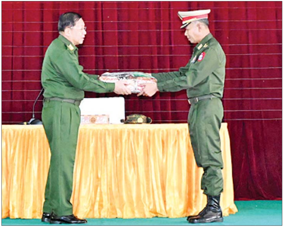
နိုင်ငံတော်စီမံအုပ်ချုပ်ရေးကောင်စီဥက္ကဋ္ဌ တပ်မတော်ကာကွယ်ရေးဦးစီးချုပ် ဗိုလ်ချုပ်မှူးကြီး မင်းအောင်လှိုင် မိတ္ထီလာတပ်နယ်ရှိ အရာရှိ၊ စစ်သည်၊ မိသားစုများအတွက် စားသောက်ဖွယ်ရာပစ္စည်းများ ပေးအပ်စဉ်။

တပ်မတော်ပိုင်းနှင့်ပတ်သက်၍ ခေတ်အဆက် ဆက်တွင် နိုင်ငံရေးအရ စစ်ရေးအရဖြစ်ပေါ်လာသည့် ပြည်တွင်းပြည်ပ အန္တရာယ်များကြား၌ မိမိတို့ တပ်မတော်သားများသည် နိုင်ငံနှင့်ပြည်သူအကျိုး အတွက် စွန့်လွှတ်စွန့်စားခြင်းများစွာဖြင့် ပေးအပ် လာသည့်တာဝန်များကို ကျေပွန်အောင်ထမ်းဆောင် ခဲ့ကြကြောင်း၊ လွတ်လပ်ရေးနှင့်အတူ ပေါ်ပေါက်ခဲ့ သည့် ပြည်တွင်းသောင်းကျန်းမှုများ၊ ဝါဒစွဲ ဂိုဏ်းဂဏစွဲကြောင့် ဖြစ်ပေါ်လာသည့် ထိုးနှက် တိုက်ခိုက်မှုများကြားတွင် တပ်မတော်အနေဖြင့် စစ်မှန်သည့် အမျိုးသားရေးတာဝန်ကိုသာ ရှေးရှုပြီး တိုင်းပြည်နှင့်လူမျိုးအကျိုး သယ်ပိုးခဲ့သည်မှာ သမိုင်း သက်သေရှိပြီးဖြစ်ကြောင်း၊ ယခုမိမိတို့တပ်မတော်၏ နိုင်ငံရေးတာဝန်များကို ထမ်းဆောင်နေမှုများသည် လည်း သမိုင်းများပင်ဖြစ်သဖြင့် သမိုင်းမှတ်တမ်းကောင်း ကို ရေးထိုးနိုင်ရမည်ဖြစ်ကြောင်း၊ လက်ရှိ ပြည်တွင်း ပြည်ပ အန္တရာယ်များ၊ ဝင်ရောက်စွက်ဖက်မှုများဖြင့် ကြုံတွေ့နေရချိန်တွင် နိုင်ငံတော်ကာကွယ်ရေးနှင့် လုံခြုံရေးတာဝန် ထမ်းဆောင်နေကြသူများအားလုံး၏