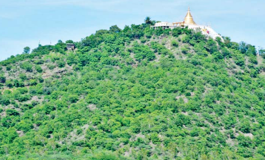
တုရင်တောင်ကြိုးပြင်ကာကွယ်တော၏ သဘာဝရှုခင်းကို တွေ့ရစဉ်။

ပြည်ထောင်စု သမ္မတမြန်မာ ထိန်းသိမ်းရေး ဝန်ကြီးဌာနသည် အရ အပင်နှင့်ထားသော လုပ်ပိုင် နိုင်ငံတော်အစိုးရ၊ သယံဇာတ ၂၀၁၈ ခုနှစ်တွင် ပြဋ္ဌာန်းထားသည့် ခွင့်များကိုကျင့်သုံးလျက် မန္တလေး နှင့် သဘာဝပတ်ဝန်းကျင် သစ်တောဥပဒေပုဒ်မ ၆၊ ပုဒ်မခွဲ(c) တိုင်းဒေသကြီး၊ ညောင်ဦးခရိုင်