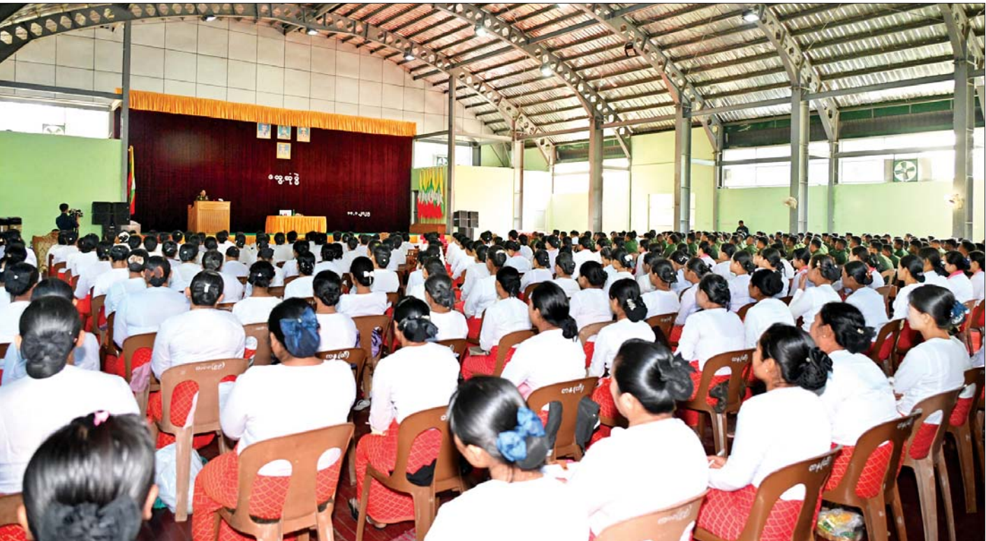
နိုင်ငံတော်စီမံအုပ်ချုပ်ရေးကောင်စီဥက္ကဋ္ဌ တပ်မတော်ကာကွယ်ရေးဦးစီးချုပ် ဗိုလ်ချုပ်မှူးကြီးမင်းအောင်လှိုင် မိတ္ထီလာတပ်နယ်ရှိ အရာရှိ၊ စစ်သည်၊ မိသားစုများအား တွေ့ဆုံအမှာစကားပြောကြားစဉ်။

ထိုသို့ တွေ့ဆုံအမှာစကားပြောကြားရာတွင် နိုင်ငံတော်၏ နိုင်ငံရေးဖြစ်ပေါ်ပြောင်းလဲမှု အခြေ အနေများ၊ နိုင်ငံတော်ဖြစ်တည်မှု ပထဝီမြေအနေ အထားအရ လုံခြုံရေးနှင့် အချုပ်အခြာအာဏာ တည်တံ့ခိုင်မြဲရေးအတွက် တပ်မတော်အနေဖြင့် ခေတ်အဆက်ဆက်တွင် ပြည်ထောင်စုမပြိုကွဲရေး၊ တိုင်းရင်းသား စည်းလုံးညီညွတ်မှုမပြိုကွဲရေး၊ အချုပ် အခြာအာဏာတည်တံ့ခိုင်မြဲရေး တာဝန်များကို တစိုက်မတ်မတ် ထမ်းဆောင်ခဲ့သည့်အခြေအနေ များ၊ ပြည်တွင်းလက်နက်ကိုင်ပဋိပက္ခများဖြစ်ပေါ် ခဲ့မှုနှင့် နိုင်ငံတော်၏ သမိုင်းကြောင်းစဉ်ဆက်အရ ရှေးယခင်ကတည်းကပင် အတူတကွပေါင်းစည်း နေထိုင်ခဲ့ကြပြီး ပြည်နယ်များ၊ ဒေသများစုပေါင်း တည်ဆောက်ထားသည့်ပြည်ထောင်စုနိုင်ငံတော်ကြီး ကို ရေရှည်တည်တံ့ခိုင်မြဲအောင် ဆောင်ရွက်လျက် ရှိသည့် အခြေအနေများ၊ ၂၀၂၀ ပြည့်နှစ် ပါတီစုံ ဒီမိုကရေစီအထွေထွေရွေးကောက်ပွဲတွင် မဲမသမာမှု များဖြစ်ပေါ်ခဲ့သည့် အခြေအနေများနှင့် အဆိုပါ မဲမသမာမှုများကို ဖြေရှင်းဆောင်ရွက်ပေးခြင်းမရှိခဲ့ သည့်အပြင် နိုင်ငံတော်၏အာဏာကို အတင်းအဓမ္မ ရယူရန် လုပ်ဆောင်လာခဲ့သောကြောင့် ဖြစ်ပေါ်လာ သည့်အခြေအနေများအရ နိုင်ငံတော်ကို နိုင်ငံရေး အရ အရေးပေါ်အခြေအနေကြေညာခဲ့ပြီး တပ်မတော် မှ နိုင်ငံ့တာဝန်များကို ထမ်းဆောင်ခဲ့ရသည့်