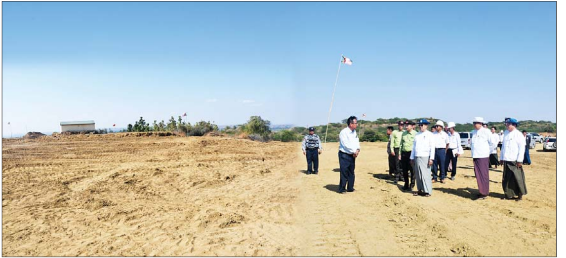
ခရိုင်အတွင်းရှိ ဘုရားစေတီဂေါပကအဖွဲ့ဝင်များနှင့်တွေ့ဆုံ၍ စွယ်တော်မြတ်စေတီတော်ပုံတူတည်ဆောက်ရေး ဆောင်ရွက်မည့်အခြေအနေ၊ စေတီတော်ကြီးကိုအများပြည်သူလှူဒါန်းမှုဖြင့် တည်ထားကိုးကွယ်မည်ဖြစ်သည့်အတွက် မြို့မိမြို့ဖများ၊ ဌာနဆိုင်ရာတာဝန်ရှိသူများ အနေဖြင့် ကုသိုလ်ယူပါဝင် ပူးပေါင်းဆောင်ရွက်ရေး တို့ကို တိုက်တွန်းပြောကြားပြီး မြို့မိမြို့ဖများ၏တင်ပြမှုများကို ပြန်လည်ရှင်းလင်းဆွေးနွေးပြောကြားခဲ့ကြောင်း သိရသည်။ သတင်းစဉ်

ဝန်ကြီးက စွယ်တော်မြတ်စေတီ တည်ထားကိုးကွယ်မည့် ချောက်မြို့ အမှတ် (၅) ရပ်ကွက်ကွင်းအမှတ် ၂၂၉၃ ရှိ မြေ ၂၀ ဒသမ ပကတိပေါ်တွင် စေတီတော်တည်ဆောက်ရေးလုပ်ငန်းများ အမြန်ဆုံးဆောင်ရွက်နိုင်ရေး၊ သက်ဆိုင်ရာဌာနများပေါင်းစပ်၍ မြေအရည်အသွေး တိုင်းတာစစ်ဆေးခြင်း၊ စေတီတော်တည်ထားမည့်ပန္နက်မြေနေရာ အတည်ပြုသတ်မှတ်ခြင်း၊ မြေပြုပြင်ရှင်းလင်းခြင်းလုပ်ငန်းများ ဆောင်ရွက်သွားရေးတို့ကို မှာကြားသည်။ ယင်းနောက် ပြည်ထောင်စုဝန်ကြီးသည် ခရိုင်/မြို့နယ်အဆင့်ဌာနဆိုင်ရာ တာဝန်ရှိသူများ၊ မြို့မိမြို့ဖများ၊ ချောက်