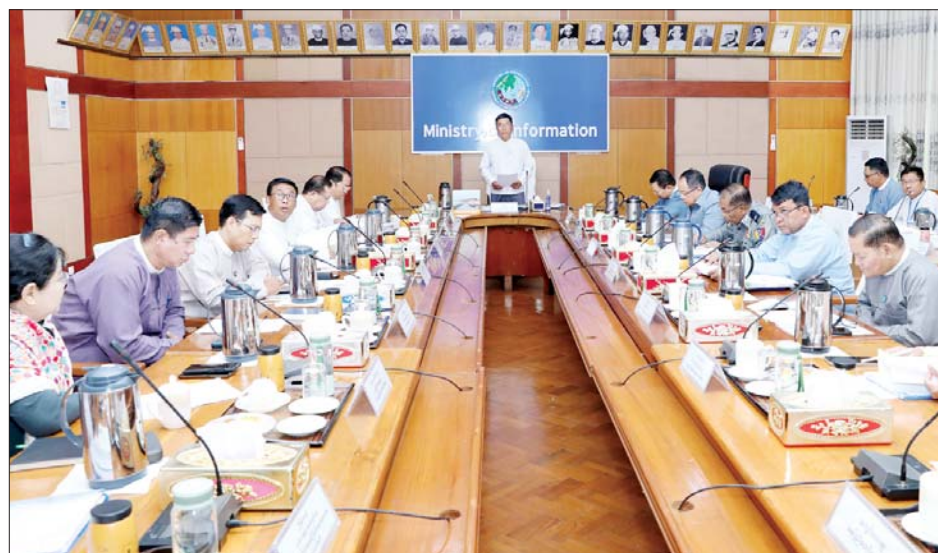
တာဝန်ရှိသူများတက်ရောက်ကြပြီး မြန်မာနိုင်ငံရုပ်ရှင်အစည်းအရုံးဥက္ကဋ္ဌ ဦးကြည်စိုးထွန်း၊ မြန်မာနိုင်ငံဂီတအစည်းအရုံး(ဗဟို)အတွင်းရေးမှူးဦးမြင့်အောင်၊ ဒေါ်ဆွေဇင်ထိုက်နှင့် ဆပ်ကော်မတီမှ တာဝန်ရှိသူများက အွန်လိုင်းမှ တက်ရောက်ကြသည်။ ဦးစွာ လုပ်ငန်းကော်မတီဥက္ကဋ္ဌ ဒုတိယဝန်ကြီး

နေပြည်တော် ဇန်နဝါရီ ၁၀ ၂၀၂၄ ခုနှစ်အတွက် မြန်မာ့ရုပ်ရှင်ထူးချွန်ဆုချီးမြှင့်ပွဲအခမ်းအနားကို ဖေဖော်ဝါရီ ၉ ရက်တွင် နေပြည်တော် မြန်မာအပြည်ပြည်ဆိုင်ရာကွန်ဗင်းရှင်းဗဟိုဌာန-၁ (MICC-1)၌ ကျင်းပမည်ဖြစ်ရာ အခမ်းအနားအောင်မြင်စွာ ကျင်းပနိုင်ရေး မြန်မာ့ရုပ်ရှင်ထူးချွန်ဆု ချီးမြှင့်ပွဲ အခမ်းအနားကျင်းပရေးလုပ်ငန်းကော်မတီ ညှိနှိုင်းအစည်းအဝေးကို ယနေ့ နံနက်ပိုင်းတွင် နေပြည်တော်ရှိ ပြန်ကြားရေးဝန်ကြီးဌာန အစည်းအဝေးခန်းမ၌ ကျင်းပသည်။ အစည်းအဝေးသို့ မြန်မာ့ရုပ်ရှင်ထူးချွန်ဆု ချီးမြှင့်ပွဲအခမ်းအနားကျင်းပရေး လုပ်ငန်းကော်မတီဥက္ကဋ္ဌ ပြန်ကြားရေးဝန်ကြီးဌာန ဒုတိယဝန်ကြီးဦးရဲတင်၊ နေပြည်တော်စည်ပင်သာယာရေးကော်မတီဒုတိယမြို့တော်ဝန် ဦးမောင်မောင်၊ အမြဲတမ်းအတွင်းဝန်များ၊ ဌာနဆိုင်ရာအကြီးအကဲများ၊ လုပ်ငန်းကော်မတီအဖွဲ့ဝင်များ၊ ဆပ်ကော်မတီဥက္ကဋ္ဌများနှင့်