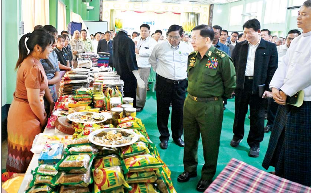
နိုင်ငံတော်စီမံအုပ်ချုပ်ရေးကောင်စီဥက္ကဋ္ဌ နိုင်ငံတော်ဝန်ကြီးချုပ် ဗိုလ်ချုပ်မှူးကြီးမင်းအောင်လှိုင် ခင်းကျင်းပြသထားသည့် ဒေသထွက်စားသောက်ကုန်ပစ္စည်းများကို ကြည့်ရှုစဉ်။

ထုတ်ကုန်များကိုလည်း ထုတ်လုပ်နိုင်မည်ဖြစ်ကြောင်းနှင့် သက်ဆိုင်ရာ ကဏ္ဍအလိုက် ပြန်လည်ဆွေးနွေးပြောကြားကြသည်။ ဒေသဖွံ့ဖြိုးတိုးတက်ရေးအတွက် လိုအပ်သည်များ ဆွေးနွေးမှာကြားထို့နောက် နိုင်ငံတော်စီမံအုပ်ချုပ်ရေးကောင်စီဥက္ကဋ္ဌ နိုင်ငံတော်ဝန်ကြီးချုပ်က မိတ္ထီလာခရိုင်ဖွံ့ဖြိုးတိုးတက်ရေးနှင့် ခရိုင်အတွင်းရှိ အသေးစား၊ အငယ်စားနှင့် အလတ်စား စီးပွားရေး (MSME) လုပ်ငန်းများ ဖွံ့ဖြိုးတိုးတက်ရေးနှင့် ပတ်သက်၍ ဆွေးနွေးပြောကြားရာ၌ မိတ္ထီလာခရိုင်၏ ဒေသဆိုင်ရာ အချက်အလက်များပေါ်တွင် အခြေခံ၍ ဒေသ၏ လူမှုစီးပွားဘဝ ဖွံ့ဖြိုးတိုးတက်လာစေရေး ဆောင်ရွက်သင့်သည် များနှင့် ဆောင်ရွက်နိုင်သည်များ ၂၀၂၄ ခုနှစ်အတွင်း စာမျက်နှာ ၆ သို့ >>>