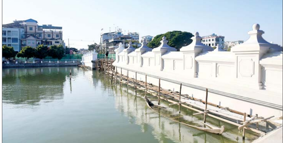
မန္တလေးနန်းမြို့အနောက်ဘက်ရှိ စည်ရှည်တံတား ပြန်လည်တည်ဆောက်နေမှုကို တွေ့ရစဉ်။

ယင်းနောက် နိုင်ငံတော်စီမံအုပ်ချုပ်ရေးကောင်စီဥက္ကဋ္ဌ တပ်မတော်ကာကွယ်ရေးဦးစီးချုပ်နှင့်အဖွဲ့ဝင်များသည် မန္တလေးနန်းမြို့ရိုးတစ်လျှောက် မော်တော်ယာဉ်များဖြင့် လိုက်လံကြည့်ရှုစစ်ဆေးခဲ့ကြောင်း သိရသည်။ သတင်းစဉ်