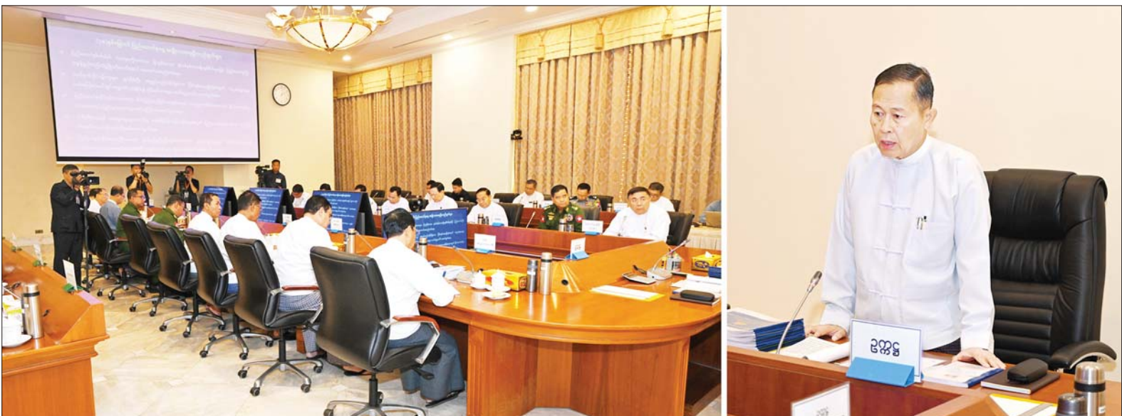
နိုင်ငံတော်စီမံအုပ်ချုပ်ရေးကောင်စီဒုတိယဥက္ကဋ္ဌ ဒုတိယဝန်ကြီးချုပ် ဒုတိယဗိုလ်ချုပ်မှူးကြီးစိုးဝင်း (၇၈)နှစ်မြောက် ပြည်ထောင်စုနေ့ကျင်းပရေးဗဟိုကော်မတီ ပထမအကြိမ် ညှိနှိုင်းအစည်းအဝေးတွင် အမှာစကားပြောကြားစဉ်။

နေပြည်တော် ဇန်နဝါရီ ၁၀ ၂၀၂၅ ခုနှစ် (၇၈)နှစ်မြောက် ပြည်ထောင်စုနေ့ကျင်းပရေး ဗဟိုကော်မတီ ပထမအကြိမ် ညှိနှိုင်းအစည်းအဝေးကို ယနေ့မွန်းလွဲပိုင်းတွင် နေပြည်တော်ရှိ နိုင်ငံတော် စီမံအုပ်ချုပ်ရေးကောင်စီဥက္ကဋ္ဌရုံး အစည်းအဝေးခန်းမ၌ ကျင်းပရာ ၂၀၂၅ ခုနှစ် (၇၈)နှစ်မြောက် ပြည်ထောင်စုနေ့ ကျင်းပရေးဗဟိုကော်မတီ ဥက္ကဋ္ဌ နိုင်ငံတော်စီမံအုပ်ချုပ်ရေးကောင်စီဒုတိယဥက္ကဋ္ဌ ဒုတိယဝန်ကြီးချုပ် ဒုတိယဗိုလ်ချုပ်မှူးကြီးစိုးဝင်း တက်ရောက်အမှာစကား ပြောကြားသည်။ စာမျက်နှာ ၉ ကော်လံ ၁ သို့ ၀