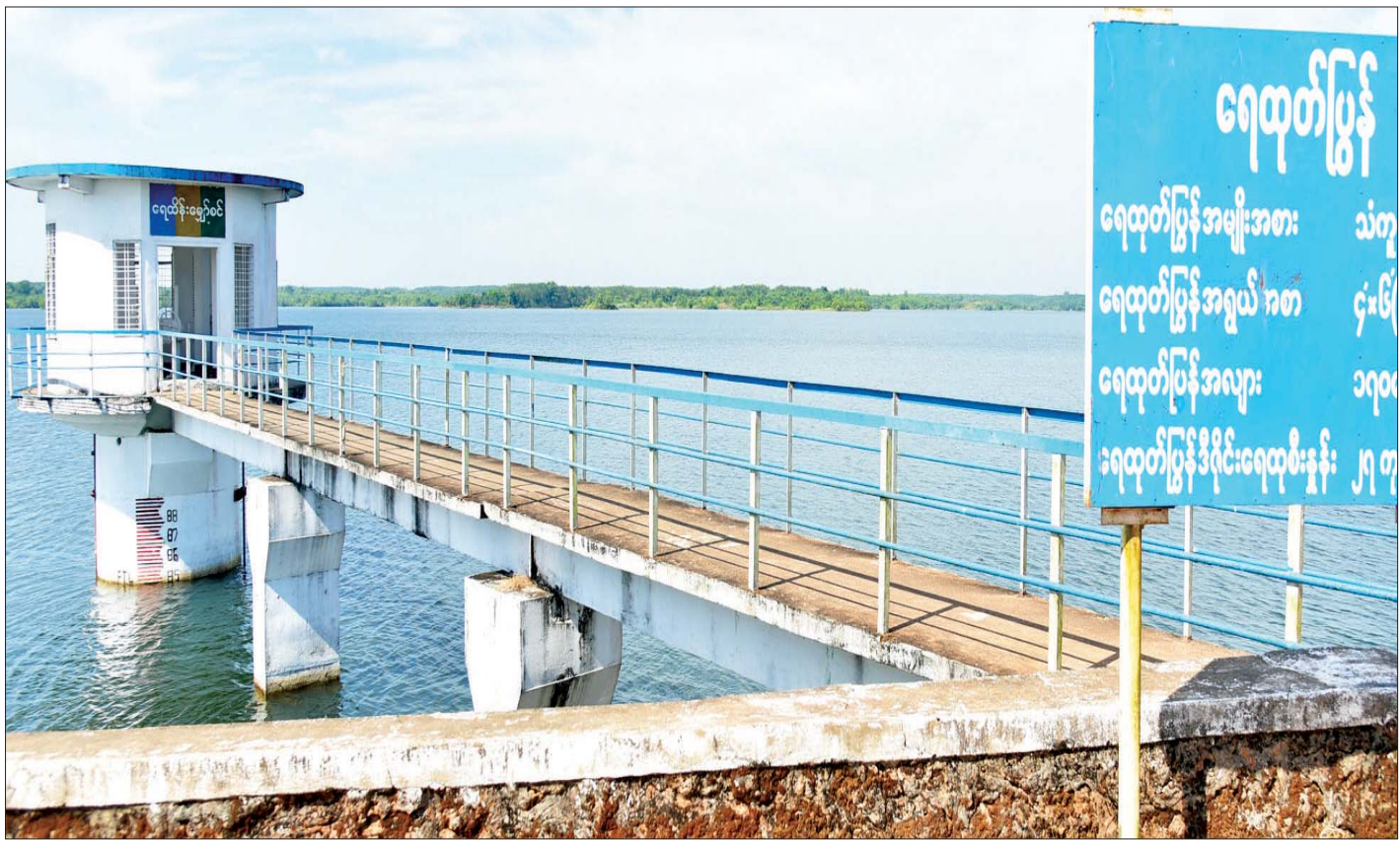
စိုက်ပျိုးရေးနှင့် သောက်သုံးရေအတွက် အကျိုးပြုနေသည့် မဇင်းဆည်တံမံကို တွေ့ရစဉ်။

ပဲခူးတိုင်းဒေသကြီးသည် စိုက်ပျိုးရေးကဏ္ဍတွင် နှစ်သီးစိုက်မှ သုံးသီးစိုက်အဖြစ် မြှင့်တင်ဆောင်ရွက် နေသော တိုင်းဒေသကြီးတစ်ခုဖြစ်ပြီး စိုက်ပျိုးရေး ကဏ္ဍ အောင်မြင်ဖြစ်ထွန်းရန် ပံ့ပိုးကူညီဆောင်ရွက် ပေးနေသော ဆည်တံမံများ၏ အခန်းကဏ္ဍသည် အထူးအရေးပါလျက်ရှိသည်။ စိုက်ပျိုးရေးကိုအခြေခံ သည့် မြန်မာနိုင်ငံတွင် မိုးစပါးကို အများဆုံးစိုက်ပျိုး ကြသည့်နည်းတူ တောင်သူများ အထူးအားထားရာ နွေစပါးကိုလည်း နှစ်စဉ်မပြတ် စိုက်ပျိုးလျက်ရှိသည်။ စိုက်ပျိုးရေး၊ မွေးမြူရေးနှင့် ဆည်မြောင်းဝန်ကြီး ဌာနအနေဖြင့် တောင်သူတို့၏ လူမှုစီးပွားဖွံ့ဖြိုး တိုးတက်မှုကို အစဉ်အလေးထားဆောင်ရွက်နေသည့် နည်းတူ ပြည်တွင်းစားသုံးမှုနှင့် ပြည်ပပို့ကုန်အတွက် စိုက်ပျိုးထုတ်လုပ်လျက်ရှိသည့် ဆန်စပါးစိုက်ပျိုးမှု ကဏ္ဍတွင်လည်း တောင်သူများလိုအပ်သည့် ဆည် ရေကို အစဉ်မပြတ် ပို့လွှတ်ပေးနေမှုဖြင့် စိုက်ပျိုးရေး ကဏ္ဍတွင် ဆည်တံမံများ၏အခန်းကဏ္ဍသည် အသက်သွေးကြောသဖွယ် အရေးပါလာခြင်း ဖြစ် သည်။