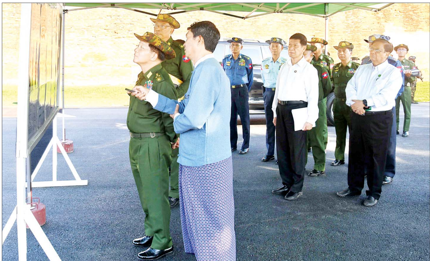
နိုင်ငံတော်စီမံအုပ်ချုပ်ရေးကောင်စီဥက္ကဋ္ဌ နိုင်ငံတော်ဝန်ကြီးချုပ် ဗိုလ်ချုပ်မှူးကြီး မင်းအောင်လှိုင်အား မန္တလေးနန်းမြို့အနောက်ဘက်ရှိ စည်ရှည်တံတား ပြန်လည်တည်ဆောက်ရေးလုပ်ငန်းဆောင်ရွက်နေမှုများကို တာဝန်ရှိသူတစ်ဦးက ရှင်းလင်းတင်ပြစဉ်။

တပ်မတော်အနေဖြင့် ဒို့တာဝန်အရေးသုံးပါးဖြစ်သည့် ပြည်ထောင်စုမပြိုကွဲရေး၊ တိုင်းရင်းသားစည်းလုံးညီညွတ်မှု မပြိုကွဲရေး၊ အချုပ်အခြာအာဏာ တည်တံ့ခိုင်မြဲရေးကို အထူးအလေးထား ဆောင်ရွက်သွားရမည်ဖြစ်ကြောင်း၊ စုစည်းညီညွတ်သည့် အင်အားဖြင့် ဆောင်ရွက်ရမည်ဖြစ်ပြီး တပ်မတော်သားတိုင်းအနေဖြင့် နိုင်ငံတော်ကာကွယ်ရေးနှင့် ပတ်သက်ပါက စစ်သားစိတ်မွေး၍ ဆောင်ရွက်သွား