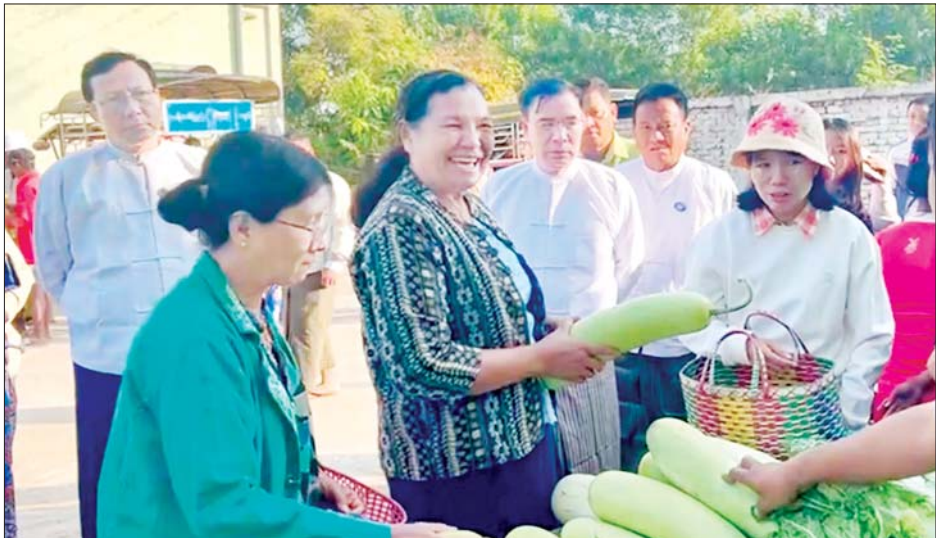
ရွက်ပေးခြင်းဖြစ်၍ ကုန်ပစ္စည်းများ ပြတ်လပ်မှုမရှိ ဆောင်ရွက်ရန် တာဝန်ရှိသူများအား လမ်းညွှန်စေရေးနှင့် ကုန်ပစ္စည်းများ၏ အရည်အသွေးနှင့် မှာကြားခဲ့ကြောင်း သိရသည်။ ဈေးနှုန်းမှန်ကန်မှုရှိစေရေး စဉ်ဆက်မပြတ် ကြီးကြပ် တိုင်းဒေသကြီး(ပြန်/ဆက်)

ယင်းနောက် တိုင်းဒေသကြီးဝန်ကြီးချုပ်နှင့်အဖွဲ့သည် ပဲခူးမြို့ ဥဿာသီရိဈေးအပေါ်ထပ်၌ MSMEs ထုတ်ကုန်များ အရောင်းစင်တာသို့ ရောက်ရှိပြီး ပဲခူးတိုင်းဒေသကြီးအတွင်းရှိ မြို့နယ် ၂၈ မြို့နယ်မှထွက်ရှိလာသည့် ဒေသထွက် စားသုံးကုန်များ၊ လူသုံးကုန်များ၊ တိုင်းရင်းဆေးဝါးများ၊ စားဖိုဆောင်သုံးပစ္စည်းများ၊ လယ်ယာသုံးကိရိယာများကို တစ်နေရာတည်း ဝယ်ယူ/ရောင်းချနိုင်ရေး ဆောင်