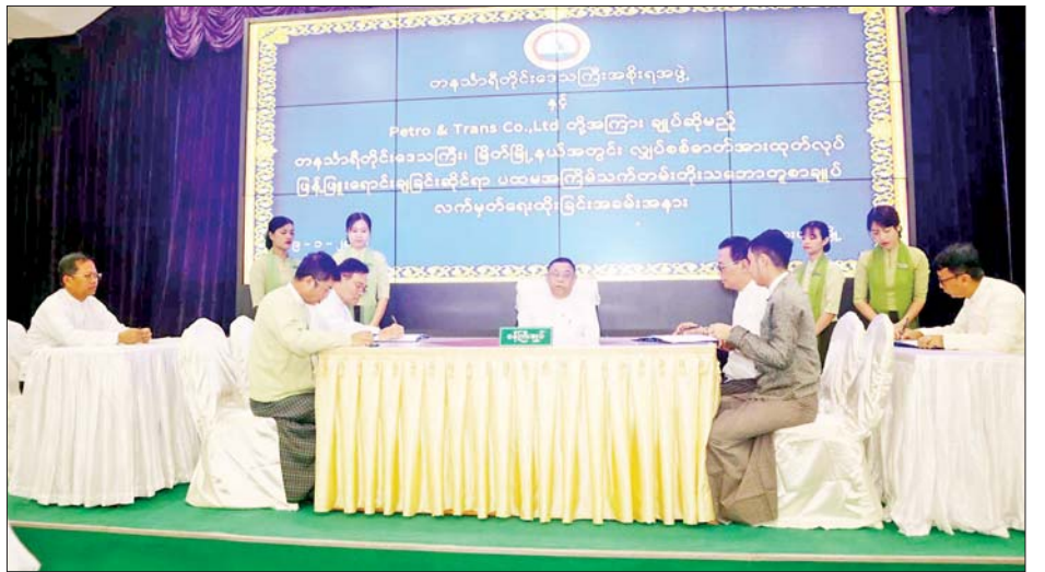
ထုတ်လုပ်ဖြန့်ဖြူးရောင်းချခြင်းဆိုင်ရာ ပထမအကြိမ် ရေးထိုးခဲ့ကြကြောင်း သိရသည်။ သက်တမ်းတိုးသဘောတူစာချုပ်အား လက်မှတ် တိုင်းဒေသကြီး(ပြန်/ဆက်)

ထို့နောက်တာဝန်ရှိသူများက တနင်္သာရီတိုင်း ဒေသကြီးအစိုးရအဖွဲ့နှင့် Petro & Trans Co.,Ltd. တို့အကြား မြိတ်မြို့နယ်အတွင်း လျှပ်စစ်ဓာတ်အား