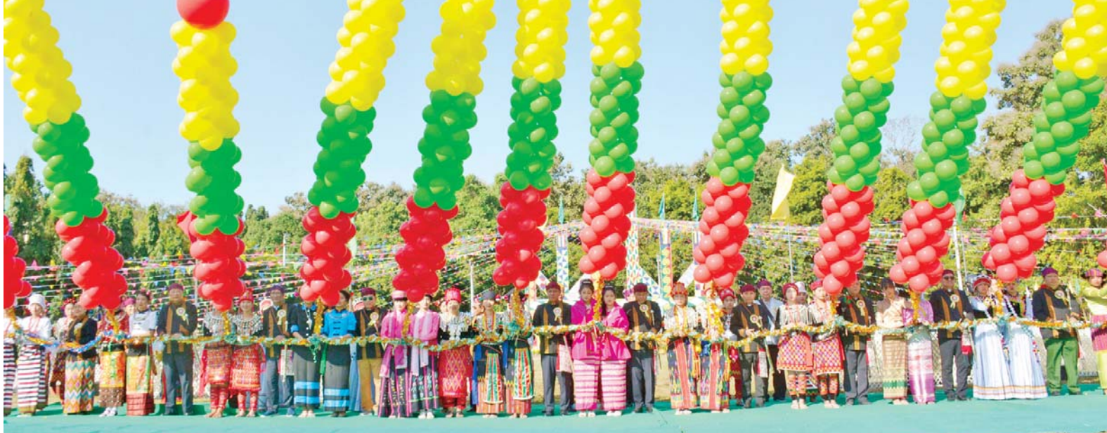
နိုင်ငံတော်စီမံအုပ်ချုပ်ရေး ကောင်စီအဖွဲ့ဝင် ဒုတိယဝန်ကြီးချုပ်နှင့် ပြည်ထောင်စုဝန်ကြီး ဗိုလ်ချုပ်ကြီး တင်အောင်စန်းနှင့် အဖွဲ့ဝင်များ (၇၇) နှစ်မြောက် ကချင်ပြည်နယ်နေ့ အထိမ်းအမှတ် မနောပွဲတော် အခမ်းအနားကို ရိုးရာအစဉ်အလာနှင့်အညီ ဖဲကြိုးဖြတ်ဖွင့်လှစ်ပေးစဉ်။

ဦးစွာ ပြည်နယ်ဝန်ကြီးချုပ် ဦးခက်ထိန်နန်က ရောဝတီ ဆောင်ရွက်ထားရှိမှု ကျန်းမာရေး လေ့ကျင့်ခန်း စုပေါင်းဆောင်ရွက် နေမှုနှင့် အခြေခံပညာကျောင်း များမှ ကျောင်းသား ကျောင်းသူ လေးများ၏ ရိုးရာတေးသီချင်း သရုပ်ဖော် အကအလှများဖြင့် ဖျော်ဖြေတင်ဆက်မှုကို ကြည့်ရှု အားပေးကြကာ ချီးမြှင့်ငွေများ ကို ပေးအပ်ချီးမြှင့်ကြသည်။ ဆက်လက်၍ စီတာပူမနောကွင်း