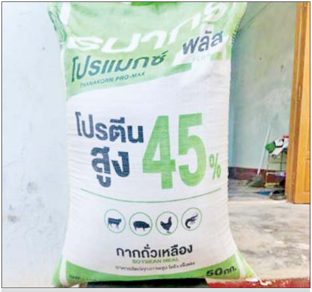
ပဲခူးတိုင်းဒေသကြီး၌ သိမ်းဆည်းရမိမှု။

နေပြည်တော် ဇန်နဝါရီ ၉ တရားမဝင်ကုန်သွယ်မှု တိုက်ဖျက်ရေး ဦးဆောင်ကော်မတီ၏ ကြီးကြပ်ကွပ်ကဲမှုဖြင့် တရားမဝင်ကုန်သွယ်မှုများကို ဥပဒေနှင့်အညီ ထိရောက်စွာ တားဆီးအရေးယူနိုင်ရေး ဆောင်ရွက်လျက်ရှိရာ ဇန်နဝါရီ ၇ ရက်တွင် မကွေးတိုင်းဒေသကြီး တရားမဝင်ကုန်သွယ်မှု တိုက်ဖျက်ရေးအထူးအဖွဲ့၏ စီမံခန့်ခွဲမှုဖြင့် တာဝန်ကျပူးပေါင်းအဖွဲ့က စစ်ဆေးမှုများ ဆောင်ရွက်ခဲ့ရာ မင်းဘူးမြို့ ရွာသစ်ကျေးရွာအနီး၌ တရားမဝင်ရေနံစိမ်း ၄၆၈ ဂါလန်နှင့် ဆက်စပ်ပစ္စည်းတစ်မျိုးစုစုပေါင်း (ခန့်မှန်းတန်ဖိုးငွေကျပ် ၁၇၂၅၀၀၀)ကို သိမ်းဆည်းရမိခဲ့ပြီး ပြည်သူ့ဝိုင်ပစ္စည်း ကာကွယ်ရေးအင်္ဂါအဖွဲ့နှင့်အညီ အရေးယူဆောင်ရွက်လျက်ရှိသည်။ ဇန်နဝါရီ ၈ ရက်တွင် စစ်ကိုင်းတိုင်းဒေသကြီး တရားမဝင်ကုန်သွယ်မှုတိုက်ဖျက်ရေး အထူးအဖွဲ့၏ စီမံခန့်ခွဲမှုဖြင့် တာဝန်ကျပူးပေါင်းအဖွဲ့က စစ်ဆေးမှုများ ဆောင်ရွက်ခဲ့ရာ စစ်ကိုင်းမြို့ ရတနာပုံတံတား ပူးပေါင်းစစ်ဆေးရေးဂိတ်နှင့် ကံတလူပူးပေါင်းစစ်ဆေးရေးဂိတ်တို့၌ လိုင်စင်မဲ့ Nissan Note ယာဉ်တစ်စီးနှင့် Nissan AD Van ယာဉ်တစ်စီး (ခန့်မှန်း တန်ဖိုးငွေကျပ် ၁၉၀၀၀၀၀)ကို ပို့ကုန်သွင်းကုန် ဥပဒေအရလည်းကောင်း၊ စစ်ကိုင်းမြို့ ရတနာပုံတံတားပူးပေါင်းစစ်ဆေးရေးဂိတ်၌ တရားမဝင် စက်သုံးဆီ ဒီဇယ်ဆီ ၁၁ ပီပီ၊ ဓာတ်ဆီ ပီပီ ၇၀ (ခန့်မှန်းတန်ဖိုးငွေကျပ် ၄၅၀၀၀၀)ကို ရေနံနှင့် ရေနံထွက်ပစ္စည်းဆိုင်ရာ ဥပဒေအရလည်းကောင်း (စုစုပေါင်း ခန့်မှန်း တန်ဖိုးငွေကျပ် ၅၉၅၀၀၀၀)ကို သိမ်းဆည်းအရေးယူ ဆောင်ရွက်လျက်ရှိသည်။ ထို့ပြင် ပဲခူးတိုင်းဒေသကြီး တရားမဝင်ကုန်သွယ်မှု တိုက်ဖျက်ရေးအထူးအဖွဲ့၏ စီမံခန့်ခွဲမှုဖြင့် တာဝန်ကျ ပူးပေါင်းအဖွဲ့များက