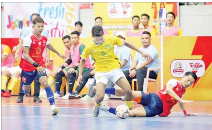
MH Dream Team အသင်းနှင့် YRG အသင်းတို့ ယှဉ်ပြိုင်ကစားကြစဉ်။

ပွဲစဉ်(၄)တွင် MIU အသင်းက Winner Soccer အသင်းကို နှစ်ဂိုး-တစ်ဂိုး၊ ဖူဆယ်ချစ်သူအသင်းက SGF အသင်းကို ခြောက်ဂိုး-ဂိုးမရှိ Generations အသင်းက VUC အသင်းကို သုံးဂိုး-နှစ်ဂိုးဖြင့် အနိုင်ရပြီး MH Dream Team အသင်းနှင့် စာမျက်နှာ ၂၀ ကော်လံ ၁ သို့