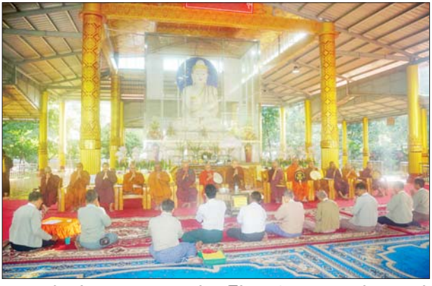
ရေးကော်မတီဥက္ကဋ္ဌ၊ ဘဏ္ဍာတော်ကြီး ဂေါပကဥက္ကဋ္ဌနှင့် အဖွဲ့ဝင်ထိန်းဂေါပကအဖွဲ့၊ စေတီတော်များ၊ စေတနာရှင် အလှူရှင်များ

မြောက်ဥက္ကလာပ ဇန်နဝါရီ ၉ ရန်ကုန်တိုင်းဒေသကြီး မြောက်ဥက္ကလာပမြို့၌ ဆုတောင်းပြည့်မယ်လမုစေတီတော်ဘဏ္ဍာတော်ထိန်းဂေါပကအဖွဲ့က ဦးစီးကျင်းပသော(၅၅)ကြိမ်မြောက်ဗုဒ္ဓပူဇော်ပွဲတော် ဗုဒ္ဓါဘိသေက အနေကဇာတင်အခမ်းအနားကို ယနေ့နံနက် ၅ နာရီက ဆုတောင်းပြည့်မယ်လမုစေတီတော်ကြီး၌ ကျင်းပသည်။