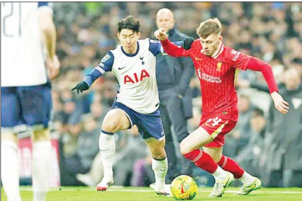
စပါးအသင်းနှင့် လီဗာပူးအသင်းတို့ ယှဉ်ပြိုင်ကစားကြစဉ်။