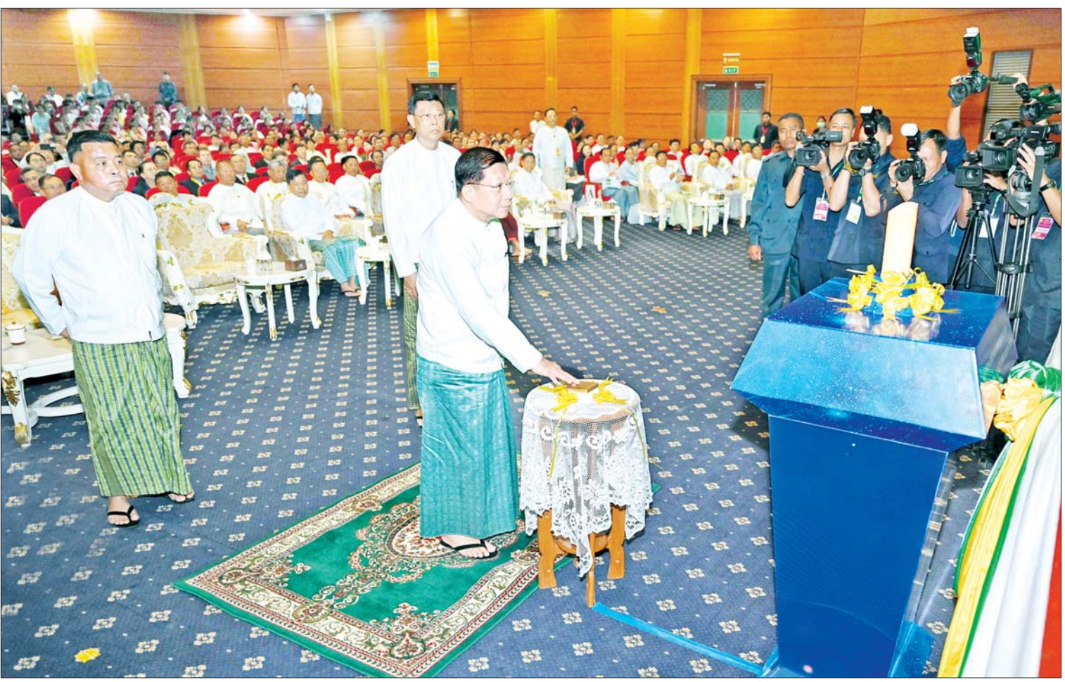
နိုင်ငံတော်စီမံအုပ်ချုပ်ရေးကောင်စီဥက္ကဋ္ဌ နိုင်ငံတော်ဝန်ကြီးချုပ် ဗိုလ်ချုပ်မှူးကြီးမင်းအောင်လှိုင် ပညာဆီမီးတိုင်ကို စက်ခလုတ်နှိပ် ထွန်းညှိပေးစဉ်။

နေပြည်တော် ဇန်နဝါရီ ၉ ပညာရေးဆိုင်ရာ အသုံးချသုတေသန နိုင်ငံတကာညီလာခံ(၂၀၂၅)ဖွင့်ပွဲ အခမ်းအနားကို ယနေ့နံနက်ပိုင်းတွင် နေပြည်တော်ရှိမြန်မာအပြည်ပြည်ဆိုင်ရာ ကွန်ဗင်းရှင်းဗဟိုဌာန(၂)၅၅ ကျင်းပပြုလုပ်ရာ နိုင်ငံတော်စီမံအုပ်ချုပ်ရေးကောင်စီ ဥက္ကဋ္ဌ နိုင်ငံတော်ဝန်ကြီးချုပ် ဗိုလ်ချုပ်မှူးကြီး မင်းအောင်လှိုင် တက်ရောက်၍ မိန့်ခွန်းပြောကြားသည်။ တက်ရောက် အခမ်းအနားသို့ နိုင်ငံတော်စီမံအုပ်ချုပ်ရေးကောင်စီဥက္ကဋ္ဌ နိုင်ငံတော်ဝန်ကြီးချုပ် ဗိုလ်ချုပ်မှူးကြီးမင်းအောင်လှိုင်၊ ကောင်စီ ဒုတိယဥက္ကဋ္ဌ ဒုတိယဝန်ကြီးချုပ် ဒုတိယဗိုလ်ချုပ်မှူးကြီး စိုးဝင်း၊ ကောင်စီတွဲဖက် အတွင်းရေးမှူး ဗိုလ်ချုပ်ကြီးရဲဝင်းဦး၊ ကောင်စီဝင်များ၊ ပြည်ထောင်စုဝန်ကြီးများနှင့် ပြည်ထောင်စုအဆင့်ပုဂ္ဂိုလ်များ၊ နိုင်ငံတကာသံရုံးများမှ မြန်မာနိုင်ငံဆိုင်ရာ သံအမတ်ကြီးများ၊ နေပြည်တော် ကောင်စီဥက္ကဋ္ဌ၊ ကာကွယ်ရေးဦးစီးချုပ်ရုံးမှ အဆင့်မြင့် တပ်မတော်အရာရှိကြီးများ၊ နေပြည်တော်တိုင်း စစ်ဌာနချုပ်တိုင်းမှူး၊ ဒုတိယဝန်ကြီးများ၊ ပါမောက္ခချုပ်များနှင့် ကျောင်းအုပ်ကြီးများ၊ တိုင်းဒေသကြီးနှင့် စာမျက်နှာ ၄ ကော်လံ ၁ သို့ ။