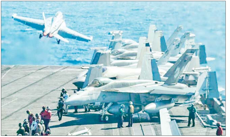
ယခုနှစ် ဇန်နဝါရီလကတည်းက ဟူသီပစ်မှတ်များကို လေကြောင်းတိုက်ခိုက်မှုများ ပုံမှန်ပြုလုပ်လျက် ရှိကြောင်း သိရသည်။ ကိုးကား - အင်န်အိတ်ချ်ကေ ဘာသာပြန် - အောင်ကျော်ကျော်

ဖြစ်နိုင်ဖွယ်ရှိကြောင်း သိရသည်။ ဟူသီအဖွဲ့သည် တောင်ပိုင်းပင်လယ်နီနှင့် အေဒင်ပင်လယ်ကွေ့ရှိ အမေရိကန်ရေတပ် စစ်သင်္ဘောများနှင့် ကုန်သည်သင်္ဘောများကို တိုက်ခိုက်ရန် အဆိုပါ အဆောက်အအုံများကို အသုံးပြုခဲ့သည်။ တိုက်ခိုက်မှုများနှင့် ပတ်သက်၍ ဟူသီအဖွဲ့က ချက်ချင်း မှတ်ချက်ပေးခြင်းမရှိသေးပေ။ ၂၀၂၃ ခုနှစ် နိုဝင်ဘာလကတည်းက ဟူသီအဖွဲ့သည် အစွဲအမူးနိုင်ငံရှိမြို့များကို ခိုးလက်နက်များ အပါအဝင် ဒရုန်းများဖြင့် တိုက်ခိုက်မှုများ လုပ်ဆောင်ခဲ့ပြီး ပင်လယ်နီတွင် အစွဲအမူးနှင့်ဆက်သွယ်သော သင်္ဘောများကိုလည်း ပစ်ခတ်ဖျက်ဆီးခဲ့ကြောင်း သိရသည်။ ယင်းသို့ ဟူသီ၏ လုပ်ရပ်များကို တုံ့ပြန်သည့် အနေဖြင့် အဆိုပါဒေသတွင် တပ်စွဲထားသော အမေရိကန်ဦးဆောင်သော ရေတပ်ညွှန်ပေါင်းအဖွဲ့သည် ဟူသီလက်နက်ကိုင်အဖွဲ့အား ဟန့်တားရန်အတွက်