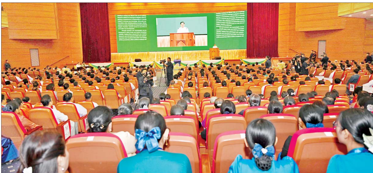
နိုင်ငံတော်စီမံအုပ်ချုပ်ရေးကောင်စီဥက္ကဋ္ဌ နိုင်ငံတော်ဝန်ကြီးချုပ် ဗိုလ်ချုပ်မှူးကြီး မင်းအောင်လှိုင် ပညာရေးဆိုင်ရာအသုံးချသုတေသန နိုင်ငံတကာညီလာခံ (၂၀၂၅) ဖွင့်ပွဲအခမ်းအနားတွင် မိန့်ခွန်းပြောကြားစဉ်။

ဖဲကြိုးဖြတ်ဖွင့်လှစ် ဦးစွာ နိုင်ငံတော်စီမံအုပ်ချုပ်ရေးကောင်စီ ဒုတိယဥက္ကဋ္ဌ ဒုတိယဝန်ကြီးချုပ် ဒုတိယဗိုလ်ချုပ်မှူးကြီး စိုးဝင်း၊ ကောင်စီတွဲဖက်အတွင်းရေးမှူး ဗိုလ်ချုပ်ကြီး ရဲဝင်းဦး၊ ကောင်စီဝင်ဗိုလ်ချုပ်ကြီးမြထွန်းဦး၊ ပညာရေးဝန်ကြီးဌာန ပြည်ထောင်စုဝန်ကြီး ဒေါက်တာညွန့်ဖေနှင့် သိပ္ပံနှင့် နည်းပညာဝန်ကြီးဌာန ပြည်ထောင်စုဝန်ကြီး ဒေါက်တာမျိုးသိန်းကျော်တို့က အခမ်းအနားကို ဖဲကြိုးဖြတ်ဖွင့်လှစ်ပေးကြသည်။