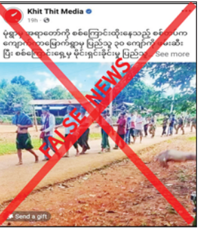
လက်နက်ကြီးများဖြင့် ပစ်ခတ်တိုက်ခိုက်ခြင်းများ လုပ်ဆောင်

ရှိသည်ကို တွေ့ရသည်။ မှန်ကန်မှုမရှိ အဆိုပါ သတင်းနှင့်ပတ်သက်၍ သက်ဆိုင်ရာလုံခြုံရေး တာဝန်ရှိသူ တစ်ဦး၏ ပြောကြားချက်အရ ၎င်းဖြစ်စဉ်မှာ မှန်ကန်မှုမရှိကြောင်း၊ အကြမ်းဖက် သမားများကသာ အစိုးရ၏ အုပ်ချုပ်မှုယန္တရားများ ပျက်ပြားစေရန်အတွက် ဌာနဆိုင်ရာ အဆောက်အအုံများကို Drop Bomb ချတိုက်ခိုက်ခြင်း၊