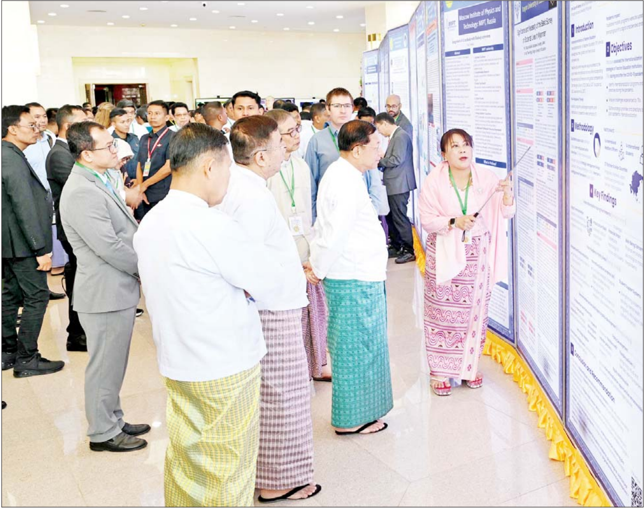
နိုင်ငံတော်စီမံအုပ်ချုပ်ရေးကောင်စီဥက္ကဋ္ဌ နိုင်ငံတော်ဝန်ကြီးချုပ် ဗိုလ်ချုပ်မှူးကြီး မင်းအောင်လှိုင် ခင်းကျင်းပြသထားသည့် ပညာရေးဆိုင်ရာအသုံးချသုတေသန နိုင်ငံတကာညီလာခံ (၂၀၂၅) အထိမ်းအမှတ် ပိုစတာပြခန်းကို ကြည့်ရှုစဉ်။

○ စာမျက်နှာ ၄ မှ နိုင်ငံတော်အနေဖြင့် တိုင်းပြည် သာယာဝပြောရေးနှင့် စားရေ ရိက္ခာဖူလုံရေးတို့အတွက် စိုက်ပျိုးရေးနှင့်မွေးမြူရေးကို ခေတ်မီနည်းစနစ်များဖြင့် တိုးတက်အောင်ဆောင်ရွက်ပြီး အခြားစီးပွားရေးကဏ္ဍများကိုလည်း ဘက်စုံဖွံ့ဖြိုးတိုးတက်အောင် တည်ဆောက်ရေးအတွက် ဦးတည်ချက်ချမှတ်အကောင်အထည်ဖော် လျက်ရှိကြောင်း၊ ခေတ်မီ စိုက်ပျိုးမွေးမြူရေးလုပ်ငန်းများကို အောင်မြင်စွာဆောင်ရွက်နိုင်ရေး အတတ်ပညာရှင်များ လိုအပ်မည်ဖြစ်ကြောင်း၊ ထို့ကြောင့် စိုက်ပျိုးမွေးမြူရေးနှင့် စက်မှုနည်းပညာဆိုင်ရာ လူသားအရင်းအမြစ်များ မွေးထုတ်နိုင်ရေးအတွက် ခရိုင်အသီးသီးတွင် စက်မှု၊ စိုက်ပျိုးရေးနှင့် မွေးမြူရေးပညာများကို သင်ကြားပေးနေသည့် အခြေခံပညာအထက်တန်းကျောင်း ၈၅ ကျောင်းကို ဖွင့်လှစ်သင်ကြားပေးလျက်ရှိပြီး KG+9 ပြီး မြောက်အောင်မြင်သူများ တက်ရောက်နိုင်မည်ဖြစ်ကြောင်း၊ ထိုမှတစ်ဆင့် ထူးချွန်စွာ အောင်မြင်ပါက သက်ဆိုင်ရာတက္ကသိုလ်၊ ကောလိပ်များကို ဆက်လက်တက်ရောက်နိုင်မည်ဖြစ်ကြောင်း၊ နိုင်ငံအတွက် ပညာရှင်များစွာ လိုအပ်လျက် ရှိနေဆဲဖြစ်သောကြောင့် အသိပညာရှင်၊ အတတ်ပညာရှင် လူသားအရင်းအမြစ်များ မွေးထုတ်ပေးနိုင်ရေး နိုင်ငံတော်