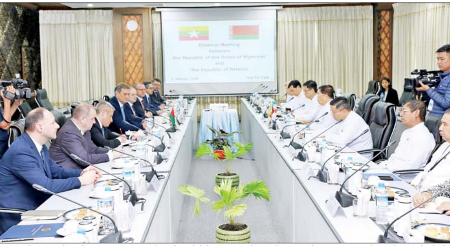
ပူးပေါင်းဆောင်ရွက်ရေး၊ ၂၀၂၄ ခုနှစ်တွင် နှစ်နိုင်ငံ သံတမန်ဆက်ဆံရေးထူထောင်မှု (၂၅) နှစ်ပြည့် မြောက်ခဲ့သည့် အခါသမယ၌ နှစ်နိုင်ငံပူးပေါင်းဆောင် ရွက်ရေးနယ်ပယ်များတွင် အောင်မြင်မှုများ ရရှိခဲ့ သည့်အခြေအနေ၊ စီးပွားရေး၊ ကုန်သွယ်ရေး၊ စိုက်ပျိုး ရေးနှင့် မွေးမြူရေး၊ ပညာရေးနှင့် ကာကွယ်ရေးကဏ္ဍ များအပါအဝင် နှစ်နိုင်ငံပြည်သူအချင်းချင်း ထိတွေ့ ဆက်ဆံမှုနှင့် နှစ်နိုင်ငံအကြား အပြန်အလှန်အကျိုး

နေပြည်တော် ဇန်နဝါရီ ၉ ဒုတိယဝန်ကြီးချုပ်နှင့် နိုင်ငံခြားရေးဝန်ကြီးဌာန ပြည်ထောင်စုဝန်ကြီး ဦးသန်းဆွေနှင့် ဘယ်လာရစ် သမ္မတနိုင်ငံ နိုင်ငံခြားရေးဝန်ကြီးဌာန ဝန်ကြီး H.E. Mr. Maxim RYZHENKOV တို့ တွေ့ဆုံဆွေးနွေးပွဲကို ယနေ့နံနက် ၉ နာရီတွင် နေပြည်တော်ရှိ နိုင်ငံခြားရေး ဝန်ကြီးဌာန၌ ကျင်းပသည်။ ဆွေးနွေးပွဲသို့ နိုင်ငံခြားရေးဝန်ကြီးဌာန ဒုတိယ ဝန်ကြီးနှင့် ဌာနဆိုင်ရာတာဝန်ရှိသူများ၊ မြန်မာနိုင်ငံ ဆိုင်ရာ ဘယ်လာရစ်သံအမတ်ကြီး၊ ဘယ်လာရစ် စက်မှုဝန်ကြီးဌာန၊ ကျန်းမာရေးဝန်ကြီးဌာန၊ စိုက်ပျိုး ရေးနှင့်စားနပ်ရိက္ခာဝန်ကြီးဌာနတို့မှ ဒုတိယဝန်ကြီး များ၊ ဘယ်လာရစ် တက္ကသိုလ်၏ ဒုတိယပါမောက္ခချုပ် နှင့် ဘယ်လာရစ် နိုင်ငံခြားရေးဝန်ကြီးဌာနမှ တာဝန် ရှိသူများ တက်ရောက်ကြသည်။ ဆွေးနွေးပွဲတွင် မြန်မာ-ဘယ်လာရစ်နှစ်နိုင်ငံ နိုင်ငံခြားရေးဝန်ကြီးဌာနများအကြား ပိုမို နီးကပ်စွာ