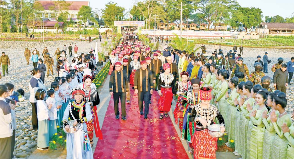
ရောဝတီရှုခင်းသာ အပန်းဖြေစခန်း ဖွင့်ပွဲအခမ်းအနားကျင်းပစဉ်။

ထို့နောက် ဒုတိယဝန်ကြီးချုပ် နှင့် ပြည်ထောင်စုဝန်ကြီးနှင့် အဖွဲ့ဝင်များသည် ပြည်နယ် ဝန်ကြီးချုပ်နှင့်အတူ (၇၇)နှစ် မြောက် ကချင်ပြည်နယ်နေ့ အထိမ်းအမှတ် မြစ်ကြီးနားမြို့ ရောဝတီကွက်ရှိ ကချင်ပြည်နယ် ယဉ်ကျေးမှုပြတိုက် အဆောင်သစ် ပထမအဆင့် ဖွင့်ပွဲအခမ်းအနားသို့ တက်ရောက်ကြသည်။