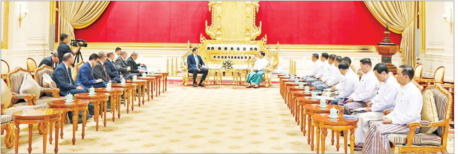
နိုင်ငံတော်စီမံအုပ်ချုပ်ရေးကောင်စီဥက္ကဋ္ဌ နိုင်ငံတော်ဝန်ကြီးချုပ် ဗိုလ်ချုပ်မှူးကြီးမင်းအောင်လှိုင် ဘယ်လာရစ်သမ္မတနိုင်ငံ နိုင်ငံခြားရေးဝန်ကြီး H.E. Mr. Uladzimir BARAVIKOU၊ အား လက်ခံတွေ့ဆုံစဉ်။