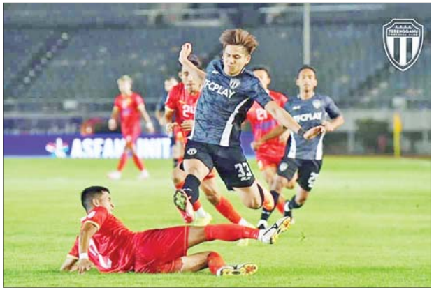
ဇန်နဝါရီ ၈ ရက်က မြန်မာကလပ် ရှမ်းယူနိုက်တက်နှင့် မလေးရှားကလပ် တီရန်ဂါနူးအသင်းတို့ ယှဉ်ပြိုင်နေစဉ်။

နေပြည်တော် ဇန်နဝါရီ ၉ ၂၀၂၄-၂၀၂၅ ရာသီ အာဆီယံကလပ် ချန်ပီယံရှစ်ပြိုင်ပွဲ အုပ်စုတတိယပွဲစဉ်များကို ဇန်နဝါရီ ၈၊ ၉ ရက်က ဆက်လက်ကျင်းပသည်။ အုပ်စု (A) တတိယနေ့တွင် မလေးရှားကလပ် တီရန်ဂါနူးအသင်းက မြန်မာကလပ် ရှမ်းယူနိုက်တက်အသင်းကို အဝေးကွင်း၌ ငါးဂိုးပြတ်၊ အင်ဒိုနီးရှားကလပ် မကာဆာအသင်းက ကမ္ဘောဒီးယားကလပ် Preah Khan Reach Svay Rieng အသင်းကို အဝေးကွင်း၌ တစ်ဂိုး-ဂိုးမရှိဖြင့် အနိုင်ရရှိပြီး ထိုင်းကလပ် BG ပါသွန်ယူနိုက်တက်အသင်းနှင့် ဗီယက်နမ်