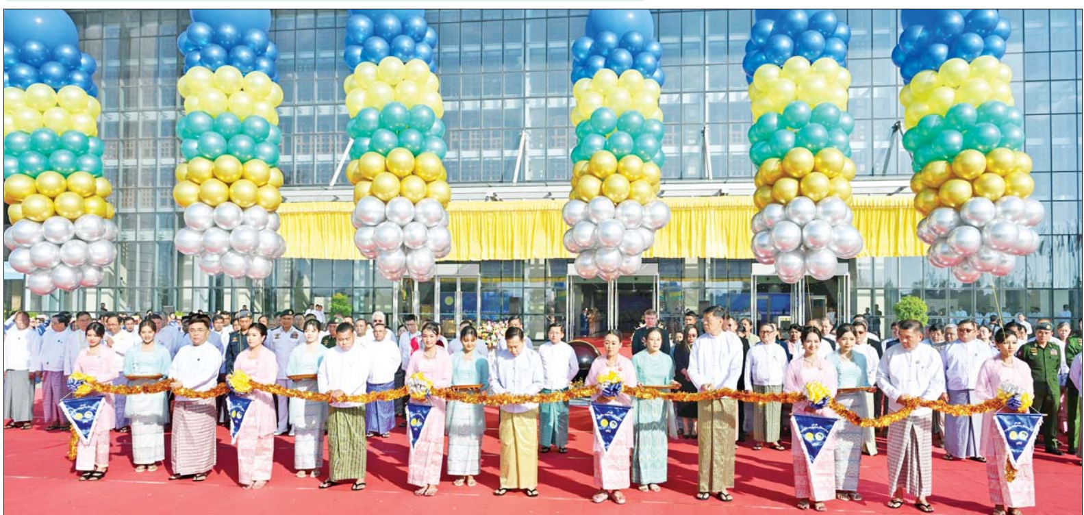
နိုင်ငံတော်စီမံအုပ်ချုပ်ရေးကောင်စီ ဒုတိယဥက္ကဋ္ဌ ဒုတိယဝန်ကြီးချုပ် ဒုတိယဗိုလ်ချုပ်မှူးကြီး စိုးဝင်း၊ ကောင်စီတွဲဖက်အတွင်းရေးမှူး ဗိုလ်ချုပ်ကြီးရဲဝင်းဦး၊ ကောင်စီဝင်ဗိုလ်ချုပ်ကြီးမြထွန်းဦး၊ ပြည်ထောင်စုဝန်ကြီး ဒေါက်တာညွန့်ဖေနှင့် ပြည်ထောင်စုဝန်ကြီး ဒေါက်တာမျိုးသိန်းကျော်တို့က ပညာရေးဆိုင်ရာ အသုံးချသုတေသန နိုင်ငံတကာညီလာခံ (၂၀၂၅) ဖွင့်ပွဲအခမ်းအနားကို ဖဲကြိုးဖြတ်ဖွင့်လှစ်ပေးကြစဉ်။

ကျွမ်းကျင်လုပ်သားများ မွေးထုတ်ပေးနိုင်မည် သုတေသန လုပ်ငန်းများ ကြောင့် အသေးစား၊ အငယ်စားနှင့် အလတ်စား စီးပွားရေးလုပ်ငန်းများအတွက် နည်းပညာသစ်များ ဖော်ထုတ်ပြီး ဈေးကွက်သစ်များ ချဲ့ထွင်နိုင်မည် ဖြစ်သကဲ့သို့ နည်းပညာ၊ သက်မွေးပညာရေးနှင့် လေ့ကျင့်ရေးအတွက် ကျွမ်းကျင်မှု အရည်အသွေးများနှင့် ပြည့်စုံသည့် ကျွမ်းကျင်လုပ်သားများကို မွေးထုတ်ပေးနိုင်မည်ဖြစ်ကြောင်း၊ ယနေ့ကျင်းပသည့် နိုင်ငံတကာ သုတေသနညီလာခံကြီးမှ သုတေသနနှင့် ဖွံ့ဖြိုးတိုးတက်မှုအတွက် အရေးပါသည့် ပူးပေါင်းဆောင်ရွက်မှုတံခါးသစ်ကို ဖွင့်လှစ်ပေးသွားလိမ့်မည်ဟု ယုံကြည်ကြောင်း။