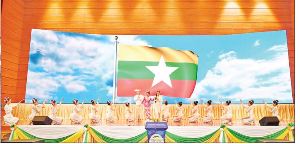
နိုင်ငံတော်စီမံအုပ်ချုပ်ရေးကောင်စီဥက္ကဋ္ဌ နိုင်ငံတော်ဝန်ကြီးချုပ် ဗိုလ်ချုပ်မှူးကြီး မင်းအောင်လှိုင်နှင့် အခမ်းအနားတက်ရောက်လာကြသူများ ကျောင်းသား ကျောင်းသူများ၏ သီဆိုကပြပျော်ဖြေမှုကို ကြည့်ရှုအားပေးကြစဉ်။