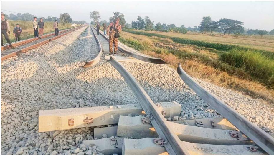
၁၄-၁၂-၂၀၂၄ ရက်နေ့က ရန်ကုန်-မန္တလေးရထားလမ်းပိုင်းအတွင်းရှိ တော်ဝိနှင့် ပိန်းဇလုပ်ဘူတာ အကြား အစုန်ရထားလမ်းပေါ်၌ အကြမ်းဖက်သောင်းကျန်းသူအဖွဲ့က မိုင်းဖောက်ခွဲမှုကြောင့် ပျက်စီးမှု အခြေအနေကို တွေ့ရစဉ်။