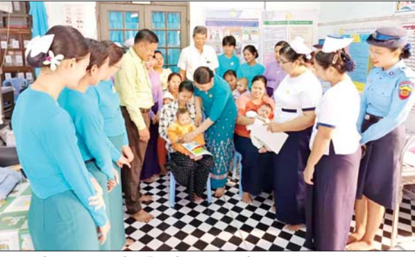
မွေးကင်းစမှ အသက် ခြောက်လ အောက်ကလေးများ၊ အသက် ခြောက်လမှ အသက် တစ်နှစ် အောက်ကလေးများ၊ အသက် တစ်နှစ်မှ အသက် နှစ်နှစ်အထက် ကလေးများနှင့် ကိုယ်ဝန်ဆောင် မိခင် ၁၅ ဦးတို့ ပါဝင်ယှဉ်ပြိုင်ကြ

ရေကြည် ဇန်နဝါရီ ၃ ဧရာဝတီ တိုင်းဒေသကြီး ရေကြည်မြို့နယ် မိခင်နှင့် ကလေး စောင့်ရှောက်မှုကြီးကြပ်ရေးအဖွဲ့ က ကြီးမှူးကျင်းပသည့် (၇၇)နှစ် မြောက် လွတ်လပ်ရေးနေ့ကို ကြိုဆိုဂုဏ်ပြုသောအားဖြင့် စံပြု မိခင်နှင့် ကလေးပြိုင်ပွဲကို ယနေ့ နံနက်ပိုင်းက မြို့နယ်မိခင်နှင့် ကလေး စောင့်ရှောက်ရေးဌာန၌ ကျင်းပသည်။