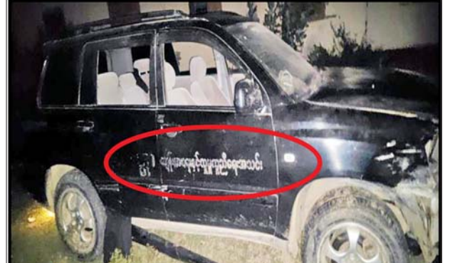
PDF အမည်ခံအကြမ်းဖက်သမားများ ခိုအောင်းနေထိုင်လျက်ရှိသည့် ငါန်းဇွန်မြို့နယ် ကုလားကျေးရွာအတွင်း ဝင်ရောက်ရှင်းလင်းစဉ် ဖော်ထုတ်သိမ်းဆည်းရမိသည့် ၎င်းတို့အသုံးပြုလျက်ရှိသည့် မော်တော်ယာဉ်များအား တွေ့မြင်ရစဉ်။

PDF အမည်ခံအကြမ်းဖက်သမားများ ခိုအောင်းနေထိုင်လျက်ရှိသည့် ငါန်းဇွန်မြို့နယ် ကုလားကျေးရွာအတွင်း ဝင်ရောက်ရှင်းလင်းစဉ် ဖော်ထုတ်သိမ်းဆည်းရမိသည့် ဖောက်ခွဲဖျက်ဆီးရေးပစ္စည်းများအား တွေ့မြင်ရစဉ်။