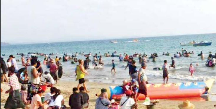
ငွေဆောင်ကမ်းခြေသို့ လာရောက်လည်ပတ်ကြသူများကို တွေ့ရစဉ်။

သုံးဆူတို့သို့ သွားရောက်လည်ပတ်ခြင်း၊ မိုးမခဆင်စခန်းနှင့် ငွေဆောင်ဆင်စခန်းတို့သို့လည်း သွားရောက်လည်ပတ် အပန်းဖြေခဲ့ကြကြောင်း သိရသည်။ ကျော်လင်းဦး(ပြန်/ဆက်)