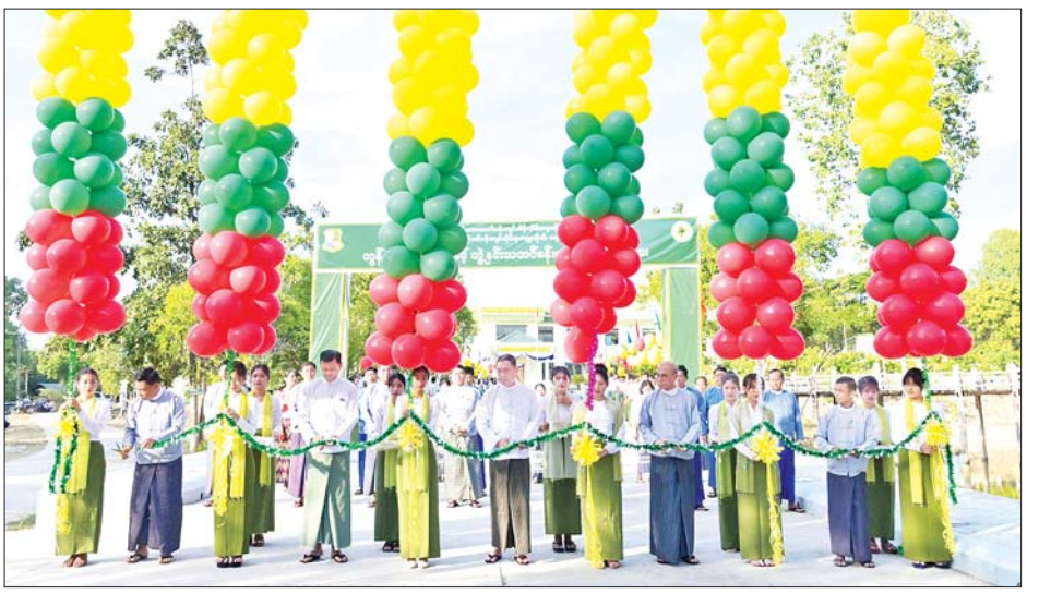
နှင့် တာဝန်ရှိသူများသည် အတန်းအလိုက် ပထမ၊ ဒုတိယ၊ တတိယဆုရရှိသူများအား ဂုဏ်ပြုဆုများ ပေးအပ်ချီးမြှင့်ကြသည်။ ယင်းနောက် ပြည်ထောင်စုဝန်ကြီးသည် သစ်တောနှင့်ပတ်ဝန်းကျင်ဆိုင်ရာ တက္ကသိုလ် ရန်အောင်မြင်အမျိုးသားဆောင်၌ ကျင်းပသည့် မောင်မယ်သစ်လွင်ကြိုဆိုပွဲသို့ တက်ရောက် အမှာစကားပြောကြားပြီး ကျောင်းသား ကျောင်းသူများ၏ အဆို၊ အကနှင့် တေးသရုပ်ဖော် ဖျော်ဖြေမှုကို ကြည့်ရှုအားပေးခဲ့ကြောင်း သိရသည်။ သတင်းစဉ်

ခန်းမတွင် ဆက်လက်ကျင်းပရာ ပြည်ထောင်စုဝန်ကြီးက အမှာစကားပြောကြားပြီး ပြည်ထောင်စုဝန်ကြီး၊ ဒုတိယဝန်ကြီးနှင့် တာဝန်ရှိသူများက စိုက်ခင်း၊ တရားမဝင်သစ်ဖမ်းဆီးရမိမှုနှင့် အားကစားပြိုင်ပွဲများတွင် ပထမ၊ ဒုတိယ၊ တတိယ ဆုရရှိသူများနှင့် ဆုရအသင်းများကို ဆုများပေးအပ်ချီးမြှင့်ကြသည်။ ဥပဒေပိုင်းတွင် သစ်တောနှင့် ပတ်ဝန်းကျင်ဆိုင်ရာ တက္ကသိုလ်(ရေဆင်း) ဘွဲ့နှင်းသဘင်ခန်းမ ဖွင့်ပွဲ၊ မောင်မယ်သစ်လွင်ကြိုဆိုပွဲနှင့် ဆုချီးမြှင့်ခြင်း အခမ်းအနားကို ကျင်းပရာ ပြည်ထောင်စုဝန်ကြီးနှင့် တာဝန်ရှိသူများက ဘွဲ့နှင်းသဘင်ခန်းမကို ဖဲကြိုးဖြတ်ဖွင့်လှစ်ပေးပြီး ကမ္ဘာ့ကျောက်စာကို အမွှေးနံ့သာရည်ဖြင့် ပတ်ဖျန်းပေးသည်။ ထို့နောက် ပြည်ထောင်စုဝန်ကြီးက အမှာစကားပြောကြားပြီး ပြည်ထောင်စုဝန်ကြီး၊ ဒုတိယဝန်ကြီး