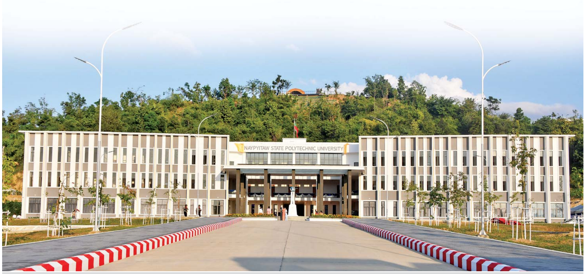
နိုင်ငံတော်အစိုးရက အနာဂတ်မျိုးဆက်သစ်များအတွက် ပညာရေး ရေခံမြေခံကောင်းများစွာ ဖန်တီးပေးလျက်ရှိရာ (၂၀-၁၁-၂၀၂၄)ရက်နေ့က ဖွင့်လှစ်ခဲ့သည့် Naypyitaw State Polytechnic University ကို တွေ့ရစဉ်။

တန်ဖိုးထားရမည့်အရာ တန်ဖိုးထားတတ်မှ ယနေ့အချိန်အခါတွင် အရေးကြီးသည်က ဖြည့်ဆည်းရမည့် စိတ်ဓာတ်ပိုင်း ခံယူချက်နှင့် စိတ်ဓာတ်အရည်အသွေးများပင်ဖြစ်သည်ဟု ဆိုရမည်။ တန်ဖိုးထားရမည့်အရာကို တန်ဖိုးထားတတ်အောင် သိရှိနက်သလို ရိုက်သွင်းထားဖို့ လိုသည်ဟု ထင်ပါသည်။ ယနေ့မျိုးဆက် အထူးထုတ် [ ၈ ] သို့ >>>