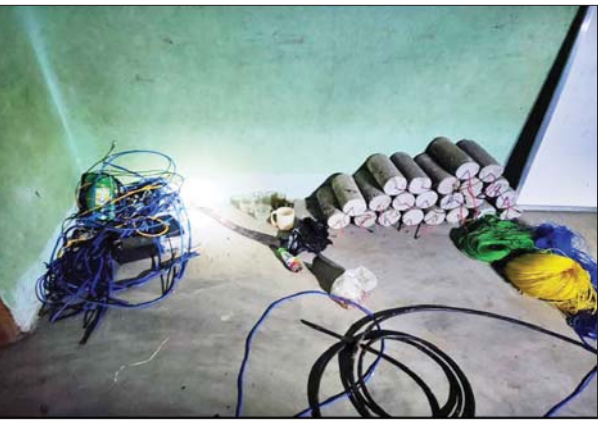
ဖောက်ခွဲရေးပစ္စည်းများ

အထောက်အကူပြုသည့် ပညာရည်မြင့်မားမှုကို ပိတ်ပင်ဖျက်ဆီးမှုဖြစ်သဖြင့် ရာဇဝတ်မှုကျူးလွန်ခြင်းဖြစ်ကြောင်းနှင့် အဆိုပါ သိမ်းဆည်းရမိ ဆက်စပ်ပစ္စည်းများအား လုပ်ထုံးလုပ်နည်းများနှင့်အညီ ဆက်လက်ဆောင်ရွက်သွားမည်ဖြစ်သည်။