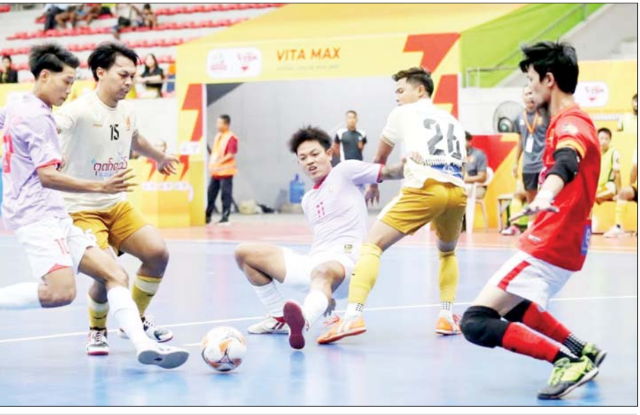
JZ Yangon အသင်းနှင့် Black Cross အသင်းတို့ ယှဉ်ပြိုင်ကစားကြစဉ်။

ရန်ကုန် ဇန်နဝါရီ ၃ ၂၀၂၄-၂၀၂၅ ရာသီ MFF ဖူဆယ်လိဂ်-၂ ပြိုင်ပွဲ ပွဲစဉ် (၂) ကို ဇန်နဝါရီ ၃ ရက်က ရန်ကုန်မြို့ သုဝဏ္ဏကွင်းရှိ MFF ဖူဆယ် အားကစားရုံ၌ ဆက်လက် ကျင်းပရာ Pacific Sun Far အသင်းနှင့် JZ Yangon အသင်းတို့ နိုင်ပွဲဆက်ခဲ့သည်။ ပွဲစဉ် (၂) တွင် လက်ဝဲသုန္ဒရ အသင်းက Maryar အသင်းကို သုံးဂိုး-နှစ်ဂိုး၊ JZ Yangon အသင်း က Black Cross အသင်းကို ခုနစ်ဂိုး-သုံးဂိုး၊ Gold Dream အသင်းက ရွှေပြည်သာယူနိုက် တက်အသင်းကို သုံးဂိုး-တစ်ဂိုး၊ စာမျက်နှာ ၁၉ ကော်လံ ၁ သို့