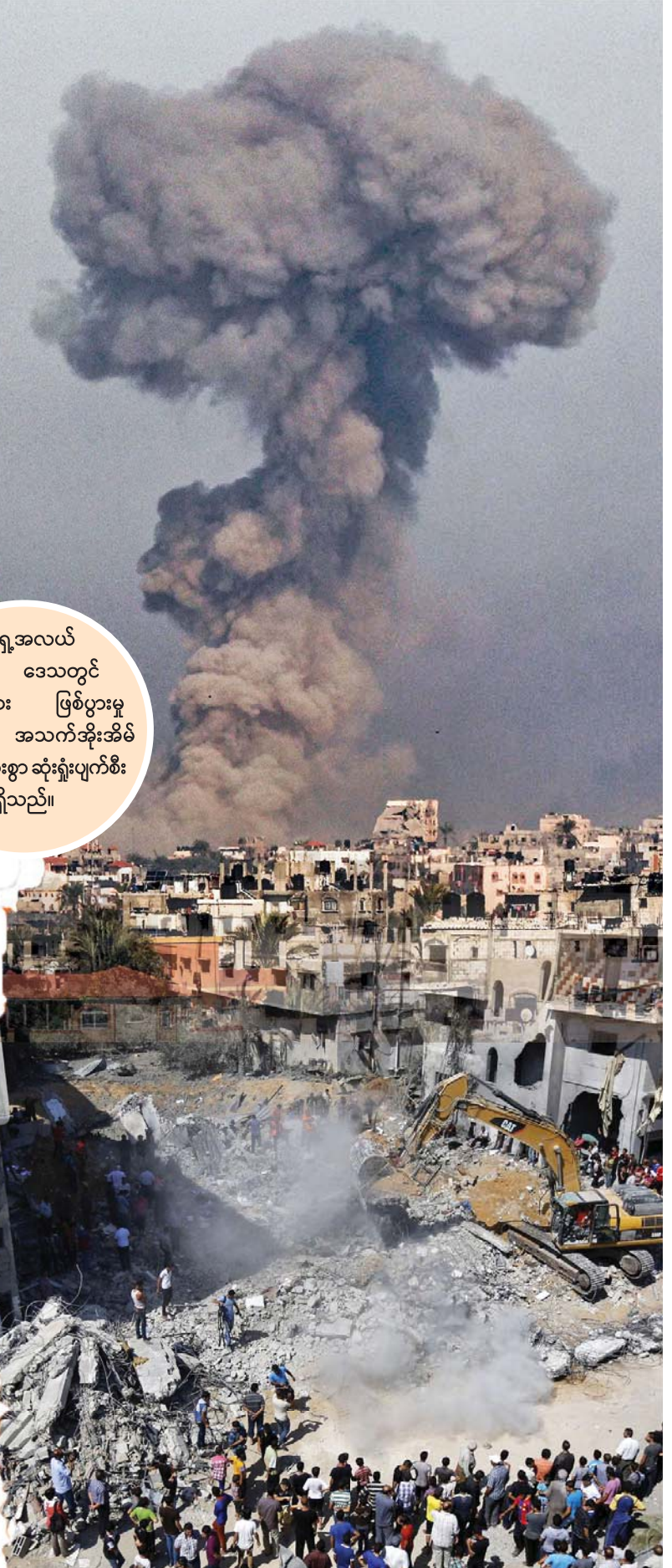
အရှေ့အလယ် ပိုင်း ဒေသတွင် ပဋိပက္ခများ ဖြစ်ပွားမှု ကြောင့် အသက်အိုးအိမ် စည်းစိမ်များစွာ ဆုံးရှုံးပျက်စီး ရလျက်ရှိသည်။

ယနေ့အချိန်အခါတွင် အရေးကြီးသည်က ဖြည့်ဆည်းရမည့် စိတ်ဓာတ်ပိုင်း၊ ခံယူချက်နှင့် စိတ်ဓာတ်အရည် အသွေးများပင်ဖြစ်သည်ဟုဆိုရမည်။ တန်ဖိုးထားရမည့်အရာ ကို တန်ဖိုးထားတတ်အောင် သံမှိုနှက်သလို ရိုက်သွင်းထားဖို့လိုသည် ဟုထင်ပါသည်။ ယနေ့မျိုးဆက်တို့ လွတ်လပ်ခြင်း၏ အရသာကို ကောင်းကောင်းခံစားလိုသော်လည်း လွတ်လပ်ရေး၏ တန်ဖိုးကိုကောသိကြ ရဲ့လားတွေ့မိသည်။ နိုင်ငံနှင့်လူမျိုး သူ့ကျွန်ဘဝမှ လွတ်မြောက်အောင် ခက်ခက်ခဲခဲ ဘယ်လိုတိုက်ယူခဲ့ရသလဲ၊ လွတ်လပ်ရေးရဖို့ ဘယ်လိုအသက် သွေး ချွေးစတေးခဲ့ကြရသလဲ၊ ရပြီးသားလွတ်လပ်ရေးကြီး အစဉ်တည်တံ့ နေအောင် ဘယ်လိုအရင်းအနှီးတွေ ပေးဆပ်ပြီး ထိန်းသိမ်းစောင့် ရှောက်နေရသလဲ၊ ခံယူချက်မှန်ဖို့က အနည်းဆုံးတော့ ဒီမြေ၊ ဒီရေ၊ ဒီလေပိုင်နက်၏ တန်ဖိုးများကို နားလည်ဖို့လိုပါ ဦးမည်။