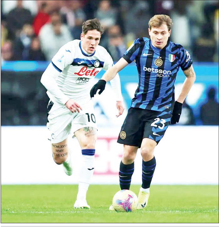
အင်တာမီလန်အသင်းနှင့် အတ္တလန္တာအသင်းတို့ ယှဉ်ပြိုင်ကစားကြစဉ်။

ဒမ်ဖရီးစ်ရဲ့သွင်းဂိုးနှစ်ဂိုးနဲ့ အနိုင်ရရှိခဲ့ပြီးနောက် အင်တာမီလန် အသင်းဟာ အတ္တလန္တာအသင်းကို ခုနစ်ပွဲဆက်တိုက်အနိုင်ရရှိအောင် စွမ်းဆောင်နိုင်ခဲ့ပြီဖြစ်ပါတယ်။ လက်ရှိမှာ နောက်ဆုံးဗိုလ်လုပွဲအဆင့် အထိ တက်လှမ်းခွင့်ရရှိထားပြီးဖြစ်တာကြောင့် အင်တာမီလန်အသင်း အနေနဲ့ အီတလီစူပါဖလားကို စာမျက်နှာ ၁၉ ကော်လံ ၄ သို့