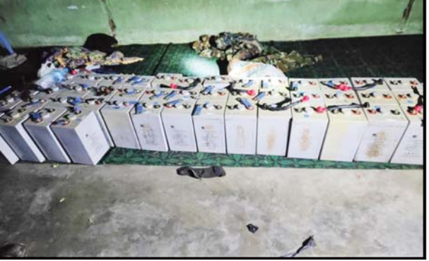
ဖောက်ခွဲရေးပစ္စည်းများ

PDF အမည်ခံအကြမ်းဖက်သမားများ ခိုအောင်းနေထိုင်လျက်ရှိသည့် ငါန်းဇွန်မြို့နယ် ကုလားကျေးရွာအတွင်း ဝင်ရောက်ရှင်းလင်းစဉ် ဖော်ထုတ်သိမ်းဆည်းရမိသည့် ဖောက်ခွဲဖျက်ဆီးရေးပစ္စည်းများအား တွေ့မြင်ရစဉ်။