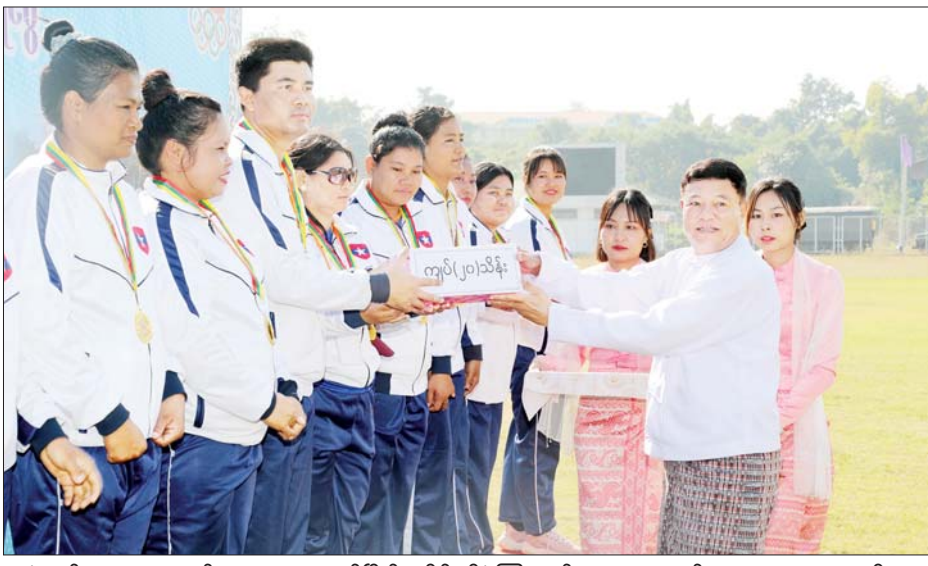
လှပွဲတွင် သယံဇာတနှင့် သဘာဝပတ်ဝန်းကျင်ထိန်းသိမ်းရေးဝန်ကြီးဌာနအသင်းက ပြည်ထောင်စုရာထူးဝန်အသင်းကို နှစ်ပွဲ-တစ်ပွဲဖြင့်လည်းကောင်း၊ လွန်ဆွဲ(အမျိုးသား) တတိယလှပွဲတွင် အားကစားနှင့် လူငယ်ရေးရာဝန်ကြီးဌာနအသင်းက ကာကွယ်ရေးဝန်ကြီးဌာနအသင်းကို နှစ်ပွဲပြတ်ဖြင့်လည်းကောင်း၊ လွန်ဆွဲ(အမျိုးသမီး) ဗိုလ်လုပွဲတွင် ကာကွယ်ရေးဝန်ကြီးဌာနအသင်းက အားကစားနှင့်လူငယ်ရေးရာဝန်ကြီးဌာနအသင်းကို နှစ်ပွဲပြတ်ဖြင့်လည်းကောင်း၊ လွန်ဆွဲ(အမျိုးသား) ဗိုလ်လုပွဲတွင် ပြည်ထဲရေးဝန်ကြီးဌာနအသင်းက နယ်စပ်ရေးရာဝန်ကြီးဌာနအသင်းကို နှစ်ပွဲပြတ်ဖြင့် လည်းကောင်း ယှဉ်ပြိုင်အနိုင်ရရှိခဲ့ကြသည်။ အသင်း၊ စတုတ္ထဆုရရှိသော ကာကွယ်ရေးဝန်ကြီးဌာနအသင်း၊ လွန်ဆွဲ (အမျိုးသမီး)ပြိုင်ပွဲတွင် ပထမဆုရရှိသော ကာကွယ်ရေးဝန်ကြီးဌာနအသင်း၊ ဒုတိယဆုရရှိသော အားကစားနှင့်လူငယ်ရေးရာဝန်ကြီးဌာနအသင်း၊ တတိယဆုရရှိသော သယံဇာတနှင့် သဘာဝပတ်ဝန်းကျင် ထိန်းသိမ်းရေးဝန်ကြီးဌာနအသင်းနှင့် စတုတ္ထဆုရရှိသော ပြည်ထောင်စုရာထူးဝန် အသင်းတို့ကို ပြည်ထောင်စုဝန်ကြီးများ ဖြစ်ကြသည့် ဒုတိယဗိုလ်ချုပ်ကြီးထွန်းထွန်းနောင်၊ ဦးမင်းသိန်းဇံ၊ ဒုတိယဝန်ကြီးများနှင့် တာဝန်ရှိသူများက တစ်ဦးချင်း ဆုတံဆိပ်နှင့် ငွေသားဆုများ ပေးအပ်ချီးမြှင့်ခဲ့ကြောင်း သိရသည်။ သတင်းစဉ်

နေပြည်တော် ဇန်နဝါရီ ၃ ၂၀၂၅ ခုနှစ် (၇၇)နှစ်မြောက် လွတ်လပ်ရေးနေ့ အထိမ်းအမှတ် အားကစားပြိုင်ပွဲများ ကျင်းပရေး ဆပ်ကော်မတီဥက္ကဋ္ဌ အားကစားနှင့် လူငယ်ရေးရာဝန်ကြီးဌာန ပြည်ထောင်စုဝန်ကြီး ဦးမင်းသိန်းဇံသည် တာဝန်ရှိသူများနှင့် အတူ ယနေ့နံနက်ပိုင်းတွင် နေပြည်တော် ဝဏ္ဏသိဒ္ဓိ အားကစားကွင်းရှိ လေ့ကျင့်ရေးကွင်းအမှတ်(၁၊ ၂ နှင့် ၃)တို့၌ ကျင်းပလျက်ရှိသည့် ၂၀၂၅ ခုနှစ် (၇၇)နှစ်မြောက် လွတ်လပ်ရေးနေ့ အထိမ်းအမှတ် ဝန်ကြီးဌာနပေါင်းစုံ အားကစားပြိုင်ပွဲ လွန်ဆွဲ(အမျိုးသား၊ အမျိုးသမီး) ထုပ်ဆီးတိုး(အမျိုးသမီး) တတိယလှပွဲနှင့် ဗိုလ်လုပွဲ ပွဲစဉ်များ ယှဉ်ပြိုင်နေမှုကို ကြည့်ရှုအားပေးသည်။ ယှဉ်ပြိုင်အနိုင်ရရှိ ဦးစွာ ထုပ်ဆီးတိုး(အမျိုးသမီး) တတိယလှပွဲတွင် စိုက်ပျိုးရေး၊ မွေးမြူရေးနှင့် ဆည်မြောင်းဝန်ကြီးဌာနအသင်းက ဆောက်လုပ်ရေးဝန်ကြီးဌာန အသင်းကို ရမှတ် ၁၄ မှတ်- ၆ မှတ်ဖြင့်လည်းကောင်း၊ ဗိုလ်လုပွဲတွင် နယ်စပ်ရေးရာဝန်ကြီးဌာနအသင်းက ပို့ဆောင်ရေးနှင့် ဆက်သွယ်ရေးဝန်ကြီးဌာန အသင်းကို ရမှတ် ၂၅ မှတ်-၅ မှတ်ဖြင့်လည်းကောင်း ယှဉ်ပြိုင်အနိုင်ရရှိခဲ့ကြသည်။ လွန်ဆွဲ(အမျိုးသမီး) တတိယ