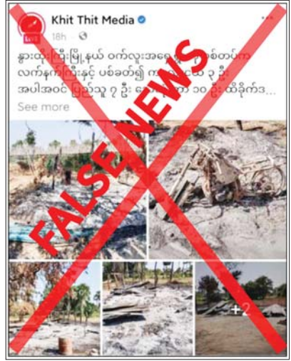
ဝက်လူးအရှေ့ကျေးရွာ အနီးဝန်းကျင်တွင် နယ်မြေလုံခြုံရေး ဆောင်ရွက်နေသည့် လုံခြုံရေးတပ်ဖွဲ့ဝင်များကို လက်နက်ကြီး၊ လက်နက်

နေပြည်တော် ဇန်နဝါရီ ၃ မန္တလေးတိုင်းဒေသကြီး နွားထိုးကြီးမြို့နယ် ဝက်လူးအရှေ့ကျေးရွာကို ဒီဇင်ဘာ ၃၁ ရက်က လုံခြုံရေးတပ်ဖွဲ့ဝင်များက လက်နက်ကြီးပစ်ခတ်မှုကြောင့် ကလေးငယ်သုံးဦး အပါအဝင် ဒေသပြည်သူ့အန္တရာယ် သေဆုံးခဲ့ကာ ၁၀ ဦး ထိခိုက်ဒဏ်ရာများရရှိခဲ့သည်ဟု တရားမဝင်ပြည်ပျက်မီဒီယာများက တစ်ဖက်သတ်လုပ်ကြံရေးသားထားသည့် သတင်းတု သတင်းမှားများဖြင့် မဟုတ်မမှန် ရေးသားဖြန့်ဝေနေသည်ကို တွေ့ရှိရသည်။