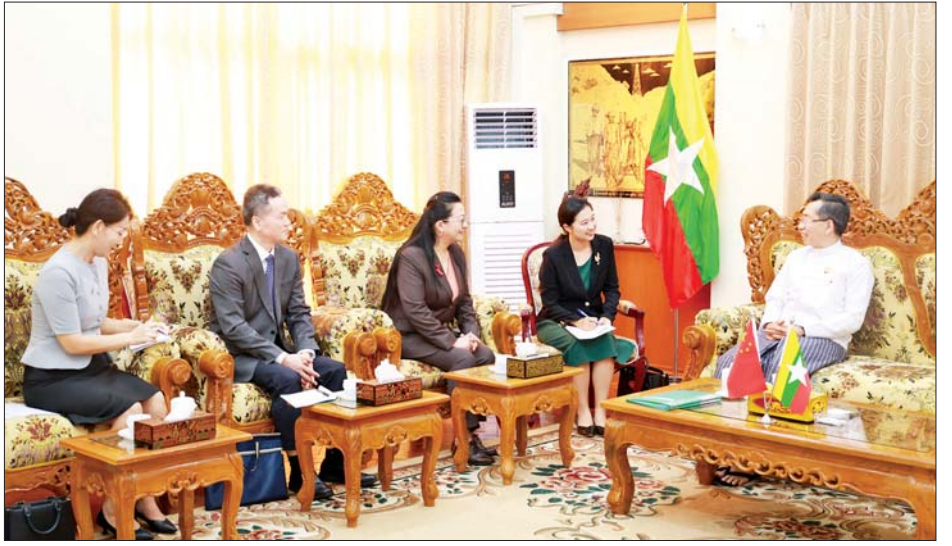
တွေ့ဆုံပွဲသို့ ဒုတိယဝန်ကြီး ဦးသန့်စင်၊ ပြည်ထောင်စုဝန်ကြီးရုံး ညွှန်ကြားရေးမှူးချုပ်၊ ဝန်ကြီးဌာနအောက်ရှိ ညွှန်ကြားရေးမှူးချုပ်များ၊ ဦးဆောင်ညွှန်ကြားရေးမှူး၊ စွမ်းအင်ဝန်ကြီးဌာနနှင့် တရုတ်သံရုံးမှတာဝန်ရှိသူများ တက်ရောက်ကြကြောင်း သိရသည်။ သတင်းစဉ်

သဘာဝဓာတ်ငွေ့ပိုက်လိုင်းများ၏ စွမ်းရည်အပြည့်အသုံးပြုနိုင်ရန်အတွက် ဖြစ်နိုင်ခြေဆန်းစစ်ခြင်းကို ပူးပေါင်းဆောင်ရွက်ရေး၊ ရေနံစိမ်းပိုက်လိုင်းမှ ရရှိမည့် ရေနံစိမ်းကိုရယူပြီး ရေနံချက်စက်ရုံအသစ် ပူးပေါင်းတည်ဆောက်မည့် စီမံကိန်းဆိုင်ရာများ၊ မြန်မာနိုင်ငံ၏အလားအလာကောင်းသော ရေနံနှင့် သဘာဝဓာတ်ငွေ့စီမံကိန်းများ၊ ပိုက်လိုင်းများ တည်ဆောက်ခြင်း၊ အဆင့်မြှင့်တင်ခြင်းလုပ်ငန်းများ၊ ရေနံချက်စက်ရုံနှင့် ဓာတ်မြေဩဇာစက်ရုံများ အဆင့်မြှင့်တင်ခြင်း၊ အသစ်တည်ဆောက်ခြင်းတို့တွင် ရင်းနှီးမြှုပ်နှံမှုများဆောင်ရွက်နိုင်မည့် အခြေအနေများနှင့် နှစ်နိုင်ငံအစိုးရချင်း ပူးပေါင်းဆောင်ရွက်သွားမည့် အခြေအနေများကို ရင်းနှီးပွင့်လင်းစွာ အမြင်ချင်း ဖလှယ်ဆွေးနွေးကြသည်။