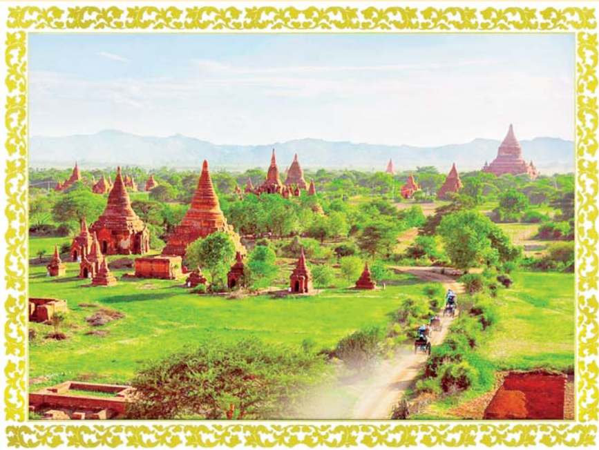
ပုဂံရှုခင်း