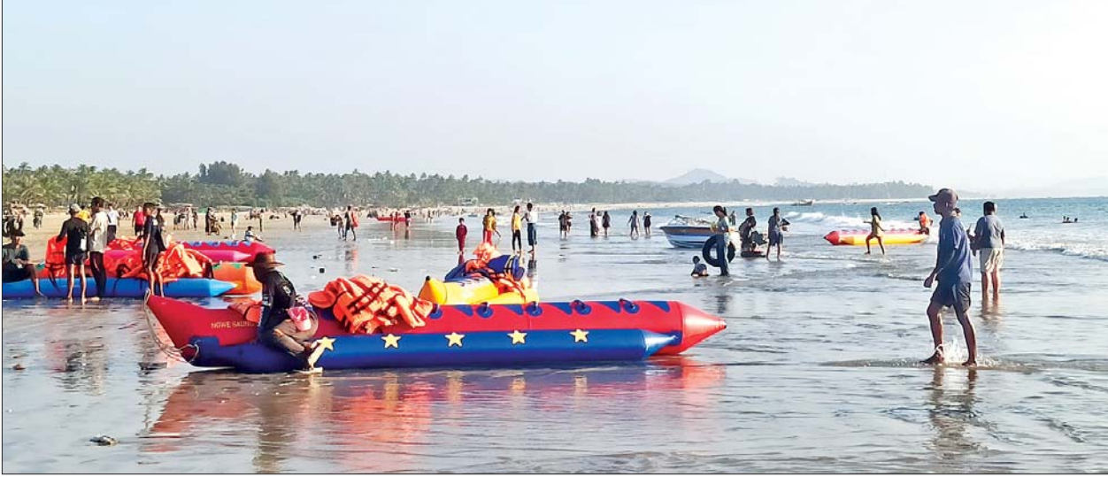
ငွေဆောင်ကမ်းခြေတွင် လာရောက်လည်ပတ်ကြသူများဖြင့် စည်ကားနေသည်ကို တွေ့ရစဉ်။

ပြည်ထောင်စုစိတ်ဓာတ်သည် အတိတ်သမိုင်း၏ လွတ်လပ်ရေးကြိုးပမ်းမှုတွင် အရင်းခံဖြစ်သကဲ့သို့ အနာဂတ်ဒီမိုကရေစီနိုင်ငံတော်ကို ထိန်းသိမ်းစောင့်ရှောက်ရေး၏ အခြေခံအုတ်မြစ်လည်းဖြစ် ပြည်ထောင်စုသမ္မတမြန်မာနိုင်ငံတော် နိုင်ငံတော်စီမံအုပ်ချုပ်ရေးကောင်စီဥက္ကဋ္ဌ နိုင်ငံတော်ဝန်ကြီးချုပ် ဗိုလ်ချုပ်မှူးကြီး သတိုးမဟာသရေစည်သူ သတိုးသိရီသုဓမ္မ မင်းအောင်လှိုင်ထံမှ ၂၀၂၅ ခုနှစ် (၇၇)နှစ်မြောက် လွတ်လပ်ရေးနေ့အခမ်းအနားသို့ ပေးပို့သည့်သဝဏ်လွှာ ချစ်ကြည်လေးစားရပါသော ပြည်ထောင်စုဖွားတိုင်းရင်းသား ညီအစ်ကိုမောင်နှမများခင်ဗျား ယနေ့ ဇန်နဝါရီလ (၄) ရက်နေ့တွင် ကျရောက်သော ပြည်ထောင်စုသမ္မတမြန်မာနိုင်ငံတော်၏ (၇၇)နှစ်မြောက် လွတ်လပ်ရေးနေ့ နေ့ထူးနေ့မြတ် မင်္ဂလာအခါသမယ၌ တိုင်းရင်းသားပြည်သူများအားလုံး စိတ္တသုခ၊ ကာယသုခ နှစ်ဖြာသောသူနှင့် ပြည့်စုံကြပါစေကြောင်း ဆုမွန်ကောင်းတောင်းလျက် နှုတ်ခွန်းဆက်သအပ်ပါသည်။ မြန်မာနိုင်ငံသည် ရှေးနှစ်ပေါင်းများစွာကတည်းက ကိုယ့်မြေ၊ ကိုယ့်ရေ၊ ကိုယ့်ပိုင်နက်နယ်မြေ၊ ကိုယ့်ထီး၊ ကိုယ့်နန်း၊ ကိုယ့်ကြွနန်းဖြင့် လွတ်လပ်သည့်နိုင်ငံအဖြစ် ဝင့်ထည်စွာရပ်တည်ခဲ့ပါသည်။ ကိုယ်ပိုင် ဘာသာစကား၊ စာပေ၊ ယဉ်ကျေးမှု၊ အနုပညာ၊ ဓလေ့ထုံးတမ်းတို့ကို တင့်တယ်စွာ ပိုင်ဆိုင်ခဲ့ပါသည်။ ပြည်ထောင်စုဖွားတိုင်းရင်းသား အားလုံးတို့သည် တစ်အူထုံဆင်း သွေးသားရင်းပမာ ချစ်ကြည်လေးစားကြလျက် တစ်မြေတည်းနေ တစ်ရေတည်းသောက်ကာ အေးအတူ ပူအမျှ၊ ဥမကဲ့ သိုက်မပျက် စည်းလုံးညီညွတ်စွာ နေထိုင်ခဲ့ကြပါသည်။ စာမျက်နှာ ၃ ကော်လံ ၁ သို့ ❖