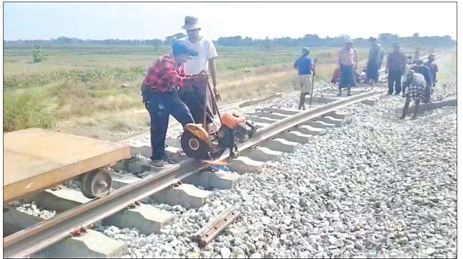
၁၄-၁၂-၂၀၂၄ ရက်နေ့က ရန်ကုန်-မန္တလေးရထားလမ်းပိုင်းအတွင်းရှိ တော်ဝိနှင့် ပိန်းဇလုပ်ဘူတာ အကြား မိုင်းပေါက်ကွဲမှုကြောင့် ပျက်စီးသွားသည့် အစုန်ရထားလမ်းအား ပြန်လည်ပြုပြင်နေမှုကို တွေ့ရ စဉ်။

ယနေ့အချိန်အခါတွင် အရေးကြီးသည်က ဖြည့်ဆည်းရမည့် စိတ်ဓာတ်ပိုင်း၊ ခံယူချက်နှင့် စိတ်ဓာတ်အရည် အသွေးများပင်ဖြစ်သည်ဟုဆိုရမည်။ တန်ဖိုးထားရမည့်အရာ ကို တန်ဖိုးထားတတ်အောင် သံမှိုနှက်သလို ရိုက်သွင်းထားဖို့လိုသည် ဟုထင်ပါသည်။ ယနေ့မျိုးဆက်တို့ လွတ်လပ်ခြင်း၏ အရသာကို ကောင်းကောင်းခံစားလိုသော်လည်း လွတ်လပ်ရေး၏ တန်ဖိုးကိုကောသိကြ ရဲ့လားတွေ့မိသည်။ နိုင်ငံနှင့်လူမျိုး သူ့ကျွန်ဘဝမှ လွတ်မြောက်အောင် ခက်ခက်ခဲခဲ ဘယ်လိုတိုက်ယူခဲ့ရသလဲ၊ လွတ်လပ်ရေးရဖို့ ဘယ်လိုအသက် သွေး ချွေးစတေးခဲ့ကြရသလဲ၊ ရပြီးသားလွတ်လပ်ရေးကြီး အစဉ်တည်တံ့ နေအောင် ဘယ်လိုအရင်းအနှီးတွေ ပေးဆပ်ပြီး ထိန်းသိမ်းစောင့် ရှောက်နေရသလဲ၊ ခံယူချက်မှန်ဖို့က အနည်းဆုံးတော့ ဒီမြေ၊ ဒီရေ၊ ဒီလေပိုင်နက်၏ တန်ဖိုးများကို နားလည်ဖို့လိုပါ ဦးမည်။