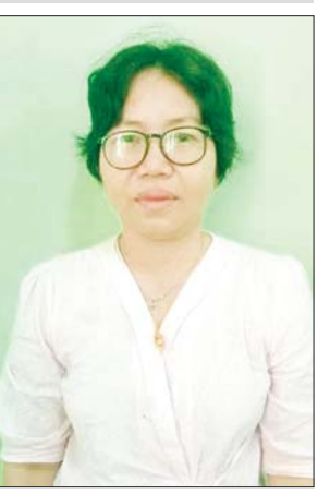
ရရှိ ဆေးတက္ကသိုလ် (မန္တလေး)သို့ အကြောင်းကြားလာသည်။

နိုဝင်ဘာ ၂၀ ရက်တွင် အဆိုပါ ယာယီဆေးပညာ ဘွဲ့လက်မှတ် ကို စစ်ဆေးအတည်ပြုခဲ့ရာ