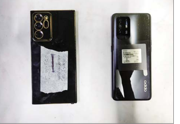
ဆေးတက္ကသိုလ် (မန္တလေး)မှ ထုတ်ပေးထားသော ဘွဲ့လက်မှတ် များမဟုတ်ဘဲ ဘွဲ့လက်မှတ်အတု များဖြစ်၍ တရားမဝင်ကြောင်း ပြန်လည်အကြောင်းကြားခဲ့သည့်