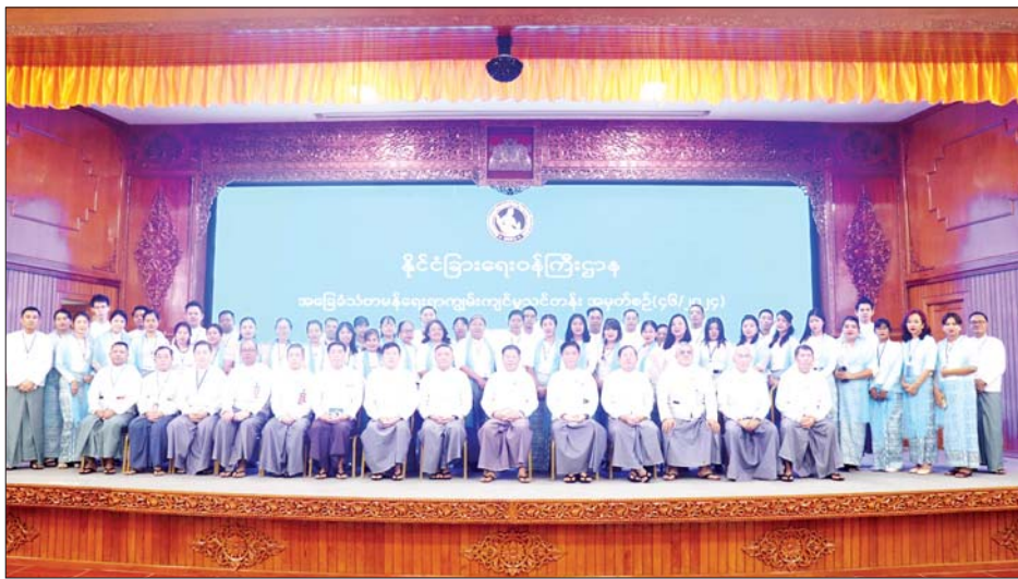
သံတမန်ရေးရာကျွမ်းကျင်မှုသင်တန်းအမှတ်စဉ် (၄၆/၂၀၂၄) ရန်ကုန်နှင့် နေပြည်တော်တန်းခွဲတို့မှ သင်တန်းသား သင်တန်းသူ ကိုယ်စားလှယ်များက ကျေးဇူးတင်စကား ပြန်လည်ပြောကြားကြသည်။

နေပြည်တော် နိုဝင်ဘာ ၂၂ ဒုတိယဝန်ကြီးချုပ်နှင့် ပြည်ထောင်စုဝန်ကြီး ဦးသန်းဆွေနှင့် အခြေခံသံတမန်ရေးရာ ကျွမ်းကျင်မှု သင်တန်းအမှတ်စဉ်(၄၆/၂၀၂၄) ရန်ကုန်တန်းခွဲနှင့် နေပြည်တော်တန်းခွဲရှိ သင်တန်းသား သင်တန်းသူ များ တွေ့ဆုံပွဲကို ယနေ့နံနက် ၁၀ နာရီခွဲတွင် နေပြည်တော်ရှိ နိုင်ငံခြားရေးဝန်ကြီးဌာန လောကနတ် ခန်းမ၌ ကျင်းပရာ ဒုတိယဝန်ကြီးများနှင့် တာဝန်ရှိ သူများ၊ သင်တန်းသား သင်တန်းသူ စုစုပေါင်း ၁၄၀ တို့ တက်ရောက်ကြသည်။