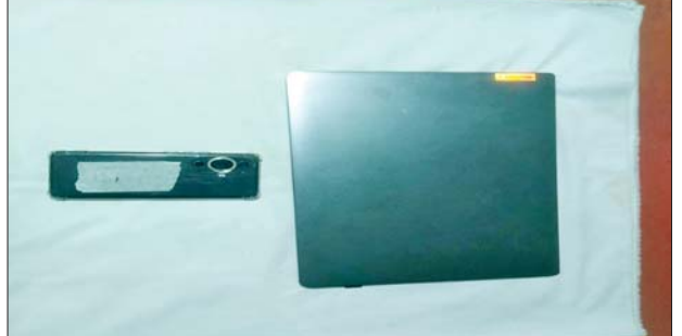
နိုတြီပြုလုပ်ရာတွင် အသုံးပြုခဲ့သည့် တရားခံမြတ်မင်းသူ၏ Laptop နှင့် ဖုန်းကို တွေ့ရစဉ်။

အတွက် Chulalongkorn တက္ကသိုလ်မှ ၎င်းတို့နှစ်ဦးအား တက္ကသိုလ် တက်ရောက်ခွင့် လက်မခံခဲ့ကြောင်း သိရသည်။ စာမျက်နှာ ၁၉ သို့ □