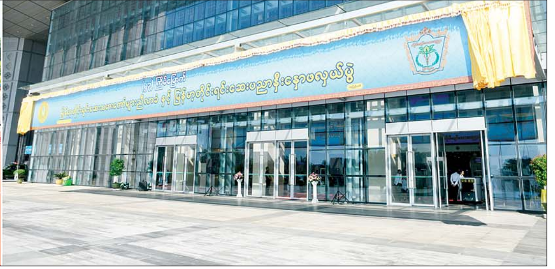
နိုင်ငံတော်စီမံအုပ်ချုပ်ရေးကောင်စီဒုတိယဥက္ကဋ္ဌ ဒုတိယဝန်ကြီးချုပ် ဒုတိယဗိုလ်ချုပ်မှူးကြီးစိုးဝင်း (၂၃)ကြိမ်မြောက် မြန်မာ့တိုင်းရင်းဆေးသမားတော်များညီလာခံနှင့် မြန်မာ့တိုင်းရင်းဆေးပညာ နှီးနှောဖလှယ်ပွဲ ဖွင့်ပွဲအခမ်းအနားကို စက်ခလုတ်နှိပ်ဖွင့်လှစ်ပေးစဉ်။