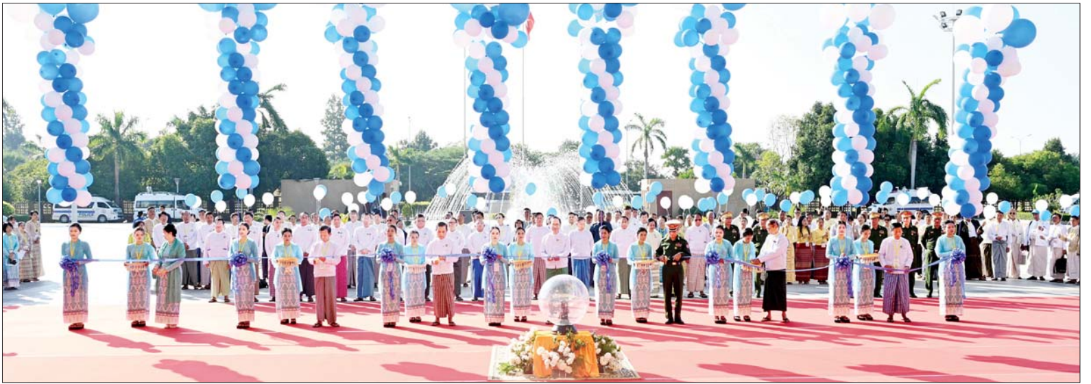
(၂၃)ကြိမ်မြောက် မြန်မာ့တိုင်းရင်းဆေးသမားတော်များညီလာခံနှင့် မြန်မာ့တိုင်းရင်းဆေးပညာနှီးနှောဖလှယ်ပွဲ ဖွင့်ပွဲအခမ်းအနားတွင် ပြည်ထောင်စုဝန်ကြီး ပါမောက္ခ ဒေါက်တာသက်ခိုင်ဝင်း၊ ဒုတိယဝန်ကြီး ပါမောက္ခ ဒေါက်တာအေးထွန်း၊ နေပြည်တော်ကောင်စီဝင် ဗိုလ်မှူးကြီး ရဲမိုး၊ တိုင်းရင်းဆေးပညာဦးစီးဌာန ညွှန်ကြားရေးမှူးချုပ် ဒေါက်တာ စုစုဒွေး၊ မြန်မာနိုင်ငံတိုင်းရင်းဆေးကောင်စီဥက္ကဋ္ဌ ဦးမြင့်ဦး၊ တိုင်းရင်းဆေးပညာရပ်ဆိုင်ရာ အကြံပေးအဖွဲ့ဥက္ကဋ္ဌ ပါမောက္ခ ဒေါက်တာဦးမိတ်နှင့် မြန်မာနိုင်ငံတိုင်းရင်းဆေး ဆရာအသင်းဗဟိုဥက္ကဋ္ဌ ဦးသိန်းဝင်းတို့က ဖဲကြိုးဖြတ်ဖွင့်လှစ်ပေးစဉ်။

ယင်းနောက် အခမ်းအနားကို ဆက်လက်ကျင်းပရာ နိုင်ငံတော် စီမံအုပ်ချုပ်ရေးကောင်စီ ဥက္ကဋ္ဌ နိုင်ငံတော်ဝန်ကြီးချုပ် ဗိုလ်ချုပ် မှူးကြီး မင်းအောင်လှိုင်က မြန်မာ့ တိုင်းရင်းဆေးသမားတော်များ ညီလာခံနှင့် မြန်မာ့တိုင်းရင်းဆေး ပညာ နှီးနှောဖလှယ်ပွဲသို့ ပေးပို့ သည့် ဂုဏ်ပြုမိန့်ခွန်း Video Message ကိုဖွင့်လှစ်ပြသသည်။ (နိုင်ငံတော် စီမံအုပ်ချုပ်ရေး