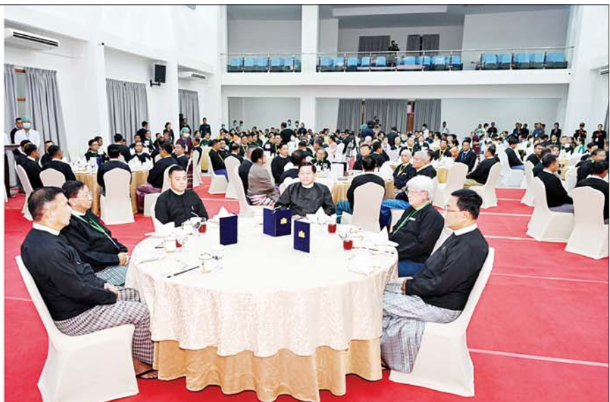
နိုင်ငံတော်စီမံအုပ်ချုပ်ရေးကောင်စီဥက္ကဋ္ဌ နိုင်ငံတော်ဝန်ကြီးချုပ် ဗိုလ်ချုပ်မှူးကြီးမင်းအောင်လှိုင်နှင့် အခမ်းအနားတက်ရောက်လာကြသူများ မြန်မာနိုင်ငံအင်ဂျင်နီယာပညာရေး နှစ် (၁၀၀)ပြည့် ရာပြည့်သဘင်နှင့် Naypyitaw State Polytechnic University ဖွင့်ပွဲ အထိမ်းအမှတ် ဂုဏ်ပြုညစာစားပွဲအခမ်းအနားတွင် ကျောင်းသား ကျောင်းသူများ၏ သီဆိုကပြပျော်ဖြေမှုကို ကြည့်ရှုအားပေးစဉ်။