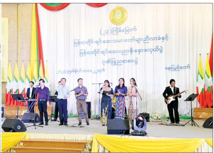
နိုင်ငံတော်စီမံအုပ်ချုပ်ရေးကောင်စီဒုတိယဥက္ကဋ္ဌ ဒုတိယဝန်ကြီးချုပ် ဒုတိယဗိုလ်ချုပ်မှူးကြီးစိုးဝင်းနှင့် အဖွဲ့ဝင်များ (၂၃)ကြိမ်မြောက် မြန်မာ့တိုင်းရင်းဆေးသမားတော်များညီလာခံနှင့် မြန်မာ့တိုင်းရင်းဆေးပညာနှီးနှောဖလှယ်ပွဲ ဂုဏ်ပြုညစာစားပွဲအခမ်းအနားတွင် ပြန်ကြားရေးဝန်ကြီးဌာန မြန်မာ့အသံနှင့် ရုပ်မြင်သံကြားမှ အနုပညာရှင်များ၏ တေးသံသာများဖြင့် သီဆိုဖျော်ဖြေမှုကို ကြည့်ရှုအားပေးစဉ်။

ဆေး)၏ အကျိုးထိရောက်မှုကို သုတေသနပြုလုပ်အောင်မြင်ခဲ့ကြကြောင်း၊ ဆေးဝါး၏ အရည်အသွေးဆိုင်ရာ ဓာတ်ခွဲစမ်းသပ်စစ်ဆေးခြင်း၊ လတ်တလောနှင့် ရေတိုအဆိပ်အာနိသင်ဆိုင်ရာ စမ်းသပ်ခြင်း၊ ဆေး၏ခံနိုင်ရည်အား ကျန်းမာသည့်လူများပေါ်တွင် စမ်းသပ်ခြင်းနှင့် ကိုဗစ်-၁၉ ရောဂါ အတည်ပြုသာမန် လက္ခဏာရှိ လူနာများပေါ်တွင်