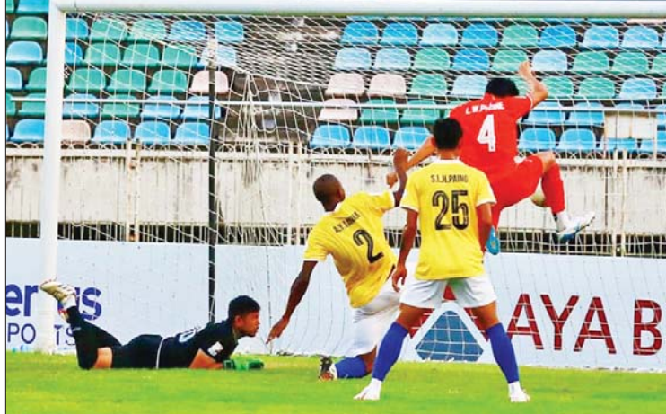
ဟံသာဝတီအသင်းအတွက် ဒုတိယဂိုးကို လတ်ဝေဘုန်း သွင်းယူစဉ်။

ရန်ကုန် နိုဝင်ဘာ ၂၂ ၂၀၂၄-၂၀၂၅ ရာသီ MNL အမှတ်ပေး ပြိုင်ပွဲ ပွဲစဉ်(၁၄) ပထမနေ့အဖြစ် ဟံသာဝတီယူနိုက်တက်အသင်းနှင့် ရခိုင် ယူနိုက်တက်အသင်းတို့ နိုဝင်ဘာ ၂၂ ရက် တွင် သုဝဏ္ဏကွင်း၌ ယှဉ်ပြိုင်ကစားရာ နှစ်ဂိုးစီသရေကျခဲ့သည်။ အမှတ်ပေးဇယား ဒုတိယနေရာတွင် ရပ်တည်နေသည့်ဟံသာဝတီယူနိုက်တက် အသင်း ခြေချော်သွားပြီး တန်းဆင်းဇန်မှ ရုန်းထွက်နိုင်ရန် ကြိုးပမ်းနေသည့် ဇယား အောက်ဆုံးမှ ရခိုင်ယူနိုက်တက်အသင်း အတွက် အဖိုးတန်သရေတစ်မှတ်ဖြစ်ခဲ့ သည်။ စာမျက်နှာ ၁၃ ကော်လံ ၅ သို့ ၀