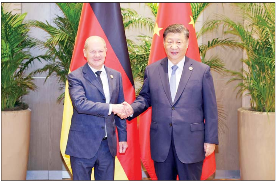
တရုတ်သမ္မတ ရီကျင့်ဖျင်နှင့် ဂျာမနီဝန်ကြီးချုပ် အိုလက်စတုန်း စက်မှုထိပ်သီးနိုင်ငံ ၂၀ (ဂျီ-၂၀) ထိပ်သီးအစည်းအဝေးပြင်ပ၌ နိုဝင်ဘာ ၁၉ ရက်က တွေ့ဆုံစဉ်။

သဘောထားကွဲလွဲမှုများကို မှန်ကန်စွာဖြေရှင်းရန် မျှော်လင့်ကြောင်း ဂျာမနီဝန်ကြီးချုပ် အိုလက်စတုန်းက ပြန်လည်ပြောကြားသည်။ ပြင်သစ်သမ္မတ မက်ရွန်နှင့် တွေ့ဆုံရာတွင် တရုတ်နှင့် ပြင်သစ်နှစ်နိုင်ငံသည် စီးပွားရေး ပူးပေါင်းဆောင်ရွက်မှုအတွက် အလားအလာများကို ပိုမိုထိရောက်စွာ အသုံးပြုနိုင်စေရန်၊ အားသာချက်များကို ပိုမိုခိုင်ခံ့စေကာ အပြန်အလှန် အကျိုးကျေးဇူးများနှင့် ရလဒ်ကောင်းများ ရရှိလိမ့်မည်ဟု မျှော်လင့်ကြောင်း သမ္မတရီကျင့်ဖျင်က ပြောကြားသည်။ အမေရိကန်ရွေးကောက်ခံသမ္မတ ထရမ် ရွေးကောက်ပွဲတွင် အနိုင်ရရှိခဲ့ပြီးနောက် တရုတ်နှင့် အမေရိကန်ကြား ကုန်သွယ်ရေးပဋိပက္ခ ဖြစ်လာနိုင်သည့် အချိန်တွင် အီးယူအဖွဲ့ဝင်များနှင့် စီးပွားရေး ဆက်ဆံရေး ခိုင်မာစေရန် သမ္မတရီကျင့်ဖျင်က ကြိုးပမ်းလျက် ရှိကြောင်း နိုင်ငံရေးလေ့လာသူများက သုံးသပ်ပြောကြားသည်။ ကိုးကား - အင်န်အိတ်ချီကော ဘာသာပြန် - အောင်ကျော်ကျော်