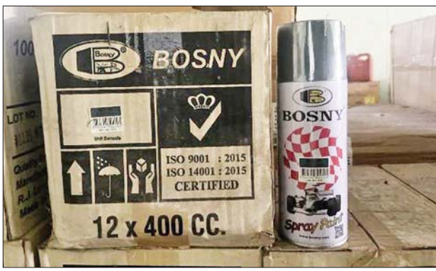
မွန်ပြည်နယ်၌ သိမ်းဆည်းရမိမှု။

ထို့အတူ ပဲခူးတိုင်းဒေသကြီးတရားမဝင်ကုန်သွယ်မှုတိုက်ဖျက် ရေးအထူးအဖွဲ့၏ စီမံခန့်ခွဲမှုဖြင့် တာဝန်ကျပူးပေါင်းအဖွဲ့က စစ်ဆေးမှု များ ဆောင်ရွက်ခဲ့ရာ ညောင်ခါးရည် X-Ray စက် စစ်ဆေးရေးဂိတ်၌ ဘားအံမြို့မှ ရန်ကုန်မြို့သို့ မောင်းနှင်လာသည့် ယာဉ်တစ်စီးပေါ်မှ တရားဝင်စာရွက်စာတမ်းအထောက်အထား တင်ပြနိုင်ခြင်းမရှိသည့် စားသောက်ကုန်ပစ္စည်းနှစ်မျိုး (ခန့်မှန်းတန်ဖိုးငွေကျပ် ၃၀၃၀၀၀) နှင့် အဆိုပါပစ္စည်းများ တင်ဆောင်လာသည့် Nissan Caravan တစ်စီး