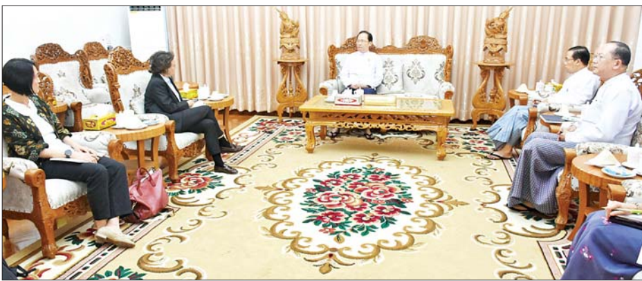
ဝန်ကြီးဦးခန့်မဆောင်၌ လက်ခံ တွေ့ဆုံသည်။ တွေ့ဆုံစဉ် ၂၀၂၄-၂၀၂၆ ခုနှစ် အတွက် ဝန်ကြီးဌာနနှင့် ကမ္ဘာလုံး ဆိုင်ရာ ရန်ပုံငွေအဖွဲ့ (The Global Fund) တို့ ပူးပေါင်းဆောင်ရွက်