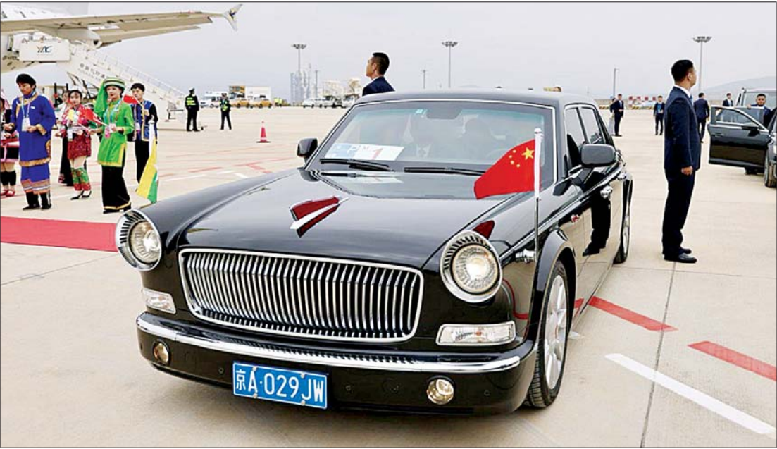
နိုင်ငံတော်ဝန်ကြီးချုပ်၏ ခရီးစဉ်တစ်လျှောက် အသုံးပြုခဲ့သည့် Hongqi L5 ကျည်ကာယာဉ်ကို တွေ့ရစဉ်။

ဖြစ်တယ်ဆိုပြီး အသိအမှတ်ပြုခြင်းတစ်မျိုးဖြစ်ပါတယ်။ ဥပမာအားဖြင့် အိန္ဒိယဝန်ကြီးချုပ်တို့၊ ရုရှားသမ္မတတို့လိုမျိုး နိုင်ငံတော်အကြီးအကဲတွေဟာ တရုတ်နိုင်ငံကို သွားရောက်တိုင်း ကော်ဇောနီခင်းပြီး အကြိုဆိုခံရသူတွေချည်းပါပဲ။ ဝန်ကြီးအဆင့်လောက်ကိုတော့ ကော်ဇောနီ (Red Carpet) မခင်းပေးပါဘူး။