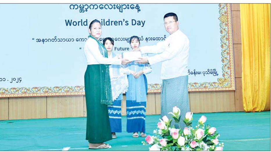
ကိုယ်တိုင်ပါဝင်ဆောင်ရွက်ခွင့် ရရှိစေရန် ကလေးများ၏အသံကို နားထောင်၍ အနာဂတ်သာယာကောင်းမွန်စေရန် ဖန်တီးပေးနိုင်ရေး ရည်ရွယ်ခြင်းဖြစ်ပါကြောင်း အမှာစကားပြောကြားသည်။ ဂုဏ်ပြုလက်ဆောင်များ ပေးအပ် ထို့နောက်တိုင်းဒေသကြီး ဝန်ကြီးချုပ်နှင့် ဧည့်သည်တော်များသည် လူမှုဝန်ထမ်း၊ ကယ်ဆယ်ရေးနှင့်ပြန်လည်နေရာချထားရေးဝန်ကြီးဌာနက ပေးပို့သည့် မှတ်တမ်းဗီဒီယိုနှင့် ပုသိမ်မူလတန်းကြိုကျောင်းများမှ ရင်သွေးငယ်များ၏ ကပြဖျော်ဖြေမှုများကို ကြည့်ရှုအားပေးခဲ့သည်။ ယင်းနောက် တိုင်းဒေသကြီးဝန်ကြီးချုပ်က ကမ္ဘာ့ကလေးများနေ့အကြို စာစီစာကုံးပြိုင်ပွဲ အခြေခံပညာအထက်တန်းအဆင့်တွင် ပထမ၊ ဒုတိယနှင့် တတိယဆုရရှိသည့် ကျောင်းသားကျောင်းသူများအား ဆုများနှင့် ကပြဖျော်ဖြေသည့် ရင်သွေးငယ်များအား ဂုဏ်ပြုလက်ဆောင်များပေးအပ်ချီးမြှင့်ခဲ့ကြောင်း သိရသည်။ တိုင်းဒေသကြီး(ပြန်/ဆက်)

ကုလသမဂ္ဂကွန်ဗင်းရှင်းနှစ်ပတ်လည်နေ့၊ ကမ္ဘာ့ကလေးများနေ့(World Children's Day) အဖြစ် သတ်မှတ်ခဲ့ပြီး ကလေးများကိုယ်တိုင်ပါဝင်သည့် အထိမ်းအမှတ်အခမ်းအနားများကို ကမ္ဘာတစ်ဝန်းကျင်းပခဲ့ခြင်းဖြစ်ပါကြောင်း၊ ကလေးများအတွက် ကလေးသူငယ်အခွင့်အရေးများဆိုင်ရာ သဘောတူစာချုပ်အရ အခြေခံလိုအပ်ချက်ဖြစ်သည့် အသက်ရှင်သန်ခွင့်၊ ဖွံ့ဖြိုးတိုးတက်ခွင့်၊ ကာကွယ်စောင့်ရှောက်ခံပိုင်ခွင့်နှင့် ပါဝင်ဆောင်ရွက်ခွင့်များကို ဆောင်ရွက်ပေးရာတွင် လူမှုဝန်ထမ်း၊ ကယ်ဆယ်ရေးနှင့်ပြန်လည်နေရာချထားရေးဝန်ကြီးဌာနက ရှေးဦးအရွယ် ကလေးသူငယ် ပြုစုပျိုးထောင်ရေးနှင့် ဖွံ့ဖြိုးရေးလုပ်ငန်းဥပဒေ၊ ကလေးသူငယ်အခွင့်အရေးများဆိုင်ရာဥပဒေများကို ပြဋ္ဌာန်းခဲ့ပြီး နိုင်ငံတော်အဆင့် အမျိုးသားကော်မတီများ ဖွဲ့စည်းဆောင်ရွက်ပေးလျက်ရှိပါကြောင်း၊ ကမ္ဘာပေါ်ရှိ ကလေးများအားလုံး၏ အခွင့်အရေးတစ်ရပ်ဖြစ်သည့် ကလေးများ