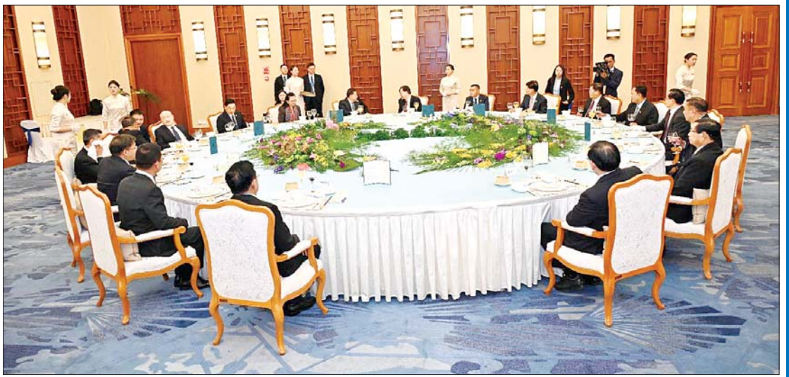
နိုင်ငံတော်စီမံအုပ်ချုပ်ရေးကောင်စီဥက္ကဋ္ဌ နိုင်ငံတော်ဝန်ကြီးချုပ် ဗိုလ်ချုပ်မှူးကြီးမင်းအောင်လှိုင်နှင့် အဖွဲ့ဝင်များအား တရုတ်ကွန်မြူနစ်ပါတီ ဗဟိုကော်မတီအဖွဲ့ဝင်နှင့် ယူနန်ပြည်နယ်ပါတီ ကော်မတီအဖွဲ့ဝင်များက တည်ခင်းဧည့်ခံသည့် ညစာကို အတူတကွသုံးဆောင်ကြစဉ်။

နောက်တစ်နေ့ မနက်မှာတော့ နိုင်ငံတော်ဝန်ကြီးချုပ်ဟာ ကူမင်းမြို့မှာ ရှိတဲ့ မြန်မာကောင်စစ်ဝန်ချုပ်ရုံး ဝန်ထမ်း