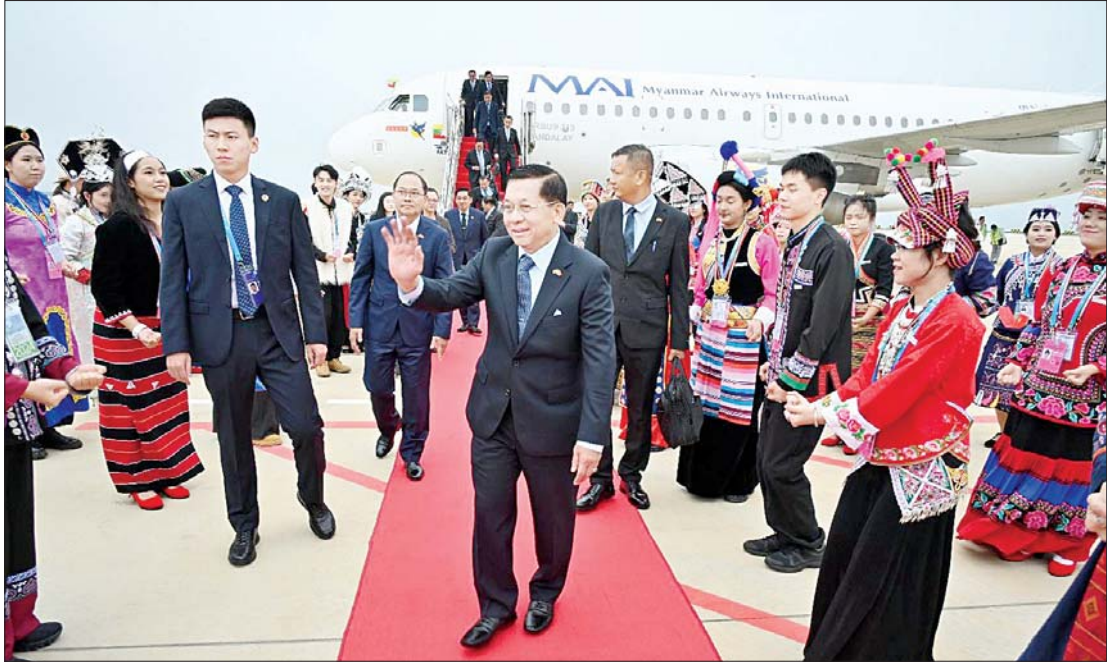
နိုင်ငံတော်စီမံအုပ်ချုပ်ရေးကောင်စီဥက္ကဋ္ဌ နိုင်ငံတော်ဝန်ကြီးချုပ် ဗိုလ်ချုပ်မှူးကြီးမင်းအောင်လှိုင်အား ကုမင်းလေဆိပ်တွင် တာဝန်ရှိသူများ၊ တရုတ်ရိုးရာယဉ်ကျေးမှုအဖွဲ့များက သောင်းသောင်းဖြဖြ လှိုက်လှဲနွေးထွေးစွာကြိုဆိုကြစဉ်။

“စာအုပ်ပေါင်း တစ်သောင်းဖတ်ခြင်းထက် ခရီးမိုင်တစ်သောင်းသွားခြင်းက ပို၍အမြင်ကျယ်၏” ဆိုတဲ့ တရုတ်ဆိုရိုးစကားရှိပါတယ်။ ခရီးသွားခြင်းဟာ ကောင်းကျိုးများစွာရှိပြီး ပျော်ရွှင်စရာကောင်းသော်လည်း ပင်ပန်းသည်ကတော့ အမှန်ပင်။ နိုင်ငံတော်ဝန်ကြီးချုပ်၏ ပြည်ပခရီးစဉ်ခြောက်ရက်တာအတွင်း မိုင်ပေါင်း ၄၀၀၀ ကျော်သွားခဲ့ရတဲ့ ခရီးတစ်ခုဖြစ်ပြီး နေပြည်တော်-ကုမင်းအသွားအပြန်ခရီးမှာ မိုင် ၁၀၀၀ ကျော်ရှိတဲ့အတွက် တရုတ်နိုင်ငံအတွင်း မိုင်ပေါင်း ၃၀၀၀ ကျော် မနားတမ်းခရီး နှင့်ခွဲခြားဖြစ်ပါတယ်။ အစည်းအဝေးများတက်ရောက်ခြင်း၊ အခမ်းအနားများတက်ရောက်ခြင်းနှင့် လှည့်လည်ကြည့်ရှုခြင်းများအပါအဝင် မိုင်ပေါင်း ၃၀၀၀ ကျော်ခရီးမှာ တစ်ရက်ပျမ်းမျှ မိုင် ၅၀၀ ကျော် သွားလာခဲ့ခြင်းဖြစ်တဲ့အတွက် သာမန်လူငယ်များအတွက်ပင် ခက်ခဲသောခရီးရှည်ဖြစ်၍ ပင်ပန်းလွန်းလှမည်မှာ အသေအချာဖြစ်ပါတယ်။