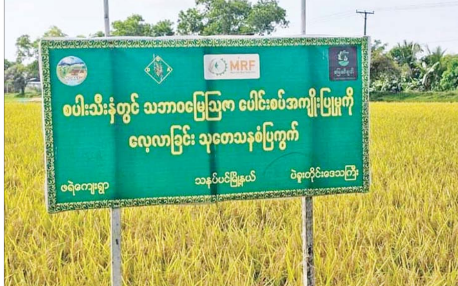
ပဲခူးတိုင်းဒေသကြီး သနပ်ပင်မြို့နယ် ဖရဲကျေးရွာရှိ သုတေသနစံပြုကွက်အားတွေ့ရစဉ်။