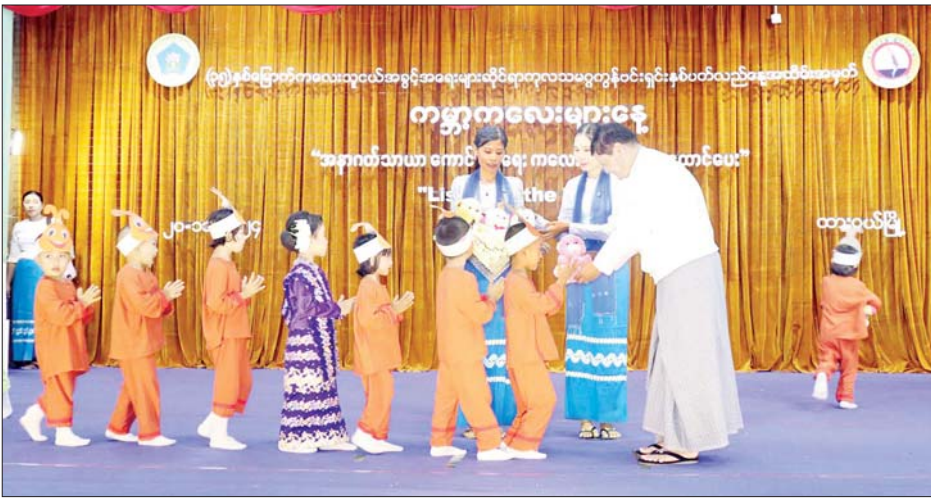
ဖက်မှု၊ လျစ်လျူရှုမှုနှင့် ခေါင်းပုံဖြတ်မှုအမျိုးမျိုးမှ ကာကွယ်စောင့်ရှောက်ခံပိုင်ခွင့်နှင့် ကလေးသူငယ်များ၏အရေးကိစ္စရပ်များတွင် ကလေးသူငယ်များကိုယ်တိုင် ပူးပေါင်းပါဝင် ဆောင်ရွက်ခွင့်တို့ကို

ထားဝယ် နိုဝင်ဘာ ၂၀ (၃၅)နှစ်မြောက် ကလေးသူငယ်အခွင့်အရေးများဆိုင်ရာ ကုလသမဂ္ဂကွန်ဗင်းရှင်းနှစ်ပတ်လည်နေ့အထိမ်းအမှတ် ကမ္ဘာ့ကလေးများနေ့ အခမ်းအနားကို ယနေ့နံနက် ၁၀ နာရီက တနင်္သာရီတိုင်းဒေသကြီး ထားဝယ်မြို့ မြို့တော်ခန်းမ၌ ကျင်းပသည်။ အခမ်းအနားတွင်တိုင်းဒေသကြီးဝန်ကြီးချုပ် ဦးမြတ်ကိုက တနင်္သာရီတိုင်းဒေသကြီးအနေဖြင့် တိုင်းဒေသကြီး၊ ခရိုင်နှင့်မြို့နယ် ကလေးသူငယ်အခွင့်အရေးများဆိုင်ရာကော်မတီများကို ဖွဲ့စည်းပေးခဲ့ပြီးဖြစ်ကြောင်း၊ ကလေးသူငယ်အခွင့်အရေးများဆိုင်ရာ ကုလသမဂ္ဂသဘောတူစာချုပ်တွင်ပါရှိသည့် ကလေးသူငယ်အခွင့်အရေး(၄)ရပ်ဖြစ်သောကလေးသူငယ်များ အသက်ရှင်သန်ခွင့်၊ ကလေးသူငယ်များ ဖွံ့ဖြိုးတိုးတက်ခွင့်၊ ကလေးသူငယ်များကို အကြမ်းဖက်မှု၊ လျစ်လျူရှုမှုနှင့် ခေါင်းပုံဖြတ်မှုအမျိုးမျိုးမှ ကာကွယ်စောင့်ရှောက်ခံပိုင်ခွင့်နှင့် ကလေးသူငယ်များ၏အရေးကိစ္စရပ်များတွင် ကလေးသူငယ်များကိုယ်တိုင် ပူးပေါင်းပါဝင် ဆောင်ရွက်ခွင့်တို့ကို