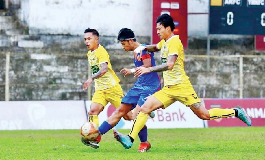
ရာမညယူနိုက်တက်အသင်းနှင့် ဧရာဝတီရိန်းဂျားအသင်းတို့ ယှဉ်ပြိုင်ကစားကြစဉ်။

သုံးဂိုး-နှစ်ဂိုးဖြင့်အနိုင်ရ ပဒုမ္မာကွင်း၌ ကျင်းပသည့် ပွဲတွင် ရာမညယူနိုက်တက်အသင်း က ဧရာဝတီရိန်းဂျားအသင်းကို သုံးဂိုး-နှစ်ဂိုးဖြင့် အနိုင်ရခဲ့သည်။ ရာမညယူနိုက်တက်အသင်းသည် ပွဲပြီးခါနီးသွင်းဂိုးဖြင့် အနိုင်ရရှိကာ စာမျက်နှာ ၂၃ ကော်လံ ၁ သို့ ❁