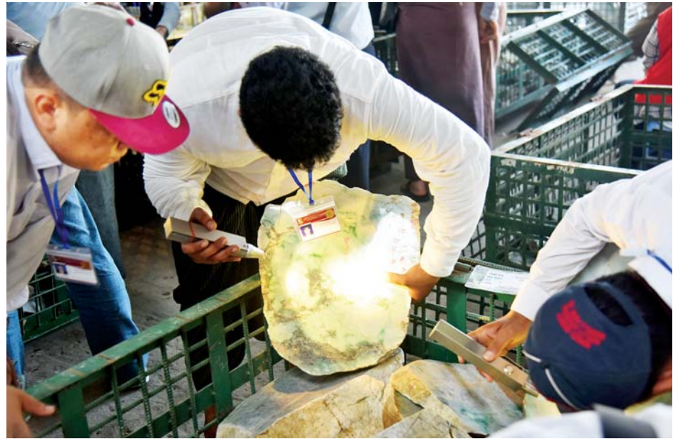
ပြည်တွင်း၊ ပြည်ပရတနာကုန်သည်များ မဏိရတနာကျောက်စိမ်းခန်းမအပြင်ဘက် သတ်မှတ်နေရာများအလိုက် ခင်းကျင်းပြသထားသည့် ကျောက်စိမ်းအတွဲများကို စိတ်ကြိုက်လေ့လာကြည့်ရှုစဉ်။