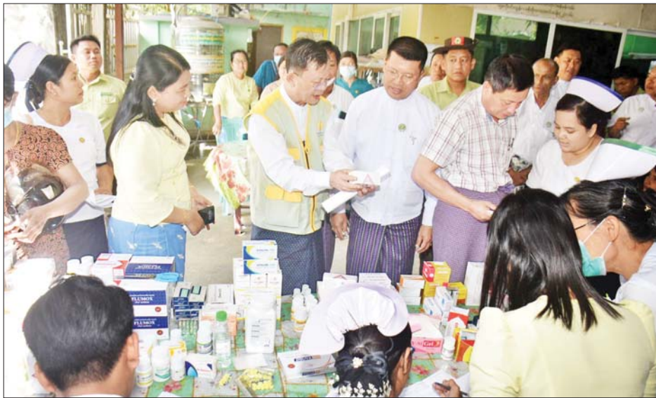
အတွက် ဒေသထွက်လက်ဆောင်ပစ္စည်းများပေးအပ်ခဲ့သည်။ ရေကြည်မြို့နယ်အတွင်း ပင်စင်စား နိုင်ငံဝန်ထမ်းများနှင့် ဒေသခံပြည်သူ စုစုပေါင်း ၃၅၅ ဦးအား အခမဲ့ဆေးကုသမှုများ ဆောင်ရွက်ပေးခဲ့ကြောင်း သိရသည်။ ဆက်လက်၍ တိုင်းဒေသကြီးဝန်ကြီးချုပ်နှင့် တိုင်းဒေသကြီး(ပြန်/ဆက်)

ပုသိမ် နိုဝင်ဘာ ၁၈ ဧရာဝတီတိုင်းဒေသကြီးဝန်ကြီးချုပ် ဦးတင်မောင် ဝင်းသည် တာဝန်ရှိသူများနှင့်အတူ ယနေ့နံနက်ပိုင်းတွင် ရေကြည်မြို့ မင်္ဂလာအောင်သိဒ္ဓိ ဘုန်းတော်ကြီးကျောင်းတွင် ပုသိမ်မြို့၊ ပြည်သူ့ဆေးရုံကြီးမှ အထူးကု ဆရာဝန်ကြီးများက ပင်စင်စားနိုင်ငံဝန်ထမ်းများနှင့် ပြည်သူများအား အခမဲ့ကွင်းဆင်းဆေးကုသမှုများကို ကြည့်ရှုအားပေးပြီး လာရောက်ကုသမှု ခံယူသည့် ဒေသခံပြည်သူများအား ရင်းရင်းနှီးနှီးတွေ့ဆုံ အားပေးစကားများ ပြောကြားသည်။