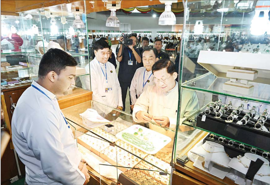
နိုင်ငံတော်စီမံအုပ်ချုပ်ရေးကောင်စီဥက္ကဋ္ဌ နိုင်ငံတော်ဝန်ကြီးချုပ်ဗိုလ်ချုပ်မှူးကြီးမင်းအောင်လှိုင် ပုဂ္ဂလိက ကျောက်မျက် ရတနာအချောထည်အရောင်းပြခန်းများ ဖွင့်လှစ်ရောင်းချနေမှုကို ကြည့်ရှုအားပေးစဉ်။