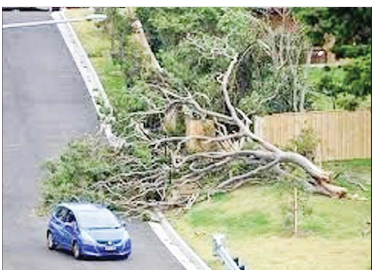
ကျရောက်နိုင်ကြောင်း မိုးလေဝသဌာနက ပြောကြားသည်။ ဆစ်ဒနီမြို့ အနောက်မြောက်ဘက် ကီလိုမီတာ ၅၀၀ ရှိ ကာရင်ဒါဒေသတွင် အဆောက်အအုံသုံးလုံး ပျက်စီးခဲ့သည်။ လေပြင်းတိုက်ခတ်မှုကြောင့် ခေါင်မိုးများ ပြိုကျခဲ့ပြီး မော်တော်ယာဉ် ၂၅ စီး ပျက်စီးခဲ့ ကာဆစ်ဒနီတံတားပေါ်တွင် ယာဉ်ကြော ပိတ်ဆို့မှုများ ဖြစ်ပေါ်ခဲ့သည်။ ပြည်နယ်အစိုးရသည် ပျက်စီးသွား သည့် မော်တော်ယာဉ်များကို ပြုပြင်ရန် အတွက် စရိတ်ပေးဆောင်ရမည်ဟု နယူးဆောက်ဝေးလ်သယ်ယူပို့ဆောင်ရေး အတွင်းရေးမှူး ဂျော့မာရေးက ပြောကြား သည်။ ကိုးကား - ဆင်ဟွာ ဘာသာပြန် - စိုးသူရ

ဆစ်ဒနီ နိုဝင်ဘာ ၁၈ သြစတြေးလျနိုင်ငံ နယူးဆောက် ဝေးလ်ပြည်နယ်၌ မုန်တိုင်းဝင်ရောက် တိုက်ခတ်မှုမှတစ်ဆင့် ဖြစ်ပေါ်ခဲ့သည့် မိုးသည်းထန်စွာ ရွာသွန်းမှုကြောင့် လူနေအိမ်အများအပြား ပျက်စီးခဲ့ပြီး လေယာဉ်ခရီးစဉ် ၂၀ ကျော် ဖျက်သိမ်းခဲ့ ရကာ ဆစ်ဒနီဆိပ်ကမ်းတံတား၏ အစိတ်အပိုင်းများ ထိခိုက်ပျက်စီးခဲ့ ကြောင်း ယနေ့ဆင်ဟွာသတင်းအရ သိရ သည်။ တစ်နာရီလျှင် လေတိုက်နှုန်း ကီလို မီတာ ၁၀၀ ကျော်ရှိသည့် အဆိုပါမုန်တိုင်း သည် မိုးသည်းထန်စွာရွာသွန်းပြီး ဆစ်ဒနီမြို့နှင့် နယူးဆောက်ဝေးလ် ပြည်နယ်တို့၌ နိုဝင်ဘာ ၁၇ ရက်ညတွင် တိုက်ခတ်ခဲ့ရာ လျှပ်စစ်မီးပျက်မှုများ ကြောင့် နယူးဆောက်ဝေးလ်ပြည်နယ် တစ်ဝန်းရှိ ဒေသခံများ ထိခိုက်ခဲ့သည်။ ၎င်းမုန်တိုင်းကြောင့် နယူးဆောက် ဝေးလ်ပြည်နယ် အရှေ့မြောက်ပိုင်းတွင် ပိုမိုပြင်းထန်သော မိုးကြိုးမုန်တိုင်းများ