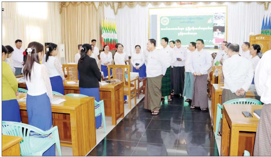
သမဝါယမအသင်း စာရင်းဇယား ငွေများ စနစ်တကျထိန်းသိမ်း ကိုင်နှင့် စာရင်းစစ်ဆေးခြင်း များ စနစ်တကျရှိစေရန်နှင့် ဘဏ္ဍာ တတ်စေရန်၊ စာရင်းရေး၊ စာရင်း စသည့်သမဝါယမပညာရပ်များကို

များ၊ သမဝါယမအသင်းစုချုပ် ဥက္ကဋ္ဌများနှင့် တာဝန်ရှိသူများ၊ သင်တန်းသား သင်တန်းသူများ တက်ရောက်ကြသည်။ မှာကြား ဦးစွာ ပြည်ထောင်စုဝန်ကြီးက ယခုသင်တန်းတွင် သမဝါယမ အသင်းများ နည်းစနစ်မှန်ကန်စွာ ရှင်သန်ဖွံ့ဖြိုးတိုးတက်လာစေရေး ဆောင်ရွက်ရန် အချက်များ၊ နေကြာသီးနှံအား ရှာဖွေမြေဩဇာ သုံးစွဲ၍ စိုက်ပျိုးနည်းစနစ်များ၊ မိုးစပါး၊ ဝါ၊ နေကြာသီးနှံများ အထွက်နှုန်းတိုးတက်ပြီး ပန်းတိုင် ရည်မှန်းချက်ရရှိရေးအတွက် စနစ် တကျ ဆောင်ရွက်ရန်အချက်များ၊