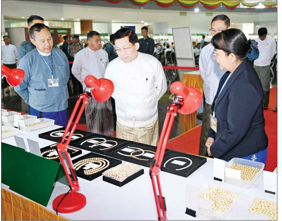
နိုင်ငံတော်စီမံအုပ်ချုပ်ရေးကောင်စီဥက္ကဋ္ဌ နိုင်ငံတော်ဝန်ကြီးချုပ် ဗိုလ်ချုပ်မှူးကြီးမင်းအောင်လှိုင် မဏိရတနာကျောက်စိမ်းခန်းမအတွင်း ခင်းကျင်းပြသထားသည့် ပုလဲအတွဲများကို ကြည့်ရှုစစ်ဆေးစဉ်။

★ စာမျက်နှာ ၃ မှ ထို့နောက် နိုင်ငံတော်စီမံ အုပ်ချုပ်ရေးကောင်စီ ဥက္ကဋ္ဌ နိုင်ငံတော်ဝန်ကြီးချုပ်နှင့် အဖွဲ့ဝင် များသည် ပုဂ္ဂလိက ကျောက်မျက် ရတနာ အချောထည် အရောင်းပြ ခန်းများ ဖွင့်လှစ်ရောင်းချနေမှုကို လိုက်လံကြည့်ရှုအားပေးပြီး ခန်းမ အပြင်ဘက်တွင် ခင်းကျင်းပြသ ထားသည့် ကျောက်စိမ်းရိုင်းအတွဲ များကို လိုက်လံကြည့်ရှုစစ်ဆေး သည်။