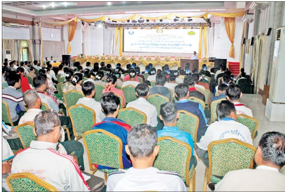
အခြေခံသဘောတရားများကို နားလည်သဘောပေါက်ကာ ဥပဒေပါ တားမြစ်ချက်ကို မလိုက်နာခြင်း၊ ဥပဒေအရ လိုက်နာဆောင်ရွက်ရမည့်ကိစ္စကို

ဥပဒေရေးရာဝန်ကြီးဌာနနှင့် ပညာရေးဝန်ကြီးဌာနတို့ ပူးပေါင်းပြီး မကွေးတိုင်းဒေသကြီးအစိုးရအဖွဲ့၏ ကြီးကြပ်လမ်းညွှန်မှုဖြင့် ဖွင့်လှစ်သည့် Grade - 11 နှင့် Grade - 12 တွင် သင်ကြားနေသော ကျောင်းသား ကျောင်းသူများအား ဥပဒေဘာသာရပ် သင်ကြားပေးနိုင်ရန် ဆရာ ဆရာမများအား ဥပဒေအသိပညာပြန့်ပွားရေး ဆရာဖြစ်သင်တန်း အမှတ်စဉ် (၂) သင်တန်းဖွင့်ပွဲ အခမ်းအနားကို ယနေ့နံနက် ၉ နာရီတွင် မကွေးမြို့ မြို့တော်ခန်းမ၌ ကျင်းပသည်။ အခမ်းအနားသို့ တိုင်းဒေသကြီးဝန်ကြီးချုပ် ဦးတင်လွင်၊ တိုင်းဒေသကြီးဝန်ကြီးများ၊ တိုင်းဒေသကြီးဥပဒေချုပ်၊ တရားလွှတ်တော်တရားသူကြီးများ၊ ဌာနဆိုင်ရာတာဝန်ရှိသူများ၊ သင်တန်းပို့ချမည့် ဥပဒေအရာရှိများ၊ သင်တန်းသား သင်တန်းသူ ဆရာ ဆရာမများ တက်ရောက်ကြသည်။ ဦးစွာ တိုင်းဒေသကြီးဝန်ကြီးချုပ်က ဥပဒေအသိပညာကို ကျောင်းသင်ခန်းစာတွင် သင်ရိုးညွှန်းတမ်းအဖြစ် ထည့်သွင်းသင်ကြားပေးခြင်းအားဖြင့် ကျောင်းသား ကျောင်းသူများသည် ဥပဒေ၏