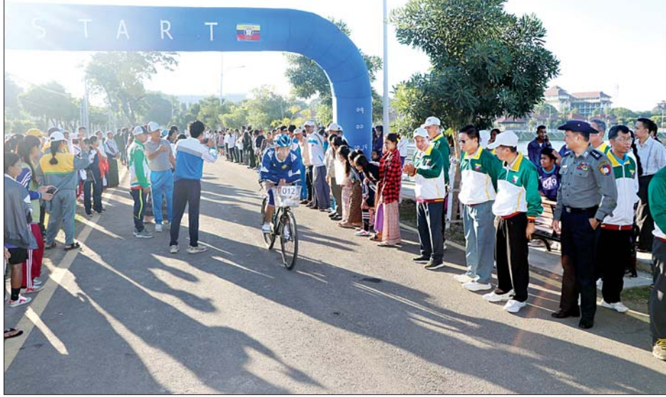
ဦးစွာ အမျိုးသား အမျိုးသမီး မိနီမာရသွန်ပြိုင်ပွဲ အား တာထွက်အချက်ပြုကာ ဖွင့်လှစ်ပေးပြီး တိုင်းဒေသကြီးဝန်ကြီးချုပ်နှင့် တာဝန်ရှိသူများက ကြည့်ရှုအားပေးကာ အနောက်ဘက်ကန်သာယာ တစ်လျှောက်တွင် တိုင်းဒေသကြီး၊ ခရိုင်၊ မြို့နယ် အဆင့် ဌာနဆိုင်ရာများမှ အရာထမ်း၊ အမှုထမ်းများ

ထို့နောက် တိုင်းဒေသကြီးဝန်ကြီးချုပ်နှင့် တာဝန်ရှိသူများသည် မုံရွာမြို့ပြည်သူ့အားကစား ကွင်းအတွင်း ၂၀၂၄ ခုနှစ် တိုင်းဒေသကြီး ဝန်ကြီးချုပ်ဖလား ဝန်ကြီးဌာနများနှင့် တက္ကသိုလ် / ဒီဂရီကောလိပ်များ အားကစားပြိုင်ပွဲ အမျိုးသမီး ထုပ်ဆီးတိုးပြိုင်ပွဲ ယှဉ်ပြိုင်နေမှုများနှင့် အမျိုးသား အမျိုးသမီး မိတာ ၈၀၀၊ မိတာ ၄၀၀ ၊ မိတာ ၂၀၀၊ မိတာ ၁၀၀ ပြေးခုန်ပစ်ပြိုင်ပွဲများ ယှဉ်ပြိုင်နေမှုများ အား ကြည့်ရှုအားပေးပြီး လိုအပ်သည်များကို တာဝန် ရှိသူများနှင့် ဖြည့်ဆည်းပေါင်းစပ် ဆောင်ရွက်ပေး ခဲ့ကြောင်း သိရသည်။ တိုင်းဒေသကြီး(ပြန်/ဆက်)