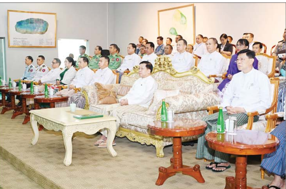
နိုင်ငံတော်စီမံအုပ်ချုပ်ရေးကောင်စီဥက္ကဋ္ဌ နိုင်ငံတော်ဝန်ကြီးချုပ် ဗိုလ်ချုပ်မှူးကြီးမင်းအောင်လှိုင်နှင့် အခမ်းအနားတက်ရောက်လာကြသူများ မြန်မာ့ပုလဲများထုတ်လုပ်မှုနှင့် ရောင်းချနိုင်မှု၊ ကျောက်မျက် ရတနာပစ္စည်းများ ထုတ်လုပ်မှုနှင့် ၂၀၂၄ ခုနှစ် နှစ်လယ်မြန်မာ့ကျောက်မျက်ရတနာပြပွဲ အခမ်းအနားကျင်းပနိုင်ရေး ပြင်ဆင်ဆောင်ရွက်ခဲ့မှု ဗီဒီယိုမှတ်တမ်းကို ကြည့်ရှုစဉ်။

★ ရှေ့ဖုံးမှ ဖိတ်ကြားထားသူများ၊ ပြည်တွင်း၊ ပြည်ပမှ ကျောက်မျက်လုပ်ငန်းရှင် များ တက်ရောက်ကြသည်။ ဦးစွာနိုင်ငံတော်စီမံအုပ်ချုပ်ရေး ကောင်စီဥက္ကဋ္ဌ နိုင်ငံတော် ဝန်ကြီးချုပ်နှင့် အခမ်းအနား တက်ရောက်လာကြသူများသည် မြန်မာ့ပုလဲများ ထုတ်လုပ်မှုနှင့် ရောင်းချနိုင်မှု၊ ကျောက်မျက် ရတနာပစ္စည်းများ ထုတ်လုပ်မှုနှင့် ၂၀၂၄ ခုနှစ် နှစ်လယ်မြန်မာ့ ကျောက်မျက်ရတနာပြပွဲ အခမ်း အနားကျင်းပနိုင်ရေး ပြင်ဆင် ဆောင်ရွက်ခဲ့မှု ဗီဒီယိုမှတ်တမ်း ကို ကြည့်ရှုကြသည်။ ကျောက်စိမ်း၊ ကျောက်မျက် အတွဲများနှင့် ပုလဲအတွဲများ ကြည့်ရှုစစ်ဆေး ယင်းနောက် နိုင်ငံတော်စီမံ အုပ်ချုပ်ရေးကောင်စီ ဥက္ကဋ္ဌ နိုင်ငံတော် ဝန်ကြီးချုပ်နှင့် အခမ်းအနားတက်ရောက်လာကြ သူများသည် ၂၀၂၄ ခုနှစ် နှစ်လယ်