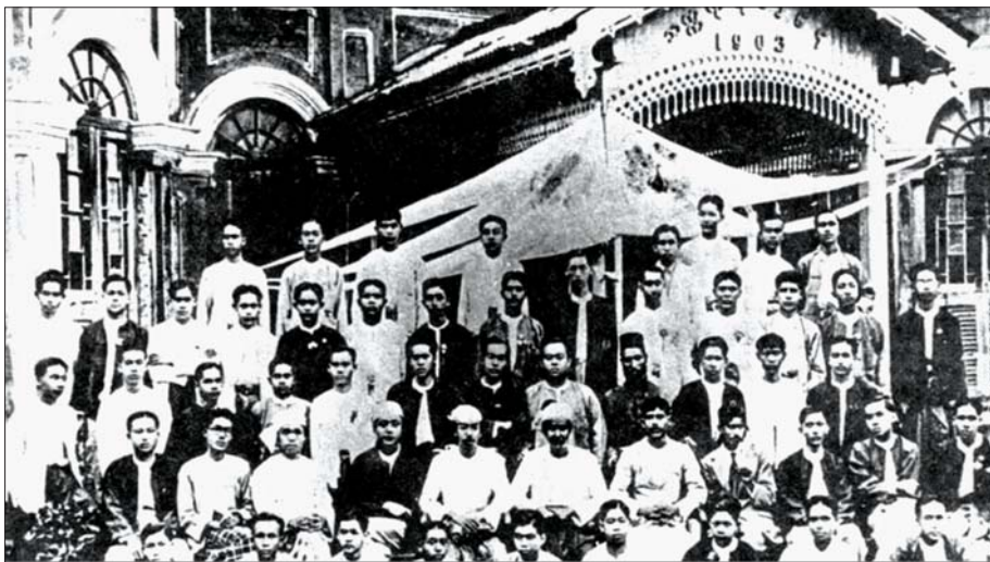
၁၉၂၀ ပြည့်နှစ် ပထမကျောင်းသားသပိတ်အပြီး ဗဟန်းအမျိုးသားကောလိပ်ကို ဖွင့်လှစ်ခဲ့ရာ သင်ကြားပို့ချပေးသည့် ဆရာများနှင့် ကျောင်းသားများကို တွေ့ရစဉ်။

စင်စစ် မြန်မာတို့ အမျိုးသားရေးစိတ်ဓာတ်များ နိုးကြားလာရသည့် အခြေခံအကြောင်းရင်းများတွင် ကိုလိုနီခေတ်တစ်လျှောက် ရုံးသုံးစာပေအဖြစ် အင်္ဂလိပ်ဘာသာဖြင့်သာ သတ်မှတ်သုံးစွဲခဲ့ကြခြင်း၊ အရပ်သုံး၊ စီးပွားရေးနယ်ပယ်သုံး ဘာသာစကား အဖြစ် ဟိန္ဒူစတန်နီလို အိန္ဒိယဘာသာစကားများကို သုံးစွဲခဲ့ခြင်း၊ ၁၉၁၀ ပြည့်လွန်ကာလဆီက မြန်မာ သင်ပုန်းကြီးပြဋ္ဌာန်းဖတ်စာထဲတွင် အသုံးနည်း သည့် မြန်မာအက္ခရာတချို့ကို ဖြုတ်ပယ်ရန် ကြံစည်