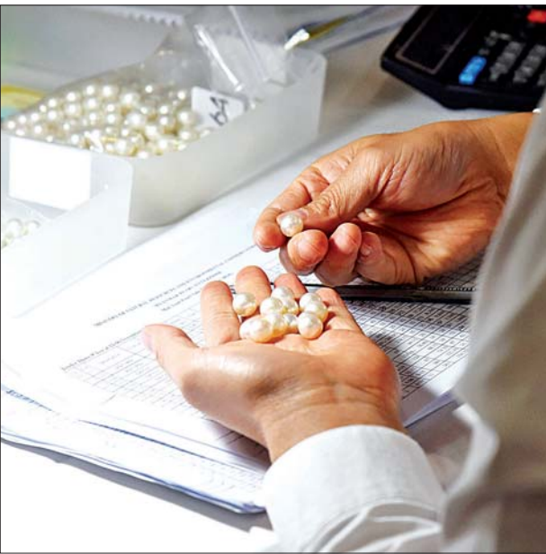
ပြည်တွင်း၊ ပြည်ပရတနာကုန်သည်များ မဏိရတနာကျောက်စိမ်းခန်းမအတွင်း ခင်းကျင်းပြသထားသည့် ပုလဲအတွဲများကို စိတ်ကြိုက်လေ့လာကြည့်ရှုစဉ်။

ပေးချေဝယ်ယူနိုင်မည့် အုပ်စု(အေ)နှင့် အုပ်စု(ဘီ)တို့မှ ကျောက်စိမ်းအတွဲများကို အမေရိကန်ဒေါ်လာဖြင့် ကြမ်းခင်းဈေးသတ်မှတ်ထားရှိပြီး ပြည်တွင်း၊