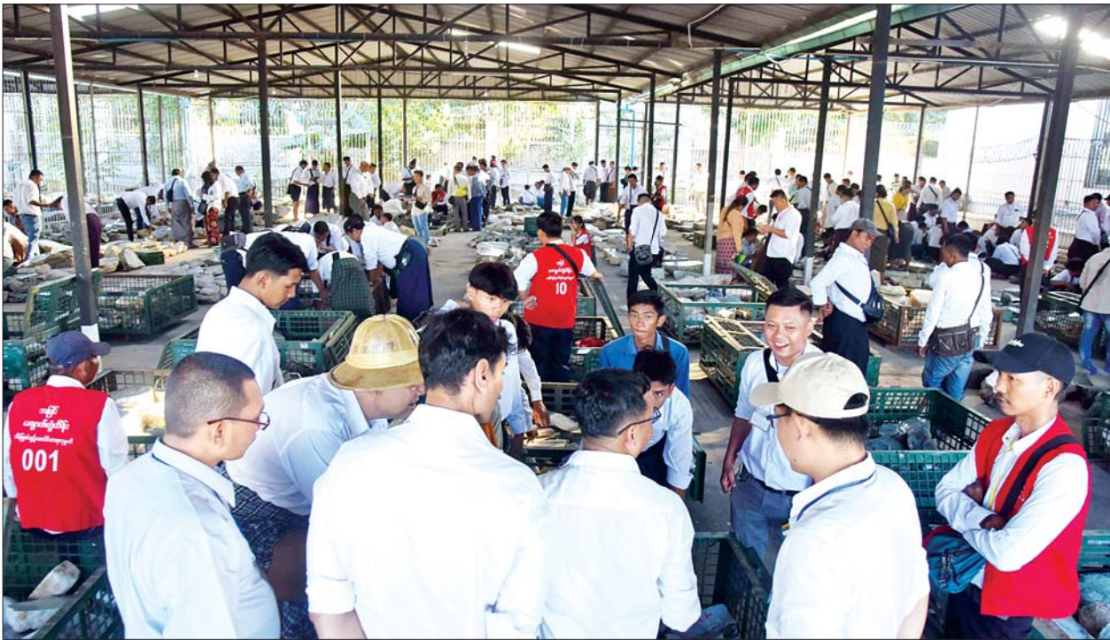
ပြည်တွင်း၊ ပြည်ပရတနာကုန်သည်များ မဏိရတနာကျောက်စိမ်းခန်းမအပြင်ဘက် သတ်မှတ်နေရာများအလိုက် ခင်းကျင်းပြသထားသည့် ကျောက်စိမ်းအတွဲများကို စိတ်ကြိုက်လေ့လာကြည့်ရှုစဉ်။

ပုလဲအတွဲများကို နိုဝင်ဘာ ၁၉ ရက်နှင့် ၂၀ ရက်တို့တွင် လည်းကောင်း၊ ကျောက်မျက် အတွဲများကို နိုဝင်ဘာ ၂၁ ရက်တွင်လည်းကောင်း၊ အုပ်စု(အေ) နှင့် အုပ်စု(ဘီ)မှ ကျောက်စိမ်းအတွဲများကို နိုဝင်ဘာ ၂၂ ရက်မှ ၂၄ ရက်အထိ လည်းကောင်း၊