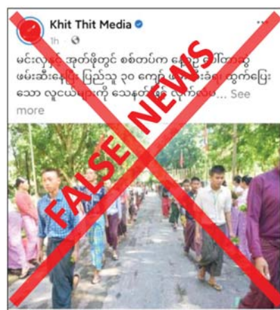
မူမရှိကြောင်း၊ ပြည်သူ့စစ်မှုထမ်းဆောင်ရန် အတွက်လူငယ်များ၊ လမ်းသွားလမ်းလာများကို

နေပြည်တော် နိုဝင်ဘာ ၁၈ ပဲခူးတိုင်းဒေသကြီး မင်းလှမြို့နယ်နှင့် အုတ်ဖိုမြို့နယ်တို့တွင် ပြည်သူ့စစ်မှုထမ်းဆောင်ရန် ပြည်သူ ၃၀ ကျော်ကို ပေါ်တာဆွဲဖမ်းဆီးခဲ့ကြောင်းနှင့် ထွက်ပြေးတိမ်းရှောင်သူများကို သေနတ်ဖြင့် လိုက်လံပစ်ခတ်ခဲ့ရာ ပြည်သူတစ်ဦး ဒဏ်ရာရရှိခဲ့သည်ဟု သတင်းတူ၊ သတင်းမှားများကို တရားမဝင်ပြည်ဖျက်မိဒီယာများက မဟုတ်မမှန် လှုံ့ဆော်ရေးသား ဝါဒဖြန့်ဝေနေသည်ကို တွေ့ရှိရသည်။ အဆိုပါ သတင်းနှင့်ပတ်သက်၍ သက်ဆိုင်ရာမြို့နယ် ပြည်သူ့စစ်မှုထမ်းဆိုင်ရေးအဖွဲ့များမှ တာဝန်ရှိသူများ၏ ပြောကြားချက်အရ ၎င်းသတင်းမှာ မှန်ကန်