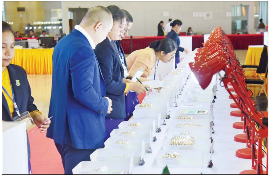
ပြည်တွင်း၊ ပြည်ပရတနာကုန်သည်များ မဏိရတနာကျောက်စိမ်းခန်းမအတွင်း ခင်းကျင်းပြသထားသည့် ပုလဲအတွဲများကို စိတ်ကြိုက်လေ့လာကြည့်ရှုစဉ်။

သတင်း - အောင်ရဲသွင်