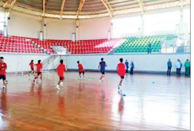
ပဉ္စမအကြိမ် အမျိုးသားအားကစားပွဲတော်တွင် ဝင်ရောက်ယှဉ်ပြိုင်မည့် ပဲခူးတိုင်းဒေသကြီးကိုယ်စားပြုအားကစားသမားများ လေ့ကျင့်နေမှုကို တွေ့ရစဉ်။

ကြည့်ရှုအားပေးခွင့်ရ ကျွန်တော် ဖြတ်သန်းခဲ့သော ဘဝတစ်လျှောက်တွင် ပြည်တွင်း၊ ပြည်ပ အားကစားပြိုင်ပွဲအမျိုးမျိုးကို ကြုံတွေ့ခဲ့ဖူး၊ အားပေးခဲ့ဖူးပါသည်။ အားကစားကဏ္ဍအသီးသီးမှ နိုင်ငံ့ဂုဏ်ဆောင် အောင်မြင်မှုအမှတ်တရများနှင့် တစ်တိုင်းတစ်ပြည်လုံး ပြည်သူ့လူထုတစ်ရပ်လုံး တစ်ခဲနက်အားပေးမှုများကို ရင်ထဲအသည်းထဲ လှိုက်လှိုက်လှဲလှဲနှင့် ကြုံခဲ့ဖူးပါသည်။ အားကစားအောင်မြင်မှုများသည် နိုင်ငံတော်နှင့် ပြည်သူ့လူထုတစ်ရပ်လုံးအတွက် ဝမ်းမြောက်ဂုဏ်ယူစရာများပင်ဖြစ်သည်။ အားကစားပြိုင်ပွဲများကို စိတ်ရောကိုယ်ပါ ကိုယ်တိုင်ကိုယ်ကျ သွားရောက်အားပေးချီးမြှောက်ခဲ့ကြသည့် ပြည်သူများကို အသိအမှတ်ပြုရမည်ဖြစ်သည်။ ကျွန်တော့်အနေဖြင့် အားကစားဝါသနာအိုး မဟုတ်သော်လည်း နေပြည်တော်တွင် နိုင်ငံ့တာဝန်ထမ်းဆောင်စဉ်က ၂၀၁၃ (၂၇) ကြိမ်မြောက် အရှေ့တောင်အာရှအားကစားပြိုင်ပွဲ၊ ၂၀၁၄ အာဆီယံမသန်စွမ်းအားကစားပြိုင်ပွဲ၊ ၂၀၁၅ စတုတ္ထအကြိမ် အမျိုးသားအားကစားပွဲတော်၊ ၂၀၁၈ အာဆီယံတက္ကသိုလ်များအားကစားပြိုင်ပွဲများကို ကြည့်ရှုအားပေးခွင့်ရခဲ့ဖူးပါသည်။