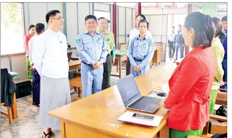
အအုံများ၊ ဝန်ထမ်းအိမ်ရာများ ပြန်လည်ပြုပြင်ဆောင်ရွက်နေမှုနှင့် ဌာနခွဲ၊ ဌာနစိတ်များအလိုက် ဝန်ထမ်းများ တာဝန်ထမ်းဆောင်နေမှုတို့ကို ကြည့်ရှုစစ်ဆေးကာ ဝန်ထမ်းများအား ရင်းရင်းနှီးနှီး နှုတ်ဆက်အားပေးစကား ပြောကြားခဲ့ကြောင်း သိရသည်။ ပြည်နယ်(ပြန်/ဆက်)

ကြည့်ရှုစစ်ဆေးသည်။ ပြည်နယ်ဝန်ကြီးချုပ်က ရွှေတောင်ပရိယတ္တိစာသင်တိုက် အတုလကျောင်းဆောင် မျက်နှာကြက်၊ ပြတင်းမှန်နှင့် လောကမှန်များ ထပ်မံပြုပြင်ပေးရန်နှင့် ဆရာတော်၊ သံဃာတော်များ ပြန်လည်ဝင်ရောက်သီတင်းသုံးချိန်တွင် အဆင်ပြေချောမွေ့စေရေးအတွက် လုပ်ငန်းများအား သတ်မှတ်ချိန်စံညွှန်းပြည့်မီရေး၊ သတ်မှတ်ကာလအတွင်း ပြီးစီးရေးအလေးထား ဆောင်ရွက်ရန် မှာကြားပြီး လိုအပ်သည်များ ပေါင်းစပ်ညှိနှိုင်းပေးသည်။ ထို့နောက် ပြည်နယ်နှင့် မြို့နယ်စည်ပင်သာယာရေးအဖွဲ့ရုံးများ ပြန်လည် ဖွင့်လှစ်လျက်ရှိသည့် အခြေအနေနှင့် ရုံးအဆောက်