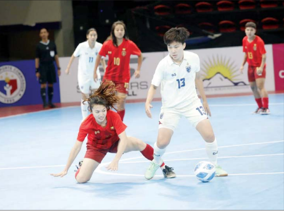
မြန်မာအသင်းနှင့် ထိုင်းအသင်းတို့ ယှဉ်ပြိုင်ကစားကြစဉ်။

အုပ်စုတတိယနေ့တွင် ထိုင်း အသင်းက မြန်မာအသင်းကို ရုံးနိမ့်-တစ်ဂိုး၊ ဗီယက်နမ်အသင်း က အင်ဒိုနီးရှားအသင်းကို ငါးဂိုး ပြတ်အနိုင်ရခဲ့သည်။ မြန်မာ အသင်းသည် နာမည်ကြီး ထိုင်း အသင်းကို အရေးနိမ့်သော်လည်း အပြန်အလှန် ကစားနိုင်ခဲ့ပြီး တစ်ဂိုးတည်းဖြင့် ကပ်၍အရေးနိမ့် ခဲ့ခြင်းဖြစ်သည်။