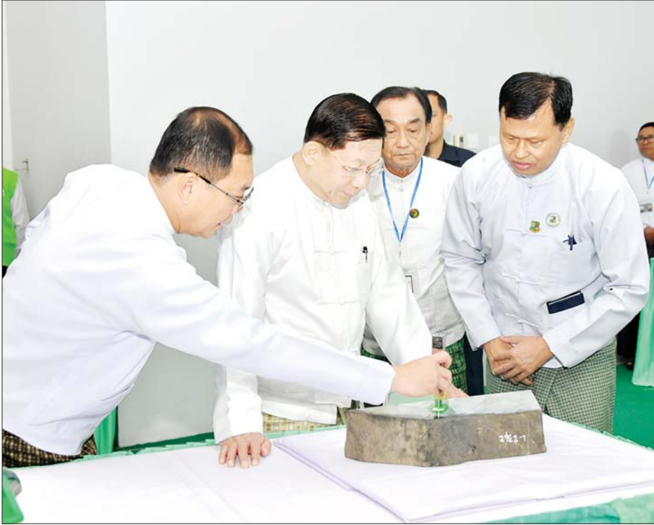
နိုင်ငံတော်စီမံအုပ်ချုပ်ရေးကောင်စီဥက္ကဋ္ဌ နိုင်ငံတော်ဝန်ကြီးချုပ် ဗိုလ်ချုပ်မှူးကြီးမင်းအောင်လှိုင် မဏိရတနာကျောက်စိမ်းခန်းမအတွင်း ခင်းကျင်းပြသထားသည့် ကျောက်စိမ်းအတွဲများကို ကြည့်ရှု စစ်ဆေးစဉ်။