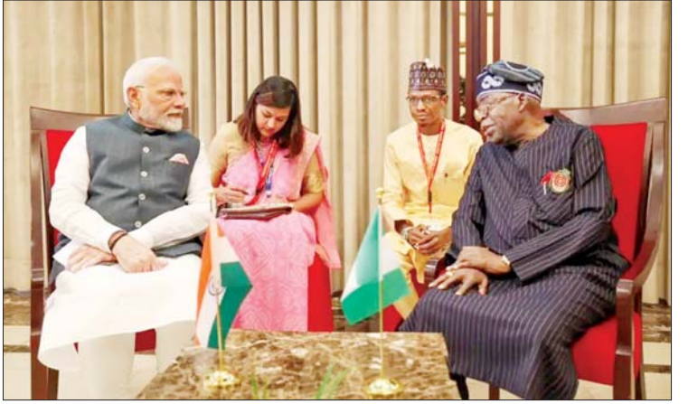
အိန္ဒိယနိုင်ငံက အသင့်ရှိကြောင်း မိုဒီက အိန္ဒိယခေါင်းဆောင်တစ်ဦး၏ ပထမဆုံး ထပ်လောင်းပြောကြားခဲ့သည်။ သော နိုင်ဂျီးရီးယားနိုင်ငံ ခရီးစဉ်ဖြစ်သည်။ မိုဒီ၏ခရီးစဉ်သည် ၁၇ နှစ်အတွင်း ကိုးကား - ဆင်ဟွာ၊ ဘာသာပြန် - စိုးသူရ

ဝန်ကြီးချုပ်မိုဒီ၏ ခရီးစဉ်အပြီးတွင် ကြေညာခဲ့သည်။ အကြမ်းဖက်ဝါဒကို လက်သင့်မခံ ကြောင်းနှင့် ကုလသမဂ္ဂနိုင်ငံတကာ အကြမ်းဖက်မှုဆိုင်ရာ ဘက်စုံကွန်ဗင်းရှင်း လုပ်ငန်းစဉ်အောက်တွင် အကောင်အထည် ဖော်ရန်အပါအဝင် အကြမ်းဖက်မှုတပ်ပြန် ရေး ကုလသမဂ္ဂလုံခြုံရေးကောင်စီ ဆုံးဖြတ်ချက်များအား အကောင်အထည် ဖော်ရန် နှစ်နိုင်ငံစလုံးက တောင်းဆိုခဲ့ သည်။ နိုင်ဂျီးရီးယား၏ ကာကွယ်ရေးကဏ္ဍ ခေတ်မီရန် ကြိုးပမ်းမှုများကို ပံ့ပိုးရန်