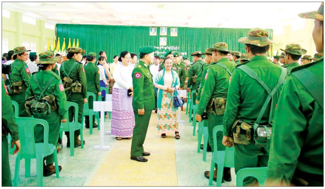
၂၀၂၃-၂၀၂၄ ပညာသင်နှစ်အတွက် တက္ကသိုလ်လေ့ကျင့်ရေးတပ်ဖွဲ့ဝင် ဆရာ ဆရာမများနှင့် ကျောင်းသား ကျောင်းသူများ မိုးရာသီစခန်းချလေ့ကျင့်ရေး သင်တန်းဆင်းပွဲကျင်းပစဉ်။

နေပြည်တော် နိုဝင်ဘာ ၁၄ နိုင်ငံတော် ကာကွယ်ရေးဆိုင်ရာ အသိအမြင်များရရှိ၍ အနာဂတ်နိုင်ငံတော်၏ တာဝန်များထမ်းဆောင်သည့် အခါတွင် အထောက်အကူရရှိကာ နိုင်ငံချစ်စိတ်၊ မျိုးချစ်စိတ်များ ပိုမိုရင့်သန်လာစေရန်နှင့် ယုံကြည်ချက်၊ ခံယူချက် မြင့်မားပြီး အရည်အချင်း ပြည့်ဝစေရန် ရည်ရွယ်ချက်ဖြင့် တက္ကသိုလ်အသီးသီးမှ ကိုယ်တိုင်ဆန္ဒပြုသည့် တက္ကသိုလ်လေ့ကျင့်ရေးတပ်ဖွဲ့ဝင် ဆရာ ဆရာမများ၊ ကျောင်းသားကျောင်းသူများကို ကာကွယ်ရေးဦးစီးချုပ်ရုံး(ကြည်း) ပြည်သူ့စစ်နှင့်နယ်ခြားတပ်များ ညွှန်ကြားရေးမှူးရုံးကွပ်ကဲမှုအောက် တက္ကသိုလ်လေ့ကျင့်ရေးတပ်များမှ ပထမနှစ်အခြေခံစစ်ပညာသင်တန်း၊ ဒုတိယနှစ်အခြေခံစစ်ပညာသင်တန်းနှင့် ပထမနှစ်တန်းမြင့်စစ်ပညာစာမျက်နှာ ၁၅ ကော်လံ ၁ သို့ ၀