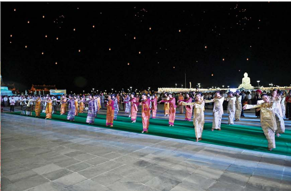
နိုင်ငံတော်စီမံအုပ်ချုပ်ရေးကောင်စီဥက္ကဋ္ဌ နိုင်ငံတော်ဝန်ကြီးချုပ် ဗိုလ်ချုပ်မှူးကြီးမင်းအောင်လှိုင်နှင့်ဇနီး ဒေါ်ကြူကြူလှ၊ အခမ်းအနားတက်ရောက်လာကြသူများ ယဉ်ကျေးမှုအဖွဲ့များ၏ ဖျော်ဖြေတင်ဆက်မှုကို ကြည့်ရှုအားပေးစဉ်။

»» စာမျက်နှာ ၃ မှ ထို့နောက် နိုင်ငံတော်စီမံအုပ်ချုပ်ရေးကောင်စီ ဥက္ကဋ္ဌ နိုင်ငံတော်ဝန်ကြီးချုပ်နှင့် ဇနီးနှင့် ဧည့်ပရိသတ်များသည် နေပြည်တော် ကောင်စီနယ်မြေ အပါအဝင် တိုင်းဒေသကြီးနှင့် ပြည်နယ်အသီးသီးရှိ ရက်ကန်းစင်တော် ၁၅ ခုမှ ရက်ကန်းအဖွဲ့များ၏ မသိုးရွှေကြာသင်္ကန်း ရက်လုပ်နေမှုများကို ရက်ကန်းစင်တော် တစ်ခုချင်းစီအလိုက် စိတ်ဝင်တစား လှည့်လည်ကြည့်ရှုအားပေးကြသည်။