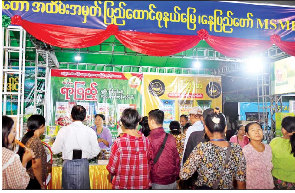
ဒေသထွက်ကုန်၊ စားသောက်ကုန်နှင့် လူသုံးကုန်ပစ္စည်းအရောင်းဆိုင်များတွင် ဝယ်ယူအားပေးကြသူများကို တွေ့ရစဉ်။