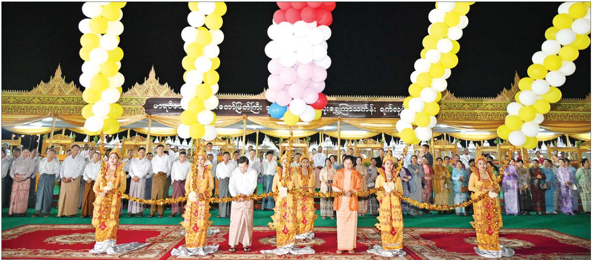
နိုင်ငံတော်စီမံအုပ်ချုပ်ရေးကောင်စီဥက္ကဋ္ဌ နိုင်ငံတော်ဝန်ကြီးချုပ် ဗိုလ်ချုပ်မှူးကြီးမင်းအောင်လှိုင်နှင့် ဇနီး ဒေါ်ကြူကြူလှ မာရဝိဇယဗုဒ္ဓရုပ်ပွားတော်မြတ်ကြီးအား ဒုတိယအကြိမ် မသိုးရွှေကြာသင်္ကန်းတော် ရက်လုပ်ပူဇော်ပွဲ ဖွင့်ပွဲအခမ်းအနားကို ဖဲကြိုးဖြတ်ဖွင့်လှစ်ပေးစဉ်။