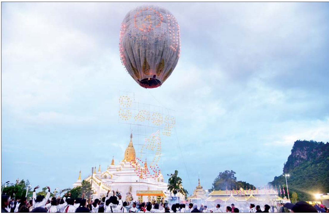
တောင်ကြီးမြို့၌ တန်ဆောင်တိုင် မီးပုံးပျံပွဲတော်အခမ်းအနားကို နိုဝင်ဘာ ၁၂ ရက်က ကျင်းပစဉ်။

အဇာတသတ်မင်းကြီး၏ အမြော်အမြင်ကြီးမားမှုကြောင့် ယနေ့ကာလတွင် သာသနာတော်နှစ်ကို ၂၅၆၈ ခုနှစ်ဟု အတိအကျပြောနိုင်၊ ရေးနိုင်ခဲ့ပေသည်။ အဇာတသတ်မင်းကြီးကို အကြောင်းပြု၍