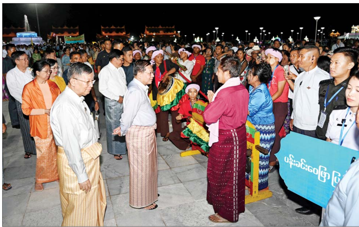
နိုင်ငံတော်စီမံအုပ်ချုပ်ရေးကောင်စီဥက္ကဋ္ဌ နိုင်ငံတော်ဝန်ကြီးချုပ် ဗိုလ်ချုပ်မှူးကြီးမင်းအောင်လှိုင်နှင့်ဇနီး ဒေါ်ကြူကြူလှ ဘုရားဖူးလာရဟန်းရှင်လှပြည်သူများအား ရင်းရင်းနှီးနှီးနှုတ်ဆက်စဉ်။

တော် ဒက္ခိဏသီရိမြို့နယ်ရှိ မာရဝိဇယ ဗုဒ္ဓရုပ်ပွားတော်မြတ်ကြီး ဗုဒ္ဓဥယျာဉ်တော်အတွင်း၌ တန်ဆောင်တိုင်ပွဲတော် အခါသမယအဖြစ် တန်ဆောင်တိုင်မီးထွန်းပွဲတော်ကို နိုဝင်ဘာ ၁၃ ရက်မှ ၁၅ ရက်အထိ ရိုးရာယဉ်ကျေးမှုအစဉ်အလာများနှင့်အညီ ခမ်းနားထည်ဝါစွာဖြင့် စည်ကားသိုက်မြိုက်စွာ ကျင်းပပြုလုပ်သွားမည်ဖြစ်ပြီး အသံမစ်မဟာပဋ္ဌာန်းရွတ်ဖတ်ပူဇော်ခြင်း၊ ဝတ်အသင်းအဖွဲ့များမှ ဝတ်ရွတ်စဉ်များဖြင့် ပူဇော်ခြင်း၊ မီးရှူးမီးပန်းများ ပစ်လွှတ်ပူဇော်ခြင်း၊ အလှည့်မီးကြီးနှင့် စိန်နားပန်းမီးပုံးပျံကြီးများ လွှတ်တင်ပူဇော်ခြင်း၊ ဒုတိယအကြိမ် မသိုးရွှေကြာသင်္ကန်းရက်လုပ် ကပ်လှူပူဇော်ခြင်းများကို ဆောင်ရွက်သွားမည်ဖြစ်သည့်အပြင် ဗုဒ္ဓဥယျာဉ် ဝတ္ထုကံတော်အတွင်း LED မီးများဖြင့် အလှဆင် ပူဇော်ထားရှိခြင်း၊ အသေးစား၊ အငယ်စားနှင့် အလတ်စားစီးပွားရေး (MSME) လုပ်ငန်းများ၏ ဒေသထွက်ကုန်၊ စားသောက်ကုန်၊ လူသုံးကုန်