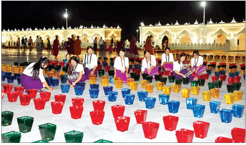
ဌာနဆိုင်ရာဝန်ထမ်းများ ဆီမီးထွန်းညှိပူဇော်ကြစဉ်။