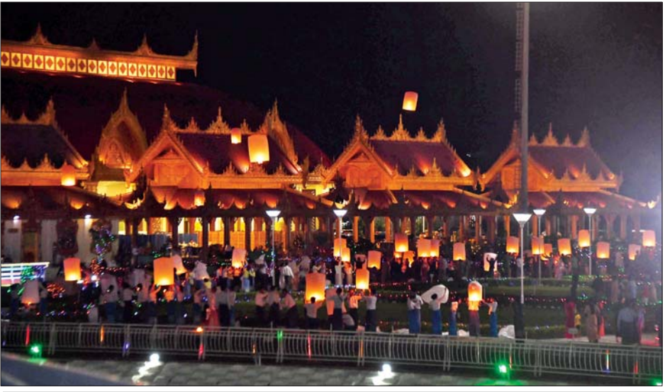
မီးပုံးပျံအသေးများ လွှတ်တင်ပူဇော်စဉ်။

မီးထွန်းပွဲတော်သို့ လာရောက်ကြသည့် ဘုရားဖူးလာ ရဟန်း ရှင်လှူပြည်သူများသည် စိတ်အေးချမ်းသာစွာဖြင့် မာရဝိဇယဗုဒ္ဓရုပ်ပွားတော်မြတ်ကြီးအား ဖူးမြော်ကြည့်ကြပြီး ဘုရားရင်ပြင်တော်အတွင်း ဆီမီးကပ်လှူပူဇော်ခြင်း၊ အသံမစဲ ပဋ္ဌာန်းရွတ်ဖတ်ပူဇော်ခြင်းနှင့် ဝတ်အသင်းအဖွဲ့များက ဝတ်ရွတ်စဉ်များဖြင့် ပူဇော်ခြင်းတို့ကို ဆောင်ရွက်ကြရာ စာမျက်နှာ ၉ သို့ ❁