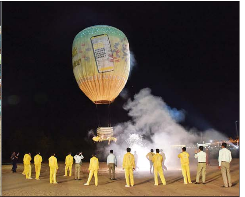
နိုင်ငံတော်စီမံအုပ်ချုပ်ရေးကောင်စီဥက္ကဋ္ဌ နိုင်ငံတော်ဝန်ကြီးချုပ် ဗိုလ်ချုပ်မှူးကြီးမင်းအောင်လှိုင်နှင့်ဇနီး ဒေါ်ကြူကြူလှ၊ အခမ်းအနားတက်ရောက်လာကြသူများ စိန်နားပန်မီးပုံးပျံများ လွှတ်တင်မှုကို ကြည့်ရှုအားပေးစဉ်။

၀ ရှေ့ဖုံးမှ အခမ်းအနားသို့ နိုင်ငံတော် စီမံအုပ်ချုပ်ရေးကောင်စီ ဥက္ကဋ္ဌ နိုင်ငံတော်ဝန်ကြီးချုပ်နှင့် ဇနီး တို့နှင့်အတူ နိုင်ငံတော်စီမံအုပ်ချုပ် ရေးကောင်စီဒုတိယဥက္ကဋ္ဌ ဒုတိယ ဝန်ကြီးချုပ်နှင့်ဇနီး၊ ကောင်စီ အတွင်းရေးမှူးနှင့်ဇနီး၊ တွဲဖက် အတွင်းရေးမှူးနှင့်ဇနီး၊ ကောင်စီ ဝင်များနှင့် ဇနီးများ၊ ပြည်ထောင်စု အဆင့်ပုဂ္ဂိုလ်များ၊ ပြည်ထောင်စု ဝန်ကြီးများနှင့် ဇနီးများ၊ နေပြည်တော်ကောင်စီဥက္ကဋ္ဌ၊ ကာကွယ်ရေး ဦးစီးချုပ်ရုံးမှ အဆင့်မြင့်တပ်မတော်အရာရှိကြီး များနှင့် ဇနီးများ၊ နေပြည်တော် တိုင်းစစ်ဌာနချုပ် တိုင်းမှူးနှင့် တာဝန်ရှိသူများ တက်ရောက် ကြပြီး ဘုရားဖူးလာ ရဟန်းရှင်လူ ပြည်သူများကလည်း စည်ကား များပြားစွာ လာရောက်ကြည့်ရှု ကြသည်။ ဦးစွာ အခမ်းအနားကို “နမော တဿ” သုံးကြိမ်ရွတ်ဆို ဘုရား ကန်တော့ဖွင့်လှစ်ကြပြီး သာသနာ ရေးနှင့် ယဉ်ကျေးမှုဝန်ကြီးဌာန ပြည်ထောင်စုဝန်ကြီး ဦးတင်ဦးလွင် က “ဇယမင်္ဂလာစာတမ်းလွှာ” ကို ဖတ်ကြားသည်။ ထို့နောက် နိုင်ငံတော်စီမံအုပ်ချုပ် ရေးကောင်စီဥက္ကဋ္ဌ နိုင်ငံတော်