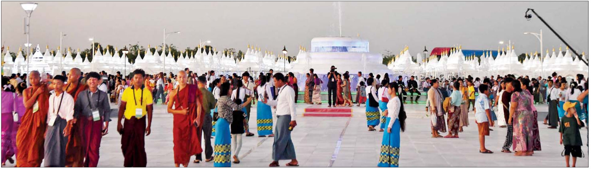
ကျောက်စာရုံစေတီတော်များနှင့်အတူ ဘုရားဖူးပြည်သူများဖြင့် စည်ကားလျက်ရှိသည်ကို တွေ့ရစဉ်။

စာမျက်နှာ ၈ မှ ဗုဒ္ဓဥယျာဉ် ဝတ္ထုကံတော်အတွင်း မြတ်စွာဘုရားရှင်၏ တရားဓမ္မသံများ စိတ်ကြည်နူးဖွယ်ရာ ဖုံးလွှမ်းလျက်ရှိသည်။