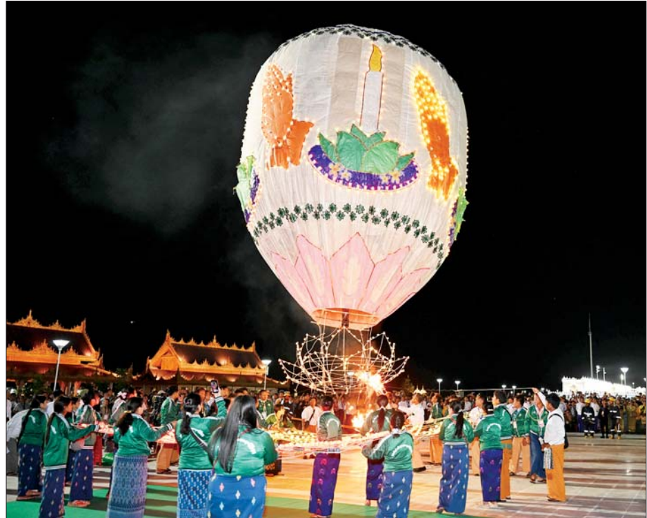
စိန်နားပန်းမီးပုံးပျံကြီး လွှတ်တင်ပူဇော်နေမှုကို တွေ့ရစဉ်။

တန်ဆောင်တိုင်မီးထွန်းပွဲတော်လာပြည်သူများ စိတ်အေးချမ်းသာစွာဖြင့် ကုသိုလ်ကောင်းမှုပြုလုပ်ကြပြီး ပွဲတော်ကို ဆင်နွှဲနိုင်ရေးအတွက်လည်း တာဝန်ရှိသူများနှင့် ကျန်းမာရေးဝန်ထမ်းများက ဘုရားပရိဝုဏ်အတွင်း စနစ်တကျလိုအပ်သည်များကို ကူညီဆောင်ရွက်ပေးသည့်အပြင် ဘုရားဖူးလာပြည်သူများ ကျန်းမာရေးတစ်စုံတစ်ရာ ဖြစ်ပေါ်လာပါက အရေးပေါ် ကျန်းမာရေးစောင့်ရှောက်မှုပေးနိုင်ရန်အတွက်လည်း ကျန်းမာရေးစောင့်ရှောက်မှုဆေးခန်းများ ဖွင့်လှစ်ထားရှိသည်ကိုလည်း တွေ့မြင်ရသည်။