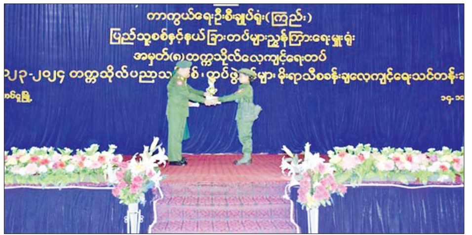
ပဲခူးတိုင်းဒေသကြီး တောင်ငူမြို့၌ မိုးရာသီစခန်းချလေ့ကျင့်ရေး သင်တန်း၌ ဆုရရှိသည့် သင်တန်းသူတစ်ဦးအား ဆုပေးအပ်ချီးမြှင့်စဉ်။

လည်း နိုင်ငံတော်ကာကွယ်ရေးနဲ့ ပတ်သက်ပြီးတော့တာဝန်ရှိတယ်။ ကျွန်တော်ဆိုရင် အခြေခံဒုတိယ နှစ်သင်တန်းကို ရောက်ရှိနေပြီ ဖြစ်ပါတယ်။ အခြေခံဒုတိယနှစ် သင်တန်းမှာဆိုရင် အခြေခံပထမ နှစ်ကတော့ တပ်နဲ့ပတ်သက်တဲ့ အခြေခံ အကြောင်းအရာတွေ သင်ကြားရတာပါ။ အခြေခံဒုတိယ နှစ်ရောက်သွားတော့ ပထမနှစ် ထက် တစ်ဆင့်မြင့်ပြီးတော့ အခုဆိုရင် တိုက်ပွဲဝင်နိုင်တဲ့အဆင့် ထိပါ သင်ကြားပေးထားပြီးဖြစ်တဲ့ အတွက် လေ့ကျင့်သားပြည့်ဝနေ ပြီလို့ ပြောလို့ရပါတယ်။ ဒါကြောင့်မို့ အခုဆို ကျွန်တော်တို့လည်းပဲ တပ်မတော်သားတွေလိုပဲ လေ့ကျင့် သားပြည့်ဝတဲ့ တက္ကသိုလ် တပ်ဖွဲ့ဝင်တစ်ယောက် အနေနဲ့ နိုင်ငံတော်ကာကွယ်ရေးမှာ အရေး ကြီးရင်တော့ လိုအပ်တဲ့နေရာ