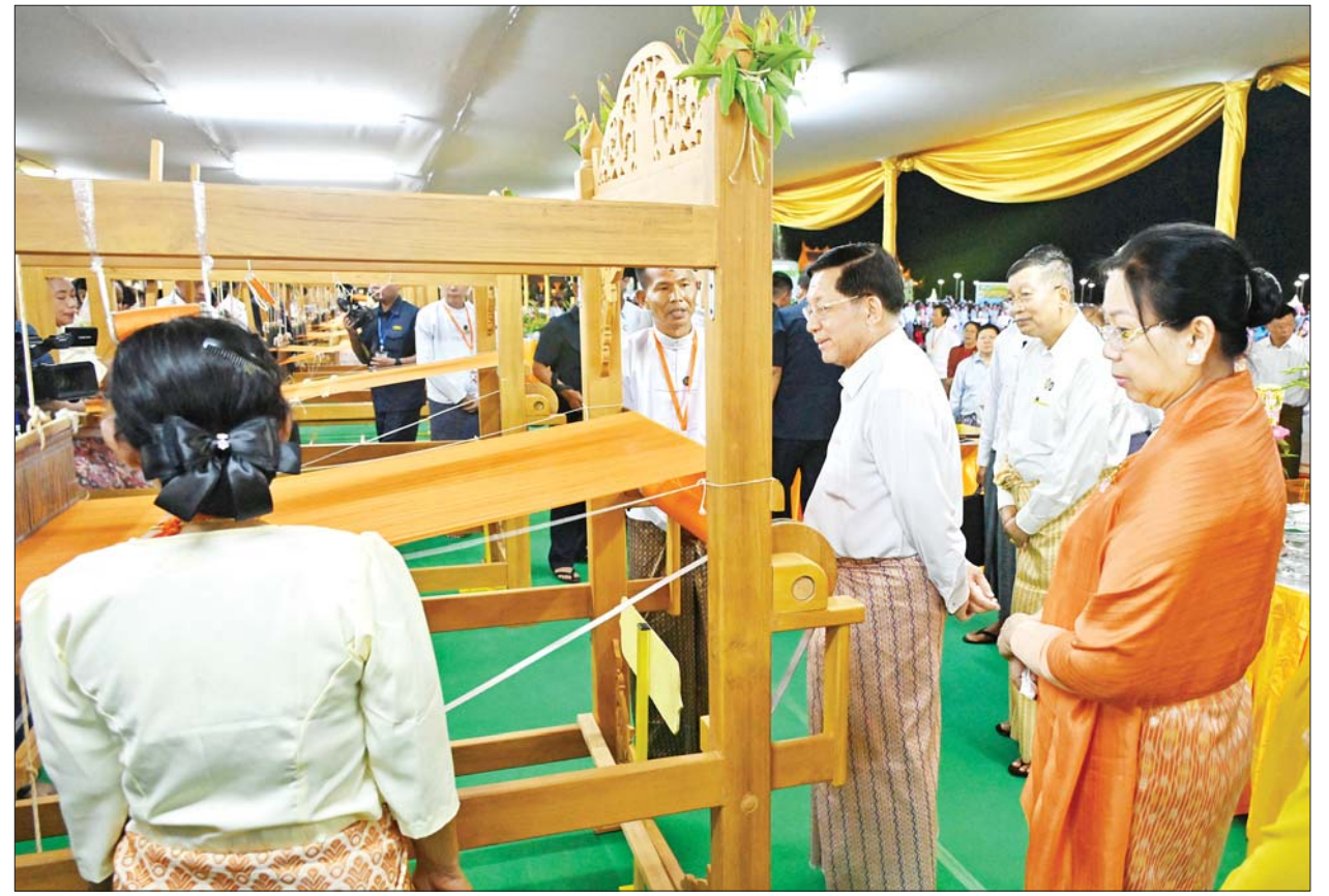
နိုင်ငံတော်စီမံအုပ်ချုပ်ရေးကောင်စီဥက္ကဋ္ဌ နိုင်ငံတော်ဝန်ကြီးချုပ် ဗိုလ်ချုပ်မှူးကြီးမင်းအောင်လှိုင်နှင့်ဇနီး ဒေါ်ကြူကြူလှတို့ မသိုးရွှေကြာသင်္ကန်း ရက်လုပ်နေမှုကို ကြည့်ရှုအားပေးစဉ်။

ဝန်ကြီးချုပ် ဗိုလ်ချုပ်မှူးကြီး မင်းအောင်လှိုင်နှင့် ဇနီး ဒေါ်ကြူကြူလှတို့က မာရဝိဇယ ဗုဒ္ဓရုပ်ပွားတော် မြတ်ကြီးအား ဒုတိယအကြိမ် မသိုးရွှေကြာ သင်္ကန်းတော် ရက်လုပ်ပူဇော်ပွဲ ဖွင့်ပွဲအခမ်းအနားကို ဖဲကြိုးဖြတ် ၍ ဖွင့်လှစ်ပေးကြသည်။ မသိုးရွှေကြာသင်္ကန်းတော်များ စတင်ရက်လုပ် ယင်းနောက် မာရဝိဇယဗုဒ္ဓ ရုပ်ပွားတော်မြတ်ကြီး ဂေါပက အဖွဲ့ဝင် ဦးသန့်ဆွေက မင်္ဂလာ အဖွဲ့ဝင် ဦးသန့်ဆွေက မင်္ဂလာ ရွှေမောင်းကို တီးခတ်၍ အချက်ပေးရာ ရက်ကန်းအဖွဲ့ များက ရက်ကန်းစင်တော်များ၌ မသိုးရွှေကြာသင်္ကန်းတော်များကို စတင်ရက်လုပ်ကြသည်။ ထိုသို့ ရက်ကန်းအဖွဲ့များက ရက်ကန်း စတင်ရက်လုပ်သည်နှင့် တစ်ပြိုင် နက် ပြန်ကြားရေးဝန်ကြီးဌာန မြန်မာ့အသံနှင့် ရုပ်မြင်သံကြားမှ အနုပညာရှင်များ၊ သာသနာရေး နှင့် ယဉ်ကျေးမှုဝန်ကြီးဌာန အနုပညာဦးစီးဌာနမှ ယဉ်ကျေးမှု အဖွဲ့များနှင့် ပြည်သူ့ဆက်ဆံရေး နှင့်စိတ်ဓာတ်စစ်ဆင်ရေး ညွှန်ကြား ရေးမှူးရုံးကွပ်ကဲမှုအောက် မြဝတီ တေးဂီတအဖွဲ့မှ အနုပညာရှင်များ က မြိုင်မြိုင်ဆိုင်ဆိုင်လတန်ဆောင် တိုင် တေးသီချင်းဖြင့် သီဆို