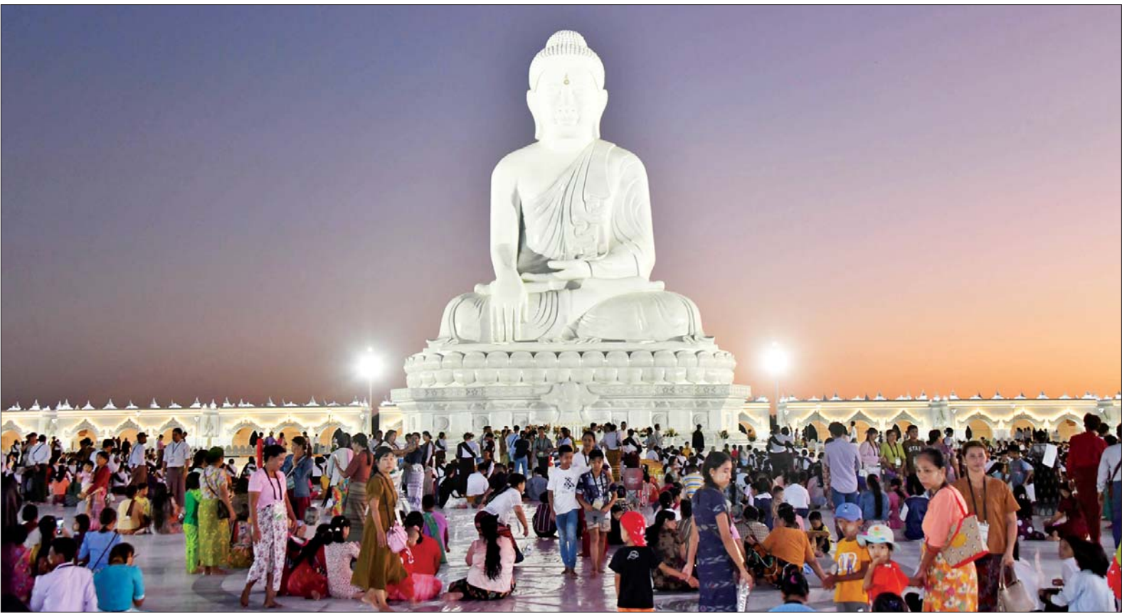
မာရဝိဇယဗုဒ္ဓရုပ်ပွားတော်မြတ်ကြီး၌ တန်ဆောင်တိုင်မီးထွန်းပွဲတော် ဒုတိယနေ့တွင် အနယ်နယ်အရပ်ရပ်မှ ဘုရားဖူးလာပြည်သူများဖြင့် အထူးစည်ကားများပြားလျက်ရှိသည်ကို တွေ့ရစဉ်။

နေပြည်တော် နိုဝင်ဘာ ၁၄ ပြည်ထောင်စုနယ်မြေ နေပြည်တော် ဒက္ခိဏသီရိမြို့နယ်အတွင်း တည်ထားပူဇော် အောင်မြင်ခဲ့သည့် ကမ္ဘာပေါ်ရှိ ထိုင်တော်မူ ကျောက်ဆစ်ဗုဒ္ဓရုပ်ပွားဆင်းတုတော်များအနက် ဉာဏ်တော်အမြင့်ဆုံးဖြစ်သည့် မာရဝိဇယဗုဒ္ဓရုပ်ပွားတော်မြတ်ကြီးတွင် ယနေ့ တန်ဆောင်တိုင်မီးထွန်းပွဲတော် ဒုတိယနေ့ကို စည်ကားသိုက်မြိုက်စွာ ဆက်လက် ကျင်းပရာ အနယ်နယ်အရပ်ရပ်မှ ပါဝင်ဆင်နွှဲကြသည့် ဘုရားဖူးလာပြည်သူများဖြင့် အထူးစည်ကားလျက်ရှိသည်။