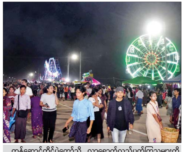
တန်ဆောင်တိုင်ပွဲတော်သို့ လာရောက်လည်ပတ်ကြသူများကို တွေ့ရစဉ်။