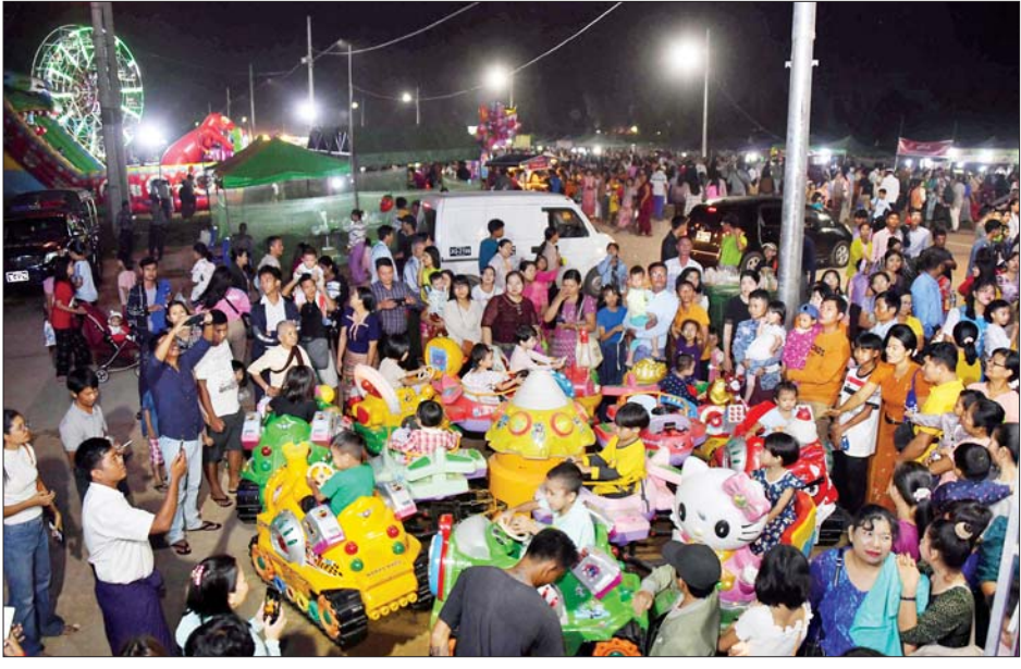
ကလေးကစားကွင်း၌ လာရောက်ကစားကြသူများဖြင့် စည်ကားလျက်ရှိသည်ကို တွေ့ရစဉ်။