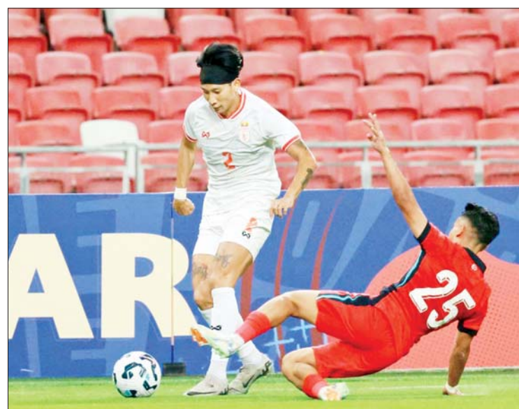
စင်ကာပူလက်ရွေးစင်အသင်းနှင့် မြန်မာ့လက်ရွေးစင်အသင်းတို့ ယှဉ်ပြိုင်နေစဉ်။