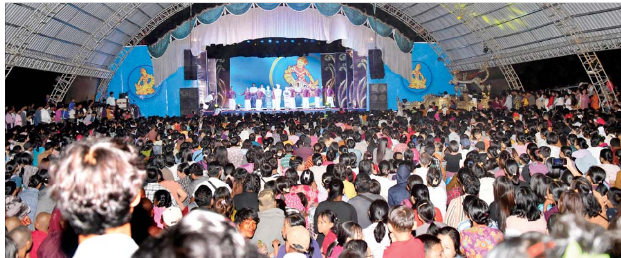
ဇာတ်မင်းသား ဖိုးချစ်အဖွဲ့နှင့်အတူ သာသနာရေးနှင့် ယဉ်ကျေးမှုဝန်ကြီးဌာနမှ အနုပညာရှင်ဝန်ထမ်းများက ဖျော်ဖြေတင်ဆက်ကြစဉ်။