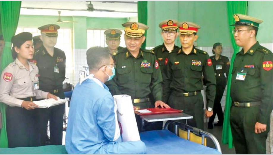
တိုင်းမှူးဗိုလ်ချုပ်ဇော်ဟိန်း မင်္ဂလာဒုံမြို့နယ်ရှိ တပ်မတော်အရိုးရောဂါအထူးကုဆေးရုံကြီး (ခုတင်- ၅၀၀)၌ တက်ရောက် ဆေးကုသမှုခံယူလျက်ရှိသူတစ်ဦးအား ကြည့်ရှုအားပေးစဉ်။