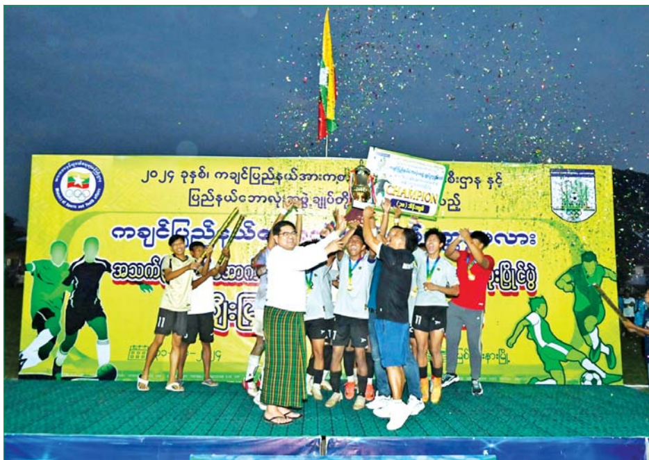
ချုပ်ဥက္ကဋ္ဌဦးလအောင်က ပထမဆုအသင်းအတွက် တစ်ဦးချင်း လည်ဆွဲဆုတံဆိပ်နှင့် ဂုဏ်ပြုချီးမြှင့် ငွေကျပ်သိန်း ၃၀ ကို လည်းကောင်း၊ ပြည်နယ်ဝန်ကြီး ချုပ်က ပထမ တံခွန်စိုက်ဆုဖလားကိုလည်းကောင်း ပေးအပ်ချီးမြှင့်ကြကြောင်း သိရသည်။ ပြည်နယ်(ပြန်/ဆက်)

ဗိုလ်စွဲခဲ့သည်။ ယင်းနောက် ဆက်လက်ကျင်းပရာ ပြည်နယ်ဝန်ကြီးများနှင့် ပြည်နယ်ဥပဒေချုပ်တို့က ပြိုင်ပွဲဖြစ်မြောက်ရေး အတွက် ဝိုင်းဝန်းကူညီပံ့ပိုးပေးခဲ့သည့် လူပုဂ္ဂိုလ်၊ အဖွဲ့အစည်းများအတွက် အမှတ်တရဂုဏ်ပြုမှတ်တမ်း လွှာများနှင့် ဂုဏ်ပြုချီးမြှင့်ငွေများကိုလည်းကောင်း၊ နေရာအလိုက် အကောင်းဆုံး ကစားသမားဆုများနှင့် အသက်ရှင်ဆုံးအသင်းဆု၊ တတိယဆုအသင်းတို့ ကိုပေးအပ်ချီးမြှင့်ခဲ့ကြပြီး ဒုတိယဆုအသင်း အတွက် ပြည်နယ်ဝန်ကြီးချုပ်၏ဇနီးက တစ်ဦးချင်း လည်ဆွဲဆုတံဆိပ်အားလည်းကောင်း၊ ပြည်နယ် တရားလွှတ်တော်တရားသူကြီးချုပ်က ဂုဏ်ပြုချီးမြှင့် ငွေနှင့် ဆုဖလားတို့အားလည်းကောင်း ပေးအပ် ချီးမြှင့်ကြသည်။ ဆက်လက်၍ ကချင်ပြည်နယ်ဘောလုံးအဖွဲ့