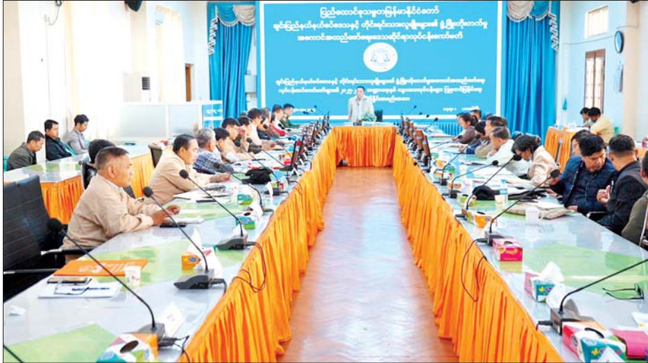
ဘဏ္ဍာနှစ်အတွင်းဆောင်ရွက်ရန်လျာထားရေးလုပ်ငန်း များကို ဆွေးနွေးတင်ပြသည်။ ထို့နောက်လုပ်ငန်းဆင်နက်မတီဥက္ကဋ္ဌ လမ်းပန်း အားအရင်းအမြစ်ဖွံ့ဖြိုးရေးလုပ်ငန်း ဆင်နက်မတီ ပို့ဆောင်ရေး၊ ဆက်သွယ်ရေးနှင့် ခရီးသွားလုပ်ငန်း

ချင်းပြည်နယ် နယ်စပ်ဒေသနှင့် တိုင်းရင်းသား လူမျိုးများ၏ ဖွံ့ဖြိုးတိုးတက်မှု အကောင်အထည် ဖော်ရေး လုပ်ငန်းဆင်နက်မတီများ၏ ၂၀၂၅-၂၀၂၆ ဘဏ္ဍာနှစ် လျာထားလုပ်ငန်းများ ပြုစုတင်ပြနိုင် ရေးလုပ်ငန်းညှိနှိုင်းအစည်းအဝေးကို အောက်တိုဘာ ၃၁ ရက် မွန်းလွဲ ၁ နာရီခွဲက ဟားခါးမြို့၊ ချင်းပြည်နယ် အစိုးရအဖွဲ့ရုံး အစည်းအဝေးခန်းမ၌ ကျင်းပသည်။ ဦးစွာ ချင်းပြည်နယ် နယ်စပ်ဒေသနှင့်တိုင်းရင်း သားလူမျိုးများ၏ ဖွံ့ဖြိုးတိုးတက်မှုအကောင် အထည်ဖော်ရေးဒေသဆိုင်ရာ လုပ်ငန်းဆင်နက်မတီ ဥက္ကဋ္ဌ ချင်းပြည်နယ်ဝန်ကြီးချုပ် ဒေါက်တာ ဝန်ဆန်းထွန်းက အဖွင့်အမှာစကားပြောကြားသည်။ ယင်းနောက် ချင်းပြည်နယ် နယ်စပ်ဒေသနှင့် တိုင်းရင်းသားလူမျိုးများ၏ ဖွံ့ဖြိုးတိုးတက်မှု အကောင် အထည်ဖော်ရေးဒေသဆိုင်ရာ လုပ်ငန်းဆင်နက်မတီ အတွင်းရေးမှူး လုံခြုံရေးနှင့်နယ်စပ်ရေးရာဝန်ကြီး ဗိုလ်မှူးကြီး သိန်းထွန်းအောင်က ၂၀၂၅-၂၀၂၆