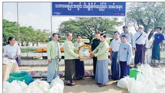
ကောင်ရေ ၅၀၀၀၀၊ ငါးမြစ်ချင်း ကောင်ရေ ၁၂၅၀၀၀ ကို နတ်ကင်းကျေးရွာရှိ သဘာဝရေပြင်အတွင်းသို့ ငါးမျိုးစိုက်ထည့်ခဲ့ကြောင်း သိရသည်။