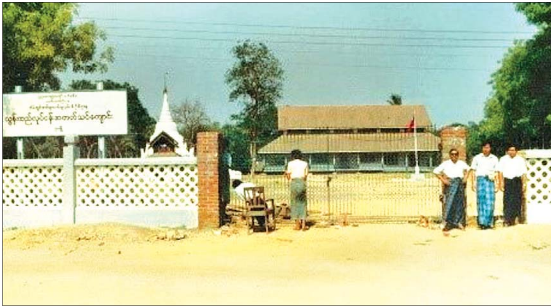
၁၉၂၄ ခုနှစ်တွင် စတင်ဖွင့်လှစ်ခဲ့သည့် ယွန်းထည်လုပ်ငန်းအတတ်သင်ကျောင်း။

အဆိုပါ အခက်အခဲများနှင့် ကန့်သတ်ချက်များ ကျော်လွှားနိုင်စေရန် ယခုအခါ ယွန်းပညာကောလိပ်တွင် မြန်မာ့ယွန်းလုပ်ငန်းရှင်များ အသင်းမှ အသင်းဝင်လုပ်ငန်းရှင်များအား ဖိတ်ခေါ်၍ ယွန်းပစ္စည်းထုပ်ပိုးမှုစနစ်များ ပိုမို ကောင်းမွန်လာစေရေးနည်းလမ်းများကို ဆွေးနွေးချပြခြင်း၊ ယွန်းပစ္စည်းများကို စံကိုင်စနစ်တစ်ခုထားရှိရေး ဆွေးနွေးပြောကြားခြင်းနှင့် ယွန်းအခြောက်ခံကာလ ပိုမိုတိုတောင်းစေရန် ဆောင်ရွက်နိုင်သည့် ခေတ်မီနည်းစနစ်များအား သရုပ်ပြဆွေးနွေးခြင်းများကို စဉ်ဆက်မပြတ် ဆောင်ရွက်ပေးလျက်ရှိပါသည်။