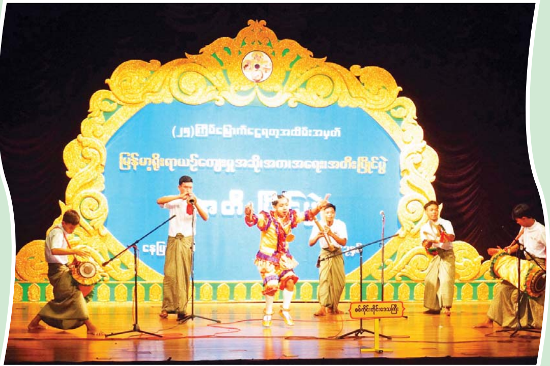
ဒိုးပတ်အတီးပြိုင်ပွဲ အခြေခံပညာအဆင့် (အမျိုးသား အသက် ၁၅ နှစ်မှ ၂၀ နှစ်အတွင်း)၌ ပထမဆုရရှိသည့် စစ်ကိုင်းတိုင်းဒေသကြီးမှ မောင်ဖြိုးသူရနှင့်အဖွဲ့ တီးခတ်ယှဉ်ပြိုင်ဟန်။