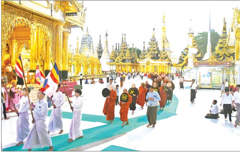
တက်ရောက်ကြည့်ကြည့်ကြသည်။ အခမ်းအနားတွင် ရန်ကုန်တိုင်းဒေသကြီး သံဃာ