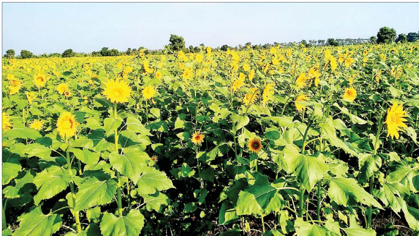
မုံရွာမြို့နယ်၌ နေကြာစိုက်ခင်းများ အောင်မြင်ဖြစ်ထွန်းနေမှုကို တွေ့ရစဉ်။