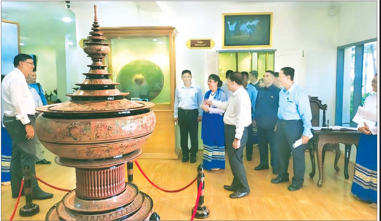
နိုင်ငံတော်စီမံအုပ်ချုပ်ရေးကောင်စီဥက္ကဋ္ဌ နိုင်ငံတော်ဝန်ကြီးချုပ် ဗိုလ်ချုပ်မှူးကြီး မင်းအောင်လှိုင် ယွန်းပြတိုက်တွင် ကြည့်ရှုလေ့လာစဉ်။

မြန်မာ့ယွန်းအတတ်ပညာကို ခေတ်အဆက်ဆက် ဆက်လက် ထိန်းသိမ်းပြီး ပိုမိုတိုးတက်အောင် ကြိုးပမ်း ဆောင်ရွက်ခဲ့ခြင်းကြောင့် ယခုအခါ မြန်မာ့ယွန်းထည်များ နိုင်ငံတကာမှ ပိုမိုနှစ်သက်လက်ခံလာ သည့်အဆင့်အထိ ရောက်ရှိလာခဲ့ပြီ