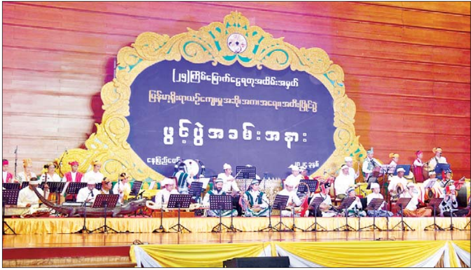
ပြည်ထောင်စုဖွား တိုင်းရင်းသားညီအစ်ကိုမောင်နှမတို့၏ စုစည်းတီးခတ်ပုံဖော်ထားသော တိုင်းရင်း သား တူရိယာသံစုံတီးခိုင်းကြီး၏ တီးခတ်ဖျော်ဖြေတင်ဆက်မှုကို တွေ့ရစဉ်။

ပြည်ထောင်စုတိုင်းရင်းသား သွေးချင်းများသည် မြန်မာနိုင်ငံအတွင်း နှစ်ပေါင်းထောင်ချီ ရှည်လျား သော သမိုင်းစဉ်တစ်လျှောက်တွင် စည်းလုံးညီညွတ် စွာ နေလာခဲ့ကြပြီး ထုထည်ပမာဏ ကြီးမားခိုင်ခံ့ သော မြန်မာ့ယဉ်ကျေးမှုအုတ်မြစ်ကြီးများကို ခိုင်ခိုင် မာမာ စိုက်ထူနိုင်ခဲ့ကြသည်။