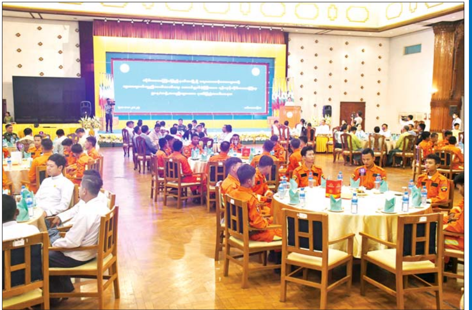
ပဲခူးတိုင်းဒေသကြီးဝန်ကြီးချုပ် ဦးမျိုးဆွေဝင်း ရာဂီမုန်တိုင်းသင့်ဒေသများတွင် ကယ်ဆယ်ရေး လုပ်ငန်းများ ဆောင်ရွက်ခဲ့သည့် တပ်မတော်သားများ၊ မြန်မာနိုင်ငံရဲတပ်ဖွဲ့ဝင်များ၊ ပြည်သူ့စစ်တပ်ဖွဲ့ဝင် များ၊ စီးသတ်တပ်ဖွဲ့ဝင်များ၊ အခြားဌာနနှင့် အဖွဲ့အစည်းများအား ဂုဏ်ပြုပွဲအခမ်းအနားတွင် ဂုဏ်ပြု မှတ်တမ်းလွှာနှင့် ဂုဏ်ပြုချီးမြှင့်ငွေပေးအပ်စဉ်။