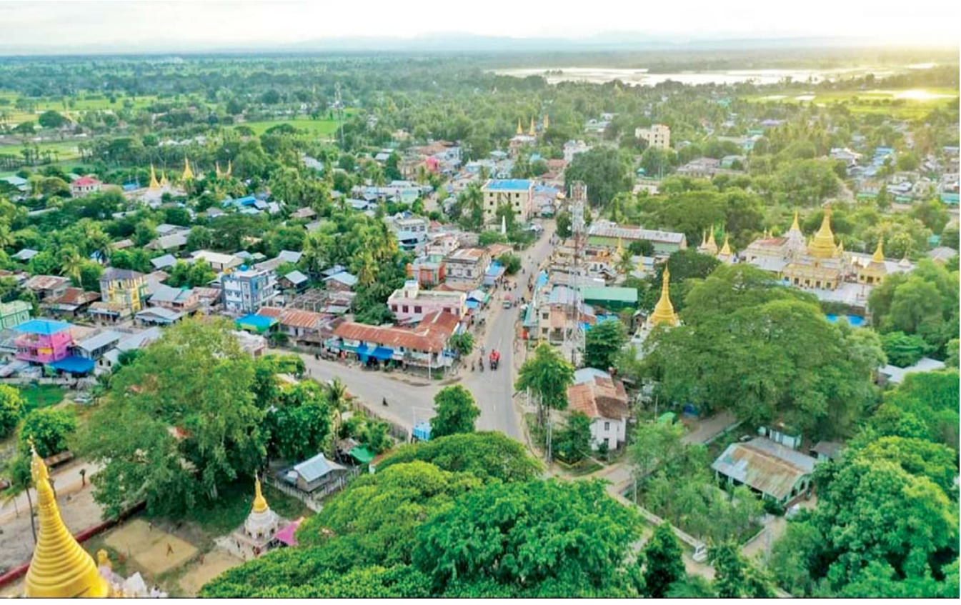
သမိုင်းဝင်ဘုရားစေတီများနှင့် လေ့လာလည်ပတ်စရာ အထင်ကရနေရာများရှိသည့် မင်းဘူးမြို့၏ သဘာဝရှုခင်းအလှကို တွေ့ရစဉ်။