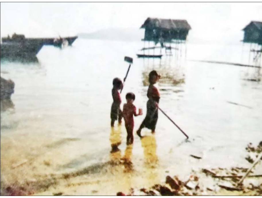
ပင်လယ်ကမ်းစပ်၌ ဆလုံကလေးများဆော့ကစားနေကြစဉ်။

ကလေးဘဝရှင်သန်ဖြတ်သန်းမှု ဆလုံတိုင်းရင်းသားတို့၏ လူမှုဘဝသည် ပင်လယ်ပြင်ကိုအခြေခံလျက်ရှိသည်။ ရှေးယခင် ကာလများတွင် ဆလုံတိုင်းရင်းသားတို့သည် ပင်လယ်ပြင်ကိုအခြေပြု၍ သွားလာနေထိုင်ကြသူ များဖြစ်သည်။ ယခုနောက်ပိုင်းတွင် ကျွန်းများနှင့် ပင်လယ်ကမ်းစပ်တို့တွင် တဲအိမ်များ၊ သွပ်မိုးပျဉ်ကာ အိမ်များအထိ ဆောက်လုပ်နေထိုင်လာကြသည်။ ဆလုံအမျိုးသမီးတို့သည် ယခင်က ကလေး မွေးဖွားပြီး ခုနစ်ရက်အတွင်းမှာပင် ပင်လယ်ထဲဆင်း ကာ အလုပ်လုပ်ကြသည်။ ကလေးကို လှေထဲတွင် ကျန်ရစ်သည့် အဘိုးအဘွားများက ကြည့်ရှု စောင့်ရှောက်ကြရသည်။ ကျွန်းများပေါ်တွင်လည်း အိမ်၌နေစဉ် ကလေးကိုကြည့်ရှုပေးမည့် အဘိုး အဘွားများမရှိပါက အိမ်နီးချင်းများက ကူညီ စောင့်ရှောက်ပေးကြသည်။ မိခင်ဖြစ်သူက ကလေးကိုကျောပိုး၍ ဝမ်းရေး အတွက် အလုပ်လုပ်ကြရသည်မှာလည်း ဆလုံတို့၏ ဓလေ့တစ်ခုပင်ဖြစ်သည်။ ကလေးကိုကျောပိုးကာ လုပ်ငန်းခွင်သို့ခေါ်ဆောင်ရာတွင် ကလေး၏ သုံးလ သား အရွယ်ကတည်းကပင်ဖြစ်သည်။ ကလေးကို ကျောပိုး၍ ခရင်းခွာသည့်နေရာများ၊ ပင်လယ် ပက်ကျိုဖမ်းသည့်နေရာများသို့ ခေါ်ဆောင်သွားလေ့ ရှိကြောင်း ဆလုံတိုင်းရင်းသားလူမှုဘဝ သမိုင်း မှတ်တမ်းများအရ သိရသည်။ ကလေးတို့ကို အလုပ်လုပ်သည့်နေရာတိုင်းသို့ ခေါ်ဆောင်သွားလေ့ ရှိခြင်းကြောင့် ကလေးများသည် ငယ်စဉ်ကတည်းက ပင် ခရင်းခွာခြင်း၊ ကဏန်းဖမ်းခြင်းတို့ကို မျက်မြင် လက်တွေ့မြင်ဖူး သိရှိနေကြပြီဖြစ်ပေသည်။