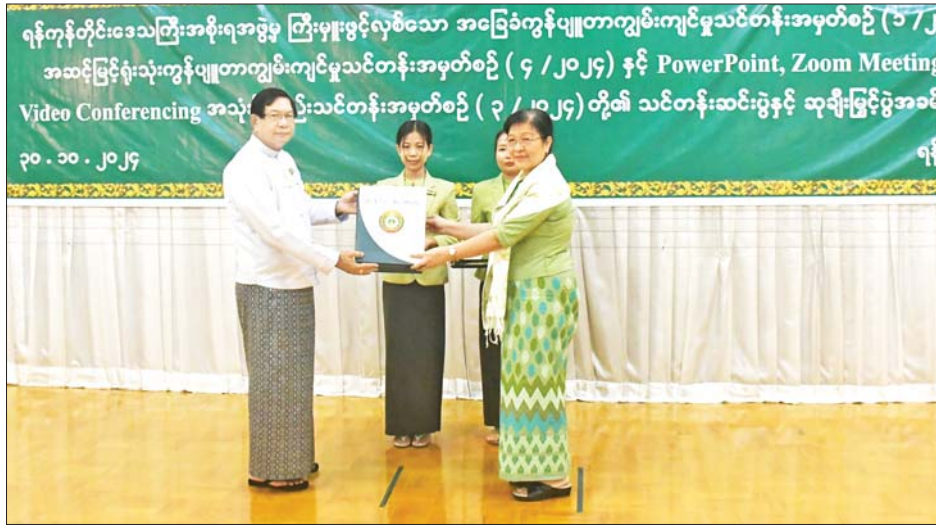
နိုင်ငံတော်၏ e-Government စနစ်မှ Digital Government စနစ်သို့ ဆောင်ရွက်ရာ၌ ကြိုးစား ဆောင်ရွက်ကြရန်နှင့် အဆင့်မြင့်သင်တန်းများကို ဆက်လက်တက်ရောက်ကြရန် ပြောကြားသည်။ ထို့နောက် တိုင်းဒေသကြီးဝန်ကြီးချုပ်က သင်တန်းကြီးကြပ်ဆရာ ဆရာမများအား အမှတ်တရ

ဦးစွာ ရန်ကုန်တိုင်းဒေသကြီး ဝန်ကြီးချုပ် ဦးစိုးသိန်းက ရန်ကုန်တိုင်းဒေသကြီးအစိုးရအဖွဲ့ e-Government Training Center က ၂၀၂၂ ခုနှစ်မှ စတင်ပြီး ကွန်ပျူတာသင်တန်း စုစုပေါင်း ၅၉ ကြိမ် ဌာနဆိုင်ရာသင်တန်းသား ၁၆၀၁ ဦးကို သင်ကြား ပေးနိုင်ခဲ့ကြောင်း၊ သင်တန်းသား သင်တန်းသူများ အနေဖြင့် သင်ယူထားသည့်ပညာရပ်များဖြင့်