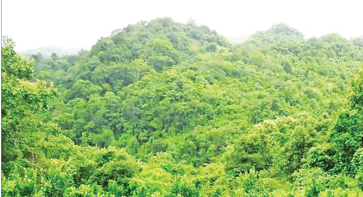
ရေထွက်ကျောက်ခေါင်း(လင်းဝေး)ဘူမိရုပ်သွင်ထူးခြားသည့်နယ်မြေ သဘာဝရှုခင်းကို တွေ့ရစဉ်။