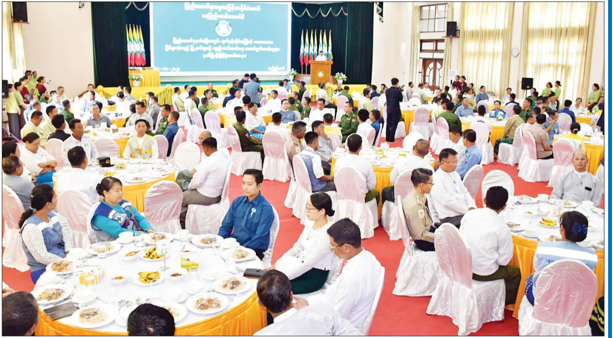
နေပြည်တော်ကောင်စီဥက္ကဋ္ဌ ဦးသန်းထွန်းဦး နေပြည်တော်ကောင်စီရုံး ဧမ္မာသီရိခန်းမ၌ကျင်းပသည့် ပြည်ထောင်စုနယ်မြေ နေပြည်တော်အတွင်း ရာဂီမုန်တိုင်းဒဏ်ကြောင့် သဘာဝဘေးဖြစ်ပွားခဲ့သည့်မြို့နယ်များ၌ ကူညီကယ်ဆယ်ရေးဆောင်ရွက်ပေးခဲ့သူများအား ဂုဏ်ပြုချီးမြှင့်ပွဲတွင် အမှာစကားပြောကြားစဉ်။