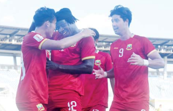
အုပ်စုအဖွင့်ပွဲတွင် နိုင်ပွဲရခဲ့သည့် ရှမ်းယူနိုက်တက်အသင်း ကစားသမားများကို တွေ့ရစဉ်။

ရန်ကုန် အောက်တိုဘာ ၃၁ လက်ရှိကျင်းပလျက်ရှိသည့် ၂၀၂၄-၂၀၂၅ ရာသီ AFC Challenge League ပြိုင်ပွဲအုပ်စုဒုတိယနေ့အပြီးတွင် မြန်မာကလပ် ရှမ်းယူနိုက်တက် အသင်းအပါအဝင် အသင်းလေးသင်း ကွာတားဖိုင်နယ် တက်ရောက်ခွင့် ရရှိထားသည်။ ယင်းပြိုင်ပွဲကို အနောက်အာရှဇုန်တွင် အုပ်စုသုံးခု၊ အရှေ့အာရှဇုန်တွင် အုပ်စုနှစ်ခုခွဲ၍ ကျင်းပလျက်ရှိပြီး အနောက်အာရှဇုန်အုပ်စု(C) တွင် အိုမန်ကလပ် အယ်လ်ဆီဘီအသင်း၊ အရှေ့အာရှဇုန်အုပ်စု(D) တွင် မြန်မာကလပ် ရှမ်းယူနိုက်တက်၊ တရုတ်(တိုင်ပေ)ကလပ် တိုင်နန်စီးတီးအသင်း၊ စာမျက်နှာ ၁၅ ကော်လံ ၅ သို့ ၀