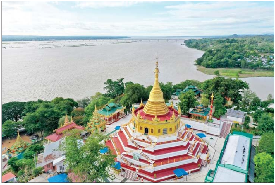
မင်းဘူးမြို့ ရှင်ပင်စက္ကိန်းတဲစေတီတော်မြတ် ကြီးနှင့် ရေဝတီမြစ်ရှမ်းကို တွေ့ရစဉ်။

ဘုရား၊ စက္ကိန်းတဲဘုရား၊ ရှင်မင်းဘူးဘုရား၊ သမုတ္တ ကိရိမြစ်စေတီတော်မြတ်ကြီးနှင့် နဂါးပွက်တောင်၊ မှန်ကင်းရုပ်စုံကျောင်း၊ သုံးထပ်ရုပ်စုံကျောင်း၊ ကန်ဦးဘုန်းတော်ကြီးကျောင်းများ၏ ပုဂံခေတ်နှင့် ကုန်းဘောင်ခေတ် ပန်းပုလက်ရာများကိုလည်း လေ့လာကြည့်ရှုနိုင်သည်။ ထိုကဲ့သို့ သမိုင်းဝင်ဘုရားစေတီများ၊ လေ့လာ လည်ပတ်စရာ အထင်ကရနေရာများရှိသည့်အပြင် အေးချမ်းလှပြီး သာယာကြည်နူးဖွယ်၊ ချမ်းမြေ့ဖွယ်ရာ ကောင်းလှသည့် အထက်အညာဒေသရှိ ရေဝတီ မြစ်ကမ်းဘေးမှ အေးချမ်းလှသော မင်းဘူးမြို့လေး သို့ ပွင့်လင်းရာသီတွင် သွားရောက်လေ့လာလည်ပတ် နိုင်ကြောင်း ရေးသားလိုက်ရပါသည်။ ဇေယျာထက်(မင်းဘူး)