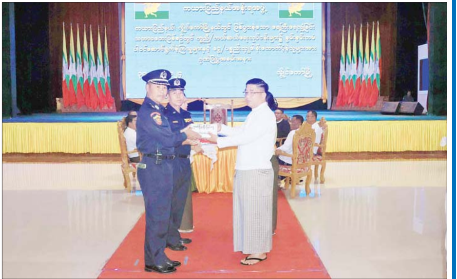
ကယားပြည်နယ်ဝန်ကြီးချုပ် ဦးဇော်မျိုးတင် ကယားပြည်နယ် လျှင်ကော်မြို့ ရေကြီးရေလျှံမှု သဘာဝဘေးဖြစ်စဉ်တွင် ကူညီကယ်ဆယ်ရေးလုပ်ငန်းများ၌ စွမ်းစွမ်းတမ်း ဆောင်ရွက်ခဲ့သူများနှင့် ငွေ / ပစ္စည်းလှူဒါန်းထောက်ပံ့ခဲ့သူများအား ဂုဏ်ပြုပွဲအခမ်းအနားတွင် ဂုဏ်ပြုချီးမြှင့်ငွေ ပေးအပ်စဉ်။