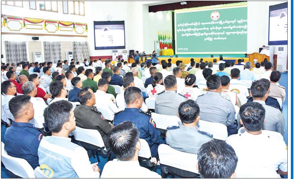
မန္တလေးတိုင်းဒေသကြီးဝန်ကြီးချုပ် ဦးမျိုးအောင် ရာဂီမုန်တိုင်းဒဏ်သင့်ခဲ့သော မြို့နယ်များတွင် ကယ်ဆယ်ရေးလုပ်ငန်းများနှင့် ပြန်လည်ထူထောင်ရေးလုပ်ငန်းများ ဆောင်ရွက်ပေးခဲ့သည့် တပ်မတော်၊ မြန်မာနိုင်ငံရဲတပ်ဖွဲ့၊ မီးသတ်တပ်ဖွဲ့၊ ကြက်ခြေနီတပ်ဖွဲ့၊ ပြည်သူ့စစ်၊ ဌာနဆိုင်ရာများနှင့် လူမှုရေးအဖွဲ့အစည်းများအား ဂုဏ်ပြုပွဲအခမ်းအနားတွင် အမှာစကားပြောကြားစဉ်။