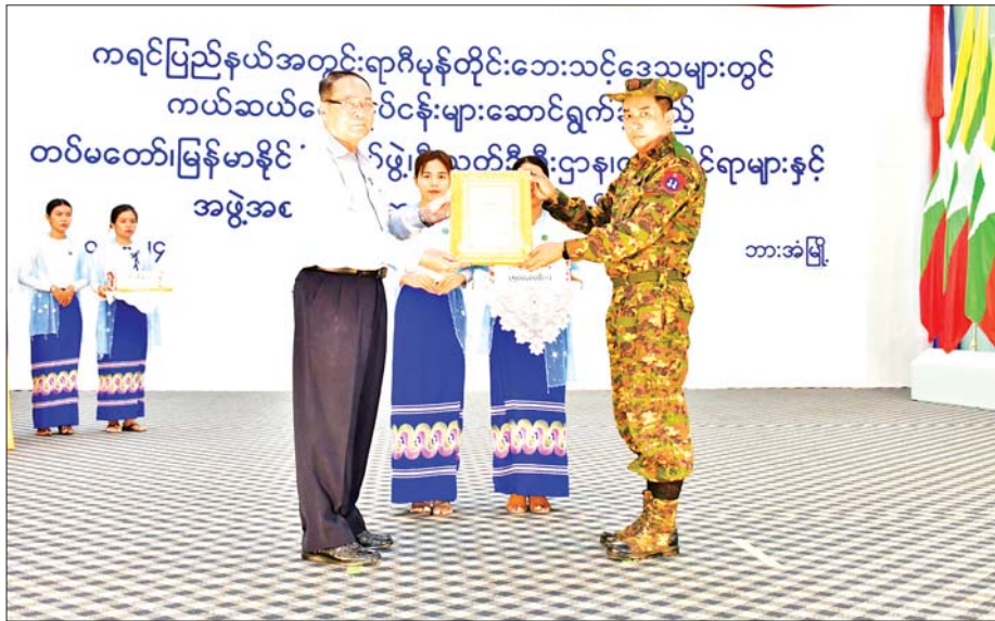
ကရင်ပြည်နယ်အတွင်းရာဂီမုန်တိုင်းဘေးသင့်ဒေသများတွင် ကယ်ဆယ်ရေးလုပ်ငန်းများဆောင်ရွက်ခဲ့သည့် တပ်မတော်၊ မြန်မာနိုင်ငံရဲတပ်ဖွဲ့၊ မီးသတ်တပ်ဖွဲ့၊ ဌာနဆိုင်ရာများနှင့် လူမှုရေးအသင်းအဖွဲ့အစည်းများအား ဂုဏ်ပြုသည့် အခမ်းအနားတွင် ဂုဏ်ပြုမှတ်တမ်းလွှာနှင့် ဂုဏ်ပြုချီးမြှင့်ငွေ ပေးအပ်စဉ်။