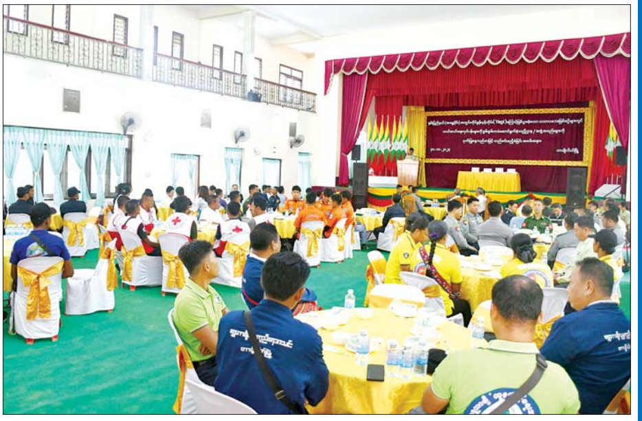
ဧရာဝတီတိုင်းဒေသကြီးဝန်ကြီးချုပ် ဦးတင်မောင်ဝင်း ရာဂီမုန်တိုင်းနှင့် စစ်လျဉ်း၍ ဖြစ်ပွားခဲ့သော ရေဘေးကြောင့် ထိခိုက်ပျက်စီးမှုများအပေါ် ကယ်ဆယ်ရေးလုပ်ငန်း ဆောင်ရွက်ခဲ့ကြသူများအား ဂုဏ်ပြုပွဲအခမ်းအနားတွင် ဂုဏ်ပြုမှတ်တမ်းလွှာနှင့် ဂုဏ်ပြုချီးမြှင့်ငွေ ပေးအပ်စဉ်။