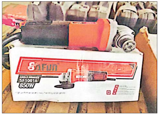
ရှမ်းပြည်နယ်၌ သိမ်းဆည်းရမိမှု။