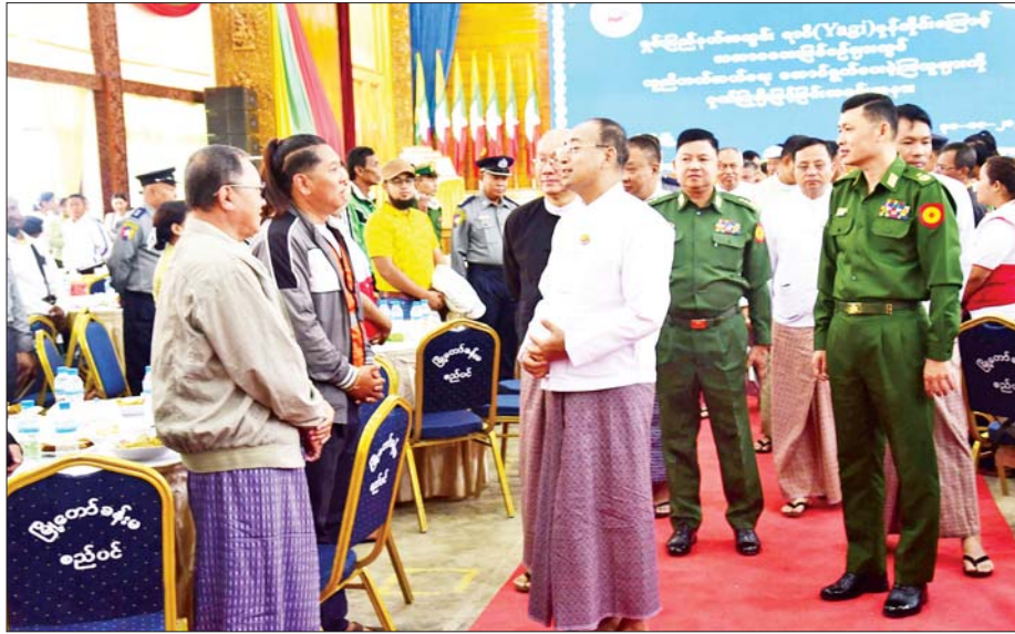
ရှမ်းပြည်နယ်ဝန်ကြီးချုပ် ဦးအောင်အောင် ရှမ်းပြည်နယ်အတွင်း တိုင်ဖွန်းမုန်တိုင်းရာဂီအရှိန်ကြောင့် ဖြစ်ပွားခဲ့သော သဘာဝဘေးဖြစ်ပွားမှုများတွင် ကယ်ဆယ်ရေးလုပ်ငန်းများကို စွမ်းစွမ်းတမ်း ဆောင်ရွက်ခဲ့သည့် ဌာန / အဖွဲ့အစည်းများအား ဂုဏ်ပြုချီးမြှင့်ပွဲအခမ်းအနားသို့ တက်ရောက်လာကြသူများအား ရင်းရင်းနှီးနှီး လိုက်လံနှုတ်ဆက်စဉ်။