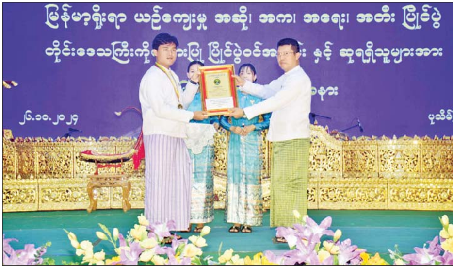
အောင်မြင်မှုများရရှိအောင် ကြိုးပမ်းဆောင်ရွက်ကြ ဆက်လက်၍ (၂၅) ကြိမ်မြောက် ငွေရတုအထိမ်းအမှတ် မြန်မာ့ရိုးရာယဉ်ကျေးမှု အဆို၊ အက၊ အရေး၊ အတီး ပြိုင်ပွဲဝင်များနှင့် ဆုရရှိသူများအား ဂုဏ်ပြုဆုချီးမြှင့်ပေးအပ်ကြသည်။

ဦးစွာ ဧရာဝတီတိုင်းဒေသကြီး ဝန်ကြီးချုပ် ဦးတင်မောင်ဝင်းက မိမိတို့တိုင်းဒေသကြီးအနေဖြင့် ပြိုင်ပွဲဝင် ၂၆၄ ဦး ပါဝင်ယှဉ်ပြိုင်ခဲ့ရာ ရွှေတံဆိပ်ကိုးခု၊ ငွေတံဆိပ် ၁၉ ခု၊ ကြေးတံဆိပ် ၁၈ ခု၊ နှစ်သိမ့်ဆု နှစ်ခု စုစုပေါင်း ဆုတံဆိပ် ၄၈ ခု ဆွတ်ခူးရရှိခဲ့ပြီး တိုင်းဒေသကြီး/ပြည်နယ်များအလိုက် ဆုရရှိမှုစာရင်းတွင် ဆဋ္ဌမနေရာရရှိခဲ့ကြောင်း၊ ယခုနှစ်ရရှိခဲ့သည့် အတွေ့အကြုံများအပေါ် အခြေခံပြီး နောင်လာမည့် ပြိုင်ပွဲများတွင်လည်း ယခုထက်ပို၍ တိုးတက်