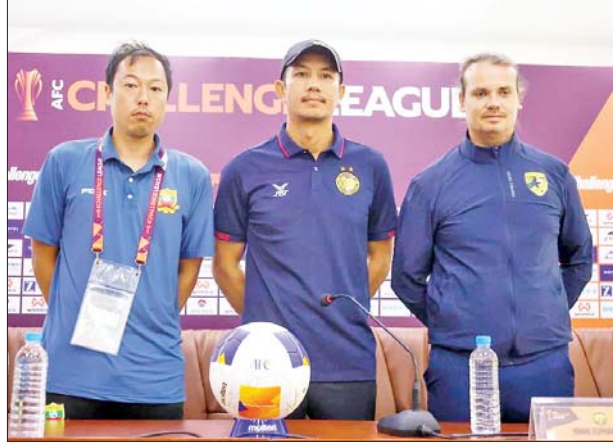
အုပ်စု (D) တွင် ပါဝင်သည့် ရှမ်းယူနိုက်တက်၊ Young Elephant နှင့် တိုင်နန်စီးတီးအသင်းနည်းပြချုပ်များကို တွေ့ရစဉ်။

ရန်ကုန် အောက်တိုဘာ ၂၆ မြန်မာနိုင်ငံက အိမ်ရှင်အဖြစ်လက်ခံကျင်းပမည့် ၂၀၂၄-၂၀၂၅ ရာသီ AFC Challenge League ပြိုင်ပွဲ အုပ်စု(D)တွင် ပါဝင်သည့် အသင်းများအား ပွဲကြိုသတင်းစာရှင်းလင်းပွဲကို အောက်တိုဘာ ၂၆ ရက်