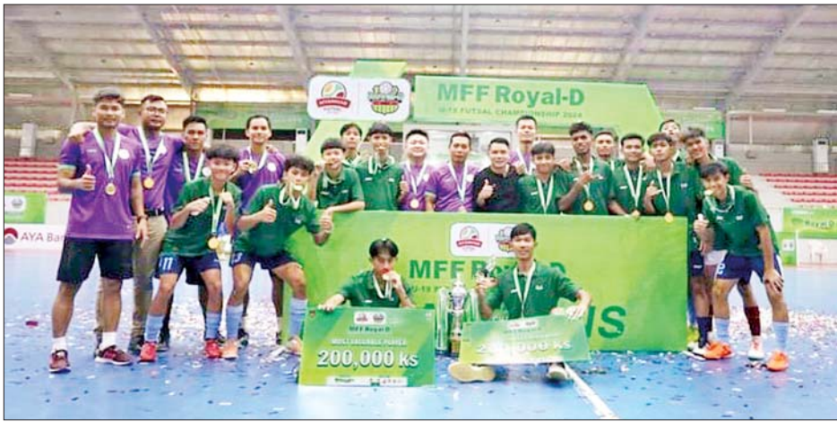
ချန်ပီယံဆုရရှိခဲ့သည့် ဟင်္သာအသင်းကစားသမားများကို တွေ့ရစဉ်။

ရန်ကုန် အောက်တိုဘာ ၂၆ MFF ယူ-၁၉ ဖူဆယ်ချန်ပီယံရှစ် ပြိုင်ပွဲ တတိယနေရာလုပွဲနှင့် ဗိုလ်လုပွဲကို အောက်တိုဘာ ၂၆ ရက်က ကျင်းပရာ ဟင်္သာအသင်း ဗိုလ်စွဲခဲ့သည်။