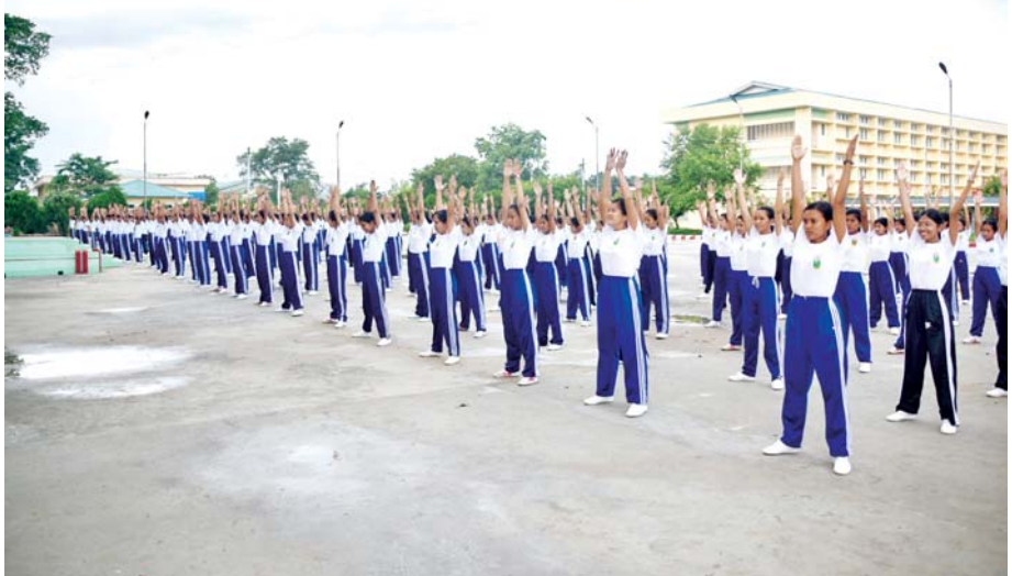
ပြည်ထောင်စုတိုင်းရင်းသားလူမျိုးများဖွံ့ဖြိုးရေးတက္ကသိုလ် ကျောင်းသား ကျောင်းသူများ ကိုယ်ကာယကြံ့ခိုင်ရေး လေ့ကျင့်နေမှုကို တွေ့ရစဉ်။