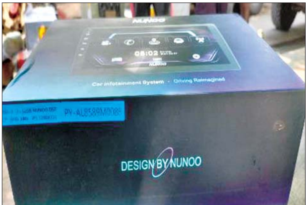
မန္တလေးတိုင်းဒေသကြီး၌ သိမ်းဆည်းရမိမှု။

ထို့အတူ မွန်ပြည်နယ် တရားမဝင်ကုန်သွယ်မှုတိုက်ဖျက်ရေးအထူးအဖွဲ့၏စီမံခန့်ခွဲမှုဖြင့် တာဝန်ကျပူးပေါင်းအဖွဲ့က စစ်ဆေးမှုများဆောင်ရွက်ခဲ့ရာ မော်လမြိုင်-ကျိုက်မရောလမ်း ကျွဲခြံကုန်းရပ်ကွက်လမ်းဘေးတစ်နေရာ၌ စုပုံထားသော အကောက်ခွန်မဲ့စားသောက်ကုန်ပစ္စည်း နှစ်မျိုး (စုစုပေါင်း ခန့်မှန်းတန်ဖိုးငွေကျပ် ၁၅၀၀၀၀၀၀) ကို သိမ်းဆည်းရမိခဲ့ပြီး အကောက်ခွန်လုပ်ထုံးလုပ်နည်းများနှင့်အညီ