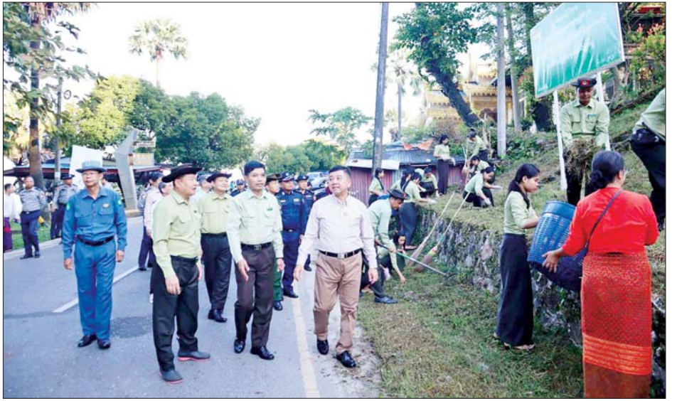
နိုင်ရေး၊ ကျန်းမာရေးအတွက် ကိုယ်လက်လှုပ်ရှား လမ်းတစ်လျှောက် သန့်ရှင်းသာယာလှပရေး လမ်းညွှန်အားကစားများ ဆောင်ရွက်နိုင်ရေးနှင့် တောင်ရိုးတန်း မှာကြားခဲ့ကြောင်း သိရသည်။ သက်နိုင်(မော်လမြိုင်)

ကြည့်ရှုအားပေးခဲ့သည်။ ကြည့်ရှုအားပေးဆက်လက်၍ ပြည်နယ်ဝန်ကြီးချုပ်နှင့် တာဝန်ရှိသူများသည် မော်လမြိုင်မြို့ တောင်ရိုးတန်းလမ်း ဦးခန္တီမဟာမြတ်မုနိ ဆုတောင်းပြည့်ဘုရားနှင့် View Point အနီးပတ်ဝန်းကျင်တွင် ဌာနဆိုင်ရာများ၊ မြန်မာနိုင်ငံရဲတပ်ဖွဲ့နှင့် ရပ်ကွက်နေပြည်သူများ စုပေါင်းသန့်ရှင်းရေးဆောင်ရွက်နေမှုကို ကြည့်ရှုအားပေးသည်။ ထို့နောက် ပြည်နယ်ဝန်ကြီးချုပ်နှင့် တာဝန်ရှိသူများသည် တောင်ရိုးတန်း လမ်းတစ်လျှောက် လှည့်လည်ကြည့်ရှုစစ်ဆေးပြီး တာဝန်ရှိသူများနှင့် တွေ့ဆုံကာ အများပြည်သူလာရောက်စိတ်အပန်းဖြေ