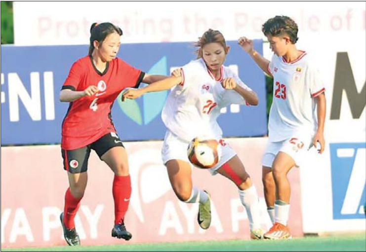
မြန်မာ့လက်ရွေးစင်အသင်းနှင့် ဟောင်ကောင်လက်ရွေးစင်အသင်းတို့ ခြေစမ်းကစားစဉ်။

မြန်မာ့လက်ရွေးစင် အမျိုးသမီးအသင်းသည် ဟောင်ကောင်အသင်းကို ခြေစမ်းပွဲ နှစ်ပွဲစလုံး လေးဂိုး-တစ်ဂိုးရလဒ်ဖြင့် အနိုင်ယူခဲ့ခြင်းဖြစ်သည်။ မြန်မာ့လက်ရွေးစင် အမျိုးသမီးအသင်းသည် စာမျက်နှာ ၂၅ ကော်လံ ၁ သို့ ❁