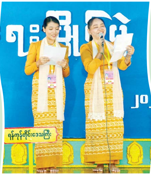
ရန်ကုန်တိုင်းဒေသကြီး

အရေးပြိုင်ပွဲ အခြေခံပညာအဆင့်(အသက် ၁၅ နှစ်မှ ၂၀ နှစ် အတွင်း)၌ ပထမဆုရရှိသည့် ရန်ကုန်တိုင်းဒေသကြီးမှ အိန္ဒြေမြင့်မိုရ် “လူငယ်အားမာန် အမြရှင်သန် နိုင်ငံပြည်ကျိုးဆောင်သယ်ပိုး” ခေါင်းစဉ်ဖြင့် ယှဉ်ပြိုင်မှုကို တွေ့ရစဉ်။