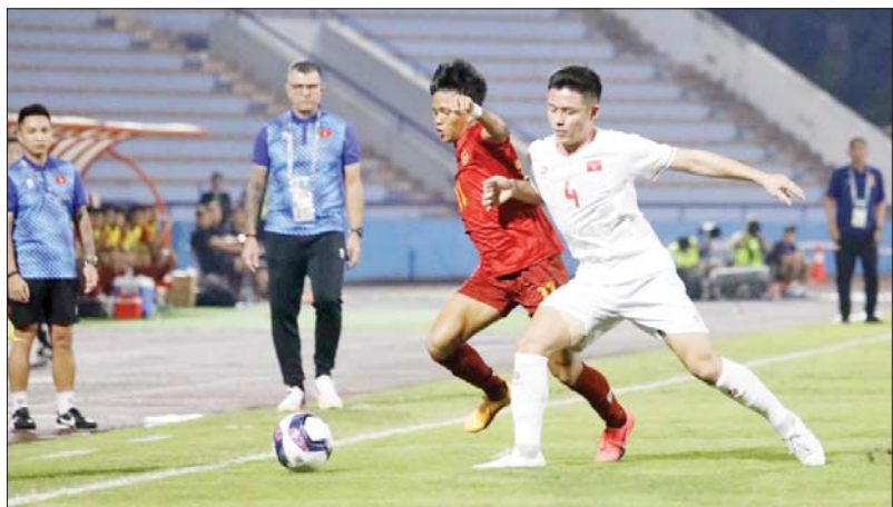
မြန်မာအသင်းနှင့် ဗီယက်နမ်အသင်းတို့ ယှဉ်ပြိုင်ကစားကြစဉ်။