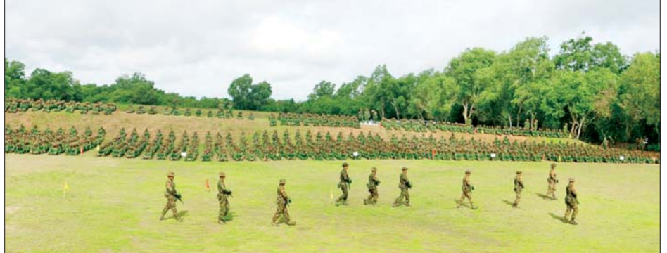
ပြည်သူ့စစ်မှုထမ်းသင်တန်းသားများ လေ့ကျင့်ရေးဆောင်ရွက်နေမှုကို တွေ့ရစဉ်။

ပြည်သူ့စစ်မှုထမ်းသင်တန်း အမှတ်စဉ်(၄)တွင် တက်ရောက်ခဲ့ရသည့် အတွေ့အကြုံများ၊ သင်တန်းမှ ရရှိခဲ့သည့် အလေ့အကျင့်ကောင်းများ၊ ယုံကြည်ချက်၊ ခံယူချက်များနှင့် သင်တန်းဆင်းပြီးနောက် မိမိတို့ တာဝန်ကျရာတပ်ရင်း၊ တပ်ဖွဲ့များ၌ ဆက်လက်တာဝန် ထမ်းဆောင်သွားမည့်အခြေအနေများနှင့်ပတ်သက်၍ သင်တန်းဆင်း နိုင်ငံ့သားကောင်းစစ်သည်များ၏ စကားသံများကိုလည်း ယခုလို ကြားသိရပါသည်။ ဒီသင်တန်းတက်ရောက်ရတဲ့ အဓိက ရည်ရွယ်ချက်ကတော့ နိုင်ငံတော်ကိုကာကွယ်ဖို့နဲ့ နိုင်ငံကလိုအပ်လာတဲ့အခါ ကျွန်တော့်ဘက်က အသင့်ဖြစ်အောင်လို့ ဒီသင်တန်းကိုလာရောက် တက်တာပါ။ ကျွန်တော်က တစ်ကျောင်းလုံးရဲ့ ကိုယ်စားအနေနဲ့ စံပြဆုကိုရရှိခဲ့တာပါ။ ဒီဆုကိုရရှိဖို့ အတော်ကို ကြိုးစားခဲ့ရပါတယ်။ သင်ခန်းစာ တွေအားလုံးကို စိတ်ပါဝင်စားစွာနဲ့ လုပ်ဆောင်ခဲ့ပါ တယ်။ အကျင့်စာရိတ္တကောင်းမွန်အောင် စည်းကမ်းက အစအကုန်လုံးကို တလေးတစားနဲ့လိုက်နာလုပ်ဆောင် ခဲ့ရပါတယ်။ အဓိကကတော့ ကိုယ့်ကိုယ်ကိုယ် ကာကွယ်နိုင်မယ်။ နောက်ပြီး နိုင်ငံတော်ကိုလည်း ကာကွယ်လို့ရတယ်။ ကျွန်တော်တို့သင်တန်းကာလ တွေပြီးသွားတဲ့အခါ ကိုယ့်တာဝန်ကိုယ်ပြီးဆုံးတဲ့အခါ ကျွန်တော်တို့ရပ်ရွာမှ မိသားစုတွေကိုလည်း ကာကွယ် လို့ရတယ်လို့ ကျွန်တော့်အနေနဲ့ယုံကြည်ပါတယ်။