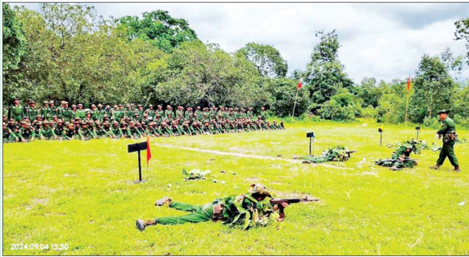
ပြည်သူ့စစ်မှုထမ်းသင်တန်းသားများ လေ့ကျင့်ရေးဆောင်ရွက်နေမှုကို တွေ့ရစဉ်။