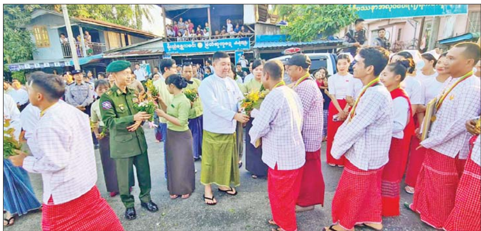
မြောက်ငွေရတုအထိမ်းအမှတ် မြန်မာ့ရိုးရာယဉ်ကျေးမှု အဆို၊ အက၊ အရေး၊ အတီး ဗဟိုအဆင့်ပြိုင်ပွဲတွင် ဝင်ရောက်ယှဉ်ပြိုင်ခဲ့ကြသည့် ပြိုင်ပွဲဝင်များအား ရင်းရင်းနှီးနှီး ဂုဏ်ပြုအားပေး နှုတ်ဆက်ခဲ့ကြောင်း သိရသည်။ ခင်စန်းမြင့်(ပြန်/ဆက်)

ပြိုင်ပွဲများနှင့် မဟာဇနကဇာတ်တော်ကြီး ပြိုင်ပွဲတွင် ပထမဆုံး(ရွှေတံဆိပ်ဆု)များ ရရှိသည့်အတွက် အထူးဝမ်းမြောက်ဂုဏ်ယူပါကြောင်း၊ အနုပညာအရည်အချင်းများဖြင့် ကြိုးစားအားထုတ်ယှဉ်ပြိုင်ခဲ့ကြ၍ ရွှေတံဆိပ်ဆု ၁၈ ခု၊ ငွေတံဆိပ်ဆု ခြောက်ခု၊ ကြေးတံဆိပ်ဆု ၁၁ ခုနှင့် အထူးဆု နှစ်ဆု ရရှိခဲ့ကာ တိုင်းဒေသကြီး၊ ပြည်နယ်အဆင့်တွင် အဆင့်(၄) ရရှိခဲ့သည့်အတွက် ပြည်နယ်အတွက် ဂုဏ်ဆောင်ရွာထိုက်ထိုက်တန်တန် ရရှိခဲ့ခြင်းဖြစ်ကြောင်း၊ ပြိုင်ပွဲဝင်များအနေဖြင့် နောင်နှစ်ပြိုင်ပွဲများတွင်လည်း မိမိတို့၏ အနုပညာပညာရပ်များကို အစွမ်းကုန်ထုတ်ဖော်ပြသ ဝင်ရောက်ယှဉ်ပြိုင်ခြင်းဖြင့် ပြည်နယ်၏ဂုဏ်ကို ဆက်လက်မြှင့်တင် စွမ်းဆောင်ပေးကြရန် တိုက်တွန်းလိုကြောင်း ဂုဏ်ပြုအမှာစကား ပြောကြားသည်။ ထို့နောက် ပြည်နယ်ဝန်ကြီးချုပ်က (၂၅)ကြိမ်