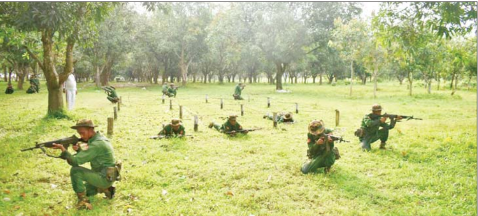
ပြည်သူ့စစ်မှုထမ်းသင်တန်းသားများ လေ့ကျင့်ရေးဆောင်ရွက်နေမှုကို တွေ့ရစဉ်။

အဆိုပါ ပြည်သူ့စစ်မှုထမ်းသင်တန်းအမှတ်စဉ် (၄)ကို ၂၀၂၄ ခုနှစ် ဩဂုတ် ၅ ရက်တွင် စတင်ဖွင့်လှစ်ခဲ့ ခြင်းဖြစ်ပြီး သင်တန်းကာလအတွင်း ကြံ့ခိုင်ရေး ဘာသာရပ်၊ စစ်ရေးပြဘာသာရပ်၊ ခြေလျင်လက်နက် ငယ်ဘာသာရပ်များကိုလည်းကောင်း၊ စစ်နည်းဗျူဟာ ဘာသာရပ်ကို လည်းကောင်း စာတွေ့၊ လက်တွေ့ စနစ်တကျသင်ကြား လေ့ကျင့်ခဲ့ကြပြီး စစ်မြေပြင် အင်ဂျင်နီယာဘာသာရပ်၊ စစ်မြေပြင်အုပ်ချုပ်ရေး ဘာသာရပ်နှင့် အထွေထွေဘာသာရပ်များကိုလည်း ရက်သတ္တပတ်အလိုက် အဆင့်ဆင့်လေ့ကျင့်သင်ကြား ခဲ့ကြကြောင်း သိရသည်။