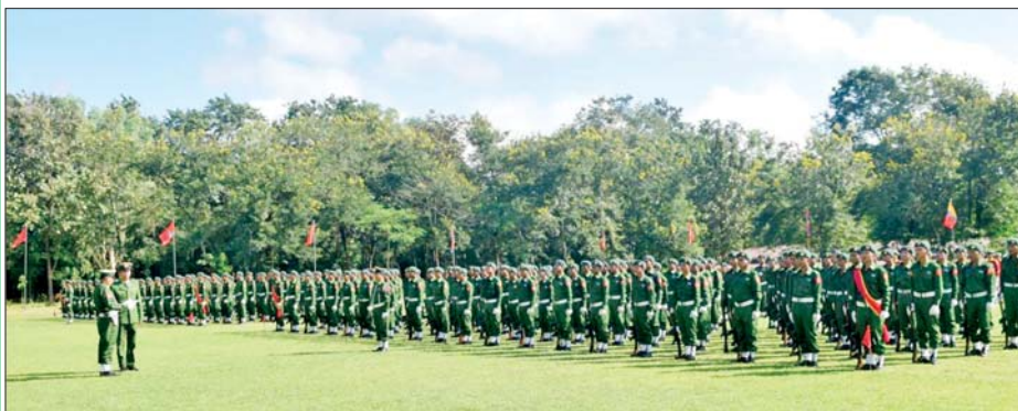
ပဲခူးတိုင်းဒေသကြီး ပြည်သူ့စစ်မှုထမ်းသင်တန်းဆင်းပွဲ ကျင်းပစဉ်။