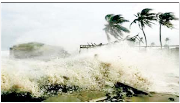
ဘင်ဂေါပြည်နယ်တို့တွင် လေပြင်းများတိုက်ခတ်မှုကြောင့် သစ်ပင်များ ကျိုးကျကာ ဓာတ်တိုင်များ ပြိုလဲပျက်စီးပြီး သီးနှံများထိခိုက်ပျက်စီးခဲ့ကြောင်း သိရသည်။ ပြည်နယ်နှစ်ခုစလုံး၌ စာသင်ကျောင်းများပိတ်ထားကာ ရထားခရီးစဉ် ၄၀၀ ကျော်ကို ဖျက်သိမ်းခဲ့

နယူးဒေလီ အောက်တိုဘာ ၂၅ အိန္ဒိယနိုင်ငံ သြရိသပြည်နယ်နှင့် အနောက်ဘင်ဂေါပြည်နယ်တို့ရှိ ကမ်းရိုးတန်းဒေသများတွင် အောက်တိုဘာ ၂၅ ရက်က ဆိုင်ကလုန်းမုန်တိုင်း ဒါနာ ဝင်ရောက် တိုက်ခတ်ခဲ့ကြောင်း တာဝန်ရှိသူများက ပြောကြားသည်။ ယင်းဆိုင်ကလုန်း မုန်တိုင်းကြောင့် သြရိသပြည်နယ် ကန်ဒရာ ပါယာခရိုင်နှင့် ဗာဒတ်ခရိုင်တို့တွင် မြေပြိုမှုများ ဖြစ်ပွားပြီး သြရိသပြည်နယ်နှင့်အနောက်