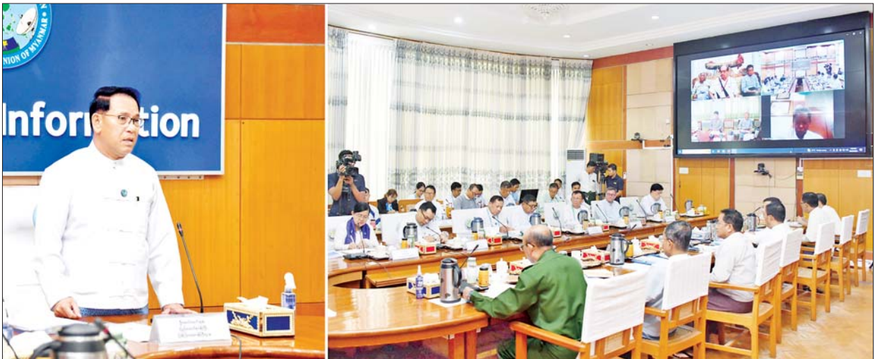
ပြည်ထောင်စုဝန်ကြီး ဦးမောင်မောင်အုန်း၊ ပဉ္စမအကြိမ် အမျိုးသားအားကစားပွဲတော် ဖွင့်ပွဲ၊ ပိတ်ပွဲ အခမ်းအနားကျင်းပရေးလုပ်ငန်း ကော်မတီ စတုတ္ထအကြိမ် ညှိနှိုင်းအစည်းအဝေးတွင် အမှာစကားပြောကြားစဉ်။

နေပြည်တော် အောက်တိုဘာ ၂၅ ပဉ္စမအကြိမ် အမျိုးသား အားကစားပွဲတော် ဖွင့်ပွဲ၊ ပိတ်ပွဲ အခမ်းအနား ကျင်းပရေးလုပ်ငန်း ကော်မတီ စတုတ္ထအကြိမ် ညှိနှိုင်း အစည်းအဝေးကို ယနေ့မွန်းလွဲ ပိုင်းတွင် နေပြည်တော်ရှိ ပြန်ကြားရေးဝန်ကြီးဌာန အစည်း အဝေးခန်းမ၌ ကျင်းပသည်။