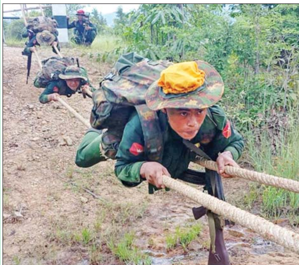
ပြည်သူ့စစ်မှုထမ်းသင်တန်းသားများ လေ့ကျင့်ရေးဆောင်ရွက်နေမှုကို တွေ့ရစဉ်။