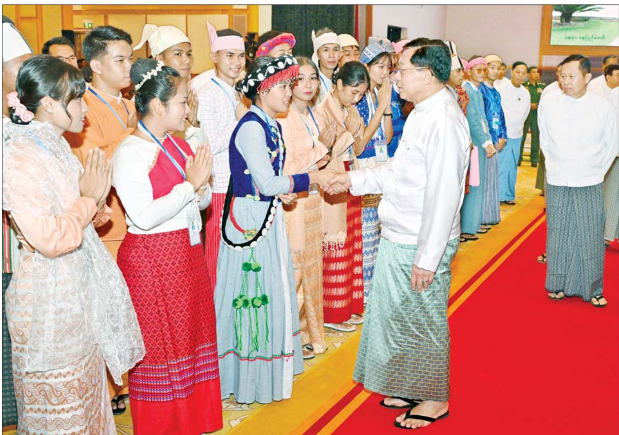
နိုင်ငံတော်စီမံအုပ်ချုပ်ရေးကောင်စီဥက္ကဋ္ဌ နိုင်ငံတော်ဝန်ကြီးချုပ် ဗိုလ်ချုပ်မှူးကြီးမင်းအောင်လှိုင် ကျောင်းသား ကျောင်းသူများကို တစ်ဦးချင်း ရင်းရင်းနှီးနှီး မေးမြန်းနှုတ်ဆက်အားပေးစဉ်။

မျက်မှောက်ကာလ မြန်မာ့အခြေအနေ၊ ကမ္ဘာ့အခြေအနေတို့အရ မြန်မာနိုင်ငံသားတိုင်းကိုယ့်မြေ၊ ကိုယ့်ရေ၊ ကိုယ့်လူမျိုး၊ ကိုယ့်အချုပ်အခြာ အာဏာကို ကာကွယ်ရန် အချိန်ကျရောက်လာပြီဖြစ်ကြောင်း၊ ပြည်သူတစ်ယောက်အနေဖြင့် နိုင်ငံတော်ကာကွယ်ရေးတာဝန်ကို ထမ်းဆောင်ခြင်းသည် နိုင်ငံတော်ကြီးတစ်ခုလုံးနှင့် နိုင်ငံ