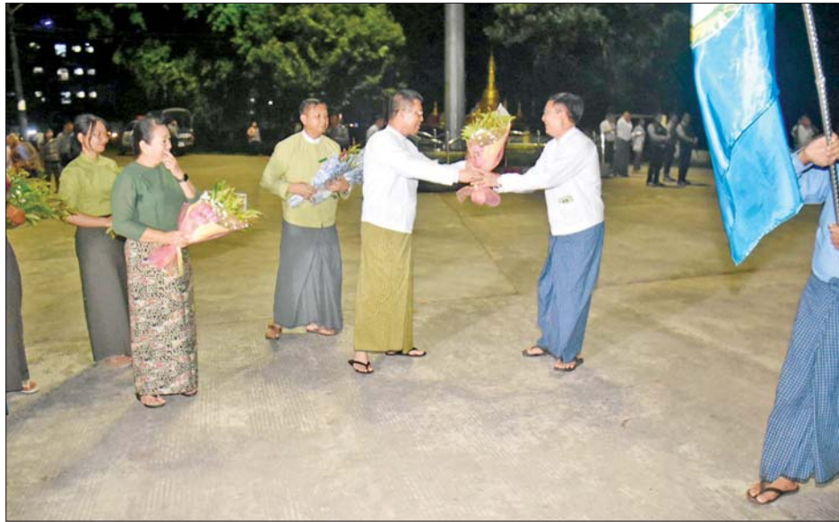
ယင်းနောက် အဆိုပါအဖွဲ့များသည် Sea & Lake Garden ဒီရေတောတံတား၊ ကျောက်စိမ်းပြတိုက်၊ သစ်သားများဖြင့် ထွင်းထုထားသည့် ပန်းပုရုပ်တု ပြတိုက်နှင့် အသံတစ်ရာဥယျာဉ်တို့တွင် လေ့လာလည်ပတ်ကြည့်ရှုခြင်းများအပြင် အခြားလည်ပတ်စရာ နေရာများသို့လည်း လွတ်လပ်ပျော်ရွှင်စွာ လည်ပတ်ခဲ့ကြကြောင်း သိရသည်။ တိုင်းဒေသကြီး(ပြန်/ဆက်)

ပုသိမ် အောက်တိုဘာ ၂၅ (၂၅)ကြိမ်မြောက် ငွေရတုအထိမ်းအမှတ် မြန်မာ့ရိုးရာယဉ်ကျေးမှု အဆို၊ အက၊ အရေး၊ အတီး(ဗဟိုအဆင့်) ပြိုင်ပွဲတွင် ပါဝင်ယှဉ်ပြိုင်ခဲ့သည့် ရောဝတီတိုင်းဒေသကြီးကိုယ်စားပြုအသင်းအား ကြိုဆိုဂုဏ်ပြုပွဲကို ယမန်နေ့ညပိုင်းက ပုသိမ်တက္ကသိုလ် ရှေ့၌ ပြုလုပ်ခဲ့ရာ တိုင်းဒေသကြီးဝန်ကြီးချုပ် ဦးတင်မောင်ဝင်းနှင့် ဇနီး၊ တိုင်းဒေသကြီးဝန်ကြီးများနှင့် ဇနီးများ၊ ဌာနဆိုင်ရာများက ကြိုဆိုဂုဏ်ပြုခဲ့ကြသည်။