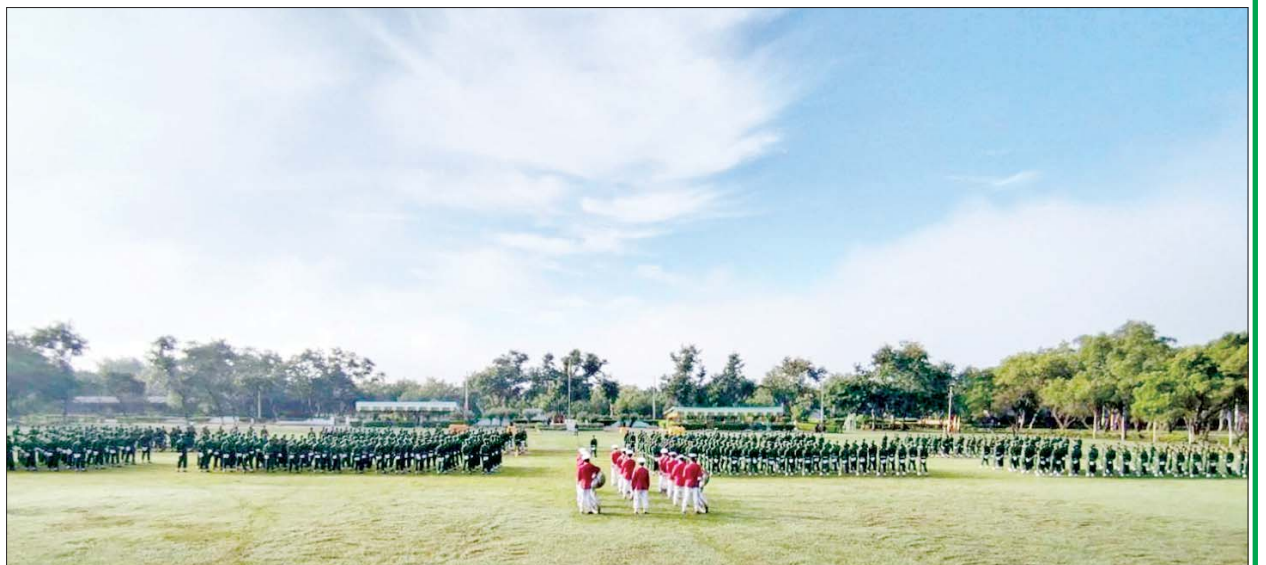
ရန်ကုန်တိုင်းဒေသကြီး ပြည်သူ့စစ်မှုထမ်းသင်တန်းဆင်းပွဲ ကျင်းပစဉ်။