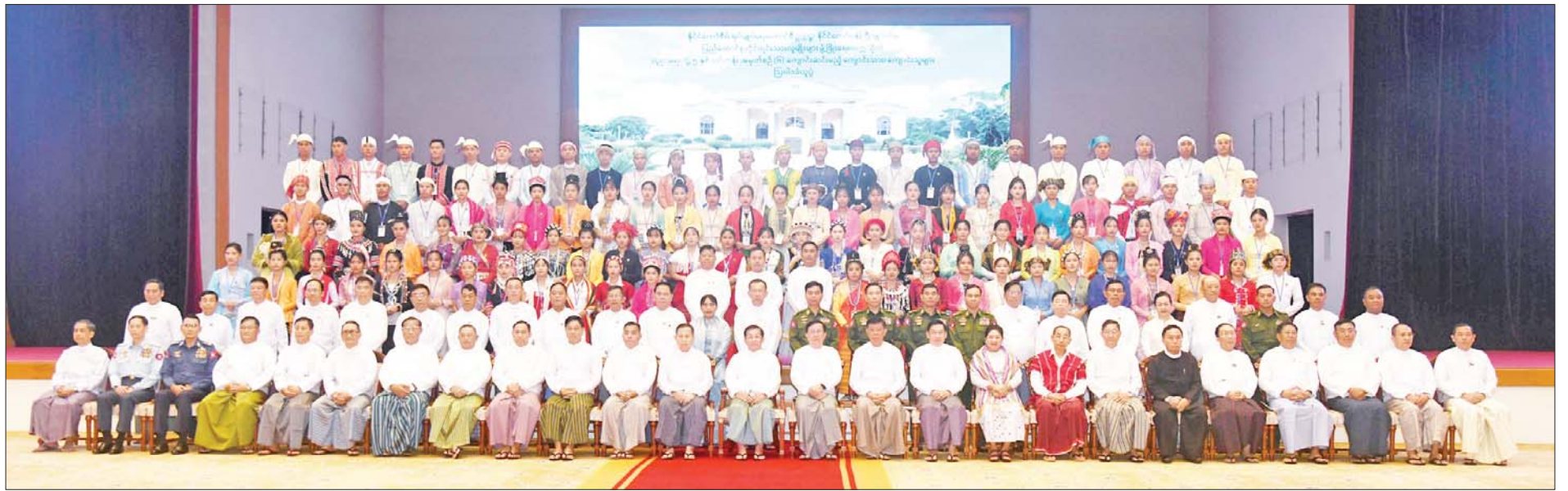
နိုင်ငံတော်စီမံအုပ်ချုပ်ရေးကောင်စီဥက္ကဋ္ဌ နိုင်ငံတော်ဝန်ကြီးချုပ် ဗိုလ်ချုပ်မှူးကြီးမင်းအောင်လှိုင်နှင့် အခမ်းအနားတက်ရောက်လာကြသူများ၊ ကျောင်းသား ကျောင်းသူများ စုပေါင်းမှတ်တမ်းတင်ဓာတ်ပုံရိုက်စဉ်။

»» စာမျက်နှာ ၄ မှ ထို့ကြောင့် မောင်တို့၊ မယ်တို့ အနေဖြင့် မိမိတို့ ပြည်ထောင်စုဖွား တိုင်းရင်းသား ညီအစ်ကိုမောင်နှမ များအကြား အပြန်အလှန်လေးစားမှု၊ နားလည်မှု၊ ယုံကြည်မှုများ တည်ဆောက်ကြရာတွင် အတွေးအခေါ်အယူအဆ မှန်ကန်စွာဖြင့် စည်းစည်းလုံးလုံး ပိုင်းဝန်းပူးပေါင်းဆောင်ရွက်ပေးကြရန် လိုအပ်ကြောင်း၊ အထူးသဖြင့် မိမိတို့စာပေပညာသင်ကြားပေးရမည့် တိုင်းရင်းသား လူငယ်များကို ပြည်ထောင်စုစိတ်ဓာတ်ကိန်းအောင်းပြီး နိုင်ငံ၏ ကောင်းကျိုးကို သယ်ပိုးဆောင်ရွက်လိုသော မွန်မြတ်သည့် စိတ်စေတနာကောင်းများ ထာဝရ