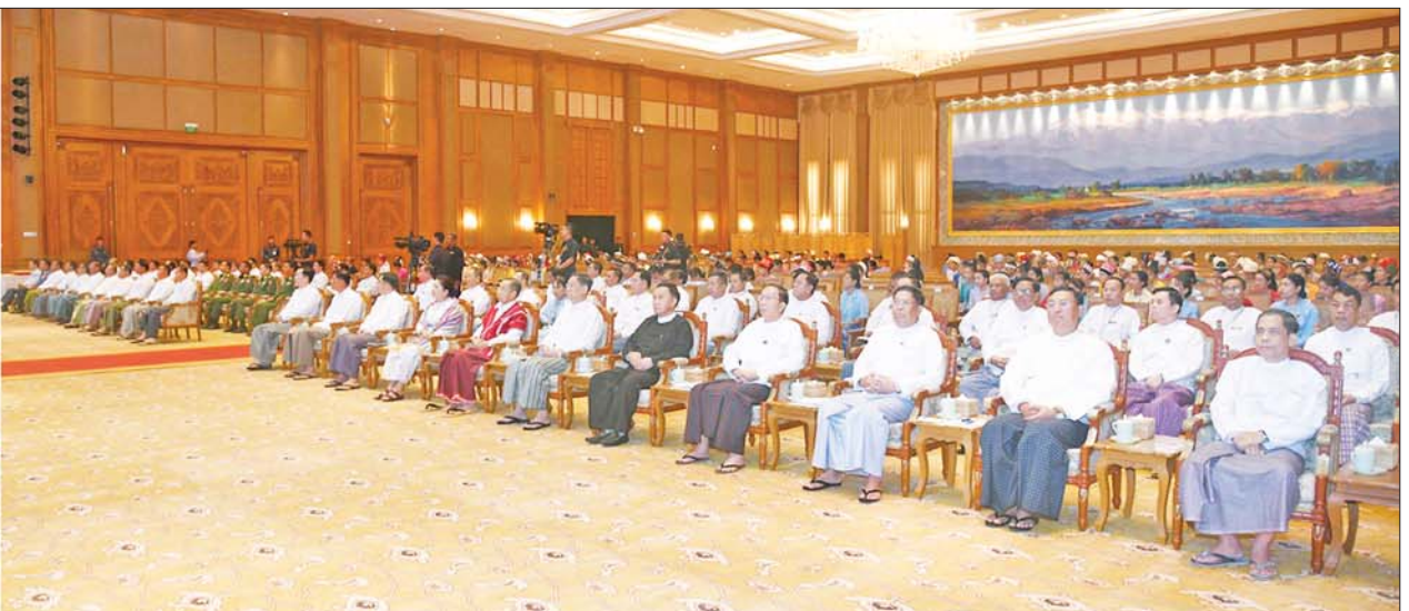
နိုင်ငံတော်စီမံအုပ်ချုပ်ရေးကောင်စီဥက္ကဋ္ဌ နိုင်ငံတော်ဝန်ကြီးချုပ် ဗိုလ်ချုပ်မှူးကြီးမင်းအောင်လှိုင် ပြည်ထောင်စုတိုင်းရင်းသားလူမျိုးများဖွံ့ဖြိုးရေးတက္ကသိုလ် ပညာရေးဘွဲ့ ငါးနှစ်သင်တန်း အမှတ်စဉ်(၆)မှ ကျောင်းသား ကျောင်းသူများကို တွေ့ဆုံအမှာစကားပြောကြားစဉ်။

★ ရှေးဦးမှ ပြည်ထောင်စု တိုင်းရင်းသားလူမျိုး များ ဖွံ့ဖြိုးရေးသိပ္ပံကို ၁၉၉၁ ခုနှစ် မေ ၁၀ ရက်တွင် ပြည်ထောင်စု တိုင်းရင်းသားလူမျိုးများ ဖွံ့ဖြိုးရေး တက္ကသိုလ်အဖြစ် အဆင့်တိုးမြှင့် ပေးခဲ့ကြောင်း၊ ပြည်ထောင်စု တိုင်းရင်းသားလူမျိုးများဖွံ့ဖြိုးရေး တက္ကသိုလ်အနေဖြင့် လေ့ကျင့်ပြုစု ပျိုးထောင်ပေးခဲ့သည်မှ ယခုအခါ သင်တန်းဆင်း ကျောင်းသား ကျောင်းသူ စုစုပေါင်း ၁၄၂၈၈ ဦး မွေးထုတ်ပေးနိုင်ခဲ့ပြီး ဖြစ်ကြောင်း။ ဘက်စုံပညာရေးစနစ် တိုးတက် ဖြစ်ပေါ်ရေး ကြိုးပမ်းဆောင်ရွက် နိုင်တစ်နိုင် ဖွံ့ဖြိုးတိုးတက်မှု၏ အခြေခံအုတ်မြစ်သည် ပညာတတ် အရင်းအမြစ်များ ပေါများခြင်းပင် ဖြစ်ကြောင်း၊ နိုင်ငံတော်အနေဖြင့် လည်း အသိပညာ၊ အတတ်ပညာ ပြည့်စုံသည့် ပညာတတ်များနှင့် သာယာဝပြောသည့် အနာဂတ် နိုင်ငံတော်ကြီးကို တည်ဆောက် ရန် ဦးတည်ဆောင်ရွက်နေပြီး အရည်အသွေးပြည့်ဝသည့် ဘက်စုံ ပညာရေးစနစ် တိုးတက်ဖြစ်ပေါ် ရေးကိုလည်း ကြိုးပမ်းဆောင်ရွက် လျက်ရှိကြောင်း။