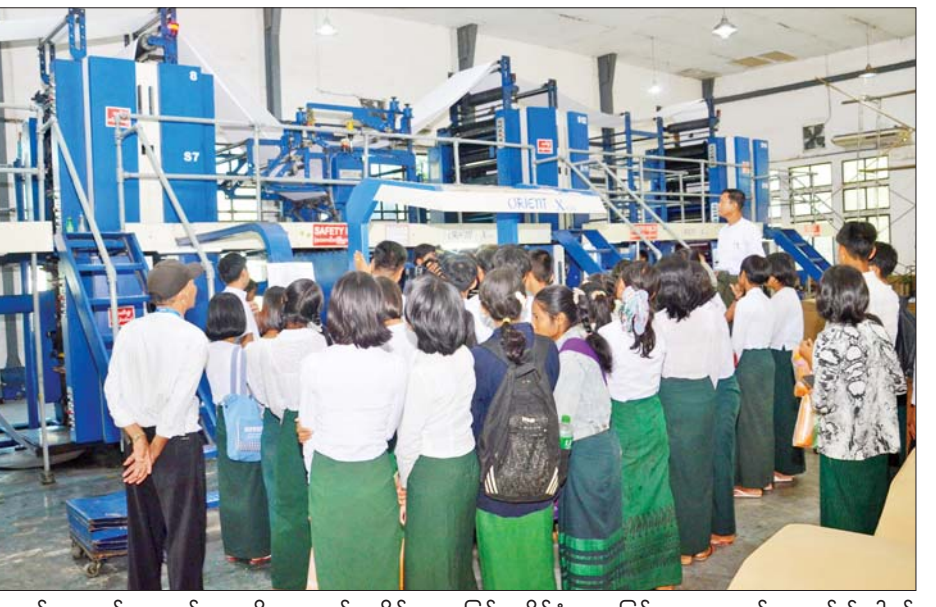
သတင်းအချက်အလက် သိနားလည်မှုဆိုင်ရာ မြန်မာနိုင်ငံအနေဖြင့် ၂၀၁၈ ခုနှစ်မှစတင်၍ ပါဝင် ရက်သတ္တပတ်အဖြစ် UNESCO က ဦးဆောင်၍ ၂၀၂၂ ဆောင်ရွက်ခြင်းဖြစ်ကြောင်း သိရသည်။ ခုနှစ်မှစတင်ကာ ကမ္ဘာတစ်ဝန်းတွင်ကျင်းပလာခဲ့ရာ

မွန်းလွဲပိုင်းတွင် လေ့လာရေးအဖွဲ့သည် နေပြည်တော် ဇေယျာသီရိမြို့နယ် ခရေပင်လမ်းခွဲရှိ သတင်းစာတိုက်များနှင့် နေပြည်တော်ပုံနှိပ်စက်ရုံ တို့ကို သွားရောက်ကြည့်ရှုလေ့လာကြသည်။ (ယာပုံ) ကမ္ဘာတစ်ဝန်းရှိ သက်ဆိုင်သူများအားလုံး အတွက် မီဒီယာနှင့်သတင်းအချက်အလက် သိနားလည် မှုဆိုင်ရာတိုးတက်မှုကို ပြန်လည်သုံးသပ်ရန်၊ သတင်း ရယူမှုအခြေအနေ တိုးမြှင့်လာစေရန်နှင့် မီဒီယာနှင့် သတင်းအချက်အလက် သိနားလည်မှုဆိုင်ရာ တိုးတက်မှုကို ဂုဏ်ပြုနိုင်ရန်၊ ကမ္ဘာတစ်ဝန်းရှိ ပြည်သူ လူထု အသိပညာများမြှင့်တင်ရေး စည်းရုံးနှိုးဆော်မှု များ ဆောင်ရွက်နိုင်ရန် ရည်ရွယ်ပြီး ကမ္ဘာ့မီဒီယာနှင့်