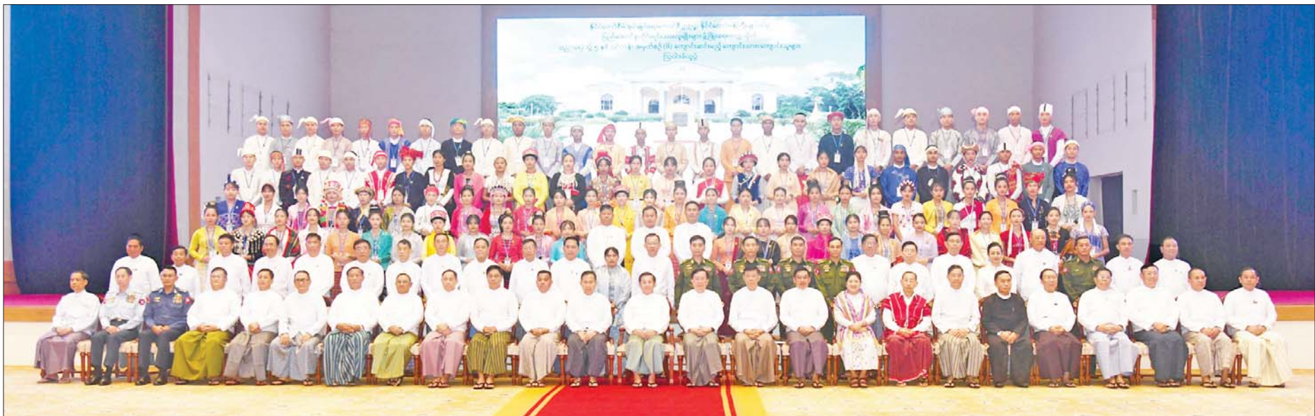
နိုင်ငံတော်စီမံအုပ်ချုပ်ရေးကောင်စီဥက္ကဋ္ဌ နိုင်ငံတော်ဝန်ကြီးချုပ် ဗိုလ်ချုပ်မှူးကြီးမင်းအောင်လှိုင်နှင့် အခမ်းအနားတက်ရောက်လာကြသူများ၊ ကျောင်းသား ကျောင်းသူများ စုပေါင်းမှတ်တမ်းတင်ဓာတ်ပုံရိုက်စဉ်။