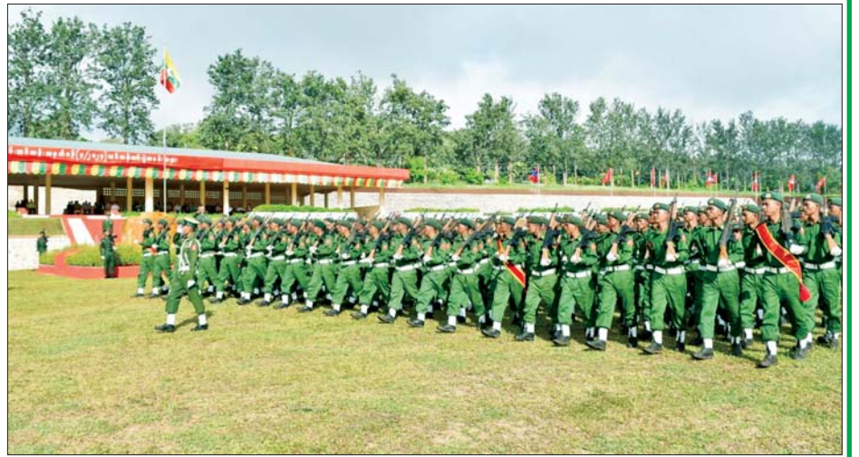
ရမ်းပြည်နယ် ပြည်သူ့စစ်မှုထမ်းသင်တန်းဆင်းပွဲ ကျင်းပစဉ်။