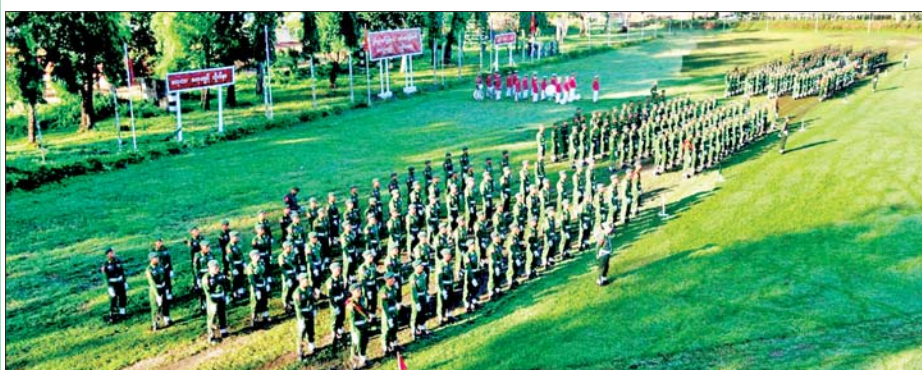
ရန်ကုန်တိုင်းဒေသကြီး ပြည်သူ့စစ်မှုထမ်းသင်တန်းဆင်းပွဲ ကျင်းပစဉ်။