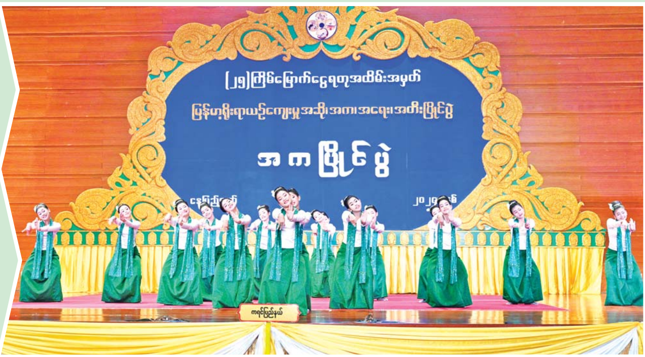
ကဗျာလွတ်အကပြိုင်ပွဲ အခြေခံပညာအဆင့်(၁၀ နှစ်မှ ၁၅ နှစ်အတွင်း) ပြိုင်ပွဲ၌ ပထမဆုရရှိသည့် ကရင်ပြည်နယ်မှ မဆုသစ်သစ်နှင့်အဖွဲ့ ကပြယှဉ်ပြိုင်စဉ်။