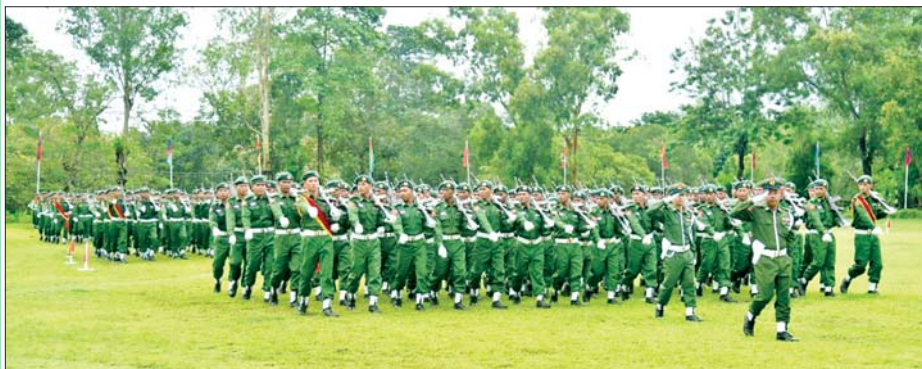
ရန်ကုန်တိုင်းဒေသကြီး ပြည်သူ့စစ်မှုထမ်းသင်တန်းဆင်းပွဲ ကျင်းပစဉ်။