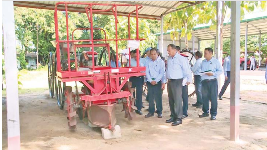
ခပေါင်းဆည်ရေသောက်စနစ်၊ လက်ဝဲတူးမြောင်း မကြီးပေတိုင်-၇၃၀၀ အနီး ရာဂီမုန်တိုင်းအရှိန်ကြောင့် တူးမြောင်းပျက်စီးမှုများကို ကြည့်ရှုစစ်ဆေးပြီး ပဲခူးတိုင်းဒေသကြီးအတွင်း နွေစပါးကေ သိန်း ၃၀ ကျော်အထိ တိုးချဲ့စိုက်ပျိုးရန်နှင့် စိုက်ပျိုးရေး လုံလောက်

နေပြည်တော် အောက်တိုဘာ ၂၅ စိုက်ပျိုးရေး၊ မွေးမြူရေးနှင့် ဆည်မြောင်းဝန်ကြီးဌာန ဒုတိယဝန်ကြီး ဦးဗိုလ်ဗိုလ်ကျော်သည် ယမန်နေ့ နံနက်ပိုင်းက ပဲခူးတိုင်းဒေသကြီး ရေတာရှည်မြို့နယ် စက်မှုလယ်ယာဦးစီးဌာန အမှတ်(၄၈)စက်မှုလယ်ယာစခန်း မြို့နယ်ဦးစီးမှူးရုံးသို့ရောက်ရှိပြီး မြို့နယ်၊ ကျေးရွာအလိုက် တောင်သူပိုင် လယ်ယာသုံးစက်ကိရိယာ ပိုင်ဆိုင်မှုစာရင်းများ မှန်ကန်စွာ ကောက်ယူရေး၊ ရေကြီးနှစ်မြုပ် ထိခိုက်ပျက်စီးခဲ့သော လယ်ယာမြေများ ပြန်လည်ထွန်ယက်ပေးနိုင်ရေး၊ ပုဂ္ဂလိက လယ်ယာဝန်ဆောင်မှုအသင်းများနှင့် ချိန်ညှိပေါင်းစပ်လုပ်ဆောင်ပေးရန် ဆွေးနွေးမှာကြားကာ စခန်းအတွင်းရှိ ဝန်ဆောင်မှုလုပ်ငန်းများတွင် အသုံးပြုနေသော ထွန်စက်ကြီးများ၊ လက်တွန်းထွန်စက်များ၊ ရိတ်သိမ်းခြွေလှေ့စက်များကို ကြည့်ရှုစစ်ဆေးသည်။ ဆွေးနွေးမှာကြား ယင်းနောက် ဒုတိယဝန်ကြီးနှင့် တာဝန်ရှိသူများသည် တောင်ငူမြို့နယ် နှစ်ဆောင်ပြိုင်ကျေးရွာအုပ်စု