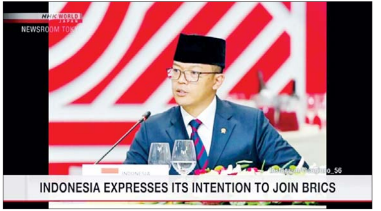
အင်ဒိုနီးရှားနိုင်ငံသည် ကမ္ဘာပေါ်တွင် စတုတ္ထမြောက် လူဦးရေအများဆုံးနိုင်ငံဖြစ်ပြီး လူဦးရေ သန်း ၂၈၀ ခန့်ရှိသည်။ အင်ဒိုနီးရှားနိုင်ငံသည် BRICS အဖွဲ့ဝင်ဖြစ်လာပါက BRICS အဖွဲ့တွင် ကမ္ဘာလူဦးရေ၏ ထက်ဝက်နီးပါးမျှရှိလာမည်ဖြစ်သည်။ ကိုးကား - အင်န်အိတ်ချ်ကော့ဘာသာပြန် - အောင်ကျော်ကျော်

အင်ဒိုနီးရှားနိုင်ငံသည် အစုအဖွဲ့တစ်ခုအနေဖြင့် ပူးပေါင်းဆောင်ရွက်ခြင်း မဟုတ်ဘဲ BRICS ၏ ဖိုရမ်အားလုံးတွင် တက်ကြွစွာ ပါဝင်ဆောင်ရွက်လျက်ရှိကြောင်း ဆူဂျီရီယိုနိုက ပြောကြားသည်။ ဘရာဇီး၊ ရုရှား၊ အိန္ဒိယ၊ တရုတ်နှင့် တောင်အာဖရိကတို့သည် BRICS အဖွဲ့ဝင်များဖြစ်သည်။ အီရန်၊ အီဂျစ်၊ အီသီယိုးပီးယားနှင့် အာရပ်စော်ဘွားများပြည်ထောင်စုတို့သည် မကြာသေးမီက ဝင်ရောက်ခဲ့သည့်အဖွဲ့ဝင်နိုင်ငံများဖြစ်သည်။