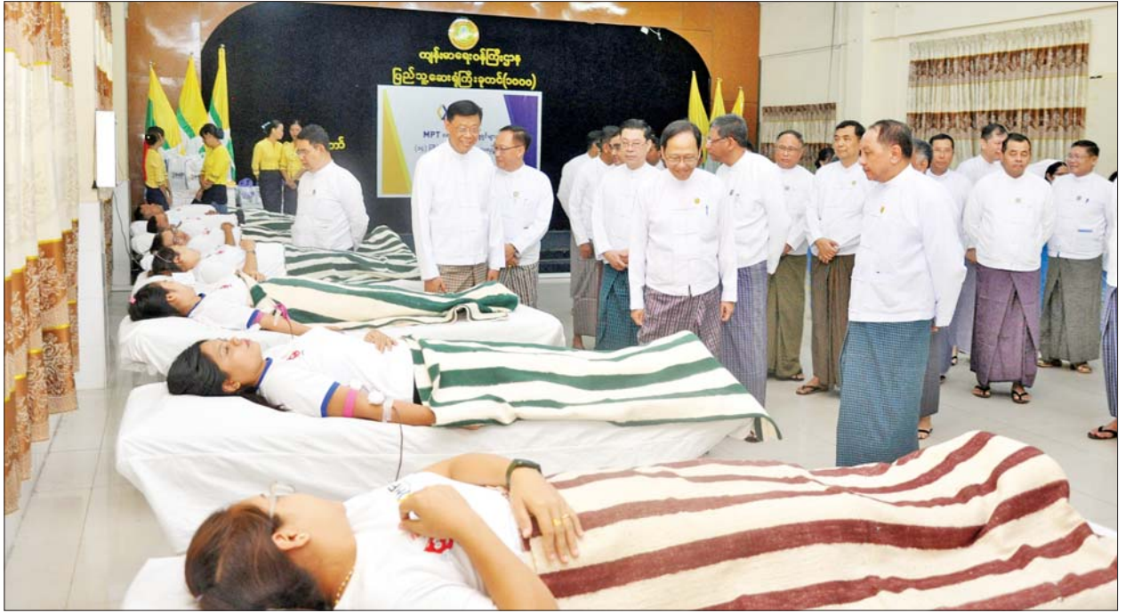
ရှမ်းပြည်နယ် (အရှေ့ပိုင်း) ရှိ သက်ဆိုင်ရာဆေးရုံများနှင့် သွေးဌာန အတိုင်းအတာဖြင့် (၁၄) ကြိမ်မြောက် စုပေါင်းသွေးလှူဒါန်းခြင်းဖြစ်ကြောင်း များတွင် ပြုလုပ်ခဲ့ရာ စုစုပေါင်း ၂၁၀ သွေးလှူဒါန်းကြကာ တစ်နိုင်ငံလုံး သိရသည်။ သတင်းစဉ်

မြန်မာ့ဆက်သွယ်ရေးလုပ်ငန်းအနေဖြင့် နိုင်ငံတစ်ဝန်း စုပေါင်း သွေးလှူဒါန်းပွဲကို နေပြည်တော်၊ ရန်ကုန်၊ မန္တလေး၊ မကွေးနှင့်