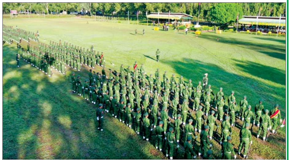
ရန်ကုန်တိုင်းဒေသကြီး ပြည်သူ့စစ်မှုထမ်းသင်တန်းဆင်းပွဲ ကျင်းပစဉ်။