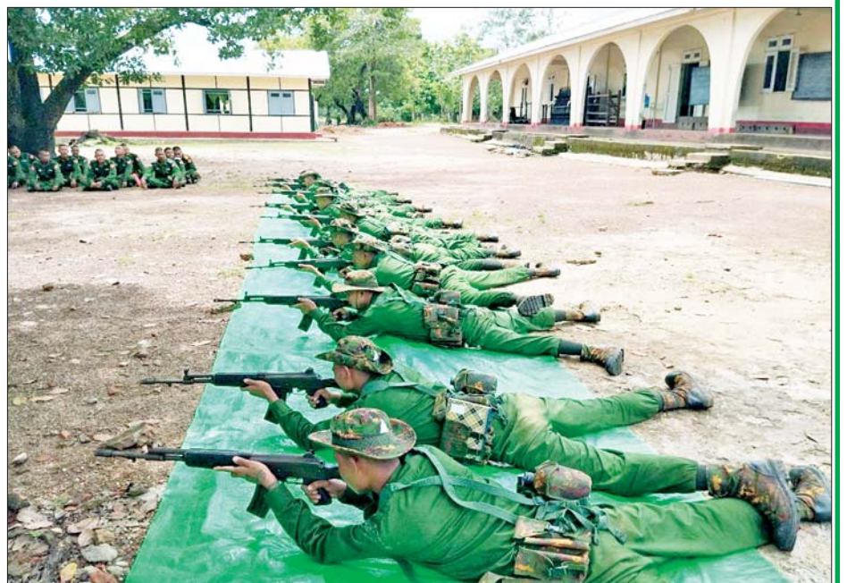
ပြည်သူ့စစ်မှုထမ်းသင်တန်းသားများ လေ့ကျင့်ရေးဆောင်ရွက်နေမှုကို တွေ့ရစဉ်။