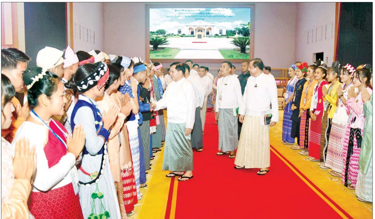
နိုင်ငံတော်စီမံအုပ်ချုပ်ရေးကောင်စီဥက္ကဋ္ဌ နိုင်ငံတော်ဝန်ကြီးချုပ် ဗိုလ်ချုပ်မှူးကြီးမင်းအောင်လှိုင် ကျောင်းသား ကျောင်းသူများကို တစ်ဦးချင်း ရင်းရင်းနှီးနှီး မေးမြန်းနှုတ်ဆက်အားပေးစဉ်။

အတွက် ဆရာ ဆရာမများ၏ သင်ကြားပြသမှု၊ သွန်သင်ဆုံးမမှု ကောင်းမွန်ခြင်း အပေါ်တွင် မူတည်နေကြောင်း၊ ကျောင်းသား ကျောင်းသူများ၏ စိတ်ဓာတ်၊ စည်းကမ်း၊ ပညာကို မှန်ကန် အောင် တည့်မတ်ပေးရေးသည် ဆရာ ဆရာမများ၏ တာဝန်ပင် ဖြစ်ကြောင်း၊ ထို့ပြင် တာဝန်ကျရာ ဒေသအသီးသီးက စာသင်ကျောင်း များတွင် ကျောင်းနေရွယ် ကလေးတိုင်း ကျောင်းနေရာခိုင်နှုန်း မြင့်မားရေး၊ ကျောင်းသား ကျောင်းသူများကို အတန်းပညာ တတ်မြောက်စေရေး၊ တန်းစဉ်ကူး ပြောင်းနှုန်းမြင့်မားစေရေးသာမက ဉာဏ်ပညာနှင့် တည်ဆောက်ထား သည့် လူ့ဘောင်အသိုင်းအဝိုင်း ဖြစ်ပေါ်လာစေရေး အလေးထား ကြိုးပမ်းဆောင်ရွက်သွားကြရန် မှာကြားလိုကြောင်း။