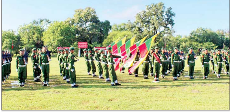
မန္တလေးတိုင်းဒေသကြီး ပြည်သူ့စစ်မှုထမ်းသင်တန်းဆင်းပွဲ ကျင်းပစဉ်။

ပင်ပန်းနွမ်းနယ်မှုတွေ၊ ရှေ့တန်းမှာပြည်သူ့လူထုရဲ့ အသက်အိုးအိမ်စည်းစိမ်တွေ ကာကွယ်ပေးရတဲ့ ရည်ရွယ်ချက်တွေ၊ ပြီးရင် ဆောင်ပုဒ်တွေ အများကြီး နားလည်လာတယ်။ သိရှိလာရတယ်။ ဒီအတွက် ကိုယ့်ချင်းလည်းစာတယ်။ ဒါတွေကိုသိလာရ တဲ့အတွက် ကိုယ့်ကိုယ်ကိုယ် စစ်သားဖြစ်တာကို ဂုဏ်ယူပါတယ်။ စရောက်တော့ တော်တော်လေး ခက်ခဲပါတယ်။ နောက်မှ တဖြည်းဖြည်းချင်း Step by Step သွားရင်းနဲ့မှ သူငယ်ချင်းတွေနဲ့ အများနဲ့ ပူးပေါင်းဆောင်ရွက်တတ်လာတယ်။ အဲဒီအား သာချက်လေးတွေရှိလာတယ်။ ဒီရောက်တော့ စည်းကမ်းရှိလာတယ်။ အရာရာအားလုံးလည်း ပြတ်သွားတယ်။ အရင်တုန်းက တော်တော်လေး ဆိုးခဲ့တဲ့ဘဝကနေ အခုဆို တော်တော်လေးလိမ္မာလာ တယ်လို့ ကိုယ့်ကိုယ်ကိုယ်မြင်မိတယ်။ လာရောက် ပြီး နောက်ထပ်သင်တန်းတက်မယ့် ညီအစ်ကိုတွေ အတွက် ဘာမှအားမငယ်ပါနဲ့။ ဒီကိုရောက်ရင်အား လုံးအဆင်ပြေမှာပါ။ ဒီရောက်လာရင် ပိုပြီးစည်းကမ်း ရှိလာမယ်။ အမိန့်နာခံတတ်လာမယ်။ အများနဲ့ ပူးပေါင်း ဆောင်ရွက်တတ်လာမယ်။ အဲဒီအကျိုး ကျေးဇူးတွေရမှာပါ။ ညီအစ်ကိုတို့အနေနဲ့ ဒီရောက်တဲ့ အခါမှာလည်း ဘာမှကြောက်နေစရာမလိုပါဘူး။ အားလုံး အဆင်ပြေသွားမှာပါလို့ပြောချင်ပါတယ် ခင်ဗျ။