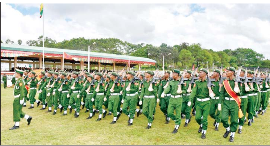
ရမ်းပြည်နယ် ပြည်သူ့စစ်မှုထမ်းသင်တန်းဆင်းပွဲ ကျင်းပစဉ်။

နေပြည်တော် အောက်တိုဘာ ၂၅ နိုင်ငံ့သားတိုင်းသည် ပြည်ထောင်စုမပြိုကွဲရေး၊ တိုင်းရင်းသား စည်းလုံးညီညွတ်မှုမပြိုကွဲရေးနှင့် အချုပ်အခြာအာဏာ တည်တံ့ခိုင်မြဲရေးဟူသည့် ဒို့တာဝန်အရေးသုံးပါးကို စောင့်ထိန်းရန်တာဝန်ရှိ သဖြင့် ယင်းတာဝန်များကိုထမ်းဆောင်နိုင်ရန် အတွက် နိုင်ငံ့သားတိုင်းစစ်ပညာသင်ကြားရန်နှင့် နိုင်ငံတော်ကာကွယ်ရေးအတွက် စစ်မှုထမ်းဆောင် နိုင်ရန် ပြည်သူ့စစ်မှုထမ်းဥပဒေကို ၂၀၂၄ ခုနှစ် ဖေဖော်ဝါရီ ၁၀ ရက်တွင် စတင်အာဏာတည်ခဲ့ပြီး နိုင်ငံတော်ကာကွယ်ရေးနှင့် လုံခြုံရေးတာဝန်များကို ထမ်းဆောင်ရန် စိတ်အားထက်သန်စွာ လာရောက် စာရင်းပေးသွင်းကြသည့်လူငယ်များကို ပြည်သူ့စစ်မှု ထမ်းသင်တန်းများ ဖွင့်လှစ်သင်ကြားပေးလျက်ရှိသည်။ ယခုအခါ ပြည်သူ့စစ်မှုထမ်းသင်တန်း အမှတ်စဉ် (၄) သင်တန်းဆင်းပွဲ အခမ်းအနားများကို ယနေ့ နံနက်ပိုင်းတွင် တိုင်းစစ်ဌာနချုပ်များအလိုက် နယ်မြေခံ သင်တန်းကျောင်းအသီးသီးတွင် ကျင်းပကြသည်။ အဆိုပါ သင်တန်းဆင်းပွဲများကို သင်တန်းဆင်း စစ်ရေးပြ အစီအစဉ်အတိုင်းဆောင်ရွက်ကြပြီး သင်တန်းသားများက နိုင်ငံတော်အလံကိုကိုင်း၍ ကတိသစ္စာခံယူကြသည်။