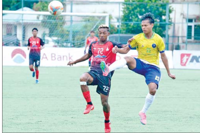
အား/ကာသိပွဲအသင်းနှင့် ရတနာပုံအသင်းတို့ ယှဉ်ပြိုင်ကစားစဉ်။

ရန်ကုန် အောက်တိုဘာ ၂၁ ၂၀၂၄-၂၀၂၅ ရာသီ MNL အမှတ်ပေးပြိုင်ပွဲ ပွဲစဉ် (၁၂) နောက်ဆုံးနေ့ကို အောက်တိုဘာ ၂၁ ရက်က ဆက်လက်ကျင်းပရာ အား/ကာသိပွဲအသင်းနှင့် ဒဂုံစတားယူနိုက်တက်အသင်း အနိုင်ရခဲ့သည်။ YUSC ကွင်း၌ကျင်းပသည့်ပွဲတွင် အား/ကာသိပွဲအသင်းက ရတနာပုံ အသင်းကို နှစ်ဂိုး-ဂိုးမရှိဖြင့် အနိုင်ရခဲ့သည်။ ပထမအကျော့က သရေကျခဲ့ သော်လည်း ယခုပွဲတွင် အား/ကာသိပွဲအသင်းက နိုင်ပွဲရယူနိုင်ခဲ့သည်။