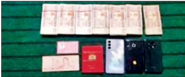
ငွေကျပ် ၃၂၂၀၀၀၀၊ လက်ကိုင်ဖုန်း သုံးလုံးနှင့် နိုင်ငံကူးလက်မှတ် စာအုပ်တစ်အုပ်။

ခြိမ်းခြောက်တောင်းခံရာမှ ရရှိထားသောငွေကြေးများဖြင့် ဝယ်ယူထားသော ယာဉ်၏ မှတ်တမ်းဓာတ်ပုံ