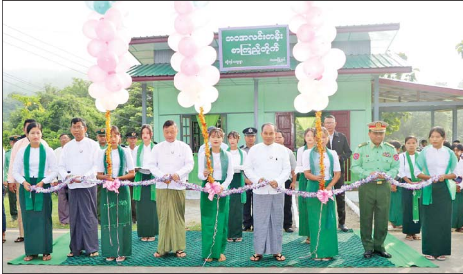
စာကြည့်တိုက်ကို ထာဝစဉ်ရှင်သန်ဖွံ့ဖြိုးတိုးတက် အောင် တာဝန်ရှိသူအားလုံးက စဉ်ဆက်မပြတ် အဆိုပါ ဘဝအလင်းတန်းစာကြည့်တိုက်သည် ဝိုင်းဝန်းပူးပေါင်းဆောင်ရွက်သွားကြရန် လိုအပ် မြန်မာနိုင်ငံ စာကြည့်တိုက်များဖွံ့ဖြိုးတိုးတက်ရေး

မုံရွာ အောက်တိုဘာ ၂၀ စစ်ကိုင်းတိုင်းဒေသကြီး ဝန်ကြီးချုပ်နှင့် တာဝန်ရှိသူများသည် ယနေ့တွင် ကလေးမြို့နယ် ကျိုကုန်းကျေးရွာရှိ ဘဝအလင်းတန်းစာကြည့်တိုက် ဖွင့်ပွဲအခမ်းအနားသို့ တက်ရောက်ကြသည်။