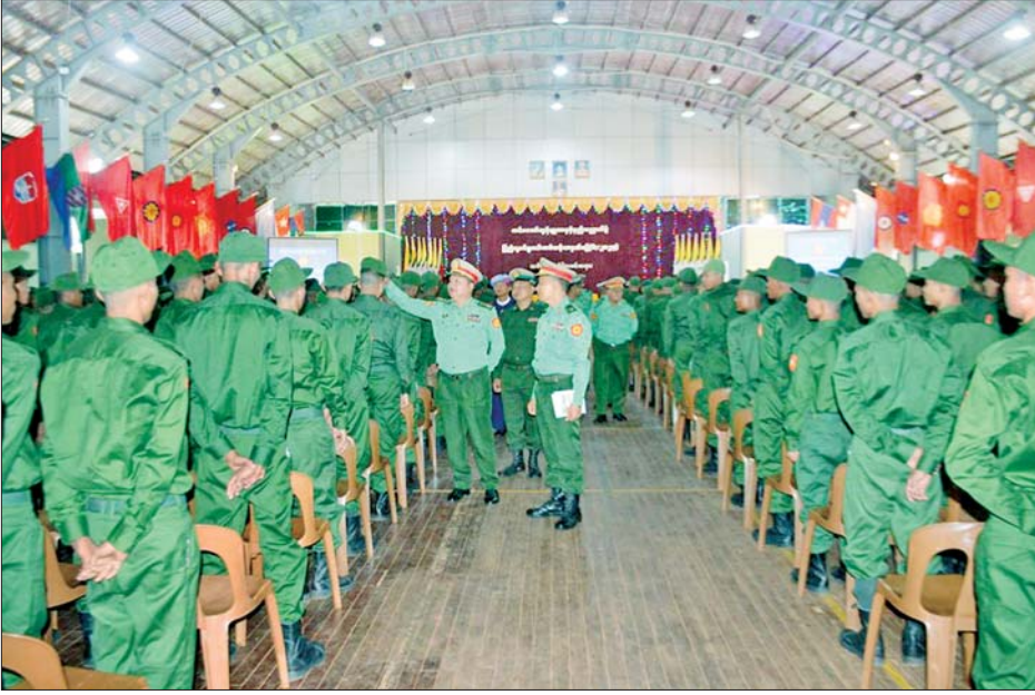
ပြည်သူ့စစ်မှုထမ်းသင်တန်းအမှတ်စဉ်(၆) သင်တန်းဖွင့်ပွဲ အခမ်းအနား ကျင်းပစဉ်။