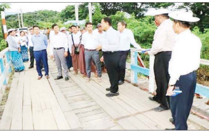
တပ်ကုန်းမြို့နယ် ရွှေမြို့ရွာ ဆင်သေချောင်းကူးတံတား ပျက်စီးမှုအား သမဝါယမနှင့် ကျေးလက်ဖွံ့ဖြိုးရေးဝန်ကြီးဌာန ပြည်ထောင်စုဝန်ကြီး ဦးလှမိုး ကွင်းဆင်းစစ်ဆေးစဉ်။

လျှပ်စစ်မီး၊ ရေရရှိရေးနှင့် ဆက်သွယ်ရေးလမ်း ကြောင်းများ ထိခိုက်ပျက်စီးခဲ့ကြောင်း သိရပါတယ်။ ရာဂီမုန်တိုင်းရဲ့နောက်ဆက်တွဲ ဖြစ်ပေါ်ခဲ့သော အရှေ့မြောက်အရပ်ကဝင်လာတဲ့ လေကြောင့် ဖြစ်တည်လာတဲ့မိုးပဲ ဖြစ်ပါတယ်။ မိုးကြီးမှုကြောင့် မိုးရေချိန်များပြီး နေရာစုံမှာ အဆက်မပြတ် ရွာသွန်း ခဲ့တာကြောင့် အာဆီယံနိုင်ငံတွေဖြစ်တဲ့ ထိုင်းနိုင်ငံနဲ့ လာအိုနိုင်ငံတွေပါ ရေကြီးမှုတွေဖြစ်ခဲ့ပြီး ထိုင်းနိုင်ငံနဲ့ များပြားခဲ့ပါတယ်။ မြန်မာနိုင်ငံမှာတော့ တာချီလိတ်မှာ စက်တင်ဘာလ ၁၀ ရက်နေ့မှစတင် ရေကြီးမှုဖြစ်ပွား ခဲ့ပြီး စိုးရိမ်ရေမှတ် စင်တီမီတာ ၃၉၀ အထိ ဖြစ်ခဲ့ ပါတယ်။ တောင်ပေါ်မြို့ဖြစ်တဲ့ ကလေးမြို့တွင် စက်တင်ဘာလ ၁၀ ရက်နေ့ ညမှာ စတင်ရေကြီးခဲ့ပြီး မြေပြိုခြင်းနဲ့ နှစ် ၁၀၀ အတွင်း အဆိုးဆုံးရေကြီးမှု နဲ့ ကြုံတွေ့ခဲ့ရပါတယ်။ တစ်ဆက်တစ်စပ်တည်း ထိုနေ့ ညပိုင်းမှာပဲ မန္တလေးတိုင်းဒေသကြီး အတွင်းရှိ ရမည်းသင်းမြို့နဲ့ ပျော်ဘွယ်မြို့တွေ၊ နေပြည်တော်တိုင်းဒေသကြီးအတွင်းရှိ တပ်ကုန်းမြို့ နဲ့ မြို့နယ်တွေမှာ ရေကြီးနစ်မြုပ်မှုတွေဖြစ်ခဲ့ ပါတယ်။ ညအချိန်ဖြစ်လို့ တော်တော်ဒုက္ခရောက်ကြ ရမှာ သေချာပါတယ်။ မိုးလင်းတာနဲ့ ကယ်ဆယ်ရေး လုပ်ငန်းတွေ စပြီးဆောင်ရွက်ခဲ့ကြပါတယ်။ နေပြည်တော်၊ ပုဗ္ဗသီရိ ပျဉ်းမနားနဲ့ လယ်ဝေးဒေသ တွေကိုတော့ စက်တင်ဘာလ ၁၀ ရက်နေ့ သန်းခေါင်ယံ အချိန်နဲ့ နံနက်စောစောပိုင်းမှာ ဝင်ရောက်ခဲ့ပါတယ်။