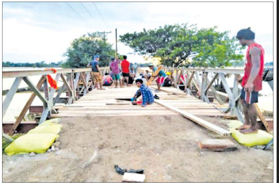
ပျဉ်းမနားမြို့ ပေါစိန်ခေါ် သစ်စိမ့်ပင်တံတား ပျက်စီးမှုနှင့် ပြုပြင်ဆောင်ရွက်နေမှုများအား သမဝါယမနှင့် ကျေးလက်ဖွံ့ဖြိုးရေးဝန်ကြီးဌာန ဒုတိယဝန်ကြီး ဦးမြင့်စိုး ကွင်းဆင်းစစ်ဆေးစဉ်။