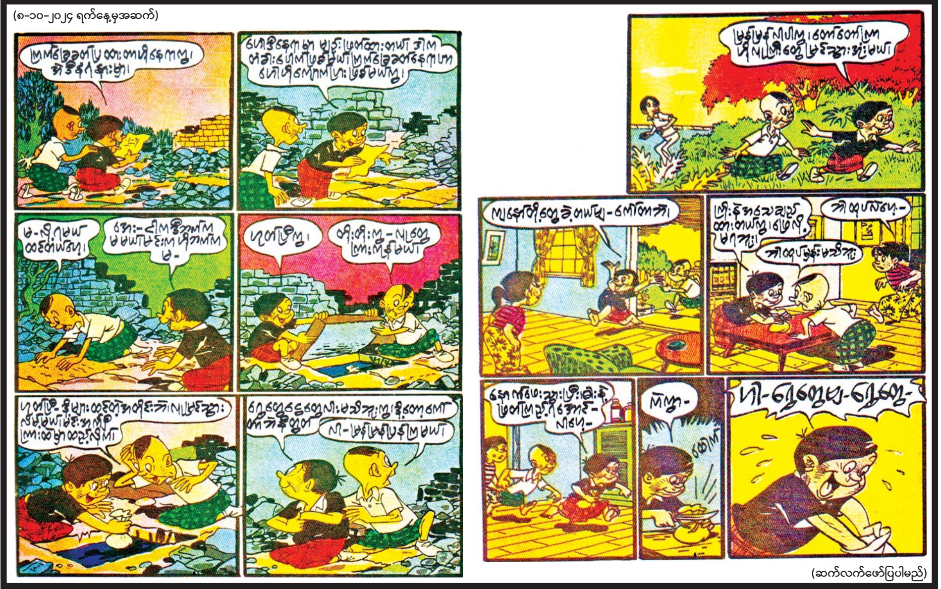
(ဆက်လက်ဖော်ပြပါမည်)

အမြားပေးမည်ဖြစ်ကြောင်းကိုလည်း ပြောပြကြကုန်၏။ ဆရာဦးဖိုးသိလည်း များစွာနှစ်သက်သဖြင့် အမတ်ကြီးအား မပြောပါဟု ကတိပေးလိုက်လေသည်။ အစေခံတို့လည်း ဝမ်းမြောက်ခြင်းဖြစ်ကြကုန်၏။ ထို့နောက် သူသည် အခန်းတွင်းသို့ ပြန်ဝင်ခဲ့လေ၏။ သူသည် စားပွဲတွင် အမတ်ကြီးနှင့်အတူ ထိုင်လေသည်။ ပြီးမှ သူ၏ ကကြီး၊ ခဆွေးစာအုပ်ကို ထုတ်ကာ- “ယခု ကျွန်ုပ်သည် မည်သည့်အရပ်၌ ငွေများ ဝှက်ထားသည်ကို ကြည့်လိုက်ဦးမည်”ဟု ဆိုလေသည်။ ထိုအခိုက်တွင် ငါးယောက်မြောက်သော အစေခံသည် တံခါးကြားသို့ဝင်ကာ နားထောင်နေလေ၏။ ထိုအစေခံမှာလည်း ခိုးမှုတွင် ပါဝင်သူဖြစ်လေသည်။ သူသည် ဆရာဦးဖိုးသိ မည်သို့ဟောမည်ကို အာရုံပြုနေလေသည်။ ထိုစဉ်တွင် ဦးဖိုးသိသည် ကြက်ရုပ်ကို သူ၏ စာအုပ်တွင်း၌ ရှာဖွေနေလေ၏။ သူသည် မတွေ့သဖြင့် စိတ်မရှည်တော့ချေ။ ထို့ကြောင့် “ထွက်ခဲ့လော့၊ ပုန်းမနေနှင့်၊ သင်တို့ သင်တို့ ဘယ်နေရာ၌ ရှိသည်ကို ကျွန်ုပ် သိသည်”ဟု ဆိုလိုက်လေ၏။ ထိုအခါ တံခါးကြားရှိ အစေခံသည် သူ့အား ပြောသည် ထင်မှတ်ကာ ထိတ်လန့်တကြား ထွက်ပြေးလေ၏။ သို့ပြေးရင်းနှင့် နှုတ်မှလည်း - “ထိုသူသည် အလုံးစုံကို သိသည်၊ အကုန်လုံးကို သိသည်၊ အကုန်လုံး နားလည်သည်”ဟု ဟစ်အော်သွားလေသည်။ ဆရာဦးဖိုးသိလည်း ငွေများဝှက်ထားသော နေရာကို အမတ်ကြီးအား ညွှန်ပြလေ၏။ သို့သော် သူသည် အစေခံများအား သစ္စာမဖောက်ချေ။ ထို့ကြောင့် သူသည် အမတ်ကြီးထံမှ ငွေများလည်း ရ၍ အစေခံများထံမှလည်း ငွေအမြောက်အမြား ရရှိလေသည်။ ထိုနေ့မှစ၍ ဆရာဦးဖိုးသိသည် ချမ်းသာကြွယ်ဝသူအဖြစ်သို့ ရောက်ရှိကာ အနီးအဝေး၌ ကျော်ကြားလေသတည်း။ ဆရာမ ငွေတာရီ၏ မပန်းစင်နှင့် အခြားပုံပြင်များ စာအုပ်မှ ပုံပြင်ကို စာရေးသူမိသားစု၏ ခွင့်ပြုချက်ဖြင့် ကူးယူဖော်ပြပါသည်။