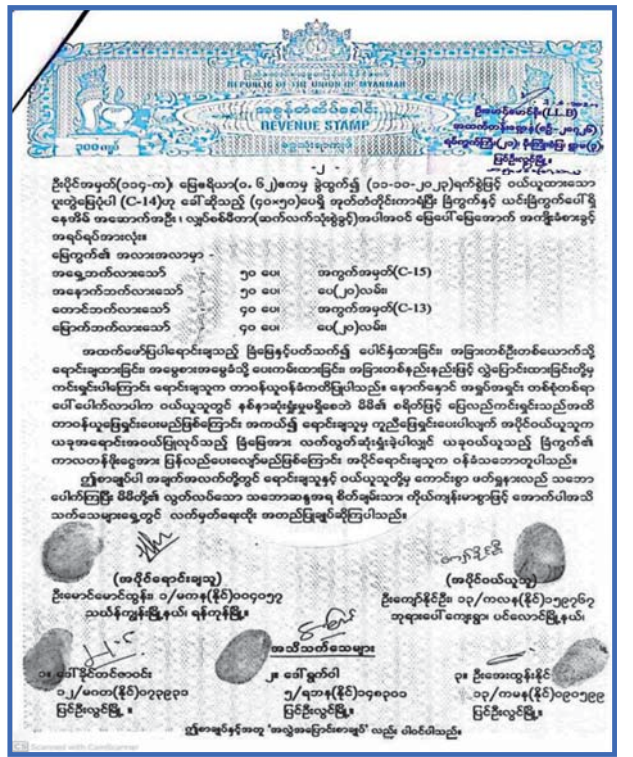
အိမ်ဝယ်ယူထားရှိမှု စာချုပ်။