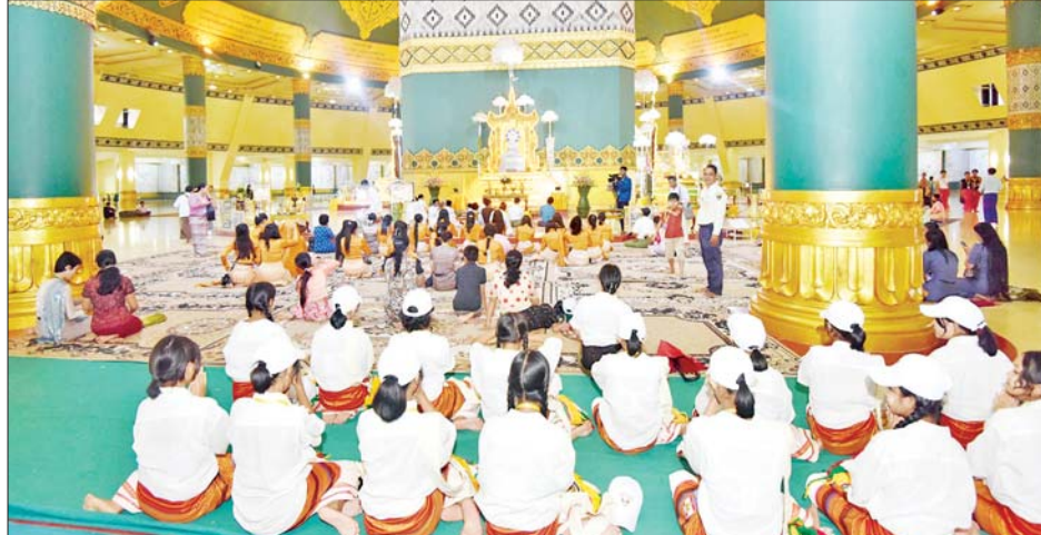
(၂၅)ကြိမ်မြောက် ငွေရတုအထိမ်းအမှတ် မြန်မာ့ရိုးရာယဉ်ကျေးမှု အဆို၊ အက၊ အရေး၊ အတီး (ဗဟိုအဆင့်)ပြိုင်ပွဲဝင်များ၊ အုပ်ချုပ်သူများနှင့် တာဝန်ရှိသူများ ဥပ္ပါတသန္တိစေတီတော်မြတ်ကြီးရှိ ဗုဒ္ဓရုပ်ပွားတော်မြတ်အား ဖူးမြော်ကြည်ညိုကြစဉ်။