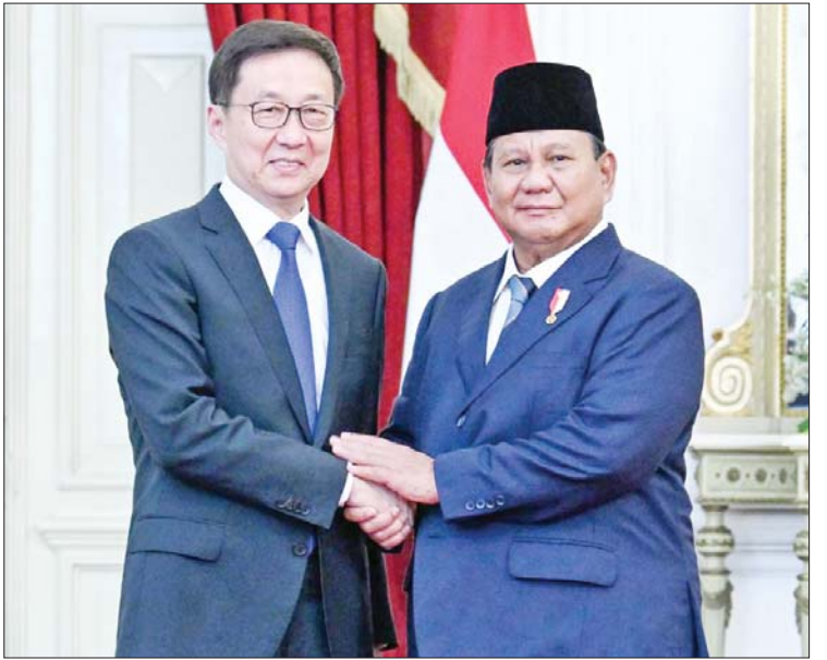
အင်ဒိုနီးရှားသမ္မတ ပရာဘိုဝို ဆူဘီယန်တိုနှင့် တရုတ်ဒုတိယသမ္မတ ဟန်ကျိန် တို့ အင်ဒိုနီးရှားနိုင်ငံ ဂျကာတာမြို့၌ အောက်တိုဘာ ၂၀ ရက်က တွေ့ဆုံဆွေးနွေးစဉ်။

အင်ဒိုနီးရှား သမ္မတဟောင်း ဂျီကို ဝီဒိုဒိုလက်ထက်တွင် ထားရှိခဲ့သည့် တရုတ် နိုင်ငံအပေါ် မိတ်ဆွေအဖြစ် ရပ်တည်မှု ဝါဒကို ဆက်လက်ထိန်းသိမ်းသွားမည် ဖြစ်ပြီး နှစ်နိုင်ငံဆက်ဆံရေးမြှင့်တင်ရေး ဖော်ဆောင်ရန်မှာ အင်ဒိုနီးရှားအစိုးရ၏ အဓိကဦးစားပေး လုပ်ငန်းဖြစ်ကြောင်း