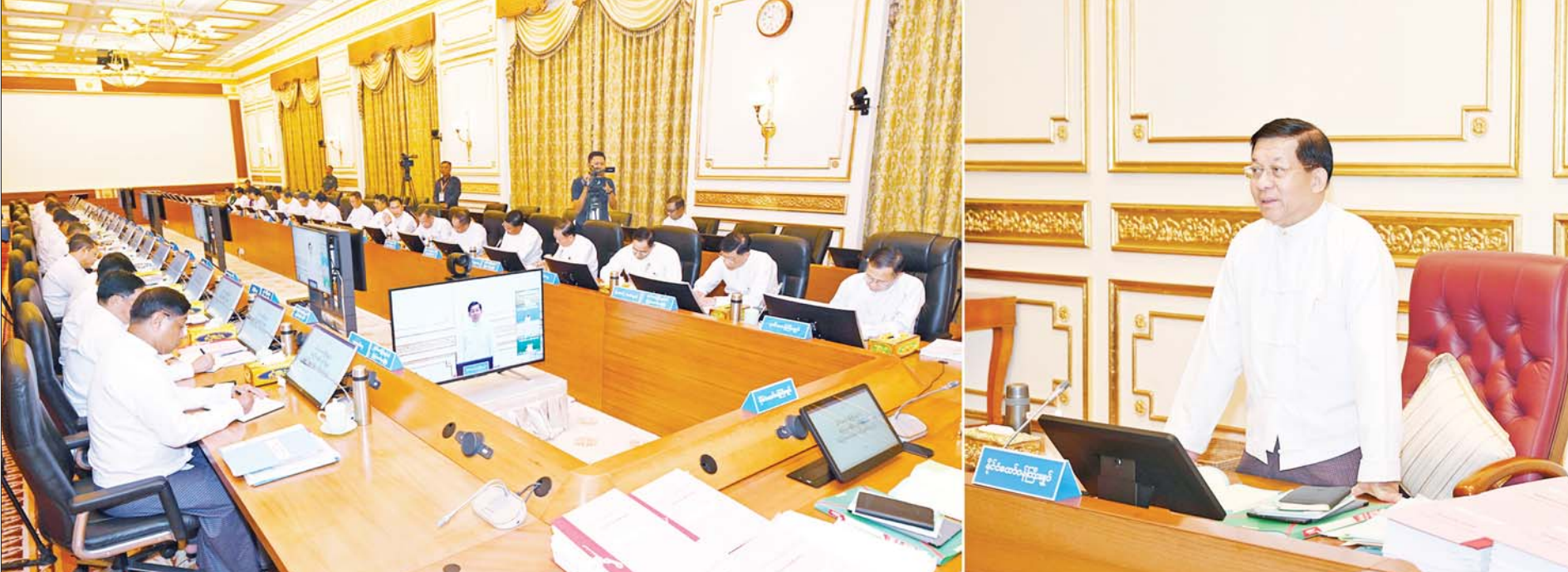
နိုင်ငံတော်စီမံအုပ်ချုပ်ရေးကောင်စီဥက္ကဋ္ဌ နိုင်ငံတော်ဝန်ကြီးချုပ် ဗိုလ်ချုပ်မှူးကြီးမင်းအောင်လှိုင် ပြည်ထောင်စုအစိုးရအဖွဲ့အစည်းအဝေးအမှတ်စဉ်(၇/၂၀၂၄)တွင် အမှာစကားပြောကြားစဉ်။