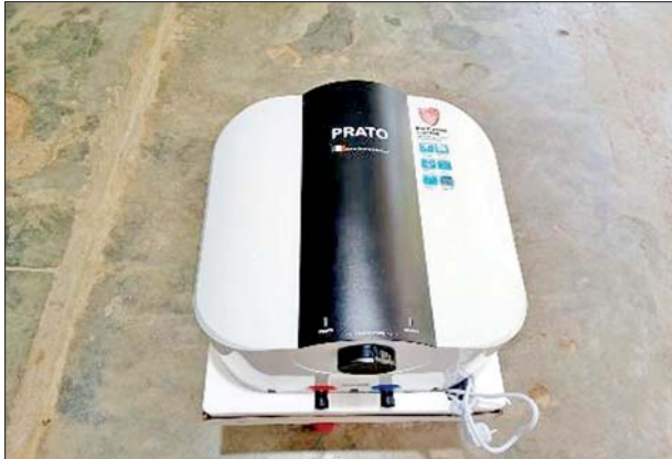
ရှမ်းပြည်နယ်၌ ဖမ်းဆီးရမိမှု။

ထို့ပြင် အောက်တိုဘာ ၂၀ ရက်တွင် ရှမ်းပြည်နယ် တရားမဝင်ကုန်သွယ်မှုတိုက်ဖျက်ရေးအဖွဲ့၏ စီမံခန့်ခွဲမှုဖြင့် တာဝန်ကျပူးပေါင်းအဖွဲ့က စစ်ဆေးမှုများဆောင်ရွက်ခဲ့ရာ ကျိုင်းတုံမြို့ မြို့ရောင်လမ်းယာဉ်ရပ်နားဝင်းအနီး၌ ယာဉ်တစ်စီးပေါ်မှ တရားဝင်စာရွက်စာတမ်းအထောက်အထားတင်ပြနိုင်ခြင်းမရှိသည့် လူသုံးကုန်ပစ္စည်း သုံးမျိုး (ခန့်မှန်းတန်ဖိုးငွေကျပ် ၂၈၈၀၀၀၀)နှင့် အဆိုပါပစ္စည်းများတင်ဆောင်လာသည့် Nissan Diesle Truck တစ်စီး (ခန့်မှန်းတန်ဖိုးငွေကျပ်