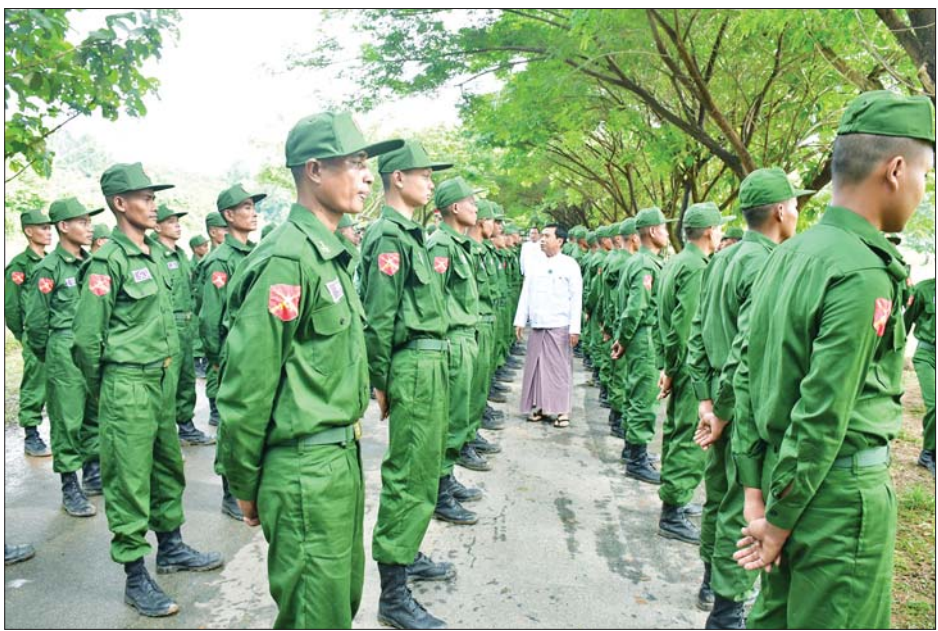
နေပြည်တော်ကောင်စီဥက္ကဋ္ဌ ဦးသန်းထွန်းဦး ပြည်သူ့စစ်မှုထမ်းသင်တန်း အမှတ်စဉ်(၆)မှ သင်တန်းသားများအား ရင်းရင်းနှီးနှီး နှုတ်ဆက်အားပေးစဉ်။

သည့် ဒို့တာဝန်အရေးသုံးပါးကို ထိန်းသိမ်းစောင့်ရှောက်ရန် နိုင်ငံသားတိုင်းတွင် တာဝန်ရှိသဖြင့် ယင်းတာဝန်များကို ထမ်းဆောင်နိုင်ရေးအတွက် စစ်ပညာသင်ကြားရန်နှင့် နိုင်ငံတော်၏ ကာကွယ်ရေးတာဝန်များကို ထမ်းဆောင်နိုင်ရန် ရည်ရွယ်၍ ပြည်သူ့စစ်မှုထမ်း ဥပဒေကို ၂၀၂၄ ခုနှစ် ဖေဖော်ဝါရီ ၁၀ ရက်တွင် စတင်အာဏာတည်စေခဲ့ပြီး ပြည်သူ့စစ်မှုထမ်း သင်တန်းများကို ဖွင့်လှစ်သင်ကြားပေးခဲ့သည်။ ပြည်သူ့စစ်မှုထမ်း သင်တန်း အမှတ်စဉ်(၁)ကို ၂၀၂၄ ခုနှစ် ဧပြီ ၈ ရက်မှစတင်၍ ဖွင့်လှစ်သင်ကြားပေးခဲ့ရာ ယခုအခါ ပြည်သူ့စစ်မှုထမ်းသင်တန်း အမှတ်စဉ်(၆)ကို ဖွင့်လှစ်ခဲ့ခြင်း ဖြစ်ပြီး စာမျက်နှာ ၁၀ သို့ ၀