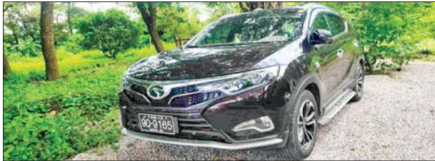
ယာဉ်အမှတ် YGN-13 9Q/9165 နံပါတ်ပါ Southeast DX-7 ယာဉ်။

ခြိမ်းခြောက်တောင်းခံရာမှ ရရှိထားသောငွေကြေးများဖြင့် ဝယ်ယူထားသော ယာဉ်၏ မှတ်တမ်းဓာတ်ပုံ