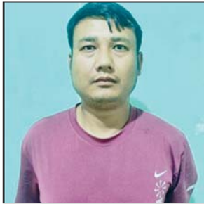
ကျော်ခိုင်ဦး(၂၀)နှစ်

တရားခံနှစ်ဦးနှင့်အတူ သိမ်းဆည်းရမိခဲ့သည့် ခြိမ်းခြောက်တောင်းခံရာမှ ရရှိထားသော ငွေကြေးများ၏ မှတ်တမ်းဓာတ်ပုံ