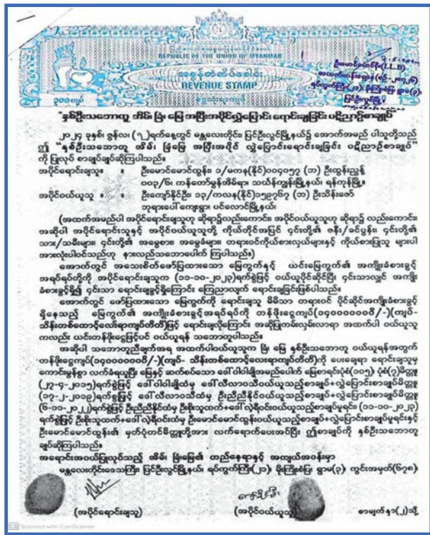
အိမ်ဝယ်ယူထားရှိမှု စာချုပ်။

စီးပွားရေးလုပ်ငန်းရှင်များထံ ခြိမ်းခြောက်ငွေကြေးတောင်းခံသည့် မှတ်တမ်းဓာတ်ပုံ