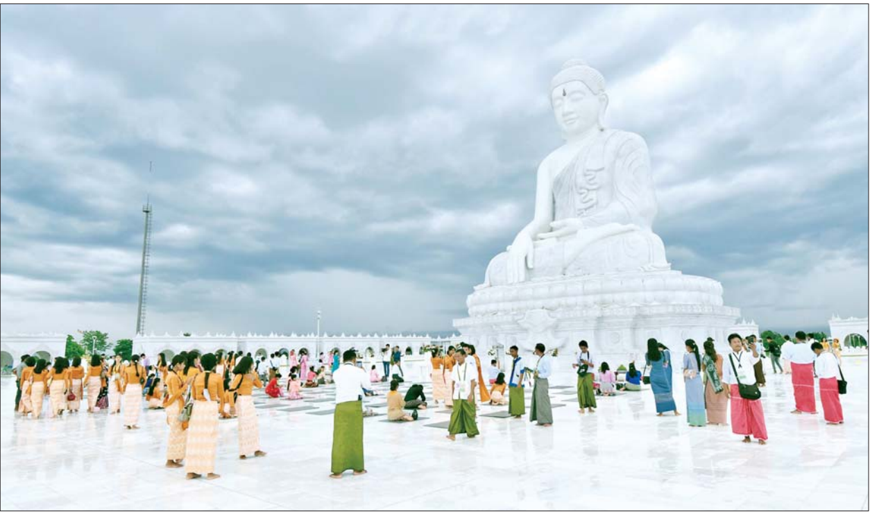
(၂၅)ကြိမ်မြောက် ငွေရတုအထိမ်းအမှတ် မြန်မာ့ရိုးရာယဉ်ကျေးမှု အဆို၊ အက၊ အရေး၊ အတီး (ဗဟိုအဆင့်)ပြိုင်ပွဲဝင်များ၊ အုပ်ချုပ်သူများနှင့် တာဝန်ရှိသူများ မာရဝိဇယဗုဒ္ဓရုပ်ပွားတော်မြတ်ကြီးအား ဖူးမြော်ကြည်ညိုကြစဉ်။

တည်ဆောက်ထားသည့် ဂန္ဓကုဋီတိုက်များ၊ ကျောက်စာရံစေတီတော်များနှင့် အဂ္ဂိမိပတိသာသနာ့ဗိမာန်တော်ကြီးကို ကြည့်ရှုလေ့လာ ဖူးမြော်ကြည်ညိုကြသည်။ ထို့အတူ ပြိုင်ပွဲဝင်များ၊ အုပ်ချုပ်သူများနှင့် တာဝန်ရှိသူများသည် ဥပ္ပါတသန္တိစေတီတော်မြတ်ကြီးအား သွားရောက်ဖူးမြော်ကြည်ညိုကြပြီး အလှူငွေများ လှူဒါန်းကြကာ ဆင်ဖြူတော်ထိန်းသိမ်း စောင့်ရှောက်ရေး ဥပ္ပါတသန္တိစေတီတော်များကို ကြည့်ရှုလေ့လာ၍ အာဟာရဒါန ကျွေးမွေးကြသည်။ ထို့ပြင် နေပြည်တော် Junction Center နှင့် ဥတ္တရသီရိ Ocean Super Center တို့သို့ သွားရောက်ကြပြီး အမှတ်တရ လက်ဆောင်ပစ္စည်းများ ဝယ်ယူခဲ့ကြကြောင်း သိရသည်။