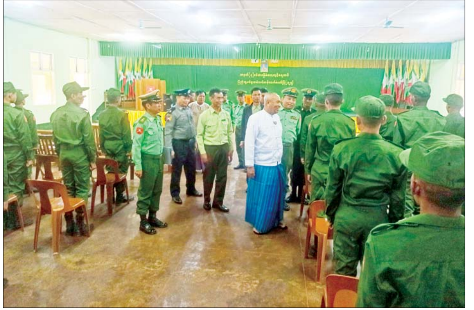
ရှမ်းပြည်နယ် တိုင်းရင်းသားရေးရာဝန်ကြီး ဦးအောင်ကြည်ဝင်း ပြည်သူ့စစ်မှုထမ်း သင်တန်း အမှတ်စဉ်(၆) သင်တန်းသားများအား ရင်းရင်းနှီးနှီး နှုတ်ဆက်အားပေးစဉ်။