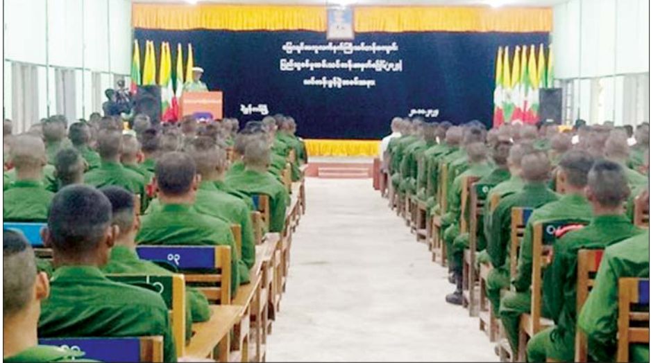
ပြည်သူ့စစ်မှုထမ်းသင်တန်းအမှတ်စဉ်(၆) သင်တန်းဖွင့်ပွဲအခမ်းအနား ကျင်းပစဉ်။