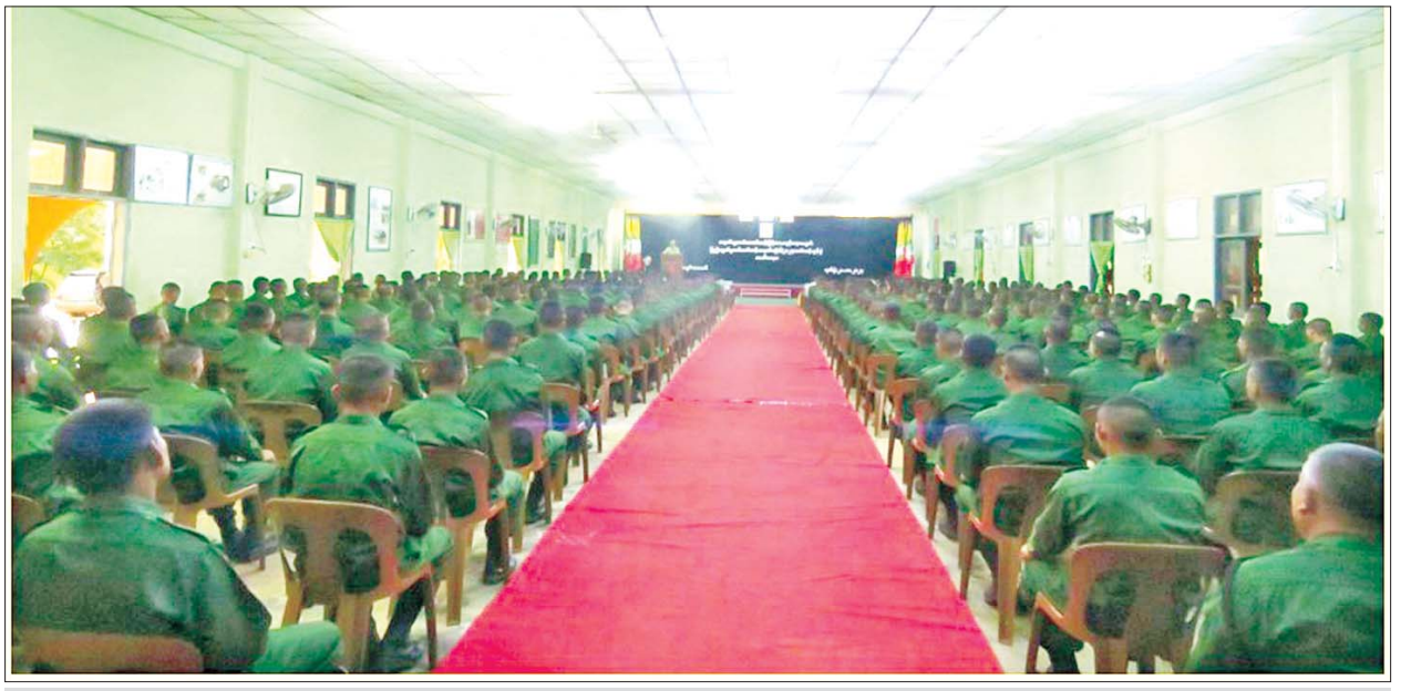
ပြည်သူ့စစ်မှုထမ်းသင်တန်းအမှတ်စဉ်(၆) သင်တန်းဖွင့်ပွဲ အခမ်းအနား ကျင်းပစဉ်။

ကောင်း၊ ညောင်ဦးမှ မွန်းလွဲ ၃ နာရီ မိနစ် ၅၀ တွင် ထွက်ခွာပြီး ပုသိမ်သို့ ညနေ ၅ နာရီ ၃၅ မိနစ်တွင်လည်းကောင်း၊ ပုသိမ်မှ ၅ နာရီ မိနစ် ၅၀ တွင် ထွက်ခွာပြီး ရန်ကုန်သို့ ညနေ ၆ နာရီခွဲတွင် ရောက်ရှိမည် ဖြစ်သည်။