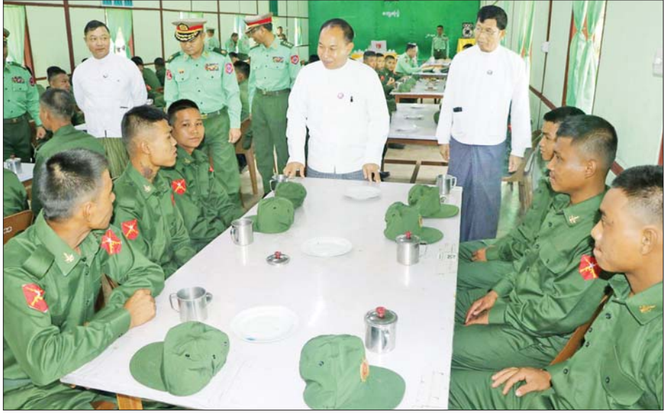
စစ်ကိုင်းတိုင်းဒေသကြီးဝန်ကြီးချုပ် ဦးမြတ်ကျော် ပြည်သူ့စစ်မှုထမ်းသင်တန်း အမှတ်စဉ်(၆)မှ သင်တန်းသားများအား ရင်းရင်းနှီးနှီး နှုတ်ဆက်အားပေးစဉ်။