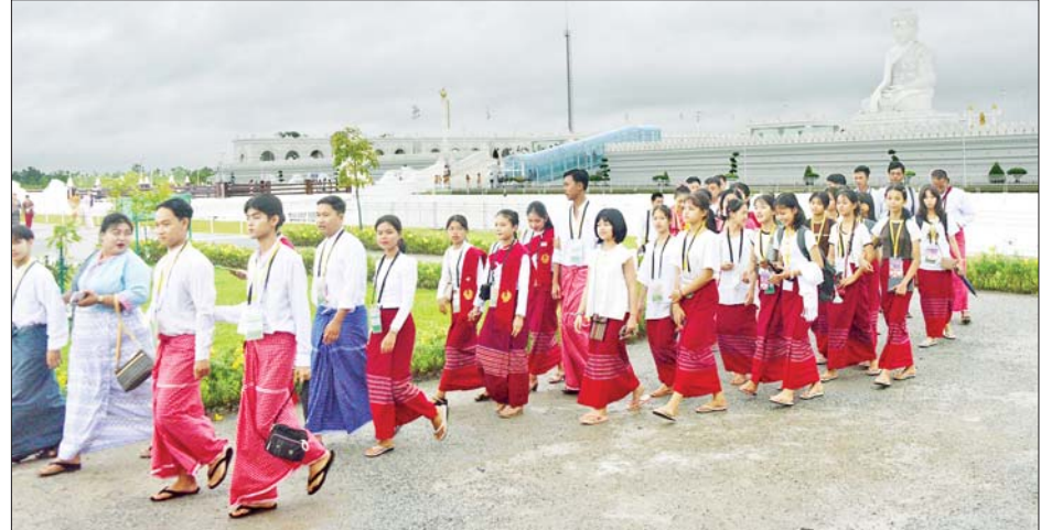
(၂၅)ကြိမ်မြောက် ငွေရတုအထိမ်းအမှတ် မြန်မာ့ရိုးရာယဉ်ကျေးမှု အဆို၊ အက၊ အရေး၊ အတီး (ဗဟိုအဆင့်)ပြိုင်ပွဲဝင်များ၊ အုပ်ချုပ်သူများနှင့် တာဝန်ရှိသူများ ဗုဒ္ဓဥပ္ပါတဝတ္ထုတော်အတွင်း ကြည့်ရှုလေ့လာ ဖူးမြော်ကြည်ညိုကြစဉ်။