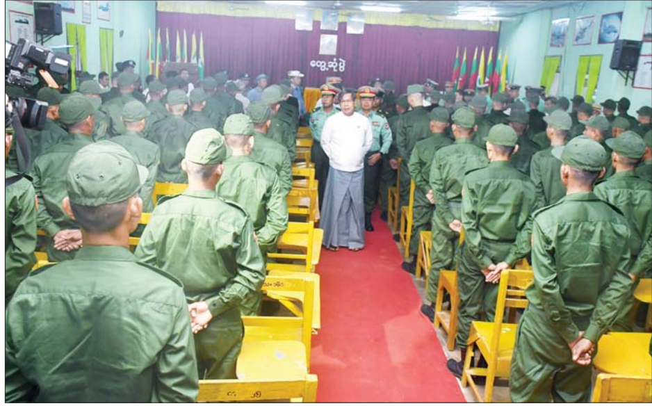
ရန်ကုန်တိုင်းဒေသကြီးဝန်ကြီးချုပ် ဦးစိုးသိန်း ပြည်သူ့စစ်မှုထမ်းသင်တန်း အမှတ်စဉ်(၆)မှ သင်တန်းသားများအား ရင်းရင်းနှီးနှီး နှုတ်ဆက်အားပေးစဉ်။