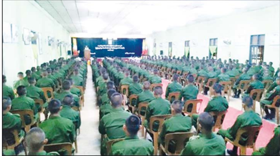
ပြည်သူ့စစ်မှုထမ်းသင်တန်းအမှတ်စဉ်(၆) သင်တန်းဖွင့်ပွဲအခမ်းအနား ကျင်းပစဉ်။