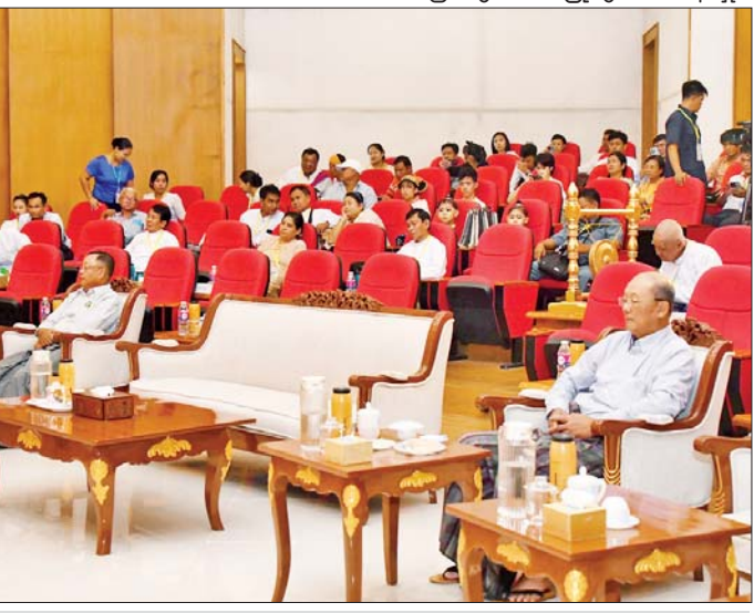
ပြည်ထောင်စုဝန်ကြီး Jeng Phang နော်တောင်နှင့် တာဝန်ရှိသူများ အခြေခံပညာအဆင့် (အသက် ၁၀ နှစ်မှ ၁၅ နှစ်အတွင်း) အမျိုးသမီး ပတ္တလားအတီးပြိုင်ပွဲတွင် ဧရာဝတီတိုင်းဒေသကြီးမှ ပြိုင်ပွဲဝင်တစ်ဦး ယှဉ်ပြိုင်နေမှုကို ကြည့်ရှုအားပေးကြစဉ်။

နေပြည်တော် စည်ပင်သာယာရေးကော်မတီ လဟာပြင်ဇာတ်ရုံ၌ ကျင်းပရာ ဇာတ်တော်ကြီးအဖွဲ့လိုက် ဝါသနာရှင်အဆင့် (ပထမတန်း) ပြိုင်ပွဲတွင် “မဟာဇနက” ဇာတ်တော်ကြီးဖြင့် ရန်ကုန်တိုင်းဒေသကြီးကိုယ်စားပြု ရွှေရန်