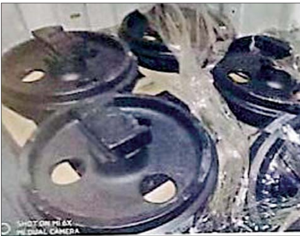
အေးရှားဝေါလ်ကုန်သေတ္တာစစ်ဆေးရေးစခန်း၌ သိမ်းဆည်းရမိမှု။

တရားမဝင် ကုန်သွယ်မှုတိုက်ဖျက်ရေး ဦးဆောင်ကော်မတီ၏ ကြီးကြပ်ကွပ်ကဲမှုဖြင့် တရားမဝင် ကုန်သွယ်မှုများကို ဥပဒေနှင့်အညီ ထိရောက်စွာ တားဆီးအရေးယူနိုင်ရေး ဆောင်ရွက်လျက်ရှိပြီး အကောက်ခွန်ဦးစီးဌာန၏ စီမံခန့်ခွဲမှုဖြင့် တာဝန်ကျပေးပေါင်းအဖွဲ့များက စစ်ဆေးမှုများဆောင်ရွက်ခဲ့ရာ အောက်တိုဘာ ၁၅ ရက်တွင် အေးရှားဝေါလ်ကုန်သေတ္တာ စစ်ဆေးရေးစခန်း၌ ကုန်သေတ္တာ ၁၃ လုံး အတွင်းမှ တရားဝင်စာရွက်စာတမ်းအထောက်အထား တင်ပြနိုင်ခြင်း မရှိသည့် လုပ်ငန်းသုံးပစ္စည်းလေးမျိုးနှင့် လူသုံးကုန်ပစ္စည်းတစ်မျိုး (ခန့်မှန်းတန်ဖိုးငွေကျပ် ၁၆၂၅၅၆၃၂၆)ကို လည်းကောင်း၊ ရန်ကုန် အပြည်ပြည်ဆိုင်ရာလေဆိပ် လေဆိပ်(သွင်းကုန်)၌ တရားဝင်စာရွက် စာတမ်းအထောက်အထား တင်ပြနိုင်ခြင်းမရှိသည့် လုပ်ငန်းသုံး ပစ္စည်းတစ်မျိုး (ခန့်မှန်းတန်ဖိုးငွေကျပ် ၄၄၄၄၄၄၄၄)ကို လည်းကောင်း၊ (စုစုပေါင်းခန့်မှန်းတန်ဖိုးငွေကျပ် ၁၆၇၂၄၄၄၄၄)ကို သိမ်းဆည်းရမိခဲ့ပြီး အကောက်ခွန်လုပ်ထုံးလုပ်နည်းများနှင့်အညီ အရေးယူဆောင်ရွက် လျက်ရှိသည်။