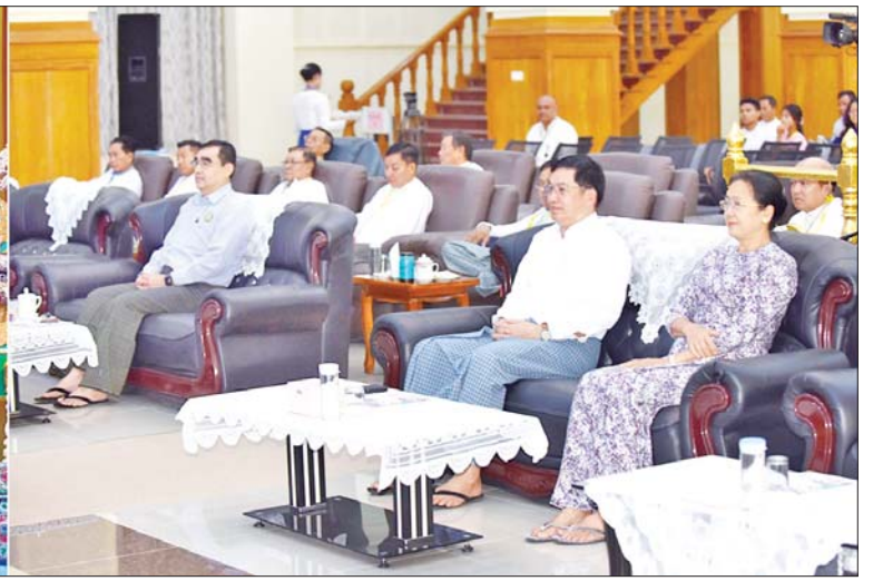
နိုင်ငံတော်စီမံအုပ်ချုပ်ရေးကောင်စီအဖွဲ့ဝင် ဗိုလ်ချုပ်ကြီးညိုစောနှင့် တာဝန်ရှိသူများ အဆင့်မြင့်ပညာအဆင့် အမျိုးသား ဆိုင်းတစ်ဦးချင်း အတီးပြိုင်ပွဲတွင် စစ်ကိုင်းတိုင်း ဒေသကြီးမှ ပြိုင်ပွဲဝင်တစ်ဦး ယှဉ်ပြိုင်နေမှုကို ကြည့်ရှုအားပေးစဉ်။

ပြည်နယ်၊ ရန်ကုန်တိုင်းဒေသကြီး၊ ရခိုင်ပြည်နယ်၊ ကရင်ပြည်နယ်၊ ဧရာဝတီတိုင်း ဒေသကြီးနှင့် မန္တလေးတိုင်း ဒေသကြီးတို့မှ ပြိုင်ပွဲဝင်များက “မဂ္ဂင်ရှစ်ပါး” သီချင်းဖြင့်လည်းကောင်း၊ အခြေခံ ပညာအဆင့် (အသက် ၁၅ နှစ်မှ ၂၀ နှစ်အတွင်း) အမျိုးသမီးပြိုင်ပွဲ