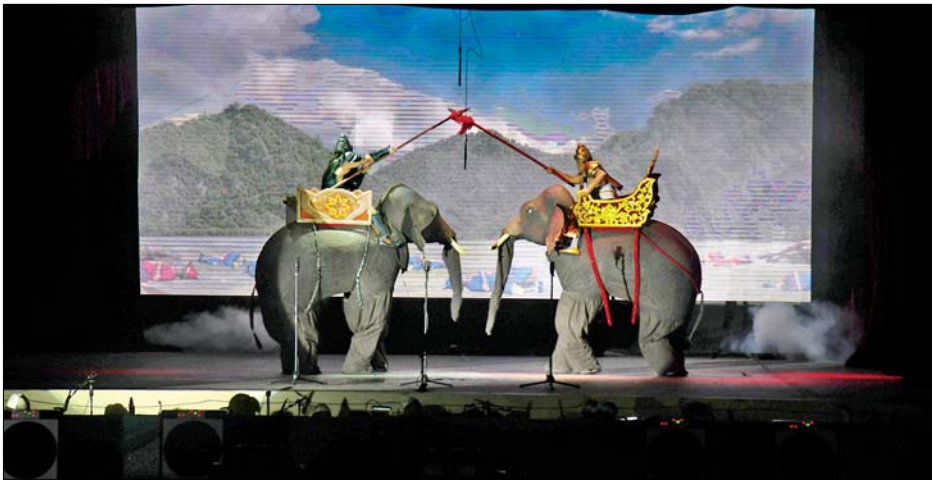
မဟာဇနကဇာတ်တော်ကြီးပြိုင်ပွဲတွင် ရန်ကုန်တိုင်းဒေသကြီးကိုယ်စားပြု “ရွှေရန်ကုန်တိုင်း ဇာတ်အလှသဘင်” ဇာတ်တော်ကြီးအဖွဲ့ တင်ဆက်ကပြယှဉ်ပြိုင်စဉ်။

ကိုယ်စားပြု “ရွှေရန်ကုန်တိုင်း ဇာတ်အလှသဘင်” ဇာတ်တော်ကြီးအဖွဲ့တို့ကလည်းကောင်း ပါဝင် ယှဉ်ပြိုင်ခဲ့ကြပြီး အောက်တိုဘာ ၁၉ ရက်နှင့် ၂၀ ရက်တို့တွင် ပဲခူးတိုင်းဒေသကြီးနှင့် စစ်ကိုင်းတိုင်း ဒေသကြီးတို့မှ သက်ဆိုင်ရာကိုယ်စားပြု ဇာတ်တော် ကြီးအဖွဲ့များက ဆက်လက်ပါဝင်ယှဉ်ပြိုင်သွားကြ မည်ဖြစ်ကြောင်း သိရသည်။ သတင်းစဉ်