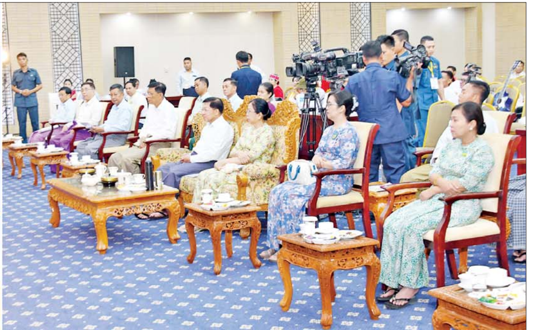
ပဲခူးတိုင်းဒေသကြီး