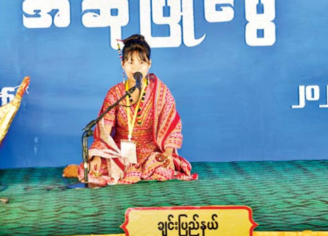
နိုင်ငံတော်စီမံအုပ်ချုပ်ရေးကောင်စီအဖွဲ့ဝင် ဒေါက်တာဘရွှေ၊ ပြည်ထောင်စုဝန်ကြီးများဖြစ်ကြသည့် ဦးတင်ဦးလွင်၊ ဒေါက်တာသက်ခိုင်ဝင်းနှင့် တာဝန်ရှိသူများ အဆင့်မြင့် ပညာအဆင့် အမျိုးသမီး မဟာဂီတအဆိုပြိုင်ပွဲတွင် ချင်းပြည်နယ်မှ ပြိုင်ပွဲဝင်တစ်ဦး ယှဉ်ပြိုင်နေမှုကို ကြည့်ရှုအားပေးကြစဉ်။

“သီလာဝေယံ” (ပတ်ပျိုး) သီချင်း ဖြင့်လည်းကောင်း၊ အဆင့်မြင့် ပညာအဆင့် အမျိုးသားပြိုင်ပွဲတွင် ရခိုင်ပြည်နယ်၊ ပဲခူးတိုင်းဒေသ ကြီး၊ ရန်ကုန်တိုင်းဒေသကြီး၊ စစ်ကိုင်းတိုင်းဒေသကြီး၊ မန္တလေး တိုင်းဒေသကြီး၊ ဧရာဝတီတိုင်း ဒေသကြီး၊ တနင်္သာရီတိုင်းဒေသ ကြီးနှင့် မွန်ပြည်နယ်တို့မှ ပြိုင်ပွဲဝင်များက “သီလာဝေယံ” (ပတ် ပျိုး) သီချင်းဖြင့် လည်းကောင်း ယှဉ်ပြိုင်ကြသည်။