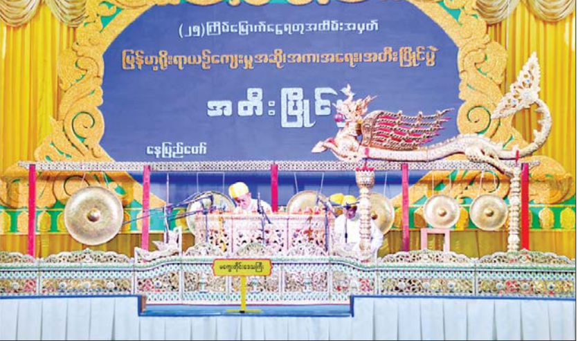
ပြည်ထောင်စုဝန်ကြီး ဦးညွှန်ထွန်းနှင့်တာဝန်ရှိသူများ ဝါသနာရှင်အဆင့် (ပထမတန်း) အမျိုးသား ဆိုင်းတစ်ဦးချင်း အတီးပြိုင်ပွဲတွင် မကွေးတိုင်းဒေသကြီးမှ ပြိုင်ပွဲဝင်တစ်ဦး ယှဉ်ပြိုင်နေမှုကို ကြည့်ရှုအားပေးကြစဉ်။

ဒေသကြီး၊ မန္တလေးတိုင်းဒေသကြီး၊ စစ်ကိုင်းတိုင်းဒေသကြီး၊ ရန်ကုန်တိုင်းဒေသကြီး၊ ရခိုင်ပြည်နယ်၊ ကယားပြည်နယ်၊ ကရင်ပြည်နယ်၊ တနင်္သာရီတိုင်းဒေသကြီး၊ မွန်ပြည်နယ်၊ ပဲခူးတိုင်းဒေသကြီး၊ ကချင်ပြည်နယ်၊ ချင်းပြည်နယ်နှင့် ဧရာဝတီတိုင်းဒေသကြီးတို့မှ ပြိုင်ပွဲဝင်များက “ရီရီဆိုင်းဆိုင်း” (ကြိုး) သီချင်းဖြင့်လည်းကောင်း၊ ဝါသနာရှင်အဆင့် (ဒုတိယတန်း) အမျိုးသမီးပြိုင်ပွဲတွင် မွန်ပြည်နယ်၊ ဧရာဝတီတိုင်းဒေသကြီး၊ မန္တလေးတိုင်းဒေသကြီးနှင့် ရန်ကုန်တိုင်းဒေသကြီးတို့မှ ပြိုင်ပွဲဝင်များက “လျှပ်ပန်းခွေခွေ” (ယိုးဒယား) သီချင်းဖြင့်လည်းကောင်း၊ အခြေခံပညာအဆင့် (အသက် ၁၀ နှစ်မှ ၁၅ နှစ်အတွင်း) အမျိုးသမီးပြိုင်ပွဲတွင် မွန်ပြည်နယ်၊ ရှမ်းပြည်နယ်၊ မန္တလေးတိုင်းဒေသကြီး၊ ဧရာဝတီတိုင်းဒေသကြီးနှင့် ရန်ကုန်တိုင်းဒေသကြီးတို့မှ ပြိုင်ပွဲဝင်များက “မင်္ဂလာသီရိ” (ဘွဲ့) သီချင်းဖြင့်