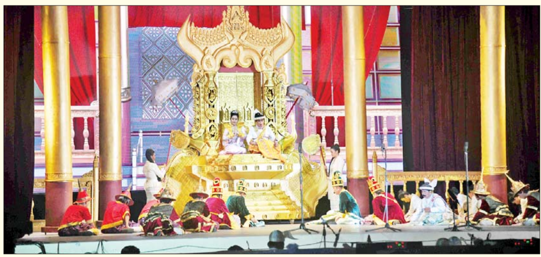
ဇာတ်တော်ကြီး အဖွဲ့လိုက် ပြိုင်ပွဲတွင် “မဟာဇနက” ဇာတ်တော်ကြီးဖြင့် ရန်ကုန်တိုင်းဒေသကြီး ကိုယ်စားပြု ရွှေရန်ကုန်တိုင်းဇာတ်အလှသဘင် အဖွဲ့ တင်ဆက်ကပြ ယှဉ်ပြိုင်စဉ်။