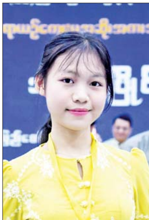
မထက်ထက်သီရိဝေ