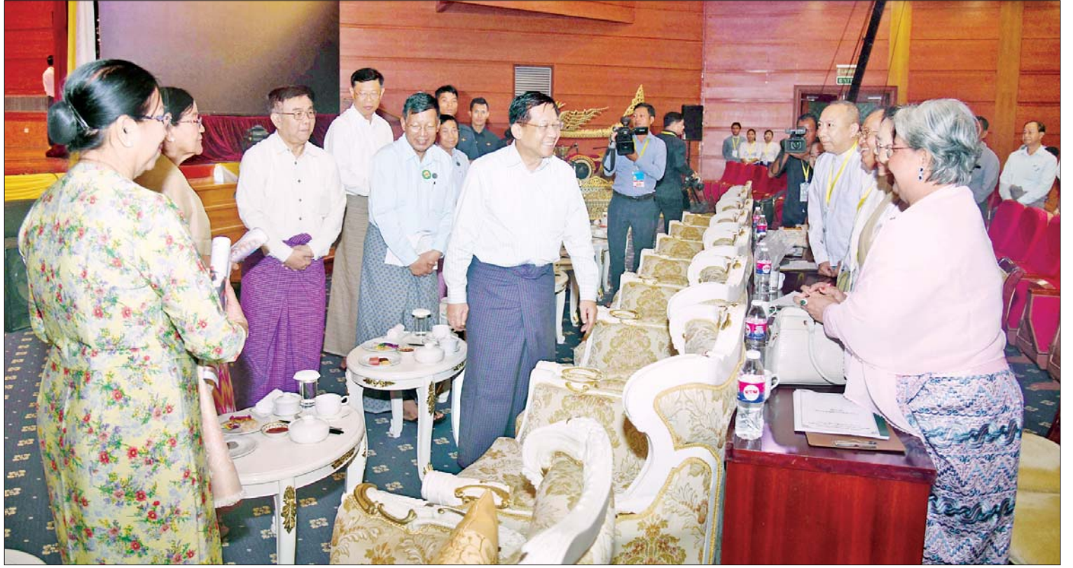
နိုင်ငံတော်စီမံအုပ်ချုပ်ရေးကောင်စီဥက္ကဋ္ဌ နိုင်ငံတော်ဝန်ကြီးချုပ် ဗိုလ်ချုပ်မှူးကြီးမင်းအောင်လှိုင်နှင့် ဇနီး ဒေါ်ကြူကြူလှ ပြိုင်ပွဲအဆင့်အလိုက် အကဲဖြတ် ဆောင်ရွက် ပေးနေသည့် အကဲဖြတ်ပညာရှင်များအား ရင်းရင်းနှီးနှီးနှုတ်ဆက်စဉ်။

၀ ရှေ့ပုံးမှ အဆိုပါပြိုင်ပွဲများသို့ နိုင်ငံတော် စီမံအုပ်ချုပ်ရေးကောင်စီဥက္ကဋ္ဌ နိုင်ငံတော် ဝန်ကြီးချုပ် ဗိုလ်ချုပ်မှူးကြီးမင်းအောင်လှိုင် နှင့် ဇနီးဒေါ်ကြူကြူလှ တို့နှင့်အတူ ကောင်စီဝင်များနှင့် ဇနီးများ၊ ပြည်ထောင်စု ဝန်ကြီးများနှင့် ဇနီးများ၊ နေပြည်တော် ကောင်စီဥက္ကဋ္ဌ၊ ဒုတိယဝန်ကြီးများ၊ အကဲဖြတ်ခိုင်အဖွဲ့ဝင်များ၊ ကြီးကြပ် အုပ်ချုပ်သူများ၊ တိုင်းဒေသကြီးနှင့် ပြည်နယ်များမှ ပြိုင်ပွဲဝင်များ၊ တိုင်းရင်းသား ညီအစ်ကိုမောင်နှမများ၊ အနုသုခုမပညာ ရပ်ကို ချစ်မြတ်နိုးကြသည့်ပြည်သူများ တက်ရောက်အားပေးကြသည်။ ကကြီးကကွက်စုံလင်စွာ ယှဉ်ပြိုင်ကပြဖျော်ဖြေ ဦးစွာ နိုင်ငံတော်စီမံအုပ်ချုပ်ရေး ကောင်စီဥက္ကဋ္ဌ နိုင်ငံတော်ဝန်ကြီးချုပ်နှင့် ဇနီး၊ အဖွဲ့ဝင်များသည် ဝါသနာရှင်အဆင့် (ပထမတန်း)အမျိုးသမီးပြိုင်ပွဲဝင်များက ခေါင်း၊ ခါး၊ ခြေ လက် အချိုးအဆစ်ညီညာ စွာအသုံးပြု၍ သက်ဆိုင်ရာ တိုင်းဒေသ ကြီးနှင့် ပြည်နယ်အလိုက် ဆိုင်းပိုင်းအဖွဲ့ များ၏ ပံ့ပိုးတီးခတ်မှုနှင့်အတူ အနုသုခုမ ရသစုံလင်လှသည့် ဆို၊ ဝါ၊ ပြော အကအလှ များဖြင့် ကကြီးကကွက်စုံလင်စွာ ယှဉ်ပြိုင်ကပြဖျော်ဖြေမှုကို ကြည့်ရှု အားပေးကြသည်။ ယှဉ်ပြိုင်မှုအပြီးတွင် နိုင်ငံတော် စီမံအုပ်ချုပ်ရေးကောင်စီဥက္ကဋ္ဌ နိုင်ငံတော်