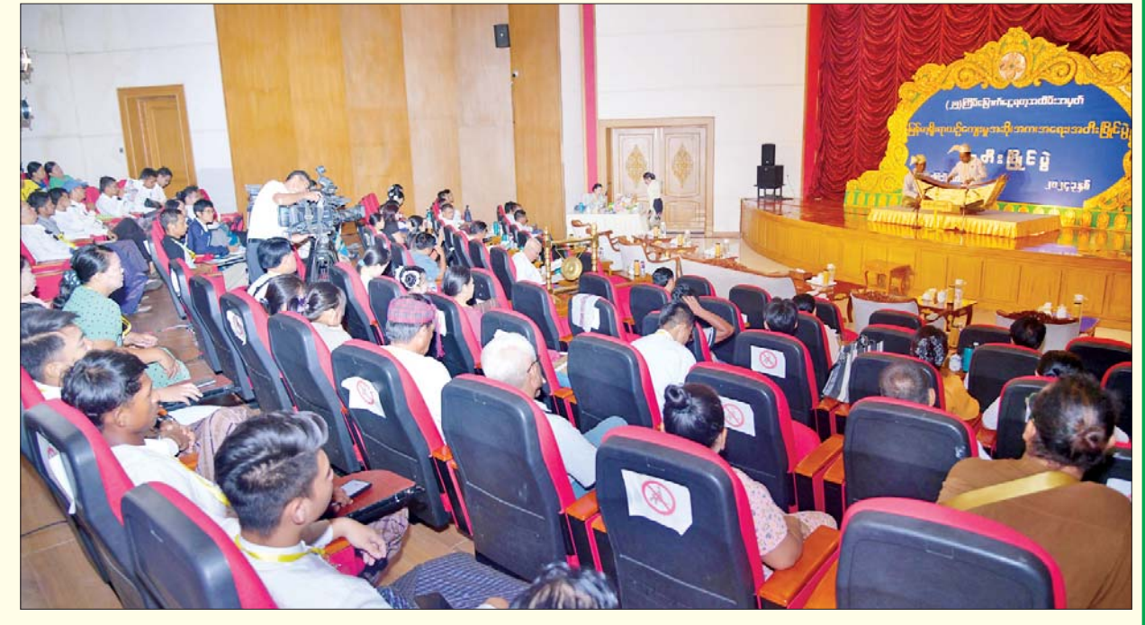
အမျိုးသား ပတ္တလားအတီးပြိုင်ပွဲတွင် စစ်ကိုင်းတိုင်းဒေသကြီးမှ ပြိုင်ပွဲဝင်တစ်ဦး ယှဉ်ပြိုင်မှုကို ပရိသတ်များ ကြည့်ရှုအားပေးစဉ်။