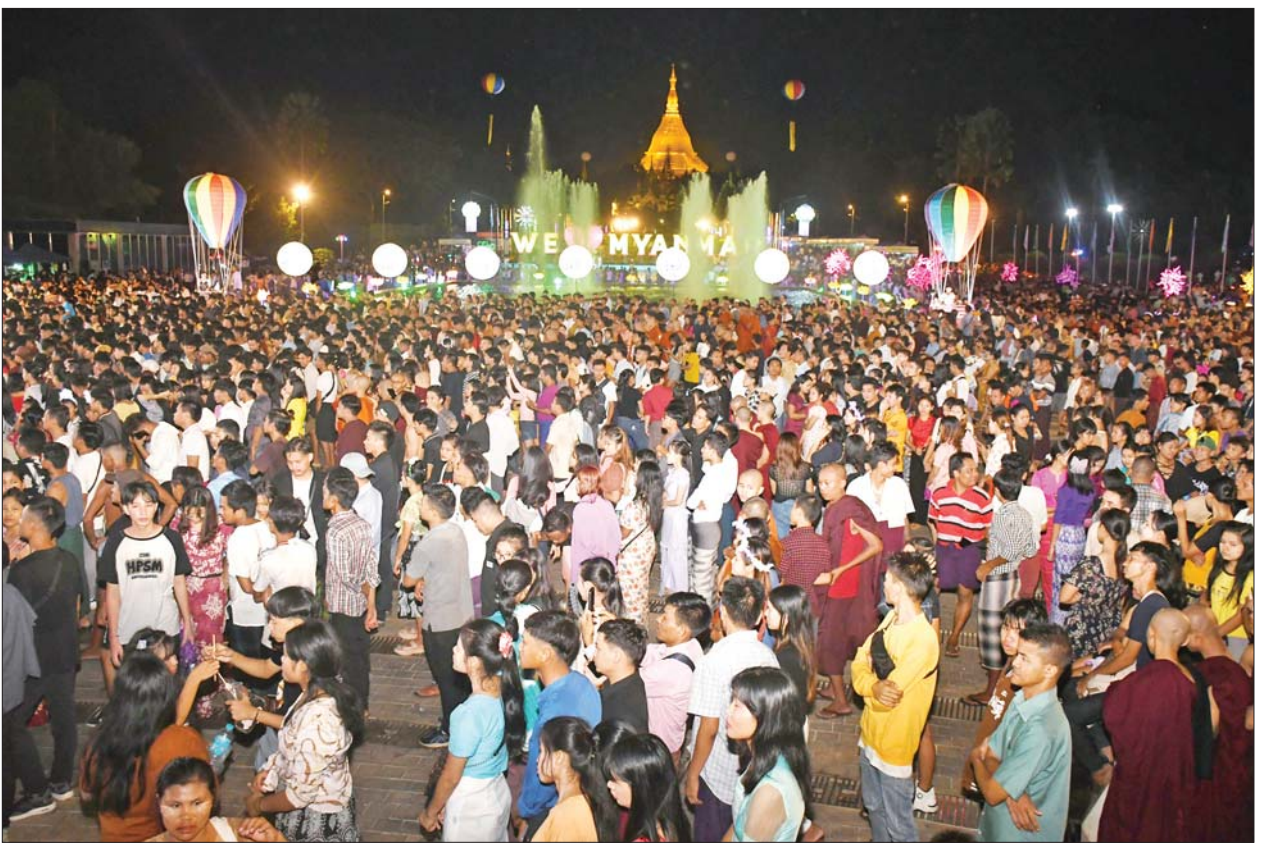
သီတင်းကျွတ်ဈေးရောင်းပွဲတော်နှင့် ဂီတပွဲတော်နောက်ဆုံးရက်တွင် ဈေးလာရောက်ဝယ်ယူသူပြည်သူများ၊ ဂီတပွဲတော်လာရောက်ဆင်နွှဲကြသူလူငယ်များဖြင့် စည်ကားလျက်ရှိသည်ကို တွေ့ရစဉ်။

ဆိုင်၊ သက်ဆိုင်ရာ ခရိုင်အလိုက် ထုတ်ကုန် အရောင်းဆိုင်များ၊ တိုင်းဒေသကြီး / ပြည်နယ်များမှ ဒေသထွက်ကုန် ပစ္စည်းများနှင့် စားသောက်ကုန်ပစ္စည်း အရောင်းဆိုင်များ၊ သုတ/ရသ စာအုပ် အရောင်းဆိုင်များတွင် ပြည်သူများ လာရောက်ဝယ်ယူအားပေးလျက်ရှိကြသည်။ အဆိုပါဆိုင်များတွင် ဈေးရောင်းချသူများထံမှ ဈေးရောင်း ကောင်းကြောင်း၊ တစ်နေ့လျှင် ကျပ်ငါးသိန်းမှ ၁၀ သိန်းဝန်းကျင်ခန့် ရောင်းချရကြောင်း၊ တချို့ဆိုင်များဆိုလျှင် ငွေကျပ် ၁၅ သိန်းအထက်နှင့် သိန်း ၂၀ ဝန်းကျင်ခန့်အထိ ရောင်းချရကြောင်း ၎င်းတို့၏ ပြောပြချက် အရ သိရသည်။ ထိုကဲ့သို့ ဝယ်ယူအားပေးကြသော ပြည်သူများဖြင့် အထူးစည်ကားလျက်ရှိနေမှုများကို ရန်ကုန်တိုင်းဒေသကြီး ဝန်ကြီးချုပ် ဦးစိုးသိန်းနှင့် တိုင်းဒေသကြီး ဝန်ကြီးများက လိုက်လံကြည့်ရှုအားပေးကြပြီး ကိုယ်တိုင်လည်း