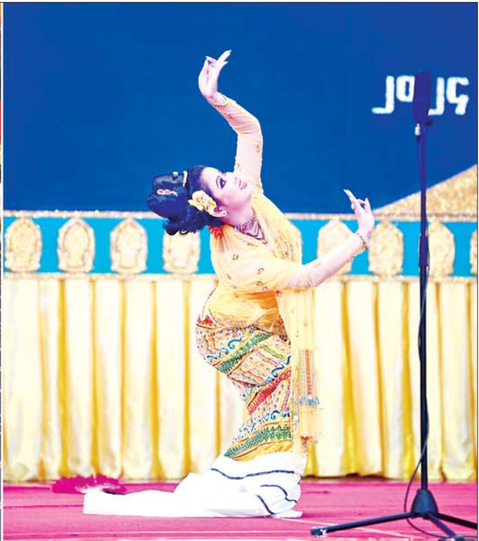
နိုင်ငံတော်စီမံအုပ်ချုပ်ရေးကောင်စီဥက္ကဋ္ဌ နိုင်ငံတော်ဝန်ကြီးချုပ် ဗိုလ်ချုပ်မှူးကြီးမင်းအောင်လှိုင်၊ ဇနီး ဒေါ်ကြူကြူလှနှင့် ဧည့်ပရိသတ်များ ဝါသနာရှင်အဆင့်(ပထမတန်း)အမျိုးသမီးအကပြိုင်ပွဲတွင် ပြိုင်ပွဲဝင်တစ်ဦး ယှဉ်ပြိုင်နေမှုကို ကြည့်ရှုအားပေးစဉ်။