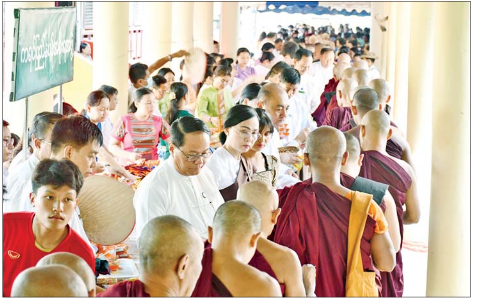
ဝင်များနှင့် ဇနီးများ၊ ဌာနဆိုင်ရာများ၊ ဝတ်ရွတ်စည်ကားသိုက်မြိုက်စွာ ဆီမီးများထွန်းညှိပူဇော်ခဲ့ကြအသင်းအဖွဲ့များ၊ ဒေသခံတိုင်းရင်းသား ပြည်သူများ၊ ကြောင်း သိရသည်။ ရဟန်း၊ ရှင်လှ၊ ဘုရားဖူးပြည်သူများ တက်ရောက်၍ စောမျိုးမင်းသိန်း(ပြန်/ဆက်)

ဆက်လက်၍ သီတင်းကျွတ်လပြည့် အဘိဓမ္မာအခါတော်နေ့တွင် ကရင်ပြည်နယ်အစိုးရအဖွဲ့က ကြီးမှူးကျင်းပသော ဘားအံမြို့ အမှတ် (၁) ရပ်ကွက် သေဋ္ဌမာရ်အောင်ဘုရားကြီးရင်ပြင်တော်၌ ဆီမီး ၉၀၀၀ ဆက်ကပ်ပူဇော်ပွဲကို ညနေ ၇ နာရီခန့်က ကျင်းပရာ ပြည်နယ်ဝန်ကြီးချုပ်၊ ပြည်နယ်တရားလွှတ်တော်တရားသူကြီးချုပ်၊ ပြည်နယ်အစိုးရအဖွဲ့