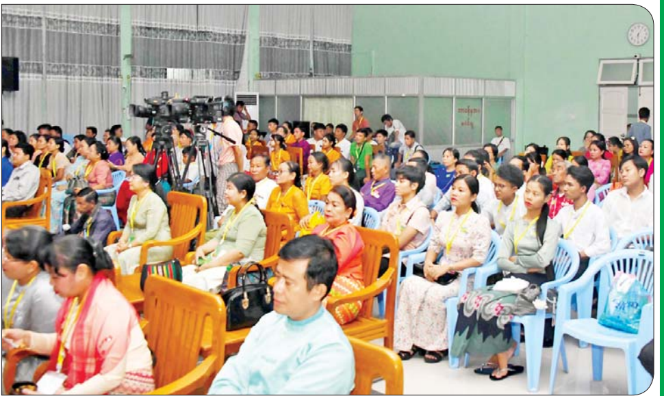
ရုပ်စုံသဘင်အဖွဲ့လိုက်ပြိုင်ပွဲ ဝါသနာရှင်အဆင့်(ပထမတန်း)ပြိုင်ပွဲတွင် “ဝေဿန္တရာ”ဇာတ်တော်ကြီးဖြင့် စစ်ကိုင်းတိုင်းဒေသကြီးကိုယ်စားပြု ရွှေဇေယျာရုပ်စုံသဘင်အဖွဲ့ တင်ဆက်ကပြ ယှဉ်ပြိုင်မှုကို ပရိသတ်များ ကြည့်ရှုအားပေးစဉ်။