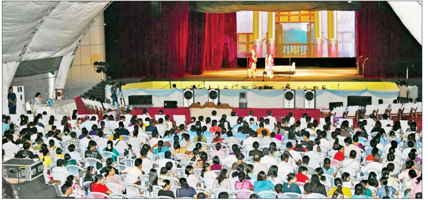
ယှဉ်ပြိုင်မှုအပြီးတွင် နိုင်ငံတော်စီမံအုပ်ချုပ်ရေး ကောင်စီ ဒုတိယဥက္ကဋ္ဌ ဒုတိယဝန်ကြီးချုပ်နှင့် ဇနီး

ဦးစွာ နိုင်ငံတော်စီမံအုပ်ချုပ်ရေးကောင်စီ ဒုတိယ ဥက္ကဋ္ဌ ဒုတိယဝန်ကြီးချုပ်၊ ဇနီးနှင့် အဖွဲ့ဝင်တို့သည် ရန်ကုန်တိုင်းဒေသကြီးကိုယ်စားပြု “ရွှေရန်ကုန်တိုင်း ဇာတ်အလှသဘင်” ဇာတ်တော်ကြီးအဖွဲ့က မူရင်း မဟာဇနကဇာတ်တော်ကြီး တီးလုံးတီးချက် အက အလှများနှင့်အတူ မြန်မာ့ဇာတ်သဘင် ဇာတ်စာ၊ ဇာတ်စကား၊ ဆို၊ ငို၊ ပြော ပညာရပ်များနှင့်ပေါင်းစပ်၍ ယှဉ်ပြိုင်ကပြဖော်ပြမှုကို ကြည့်ရှုအားပေးကြသည်။