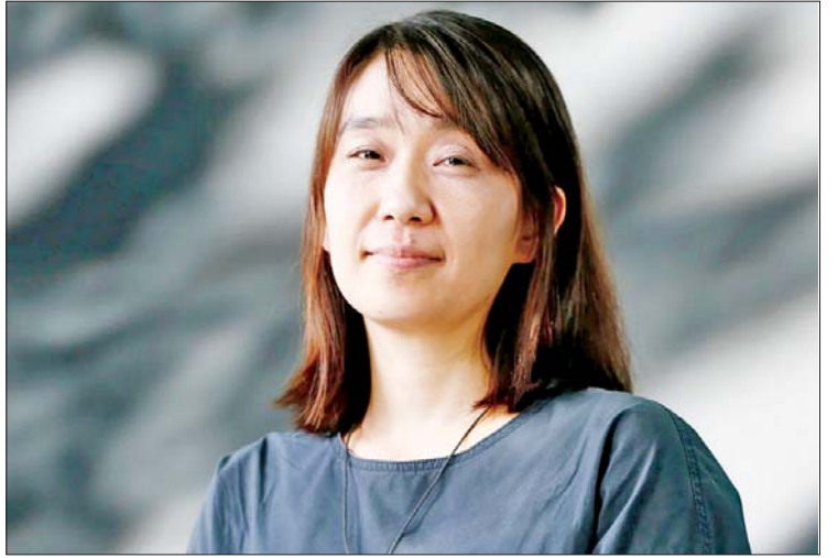
ဒေါ်လာ တစ်သန်းကျော် ချီးမြှင့်မည်ဖြစ် တွင် ကြေညာမည်ဖြစ်ကြောင်း သိရသည်။ ကြောင်းနှင့် ယခုနှစ် ငြိမ်းချမ်းရေး ကိုးကား-အင်န်အိတ်ချီကေ နိုဘယ်ဆုရရှိကို အောက်တိုဘာ ၁၁ ရက် ဘာသာပြန်-အောင်ကျော်ကျော်

ရေးသားထားသည်။ ပြောကြား ထို့ပြင် ဆွီဒင်အကယ်ဒမီသည် စာရေးဆရာမ ဟန်ကန်၏ ၂၀၁၆ ခုနှစ် တွင် ရေးသားထုတ်ဝေခဲ့သည့် “The White Book (ဝမ်းနည်းကြေကွဲမှုကို စူးစမ်းရှာဖွေခြင်း)” စာအုပ်ကိုလည်း ထုတ်ဖော်ပြောကြားခဲ့ကြောင်း သိရသည်။ ဟန်ကန်၏ စာရေးသားမှုပုံစံသည် ခေတ်ပြိုင်စကားပြေလောကတွင် ကဗျာ ဆန်ပြီး ဆန်းသစ်မှုအသွင်ဆောင်လျက် ရှိသည်ဟု ဆွီဒင်အကယ်ဒမီက ပြောကြား သည်။ စာပေဇာနည်ဆုအဖြစ် အမေရိကန်