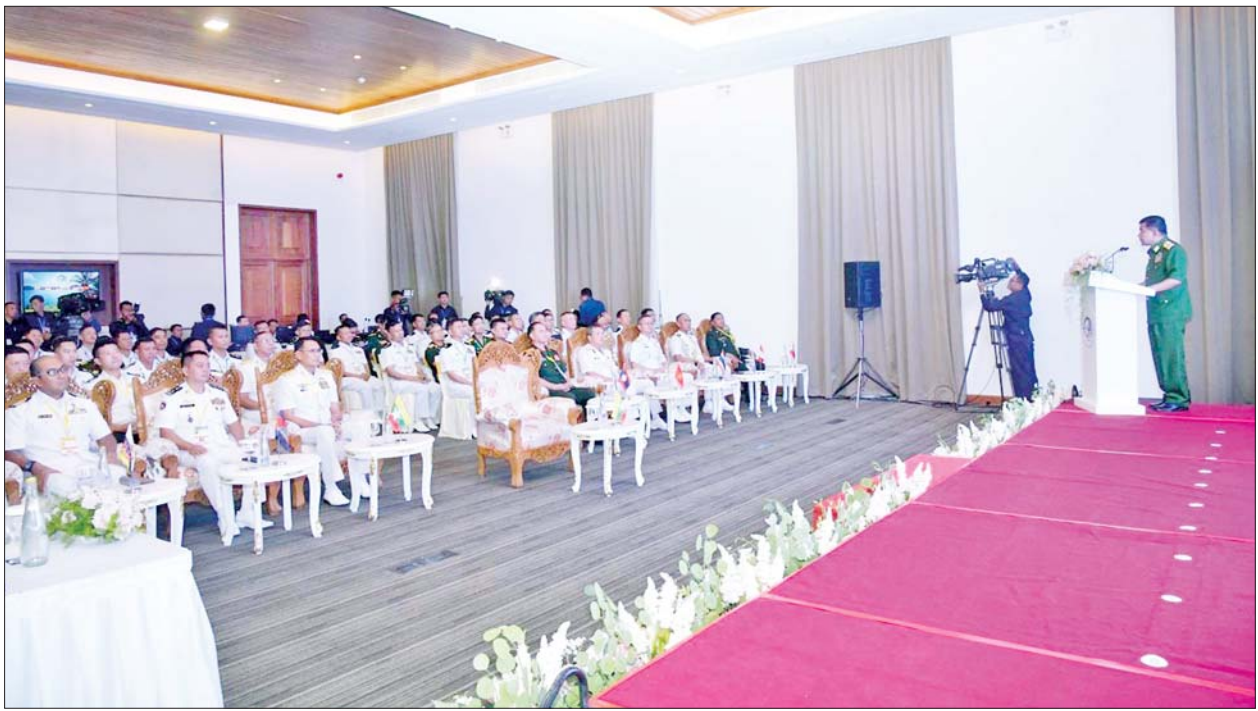
နိုင်ငံတော်စီမံအုပ်ချုပ်ရေးကောင်စီအဖွဲ့ဝင် ညွှန်ကြားရေးမှူး (ကြည်း၊ ရေ လေ) ဗိုလ်ချုပ်ကြီး မောင်မောင်အေး (၁၈)ကြိမ်မြောက် အာဆီယံရေတပ်ဦးစီးချုပ်များအစည်းအဝေး (18 th ASEAN Navy Chiefs' Meeting) ဖွင့်ပွဲအခမ်းအနားတွင် အမှာစကားပြောကြားစဉ်။

ဦးစွာ နိုင်ငံတော်စီမံအုပ်ချုပ်ရေးကောင်စီဥက္ကဋ္ဌ တပ်မတော်ကာကွယ်ရေးဦးစီးချုပ်ကိုယ်စား နိုင်ငံတော်စီမံအုပ်ချုပ်ရေးကောင်စီအဖွဲ့ဝင် ညွှန်ကြားရေးမှူး (ကြည်း၊ ရေလေ) ဗိုလ်ချုပ်ကြီး မောင်မောင်အေးက အဖွင့်အမှာစကားပြောကြားရာတွင် အာဆီယံအဖွဲ့ဝင် နိုင်ငံတစ်နိုင်ငံဖြစ်သည့် မြန်မာနိုင်ငံသည် အာဆီယံနိုင်ငံများနှင့်သာမက အိမ်နီးချင်းနိုင်ငံများနှင့်လည်း ချစ်ကြည်ရင်းနှီးစွာ ပူးပေါင်းဆောင်ရွက်လျက်ရှိကြောင်း၊ ယနေ့ကျင်းပသည့် (၁၈) ကြိမ်မြောက် အာဆီယံရေတပ်ဦးစီးချုပ်များအစည်းအဝေး၏ ရွေးချယ်ထားသည့်ခေါင်းစဉ်မှာ “ငြိမ်းချမ်းကြွယ်ဝသောဒေသဆီသို့ တက်ညီလက်ညီ လှော်ခတ်ခြင်း” ဖြစ်ပြီး မိမိတို့၏ တူညီသောရည်မှန်းချက်အမြင်နှင့် စုပေါင်းစိတ်ဓာတ်ကို အကောင်အထည်ဖော်ရန်ဖြစ်သဖြင့် လက်ရှိအခြေအနေများနှင့် အလွန်လိုက်ဖက်