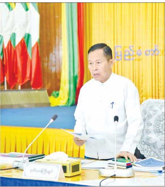
နိုင်ငံတော်စီမံအုပ်ချုပ်ရေးကောင်စီ ဒုတိယဥက္ကဋ္ဌ ဒုတိယဝန်ကြီးချုပ် ဒုတိယဗိုလ်ချုပ်မှူးကြီးစိုးဝင်း အသေးစား၊ အငယ်စားနှင့် အလတ်စားစီးပွားရေးလုပ်ငန်းများ ဖွံ့ဖြိုးတိုးတက်ရေး လုပ်ငန်းကော်မတီအစည်းအဝေး (၂/ ၂၀၂၄) တွင် အမှာစကားပြောကြားစဉ်။