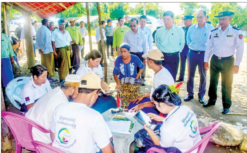
ပြန်လည်ပြုပြင်ခြင်း၊ မြေသားလမ်းများပြုပြင်ခြင်းနှင့် ရေမြောင်းများတူးဖော်ခြင်းတို့ကို သွားရောက်ကြည့်ရှုစစ်ဆေးသည်။ စစ်တွေ-ပလ္လင်ပြင်ကားလမ်းသည် ကျေးရွာပေါင်း ၁၄ ရွာမှ ပြည်သူများဖြတ်သန်းသွားလာလျက်ရှိပြီး လူဦးရေ ၂၀၀၀၀ ကျော်ကို အကျိုးပြုလျက်ရှိကြောင်း သိရသည်။ တင်ထွန်း(ပြန်/ဆက်)

ဌာန ပြည်နယ်ဦးစီးမှူး ဦးစောနိုင်နှင့် တာဝန်ရှိသူများက စစ်တွေမြို့နယ်အတွင်း စာရင်းကောက်ယူနေမှု အခြေအနေများနှင့်ပတ်သက်၍ ရှင်းလင်းတင်ပြကြသည်။ တင်ပြချက်များအပေါ် ပြည်နယ်ဝန်ကြီးချုပ်က လိုအပ်သည်များကို တာဝန်ရှိသူများနှင့် ပေါင်းစပ်ညှိနှိုင်းပေးသည်။ ဆက်လက်၍ ပြည်နယ်ဝန်ကြီးချုပ်နှင့်အဖွဲ့သည် ခေါင်းဒုက္ခာ IDPs စခန်းအတွင်း နေထိုင်သူများအား စာရင်းကောက်ယူရေးအဖွဲ့များက စာရင်းကောက်ယူနေမှုကို လှည့်လည်ကြည့်ရှုအားပေးပြီး စာရင်းကောက်ခံရာတွင် ပူးပေါင်းပါဝင်ကြသည့် ပြည်သူများအား ရင်းရင်းနှီးနှီး တွေ့ဆုံနှုတ်ဆက်သည်။ ဆက်လက်၍ ပြည်နယ်ဝန်ကြီးချုပ်နှင့်အဖွဲ့သည် သက္ကေပြင်ကျေးရွာလမ်းနှင့် စစ်တွေ-ပလ္လင်ပြင်ကားလမ်းအား ပြည်နယ်ဘဏ္ဍာရန်ပုံငွေဖြင့် ကျောက်ချောလမ်းခင်းခြင်း၊ ကွန်ကရစ်လမ်းအား