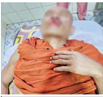
ဖာပွန်မြို့နယ် ရေပူကျေးရွာ အနီး၌ အကြမ်းဖက်သမားများ ထောင် ထားသည့် ဒေသန္တရလက်လုပ်တိုက်မိုင်း တစ်လုံးအား တိုက်ခိုက်မှုကြောင့် သံဃာတော်တစ်ပါး ထိခိုက်ဒဏ်ရာ ရရှိမှုမှတ်တမ်းဓာတ်ပုံ။

တိုက်မိုင်းကြီးအား တိုက်ခိုက် ပေါက်ကွဲမှု ဖြစ်ပွားပြီး ထိခိုက်ဒဏ်ရာများ ရရှိခဲ့ သည်။ အဆိုပါ မိုင်းစထိမှန်ဒဏ်ရာရရှိခဲ့သည့် ဆရာတော်အား လုံခြုံရေးတပ်ဖွဲ့ဝင် များက ကမမောင်းမြို့ ပြည်သူ့ဆေးရုံသို့ ပို့ဆောင်ဆေးကုသမှု ခံယူစေလျက်ရှိ ကြောင်း၊ အကြမ်းဖက်သမားများသည် အများပြည်သူ ဆက်သွယ်အသုံးပြုလျက် ရှိသည့် လမ်းကြောင်းများတွင် ယခုကဲ့သို့ မိုင်းထောင်မှုများကြောင့် ခရီးသွားလာ ရေးတွင် အခက်အခဲများ ဖြစ်ပေါ်စေ သဖြင့် ယင်းလုပ်ရပ်များကို ဒေသခံ ပြည်သူများက ပြင်းထန်စွာဆန့်ကျင် ကန့်ကွက်လျက်ရှိကြောင်းနှင့် လုံခြုံရေး တပ်ဖွဲ့ဝင်များက လိုအပ်သည့် လုံခြုံရေး နှင့် နယ်မြေစိုးမိုးရေးလုပ်ငန်းများကို တိုးမြှင့်ဆောင်ရွက်လျက်ရှိကြောင်း သိရ သည်။ သတင်းစဉ်