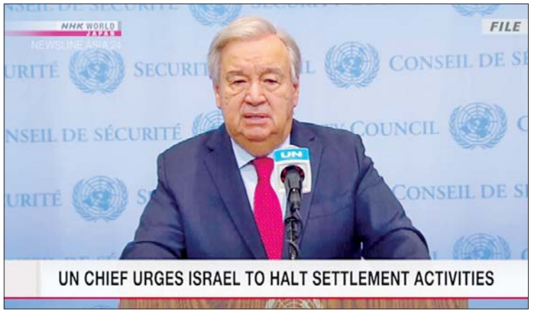
လုံခြုံရေးတပ်ဖွဲ့များ၏ အကြမ်းဖက် ဂူတာရက်စက တိုက်တွန်းခဲ့ကြောင်း မှုများအားလုံးကို သေချာစွာစုံစမ်းစစ်ဆေး သိရသည်။ ကိုးကား - အင်န်အိတ်ချီကေ ရန်လည်း အစ္စရေးအစိုးရအဖွဲ့အား ဘာသာပြန် - အောင်ကျော်ကျော်

ပြောသည်။ အထူးသဖြင့် ပါလက်စတိုင်းပိုင် အဆောက်အအုံပေါင်း ၁၂၇၇ လုံးကို ဖြိုချခဲ့ပြီးနောက် အိမ်ရာယူနစ် ၁၉၅၀၀ ခန့်ပြန်လည်ဆောက်လုပ်ပေးရန် အစီ အစဉ်များကို ဂူတာရက်စက အတည်ပြု ပြောကြားသည်။ ပါလက်စတိုင်း နယ်မြေများအတွင်း၌ အခြေချနေထိုင်ရေး လှုပ်ရှားမှုအားလုံးကို ချက်ချင်းရပ်တန့်ရန်နှင့် ပါလက်စတိုင်း ပြည်သူများအား အကြမ်းဖက်ဖြိုခွင်းခြင်း နှင့် အတင်းအကျပ် နှင့်ထုတ်ခြင်းများကို ရပ်တန့်ရန် ဂူတာရက်စက အစ္စရေး အစိုးရအား တောင်းဆိုခဲ့သည်။ အခြေချနေထိုင်သူများနှင့် အစ္စရေး