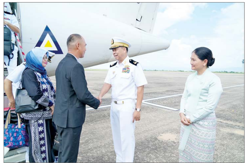
အာဆီယံနိုင်ငံများမှ ရေတပ်ဦးစီးချုပ်များနှင့် ကိုယ်စားလှယ်အဖွဲ့များအား တာဝန်ရှိသူများက နေပြည်တော်လေဆိပ်တွင် ကြိုဆိုနှုတ်ဆက်ကြစဉ်။