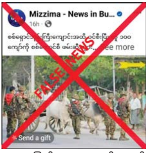
ဒေသခံပြည်သူများ အသွင်ဆောင် ၍ မြို့ရွာများအတွင်း အကြမ်းဖက် လုပ်ရပ်များကို လုပ်ဆောင်နေခြင်း ကြောင့် တာဝန်ရှိသူများနှင့် လုံခြုံ ရေးတပ်ဖွဲ့ဝင်များ ပူးပေါင်း၍ လှည့်ကင်းပတ်ကင်းများ ဆောင် ရွက်ခြင်း၊ ရှောင်တခင်စစ်ဆေး

နေပြည်တော် အောက်တိုဘာ ၁၀ မန္တလေးတိုင်းဒေသကြီး ငါးစွန် မြို့နယ် ညောင်လေးပင် ကျေးရွာ ဘုန်းတော်ကြီးကျောင်း ၌ ယာယီနေရပ်စွန့်ခွာသူ ၁၀၀ ခန့်ကို လုံခြုံရေးတပ်ဖွဲ့ဝင်များက ဖမ်းဆီး ခေါ်ဆောင်သွားကြောင်း သတင်းတူ၊ သတင်းမှားများကို တရားမဝင် ပြည်ဖျက်မီဒီယာများ က မဟုတ်မမှန်လှုံ့ဆော်ဝါဒဖြန့် ဝေနေသည်ကို တွေ့ရှိရသည်။ အဆိုပါသတင်းနှင့် ပတ်သက်၍ လုံခြုံရေးတာဝန်ရှိသူ တစ်ဦး၏ ပြောကြားချက်အရ PDF အမည်ခံ အကြမ်းဖက် သမားများသည်