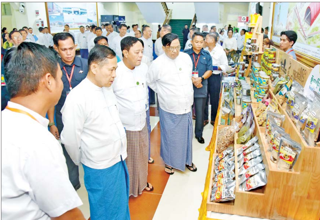
နိုင်ငံတော်စီမံအုပ်ချုပ်ရေးကောင်စီ ဒုတိယဥက္ကဋ္ဌ ဒုတိယဝန်ကြီးချုပ် ဒုတိယဗိုလ်ချုပ်မှူးကြီးစိုးဝင်း ခင်းကျင်းပြသထားသည့် MSME ထုတ်ကုန်ပစ္စည်းများကို လှည့်လည်ကြည့်ရှုစဉ်။

ယနေ့လုပ်ငန်းကော်မတီ၏(၂/၂၀၂၄) ကျင်းပရသည့် ရည်ရွယ်ချက်မှာ နိုင်ငံတော်ဝန်ကြီးချုပ်၏ လမ်းညွှန်မှာကြားချက်များ ဖြစ်သည့် စိုက်ပျိုးမွေးမြူရေးလုပ်ငန်းများ တိုးတက်အောင် ဆောင်ရွက်ခြင်းဖြင့် ကုန်ထုတ်လုပ်မှုနှင့် စက်မှုလုပ်ငန်းများကို ပိုမိုလည်ပတ်နိုင်ပြီး ထိုမှတစ်ဆင့် ဝန်ဆောင်မှုလုပ်ငန်းများလည်း တိုးတက်လာစေရန်နှင့် နိုင်ငံ၏ GDP တိုးတက်လာနိုင်ရေး၊ စားသောက်ကုန်များကိုသာမက အခြား လူသုံးကုန်ပစ္စည်းများကိုလည်း အရည်အသွေးပြည့်မီစွာဖြင့် ပြည်တွင်း၌ လုံလောက်စွာ ထုတ်လုပ်နိုင်ပြီး ပြည်ပမှ တင်သွင်းနေရမှုများကို လျော့ချနိုင်ရေး၊ ပြည်တွင်းထုတ်လုပ်သည့် MSME လုပ်ငန်းများ ဖွံ့ဖြိုးတိုးတက်ရေးအားပေးဆောင်ရွက်သွားနိုင်ရေး၊ အရည်အသွေးမြင့် ချည်မျှင် ရည်ဝါမျိုးများကို အာရုံစိုက်ပြီး စိုက်ပျိုးမှုသည် အဆင့်မီ အထည်အလိပ်ထုတ်လုပ်ခြင်းအထိ ဝါတန်ဖိုး ကွင်းဆက်တစ်ခုလုံး တိုးတက်ကောင်းမွန်လာအောင်ဆောင်ရွက်