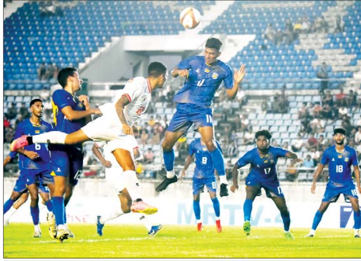
မြန်မာအသင်းနှင့် သီရိလင်္ကာအသင်းတို့ ယှဉ်ပြိုင်ကစားကြစဉ်။