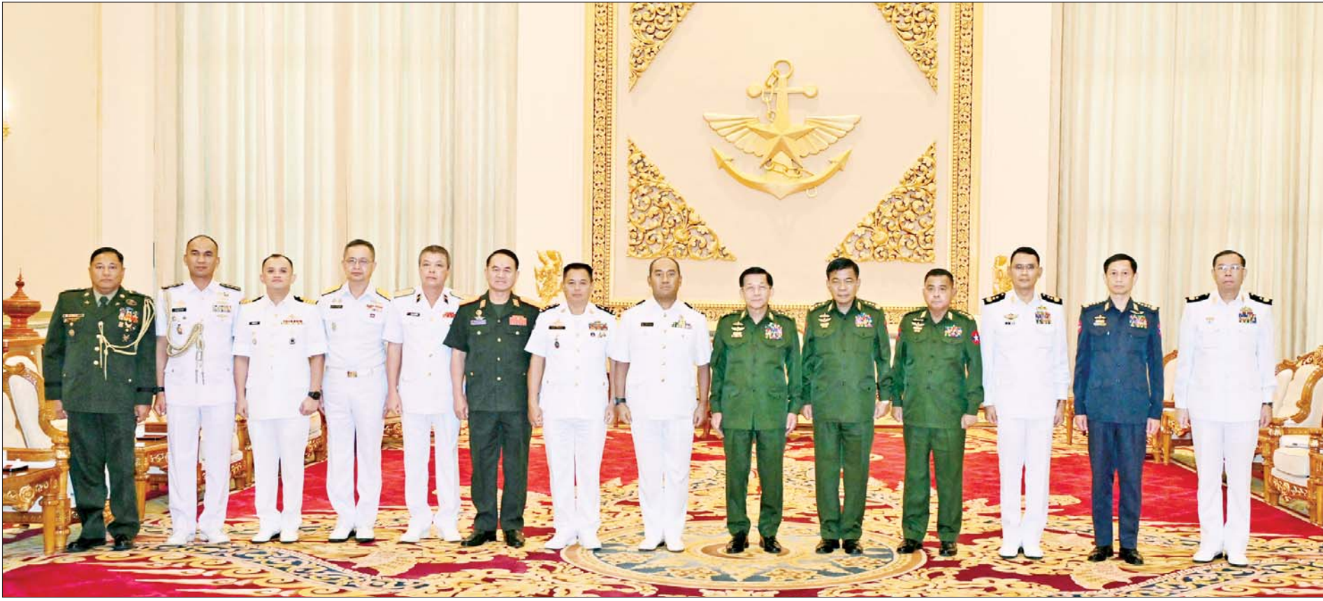
နိုင်ငံတော်စီမံအုပ်ချုပ်ရေးကောင်စီဥက္ကဋ္ဌ တပ်မတော်ကာကွယ်ရေးဦးစီးချုပ် ဗိုလ်ချုပ်မှူးကြီးမင်းအောင်လှိုင်နှင့် ကာကွယ်ရေးဦးစီးချုပ်မှူးမှ အဆင့်မြင့်တပ်မတော်အရာရှိကြီးများ၊ အာဆီယံရေတပ်အကြီးအကဲ များနှင့် ကိုယ်စားလှယ်အဖွဲ့ခေါင်းဆောင်များ စုပေါင်းမှတ်တမ်းတင်ဓာတ်ပုံရိုက်စဉ်။

( ၃-၉-၂၀၂၄ ရက်နေ့တွင် နိုင်ငံတော်စီမံအုပ်ချုပ်ရေးကောင်စီဥက္ကဋ္ဌ နိုင်ငံတော် ဝန်ကြီးချုပ် ဗိုလ်ချုပ်မှူးကြီး မင်းအောင်လှိုင်နှင့် ကာကွယ်ရေးဦးစီးချုပ်မှူးမှ အဆင့်မြင့်တပ်မတော်အရာရှိကြီးများ၊ အာဆီယံရေတပ်အကြီးအကဲ များနှင့် ကိုယ်စားလှယ်အဖွဲ့ခေါင်းဆောင်များ စုပေါင်းမှတ်တမ်းတင်ဓာတ်ပုံရိုက်စဉ်။ )