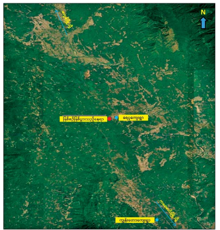
ဖာပွန်မြို့နယ် ရေပူကျေးရွာ အနီး၌ အကြမ်းဖက်သမားများ ထောင် ထားသည့် ဒေသန္တရလက်လုပ်တိုက်မိုင်း တစ်လုံးအား တိုက်ခိုက်မှုကြောင့် သံဃာတော်တစ်ပါး ထိခိုက်ဒဏ်ရာရရှိခဲ့ သည့်နေရာပြပုံ။