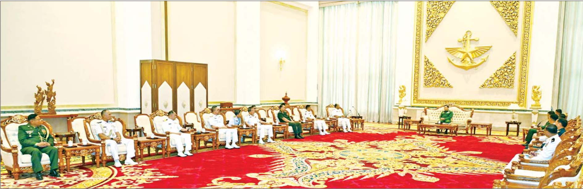
နိုင်ငံတော်စီမံအုပ်ချုပ်ရေးကောင်စီဥက္ကဋ္ဌ တပ်မတော်ကာကွယ်ရေးဦးစီးချုပ် ဗိုလ်ချုပ်မှူးကြီးမင်းအောင်လှိုင်ထံ (၁၈)ကြိမ်မြောက် အာဆီယံရေတပ်ဦးစီးချုပ်များ အစည်းအဝေးသို့ တက်ရောက်မည့် အာဆီယံရေတပ်အကြီးအကဲများနှင့် ကိုယ်စားလှယ်အဖွဲ့ခေါင်းဆောင်များ လာရောက်ဂါရဝပြုတွေ့ဆုံစဉ်။