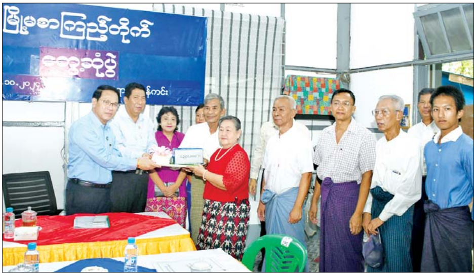
ပြည်ထောင်စုဝန်ကြီး ဦးမောင်မောင်အုန်း ရန်ကင်းမြို့နယ် အမှတ် (၄) ရပ်ကွက်ရှိ မြို့မစာကြည့်တိုက်အတွက် ထောက်ပံ့ငွေနှင့် စာအုပ်စာစောင်များ ပေးအပ်လှူဒါန်းစဉ်။

ဆက်လက်၍ ပြည်ထောင်စုဝန်ကြီး ဦးမောင်မောင်အုန်းသည် ရန်ကင်းမြို့နယ်ရှိ လူမှုရေးရာဝန်ကြီး ဦးဌေးအောင်နှင့်အတူ ရန်ကင်းမြို့နယ် အမှတ် (၄)