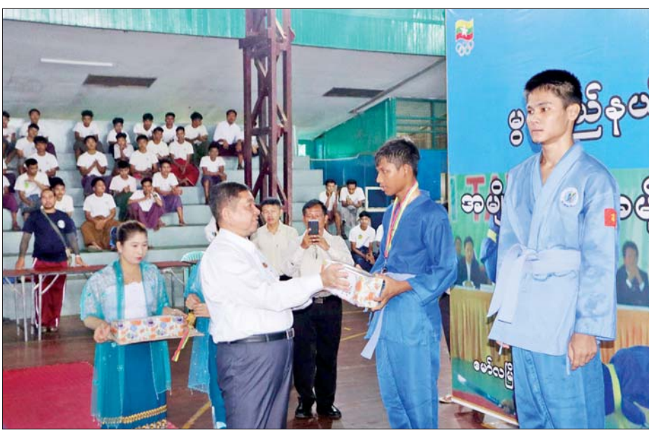
မြန်မာ့သိုင်း ဓားတစ်လက် ပထမ၊ ဒုတိယ၊ တတိယဆု ရရှိ ဗိုလ်ချုပ်အမျိုးသား (၆၀/၆၅ ကီလို အမျိုးသား၊ အမျိုးသမီးပြိုင်ပွဲတွင် သော အားကစားသမားများ၊ တန်း)နှင့် (၅၅/၆၀ ကီလိုတန်း)

မော်လမြိုင် အောက်တိုဘာ ၉ ၂၀၂၄ ခုနှစ် ပဉ္စမအကြိမ် အမျိုးသား အားကစားပွဲတော် ပါဝင်ယှဉ်ပြိုင်နိုင်ရေး မွန်ပြည်နယ်ဝန်ကြီးချုပ်ဖလား အမျိုးသား၊ အမျိုးသမီး မြန်မာ့သိုင်းနှင့် ဗိုလ်ချုပ် ပြိုင်ပွဲ ဗိုလ်လုပွဲနှင့် ဆုပေးပွဲ အခမ်းအနားကို ယနေ့နံနက် ဝိုင်းတွင် မော်လမြိုင်မြို့၊ ပြည်နယ် အားကစားခန်းမ၌ ကျင်းပရာ မွန်ပြည်နယ်ဝန်ကြီးချုပ် ဦးအောင် ကြည်သိန်းနှင့် တာဝန်ရှိသူများ တက်ရောက်၍ သရုပ်ပြသခြင်းနှင့် ဗိုလ်ချုပ်ပြိုင်ပွဲ ဗိုလ်လုပွဲ ဝင်ရောက် ယှဉ်ပြိုင်နေမှုတို့ကို ကြည့်ရှု အားပေးသည်။