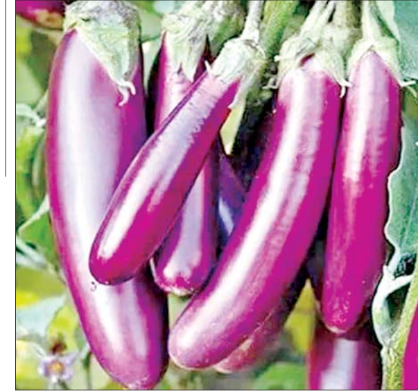
သတင်းရင်းမြစ် - စီးပွား/ကူးသန်း

ခရမ်းသီးစိုက်ပျိုးရာတွင် မျိုးစေ့ကိုပျိုးထောင်ကာ ၄၅ ရက်သားအရွယ်တွင် စိုက်ပျိုး၍ စိုက်ပျိုးပြီး သုံးလခန့်အကြာတွင် အသီးများ စတင်ခူးဆွတ်နိုင်ကြောင်း၊ မျိုးအနေဖြင့် ခရမ်းသီး-၅၅၅ မျိုးနှင့် မြူပဲခရမ်းမျိုးများကို စိုက်ပျိုးကြပြီး စိုက်ပျိုးမှုအတွက် မျိုး၊ သွင်းအားစု၊ လုပ်သားခအပါအဝင် တစ်ဧကလျှင် စုစုပေါင်းငွေကျပ် ရှစ်သိန်းခန့် ကုန်ကျကြောင်း၊ ခရမ်းသီးကို လေးရက်ခြားတစ်ကြိမ် ခူးဆွတ်ရပြီး ခရမ်းသီးများ လှိုင်လှိုင်ထွက်ပေါ်ချိန်တွင် အထွက်နှုန်းပိုလာကြောင်း၊ အထွက်နှုန်းအနေဖြင့် တစ်ပတ်လျှင် ပိဿာချိန် ၃၀၀-၄၀၀ အထိ ထွက်ရှိ၍ ခရမ်းပင်သက်တမ်း ၄-၅ လခန့်အထိ ခူးဆွတ်နိုင်ပြီး မြေအနေအထားနှင့် သီးနှံဖြစ်ထွန်းအောင်မြင်မှုအပေါ်မူတည်၍ အထွက်နှုန်းများ ကွာခြားမှုရှိကြောင်း၊ ဈေးနှုန်းဈေးကွက်အနေဖြင့် ကုန်စိမ်းပွားများက စိုက်ခင်းအထိ လာရောက်ဝယ်ယူကြပြီး ခရမ်းသီးတစ်ပိဿာလျှင် လက်ကားဈေးကျပ် ၂၅၀၊ လက်လီဈေး ငွေကျပ် ၃၀၀-၃၅၀ ဖြင့် ရောင်းချရကြောင်း၊ တစ်ဧကလျှင် ငွေကျပ် ၁၀ သိန်းခန့်အမြတ်ရရှိရာ ခရမ်းသီးစိုက် တောင်သူများအနေဖြင့် ခရမ်းသီးဈေးကောင်းရရှိသောကြောင့် အဆင်ပြေလျက်ရှိကြောင်း သိရသည်။