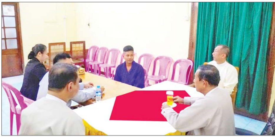
မြန်မာနိုင်ငံအမျိုးသားလူ့အခွင့်အရေးကော်မရှင်မှ အင်းစိန်ပဟိုအကျဉ်းထောင်အား ကြည့်ရှုစစ်ဆေး စဉ် လွတ်လပ်စွာတွေ့ဆုံတင်ပြခွင့် တောင်းခံသူ အကျဉ်းသားအား လက်ခံတွေ့ဆုံစဉ်။

နေပြည်တော် အောက်တိုဘာ ၉ မြန်မာနိုင်ငံ အမျိုးသားလူ့အခွင့်အရေး ကော်မရှင်ဥက္ကဋ္ဌ ဦးပေါ်လွင်စိန် ဦးဆောင်သော ကြည့်ရှုစစ်ဆေးရေးအဖွဲ့သည် ကော်မရှင်ဥပဒေပုဒ်မ ၄၃၊ ၄၄ ပြဋ္ဌာန်းချက်နှင့်အညီ အောက်တိုဘာ ၇ ရက် မှ ၉ ရက်အထိ ရန်ကုန်တိုင်းဒေသကြီး အင်းစိန် မြို့နယ်ရှိအင်းစိန်ပဟိုအကျဉ်းထောင်ကို သွားရောက် ကြည့်ရှုစစ်ဆေးသည်။