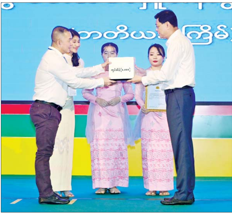
နိုင်ငံတော်စီမံအုပ်ချုပ်ရေးကောင်စီအဖွဲ့ဝင် ဗိုလ်ချုပ်ကြီး မြထွန်းဦးထံ စေတနာရှင်၊ အလှူရှင်များက အလှူငွေ ပေးအပ်လှူဒါန်းစဉ်။

ရေဘေးသင့်ခဲ့ရသည့် ဒေသ များ၌ ပြန်လည်ထူထောင်ရေး လုပ်ငန်းများ ဆောင်ရွက်ရာတွင် အလှူရှင်များ အနေဖြင့်လည်း ယခုကဲ့သို့ တစ်ဖက်တစ်လမ်းမှ ပါဝင် လှူဒါန်းပေးခြင်းကြောင့် လုပ်ငန်းများ ပိုမိုမြန်ဆန်စွာဖြင့် ပြီးမြောက်နိုင်မည်ဖြစ်ကြောင်း၊ လက်ရှိအချိန်အထိ ရေဘေးသင့် ပြည်သူများအတွက် လှူဒါန်းငွေ စုစုပေါင်းမှာ ငွေကျပ် ဘီလီယံ ၅၀ ကျော်ရှိပြီဖြစ်ကြောင်း၊ နိုင်ငံတော် အနေဖြင့် နှစ်စဉ်ဖြစ်ပေါ်လာခဲ့ သည့် သဘာဝဘေးအန္တရာယ်များ နှင့်ပတ်သက်၍ လိုအပ်သည့် ပြန်လည်ထူထောင်ရေးလုပ်ငန်း များကို ဆောင်ရွက်ပေးလျက်ရှိ ကြောင်း၊ လက်ရှိအချိန်တွင် အင်းလေးကန်၌ ရေကျဆင်းမှု မရှိသေးကြောင်း၊ အလားတူ လောပိတနှင့်အထက်ပေါင်းလောင်း တို့တွင်လည်း ရေဝင်ရောက်မှု