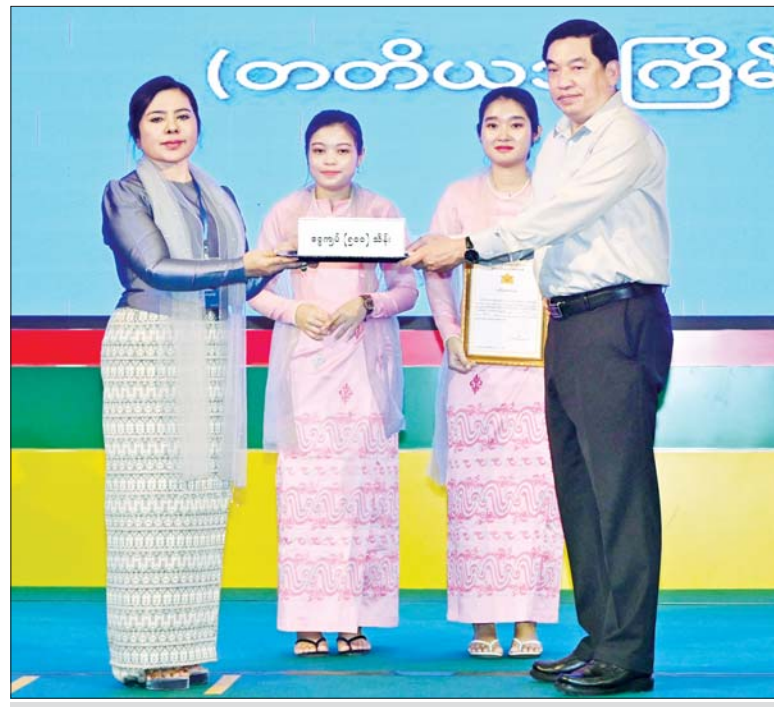
နိုင်ငံတော်စီမံအုပ်ချုပ်ရေးကောင်စီအဖွဲ့ဝင် ဗိုလ်ချုပ်ကြီး ညိုစောထံ စေတနာရှင်၊ အလှူရှင်တစ်ဦးက အလှူငွေ ပေးအပ်လှူဒါန်းစဉ်။

များပြားနေသောကြောင့် လျှပ်စစ် ဓာတ်အားထုတ်လုပ်ခြင်းများကို လုပ်ဆောင်၍ မရသေးကြောင်း၊ မိမိတို့အနေဖြင့် ပြန်လည် ထူထောင်ရေး လုပ်ငန်းများနှင့် ပတ်သက်၍ အချိန်ယူ၍ဆောင် ရွက်သွားရမည် ဖြစ်ကြောင်း၊ မိုးများသည်ထန်စွာ ရွာသွန်းခဲ့ချိန် တွင် ဆည်မြောင်းများအတွင်း ရေများ ဝင်ရောက်လျက်ရှိခြင်း ကြောင့် စိုက်ပျိုးရေးအတွက် လိုလောက်စွာ ရရှိနိုင်မည်ဖြစ် ကြောင်း၊ ထိခိုက်ပျက်စီးခဲ့ရသည့် စိုက်ပျိုးရေးလုပ်ငန်းများအတွက် လိုအပ်သည့် အရင်းအနှီးများကို နိုင်ငံတော်မှ ဆောင်ရွက်ပေးလျက် ရှိသကဲ့သို့ တက်ရောက်လာကြ သည့် စေတနာရှင်၊ အလှူရှင်များ အနေဖြင့်လည်း တတ်နိုင်သည့် ဘက်မှ ဝင်ရောက်ရင်းနှီးမြှုပ်နှံမှု များကို ဆောင်ရွက်ပေးကြရန် မေတ္တာရပ်ခံလိုပါကြောင်း၊ ထိုသို့ ဆောင်ရွက်နိုင်မည် ဆိုပါက ထိခိုက်ခဲ့ရသည့် စိုက်ပျိုးရေး လုပ်ငန်းများ ပြန်လည်လည်ပတ် နိုင်မည်ဖြစ်သကဲ့သို့ ကုန်ထုတ် လုပ်မှုများကိုလည်း ဆောင်ရွက်