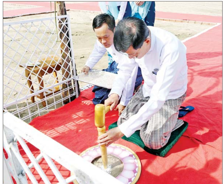
နိုင်ငံတော်စီမံအုပ်ချုပ်ရေးကောင်စီအဖွဲ့ဝင် ဗိုလ်ချုပ်ကြီး မြထွန်းဦး သတ်မှတ်နေရာ၌ ပန္နက်တော်တင်စဉ်။

ဦးစွာ အခမ်းအနားမှူးက မင်္ဂလာအခါတော် စာတမ်းကို ဖတ်ကြားပြီး မင်္ဂလာအချိန်တွင် နိုင်ငံတော် စီမံအုပ်ချုပ်ရေးကောင်စီဥက္ကဋ္ဌ နိုင်ငံတော်ဝန်ကြီးချုပ်က စာဆိုဗိမာန်အဆောက်အဦတည်ဆောက်မည့် ဗဟိုနေရာ၌ ရတနာပန္နက်တော်တင်ကို စိုက်ထူပေးပြီး အမွှေးနံ့သာရည်များဖြင့် ပက်ဖျန်းပေးသည်။