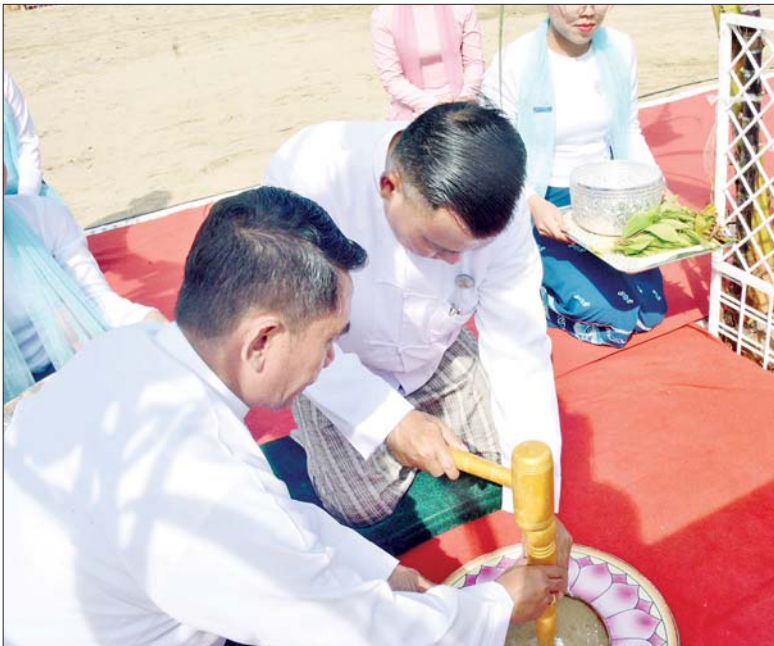
နိုင်ငံတော်စီမံအုပ်ချုပ်ရေးကောင်စီတွဲဖက်အတွင်းရေးမှူး ဗိုလ်ချုပ်ကြီး ရဲဝင်းဦး သတ်မှတ်နေရာ၌ ပန္နက်တော်တင်စဉ်။

တက်ရောက် အခမ်းအနားသို့ နိုင်ငံတော်စီမံအုပ်ချုပ်ရေးကောင်စီ ဥက္ကဋ္ဌ နိုင်ငံတော် ဝန်ကြီးချုပ်နှင့်အတူ ကောင်စီတွဲဖက်အတွင်းရေးမှူး ဗိုလ်ချုပ်ကြီးရဲဝင်းဦး၊ ကောင်စီအဖွဲ့ဝင်များ၊ ပြည်ထောင်စုအဆင့် ပုဂ္ဂိုလ်များ၊ ရန်ကုန်တိုင်းဒေသကြီး ဝန်ကြီးချုပ်၊ ကာကွယ်ရေးဦးစီးချုပ်ရုံးမှ အဆင့်မြင့်တပ်မတော် အရာရှိကြီးများ၊ ရန်ကုန်တိုင်းစစ်ဌာနချုပ်တိုင်းမှူး၊ ရန်ကုန်မြို့တော်ဝန်နှင့် ရန်ကုန်တိုင်းဒေသကြီး ဝန်ကြီးများ၊ မြန်မာနိုင်ငံဆိုင်ရာ အိန္ဒိယနိုင်ငံ သံအမတ်ကြီး H.E. Mr. Abhay Thakuri မြန်မာ-အိန္ဒိယ ချစ်ကြည်ရေးအသင်းမှ တာဝန်ရှိသူများ၊ အမျိုးသားစာပေ တစ်သက်တာဆုရ စာရေးဆရာကြီးများနှင့် ဆရာမကြီးများ၊ ဖိတ်ကြားထားသည့် ဧည့်သည်တော်များနှင့် ဌာနဆိုင်ရာတာဝန်ရှိသူများ တက်ရောက်ကြသည်။