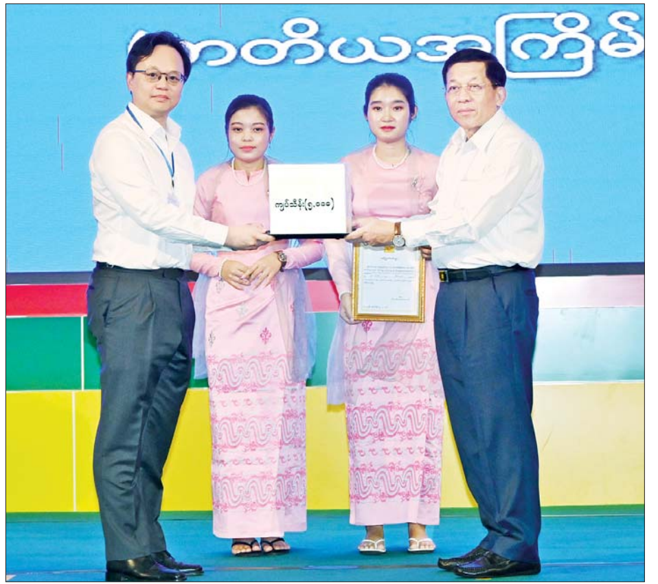
နိုင်ငံတော်စီမံအုပ်ချုပ်ရေးကောင်စီဥက္ကဋ္ဌ နိုင်ငံတော်ဝန်ကြီးချုပ် ဗိုလ်ချုပ်မှူးကြီးမင်းအောင်လှိုင်ထံ စေတနာရှင်၊ အလှူရှင်တစ်ဦးက ရေဘေးဒဏ်သင့်ခဲ့ရသည့်ဒေသများ၌ ကူညီကယ်ဆယ်ရေးနှင့် ပြန်လည် ထူထောင်ရေးလုပ်ငန်းများ ဆောင်ရွက်ရန်အတွက် အလှူငွေပေးအပ်လှူဒါန်းစဉ်။

ကြောင့် ရေကြီးရေလျှံမှုသဘာဝ ဘေးဖြစ်ပေါ်ခဲ့မှု အခြေအနေများ နှင့် ပြန်လည်ထူထောင်ရေး လုပ်ငန်းများအမြန်ဆုံးဆောင်ရွက် ပေးနိုင်ရေး လိုက်လံကြည့်ရှု စစ်ဆေးခဲ့သည့် အခြေအနေများ ကို ရှင်းလင်းပြောကြားသည်။ ဆက်လက် ပြောကြားရာတွင် ထိုကဲ့သို့သော သဘာဝဘေး အန္တရာယ်ကြုံတွေ့ခဲ့မှုကို ပြန်လည် ထူထောင်ရေးလုပ်ငန်းများ အရှိန် အဟုန်ဖြင့် ပြန်လည်ဆောင်ရွက် ပေးသွားရမည် ဖြစ်ကြောင်း၊ နိုင်ငံတော်အစိုးရမှ အင်တိုက်အား တိုက်ဆောင်ရွက်လျက်ရှိသကဲ့သို့ စေတနာရှင် အလှူရှင်များအနေ ဖြင့် တတ်နိုင်သရွေ့ လှူဒါန်းခြင်း များ၊ ကူညီကယ်ဆယ်ရေးလုပ်ငန်း များ ဆောင်ရွက်ပေးလျက်ရှိကြ ကြောင်း၊ ရေဘေးဒဏ်သင့်ခဲ့ရ သည့် ဒေသများ၌ ကူညီကယ်ဆယ် ရေးနှင့် ပြန်လည်ထူထောင်ရေး လုပ်ငန်းများ အင်တိုက်အားတိုက် ဖြင့် အမြန်ဆုံးဆောင်ရွက်နိုင်ရန် အတွက် အလှူငွေပေးအပ်ပွဲများ ဆောင်ရွက်ခဲ့ရာတွင် ပထမအကြိမ် ၌ ငွေကျပ် ၃၂ ဘီလီယံကျော် ရရှိ ခဲ့ပြီး ဒုတိယအကြိမ်တွင် ငွေကျပ် ၁၀ ဘီလီယံကျော် ရရှိခဲ့ ကြောင်း၊ စေတနာရှင်အလှူရှင် များအနေဖြင့်လည်း အခက်အခဲ များကြားမှ လှူဒါန်းခဲ့ကြခြင်း ဖြစ်ပြီး ထင်မှတ်မထားလောက် သည့် များပြားသော အလှူငွေ