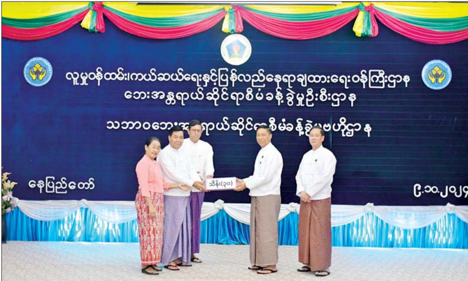
(၂၀၁၁-၂၀၁၆) ဒုတိယဝန်ကြီး နိုင်ငံအေးဆန်ပွဲရုံ သားသမီးမြေး (အငြိမ်းစား) များက ငွေကျပ်သိန်း မိသားစု၊ ကာယဉာဏလုပ်သား ၃၀၊ လမ်းမတော် အမှတ်(၆) များနှင့် ရောင်းသူဝယ်သူများက ၅၀၀ နှင့် Money King Company Limited က ငွေ ကျပ် သိန်း ၁၀၀ စုစုပေါင်းငွေကျပ် သိန်း ၆၃၀ ကို ပေးအပ်လှူဒါန်းခဲ့ ကြောင်း သိရသည်။ သတင်းစဉ်

နေပြည်တော် အောက်တိုဘာ ၉ ရေဘေးဒဏ် ခံစားရသော ဒေသများအတွက် အလှူငွေ ပေးအပ်လှူဒါန်းခြင်း အခမ်းအနား ကို လူမှုဝန်ထမ်း၊ ကယ်ဆယ်ရေး နှင့် ပြန်လည်နေရာချထားရေး ဝန်ကြီးဌာန ဘေးအန္တရာယ် ဆိုင်ရာ စီမံခန့်ခွဲမှုဗဟိုဌာန အစည်းအဝေးခန်းမ၌ ယနေ့ မွန်းလွဲပိုင်းက ကျင်းပရာ လူမှု ဝန်ထမ်း၊ ကယ်ဆယ်ရေးနှင့် ပြန်လည်နေရာချထားရေးဝန်ကြီး ဌာန ပြည်ထောင်စုဝန်ကြီး ဒေါက်တာစိုးဝင်း တက်ရောက်၍ အလှူငွေများ လက်ခံရယူပြီး ကျေးဇူးတင်စကားပြောကြားကာ ဂုဏ်ပြုမှတ်တမ်းလွှာများ ပြန် လည်ပေးအပ်သည်။ အဆိုပါ အခမ်းအနားတွင်