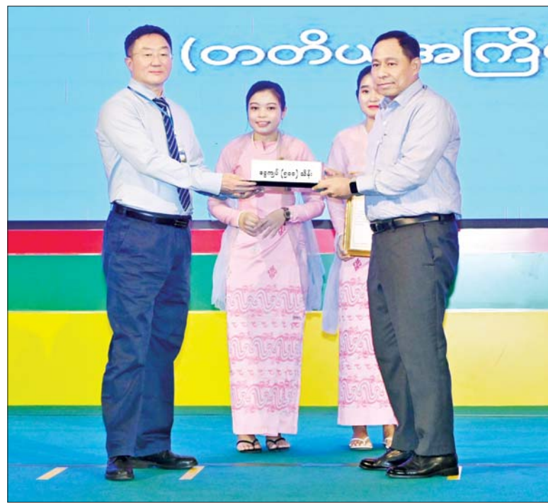
နိုင်ငံတော်စီမံအုပ်ချုပ်ရေးကောင်စီအဖွဲ့ဝင် ဒုတိယဗိုလ်ချုပ်ကြီး ရာပြည့်ထံ စေတနာ ရှင်၊ အလှူရှင်တစ်ဦးက အလှူငွေ ပေးအပ်လှူဒါန်းစဉ်။