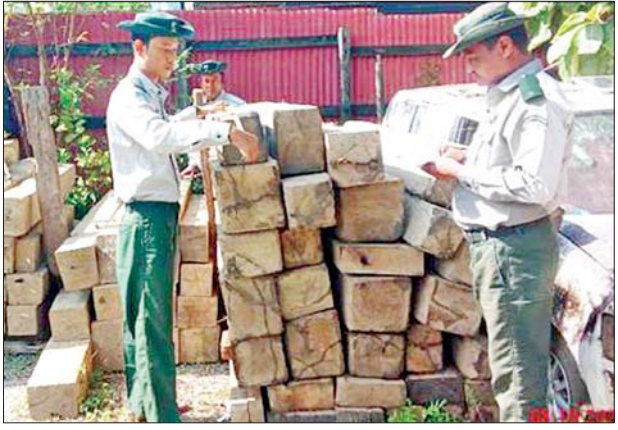
ပဲခူးတိုင်းဒေသကြီး၌ ဖမ်းဆီးရမိမှု။

နေပြည်တော် အောက်တိုဘာ ၉ အကောက်ခွန်ဦးစီးဌာန၏ စီမံ ခန့်ခွဲမှုဖြင့် တာဝန်ကျပူးပေါင်း အဖွဲ့များက အောက်တိုဘာ ၈ ရက်တွင် စစ်ဆေးမှုများ ဆောင်ရွက်ခဲ့ရာ မရမ်းချောင်း အမြဲတမ်းစစ်ဆေးရေး စခန်း၌ ဘားအံမြို့မှ ရန်ကုန်မြို့သို့ မောင်းနှင်လာသည့် ယာဉ်တစ်စီး ပေါ်မှ တရားဝင်စာရွက်စာတမ်း အထောက်အထား တင်ပြနိုင်ခြင်း မရှိသည့် စားသောက်ကုန်ပစ္စည်း တစ်မျိုး၊ လူသုံးကုန်ပစ္စည်း တစ်မျိုး (ခန့်မှန်းတန်ဖိုးငွေကျပ် ၆၉၀၀၀၀)နှင့် အဆိုပါပစ္စည်းများ တင်ဆောင်လာသည့် Yutong Bus တစ်စီး (ခန့်မှန်းတန်ဖိုးငွေ ကျပ် ၇၀၀၀၀၀) ကိုလည်းကောင်း၊ မြန်မာ့စက်မှုဆိပ်ကမ်း၌ ကုန်သေတ္တာ ခြောက်လုံးအတွင်း မှ တရားဝင်စာရွက်စာတမ်း အထောက်အထား တင်ပြနိုင်ခြင်း မရှိသည့် လုပ်ငန်းသုံးပစ္စည်း နှစ်မျိုး (ခန့်မှန်းတန်ဖိုးငွေကျပ် ၉၉၃၉၅၈၀)ကို လည်းကောင်း၊ အေးရှားဝေါလ် ကုန်သေတ္တာ စစ်ဆေးရေးစခန်း၌ ကုန်သေတ္တာ ၁၀ လုံးအတွင်းမှ တရားဝင် စာရွက်စာတမ်းအထောက်အထား တင်ပြနိုင်ခြင်းမရှိသည့် လုပ်ငန်း သုံးပစ္စည်းနှစ်မျိုး (ခန့်မှန်းတန်ဖိုး ငွေ ၁၈၀၃၃၂၃၄ ကျပ်)ကိုလည်း ကောင်း စုစုပေါင်းခန့်မှန်း တန်ဖိုးငွေ ၃၅၆၅၂၄၉၁၄ ကျပ်ကို သိမ်းဆည်းရမိခဲ့ပြီး အကောက်ခွန်