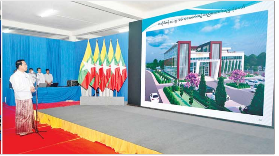
နိုင်ငံတော်စီမံအုပ်ချုပ်ရေးကောင်စီဥက္ကဋ္ဌ နိုင်ငံတော်ဝန်ကြီးချုပ် ဗိုလ်ချုပ်မှူးကြီးမင်းအောင်လှိုင်အား ပြည်ထောင်စုဝန်ကြီး ဦးမောင်မောင်အုန်းက စာဆိုဗိမာန်သုံးထပ်အဆောက်အအုံ တည်ဆောက်ခြင်းနှင့် ပတ်သက်၍ ရှင်းလင်းတင်ပြစဉ်။

* စာမျက်နှာ ၅ မှ တည်ဆောက်သွားမည့် အခြေအနေများ၊ အဆောက်အအုံအား စနစ်တကျ တည်ဆောက်နိုင်ရေး ကော်မတီများ ဖွဲ့စည်းဆောင်ရွက် ထားရှိမှုအခြေအနေများ၊ စာဆိုဗိမာန်အား အထပ်အလိုက် ပြခန်းများ ခင်းကျင်းပြသသွား မည့် အခြေအနေများနှင့် ယခင် အဆောက်အအုံအား စာပေဗိမာန် ပြည်သူ့ စာကြည့်တိုက်အဖြစ် ပြင်ဆင် ဆောင်ရွက်သွားမည့် အခြေအနေများနှင့် ပတ်သက်၍ ရှင်းလင်းတင်ပြသည်။