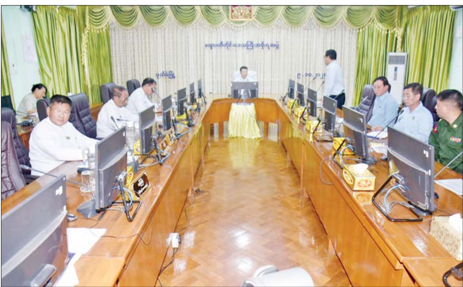
ပတ်သက်၍ သက်ဆိုင်ရာဌာနများက အချိတ်အဆက် ၏ တင်ပြချက်များအပေါ် လိုအပ်သည်များ ပေါင်းစပ် မိမိဖြင့် စုပေါင်းဆောင်ရွက်ရမည်ဖြစ်ပါကြောင်း ညှိနှိုင်းဆောင်ရွက်ပေးခဲ့ကြောင်း သိရသည်။ ဖြည့်စွက်မှာကြားခဲ့ပြီး သက်ဆိုင်ရာတာဝန်ရှိသူများ တိုင်းဒေသကြီး(ပြန်/ဆက်)

အနေအထားများနှင့် လေယာဉ်ခရီးစဉ်ပြေးဆွဲမည့် အစီအစဉ်များ၊ စစ်အင်ဂျင်နီယာညွှန်ကြားရေးမှူးရုံး မှ တာဝန်ရှိသူတစ်ဦးက ၂၀၂၄-၂၀၂၅ ဘဏ္ဍာနှစ် တွင် ဆောင်ရွက်မည့် ပုသိမ်လေယာဉ်ကွင်း အဆင့် မြှင့်တင်ခြင်းလုပ်ငန်းများ၊ ပုသိမ်လေယာဉ်ကွင်း၊ အဆောက်အအုံနှင့် ဆက်စပ်လုပ်ငန်းများ ဆောင်ရွက် မည့်အစီအမံများကို ရှင်းလင်းတင်ပြခဲ့ရာ တိုင်းဒေသ ကြီးဝန်ကြီးချုပ် ဦးတင်မောင်ဝင်းက ပုသိမ်လေဆိပ် သို့ ခရီးသည်လေယာဉ်များပြေးဆွဲရာတွင် လုံခြုံရေး ကိုလည်း အထူးဂရုပြုဆောင်ရွက်ရန် လိုကြောင်း၊ ခရီးသည်များအား လိုအပ်မည့်ဝန်ဆောင်မှုများ ပေးရန်လိုကြောင်း၊ ခရီးသည်လေယာဉ်များ ပြေးဆွဲ မှုများအား အများပြည်သူ ကျယ်ကျယ်ပြန့်ပြန့် သိရှိ နိုင်ရန်လိုပါကြောင်းနှင့် လေယာဉ်ခရီးစဉ်နှင့်