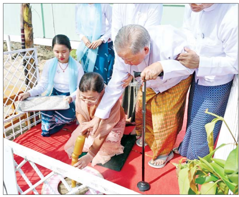
အမျိုးသားစာပေ တစ်သက်တာဆုရ စာရေးဆရာမကြီး မစန္ဒာနှင့်အဖွဲ့ သတ်မှတ်နေရာ၌ ပန္နက်တော်တင်စဉ်။

အမွှေးနံ့သာရည်ပက်ဖျန်းပေး ယင်းနောက် တက်ရောက်လာကြသည့် ကောင်စီတွဲဖက်အတွင်းရေးမှူးနှင့် ပြည်ထောင်စုအဆင့် ပုဂ္ဂိုလ်များ၊ ပြည်ထောင်စုဝန်ကြီးများ၊ ရန်ကုန်တိုင်းဒေသကြီး ဝန်ကြီးချုပ်၊ မြန်မာနိုင်ငံဆိုင်ရာ အိန္ဒိယနိုင်ငံ သံအမတ်ကြီးနှင့် အမျိုးသားစာပေ တစ်သက်တာဆုရ စာရေးဆရာကြီး၊ ဆရာမကြီးတို့က သတ်မှတ်နေရာများ၌ အစီအစဉ်အတိုင်း ပန္နက်တော်