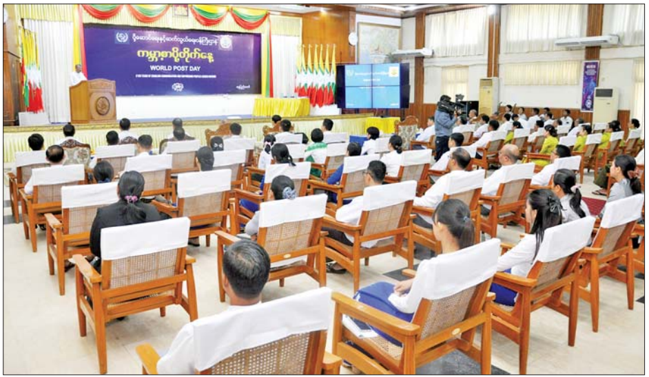
အခမ်းအနားအပြီးတွင် ဒုတိယဝန်ကြီးများသည် စာပို့တိုက်နေ့ အထိမ်းအမှတ်ပြခန်းကို ကြည့်ရှုအားပေး အခမ်းအနားသို့ တက်ရောက်လာကြသူများကို ခွဲကြကြောင်း သိရသည်။ သတင်းစဉ်

ထို့နောက် ဆွစ်ဇာလန်နိုင်ငံအခြေစိုက် ကမ္ဘာ့ စာပို့တိုက် သမဂ္ဂဌာနချုပ် (UPU) ညွှန်ကြားရေးမှူး ချုပ်ထံမှပေးပို့လာသည့် ၂၀၂၄ ခုနှစ် ကမ္ဘာ့စာပို့တိုက် နေ့ သဝဏ်လွှာ Video Clip၊ ကမ္ဘာ့စာပို့တိုက်နေ့ အထိမ်းအမှတ် မှတ်တမ်းနှင့် မြန်မာ့စာပို့တိုက်လုပ်ငန်း ၏ လုပ်ငန်းဆောင်ရွက်ချက် Video Clip တို့ကို ပြသ ပြီး ဒုတိယဝန်ကြီးက (၅၃) ကြိမ်မြောက် အသက် ၁၅ နှစ်နှင့်အောက် နိုင်ငံတကာလူငယ်များ ပေးစာ ရေးပြိုင်ပွဲ (ပြည်တွင်းအဆင့်)၌ ပထမ၊ ဒုတိယ၊ တတိယဆုရရှိကြသူများအား ဂုဏ်ပြုဆုများ ပေးအပ် ချီးမြှင့်သည်။