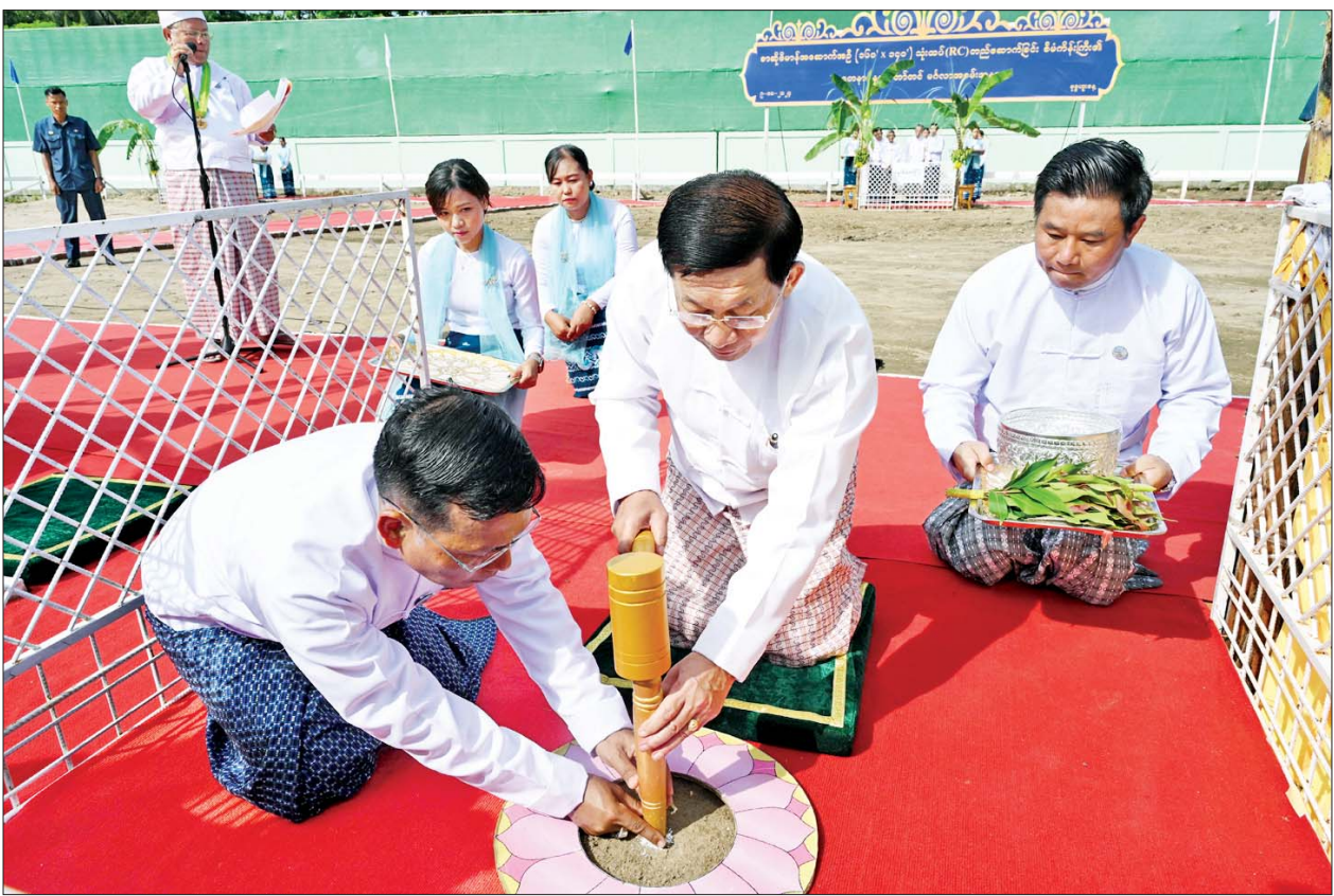
နိုင်ငံတော်စီမံအုပ်ချုပ်ရေးကောင်စီဥက္ကဋ္ဌ နိုင်ငံတော်ဝန်ကြီးချုပ် ဗိုလ်ချုပ်မှူးကြီး မင်းအောင်လှိုင် စာဆိုဗိမာန်အဆောက်အဦတည်ဆောက်မည့် ဗဟိုနေရာ၌ ရတနာပန္နက်တော်တင် စိုက်ထူပေးစဉ်။

ထို့နောက် ပြန်ကြားရေးဝန်ကြီးဌာန ပြည်ထောင်စုဝန်ကြီးဦးမောင်မောင်အုန်းက နိုင်ငံတော်ဝန်ကြီးချုပ်၏ လမ်းညွှန်ချက်အရ စာဆိုဗိမာန်တည်ဆောက်နိုင်ရေးအတွက် ဆောင်ရွက်ခဲ့မှုအခြေအနေများ၊ အိန္ဒိယ-မြန်မာချစ်ကြည်ရေး အထိမ်းအမှတ်အဖြစ် အိန္ဒိယနိုင်ငံ၏ အကူအညီ အထောက်အပံ့ဖြင့် သုံးထပ် အဆောက်အဦအဖြစ် စာမျက်နှာ ၆ သို့ *