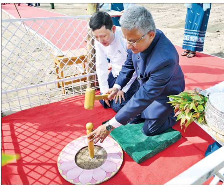
မြန်မာနိုင်ငံဆိုင်ရာ အိန္ဒိယနိုင်ငံသံအမတ်ကြီး H.E. Mr. Abhay Thakur သတ်မှတ်နေရာ၌ ပန္နက်တော်တင်စဉ်။

ဦးစွာ အခမ်းအနားမှူးက မင်္ဂလာအခါတော် စာတမ်းကို ဖတ်ကြားပြီး မင်္ဂလာအချိန်တွင် နိုင်ငံတော် စီမံအုပ်ချုပ်ရေးကောင်စီဥက္ကဋ္ဌ နိုင်ငံတော်ဝန်ကြီးချုပ်က စာဆိုဗိမာန်အဆောက်အဦတည်ဆောက်မည့် ဗဟိုနေရာ၌ ရတနာပန္နက်တော်တင်ကို စိုက်ထူပေးပြီး အမွှေးနံ့သာရည်များဖြင့် ပက်ဖျန်းပေးသည်။