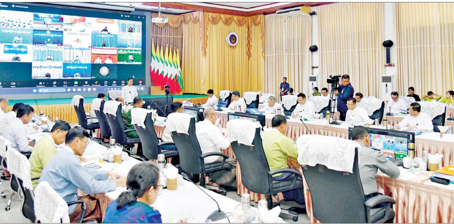
နိုင်ငံတော်စီမံအုပ်ချုပ်ရေးကောင်စီ ဒုတိယဥက္ကဋ္ဌ ဒုတိယဝန်ကြီးချုပ် ဒုတိယဗိုလ်ချုပ်မှူးကြီးစိုးဝင်း တရားမဝင်ကုန်သွယ်မှုတိုက်ဖျက်ရေးဦးဆောင်ကော်မတီ လုပ်ငန်း ညှိနှိုင်းအစည်းအဝေး (၄/၂၀၂၄) တွင် အမှာစကားပြောကြားစဉ်။

နေပြည်တော် အောက်တိုဘာ ၉ တရားမဝင် ကုန်သွယ်မှု တိုက်ဖျက်ရေး ဦးဆောင် ကော်မတီ လုပ်ငန်းညှိနှိုင်းအစည်း အဝေး (၄/၂၀၂၄) ကို ယနေ့မွန်းလွဲ ပိုင်းတွင် နေပြည်တော်ရှိ စီးပွား ရေးနှင့် ကူးသန်းရောင်းဝယ်ရေး ဝန်ကြီးဌာန ညီလာခံခန်းမ၌ ကျင်းပရာ တရားမဝင်ကုန်သွယ်မှု တိုက်ဖျက်ရေးဦးဆောင်ကော်မတီ ဥက္ကဋ္ဌ နိုင်ငံတော်စီမံအုပ်ချုပ်ရေး ကောင်စီ ဒုတိယဥက္ကဋ္ဌ ဒုတိယ ဝန်ကြီးချုပ် ဒုတိယဗိုလ်ချုပ်မှူး ကြီး စိုးဝင်း တက်ရောက်အမှာ စကားပြောကြားသည်။ အစည်းအဝေးသို့ ပြည်ထောင်စု ဝန်ကြီးများဖြစ်ကြသည့် ဦးဝင်းရှိန် နှင့် ဦးထွန်းအုံ၊ ဒုတိယဝန်ကြီးများ၊ အခွန်အယူခံခုံအဖွဲ့ဥက္ကဋ္ဌ နေပြည် တော်ကောင်စီဝင်၊ အမြဲတမ်း အတွင်းဝန်များ၊ ညွှန်ကြားရေးမှူး ချုပ်များနှင့် အသင်းအဖွဲ့များမှ စာမျက်နှာ ၇ ကော်လံ ၁ သို့ ★