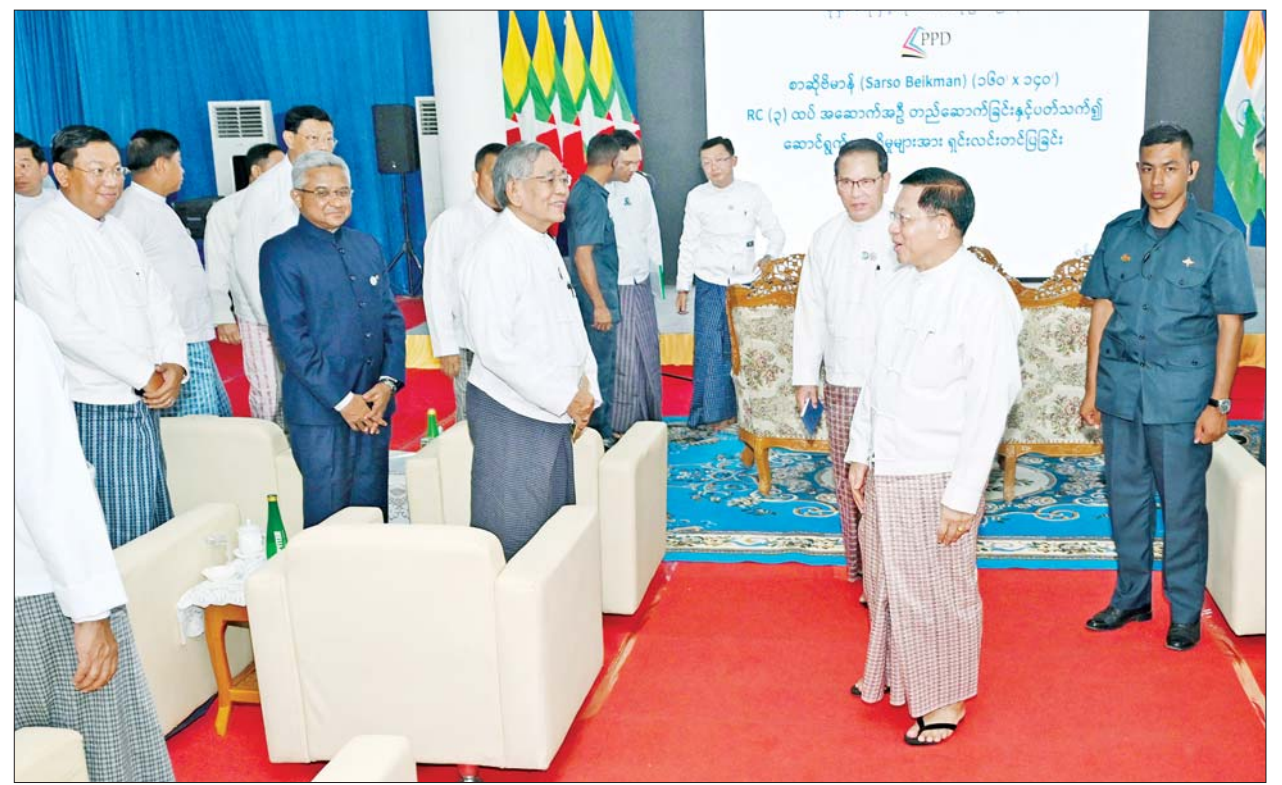
နိုင်ငံတော်စီမံအုပ်ချုပ်ရေးကောင်စီဥက္ကဋ္ဌ နိုင်ငံတော်ဝန်ကြီးချုပ် ဗိုလ်ချုပ်မှူးကြီးမင်းအောင်လှိုင် အခမ်းအနားတက်ရောက်လာကြ သူများနှင့် အမျိုးသားစာပေတစ်သက်တာဆုရ စာရေးဆရာကြီး၊ ဆရာမကြီးများအား ရင်းရင်းနှီးနှီးနှုတ်ဆက်စဉ်။

အုပ်ချုပ်ရေးကောင်စီဥက္ကဋ္ဌ နိုင်ငံ တော်ဝန်ကြီးချုပ်က အခမ်းအနား တက်ရောက်လာကြသည့် အမျိုး သား စာပေတစ်သက်တာဆုရ စာရေးဆရာကြီး၊ ဆရာမကြီးများ ကို ရင်းရင်းနှီးနှီးနှုတ်ဆက်သည်။ အဆိုဗိမာန်အဆောက် အအုံကို သုံးထပ်အဆောက်အအုံ အဖြစ် တည်ဆောက်သွားမည် ဖြစ်ပြီး တည်ဆောက်ပြီးစီးပါက စာပေဖွံ့ဖြိုးမှုဆိုင်ရာ ဆောင်ရွက်မှု သမိုင်းမှတ်တမ်း ဓာတ်ပုံများ၊ စာဖတ်ခန်းနှင့် စာကြည့်တိုက်၊ သမိုင်းဝင် ဂီတအနုပညာများ ခင်းကျင်းပြသမည့် ပြခန်းများ၊ ပေပုရပိုက်များ ခင်းကျင်းပြသမည့် ပြခန်းများ၊ သမိုင်းဝင်ကဗျာများ ခင်းကျင်းပြသမည့် ပြခန်းများ၊ စာပေဆုရခဲ့ဖူးသော စာအုပ်စာပေ များ ခင်းကျင်းပြသမည့်ပြခန်းများ၊ မြန်မာနိုင်ငံ၌ ထင်ရှားကျော်ကြား ခဲ့သည့် ခေတ်သုံးခေတ်မှ စာဆို တော်ကြီးများ၊ တစ်သက်တာစာပေ ဆု ရရှိခဲ့ကြသည့် စာပေပညာရှင် များနှင့် ကဗျာဆရာများ၏ ရုပ်တု များ ထားရှိသည့် ပြခန်းများကို ထည့်သွင်းထားရှိသွားမည် ဖြစ် သည်။ ယခင် စာပေဗိမာန်စာကြည့် တိုက်သည် စာပေဗိမာန် သုံးထပ် အဆောက်အအုံ၏ ပထမထပ်တွင် တည်ရှိပြီး ယခုတိုးတက်လာသည့် လူဦးရေနှင့် မြို့ပြဖွံ့ဖြိုးမှုအခြေ အနေများအရ ယခုအခါနိုင်ငံတော် စီမံအုပ်ချုပ်ရေးကောင်စီ ဥက္ကဋ္ဌ နိုင်ငံတော်ဝန်ကြီးချုပ်၏ လမ်း ညွှန်ချက်ဖြင့် “အမှောင်ခွင်း၍