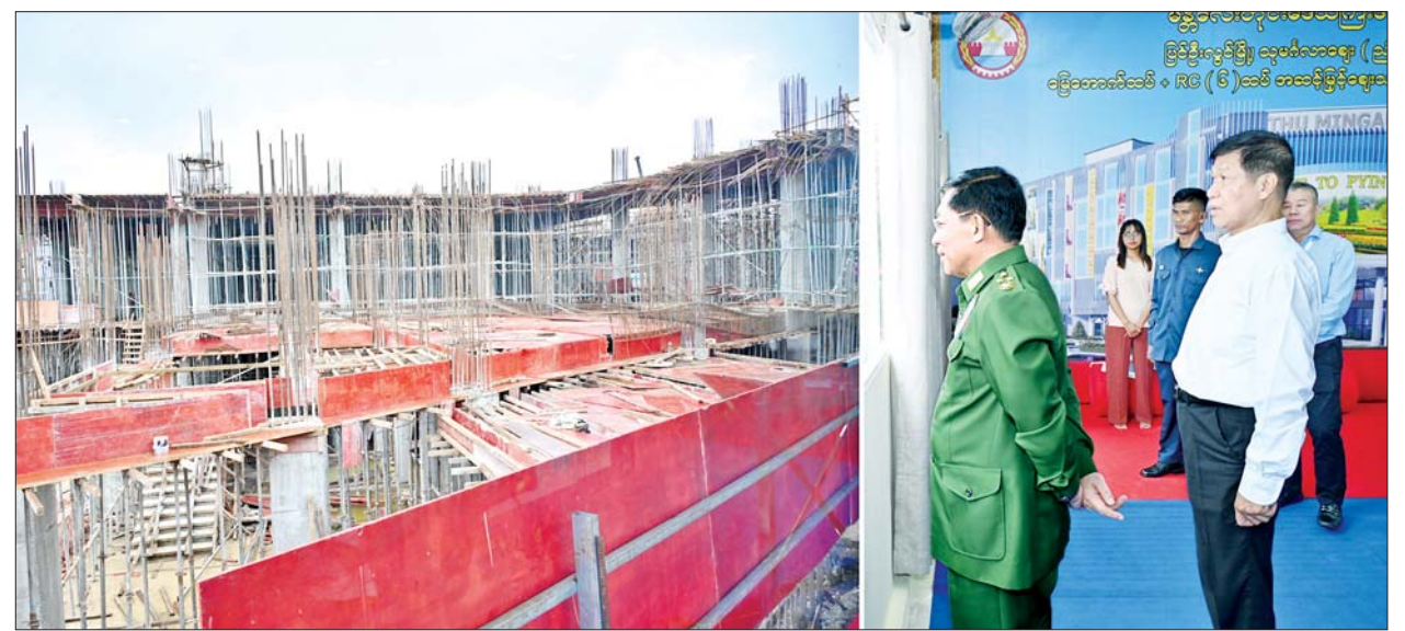
နိုင်ငံတော်စီမံအုပ်ချုပ်ရေးကောင်စီဥက္ကဋ္ဌ တပ်မတော်ကာကွယ်ရေးဦးစီးချုပ် ဗိုလ်ချုပ်မှူးကြီး မင်းအောင်လှိုင် ပြင်ဦးလွင်မြို့ သုမင်္ဂလာဈေး (ညံတောဈေး) ခြောက်ထပ်အဆင့်မြင့်ဈေးသစ် တည်ဆောက်ရေးစီမံကိန်းသို့ သွားရောက်ကြည့်ရှုစစ်ဆေးစဉ်။

အကြမ်းဖက်သောင်းကျန်းသူများထံမှ လက်နက်ခဲယမ်းများ သိမ်းဆည်းရမိမှု အခြေအနေများကို ရှင်းလင်းတင်ပြကြသည်။ ရှင်းလင်းတင်ပြမှုများအပေါ် နိုင်ငံတော် စီမံအုပ်ချုပ်ရေးကောင်စီဥက္ကဋ္ဌ တပ်မတော်ကာကွယ်ရေးဦးစီးချုပ်က ပြင်ဦးလွင်တပ်နယ်အနေဖြင့် နယ်မြေလုံခြုံရေးနှင့် တည်ငြိမ်အေးချမ်းရေးလုပ်ငန်းများကို စနစ်တကျ ဆောင်ရွက်သွားရန် လိုကြောင်း၊ တပ်နယ်အတွင်း နယ်မြေစည်းရုံးရေးလုပ်ငန်းများနှင့် နယ်မြေစိုးမိုးရေးလုပ်ငန်းများ ဆောင်ရွက်ရာတွင်လည်း မိမိတို့ တာဝန်ထမ်းဆောင်ရသည့် နယ်မြေအလိုက် ဒေသ၏ နယ်မြေဒေသအခြေအနေများ၊ ဒေသဆိုင်ရာအချက်အလက်များကို ခြေခြေမြစ်မြစ် သိရှိထားရမည် ဖြစ်ကြောင်း၊ နယ်မြေခံတပ်များနှင့် ဒေသခံများ တစ်သားတည်း ဖြစ်နေရမည်ဖြစ်ပြီး အပြန်အလှန်ရိုင်းပင်း ကူညီခြင်း၊ ပူးပေါင်းဆောင်ရွက်ခြင်းတို့ဖြင့် နယ်မြေလုံခြုံရေး၊ ဒေသခံများ၏ လုံခြုံရေးကို အတူတကွ ဝိုင်းဝန်းပူးပေါင်း ဆောင်ရွက်သွားကြရန် လိုကြောင်း မှာကြားခဲ့သည်။