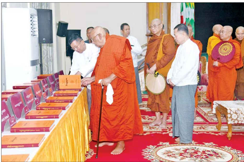
သီတဂူဆရာတော် ဒေါက်တာဘဒ္ဒန္တဏှာဏီသာရ သာသနာရေးနှင့်ယဉ်ကျေးမှုဝန်ကြီးဌာနက ခင်းကျင်းပြသထားသည့် စာအုပ်များကို ကြည့်ရှုစဉ်။

ရေကြီးရေလျှံဖြစ်ပွားခဲ့သည့် ဒေသများရှိ ရေဘေးသင့်ပြည်သူများကို သီတဂူဆရာတော်ကြီး အနေဖြင့် အမေရိကန်ဒေါ်လာ ၁၀၀၀၀ အား လည်းကောင်း၊ ကွန်းခိုရာ ကုမ္ပဏီမိသားစုက ငွေကျပ် သိန်း ၁၀၀၀ လှူဒါန်းသည့်အတွက်လည်းကောင်း နိုင်ငံတော်စီမံအုပ်ချုပ်ရေးကောင်စီအနေဖြင့် အထူးကျေးဇူးတင်ရှိပါကြောင်း၊ ရေဘေးသင့်ပြည်သူများ