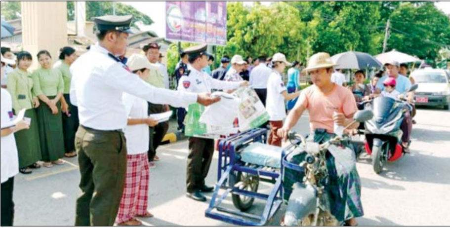
သန်းခေါင်စာရင်းကောက်ယူခြင်းအကြောင်း သိကောင်းစရာ လက်ကမ်းစာစောင်များ ဖြန့်ဝေပေးနေစဉ်။

လူဦးရေသန်းခေါင်စာရင်းဆိုသည်မှာ ပြည်သူများအနေဖြင့် သန်းခေါင်စာရင်းအဓိပ္ပာယ်ကို ကွဲကွဲပြားပြား မသိရှိကြသေးပေ။ မိမိတို့အိမ်တွင်ရှိသော အိမ်ထောင်စုလူဦးရေစာရင်း (၆၆/၆) ပုံစံကို သန်းခေါင်စာရင်းဟု ထင်မြင်နေကြဆဲဖြစ်ပါသည်။ လူဦးရေသန်းခေါင်စာရင်းဆိုသည်မှာ နိုင်ငံတစ်နိုင်ငံ၏ လူဦးရေစာရင်းကောက်ယူခြင်း၊ စာရင်းဇယားပြုစုခြင်း၊ ဆန်းစစ်လေ့လာခြင်းနှင့် ထုတ်ပြန်ကြေညာခြင်းစသည့် လုပ်ငန်းစဉ်တစ်ခုလုံးကို ဆိုလိုပါသည်။ သန်းခေါင်စာရင်းကောက်ယူရာတွင် နေ့တစ်နေ့၏ သန်းခေါင်ယံအချိန်ကို ရည်ညွှန်းချိန်အဖြစ် သတ်မှတ်ကောက်ယူခြင်းဖြစ်၍ သန်းခေါင်စာရင်းဟု ခေါ်ဝေါ်သုံးစွဲလာကြခြင်းဖြစ်ပါသည်။ ၂၀၂၄ ခုနှစ် လူဦးရေနှင့် အိမ်အကြောင်းအရာ သန်းခေါင်စာရင်းကောက်ယူမည့် အချိန်သည် အောက်တိုဘာလ ၁ ရက်နေ့မှ ၁၅ ရက်နေ့အထိ ဖြစ်၍ သန်းခေါင်စာရင်းရည်ညွှန်းချိန်မှာ ၃၀.၉.၂၀၂၄ ရက်နေ့ ညသန်းခေါင်ယံအချိန်ကို သန်းခေါင်စာရင်း ရည်ညွှန်းချိန်အဖြစ် သတ်မှတ်၍ မြန်မာနိုင်ငံနယ်နိမိတ်အတွင်း နေထိုင်သူများ အားလုံးကို ကောက်ယူသွားပါမည်။ မေးခွန်းပေါင်း ၆၈ ခုကို မေးမြန်းပါမည် သန်းခေါင်စာရင်း ကောက်ယူမည့်အချိန်သည်