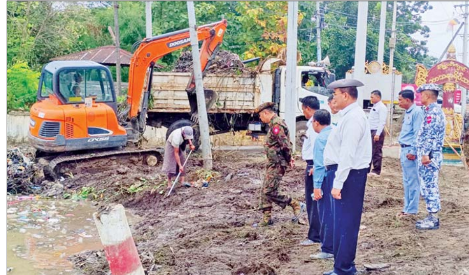
ထိုသို့ ဆောင်ရွက်ရာတွင် မိုးအဆက်မပြတ် သည်းထန်စွာ

တောင်ငူ စက်တင်ဘာ ၂၄ ပဲခူးတိုင်းဒေသကြီး တောင်ငူမြို့နယ်၌ စစ်တောင်းမြစ်ရေပြန်လည်ကျဆင်းသွားပြီဖြစ်သည့် အတွက် ပဲခူးတိုင်းဒေသကြီး ဝန်ကြီးချုပ်၏ လမ်းညွှန်မှုဖြင့် မြို့သန့်ရှင်း သာယာလှပရေးလုပ်ငန်းများအား စက်တင်ဘာ ၂၃ ရက်မှစတင်၍ ရေကြီးရေလျှံမှုဖြစ်ခဲ့ပြီး ရေဘေးသင့်ခဲ့သည့် ရပ်ကွက်/ကျေးရွာ၊ စာသင်ကျောင်း၊ ဘုန်းတော်ကြီးကျောင်း၊ ဆေးရုံ၊ ဆေးခန်း၊ သာသနိကအဆောက်အအုံများအား မြို့လုံးကျွတ် စုပေါင်းလုပ်အားပေးဆောင်ရွက်လျက်ရှိသည်။