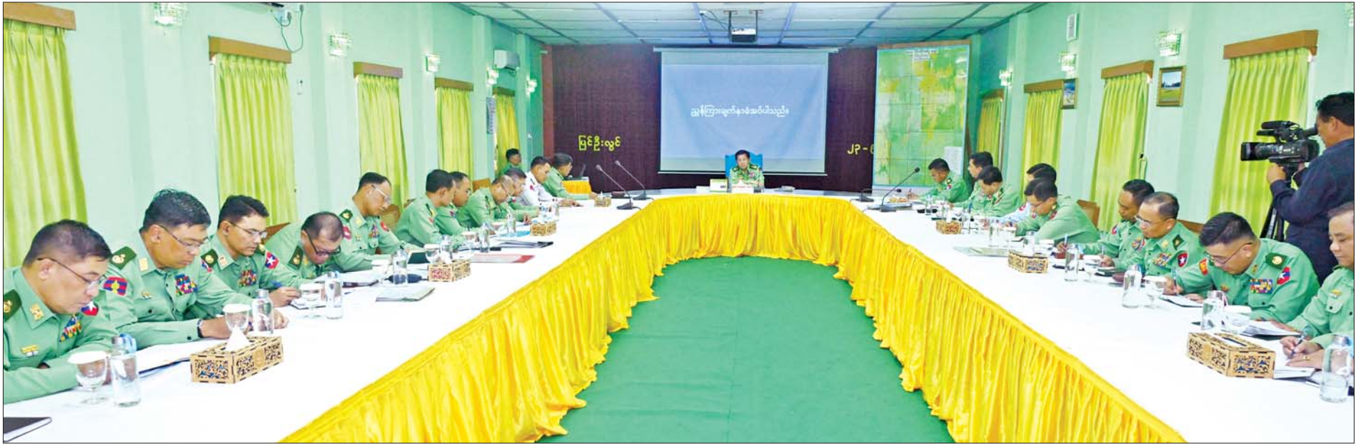
နိုင်ငံတော်စီမံအုပ်ချုပ်ရေးကောင်စီဥက္ကဋ္ဌ တပ်မတော်ကာကွယ်ရေးဦးစီးချုပ် ဗိုလ်ချုပ်မှူးကြီး မင်းအောင်လှိုင် အလယ်ပိုင်းတိုင်းစစ်ဌာနချုပ် ပြင်ဦးလွင်တပ်နယ်အတွင်း လုံခြုံရေးနှင့် နယ်မြေတည်ငြိမ်အေးချမ်းရေးဆိုင်ရာလုပ်ငန်းများ ဆောင်ရွက်လျက်ရှိမှုအခြေအနေများနှင့်ပတ်သက်၍မှာကြားစဉ်။