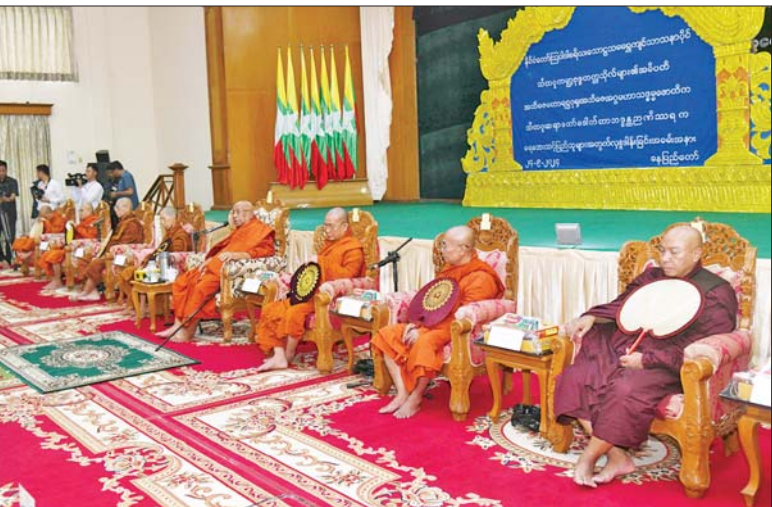
အမျိုးသားသဘာဝဘေးအန္တရာယ်ဆိုင်ရာ စီမံခန့်ခွဲမှုကော်မတီဥက္ကဋ္ဌ နိုင်ငံတော်စီမံအုပ်ချုပ်ရေးကောင်စီ ဒုတိယဥက္ကဋ္ဌ ဒုတိယဝန်ကြီးချုပ် ဒုတိယဗိုလ်ချုပ်မှူးကြီးစိုးဝင်းနှင့် အခမ်းအနားတက်ရောက်လာကြသူများက သီတဂူဆရာတော်ကြီးထံမှ ငါးပါးသီလခံယူဆောက်တည်ကြစဉ်။