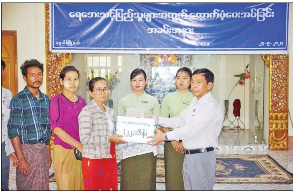
ပုဗ္ဗသီရိမြို့နယ်မှ သေဆုံးသူ ၁၁ ဦးအတွက် နေပြည်တော်ကောင်စီမှ တစ်ဦးလျှင် ငွေကျပ် နှစ်သိန်းကို မိသားစုဝင်များထံ ထောက်ပံ့ပေးအပ်စဉ်။

နေပြည်တော် စက်တင်ဘာ ၂၄ ရာဂီတိုင်းဖွန်း မုန်တိုင်းနှင့် ဆက်စပ် ရေဘေးဖြစ်ပွားမှုများကြောင့် နေပြည်တော်ကောင်စီ နယ်မြေအပါအဝင် တိုင်းဒေသကြီးနှင့် ပြည်နယ်တို့ရှိ မြို့နယ်ပေါင်း ၅၄ မြို့နယ်တို့တွင် မိုးသည်ထန်စွာရွာသွန်းပြီး ရေကြီးရေလျှံမှုများ ဖြစ်ပေါ်ခဲ့ကြောင်း ချောင်းရေနှင့် မြစ်ရေများအဆက်မပြတ် မြင့်တက်လာမှုနှင့်အတူ ရပ်ကွက်ကျေးရွာများတွင် ရေကြီးရေလျှံမှုများဖြစ်ပေါ်ခဲ့ပြီး လမ်း၊ တံတား