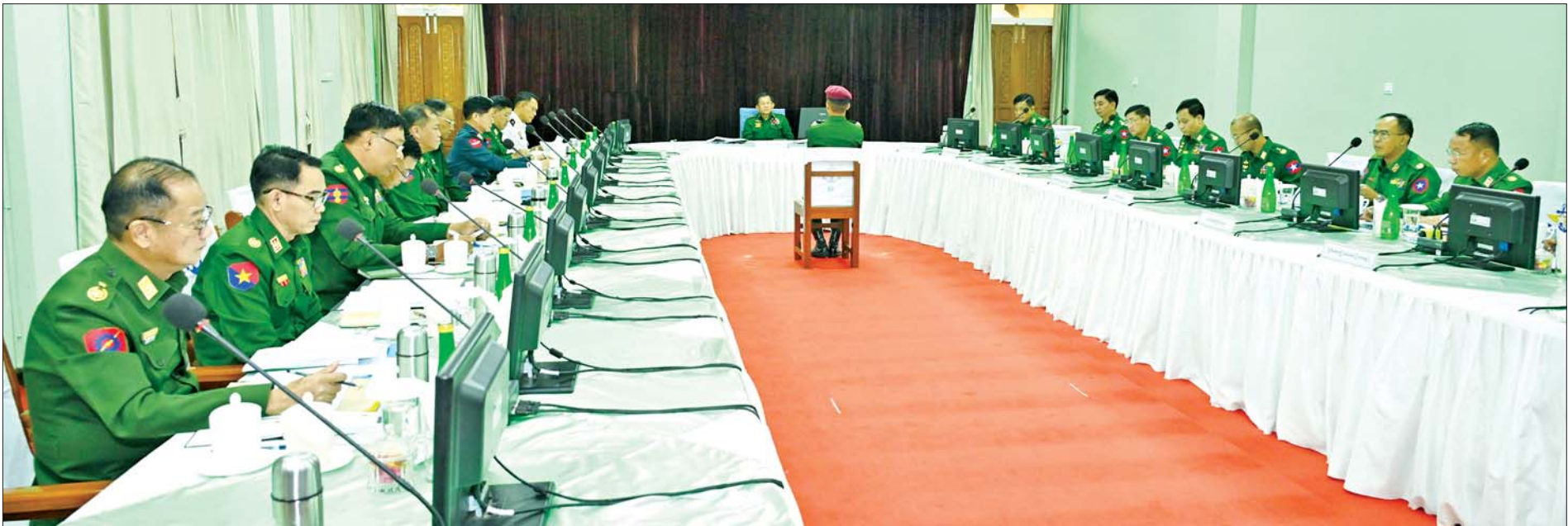
နိုင်ငံတော်စီမံအုပ်ချုပ်ရေးကောင်စီဥက္ကဋ္ဌ တပ်မတော်ကာကွယ်ရေးဦးစီးချုပ် ဗိုလ်ချုပ်မှူးကြီးမင်းအောင်လှိုင် တပ်မတော်နည်းပညာတက္ကသိုလ် ဗိုလ်လောင်းသင်တန်းအမှတ်စဉ်(၂၇) စစ်လက်ရုံးရွေးချယ်ပွဲသို့ တက်ရောက် စိစစ်ရွေးချယ်စဉ်။

( ၃-၉-၂၀၂၄ ရက်နေ့တွင် နိုင်ငံတော်စီမံအုပ်ချုပ်ရေးကောင်စီဥက္ကဋ္ဌ နိုင်ငံတော် ဝန်ကြီးချုပ် ဗိုလ်ချုပ်မှူးကြီး မင်းအောင်လှိုင် ရှမ်းပြည်နယ် အစိုးရအဖွဲ့ဝင်များ၊ ပြည်နယ်နှင့် ခရိုင်အဆင့် ဌာနဆိုင်ရာတာဝန်ရှိသူများအား ပြောကြားသည့် အမှာ စကားမှ ကောက်နုတ်ချက် )