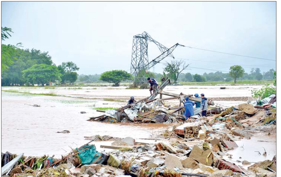
ရေကြီးရေလျှံမှုကြောင့် ပြိုလဲပျက်စီးသွားသည့် ဓာတ်အားလိုင်းများ ပြန်လည်ပြုပြင်နေမှုကို တွေ့ရစဉ်။