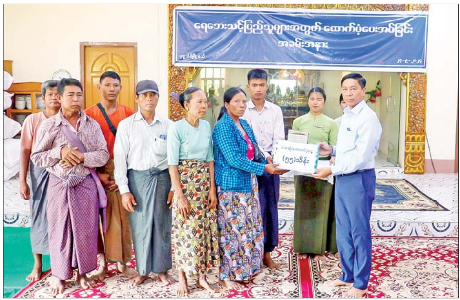
ပုဗ္ဗသီရိမြို့နယ်မှ သေဆုံးသူ ၁၁ ဦးအတွက် အမျိုးသားသဘာဝဘေးအန္တရာယ်ဆိုင်ရာ စီမံခန့်ခွဲမှုကော်မတီမှ တစ်ဦးလျှင် ငွေကျပ် ငါးသိန်းကို မိသားစုဝင်များထံ ထောက်ပံ့ပေးအပ်စဉ်။