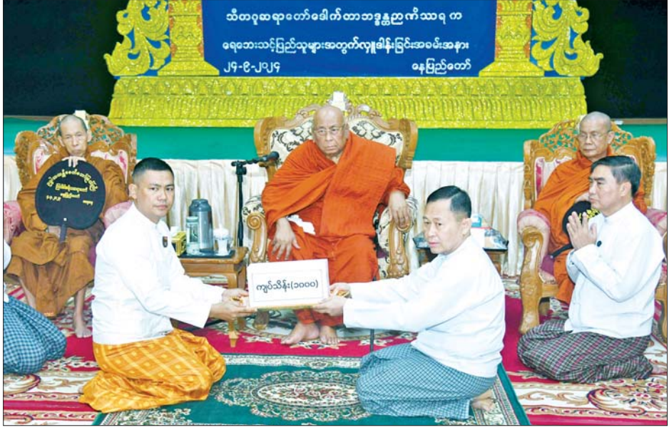
အမျိုးသားသဘာဝဘေးအန္တရာယ်ဆိုင်ရာ စီမံခန့်ခွဲမှုကော်မတီဥက္ကဋ္ဌ နိုင်ငံတော်စီမံအုပ်ချုပ်ရေးကောင်စီ ဒုတိယဥက္ကဋ္ဌ ဒုတိယဝန်ကြီးချုပ် ဒုတိယဗိုလ်ချုပ်မှူးကြီး စိုးဝင်း ကွန်းခိုရာကုမ္ပဏီမီသားစုထံမှ အလှူတော်ငွေကျပ် သိန်း ၁၀၀၀ ကို လက်ခံရယူစဉ်။

ကို ညီညွတ်မှုဖြင့် ရင်ဆိုင်ကျော်လွှားကြမည်” Video Clip နှင့် သာသနာရေးနှင့် ယဉ်ကျေးမှုဝန်ကြီးဌာနက နေပြည်တော်ကောင်စီနယ်မြေအတွင်းရှိ ရေဘေးဒဏ်ခံခဲ့ရသည့် ဘုန်းတော်ကြီးကျောင်းများနှင့် သီလရှင်ကျောင်းများကို လှူဖွယ်ပစ္စည်းများ ထောက်ပံ့လှူဒါန်းမှုမှတ်တမ်းများကို ပြသသည်။