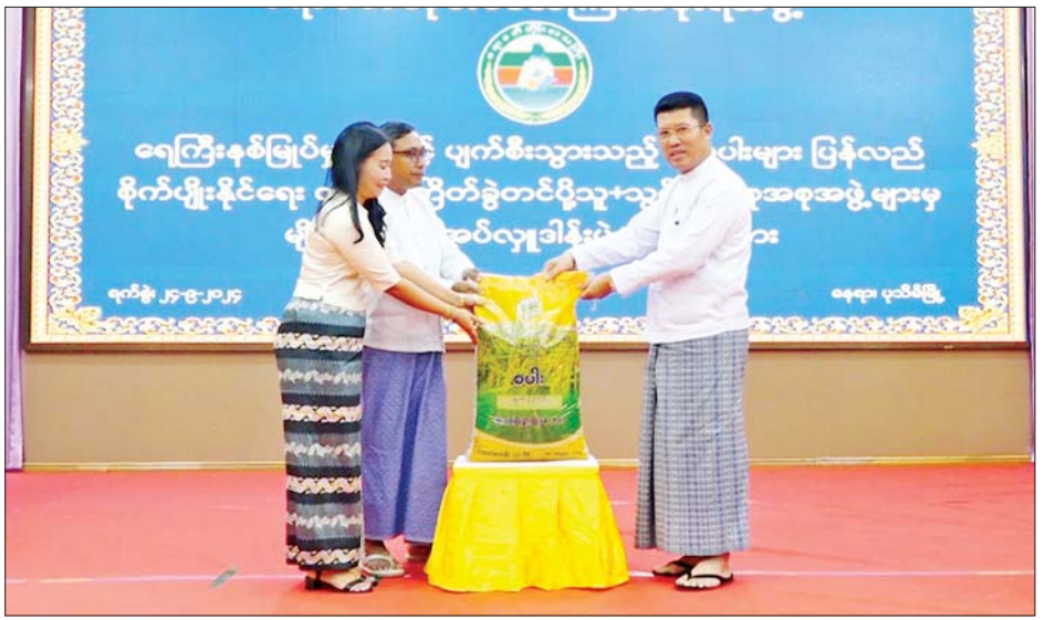
အစုအဖွဲ့များက ပထမအကြိမ်အဖြစ် ရက် ၉၀ ၁၆၀၀၀ ကျော် ထောက်ပံ့ပေးအပ်ခဲ့ကြောင်း သိရ မျိုးစပါးနှင့် သီးထပ်ရင်မျိုးစပါး စုစုပေါင်းတင်း သည်။ တိုင်းဒေသကြီး(ပြန်/ဆက်)

ပျက်စီး၊ ပြန်လည်စိုက်ပျိုးထားရှိမှုကိုလည်းကောင်း၊ စိုက်ပျိုးရေးဦးစီးဌာန တိုင်းဒေသကြီးဦးစီးမှူးက ရေကြီးနစ်မြုပ်မှုကြောင့် ထိခိုက်ပျက်စီးသွားသော မိုးစပါးများ ပြန်လည်စိုက်ပျိုးနိုင်ရေး ဝယ်ယူကြိုက်ခွဲ တင်ပို့သူများက မျိုးစပါးပေးအပ်လှူဒါန်းမှု အခြေ အနေကိုလည်းကောင်း ရှင်းလင်းတင်ပြပြီး ရေကြီး နစ်မြုပ်မှုကြောင့် ထိခိုက်ပျက်စီးသွားသော မိုးစပါး များ ပြန်လည်စိုက်ပျိုးနိုင်ရေးအတွက် ဝယ်ယူကြိုက်ခွဲ တင်ပို့သူများက မျိုးစပါးပေး အပ်လှူဒါန်းရာ တိုင်းဒေသကြီးဝန်ကြီးချုပ်နှင့် တာဝန်ရှိသူများက လက်ခံရယူကြသည်။ ရေကြီးနစ်မြုပ်မှုကြောင့် ထိခိုက်ပျက်စီးသွားသည့် မိုးစပါးများ ပြန်လည် စိုက်ပျိုးနိုင်ရေး ဝယ်ယူကြိုက်ခွဲတင်ပို့သူ၊ သွင်းအားစု