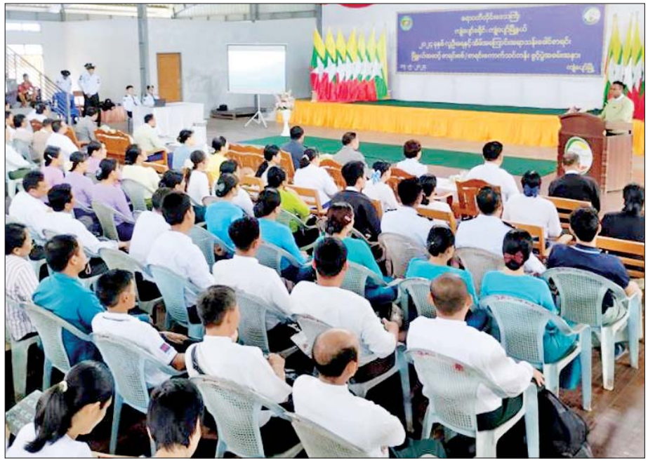
ကျိုပျော်မြို့နယ်၌ ၂၀၂၄ ခုနှစ် လူဦးရေနှင့်အိမ်အကြောင်းအရာ သန်းခေါင်စာရင်းကောက်ယူရေး မြို့နယ်အဆင့် သင်တန်းဖွင့်ပွဲကျင်းပစဉ်။

ပြည်ပရွှေ့ပြောင်းသွားလာခြင်းနှင့်ပတ်သက်၍ မေးခွန်းများကို ဖြေကြားရာတွင် အိမ်ထောင်ဦးစီးများအနေဖြင့် အမှန်ကိုသာဖြေကြားပေးရန် လိုအပ်ပါသည်။ တရားဝင် ဝီဇာဖြင့် သွားခြင်း/မသွားခြင်း၊ အောက်လမ်းမှ တရားမဝင်သွားခြင်း စသည်တို့ကို မေးမြန်းမည်မဟုတ်ပါ။ အဓိကမှာ မည်သည့်နိုင်ငံတွင် သွားရောက်နေထိုင် အလုပ် လုပ်ကိုင်နေသည်ကို ဖြေကြားရန်သာဖြစ်ပါသည်။ ၂၀၁၄ ခုနှစ် သန်းခေါင်စာရင်းအရ ပြည်ပတွင် သွားရောက်အလုပ်လုပ်ကိုင်နေသူ နှစ်သန်းခန့် (ထိုင်းနိုင်ငံတွင် ၇၀ ဒသမ ၂ ရာခိုင်နှုန်း၊ မလေးရှားနိုင်ငံတွင် ၁၅ ရာခိုင်နှုန်း၊ တရုတ်နိုင်ငံတွင် ၄ ဒသမ ၆ ရာခိုင်နှုန်း၊ စင်ကာပူနိုင်ငံတွင် ၃ ဒသမ ၉ ရာခိုင်နှုန်း၊ အမေရိကန်နိုင်ငံတွင် ၁ ဒသမ ၉ ရာခိုင်နှုန်း၊ အိန္ဒိယနိုင်ငံတွင် ၀ ဒသမ ၉ ရာခိုင်နှုန်း၊ ကိုရီးယားနိုင်ငံတွင် ၀ ဒသမ ၇ ရာခိုင်နှုန်း၊ ဂျပန်နိုင်ငံတွင် ၀ ဒသမ ၄ ရာခိုင်နှုန်းနှင့် အခြားနိုင်ငံများတွင် ၂ ဒသမ ၅ ရာခိုင်နှုန်း) ရှိပါသည်။ စာရင်းကောက်ယူခြင်းအားဖြင့် သိရှိရသောပိုင်ဆိုင်မှုများနှင့် ပတ်သက်၍လည်း အခွန်ကောက်ခံခြင်း၊ အရေးယူခြင်းတို့ကို လုံးဝ လုံးဝ ပြုလုပ်မည် မဟုတ်ပါ။