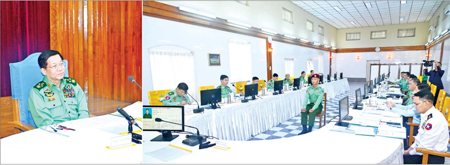
နိုင်ငံတော်စီမံအုပ်ချုပ်ရေးကောင်စီဥက္ကဋ္ဌ တပ်မတော်ကာကွယ်ရေးဦးစီးချုပ် ဗိုလ်ချုပ်မှူးကြီးမင်းအောင်လှိုင် စစ်တက္ကသိုလ်ဗိုလ်လောင်းသင်တန်းအမှတ်စဉ်(၆၇) စစ်လက်ရုံးရွေးချယ်ပွဲသို့ တက်ရောက်စိစစ်ရွေးချယ်စဉ်။

နေပြည်တော် စက်တင်ဘာ ၂၄ နိုင်ငံတော်စီမံအုပ်ချုပ်ရေးကောင်စီဥက္ကဋ္ဌ တပ်မတော်ကာကွယ်ရေးဦးစီးချုပ် ဗိုလ်ချုပ်မှူးကြီးမင်းအောင်လှိုင်သည် စက်တင်ဘာ ၂၃ ရက်နှင့် ယနေ့တို့တွင် စစ်တက္ကသိုလ်ဗိုလ်လောင်းသင်တန်းအမှတ်စဉ်(၆၇) စစ်လက်ရုံးရွေးချယ်ပွဲနှင့် တပ်မတော်နည်းပညာတက္ကသိုလ် ဗိုလ်လောင်းသင်တန်းအမှတ်စဉ်(၂၇) စစ်လက်ရုံးရွေးချယ်ပွဲတို့သို့ သီးခြားစီ တက်ရောက်စိစစ်ရွေးချယ်သည်။ စာမျက်နှာ ၃ ကော်လံ ၁ သို့ ☆