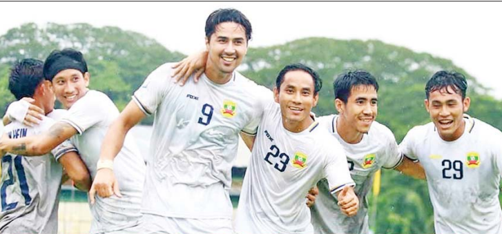
အာဆီယံကလပ်ပြိုင်ပွဲတွင် အဝေးကွင်း ထပ်မံကစားရမည့် ရှမ်းယူနိုက်တက်အသင်း ကစားသမားများကို တွေ့ရစဉ်။

ရန်ကုန် စက်တင်ဘာ ၂၄ ၂၀၂၄-၂၀၂၅ ရာသီ အာဆီယံကလပ် ချန်ပီယံရှစ်ပြိုင်ပွဲ အုပ်စုဒုတိယပွဲကို စက်တင်ဘာ ၂၅ ရက်နှင့် ၂၆ ရက်တွင် ကျင်းပမည်ဖြစ်ပြီး မြန်မာကလပ် ရှမ်းယူနိုက်တက်အသင်းသည် အဝေးကွင်းထပ်မံကစားရမည်ဖြစ်သည်။ စာမျက်နှာ ၁၉ ကော်လံ ၃ သို့ ❖