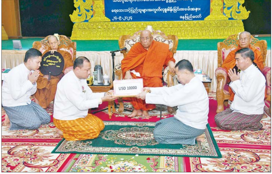
အမျိုးသားသဘာဝဘေးအန္တရာယ်ဆိုင်ရာ စီမံခန့်ခွဲမှုကော်မတီဥက္ကဋ္ဌ နိုင်ငံတော်စီမံအုပ်ချုပ်ရေးကောင်စီ ဒုတိယဥက္ကဋ္ဌ ဒုတိယဝန်ကြီးချုပ် ဒုတိယဗိုလ်ချုပ်မှူးကြီး စိုးဝင်း သီတဂူဆရာတော်ကြီး လှူဒါန်းသည့် အမေရိကန်ဒေါ်လာ ၁၀၀၀၀ ကို ဆရာတော်ဘုရားကိုယ်စား ကပိယကာရကထံမှ လက်ခံရယူစဉ်။