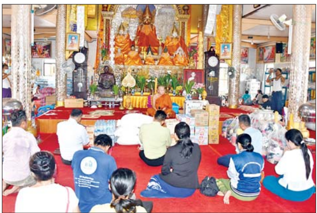
ရတနာဂူဟာ (ရှမ်း) ဘုန်းတော်ကြီး ရေဘေး ကယ်ဆယ်ရေးစခန်းသို့ ကျောင်းတွင် ဖွင့်လှစ်ထားသော သွားရောက်၍ ဆန် ငါးအိတ်၊

တာချီလိတ် စက်တင်ဘာ ၂၄ ရှမ်းပြည်နယ် (အရှေ့ပိုင်း) တာချီလိတ်မြို့၌ခရိုင်သဘာဝဘေးအန္တရာယ်စီမံခန့်ခွဲမှု ကော်မတီ ဥက္ကဋ္ဌ ခရိုင်အုပ်ချုပ်ရေးမှူး ဦးမင်းကိုနှင့် တာဝန်ရှိသူတို့သည် ရေဘေးသင့် ပြည်သူများအား ဆန်၊ ဆီ၊ စားသောက်ဖွယ်ရာများနှင့် အဝတ်အထည်များကို စက်တင်ဘာ ၂၃ ရက် မွန်းလွဲ ၂ နာရီက သွားရောက်ပေးအပ်လှူဒါန်းသည်။