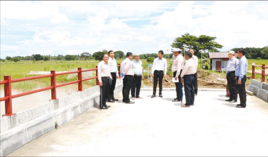
လေးမျက်နှာမြို့နယ် ခုံကြီး-ခတ္တုလမ်းပေါ်၌ တံတားတည်ဆောက်မှုကို ကြည့်ရှုစဉ်။

သည်စေတီတော်မြတ်ကြီးကို သမိုင်းဝင်ဟု ကျွန်တော်ပီပီဟိုဟိုပြုရခြင်းမှာ သက္ကရာဇ် ၄၂၀ ပြည့် နှစ်တွင် ပုဂံပြည့်ရှင်အနော်ရထာမင်းကြီး စတင် တည်ထားကိုးကွယ်ခဲ့သောကြောင့်ပါတည်း။ မြို့ အတွက်တစ်ခုတည်းသာ ကျန်ရစ်တော့သော၊ ဘာနှင့်မျှမလဲနိုင်သော ဘာသာ သာသနာ ထွန်းလင်း တောက်ပခဲ့ရုံသာ ပြယုဂ်သမိုင်းအမွေအနှစ်လည်း ဖြစ်နေပါသည်။ ကျွန်တော် မကြာခဏရေးပြခဲ့ဖူး သလို မူလလေးမျက်နှာမြို့ဟောင်းသည် စတုပုဆွေ ထူပါရုံ စေတီတော်မြတ်ကြီးတည်ရှိရာ ဝန်မြစ် အနောက်ဘက်ကမ်းတွင် တောင်မြောက်အလျား လိုက်တန်း၍ ခုံကြီးရပ်ကွက်၊ မြို့မရပ်ကွက်၊ ခတ္တု ရပ်ကွက်တို့ဖြင့် ဖွဲ့စည်းထားပြီး အစိုးရရုံးများ၊ ဆေးရုံ၊ ကျောင်း၊ တိုက်ဈေးကြီး၊ မြို့နယ်အားကစား ကွင်း၊ ပန်းခြံ၊ ဗိုလ်အောင်ဖေ ရုပ်ရှင်ရုံတို့ဖြင့် သူ့နေရာ နှင့်သူ နှစ်ပေါင်းများစွာ ဟန်ကျပန်ကျ တွေ့မြင်လာခဲ့ ကြရသည်။ မြို့ကသေးသေးလေး ဆိုသော်ငြားလည်း အနီးလေးမျက်နှာမြို့နယ်အတွင်းမှနေ၍ တိုင်းသိ ပြည်သိ ထင်ရှားကျော်ကြားခဲ့ကြသော သာသနာ့ အာဇာနည်များ၊ လူပုဂ္ဂိုလ်အကျော်အမော်များ များစွာ ပေါ်ထွန်းခဲ့ဖူးသည်။ ဘကြီးတော်မင်းနှင့် မိဖုရားခေါင်ကြီးတို့ ကိုးကွယ်တော်မူခဲ့သည့် ပထမ ထွဋ်ခေါင် ဆရာတော်ကြီး၊ ရွှေဟင်္သာဆရာတော် ကြီး၊ သခင်ပညာလောကအမည်ဖြင့် နယ်ချဲ့အင်္ဂလိပ် ကို ဆန့်ကျင်ခဲ့သည့် ဆရာတော် ဦးပညာလောက၊ ဦးဇောတိပါလနှင့် အောင်ဆန်းဆရာတော်ကြီးတို့ သည်လည်းကောင်း၊ ဝိဇ္ဇာရသခင်ချစ်မောင်၊ စာပေ ဘက်တွင် ကျောက်စာဝန် ဦးမြနှင့် ကဗျာဆရာကြီး စောရန်နောင်တို့သည်လည်းကောင်း၊ အနုပညာ