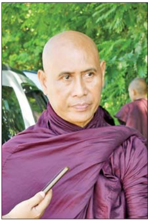
နန်းဦးဆရာတော် ဘဒ္ဒန္တပုညဝန္တ

ရာဂီတိုင်ဖွန်း မုန်တိုင်း၏ သက်ရောက်မှုကြောင့် ရေကြီး ရေလျှံမှုများဖြစ်ပွားကာ ပြည်သူများသည် သဘာဝဘေးဒဏ်ကို ထိခိုက်ခံစားခဲ့ကြရပါသည်။ ထိုသို့ သဘာဝဘေးဒဏ်ခံ ပြည်သူများအတွက် နိုင်ငံတော်အစိုးရက ထိခိုက်ဒဏ်ရာ ခံစားခဲ့ရမှုအခြေအနေနှင့် အိုးအိမ်များ ပျက်စီးဆုံးရှုံးမှု အခြေအနေများအပေါ် မူတည်ကာ လိုအပ်သည့် ထောက်ပံ့ကူညီမှုများကို ဆောင်ရွက်ပေးသွားရန် စီစဉ်လျက်ရှိပါသည်။