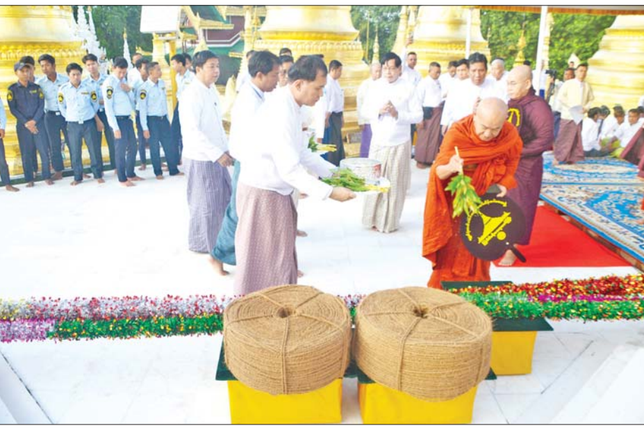
များဖြင့်ပင့်ဖိတ်ပူဇော်၍ အမွှေးနံ့သာများပက်ဖျန်းကာ ရွှေသင်္ကန်းတော်ကပ်လှူပူဇော်ခြင်းလုပ်ငန်း ကာလတစ်လျှောက် ဘေးဥပါဒ်အန္တရာယ်များ ကင်းဝေးပါစေကြောင်း တိုင်တည်ဆုတောင်းကြပြီး ဩဝါဒါစရိယဆရာတော်ကြီးများအား ရှေးဟောင်းဗုဒ္ဓရုပ်ပွားတော်များတန်ဆောင်း၌ အရုဏ်ဆွမ်းဆက်ကပ်လှူဒါန်းကြသည်။ ထို့နောက် ရွှေတိဂုံစေတီတော်ဘဏ္ဍာတော်ထိန်း

ရန်ကုန် စက်တင်ဘာ ၁၉ ၂၀၂၄-၂၀၂၅ ခုနှစ် ရွှေတိဂုံစေတီမြတ်ကြီး လုံးတော်ပြည့်ရွှေသင်္ကန်းတော် ကပ်လှူပူဇော်ရန် ငြိမ်းစေတီတည်ဆောက်ခြင်းနှင့် အန္တရာယ်ကင်းပရိတ်တရားတော်နာ မင်္ဂလာအခမ်းအနားကို ယနေ့ နံနက် ၅ နာရီတွင် စေတီမြတ်ကြီးရှိ သတ်မှတ်နေရာများ၌ ကျင်းပသည်။ အခမ်းအနားများသို့ ရွှေတိဂုံစေတီတော် ဘဏ္ဍာတော်ထိန်းဂေါပကအဖွဲ့၏ ဩဝါဒါစရိယဆရာတော်ကြီးများ ကြွရောက်တော်မူကြပြီး ရန်ကုန်တိုင်းဒေသကြီးဝန်ကြီးချုပ် ဦးစိုးသိန်းနှင့် တာဝန်ရှိသူများ၊ ပါဝင်ကုသိုလ်ယူဆောင်ရွက်ကြမည့် ဝန်ထမ်းများ၊ ဗုဒ္ဓဝေယျာဝစ္စအသင်းအဖွဲ့များနှင့် ငြိမ်းစေတီတည်ဆောက်မည့်လုပ်သားများ တက်ရောက်ကြည့်ကြည့်သည်။ ဦးစွာ ရန်ကုန်တိုင်းဒေသကြီးဝန်ကြီးချုပ် ဦးစိုးသိန်း၊ တိုင်းဒေသကြီးလူမှုရေးရာဝန်ကြီး ဦးဌေးအောင်၊ ဘဏ္ဍာတော်ထိန်းဂေါပကအဖွဲ့ဝင်များ၊ တိုင်းဒေသကြီး သာသနာရေးမှူး ဦးဇော်ဦးတို့က နတ်ဒေဝါများအား ကန်တော့ပွဲ၊ ထီး၊ တံခွန်၊ ကုက္ကား