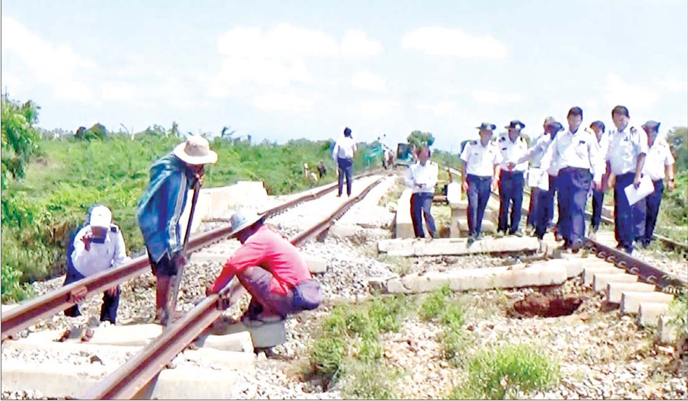
ရန်ကုန် - မန္တလေးရထားလမ်း သပြေတောင်းဘူတာနှင့် စမုံဘူတာအကြား ရထားလမ်းပိုင်းနှင့် တံတားများ ပြန်လည်ပြုပြင်ဆောင်ရွက်နေမှုကိုတွေ့ရစဉ်။