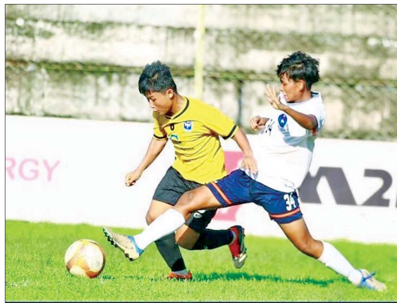
အား/ကာသိပွဲအသင်းနှင့် ဧရာဝတီအသင်းတို့ ယှဉ်ပြိုင်ကစားကြစဉ်။

ရန်ကုန် စက်တင်ဘာ ၁၉ ၂၀၂၄ ရာသီ မြန်မာအမျိုးသမီးလိဂ်ပြိုင်ပွဲ ပွဲစဉ်(၁၇) နောက်ဆုံးနေ့ကို စက်တင်ဘာ ၁၉ရက် က ဆက်လက်ကျင်းပရာ အား/ကာသိပွဲအသင်း ဂိုးပြတ်နိုင်ပွဲရယူပြီး ဆက်လက်ဦးဆောင်လျက်ရှိသည်။ သုံးဂိုးပြတ်အနိုင်ရ ပဒုမ္မာကွင်း၌ကျင်းပသည့် ပွဲတွင် အား/ကာသိပွဲအသင်းက ဧရာဝတီအသင်းကို သုံးဂိုးပြတ် အနိုင်ရခဲ့သည်။ ယခုရာသီတွင် ချန်ပီယံဆု တစ်ကျော့ပြန်ရယူနိုင်ရန် အခြေအနေကောင်းနေသည့် အား/ကာသိပွဲအသင်းသည် တတိယနေရာမှ ဧရာဝတီအသင်းကို ဂိုးပြတ်အနိုင်ယူကာ ဇယားထိပ်ဆုံးတွင် မြောက်မှတ်အသာဖြင့် ဆက်လက်ဦးဆောင်လျက်ရှိသည်။ ဧရာဝတီအသင်းမှာ ယခုရှုံးပွဲကြောင့် အဆင့်(၃)အတွင်းဝင်ရန် လက်ကျန်ပွဲများတွင် ဆက်လက်ရုန်းကန်ရမည်ဖြစ်သည်။ စာမျက်နှာ ၂၀ ကော်လံ ၁ သို့ ၀