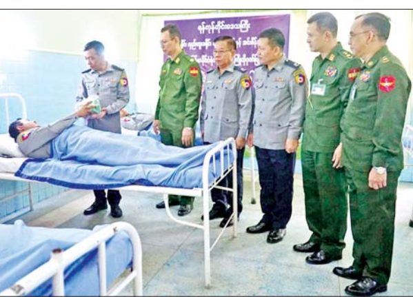
တပ်ဖွဲ့ဝင်များအား အာဟာရ ကြောင်း သိရသည်။ ဖြည့်စွက်စာများ ပေးအပ်ခဲ့ ညွှန်ကြားရေးမှူးချုပ်

(ခုတင်-၅၀၀)တပ်မှူးဗိုလ်မှူးချုပ်ကျော်ဇင်ညွန့်၊ ဒုတိယတပ်မှူးဗိုလ်မှူးကြီး ခင်ဇော်ဟိန်၊ ဒုတိယဗိုလ်မှူးကြီး ဝင်းမြတ်နှင့် တပ်ဖွဲ့ဝင်များ၊ မင်္ဂလာဒုံခရိုင်ရဲတပ်ဖွဲ့မှူး ဒုတိယရဲမှူးကြီး ဝင်းကိုကို၊ အင်းစိန် ခေတ္တခရိုင်ရဲတပ်ဖွဲ့မှူးရဲမှူး သိန်းဝင်း၊ မှော်ဘီခရိုင် ဒုတိယခရိုင်ရဲတပ်ဖွဲ့မှူး ရဲမှူးတင်အေး၊ မင်္ဂလာဒုံမြို့နယ်ရဲတပ်ဖွဲ့မှူး ရဲမှူး စိုးလင်းနှင့် တာဝန်ရှိသူများက ကြည့်ရှုအားပေးပြီး သွေးလှူဒါန်းသည့်