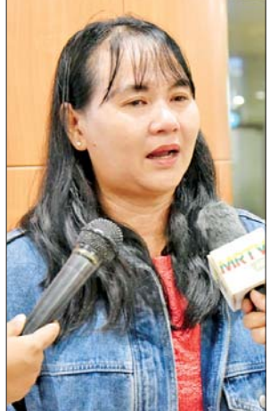
ထိုသို့ ဆောင်ရွက်ပေးလျက် ရှိရာ ယူအေအီးနိုင်ငံ ခုတိုင်းမြို့

ရန်ကုန် စက်တင်ဘာ ၁၉ နိုင်ငံတော်အစိုးရ အနေဖြင့် ပြည်ပတွင် ရောက်ရှိနေသည့် အမိနိုင်ငံသားများ အခက်အခဲ ကြုံတွေ့ရပါက နိုင်ငံသားများ အပေါ် အလေးအနက်တန်ဖိုးထား သည့်အနေဖြင့် မည်သို့သောအခြေ အနေနှင့် တွေ့ကြုံရသည်ဖြစ်စေ မြန်မာ ကောင်စစ်ဝန်ချုပ်ရုံးနှင့် မြန်မာသံရုံးသည် သက်ဆိုင်ရာ သံရုံးများနှင့်ချိတ်ဆက်၍ အမိနိုင်ငံ သားများ မြန်မာနိုင်ငံသို့ အမြန်ဆုံး အေးချမ်းလုံခြုံစွာ ပြန်လည် ရောက်ရှိနိုင်ရေး စီစဉ်ဆောင်ရွက် ပေးလျက်ရှိသည်။