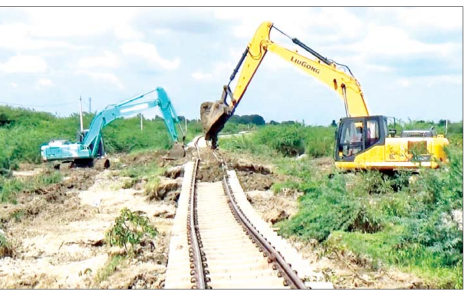
ရန်ကုန်-မန္တလေးရထားလမ်း သပြေတောင်းနှင့် စမ့်ဘူတာအကြား ရထားလမ်းပိုင်းနှင့် တံတားများ ပြန်လည်ပြုပြင်ဆောင်ရွက်နေမှုကိုတွေ့ရစဉ်။

ထည့်သွင်းခြင်း၊ တာပေါင်မြေဖိုခြင်း၊ သံလမ်း ပြန်လည်ခင်းခြင်း၊ သစ်သားဖား ထပ်ခွေခြင်း၊ ဆောင်ရွက်ပြီးစီးမှု အခြေအနေများကို စစ်ဆေး ကာ တံတားအမှတ်(၆၉၁) နေရာ၌ ဆက်လက် ဆောင်ရွက်မည့် တံတားဘေလီသံပေါင် ထည့်သွင်း ခြင်းလုပ်ငန်း အခြေအနေများကို အသေးစိတ် မှာကြား၍ စမ့်နှင့် သပြေတောင်း အဆန်လမ်းပိုင်းကို စက်တင်ဘာလမကုန်မီ အမြန်ဆုံးဖွင့်လှစ်နိုင် ရေးလိုအပ်သည်များ လမ်းညွှန်မှာကြားဖြည့်ဆည်း ပေးသည်။ ယင်းနောက် မြန်မာ့မီးရထား ဦးဆောင်ညွှန် ကြားရေးမှူးနှင့်အဖွဲ့သည် သာစည်မှ ဘုရားငါးဆူ အထိ သွားရောက်ခဲ့ပြီး ရေတိုက်စား၍ ပျက်စီးလျက် ရှိသော သာစည်နှင့်လှိုင်းတက်ကြား၊ လှိုင်းတက်နှင့် ဘုရားငါးဆူအကြားရှိ ရထားလမ်းတာပေါင်နေရာ များသို့ သွားရောက်ကြည့်ရှုစစ်ဆေးပြီး ပြုပြင်ရန် လုပ်ငန်းများကို အမြန်ဆုံးစတင် ပြုပြင်ဆောင်ရွက် နိုင်ရန် လမ်းညွှန်မှာကြားသည်။ မြန်မာ့မီးရထားအနေဖြင့် ရထားလမ်းနှင့် တံတားများ ပြင်ဆင်မွမ်းမံမှုကို လူအင်အား၊ ပစ္စည်း အင်အား၊ ထိရောက်သော ထောက်ပံ့ပို့ဆောင်ရေးအစီ