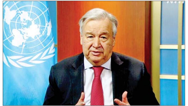
နေပြီဖြစ်ကြောင်း စက်တင်ဘာ ၁၈ ရက် တွင် ကြေညာခဲ့သည်။ လက်ဘနွန်နိုင်ငံ မြောက်ပိုင်း နယ်စပ်တစ်လျှောက်တွင် အစွဲအစွဲတပ်ဖွဲ့ဝင်များ ပိုမိုဖြန့်ကြက်

၂၀၂၄ ခုနှစ် ဇူလိုင်လ ၂၇၀၀ ကျော် ထိခိုက်ဒဏ်ရာရခဲ့ကြောင်း သိရသည်။ လက်ဘနွန်အခြေစိုက် ဟစ်ဘီဘိုလာ အဖွဲ့က အဆိုပါတိုက်ခိုက်မှုအတွက် အစွဲအစွဲကို စွပ်စွဲပြစ်တင်ခဲ့ပြီး လက်တုံ့ပြန် မည်ဖြစ်ကြောင်း ပြောကြားသည်။