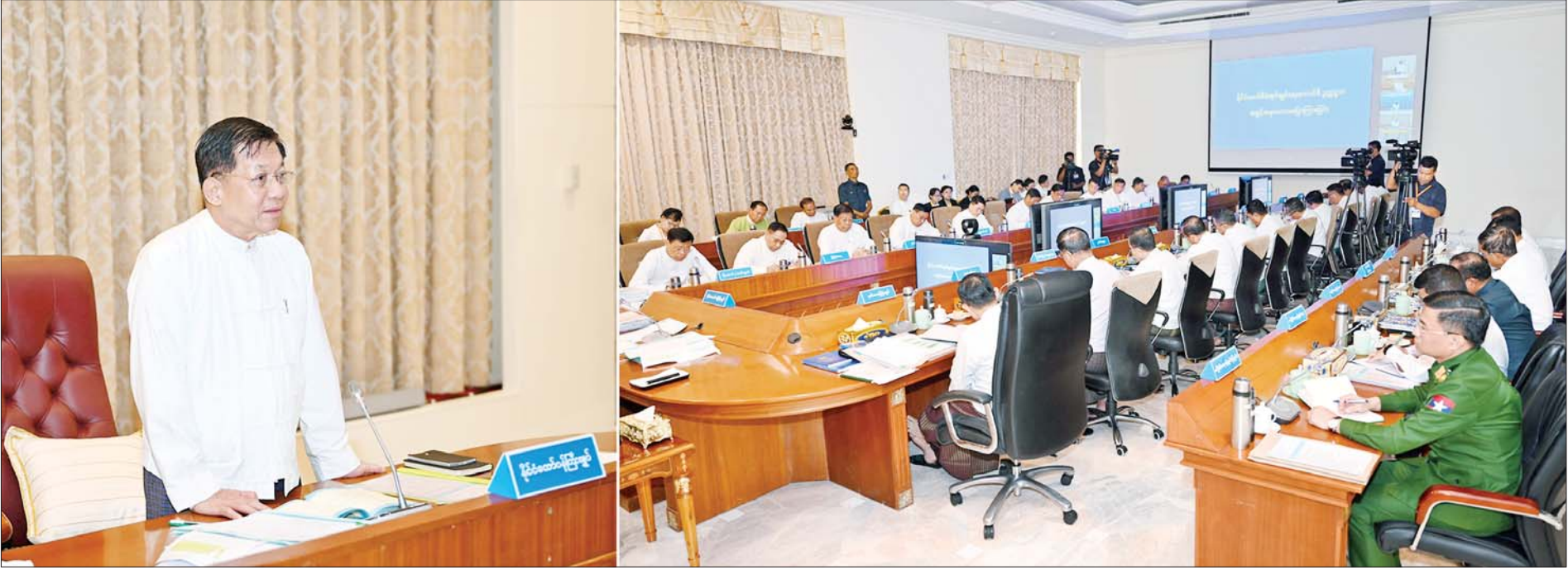
နိုင်ငံတော်စီမံအုပ်ချုပ်ရေးကောင်စီဥက္ကဋ္ဌ နိုင်ငံတော်ဝန်ကြီးချုပ် ဗိုလ်ချုပ်မှူးကြီးမင်းအောင်လှိုင် သဘာဝဘေးအန္တရာယ် စီမံခန့်ခွဲမှုဆိုင်ရာအစည်းအဝေးတွင် အမှာစကားပြောကြားစဉ်။