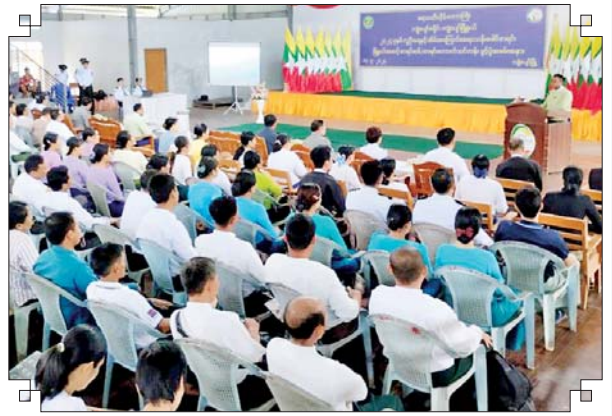
ကျိုပျော်မြို့နယ် မြို့နယ်(ပြန်/ဆက်)