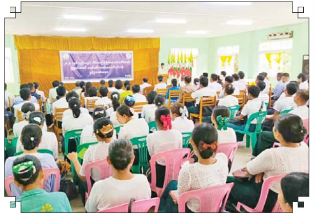
ဇီးကုန်းမြို့နယ် မြို့နယ်(ပြန်/ဆက်)