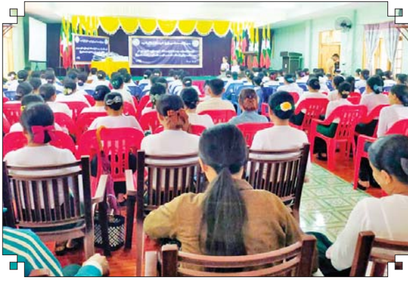
ပေါင်မြို့နယ် မွန်မလေး(ပြန်/ဆက်)