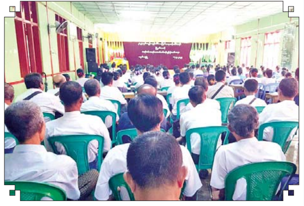
ချောင်းဆုံမြို့နယ် မြို့နယ်(ပြန်/ဆက်)