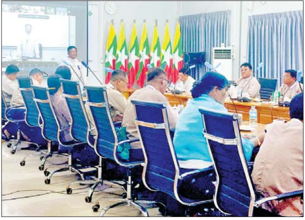
ခြင်း၊ ပညာရေးဆိုင်ရာ စိတ်ပညာ၊ သင်ကြားရေးဆိုင်ရာ ဗီဒီယို ထုတ်လွှင့်ခြင်း၊ စဉ်ဆက်မပြတ် အကဲဖြတ် စိစစ်ရေးလုပ်ငန်းစဉ်၊ ဆရာ ဆရာမများ၏ သွင်ပြင် လက္ခဏာများ၊ ကောင်းမွန်သော သင်ယူလေ့လာမှုဆိုင်ရာ စံနှုန်း စသော ဘာသာရပ်များကို

နေပြည်တော် စက်တင်ဘာ ၁၀ အခြေခံပညာနှင့် စက်မှု စိုက်ပျိုးရေးမြို့ရေး အထက်တန်း ကျောင်း ၈၅ ကျောင်းတွင် သင်ကြားရေးတာဝန် ထမ်းဆောင် လျက်ရှိကြသည့် စိုက်ပျိုးရေး ဘာသာရပ်ဆိုင်ရာ ဆရာ ဆရာမ များအား သင်ကြားရေးနည်းပညာ ရပ်များနှင့် ရုံးလုပ်ငန်းများ ကျွမ်းကျင်မှု မြှင့်တင်ရေး အထောက်အကူပြု သင်တန်းကို ယနေ့နံနက် ၁၀ နာရီက နေပြည် တော်ရှိ စိုက်ပျိုးရေးဦးစီးဌာန ရုံးချုပ်၌ ကျင်းပသည်။ သင်တန်း၌ သင်ကြားရေး နည်းစနစ်နှင့် မေးခွန်းပြင်ဆင်