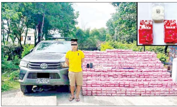
သိမ်းဆည်းရမိသည့် အိုက်စ(မက်သ်အဖက်တမင်း)နှင့်အတူ ဧည့်အစုအရ အရေးယူထားရှိပြီး အား စစ်ဆေးဖော်ထုတ်လျက် ကွင်းဆက်ပြစ်မှု ကျူးလွန်သူများ ရှိကြောင်း သိရသည်။ သတင်းစဉ်

နေပြည်တော် စက်တင်ဘာ ၁၀ - ရှမ်းပြည်နယ် (အရှေ့ပိုင်း) ကျိုင်းတုံမြို့နယ်တွင် ငွေကျပ် ၈ ဒသမ ၃၇ ဘီလီယံကျော်တန်ဖိုးရှိ အိုက်စ(မက်သ်အဖက်တမင်း) တစ်တန်ကျော် ဖမ်းဆီးရမိခဲ့ကြောင်း မြန်မာနိုင်ငံရဲတပ်ဖွဲ့မှ သိရသည်။ လုံခြုံရေး တပ်ဖွဲ့ဝင်များ ပါဝင်သော ပူးပေါင်းအဖွဲ့သည် စက်တင်ဘာ ၇ ရက် နံနက် ၄ နာရီခွဲတွင် ရှမ်းပြည်နယ် (အရှေ့ပိုင်း) ကျိုင်းတုံမြို့နယ် ယန်းကျိန် ကျေးရွာအနီး မိုင်းလား-ကျိုင်းတုံ