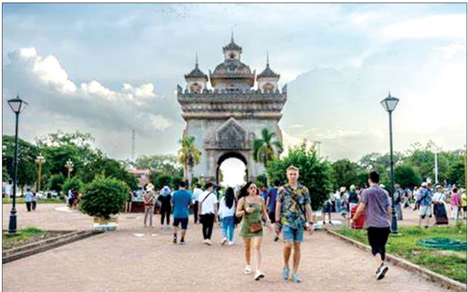
လာအိုခရီးသွားနှစ်ဦး နိုင်ငံအတွင်း ခရီးသွား နေထိုင်ခွင့်ပြုသည့်ကာလ တိုးမြှင့်သတ်မှတ်ခြင်းတို့ အများအပြားလာရောက်ရေးအတွက် ပြည်ဝင်ခွင့် ကို တာဝန်ရှိသူများက ဆောင်ရွက်နေသည်။ ဗီဇာကန့်သတ်ချက်များ ဖြေလျှော့ပေးခြင်းနှင့် ကိုးကား - ဆင်ဟွာ၊ ဘာသာပြန် - စိုးသူရ

လေ့ကျင့်သင်ကြားပေးမည်ဖြစ်ကြောင်း လာအို အမျိုးသား ရေဒီယိုအသံလွှင့်ဌာနက ပြောကြားသည်။ သင်တန်းတွင် ဧည့်လမ်းညွှန်တစ်ဦး သိရှိရမည့် အချက်အလက်များနှင့် လာအိုနိုင်ငံ၏ယဉ်ကျေးမှု ဆိုင်ရာအကြောင်းအရာများကိုလည်း သင်ကြားပေး မည်ဖြစ်သည်။ လက်ရှိအချိန်တွင် လာအိုနိုင်ငံ၏ ခရီးသွားလုပ်ငန်းသည် ဖွံ့ဖြိုးတိုးတက်မှုရရှိနေကာ ခရီးသွားကဏ္ဍနှင့် ဆက်စပ်နေသည့်လုပ်ငန်းများမှာ လည်း တိုးတက်မှုများရှိကြောင်းနှင့် ခရီးသွားလုပ်ငန်း ဖွံ့ဖြိုးတိုးတက်ရေးတွင် နိုင်ငံအတွင်းဒေသအသီးသီးရှိ ဒေသခံများကလည်း ပူးပေါင်းဆောင်ရွက်မှုများရှိ ကြောင်း လာအိုနိုင်ငံ ပြန်ကြားရေး၊ ယဉ်ကျေးမှုနှင့် ခရီးသွားလုပ်ငန်းဝန်ကြီးဌာန ဒုတိယဝန်ကြီး ဝဏ္ဏဇာနီဖိုမာဗွန်ဆာက ပြောကြားသည်။ ၂၀၂၄