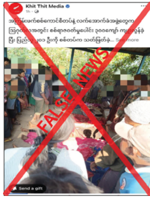
အခြေမရှိသည့် အချက်အလက်များကို လိုရာခွဲ ရေးသားခြင်းသာဖြစ်ကြောင်း သိရသည်။ သတင်းစဉ်

ပြည်သူအများ ထိခိုက်သေကျေပြီး စည်းစိမ်ဥစ္စာများ ဆုံးရှုံးပျက်စီးနေသည်ကို မျက်ကွယ်ပြု၍ တရားမဝင် ပြည်ပျက်မီဒီယာများက လုံခြုံရေးတပ်ဖွဲ့ဝင်များအပေါ် ပြည်သူများအထင်အမြင် လွှဲမှားစေရန်အတွက် ရည်ရွယ်ချက်ရှိရှိဖြင့် ယခုကဲ့သို့ အခြေ