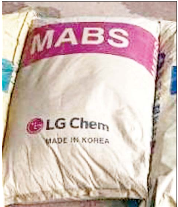
မရမ်းချောင်းအမြဲတမ်းစစ်ဆေးရေးစခန်း၌ သိမ်းဆည်းရမိမှု။

၂၀၀၀ သိမ်းဆည်းရမိခဲ့ပြီး ကွင်းဆက်အရ မောင်းနှင်ပြီး စိုင်းရန် လိုက်ပါလာသည့် ဆိုင်ကယ်ကို ရပ်တန့်စစ်ဆေးရာဖွေရာ စိတ်ပြောင်းဆေးဝါး Happy Water ၂ ဒသမ ၅ ကီလို သိမ်းဆည်းရမိခဲ့သဖြင့် ၎င်းတို့အား မူးယစ်ဆေးဝါးနှင့် စိတ်ကိုပြောင်းလဲစေသော ဆေးဝါးများဆိုင်ရာဥပဒေအရ အရေးယူထား ကြောင်း သိရသည်။ သတင်းစဉ်