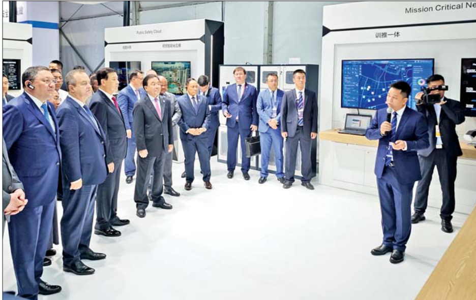
နိုင်ငံတော်စီမံအုပ်ချုပ်ရေးကောင်စီအဖွဲ့ဝင် ပြည်ထောင်စုဝန်ကြီး ဒုတိယဗိုလ်ချုပ်ကြီးရာပြည့်နှင့် မြန်မာကိုယ်စားလှယ်အဖွဲ့ လျန်ယွင်ကန်မြို့ရှိ ရဲလုပ်ငန်းဆိုင်ရာပစ္စည်းကိရိယာများနှင့် နည်းပညာပြပွဲသို့ သွားရောက်လေ့လာကြစဉ်။

နိုင်ငံတော် စီမံအုပ်ချုပ်ရေးကောင်စီအဖွဲ့ဝင် ပြည်ထောင်စုဝန်ကြီးဌာန ပြည်ထောင်စုဝန်ကြီး ဒုတိယဗိုလ်ချုပ်ကြီး ရာပြည့် ဦးဆောင်သော မြန်မာကိုယ်စားလှယ်အဖွဲ့၏ ၂၀၂၄ ခုနှစ် ကမ္ဘာလုံးဆိုင်ရာ ပြည်သူ့လုံခြုံရေးပူးပေါင်းဆောင်ရွက်မှုဖိုရမ်သို့ တက်ရောက်ခဲ့သည့် ခရီးစဉ်အတွင်း နှစ်နိုင်ငံပူးပေါင်းဆောင်ရွက်ရေးနှင့် နှစ်နိုင်ငံဝန်ကြီးဌာန နှစ်ခုအကြား ပူးပေါင်း ဆောင်ရွက်မှုများအပေါ် အပြုသဘောဆောင်သည့် ရလဒ်များကို ရရှိခဲ့ကြောင်း သိရသည်။