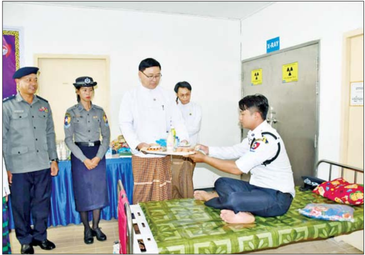
ကော့သောင်း စက်တင်ဘာ ၁၀ နှစ်(၆၀)ပြည့် မြန်မာနိုင်ငံရဲတပ်ဖွဲ့နေ့ကို ကြိုဆိုဂုဏ်ပြုသောအားဖြင့် ကော့သောင်းခရိုင် မြို့နယ်ရဲတပ်ဖွဲ့ဝင်များ၊ မိသားစုဝင်များ၊ သီးခြားတပ်ဖွဲ့မှ တပ်ဖွဲ့ဝင်များက စုပေါင်းသွေးလှူဒါန်းပွဲအခမ်းအနားကို ယနေ့နံနက်ပိုင်းက ကော့သောင်းမြို့ ပြည်သူ့ဆေးရုံကြီး၌ ကျင်းပသည်။