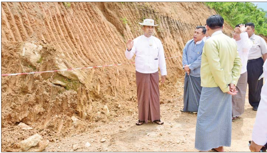
အကျိုးပြု ဧရိယာ ၅၈၉၇ ဧကဖြစ်ကြောင်း၊ ဒေသခံ တိုင်းရင်းသားပြည်သူများအတွက် စိုက်ပျိုးရေးလုပ်ငန်း များတွင် အကျိုးပြုလျက်ရှိကြောင်း သိရသည်။

တောင်ကြီး စက်တင်ဘာ ၁၀ ရှမ်းပြည်နယ်ဝန်ကြီးချုပ် ဦးအောင်အောင်၊ ပြည်နယ်ဝန်ကြီးများ၊ ပြည်နယ်အစိုးရအဖွဲ့ အတွင်း ရေးမှူးနှင့် တာဝန်ရှိသူများသည် စက်တင်ဘာ ၈ ရက် နံနက်ပိုင်းက တောင်ကြီးမြို့နယ်တွင် ဒေသ ဖွံ့ဖြိုးရေးလုပ်ငန်းများ ဆောင်ရွက်နေမှုကို ကွင်းဆင်းကြည့်ရှုစစ်ဆေးကြကြောင်း သိရသည်။