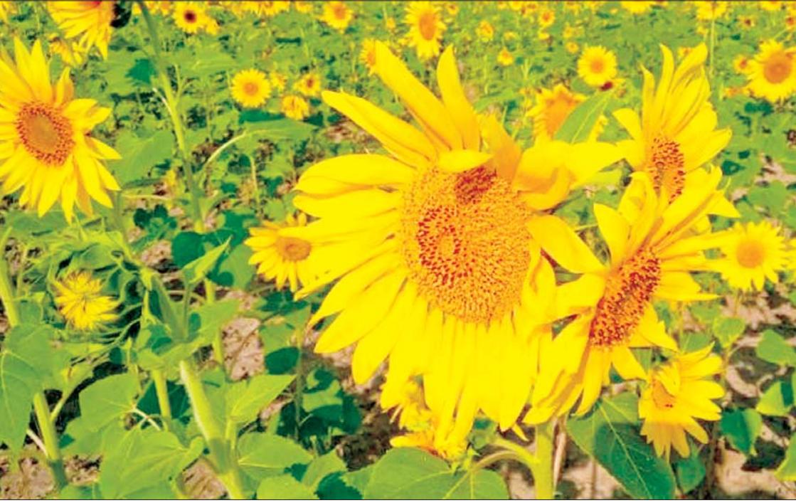
ရန်ကုန်တိုင်းဒေသကြီးအတွင်း ဆောင်းရာသီသီးနှံ နေကြာစိုက်ခင်းကိုတွေ့ရစဉ်။

ရန်ကုန် စက်တင်ဘာ ၁၀ ရန်ကုန် တိုင်းဒေသကြီးအတွင်း ယမန်နှစ်ဆောင်းရာသီ၌ ဆီထွက်သီးနှံဧက ၈၀၀၀ ကျော် စိုက်ပျိုးခဲ့ပြီး ယခုနှစ်ဆောင်းရာသီတွင် ၁၉၈၇၂ ဧက စိုက်ပျိုးရန် လျာထားဆောင်ရွက်လျက်ရှိရာ နိုင်ငံတော်၏ လမ်းညွှန်မှုနှင့်အညီ တစ်နှစ်ထက်တစ်နှစ် ဆီထွက်သီးနှံများ တိုးချဲ့စိုက်ပျိုးသွားရန် ဆောင်ရွက်ရာ၌ ယခုနှစ်ဆောင်းရာသီတွင် နေကြာ ဆီထွက်သီးနှံအား လျာထားချက်ထက် ၁၀၉၆၉ ဧက တိုးချဲ့စိုက်ပျိုးသွားမည် ဖြစ်ကြောင်း ရန်ကုန်တိုင်းဒေသကြီး စိုက်ပျိုးရေးဦးစီးဌာနမှ သိရသည်။ အဓိကထားစိုက်ပျိုးမည် ဆီထွက်သီးနှံများကို ခရိုင်ခုနစ်ခုရှိ မြို့နယ်ပေါင်း ၁၄ မြို့နယ်တို့တွင် နေကြာ၊ မြေပဲနှင့် နှမ်းကို အဓိကထား စိုက်ပျိုးသွားမည်ဖြစ်သည်။ စာမျက်နှာ ၃ ကော်လံ ၁ သို့ ၀