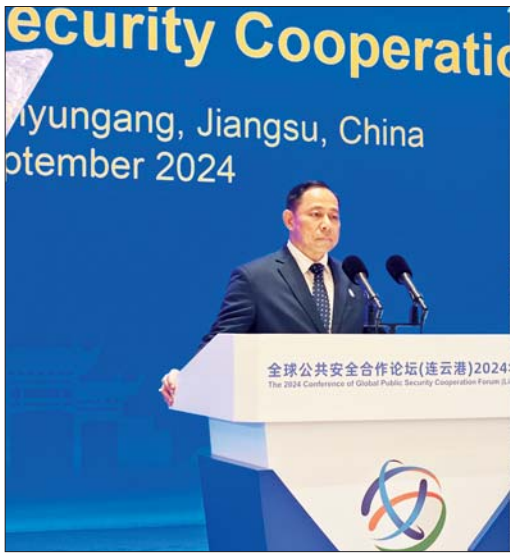
နိုင်ငံတော်စီမံအုပ်ချုပ်ရေးကောင်စီအဖွဲ့ဝင် ပြည်ထောင်စုဝန်ကြီး ဒုတိယဗိုလ်ချုပ်ကြီးရာပြည့် ၂၀၂၄ ခုနှစ် ကမ္ဘာလုံးဆိုင်ရာ ပြည်သူ့လုံခြုံရေးပူးပေါင်းဆောင်ရွက်မှုဖိုရမ်တွင် ဆွေးနွေးပြောကြားစဉ်။

နေပြည်တော် စက်တင်ဘာ ၁၀ နိုင်ငံတော် စီမံအုပ်ချုပ်ရေးကောင်စီအဖွဲ့ဝင် ပြည်ထောင်စုဝန်ကြီးရာပြည့် ဦးဆောင်သော မြန်မာကိုယ်စားလှယ်အဖွဲ့သည် တရုတ်ပြည်သူ့သမ္မတနိုင်ငံ ပြည်သူ့လုံခြုံရေးဆိုင်ရာဝန်ကြီးဌာန၏ ဖိတ်ကြားချက်အရ စက်တင်ဘာ ၈ ရက်မှ ၁၀ ရက်အထိ ၂၀၂၄ ခုနှစ် ကမ္ဘာလုံးဆိုင်ရာ ပြည်သူ့လုံခြုံရေးပူးပေါင်းဆောင်ရွက်မှုဖိုရမ်သို့ တက်ရောက်ပြီး ယနေ့တွင် လေကြောင်းခရီးစဉ်ဖြင့် ရန်ကင်းမြို့သို့ ပြန်လည်ရောက်ရှိရာ ရန်ကင်းတိုင်းဒေသကြီးဝန်ကြီးချုပ် ဦးစိုးသိန်းနှင့် ပြည်ထောင်စုဝန်ကြီးဌာနမှ တာဝန်ရှိသူများက ရန်ကင်းအပြည်ပြည်ဆိုင်ရာလေဆိပ်၌ ကြိုဆိုနှုတ်ဆက်ကြသည်။