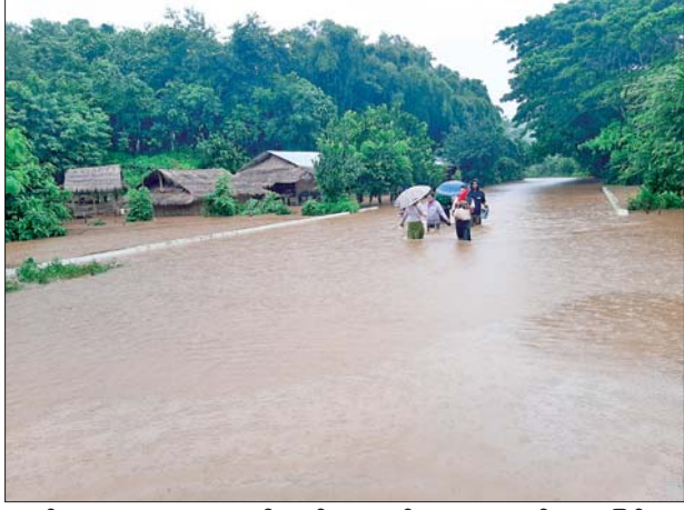
ယာဉ်များ သွားလာမှု မရရှိသည့် လည်း ရေကျော်မှုများဖြစ်ပွား အပြင် အဆိုပါလမ်းတစ်လျှောက် လျက်ရှိကြောင်း သိရသည်။ မြို့နယ်(ပြန်/ဆက်)

မိုင်းဖြတ် စက်တင်ဘာ ၁၀ ရှမ်းပြည်နယ် (အရှေ့ပိုင်း) တာချီလိတ်ခရိုင် မိုင်းဖြတ်မြို့နယ် တွင် စက်တင်ဘာ ၁၀ ရက်က မိုးအဆက်မပြတ် ရွာသွန်းမှုကြောင့် ရေကြီးရေလျှံမှုများ ဖြစ်ပွားကာ ကျေးရွာအချို့တွင် ရေဝင်ရောက်၍ လယ်ယာမြေ များ နစ်မြုပ်ခြင်း၊ ပြည်ထောင်စု လမ်းမပေါ်တွင် ရေလျှံမှုများ ဖြစ်ပွားလျက်ရှိကြောင်း သိရ သည်။ ထိုသို့ မိုးအဆက်မပြတ်ရွာသွန်း မှုကြောင့် မြို့နယ်အတွင်းရှိ နမ့်လုံ ချောင်း၊ နားလီချောင်း၊ မယ်ဟုတ် ချောင်းတို့တွင် ရေကြီးရေလျှံမှုများ ဖြစ်ပေါ်ခဲ့ပြီး ချောင်းများအနီးရှိ ဝမ်းနောင်၊ နားလီ၊ နမ့်ကုန်း၊ နန်းခမ်း တောင်ကျေးရွာများနှင့် ကျေးရွာ အချို့တို့တွင် လူနေအိမ်များ အတွင်းသို့ ရေဝင်ရောက်ခြင်း၊ လယ်ယာမြေများ ရေဖုံးလွှမ်းခြင်း တို့ ဖြစ်ပေါ်ခဲ့သည်။ ယာဉ်များသွားလာမှုမရ အလားတူ ရေကြီးရေလျှံမှုများ ကြောင့် ကျိုင်းတုံ-မိုင်းဖြတ်- တာချီလိတ်သွား ကားလမ်းဘေးရှိ နမ့်လုံချောင်း ရေလျှံမှုကြောင့် မိုင်တိုင်အမှတ်(၇၁၉) အနီး ကားလမ်းပေါ် ရေလျှံမှုဖြစ်ပွားပြီး