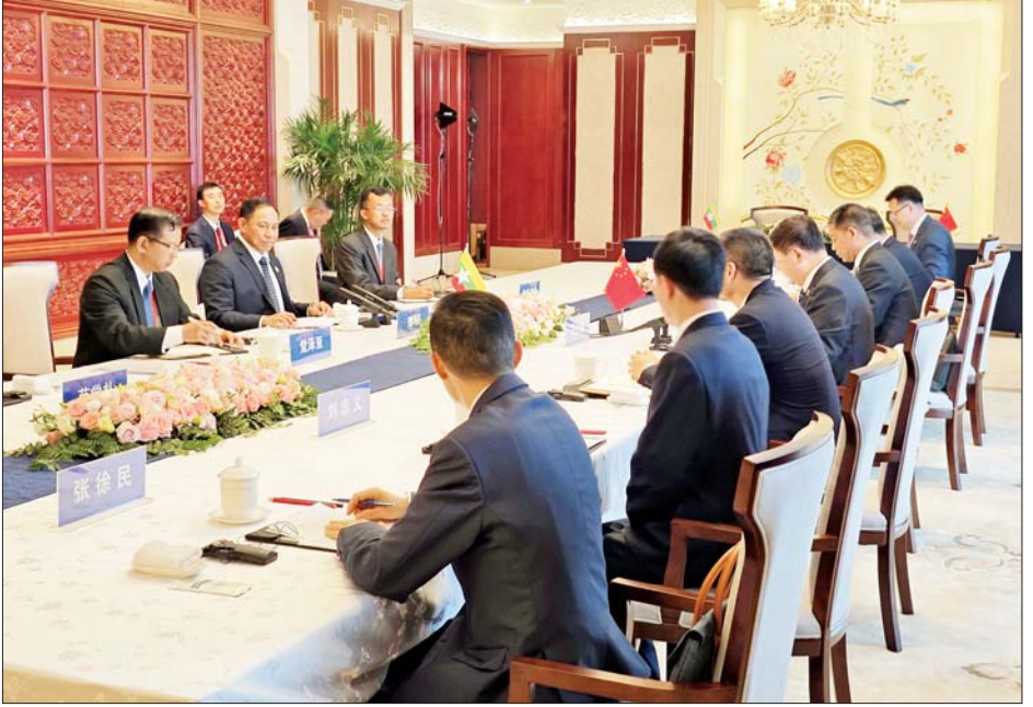
နိုင်ငံတော်စီမံအုပ်ချုပ်ရေးကောင်စီအဖွဲ့ဝင် ပြည်ထောင်စုဝန်ကြီး ဒုတိယဗိုလ်ချုပ်ကြီးရာပြည့်နှင့် တရုတ်ပြည်သူ့သမ္မတနိုင်ငံ ပြည်သူ့လုံခြုံရေးဆိုင်ရာဝန်ကြီးဌာန ဝန်ကြီး မစ္စတာ ဝမ်ရှောင်ဟုန် ဦးဆောင်သော ကိုယ်စားလှယ်အဖွဲ့တို့ တွေ့ဆုံဆွေးနွေးစဉ်။

ဝမ်ရှောင်ဟုန် ဦးဆောင်သော ကိုယ်စားလှယ်အဖွဲ့နှင့် တွေ့ဆုံကာ နှစ်နိုင်ငံလုံခြုံရေးနှင့် တရားဥပဒေစိုးမိုးရေး ပူးပေါင်းဆောင်ရွက်မှုဆိုင်ရာ ကိစ္စရပ်များကို ဆွေးနွေးခဲ့ကြပြီး မြန်မာ-တရုတ် နှစ်နိုင်ငံအကြား ရဲတပ်ဖွဲ့ပူးပေါင်းဆောင်ရွက်မှုဟိုဠာနု ထူထောင်မှုဆိုင်ရာ နားလည်မှုစာချုပ်လွှာနှင့် တရုတ်ယွမ်ငါးသန်း တန်ဖိုးရှိ