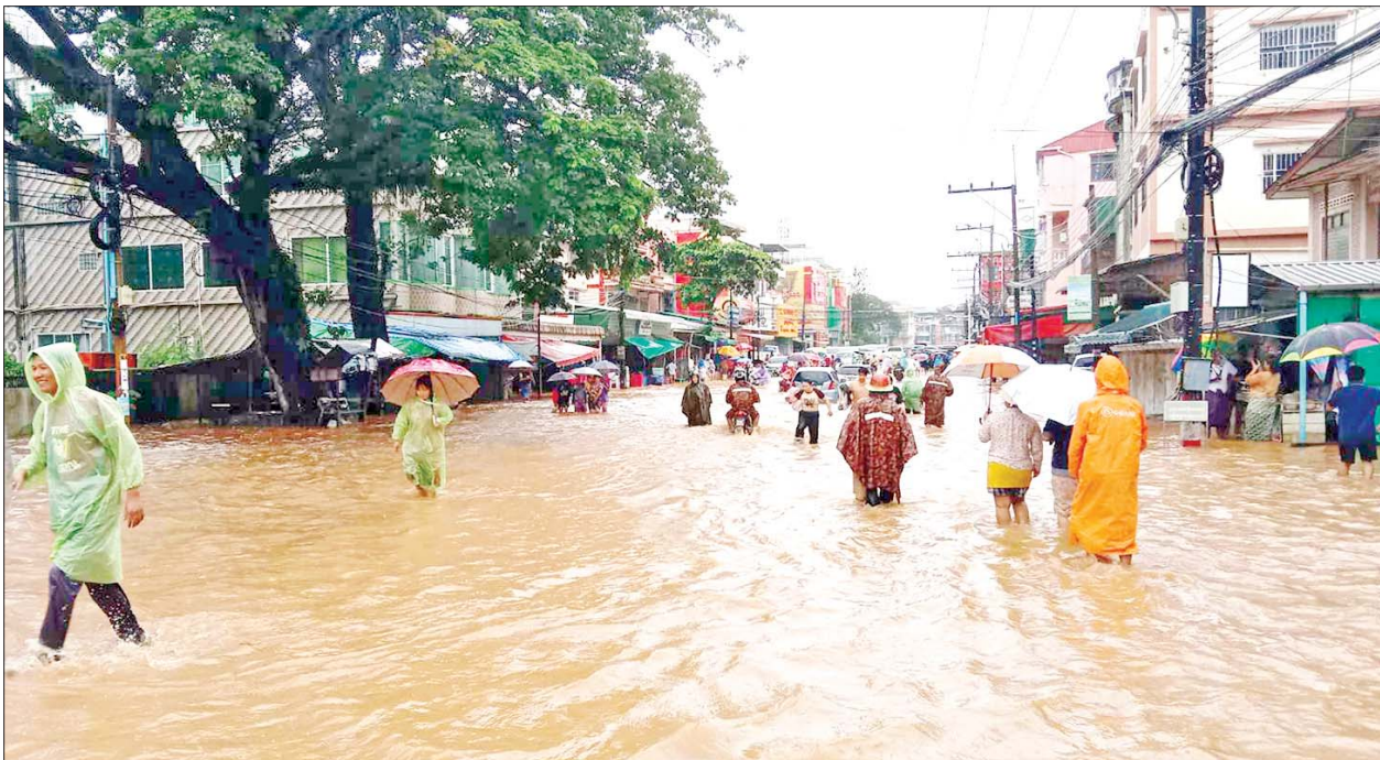
တာချီလိတ်မြို့၌ ရေကြီးရေလျှံမှုများ ဖြစ်ပေါ်လျက်ရှိသည်ကို တွေ့ရစဉ်။

တာချီလိတ် စက်တင်ဘာ ၁၀ တာချီလိတ်မြို့၌ စက်တင်ဘာ ၁၀ ရက် မွန်းလွဲ ၂ နာရီတွင် မယ်ဆိုင်ချောင်းရေသည် စိုးရိမ် ရေမှတ်အထက် ရောက်ရှိနေပြီး မြန်မာ-ထိုင်း ချစ်ကြည်ရေး တံတားအမှတ်(၁) အဝင်လမ်း ရေကျော်ခြင်းနှင့် မြို့ပေါ်ရပ်ကွက် ရှစ်ရပ်ကွက်ရှိ လူဦးရေ ၃၈၃၈ ဦးသည် ရေဘေးကြုံတွေ့နေရ သဖြင့် ကူညီကယ်ဆယ်ရေး လုပ်ငန်းများ အရှိန်မြှင့်ဆောင်ရွက် ပေးလျက်ရှိကြောင်း သိရသည်။ စက်တင်ဘာ ၈ ရက် နံနက် အစောပိုင်းမှစ၍ မိုးအဆက်မပြတ် ရွာသွန်းမှုကြောင့် နမ့်ယွန်းချောင်း၊ မယ်ခေါင်ချောင်းနှင့် မယ်ဆိုင် ချောင်း ရေကြီးရေလျှံမှုများကြောင့် စာမျက်နှာ ၁၉ ကော်လံ ၁ သို့ ၂