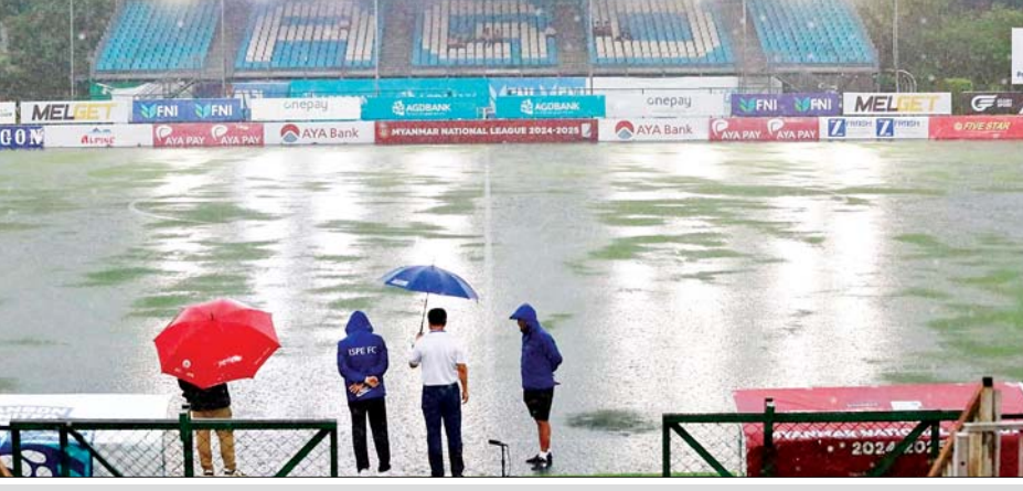
MNL ပွဲစဉ်ဖြစ်သည့် ရတနာပုံနှင့် အား/ကာသိပွဲအသင်း ပွဲကစားသည့် YUSC ကွင်းအတွင်း ရေဝပ်နေမှုကို တွေ့ရစဉ်။

ရန်ကုန် စက်တင်ဘာ ၆ စက်တင်ဘာ ၆ ရက် ညနေပိုင်းက ရန်ကုန်မြို့၌ ကျင်းပသည့် ပြည်တွင်းဘောလုံးပွဲအချို့မှာ မိုးသည်းထန်စွာရွာသွန်းမှုကြောင့် ပွဲမပြီးခင် ရပ်နားခဲ့ရပြီး ရွှေဆိုင်လိဂ်ကြောင့် သိရသည်။ ၂၀၂၄-၂၀၂၅ ရာသီ MNL အမှတ်ပေးပြိုင်ပွဲ ပွဲစဉ်(၉) ပထမနေ့အဖြစ် ရတနာပုံအသင်းနှင့် အား/ကာသိပွဲအသင်းသည် YUSC ကွင်း၌ ယှဉ်ပြိုင်ကစားရာ ပထမပိုင်းအပြီးတွင် ရပ်နားခဲ့ရသည်။ မိုးသည်းထန်စွာရွာသွန်းမှုကြောင့် ကွင်းအတွင်း ရေများဝပ်နေပြီး ဒုတိယပိုင်းမစတင်မီ မိနစ် ၃၀ စောင့်ဆိုင်းသော်လည်း မိုးအဆက်မပြတ်ရွာသွန်းနေခြင်း၊ ကွင်းအတွင်း ရေဝပ်မှုများပြားခြင်းနှင့် ပွဲကစားရန် လုံလောက်သည့် အလင်းရောင်မရှိခြင်းတို့ကြောင့် ပြိုင်ပွဲကြီးကြပ်သူ၊ ဒိုင်ကြီးကြပ်၊ နှစ်ဖက်အသင်းတာဝန်ရှိသူများညှိနှိုင်းကာ ပထမပိုင်းအပြီး