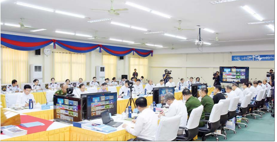
နိုင်ငံတော်စီမံအုပ်ချုပ်ရေးကောင်စီ ဒုတိယဥက္ကဋ္ဌ ဒုတိယဝန်ကြီးချုပ် ဒုတိယဗိုလ်ချုပ်မှူးကြီးစိုးဝင်း ဗဟိုသန်းခေါင်စာရင်းကော်မရှင်၏ ပဉ္စမအကြိမ် လုပ်ငန်းညှိနှိုင်းအစည်းအဝေးတွင် အမှာစကားပြောကြားစဉ်။