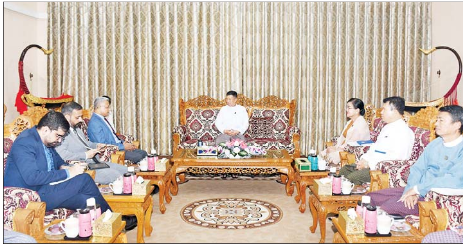
အတွက် ရှေးဟောင်းသုတေသနနှင့် အမျိုးသား ပြတိုက်ပညာမဟာဘွဲ့သင်တန်းအတွက်သင်တန်းသား ပြတိုက်ဦးစီးဌာနမှ သင်တန်းသားနှစ်ဦးခန့်နှင့် နှစ်ဦးခန့် နှစ်စဉ်ခေါ်ယူရေး၊ Information Technology

နေပြည်တော် စက်တင်ဘာ ၆ သာသနာရေးနှင့် ယဉ်ကျေးမှုဝန်ကြီးဌာန ပြည်ထောင်စုဝန်ကြီး ဦးတင်ဦးလွင်သည် အိန္ဒိယ နိုင်ငံသံအမတ်ကြီး မစ္စတာ အဘ်ဟေး တာကူးရ် အား ယနေ့ညနေ ၄ နာရီတွင် နေပြည်တော်ရှိ သာသနာရေးနှင့် ယဉ်ကျေးမှုဝန်ကြီးဌာန ပြည်ထောင်စု ဝန်ကြီး၏ ဧည့်ခန်းမ၌ လက်ခံတွေ့ဆုံသည်။ တွေ့ဆုံစဉ် မြန်မာ-အိန္ဒိယ နှစ်နိုင်ငံအကြား ချစ်ကြည်ရင်းနှီးသော ဆက်ဆံရေးကိုအခြေခံ၍ သာသနာရေးနှင့် ယဉ်ကျေးမှုကဏ္ဍဆိုင်ရာကိစ္စရပ် များတွင် နှစ်နိုင်ငံ ပူးပေါင်းဆောင်ရွက်မှုများ တိုးမြှင့်ရေး၊ ပညာတော်သင်များ အပြန်အလှန် စေလွှတ်ရေးနှင့် အိန္ဒိယနိုင်ငံတွင် Archaeological Survey of India (ASI)မှ ဖွင့်လှစ်သည့် Field School of Archaeology တွင် ဘွဲ့လွန်ဒီပလိုမာသင်တန်း