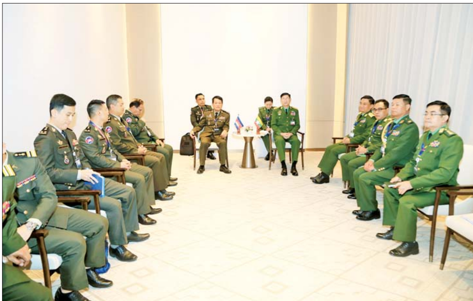
ကာကွယ်ရေးဦးစီးချုပ်ရုံး(ကြည်း)မှ စစ်ရေးချုပ် ဒုတိယဗိုလ်ချုပ်ကြီး စိုးမင်းဦးနှင့် ကမ္ဘောဒီးယား ဘုရင့်တပ်မတော်ကာကွယ်ရေးဦးစီးချုပ် General Vong Pisen တို့ တွေ့ဆုံဆွေးနွေးစဉ်။