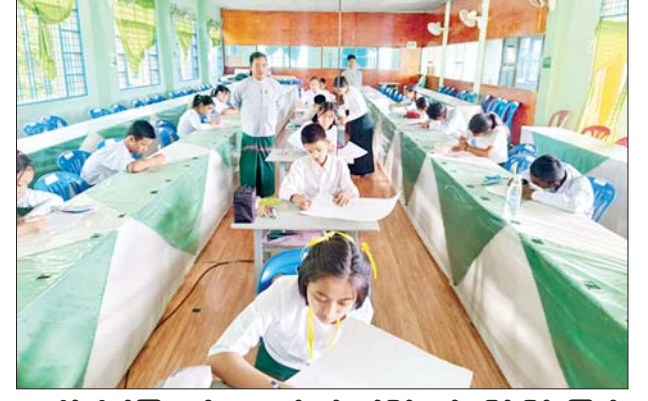
ပူးပေါင်းပါဝင်ကြစေလိုသော ရည်ရွယ်ချက်ဖြင့် ကျင်းပခြင်းဖြစ်ကြောင်း သိရသည်။ ဇာဖြူဝင်း(မြဝတီ)

ပေးခိုင်းအဖွဲ့ ဆရာ၊ ဆရာမများက ပြိုင်ပွဲစည်းကမ်းများ ဖတ်ကြားပေးသည်။ ပြိုင်ပွဲကိုစတင်ခဲ့ရာ “မွန်ထရီရယ်နောက်ဆက်တွဲစာချုပ်ရည်မှန်းချက်အောင်မြင်ဖို့ ရာသီဥတုပြောင်းလဲမှုတိုက်ဖျက်ရေး တိုးမြှင့်ဆောင်ရွက်ဖို့” ခေါင်းစဉ်ဖြင့် အထက်တန်းအဆင့် စာစီစာကုံးပြိုင်ပွဲတွင် ကျောင်းသားကျောင်းသူ ၄၀ ဦး၊ အလယ်တန်းအဆင့်တွင် ကျောင်းသား ကျောင်းသူ ခြောက်ဦးနှင့် မူလတန်းအဆင့် ပန်းချီပြိုင်ပွဲတွင် ကျောင်းသား ကျောင်းသူ ခြောက်ဦးတို့က ပါဝင်ယှဉ်ပြိုင်ခဲ့ပြီး ပြိုင်ပွဲတွင် ဆုရရှိသူများအား ကမ္ဘာ့အိုဇုန်းလွှာထိန်းသိမ်းရေးနေ့တွင် ဆုများပေးအပ်ချီးမြှင့်သွားမည်ဖြစ်သည်။ အဆိုပါပြိုင်ပွဲ ကျင်းပခြင်းအားဖြင့် ကျောင်းသား ကျောင်းသူများအနေဖြင့် အိုဇုန်းလွှာထိခိုက်ပျက်စီးဆုံးရှုံးမှု ကာကွယ်ထိန်းသိမ်းနိုင်ရန်နှင့် ရာသီဥတုပြောင်းလဲမှု တိုက်ဖျက်ရေး လုပ်ငန်းစဉ်များတွင်