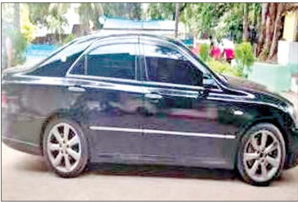
၂၀၂၄ ခုနှစ် ဩဂုတ်လအတွင်း သိမ်းဆည်းရမိမှု။

တရားမဝင်ကုန်သွယ်မှုတိုက်ဖျက်ရေး ဦးဆောင်ကော်မတီ၏ ကြီးကြပ်ကွပ်ကဲမှုဖြင့် နေပြည်တော်ကောင်စီနယ်မြေ အပါအဝင် တိုင်းဒေသကြီး၊ ပြည်နယ်များတွင် တရားမဝင်ကုန်သွယ်မှုတိုက်ဖျက်ရေး အထူးအဖွဲ့များကို ဖွဲ့စည်း၍လည်းကောင်း၊ အကောက်ခွန်ဦးစီးဌာနက ဦးဆောင်သည့် One Stop Service ဌာနဆိုင်ရာအဖွဲ့များ ဖွဲ့စည်း၍လည်း ကောင်း၊ နယ်စပ်ဝင်/ထွက်ဂိတ်များ၊ နယ်စပ်ကုန်သွယ်ရေးရုံးနှင့် စခန်းများ၊ အမြဲတမ်းစစ်ဆေးရေးစခန်းများ၊ ကုန်သွယ်မှုလမ်းကြောင်းတစ်လျှောက်နှင့် ကုန်ပစ္စည်းသိုလှောင်ရုံများ၊ အပြည်ပြည်ဆိုင်ရာဆိပ်ကမ်းများနှင့် လေဆိပ်များ၊ ကမ်းရိုးတန်းဆိပ်ကမ်းများတွင် တရားမဝင်ကုန်သွယ်မှုတိုက်ဖျက်ရေးလုပ်ငန်းများကို ထိရောက်စွာ ဆောင်ရွက်လျက်ရှိရာ သတင်းအချက်အလက်ရရှိမှုသည် အလွန်အရေးပါလျက်ရှိသည်။