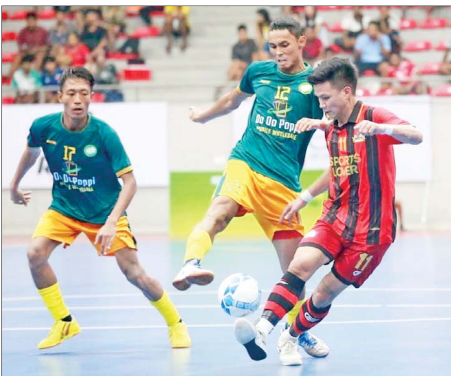
VUC အသင်းနှင့် Futsal-19 အသင်းတို့ ယှဉ်ပြိုင်ကစားကြစဉ်။