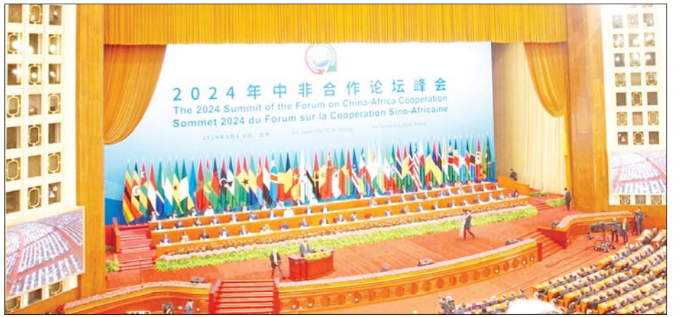
၆ ရက်အထိ ကျင်းပမည်ဖြစ်ပြီး အာဖရိကနိုင်ငံ ၅၃ တက်ရောက်ဆွေးနွေးကြမည်ဖြစ်ကြောင်း သိရ နိုင်ငံမှ နိုင်ငံ့ခေါင်းဆောင်များနှင့်တာဝန်ရှိသူများ သည်။ (သုတေသန)

တက်ရောက်ဆွေးနွေးကြမည် “ခေတ်မီရေးကို လက်တွဲတွန်းအားပေးပြီး အရည်အသွေးမြင့် တရုတ်-အာဖရိက ကံကြမ္မာ အသိုင်းအဝိုင်းကို လက်တွဲတည်ဆောက်ခြင်း” ခေါင်းစဉ်ဖြင့် တရုတ်-အာဖရိကပူးပေါင်းဆောင်ရွက် ရေးဖိုရမ် 2024 FOCAC ကို စက်တင်ဘာ ၄ ရက်မှ