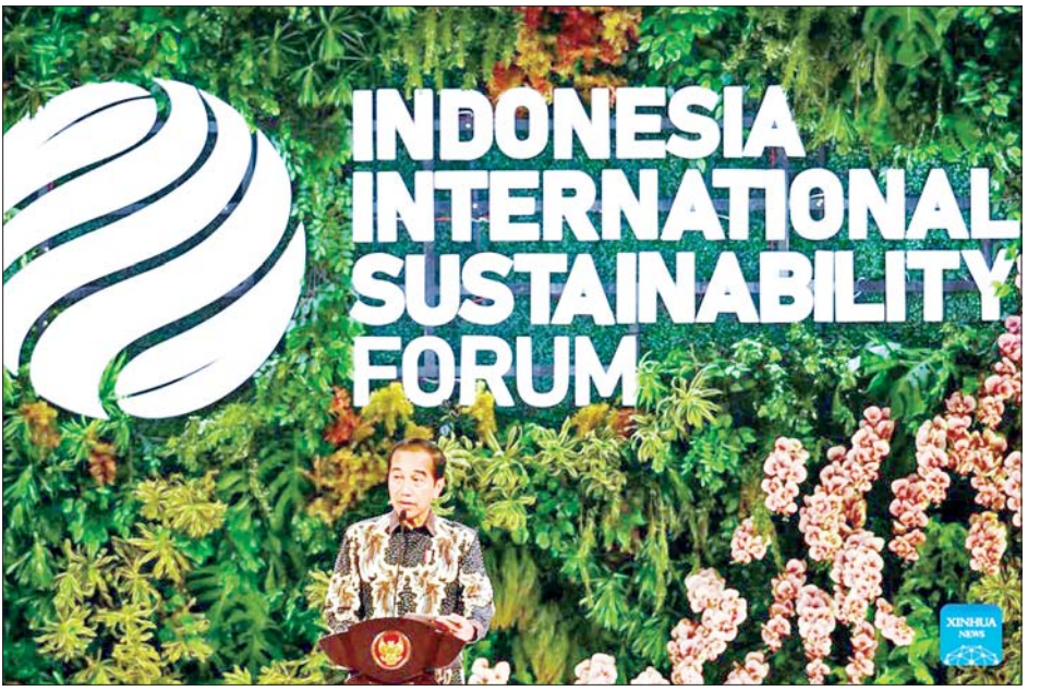
ပြောကြားသည်။ အင်ဒိုနီးရှားနိုင်ငံသည် ပိုမိုစိမ်းလန်းသောကမ္ဘာကို ဖန်တီးရန်နှင့် အစိမ်းရောင်စွမ်းအင်ကို တရားမျှတစွာရရှိရေးအတွက် ကမ္ဘာ့နိုင်ငံများနှင့် ပူးပေါင်းဆောင်ရွက်သွားမည်ဖြစ်ကြောင်း သမ္မတဂျိုကိုဝီဒိုဒိုက ပြောကြားသည်။ ကိုးကား - ဆင်ဟွာ ဘာသာပြန် - အောင်ကျော်ကျော်

နိုင်စေရန်နှင့် ရာသီဥတုပြောင်းလဲမှု၏စိန်ခေါ်မှုကို ကိုင်တွယ်ဖြေရှင်းရာတွင် ပူးပေါင်းဆောင်ရွက်မှုကို မြှင့်တင်ရန် အသိပညာ၊ အတွေ့အကြုံနှင့် အရင်းအမြစ်များကို ပေါင်းစည်းနိုင်သည့် ပလက်ဖောင်းတစ်ခုအဖြစ် ဆောင်ရွက်ပေးနိုင်မည်ဟု မျှော်လင့်ကြောင်း ၎င်းက ပြောကြားသည်။ စိမ်းလန်းသော စွမ်းအင်နှင့် ကာဗွန်စုတ်ယူမှုအတွက် အင်ဒိုနီးရှားနိုင်ငံ၏ ဟက်တာ ၃ ဒသမ ၃ သန်းရှိသော ဒီရေတောများသည် အပူပိုင်းမိုးသစ်တောများထက် ကာဗွန်စုတ်ယူမှု ရှစ်ဆမှ ၁၂ ဆ ပိုမိုထိရောက်ကြောင်း သမ္မတဂျိုကိုဝီဒိုဒိုက ထောက်ပြခဲ့သည်။ သို့သော် ဖွံ့ဖြိုးပြီးနိုင်ငံများသည် ၎င်းတို့၏ ရင်းနှီးမြုပ်နှံမှု ကြိုးပမ်းမှုများကို အရှိန်မြှင့်ပြီး ဖွံ့ဖြိုးဆဲနိုင်ငံများအတွက် ရန်ပုံငွေများကို ပံ့ပိုးပေးမှသာ ယင်းအလားအလာကို အပြည့်အဝ အကောင်အထည်ဖော်နိုင်မည်ဖြစ်ကြောင်း ၎င်းက အလေးအနက်