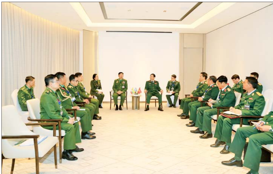
ကာကွယ်ရေးဦးစီးချုပ်ရုံး(ကြည်း)မှ စစ်ရေးချုပ် ဒုတိယဗိုလ်ချုပ်ကြီး စိုးမင်းဦးနှင့် ဗီယက်နမ် အမျိုးသားကာကွယ်ရေးဝန်ကြီးဌာန ဒုတိယဝန်ကြီးနှင့် ဗီယက်နမ်ပြည်သူ့တပ်မတော် စစ်ဦးစီးအရာရှိချုပ် Senior Lieutenant General Nguyen Tan Cuong တို့ တွေ့ဆုံဆွေးနွေးစဉ်။