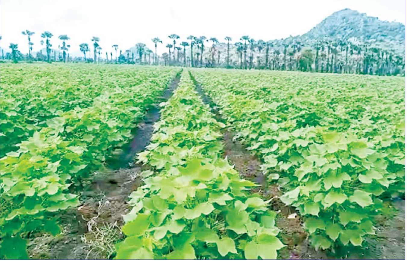
ကျောက်ဆည်မြို့နယ်၌ ဝါစိုက်ပျိုးထားရှိမှုကို တွေ့ရစဉ်။