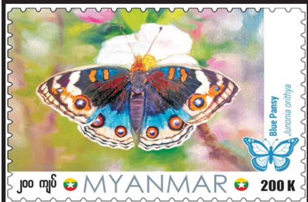
Blue Pansy Junonia orithya