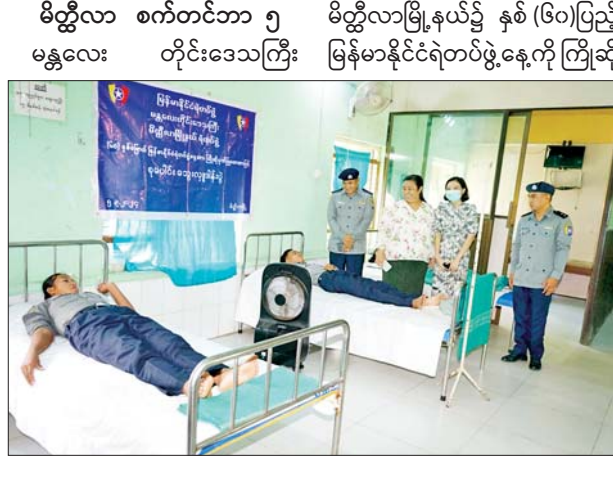
မိတ္ထီလာ စက်တင်ဘာ ၅ မန္တလေး တိုင်းဒေသကြီး