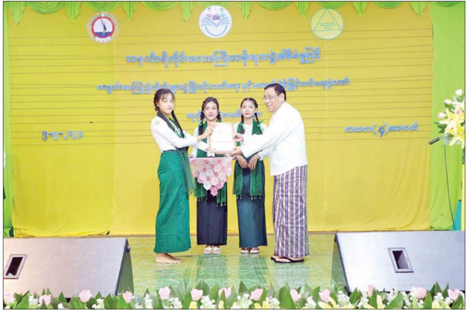
ထားဝယ်မြို့၌ ကျောင်းစာကြည့်တိုက်များဖွံ့ဖြိုးတိုးတက်ရေးနှင့် စာဖတ်ရိုက်မြှင့်တင်ရေးပွဲတော် ဆုချီးမြှင့်ပွဲကျင်းပသော ကျောင်းသား ကျောင်းသူများအားလည်းကောင်း၊ တိုင်းဒေသကြီးလမ်းပန်းဆက်သွယ်ရေး ကျောင်းသူများအားလည်းကောင်း ဆုများပေးအပ်ချီးမြှင့်သည်။ တိုင်းဒေသကြီး(ပြန်/ဆက်)

တရားသူကြီးချုပ် ဒေါ်ပိုက်ပိုက်အေးက စာစီစာကုံး (အထက်တန်း) အဆင့်တွင် ဆုရရှိသော ကျောင်းသားကျောင်းသူများအား ဆုချီးမြှင့်သည်။ ဆက်လက်၍ တိုင်းဒေသကြီးလုံခြုံရေးနှင့် နယ်စပ်ရေးရာဝန်ကြီး ဗိုလ်မှူးကြီး မင်းမင်းလတ်က အထက်တန်းအဆင့် ကျပန်းစကားပြောပြိုင်ပွဲတွင် ဆုရရှိသောကျောင်းသား ကျောင်းသူများအားလည်းကောင်း၊ တိုင်းဒေသကြီး စီးပွားရေးရာဝန်ကြီး ဦးမောင်ကြီးက စာစီစာကုံး(အလယ်တန်း) အဆင့်တွင် ဆုရရှိသောကျောင်းသား ကျောင်းသူများအားလည်းကောင်း၊ တိုင်းဒေသကြီးသယံဇာတရေးရာဝန်ကြီး ဦးခင်မောင်မြင့်က အလယ်တန်းအဆင့် ကျပန်းစကားပြောပြိုင်ပွဲတွင် ဆုရရှိသော ကျောင်းသား ကျောင်းသူများအားလည်းကောင်း၊ တိုင်းဒေသကြီးလူမှုရေးရာဝန်ကြီး ဦးသက်နိုင်က အလယ်တန်းအဆင့်ကဗျာရွတ်ဆိုပြိုင်ပွဲတွင်ဆုရရှိ