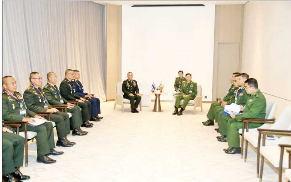
ကာကွယ်ရေးဦးစီးချုပ်(ကြည်း)မှ စစ်ရေးချုပ် ဒုတိယဗိုလ်ချုပ်ကြီး စိုးမင်းဦးနှင့် ထိုင်းဘုရင့် တပ်မတော်ကာကွယ်ရေးဦးစီးချုပ် General Songwit Noonpackdee တို့ တွေ့ဆုံဆွေးနွေးစဉ်။

သီးခြားစီတွေ့ဆုံ ယင်းနောက် မွန်းလွဲပိုင်းတွင် ကာကွယ်ရေးဦးစီးချုပ်(ကြည်း) မှ ဒုတိယဗိုလ်ချုပ်ကြီး စိုးမင်းဦး သည် ထိုင်းဘုရင့်တပ်မတော် ကာကွယ်ရေးဦးစီးချုပ် General Songwit Noonpackdee၊ ဗီယက်နမ် အမျိုးသားကာကွယ် ရေးဝန်ကြီးဌာန ဒုတိယဝန်ကြီးနှင့် ဗီယက်နမ် ပြည်သူ့တပ်မတော် စစ်ဦးစီးအရာရှိချုပ် Senior Lieutenant General Nguyen Tan Cuong နှင့် ကမ္ဘောဒီးယား ဘုရင့်တပ်မတော် ကာကွယ်ရေး ဦးစီးချုပ် General Vong Pisen တို့နှင့် သီးခြားစီ Bilateral Meeting များ တွေ့ဆုံခဲ့ကြသည်။ ထိုသို့တွေ့ဆုံရာတွင် နှစ်နိုင်ငံ တပ်မတော် နှစ်ရပ်အကြား ချစ်ကြည်ရင်းနှီးမှု ပိုမိုတိုးမြှင့် ဆောင်ရွက်ရေးနှင့် ပူးပေါင်း ဆောင်ရွက်ရေး ကိစ္စရပ်များကို ရင်းနှီးပွင့်လင်းစွာ ဆွေးနွေးကြ ပြီး အမှတ်တရ လက်ဆောင် ပစ္စည်းများ အပြန်အလှန် ပေးအပ် ကြသည်။ စာမျက်နှာ ၄ သို့ ☆