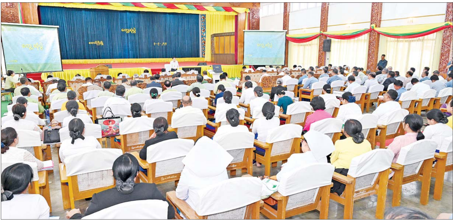
နိုင်ငံတော်စီမံအုပ်ချုပ်ရေးကောင်စီဥက္ကဋ္ဌ နိုင်ငံတော်ဝန်ကြီးချုပ် ဗိုလ်ချုပ်မှူးကြီး မင်းအောင်လှိုင် ရှမ်းပြည်နယ်အစိုးရအဖွဲ့ဝင်များ၊ ပြည်နယ်နှင့် ခရိုင်အဆင့် ဌာနဆိုင်ရာ တာဝန်ရှိသူများအား တောင်ကြီးမြို့ မြို့တော်ခန်းမ၌ တွေ့ဆုံအမှာစကားပြောကြားစဉ်။

နေပြည်တော် စက်တင်ဘာ ၃ နိုင်ငံတော် စီမံအုပ်ချုပ်ရေး ကောင်စီဥက္ကဋ္ဌ နိုင်ငံတော်ဝန်ကြီး ချုပ်ဗိုလ်ချုပ်မှူးကြီး မင်းအောင်လှိုင် သည် ယနေ့နံနက်ပိုင်းတွင် ရှမ်းပြည်နယ်အစိုးရအဖွဲ့ဝင်များ၊ ပြည်နယ်နှင့် ခရိုင်အဆင့် ဌာန ဆိုင်ရာ တာဝန်ရှိသူများအား တောင်ကြီးမြို့ မြို့တော်ခန်းမ၌ တွေ့ဆုံ အမှာစကားပြောကြား သည်။