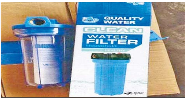
အေးရှားဝေါလ်ကုန်သေတ္တာစစ်ဆေးရေးစခန်း၌ သိမ်းဆည်းရမိမှု။

ထို့အတူ စက်တင်ဘာ ၂ ရက် တွင် နေပြည်တော်ကောင်စီ တရား မဝင်ကုန်သွယ်မှု တိုက်ဖျက်ရေး အထူးအဖွဲ့၏ စီမံခန့်ခွဲမှုဖြင့် တာဝန်ကျ ပေးပေး အဖွဲ့က စစ်ဆေးမှုများ ဆောင်ရွက်ခဲ့ရာ တာဝန်ကျ ပေးပေး အဖွဲ့က စစ်ဆေးမှုများ ဆောင်ရွက်ခဲ့ရာ ၃ ကွီလိုသီရီမြို့နယ်နှင့် လယ်ဝေး မြို့နယ်တို့အတွင်း၌ လိုင်စင်မဲ့ ယာဉ်နှစ်စီးနှင့် ဆိုင်ကယ်တစ်စီး စုစုပေါင်းခန့်မှန်းတန်ဖိုးငွေကျပ် ၄၃၃၀၀၀၀၀ ကို သိမ်းဆည်းရမိ ခဲ့ပြီး ပို့ကုန်သွင်းကုန် ဥပဒေနှင့် အညီအရေးယူ ဆောင်ရွက်လျက် ရှိသည်။ ထို့ပြင် စက်တင်ဘာ ၂ ရက်တွင် ရန်ကုန်တိုင်းဒေသကြီး တရားမဝင် ကုန်သွယ်မှု တိုက်ဖျက်ရေး အထူး အဖွဲ့၏ စီမံခန့်ခွဲမှုဖြင့် တာဝန်ကျ ပေးပေး အဖွဲ့များက စစ်ဆေးမှု များဆောင်ရွက်ခဲ့ရာ လှည်းကူး မြို့နယ်နှင့် တာမွေမြို့နယ်တို့၌ လိုင်စင်မဲ့ယာဉ်နှစ်စီး စုစုပေါင်းခန့် မှန်းတန်ဖိုးငွေကျပ် ၉၀၀၀၀၀၀ ကို သိမ်းဆည်းရမိခဲ့ပြီး ပို့ကုန်သွင်းကုန် ဥပဒေနှင့်အညီ အရေးယူ ဆောင်ရွက်လျက်ရှိသည်။ စက်တင်ဘာ ၃ ရက်တွင် စစ်ကိုင်း တိုင်းဒေသကြီး တရားမဝင် ကုန်သွယ်မှု တိုက်ဖျက်ရေး အထူး အဖွဲ့၏ စီမံခန့်ခွဲမှုဖြင့် တာဝန်ကျ ပေးပေး အဖွဲ့က စစ်ဆေးမှုများ ဆောင်ရွက်ခဲ့ရာ ကန့်ဘလူမြို့ အမှတ်(၂)ရပ်ကွက်၌ တရားမဝင် အခြားသစ် ၄ ဒသမ ၉၄၉ တန် (ခန့်မှန်းတန်ဖိုးငွေကျပ် ၂၅၇၇၈၆၄) ကို သစ်တောဥပဒေအရ လည်း ကောင်း၊ မုံရွာမြို့နယ်အတွင်း၌ လိုင်စင်မဲ့ သုံးဘီးဆိုင်ကယ်တစ်စီး (ခန့်မှန်းတန်ဖိုးငွေကျပ် ၁၀၀၀၀၀၀) ကို ပို့ကုန်သွင်းကုန် ဥပဒေအရ လည်းကောင်း စုစုပေါင်းခန့်မှန်း တန်ဖိုးငွေကျပ် ၃၂၇၇၈၆၄ ကို သိမ်းဆည်းအရေးယူ ဆောင်ရွက် လျက်ရှိသည်။