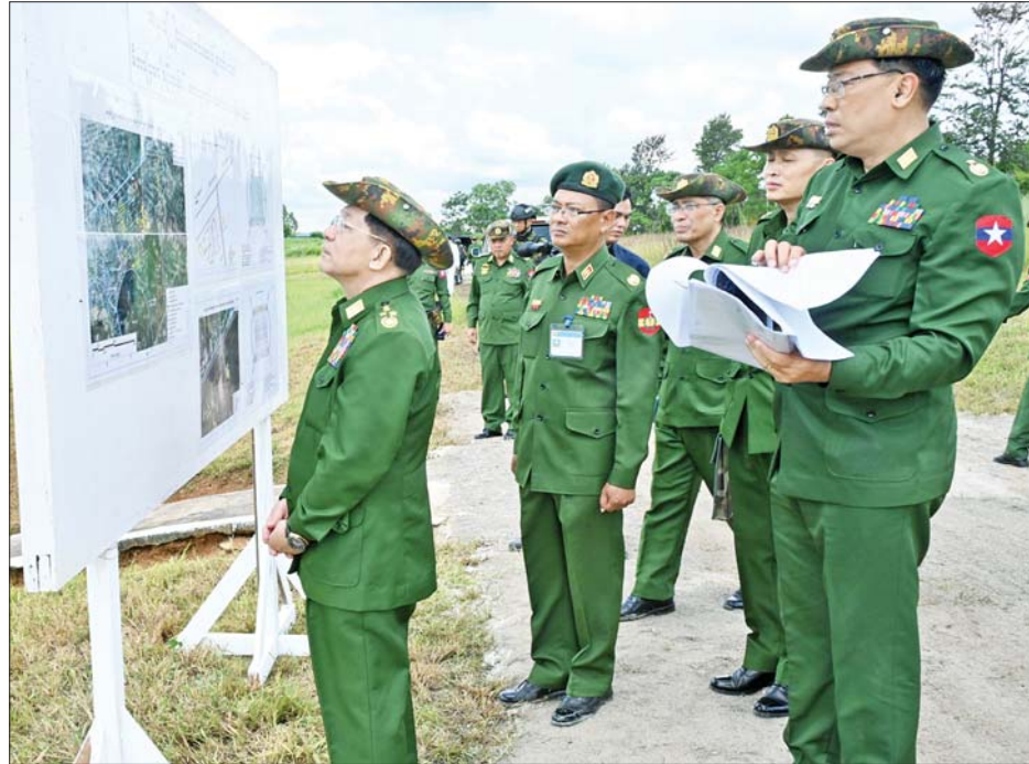
နိုင်ငံတော်စီမံအုပ်ချုပ်ရေးကောင်စီဥက္ကဋ္ဌ တပ်မတော်ကာကွယ်ရေးဦးစီးချုပ် ဗိုလ်ချုပ်မှူးကြီးမင်းအောင်လှိုင် ဆေးရုံအတွင်း မိတာ ၄၀၀ ပြေးလမ်းပါ ဘောလုံးကွင်းတည်ဆောက်ရန် ဆောင်ရွက်နေမှု အခြေအနေများကို ကြည့်ရှုစစ်ဆေးစဉ်။