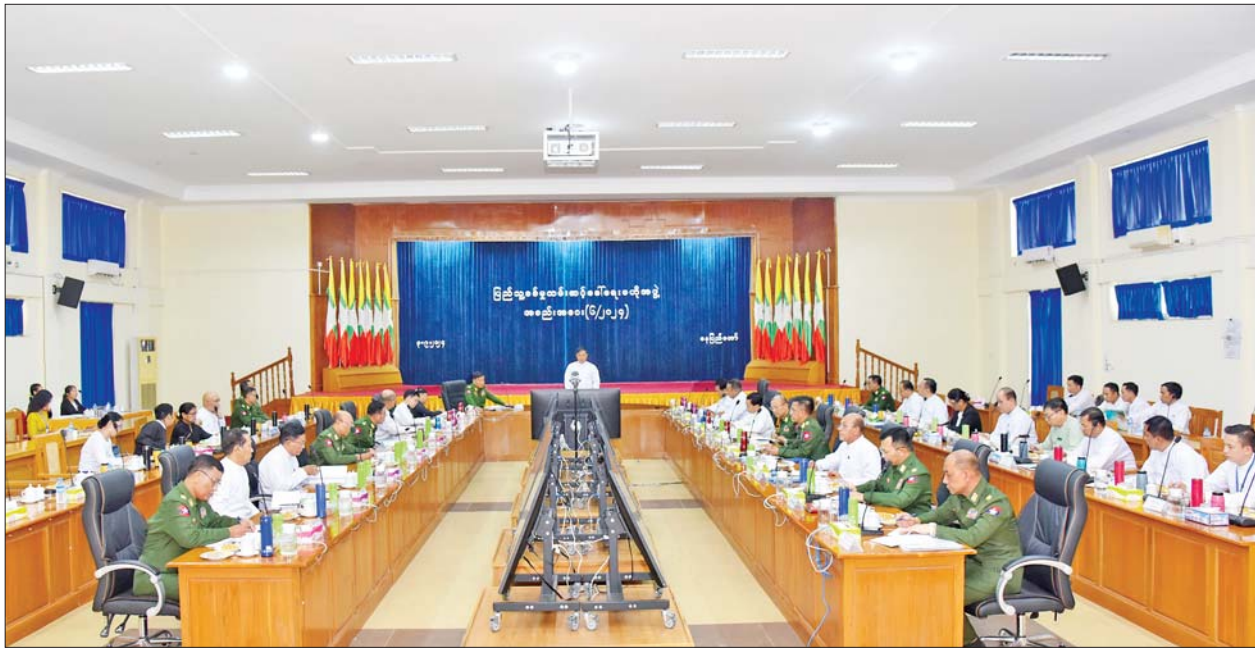
နိုင်ငံတော်စီမံအုပ်ချုပ်ရေးကောင်စီအဖွဲ့ဝင် ဒုတိယဝန်ကြီးချုပ်နှင့် ကာကွယ်ရေးဝန်ကြီးဌာန ပြည်ထောင်စုဝန်ကြီး ဗိုလ်ချုပ်ကြီး တင်အောင်စန်း ပြည်သူ့စစ်မှုထမ်းဆောင်ရေးဗဟိုအဖွဲ့ လုပ်ငန်းညှိနှိုင်းအစည်းအဝေး အမှတ်စဉ်(၆/၂၀၂၄)သို့ တက်ရောက်အမှာစကား ပြောကြားစဉ်။

ဦးစွာ ပြည်သူ့စစ်မှုထမ်း ဆောင်ရေးဗဟိုအဖွဲ့ဥက္ကဋ္ဌ နိုင်ငံ တော်စီမံအုပ်ချုပ်ရေး ကောင်စီ အဖွဲ့ဝင် ဒုတိယဝန်ကြီးချုပ်နှင့် ကာကွယ်ရေး ဝန်ကြီးဌာန ပြည်ထောင်စုဝန်ကြီး ဗိုလ်ချုပ်ကြီး တင်အောင်စန်းက ပြည်သူ့ စစ်မှုထမ်းနည်းဥပဒေ ရေးဆွဲခြင်း ကို အစည်းအဝေး အကြိမ်ကြိမ် ပြုလုပ်ခဲ့ပြီး ဗဟိုအဖွဲ့ဝင် ပြည်ထောင်စု ဝန်ကြီးဌာနများ၊ နေပြည်တော်ကောင်စီ၊ တိုင်း ဒေသကြီး/ ပြည်နယ်များမှ အကြံ ပြုချက်များ ပေးပို့ခဲ့မှုအပေါ် အပြန်အလှန်အလှည့်စစ်သုံးသပ် ၍ ပြည်သူ့စစ်မှုထမ်းနည်းဥပဒေ မူကြမ်းကို ရေးဆွဲခဲ့ရာ ယခု