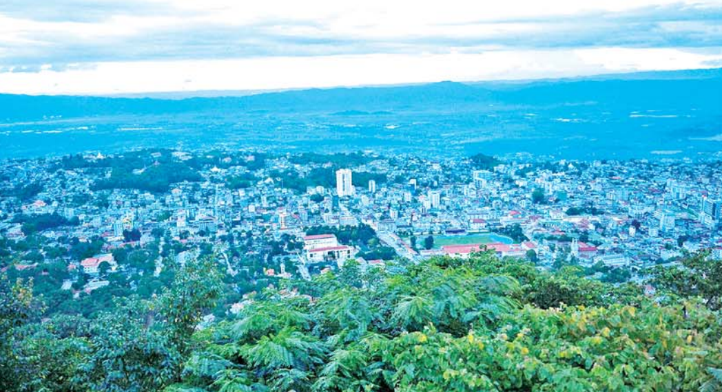
နိုင်ငံတော်စီမံအုပ်ချုပ်ရေးကောင်စီဥက္ကဋ္ဌ နိုင်ငံတော်ဝန်ကြီးချုပ် ဗိုလ်ချုပ်မှူးကြီးမင်းအောင်လှိုင် ရွှေဘုန်းပွင့်စေတီမြတ်ကြီးပေါ်ရှိ ရှုခင်းသာ View Point မှတစ်ဆင့် တောင်ကြီးမြို့၏ ရှုခင်းများကို ကြည့်ရှုစဉ်။