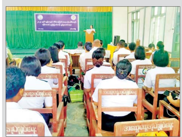
ပဲခူးတိုင်းဒေသကြီး နတ်တလင်းမြို့နယ်တွင် ၂၀၂၄ ခုနှစ်လူဦးရေ နှင့်အိမ်အကြောင်းအရာ သန်းခေါင်စာရင်းကောက်ယူနိုင်ရေး ခရိုင် အဆင့်နည်းပြသင်တန်းဖွင့်ပွဲ အခမ်းအနားကို စက်တင်ဘာ ၃ ရက် နံနက် ၉ နာရီက နတ်တလင်းမြို့ မြို့နယ်အထွေထွေအုပ်ချုပ်ရေး ဦးစီးဌာနခန်းမ၌ ကျင်းပစဉ်။ မြို့နယ်(ပြန်/ဆက်)

အုပ်ချုပ်ရေးကောင်စီဥက္ကဋ္ဌ နိုင်ငံ တော်ဝန်ကြီးချုပ်နှင့် အဖွဲ့ဝင်များ သည် တောင်ကြီးမြို့ ကျက်သရေ ဆောင် ရွှေဘုန်းပွင့်စေတီတော် မြတ်ကြီးသို့ သွားရောက်ဖူးမြော် ကြည့်ညိရာ ဂေါပကအဖွဲ့ဝင်များ က ကြိုဆိုနှုတ်ဆက်ကြသည်။ ဆက်လက်၍ နိုင်ငံတော်စီမံ အုပ်ချုပ်ရေးကောင်စီဥက္ကဋ္ဌ နိုင်ငံ တော်ဝန်ကြီးချုပ်နှင့် အဖွဲ့ဝင်များ သည် စေတီတော်မြတ်ကြီးအား ပန်း၊ ရေချမ်း၊ ဆီမီး ကပ်လှူပူဇော် ပြီး စေတီတော်မြတ်ကြီးအား လက်ယာရစ် လှည့်လည်ဖူးမြော် ကြည့်ညိကြသည်။ ထို့နောက် စေတီတော်မြတ်ကြီး ပေါ်ရှိ ရှုခင်းသာ View Point မှတစ်ဆင့် တောင်ကြီးမြို့၏ ရှုခင်း များကိုကြည့်ရှုကာ တောင်ကြီး မြို့ရှိ သဘာဝအရင်းအမြစ်များ မပျောက်ပျက်ရန်နှင့် ရေရှည် တည်တံ့ခိုင်မြဲမှုအောင် ထိန်းသိမ်း ဆောင်ရွက်ရန် လိုအပ်သည့် အခြေအနေများနှင့် ပတ်သက်၍ တာဝန်ရှိသူများအား ဆွေးနွေး မှာကြားခဲ့သည်။ ယင်းနောက် နိုင်ငံတော်စီမံ အုပ်ချုပ်ရေးကောင်စီဥက္ကဋ္ဌ နိုင်ငံ တော်ဝန်ကြီးချုပ်သည် စေတီတော် ကြီးအတွက် ဘက်စုံအလှူငွေများ ကို ပေးအပ်လှူဒါန်းရာ ဂေါပက အဖွဲ့ဝင်များက လက်ခံရယူခဲ့ကြ ကြောင်း သိရသည်။ သတင်းစဉ်