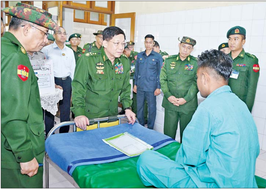
နိုင်ငံတော်စီမံအုပ်ချုပ်ရေးကောင်စီဥက္ကဋ္ဌ တပ်မတော်ကာကွယ်ရေးဦးစီးချုပ် ဗိုလ်ချုပ်မှူးကြီးမင်းအောင်လှိုင် နယ်မြေခံတပ်မတော်ဆေးရုံ၌ တက်ရောက်ကုသမှုခံယူလျက်ရှိသူတစ်ဦးအား ရင်းနှီးနွေးထွေးစွာ မေးမြန်းအားပေးစကားပြောကြားစဉ်။

ဦးစွာ အရှေ့ပိုင်းတိုင်းစစ်ဌာနချုပ် အစည်းအဝေးခန်းမတွင် တိုင်းမှူးဗိုလ်ချုပ် ဇော်မင်းလတ်က အရှေ့ပိုင်းတိုင်းစစ်ဌာနချုပ် နယ်မြေအတွင်း တပ်မတော်သားများ၊ မြန်မာနိုင်ငံရဲတပ်ဖွဲ့ဝင်များနှင့် ပြည်သူ့စစ်(ဌာန)အဖွဲ့ဝင်များ ပူးပေါင်း၍ နယ်မြေလုံခြုံရေးနှင့် လမ်းတံတားများ လုံခြုံရေးအတွက် ဆောင်ရွက်လျက်ရှိမှု၊ KNPP၊ KNDF အဖွဲ့နှင့် PDF အမည်ခံ အကြမ်းဖက်သမားများ၏တိုက်ခိုက်မှုကြောင့် ထိခိုက်ပျက်စီးမှုများ ဖြစ်ပေါ်ခဲ့သည့် လျှင်ကော်မြို့နှင့် အခြားမြို့များအား ပြန်လည်ထူထောင်ရေးလုပ်ငန်းများ ဆောင်ရွက်ပေးလျက်ရှိမှု၊ နယ်မြေလုံခြုံရေးလုပ်ငန်းများ ဆောင်ရွက်စဉ် PDF အမည်ခံ အကြမ်းဖက် သမားများထံမှ လက်နက်ခဲယမ်းများ သိမ်းဆည်းရမိမှုနှင့် PDF အမည်ခံအကြမ်းဖက် သမားများ အလင်းဝင်ရောက်လာမှု၊ တရားမဝင်သစ်များ ဖမ်းဆီးရမိမှု အခြေအနေများနှင့်ပတ်သက်၍ ရှင်းလင်းတင်ပြသည်။