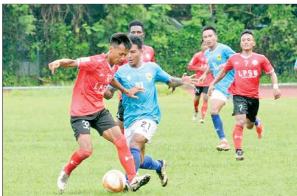
Chinland အသင်းနှင့် တက္ကသိုလ်အသင်းတို့ ယှဉ်ပြိုင်နေစဉ်။

ထိပ်ဆုံးနေရာမှ ဖယ်ပေးခဲ့ရ တက္ကသိုလ်ကွင်း၌ ကျင်းပသည့် ပွဲတွင် Chinland အသင်းက တက္ကသိုလ်အသင်းကို နှစ်ဂိုး-တစ်ဂိုးဖြင့် အနိုင်ရခဲ့သည်။ ပွဲစဉ် (၆)အပြီး ထိပ်ဆုံးတွင် ဦးဆောင် နေသည့် တက္ကသိုလ်အသင်းသည် ပထမဆုံး ရှုံးပွဲနှင့်အတူ ထိပ်ဆုံး နေရာမှ ဖယ်ပေးခဲ့ရသည်။ Chinland အသင်းအတွက် ဂိုးများ ကို ၂၆၊ ၆၈ မိနစ်တွင် လှဖုန်းဦးက စာမျက်နှာ ၁၉ ကော်လံ ၁ သို့ *