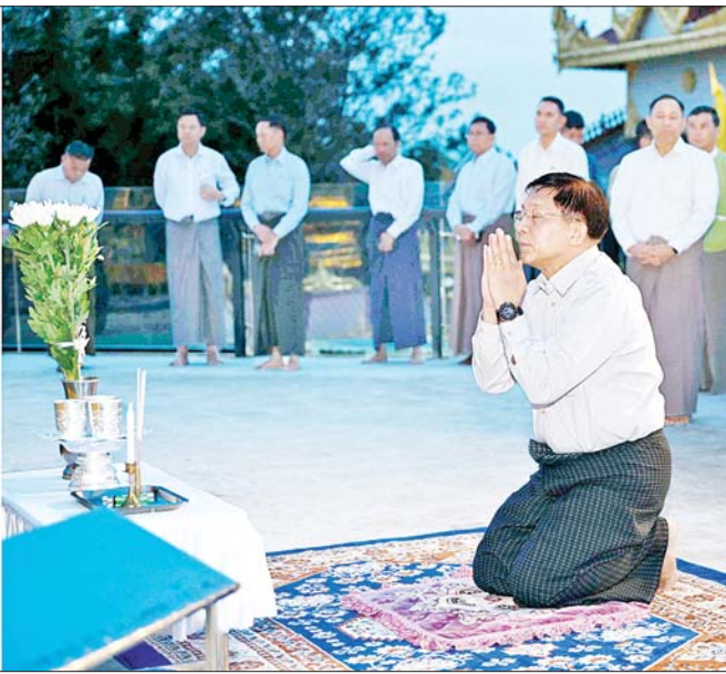
နိုင်ငံတော်စီမံအုပ်ချုပ်ရေးကောင်စီဥက္ကဋ္ဌ နိုင်ငံတော်ဝန်ကြီးချုပ် ဗိုလ်ချုပ်မှူးကြီးမင်းအောင်လှိုင် တောင်ကြီးမြို့ကျက်သရေဆောင် ရွှေဘုန်းပွင့်စေတီတော်မြတ်ကြီးအား ဖူးမြော်ကြည့်ညိစဉ်။

လုံခြုံရေးပိုင်းဆိုင်ရာများကို ဦးစွာ ပြောကြားလိုကြောင်း ပြောကြား ပြီး ၂၀၂၀ ပြည့်နှစ် ပါတီစုံ ဒီမိုကရေစီအထွေထွေရွေးကောက် ပွဲတွင် မဲမသမာမှုများဖြစ်ပေါ်ခဲ့မှု နှင့် အဆိုပါမဲမသမာမှုများကို တာဝန်ရှိသူများက ဖြေရှင်း ဆောင်ရွက်ပေးခြင်းမရှိခဲ့မှု၊ နိုင်ငံ တော်တွင် ဖြစ်ပေါ်လာခဲ့သည့် အခြေအနေများအရ ဖွဲ့စည်းပုံ အခြေခံဥပဒေ (၂၀၀၈ ခုနှစ်)နှင့် အညီ နိုင်ငံတော်ကို နိုင်ငံရေးအရ အရေးပေါ်အခြေအနေ ကြေညာ ခဲ့ပြီး တပ်မတော်မှ နိုင်ငံတာဝန် များကို ထမ်းဆောင်ခဲ့မှု၊ နိုင်ငံ တော်စီမံအုပ်ချုပ်ရေး ကောင်စီ ကို နိုင်ငံတော်၏ ကောင်းရာ ကောင်းကျိုးကို ဖော်ဆောင်ပေး နိုင်မည့် စစ်ဘက်၊ အရပ်ဘက်မှ ပုဂ္ဂိုလ်များကို ရွေးချယ်၍ ဖွဲ့စည်း တာဝန်ပေးအပ်ခဲ့မှု၊ စတင်တာဝန် ထမ်းဆောင်ခဲ့စဉ် ကိုဗစ်-၁၉ ရောဂါကြောင့် ဖြစ်ပေါ်ခဲ့ရသည့် အကျပ်အတည်းများနှင့် နိုင်ငံရေး အမြတ်ထုတ်လိုသူများ၏သွေးထိုး လှုံ့ဆော်မှုများကြောင့် ဖြစ်ပေါ်ခဲ့ သည့် အကြမ်းဖက်မှုဖြစ်စဉ်ဖြစ်ရပ် များကို ဥပဒေနှင့်အညီ ထိန်းထိန်း သိမ်းသိမ်းဆောင်ရွက်ခဲ့မှု၊ တိုင်းရင်း သားလက်နက်ကိုင်အဖွဲ့များနှင့် ပတ်သက်၍ နိုင်ငံတော်နှင့် တပ်မတော်အနေဖြင့် ခေတ်