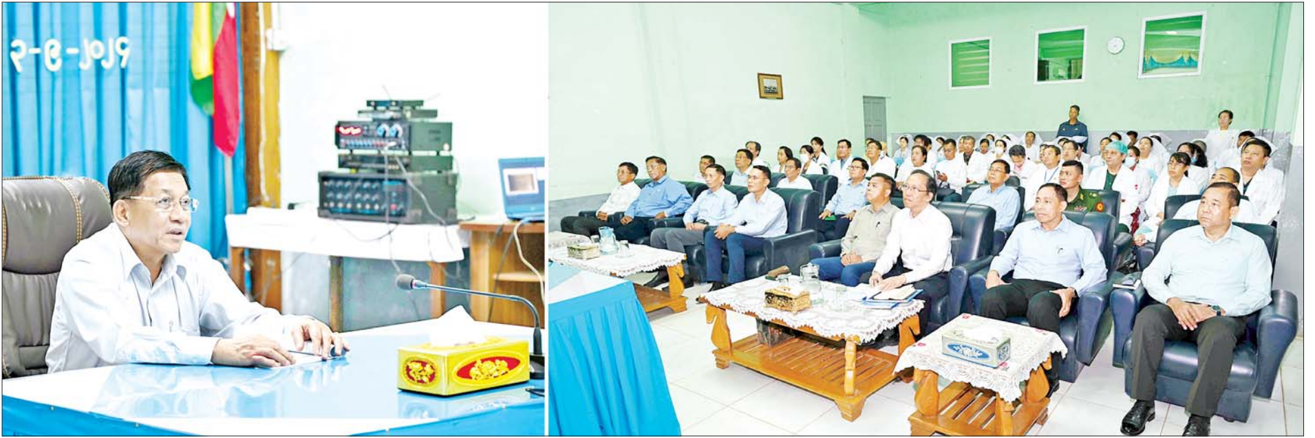
နိုင်ငံတော်စီမံအုပ်ချုပ်ရေးကောင်စီဥက္ကဋ္ဌ နိုင်ငံတော်ဝန်ကြီးချုပ် ဗိုလ်ချုပ်မှူးကြီး မင်းအောင်လှိုင် တောင်ကြီးမြို့ စဝပ်ထွန်းပြည်သူ့ဆေးရုံကြီး၌ ကျန်းမာရေးဝန်ထမ်းများအား တွေ့ဆုံအမှာစကားပြောကြားစဉ်။