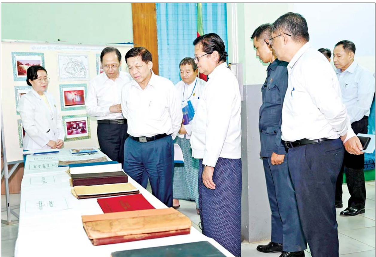
နိုင်ငံတော်စီမံအုပ်ချုပ်ရေးကောင်စီဥက္ကဋ္ဌ နိုင်ငံတော်ဝန်ကြီးချုပ် ဗိုလ်ချုပ်မှူးကြီး မင်းအောင်လှိုင် ခင်းကျင်းပြသထားသည့် စဝပ်ထွန်း ဆေးရုံကြီး အဆောက်အအုံများ၊ စက်ပစ္စည်းများနှင့်ပတ်သက်သော မှတ်တမ်းစာအုပ်များအား ကြည့်ရှုစဉ်။

ထို့နောက် ဆေးရုံကြီး အစည်း အဝေးခန်းမတွင် ဆေးရုံအုပ်ကြီး ဒေါက်တာဝင်းမော်ဦးက ဆေးရုံ၏ သမိုင်းအကျဉ်း၊ အဆောက်အအုံ များ ဆောက်လုပ်ထားရှိမှုနှင့် လူနာဆောင်သစ်များ ဆောက်လုပ် ထားရှိမှု၊ ကင်ဆာရောဂါကုသရေး လုပ်ငန်းများ ဆောင်ရွက်လျက်ရှိမှု၊ လအလိုက် ဆေးကုသမှုလုပ်ငန်း များဆောင်ရွက်နေမှု၊ အထူး ကြပ်မတ်ကုသမှုများ ဆောင်ရွက် နိုင်မှု၊ ဓာတ်မှန်လုပ်ငန်းများဆောင်