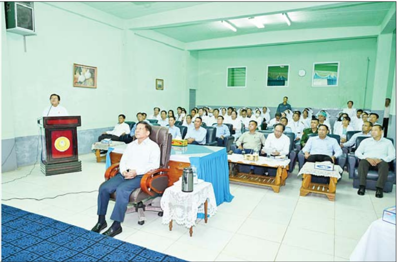
နိုင်ငံတော်စီမံအုပ်ချုပ်ရေးကောင်စီဥက္ကဋ္ဌ နိုင်ငံတော်ဝန်ကြီးချုပ် ဗိုလ်ချုပ်မှူးကြီး မင်းအောင်လှိုင်အား ဆေးရုံအုပ်ကြီး ဒေါက်တာဝင်းမော်ဦးက ရှင်းလင်းတင်ပြစဉ်။