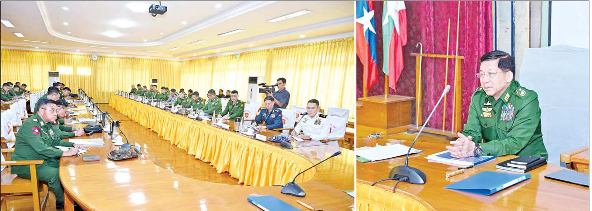
နိုင်ငံတော်စီမံအုပ်ချုပ်ရေးကောင်စီဥက္ကဋ္ဌ တပ်မတော်ကာကွယ်ရေးဦးစီးချုပ် ဗိုလ်ချုပ်မှူးကြီး မင်းအောင်လှိုင် အရှေ့ပိုင်းတိုင်းစစ်ဌာနချုပ်နယ်မြေအတွင်း နယ်မြေတည်ငြိမ်အေးချမ်းရေးဆိုင်ရာ ဆောင်ရွက်ထားရှိမှု များနှင့်ပတ်သက်၍ လမ်းညွှန်မှာကြားစဉ်။