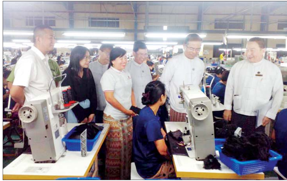
တင်ပြရာ ဒုတိယဝန်ကြီးက လိုအပ်သည်များ ညှိနှိုင်း ပေးခဲ့ပြီး စက်ရုံအတွင်း လှည့်လည်ကြည့်ရှု၍ လုပ်သားများကို ရင်းရင်းနှီးနှီးတွေ့ဆုံအားပေးသည်။ ယင်းနောက် ဒုတိယဝန်ကြီးက CMP လုပ်ငန်း

ရန်ကုန် ဩဂုတ် ၃၀ အလုပ်သမားဝန်ကြီးဌာန ဒုတိယဝန်ကြီး ဦးဝင်းရှိန်သည် ရန်ကုန်တိုင်းဒေသကြီး တိုင်းရင်းသား ရေးရာဝန်ကြီး ဦးစောကျက်ကော့ထူးနှင့် ရန်ကုန် တိုင်းဒေသကြီးရှိ အလုပ်သမားရေးရာဌာနများမှ တာဝန်ခံများနှင့်အတူ ယနေ့နံနက်ပိုင်းတွင် ရန်ကုန် တိုင်းဒေသကြီး လှိုင်သာယာအနောက်ပိုင်းမြို့နယ် ရှိ Gold Emperor Co.,Ltd. ဖိနပ်စက်ရုံနှင့် Universal Apparel Co.,Ltd. အထည်ချုပ်စက်ရုံ၊ မြန်မာစိုးစံဝင်း ဖိနပ်စက်ရုံနှင့် Sen Yu Clothings Corporation Co.,Ltd. အထည်ချုပ်စက်ရုံတို့သို့ ကွင်းဆင်းကြည့်ရှု စစ်ဆေးသည်။