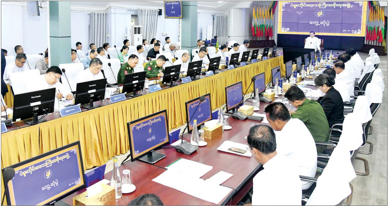
နိုင်ငံတော်စီမံအုပ်ချုပ်ရေးကောင်စီဥက္ကဋ္ဌ နိုင်ငံတော်ဝန်ကြီးချုပ် ဗိုလ်ချုပ်မှူးကြီး မင်းအောင်လှိုင် ပဲခူးတိုင်းဒေသကြီးအစိုးရအဖွဲ့ဝင်များအား တွေ့ဆုံအမှာစကားပြောကြားစဉ်။

ထို့နောက် နိုင်ငံတော်စီမံအုပ်ချုပ်ရေးကောင်စီဥက္ကဋ္ဌ နိုင်ငံတော်ဝန်ကြီးချုပ်က မြန်မာနိုင်ငံ၏ ခေတ်အဆက်ဆက် နိုင်ငံရေးဖြစ်ပေါ် ပြောင်းလဲခဲ့မှုအခြေအနေများ၊ ၂၀၂၀ ပြည့်နှစ် ပါတီစုံဒီမိုကရေစီ အထွေထွေရွေးကောက်ပွဲတွင် မဲမသမာမှုများဖြစ်ပေါ်ခဲ့သည့် အခြေအနေများနှင့် မဲမသမာမှုများကို တာဝန်ရှိသူများက ဖြေရှင်းဆောင်ရွက်ပေးခြင်း မရှိခဲ့သည့် အခြေအနေများ၊ နိုင်ငံတော်