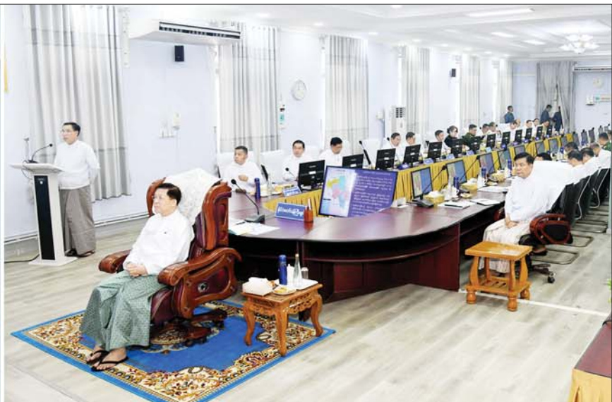
နိုင်ငံတော်စီမံအုပ်ချုပ်ရေးကောင်စီဥက္ကဋ္ဌ နိုင်ငံတော်ဝန်ကြီးချုပ် ဗိုလ်ချုပ်မှူးကြီး မင်းအောင်လှိုင်အား ပဲခူးတိုင်းဒေသကြီးဝန်ကြီးချုပ် ဦးမျိုးဆွေဝင်းက ရှင်းလင်းတင်ပြစဉ်။