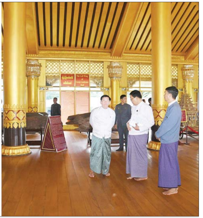
နိုင်ငံတော်စီမံအုပ်ချုပ်ရေးကောင်စီဥက္ကဋ္ဌ နိုင်ငံတော်ဝန်ကြီးချုပ် ဗိုလ်ချုပ်မှူးကြီး မင်းအောင်လှိုင် ပဲခူးမြို့၊ ကမ္ဘောဇသောဒီရွှေနန်းတော်တွင် ကြည့်ရှုစစ်ဆေးစဉ်။