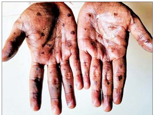
ကူးစက်မှုအား နိုင်ငံတကာပြည်သူ့ကျန်းမာရေးစိုးရိမ်ဖွယ်ရာ အခြေအနေအဖြစ် ယခုနှစ် ဩဂုတ် ၁၄ရက်တွင် ကြေညာခဲ့သည်။ ကိုးကား-ဆင်ဟွာ၊ ဘာသာပြန်-စိုးသူရ

လက်ရှိအချိန်တွင် နိုင်ငံအတွင်းရှိ အပြည်ပြည်ဆိုင်ရာလေဆိပ်များ၌ ဓာတ်ခွဲခန်းများဖြင့် ရောဂါစောင့်ကြည့်စစ်ဆေးကုသရေးလုပ်ငန်းများကို ဆောင်ရွက်နေပြီး အာဖရိကဒေသမှ လာရောက်သည့်ခရီးသည်များ၏ ကျန်းမာရေးအခြေအနေကို စောင့်ကြည့်နေကြောင်း ၎င်းက ပြောကြားသည်။ အာဖရိကဒေသ၌ မျောက်ကျောက်ရောဂါမျိုးစိတ်သစ်ပြန့်ပွားခဲ့ပြီးနောက် ကမ္ဘာ့ကျန်းမာရေးအဖွဲ့က မျောက်ကျောက်ရောဂါ