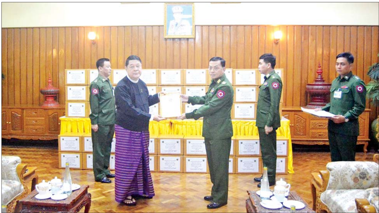
ပြည်ထောင်စုတရားသူကြီးချုပ် ဦးသာဌေး နိုင်ငံတော်ကာကွယ်ရေးနှင့် လုံခြုံရေးတာဝန်များကို စွမ်းစွမ်းတမံ ထမ်းဆောင်လျက်ရှိသော လုံခြုံရေးတပ်ဖွဲ့ဝင်များအတွက် ဂုဏ်ပြုချီးမြှင့်ငွေနှင့် စားသောက်ဖွယ်ရာများ ပေးအပ်စဉ်။

နေပြည်တော် ဩဂုတ် ၃၀ နိုင်ငံတော် ကာကွယ်ရေးနှင့် လုံခြုံရေးတာဝန်များကို စွမ်းစွမ်းတမံ ထမ်းဆောင်လျက်ရှိသော လုံခြုံရေးတပ်ဖွဲ့ဝင်များ အတွက် စေတနာရှင် အလှူရှင်များက ဂုဏ်ပြု ချီးမြှင့်ငွေများနှင့် စားသောက်ဖွယ်ရာများ လာရောက် ဂုဏ်ပြုပေးအပ်လျက်ရှိသည်။