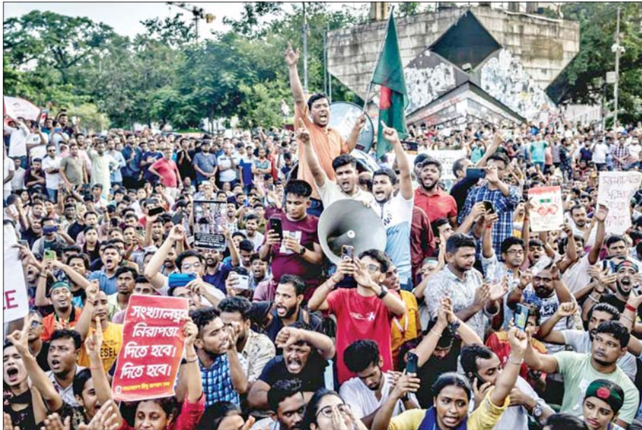
ဩဂုတ်လ ၄ ရက်နေ့က ဘင်္ဂလားဒေ့ရှ်နိုင်ငံ ဒါကာမြို့တော်တွင် BRAC တက္ကသိုလ်မှ ကျောင်းသားများဦးဆောင်သည့် ဆန္ဒပြနေသူများကို တွေ့ရစဉ်။

လက်ရှိအနေအထားအရ အနောက်အုပ်စုနှင့် အထူးနီးစပ်သည့် အသက် (၈၄) နှစ်အရွယ် မိုဟာမက်ယူနွတ်စ်ဦးဆောင်ပြီး ဆန္ဒပြကျောင်းသားများ ကြိုးကိုင်ထားသော ကြားဖြတ်အစိုးရက ဘင်္ဂလားဒေ့ရှ်နိုင်ငံကို အချိန်ကာလအတိုင်းအတာ တစ်ရပ်အထိ အုပ်ချုပ်နေဦးမည်သဘောရှိနေသည်။ ဘင်္ဂလားဒေ့ရှ်ပြည်သူများကို ဩဂုတ်လ ၁၈ ရက်နေ့က ရုပ်သံလွှင့်ပြောကြားခဲ့သည့် ယူနွတ်စ်၏ မိန့်ခွန်းတွင် ရွေးကောက်ပွဲကျင်းပမည့်ကာလကို နိုင်ငံရေးအရ ဆုံးဖြတ်ရမည်ဖြစ်ကြောင်း၊ ဘင်္ဂလားဒေ့ရှ်နိုင်ငံတွင် နိုင်ငံရေး၊ စီးပွားရေး၊ လူမှုရေး အောက်ခြေသိမ်းပြုပြင်ပြောင်းလဲမှု (ခေတ်ပြောင်းတော်လှန်ရေး) ပြုလုပ်ပြီးစီးကာ သတင်းအချက်အလက် စီးဆင်းမှုမှာလည်း အဖြတ်အတောက် အဆီးအတားမရှိ ချောမွေ့လာသည့်အခါမှသာ ရွေးကောက်ပွဲကျင်းပနိုင်မည်ဟု ပြောကြားသွားခဲ့သည်။ ယူနွတ်စ်သည် အမေရိကန်