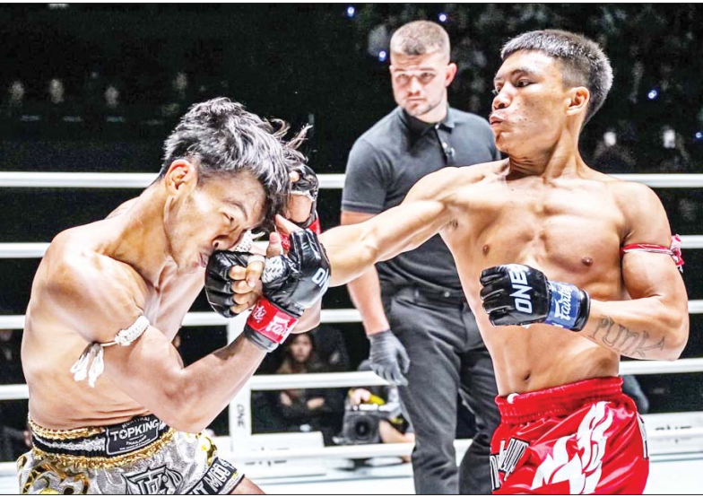
စူပါရေချမ်း၏ ညာလက်သီး ဆူတင် မျက်နှာကို ထိမှန်နေစဉ်။

ယနေ့ ဖတ်စရာ နိုင်ငံတော်ကာကွယ်ရေးနှင့် လုံခြုံရေးတာဝန်များကို စွမ်းစွမ်းတမ်းတမ်းဆောင်လျက်ရှိသော လုံခြုံရေးတပ်ဖွဲ့ဝင်များအတွက် ဂုဏ်ပြုချီးမြှင့်ငွေနှင့် စားသောက်ဖွယ်ရာများ လာရောက်ဂုဏ်ပြုပေးအပ် စာမျက်နှာ » ၆ မန္တလေးတိုင်းဒေသကြီးနှင့် ရန်ကုန်တိုင်းဒေသကြီးတို့၌ ငွေကျပ်သိန်း ၅၅၀၀ ကျော်တန်ဖိုးရှိ မူးယစ်ဆေးဝါးများ သိမ်းဆည်းရမိ စာမျက်နှာ » ၁၄