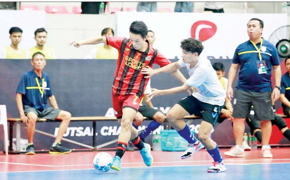
VUC အသင်းနှင့် Pacific Sun Far အသင်းတို့ ယှဉ်ပြိုင်ကစားကြစဉ်။

ရန်ကုန် ဩဂုတ် ၃၀ ၂၀၂၄ MFF ဖူဆယ်ချန်ပီယံရှစ်ပြိုင်ပွဲ အုပ်စုပွဲစဉ်များကို ဩဂုတ် ၃၀ ရက်က MFF ဖူဆယ်အားကစားရုံ၌ ဆက်လက်ကျင်းပရာ ရှုံးထွက်အဆင့် တက်ရောက်သည့် အသင်းအချို့ ထွက်ပေါ်လာသည်။ အနိုင်ရရှိ ဩဂုတ် ၃၀ ရက်က ကျင်းပသည့်ပွဲစဉ်များတွင် Winner Soccer အသင်းက KKY အသင်းကို သုံးဂိုး-နှစ်ဂိုး၊ 7 Brother အသင်းက Yankin Brotherhood အသင်းကို ငါးဂိုး-သုံးဂိုး၊ MIU အသင်းက ရွှေပြည်သာ ယူနိုက်တက်အသင်းကို ၂၁ ဂိုး-ဂိုးမရှိ၊ UPK အသင်းက တော်ဝင်နန်းအသင်းကို ငါးဂိုး-ပြတ်၊ လက်ရှိချန်ပီယံ VUC အသင်းက Pacific Sun Far အသင်းကို ဂိုး-ဂိုးမရှိ၊ Power HBI အသင်းက Noka United အသင်းကို ငါးဂိုး-နှစ်ဂိုးဖြင့် အနိုင်ရရှိသည်။ စာမျက်နှာ ၁၅ ကော်လံ ၅ သို့ ၀