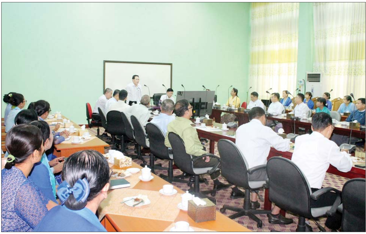
ပြည်ထောင်စုဝန်ကြီး ဦးမောင်မောင်အုန်း မကွေးတက္ကသိုလ်အစည်းအဝေးခန်းမ၌ ဆွေးနွေးပြောကြားစဉ်။

ထို့နောက် ပြည်ထောင်စုဝန်ကြီးနှင့် ဝန်ကြီးချုပ်တို့သည် ဘွဲ့နှင့်သဘင်ခန်းမ၌ မကွေးမြို့ပေါ်ရှိ တက္ကသိုလ်/ကောလိပ်အသီးသီးမှ ကျောင်းသား ကျောင်းသူများနှင့် တွေ့ဆုံသည်။ ဦးစွာ “တားဆီးကာကွယ်မီဒီယာအဆိပ်သင့်မှုအန္တရာယ်” Vedio Clip ၊ “၂၀၂၄ ခုနှစ်ပြင်သစ် အိုလံပစ်ပြိုင်ပွဲ ဖွင့်ပွဲ/ပိတ်ပွဲ အခမ်းအနားကျင်းပမှုမှတ်တမ်း” နှင့် “၂၀၂၄ ပြင်သစ်မသန်စွမ်းအိုလံပစ်ဖွင့်ပွဲအခမ်းအနား” မီဒီယိုတို့ကိုပြသပြီး ပြည်ထောင်စုဝန်ကြီးက နှုတ်ခွန်းဆက်စကား ပြောကြားရာတွင် ယနေ့အချိန်တွင် မသမာသူအဖျက်သမားများက မီဒီယာနည်းလမ်းများကို အသုံးပြု၍ သတင်းတု၊ သတင်းမှားများ ထုတ်လွှင့်ကာ ပြည်သူများကို အတွေးအမြင် လွှဲမှားအောင်ဆောင်ရွက် နေကြကြောင်း၊ တစ်နည်းအားဖြင့် မီဒီယာကို အဆိပ်သင့်အောင် ဆောင်ရွက်၍ နိုင်ငံတော်ကို အဖျက်အမှောင့်လုပ်ငန်းများ ဆောင်ရွက်နေခြင်းဖြစ်ကြောင်း၊ ယနေ့နိုင်ငံတော်တွင်