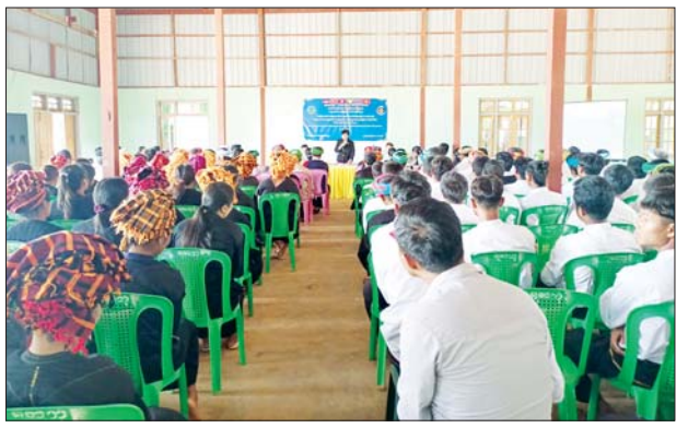
ထို့နောက် ဒုတိယညွှန်ကြားရေးမှူးချုပ်နှင့် တာဝန်ရှိသူများသည် ကျေးရွာရှိ အခြေခံအိမ်ထောင်စု ၃၀ ၏ မိသားစုဝင်များထံသို့ အိမ်တိုင်ရာရောက် လိုက်လံကြည့်ရှုစစ်ဆေးခဲ့ကြောင်း သိရသည်။ JJJ

ဆက်လက်၍ ကျေးလက်ဒေသဖွံ့ဖြိုးတိုးတက်ရေးဦးစီးဌာန ရုံးချုပ်မှ ညွှန်ကြားရေးမှူး ဦးကျော်ဇော်ဟိန်းက စီမံကိန်းဆိုင်ရာ အချက်အလက်များ၊ စီမံခန့်ခွဲမှုနှင့် ဘဏ္ဍာရေးဆိုင်ရာ ကိစ္စရပ်များနှင့် ပတ်သက်ပြီး မိတ်ဆက်ရှင်းလင်းကာ ရှမ်းပြည်နယ်(တောင်ပိုင်း) ကျေးလက်ဒေသဖွံ့ဖြိုးတိုးတက်ရေးဦးစီးဌာန ပြည်နယ်ဦးစီးမှူး ဦးမောင်မောင်ဝင်းက ကျေးရွာရှိ အခြေခံအိမ်ထောင်စုများကို စိုက်ပျိုးရေး၊ မွေးမြူရေးနှင့် ကုန်ထုတ်လုပ်ငန်း၊ သွင်းအားစုများထောက်ပံ့ခြင်း၊ နည်းပညာအကူအညီများပံ့ပိုးပေးခြင်း၊ စွမ်းဆောင်ရည်နှင့် သဘာဝပတ်ဝန်းကျင်ထိန်းသိမ်းရေးလုပ်ငန်းများ ဆောင်ရွက်ရန်အတွက် အရေးကုန်ခေါ်လာ ၁၀၀၀၀ ကျပ်ဆောင်ရွက်သွားမည်ဖြစ်ကြောင်း ရှင်းလင်းပြောကြားသည်။