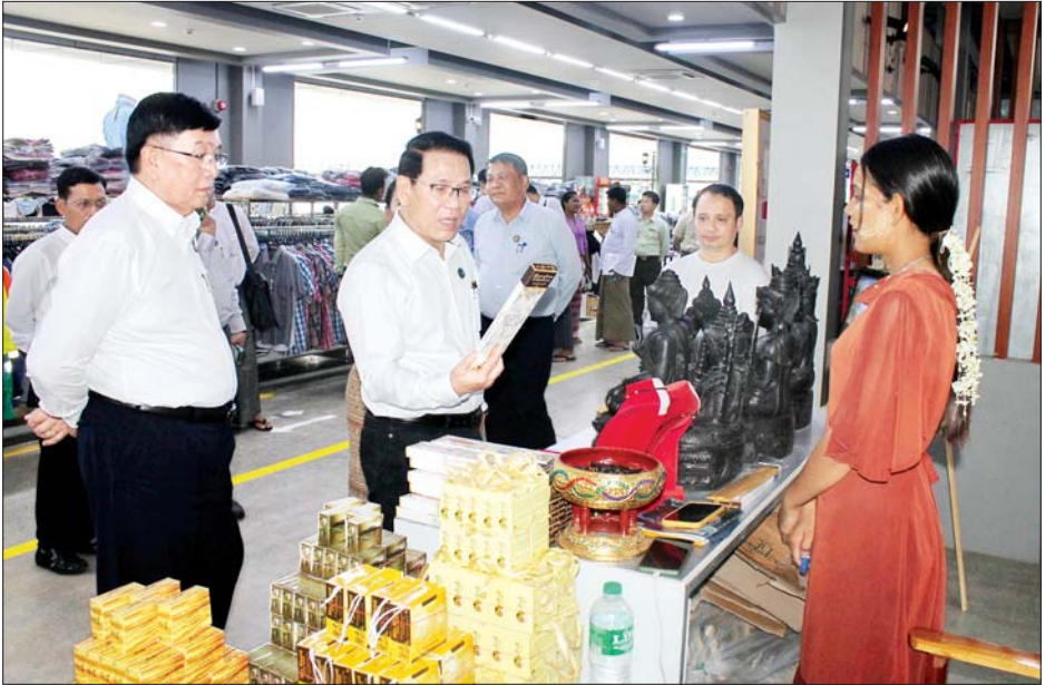
ပြည်ထောင်စုဝန်ကြီး ဦးမောင်မောင်အုန်းနှင့် တာဝန်ရှိသူများ မကွေးမြို့ကမ်းနားလမ်းရှိ MSME လုပ်ငန်းများမှ ထုတ်ကုန်ပစ္စည်းများ ခင်းကျင်းရောင်းချနေမှုကို ကြည့်ရှုအားပေးစဉ်။

အဆိုပါ မကွေးတိုင်းဒေသကြီး၏ MSME လုပ်ငန်းများမှ ထုတ်လုပ်သည့် ပစ္စည်းများသည် အရည်အသွေးကောင်းမွန်ခြင်းနှင့် ဈေးနှုန်း သက်သာခြင်းများကြောင့် ပြည်သူများ ကြိုက်နှစ်သက်ကာ ဝယ်ယူအားပေးလျက် ရှိကြောင်း သိရသည်။ အဆိုပါ ကန်သာမင်္ဂလာကန် သတင်းစဉ်