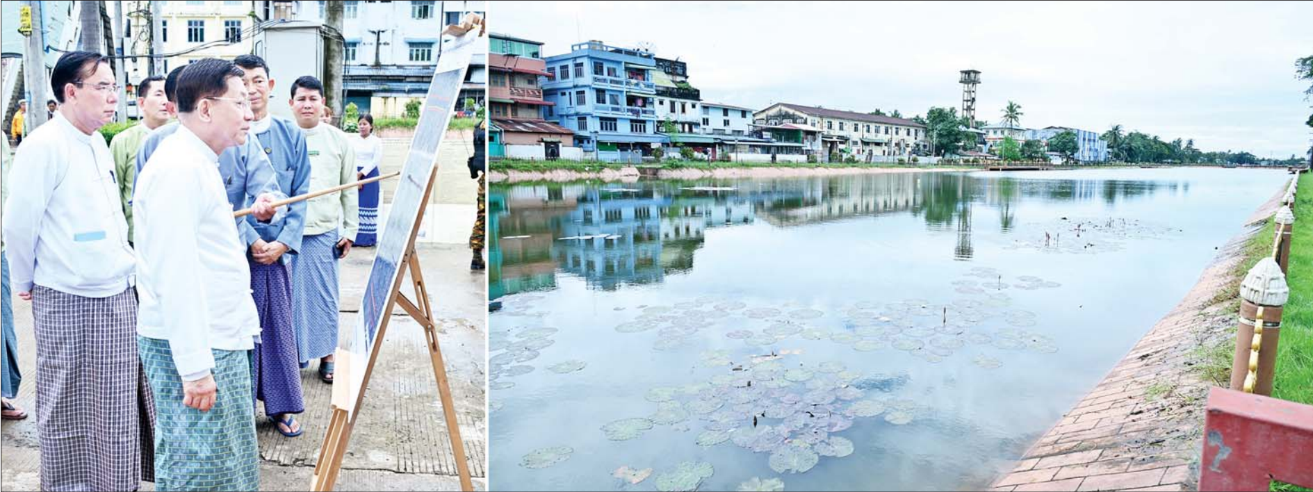
နိုင်ငံတော်စီမံအုပ်ချုပ်ရေးကောင်စီဥက္ကဋ္ဌ နိုင်ငံတော်ဝန်ကြီးချုပ် ဗိုလ်ချုပ်မှူးကြီး မင်းအောင်လှိုင် ဟံသာဝတီ နေပြည်တော် သာယာဝတီတံခါးအနီးရှိ ဟံသာဝတီမြို့ဟောင်းကျေးအား ကြည့်ရှုစစ်ဆေးစဉ်။