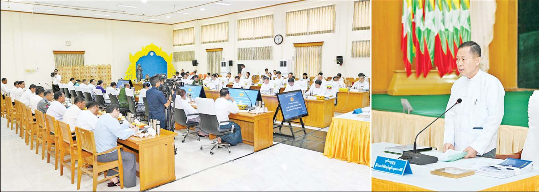
နိုင်ငံတော်စီမံအုပ်ချုပ်ရေးကောင်စီ ဒုတိယဥက္ကဋ္ဌ ဒုတိယဝန်ကြီးချုပ် ဒုတိယဗိုလ်ချုပ်မှူးကြီးစိုးဝင်း ၂၀၂၄ ခုနှစ် ပဉ္စမအကြိမ် အမျိုးသားအားကစားပွဲတော် ကျင်းပရေးဦးစီးကော်မတီ တတိယအကြိမ် အစည်းအဝေးတွင် အမှာစကားပြောကြားစဉ်။