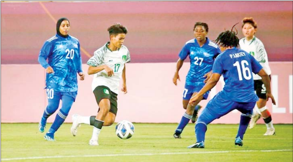
မြဝတီအသင်းနှင့် အဘူဒါဘီအသင်းတို့ ယှဉ်ပြိုင်နေစဉ်။

ရန်ကုန် ဩဂုတ် ၂၉ ၂၀၂၄-၂၀၂၅ ရာသီ အာရှအမျိုးသမီး ချန်ပီယံလိဂ်ခြေစစ်ပွဲ အုပ်စုဒုတိယနေ့ကို ဩဂုတ် ၂၈ ရက်က ဆက်လက်ကျင်းပရာ မြန်မာကလပ် မြဝတီအသင်း ရှုံးပွဲထပ်မံကြုံတွေ့ခဲ့သည်။ အုပ်စု (က) ဒုတိယနေ့တွင် ယူအေအီးကလပ် အဘူဒါဘီအသင်းက မြန်မာကလပ် မြဝတီအသင်းကို တစ်ဂိုး-ဂိုးမရှိ၊ ခေတ်ဒီအာရေဗျ ကလပ် အယ်လ်နာဆာအသင်းက လာအိုကလပ် Young Elephant အသင်းစာမျက်နှာ ၁၇ ကော်လံ ၃ သို့