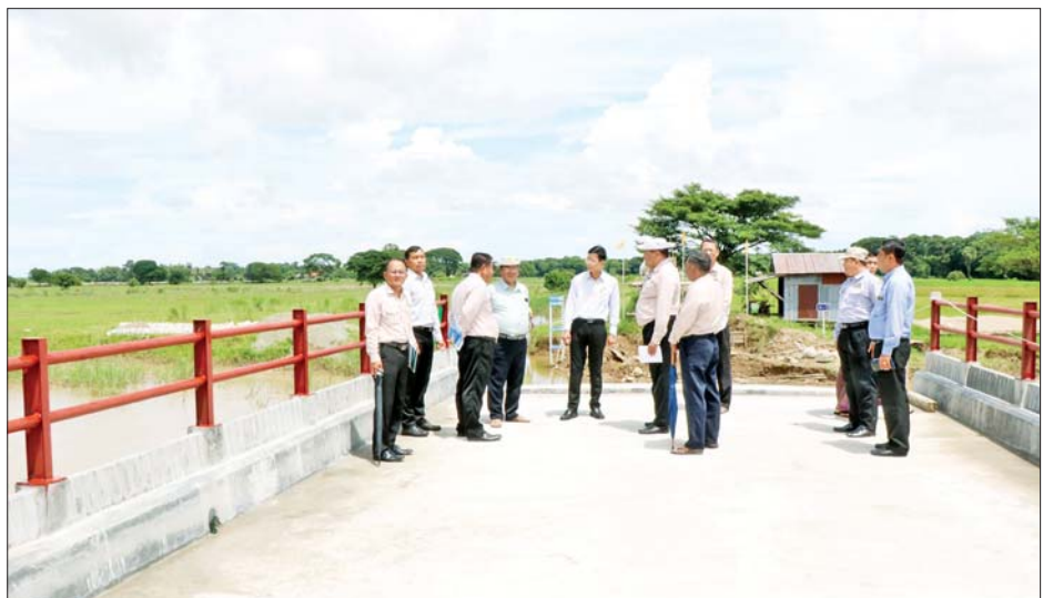
မြစ်ကြမ်းပြင် ကာကွယ်ထိန်းသိမ်းခြင်းအတွက် ကျောက်စီရေကာတာဆောင်ရွက်ခြင်း၊ စေတီတော်ရင်ပြင်ချခြင်း၊ Bored Pile အခြေပြုသံကူကွန်ကရစ် နံရံပြုလုပ်ခြင်းလုပ်ငန်းများကို တာဝန်ရှိသူအဆင့်ဆင့် က စနစ်တကျ ကြပ်မတ်ဆောင်ရွက်လျက်ရှိကြောင်း သိရသည်။

အဆိုပါ မြစ်ကမ်းထိန်းလုပ်ငန်းကို ၂၀၂၃-၂၀၂၄ ဘဏ္ဍာနှစ်မှစ၍ ဆောင်ရွက်လျက်ရှိရာ ယခုနှစ်တွင်