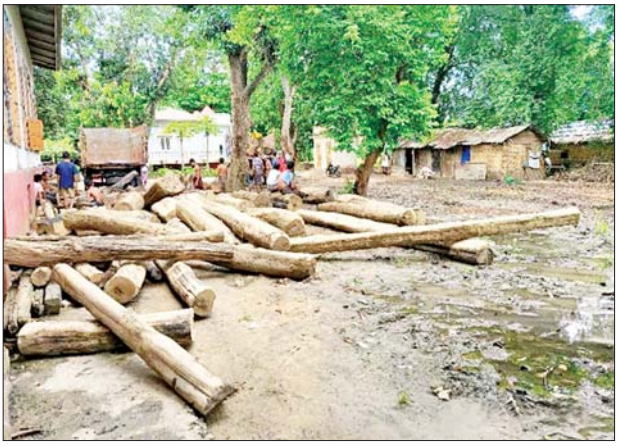
ဩဂုတ် ၁၉ ရက်မှ ၂၅ ရက်အထိ နေပြည်တော်၊ ပြည်နယ်နှင့် တိုင်းဒေသကြီး သစ်တောဦးစီးဌာနများမှ ပေးပို့လာသော စာရင်းများအရ တရားမဝင် ကျွန်းသစ် ၂၆ ဒသမ ၁၁၈၂ တန်း၊ သစ်မာ ၉

နေပြည်တော် ဩဂုတ် ၂၉ သယံဇာတနှင့်သဘာဝပတ်ဝန်းကျင်ထိန်းသိမ်းရေးဝန်ကြီးဌာန သစ်တော ဦးစီးဌာနသည် တရားမဝင်သစ်နှင့် သစ်တော ထွက်ပစ္စည်းများ ရှာဖွေဖော်ထုတ် ဖမ်းဆီးရမိရေးအတွက် ပြည်သူ ပူးပေါင်းပါဝင်သော လူထုအခြေပြု စောင့်ကြပ်ကြည့်ရှု သတင်းပို့စနစ် (Community Monitoring and Reporting System-CMRS) အပါအဝင် နည်းလမ်းမျိုးစုံဖြင့် အကောင်အထည်ဖော်ဆောင်ရွက် လျက်ရှိသည်။ ထိုသို့ ဆောင်ရွက်လျက်ရှိရာ