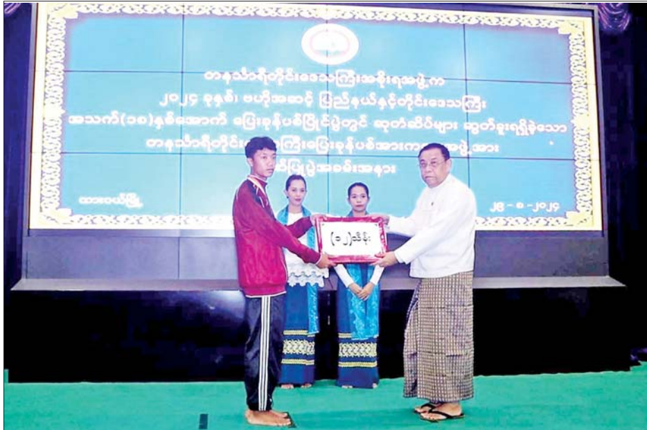
က အောင်နိုင်ရေးအတွက် ကြိုတင်ပြင်ဆင်ဆောင်ရွက်ခဲ့သည့်အခြေအနေကို ရှင်းလင်းတင်ပြသည်။ ဆက်လက်၍ တိုင်းဒေသကြီးဝန်ကြီးချုပ်က အမျိုးသားမိတာ ၂၀၀ ပြိုင်ပွဲနှင့် အလျားခုန်ပြိုင်ပွဲတွင်

ထားဝယ် ဩဂုတ် ၂၉ ၂၀၂၄ ခုနှစ် ဗဟိုအဆင့်ပြည်နယ်နှင့် တိုင်းဒေသကြီး အသက်(၁၈)နှစ်အောက် ပြေးခုန်ပစ်ပြိုင်ပွဲတွင် ဆုတံဆိပ်များဆွတ်ခူးရရှိသည့် ပြေးခုန်ပစ်အားကစားအဖွဲ့ ဂုဏ်ပြုပွဲအခမ်းအနားကို ယနေ့နံနက် ၁၀ နာရီက ထားဝယ်မြို့ တနင်္သာရီတိုင်းဒေသကြီးအစိုးရအဖွဲ့ရုံး အစည်းအဝေးခန်းမ၌ ကျင်းပသည်။