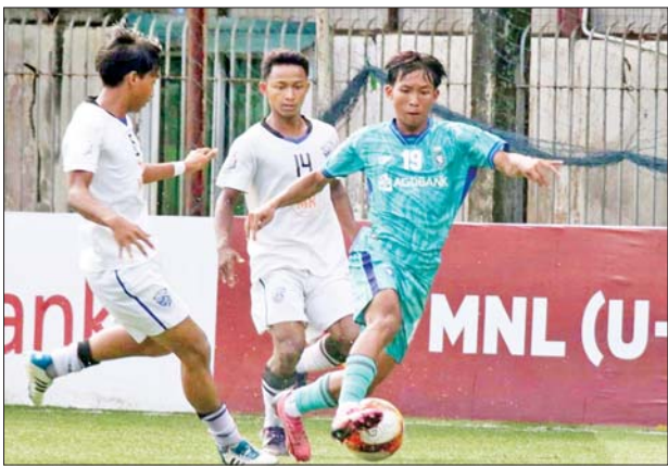
ရန်ကုန်ယူနိုက်တက်အသင်းနှင့် Dagon Port အသင်းတို့ ယှဉ်ပြိုင်နေစဉ်။

ရန်ကုန် ဩဂုတ် ၂၉ ၂၀၂၄ ရာသီ MNL ယူ-၂၀ လူငယ်လိဂ်ပြိုင်ပွဲ ပထမအကျော့ နောက်ဆုံးရက်သတ္တပတ်ဖြစ်သည့် ပွဲစဉ် (၁၃) နောက်ဆုံးနေ့ကို ဩဂုတ် ၂၉ ရက်က ဗဟန်းမြက်ခင်းတိုက်တွင် ဦးကျင်းပရာ ရန်ကုန်ယူနိုက်တက်အသင်းက Dagon Port အသင်းကို နှစ်ဂိုး-တစ်ဂိုးဖြင့် အနိုင်ရခဲ့သည်။ နိုင်ငံပွဲဆက် ရန်ကုန်ယူနိုက်တက်အသင်းသည် ပထမအကျော့ပြီးခါနီးတွင် ရလဒ်ကောင်းများဆက်တိုက်ရရှိကာ နိုင်ငံပွဲဆက်ခဲ့သည်။ Dagon Port အသင်းသည် ဒုတိယပိုင်းတွင် ချေပဂိုးပြန်သွင်းနိုင်သော်လည်း ချေပဂိုးရပြီး လေးမိနစ်အကြာမှာပင် ဂိုးထပ်ပေးလိုက်ရသဖြင့် ရှုံးပွဲကြုံတွေ့ခဲ့ခြင်းဖြစ်သည်။ စာမျက်နှာ ၁၂ ကော်လံ ၅ သို့ ၀