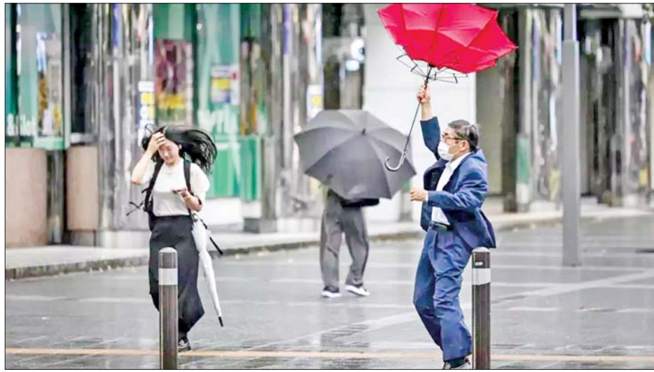
ဖြစ်ပွားလျက်ရှိသည်။

အဆိုပါမုန်တိုင်းတိုက်ခတ်မှုကြောင့် ဆက်သွယ် ရေးလမ်းကြောင်းများ ပြတ်တောက်ကာ နေရာအနှံ့ တွင် လျှပ်စစ်မီးနှင့် ရေပြတ်တောက်မှုများ