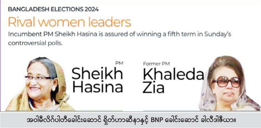
အဝါမိလိဂ်ပါတီခေါင်းဆောင် ရှိတ်ဟာဆီနာနှင့် BNP ခေါင်းဆောင် ခါလီဒါဇီယာ။

ယင်းနောက် ဆက်ခံသည့် ဒုတိယဗိုလ်ချုပ်ကြီး အာရှတ်မှာ ၁၉၉၀ ပြည့်နှစ်တွင် အတိုက်အခံ နိုင်ငံရေးပါတီများ၏ အကြံဆန့်ကျင်မှုကြောင့် ရာထူးမှ နုတ်ထွက်ပေးခဲ့ရသည်။ ထိုမှနောက်ပိုင်းတွင် ဘင်္ဂလားဒေ့ရှ်နိုင်ငံ၌ အဓိကနိုင်ငံရေးပါတီကြီးနှစ်ခုဖြစ်သော ခါလီဒါဇီယာဦးဆောင်သည့် BNP ပါတီနှင့် ရှိတ်ဟာဆီနာ ဦးဆောင်သည့် အဝါမိလိဂ်ပါတီတို့ကသာ အားပြိုင် နေခဲ့ကြကာ တစ်လှည့်စီ အာဏာရနေခဲ့ကြသည်။ ပါတီစုံဒီမိုကရေစီဟုဆိုသော်လည်း တစ်ပါတီ အာဏာရလျှင် အတိုက်အခံပါတီက လွှတ်တော် မတက်ဘဲ သပိတ်မှောက်သည်။ ရွေးကောက်ပွဲ လုပ်သည့်အခါ တစ်ဖက်နှင့်တစ်ဖက် လုံးဝ မယုံကြည်သဖြင့် သမ္မတက ကြားဖြတ်အစိုးရဖွဲ့ကာ ရွေးကောက်ပွဲလုပ်ပေးရသည်။