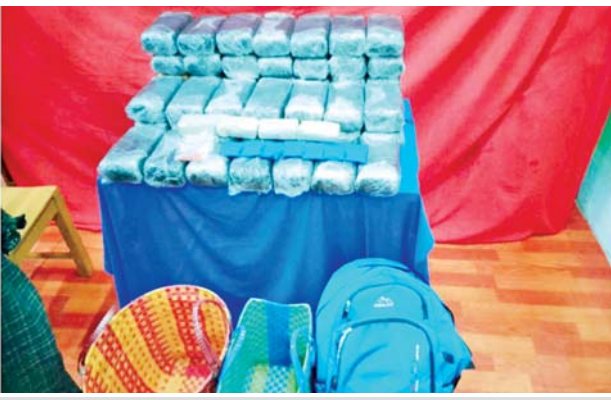
အမှတ်(၁၂)အစုန် လူစီးအမြန်ရထားပေါ်မှ စိတ်ကြွေးယစ် ဆေးဝါးများ တွေ့ရှိမှု မှတ်တမ်းဓာတ်ပုံ။