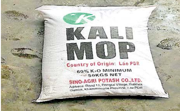
အေးရှားပေါလ်ကုန်သေတ္တာစစ်ဆေးရေးစခန်း၌ သိမ်းဆည်းရမိမှု။

နေပြည်တော် ဩဂုတ် ၂၉ - တရားမဝင် ကုန်သွယ်မှု တိုက်ဖျက်ရေးဦးဆောင်ကော်မတီ၏ ကြီးကြပ်ကွပ်ကဲမှုဖြင့် တရားမဝင် ကုန်သွယ်မှုများကို ဥပဒေနှင့်အညီ ထိရောက်စွာ တားဆီးအရေးယူ နိုင်ရေး ဆောင်ရွက်လျက်ရှိရာ ဩဂုတ် ၂၆ ရက်နှင့် ၂၇ ရက်တို့တွင် အကောက်ခွန်ဦးစီးဌာန၏ စီမံခန့်ခွဲမှုဖြင့် အေးရှားပေါလ် ကုန်သေတ္တာစစ်ဆေးရေးစခန်း၌ ကုန်သေတ္တာ ၂၃ လုံးအတွင်းမှ သွင်းကုန် ကြေညာလွှာတွင် ကြေညာထားသည်ထက် ပိုမိုပါရှိလာသည့် 100% Polyester Woven Dyed Fabric မီတာ ၈၂၅၀၀ အပါအဝင် လုပ်ငန်းသုံးပစ္စည်း သုံးမျိုးနှင့် လူသုံးကုန်ပစ္စည်း တစ်မျိုး(ခန့်မှန်းတန်ဖိုး ငွေကျပ် ၂၂၉၀၃၃၅၀)ကိုလည်းကောင်း၊ ရန်ကုန်အပြည်ပြည်ဆိုင်ရာ လေဆိပ်ခရီးသည်တစ်ဦး၏ ဝန်စည်များအတွင်းမှ တရားဝင် စာရွက်စာတမ်းအထောက်အထား တင်ပြနိုင်ခြင်းမရှိသည့် လုပ်ငန်းသုံးပစ္စည်း တစ်မျိုး(ခန့်မှန်းတန်ဖိုး ငွေကျပ် ၂၄၀၀၀၀၀)ကိုလည်းကောင်း၊ မြန်မာ့စက်မှုဆိပ်ကမ်း၌ ကုန်သေတ္တာ တစ်လုံးအတွင်းမှ သွင်းကုန် ကြေညာလွှာတွင် ကြေညာထားသည်နှင့် ကွဲလွဲစွာ ပါရှိလာသည့် လူသုံးကုန်ပစ္စည်း တစ်မျိုး(ခန့်မှန်းတန်ဖိုး ငွေကျပ် ၆၄၆၈၀၀၀)ကို လည်းကောင်း၊ ရွာသာကြီး Dry Port ၌ ဘားအံမှ ရန်ကုန်သို့ မောင်းနှင်လာသော