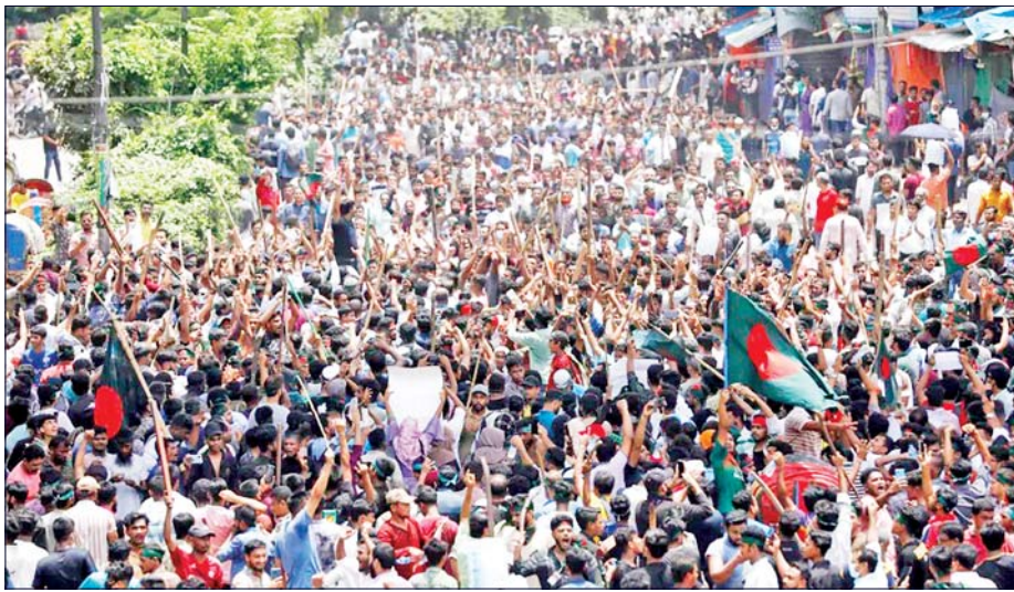
ပိုမိုတင်းမာလာခဲ့လေသည်။

ရိုဟင်ဂျာအခွင့်အရေးအဖွဲ့အစည်းများကလည်း အနောက်နိုင်ငံများ၏ ဖိအားပေးမှုကို ခေါင်းငုံ့မခံဘဲ တုံ့ပြန်ခဲ့ကြသည်။ ၂၀၂၃ ခုနှစ် ဧပြီလတွင် ဘင်္ဂလားဒေ့ရှ်လွှတ်တော်၌ ဝန်ကြီးချုပ် ရိုဟင်ဂျာအခွင့်အရေးအဖွဲ့အစည်းများက မိန့်ခွန်းပြောကြားခဲ့ရာတွင် အမေရိကန်နိုင်ငံကို တုံ့တိုးပင် ဖော်ထုတ်၍ ဖြစ်တင် ဝေဖန်မှုများ ပြုလုပ်ခဲ့သည်။ ရိုဟင်ဂျာအခွင့်အရေး အဖွဲ့အစည်းများကလည်း ဘင်္ဂလားဒေ့ရှ်တွင် ဒီမိုကရေစီ ကို ဆိတ်သုဉ်းအောင်ပြုလုပ်နေပြီး ဒီမိုကရေစီ မကျင့်သုံးသည့် အစိုးရတစ်ရပ် ပေါ်ထွက်လာစေရန် ကြိုးပမ်းနေသည်ဟု စွပ်စွဲခဲ့သည်။ အမေရိကန်သည်