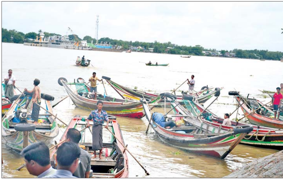
ရန်ကုန်တိုင်းဒေသကြီး ပုဂ္ဂလိကရေယာဉ်များ စနစ်တကျ ပြေးဆွဲရေးကော်မတီကို ဖွဲ့စည်းဆောင်ရွက်ခြင်း ဖြစ်ကြောင်း သိရသည်။

ရန်ကုန်တိုင်းဒေသကြီးအတွင်း ရေကြောင်းဖြင့် ခရီးသွားကြသူများ ဘေးအန္တရာယ်ကင်းရှင်းစေရေး နှင့် ကုန်စည်များ လုံခြုံချောမွေ့စွာ လိုရာခရီးသို့ သယ်ယူပို့ဆောင်နိုင်ရေး ဝန်ဆောင်မှုပေးနိုင်ရန်၊ ရေယာဉ်လုပ်ငန်းလုပ်ကိုင်သူများ၊ ရေယာဉ်ပိုင်ရှင် များ၊ ရေယာဉ်လုပ်သားများအနေဖြင့် ချမှတ်ထား သောစည်းမျဉ်းစည်းကမ်းများနှင့်အညီ လုပ်ငန်း လုပ်ဆောင်နိုင်စေရန်၊ ရေယာဉ်ဆိုက်ကပ်သည့် ဆိပ်ကမ်းနေရာများ စနစ်တကျ ရှိစေရေးဆောင်ရွက် ရန်၊ ရေယာဉ်စည်းကမ်း၊ ရေကြောင်းဆိုင်ရာ စည်းကမ်းများကို လိုက်နာဆောင်ရွက်ခြင်းဖြင့် ရေယာဉ်မတော်တဆမှုများ လျော့နည်းပပျောက်စေ