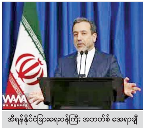
အီရန်နိုင်ငံခြားရေးဝန်ကြီး အဘတ်စ် အေရာချီ

လည်း ပြောကြားသည်။ ၎င်းတို့၏ အသုံး ပြုမှုသည် တိကျမှုကို မြှင့်တင်ခြင်းဖြင့် ထိခိုက်မှုရှိစေရန် မရည်ရွယ်သည့်ပစ္စည်း များ ပျက်စီးဆုံးရှုံးမှုကို လျော့နည်းစေ ကြောင်းလည်း ၎င်းတို့က ဆိုသည်။ ၎င်းစနစ်သည် လူသားထိန်းချုပ်မှု၏ စိတ် သို့မဟုတ် ရုပ်ပိုင်းဆိုင်ရာ အခြေ အနေကြောင့် ဖြစ်ပေါ်လာနိုင်သည့် အမှားများကို ဖယ်ရှားပေးနိုင်ကြောင်း လည်း ၎င်းတို့က ထပ်လောင်းပြော သည်။ ဆက်လက်စောင့်ကြည့်ရမည် ကုလသမဂ္ဂ အထွေထွေညီလာခံနှင့် အခြားဖိုရမ်များတွင် လူထိန်းချုပ်မဲ့ လက်နက်စနစ်ကို တားမြစ်ရန် သတ်မှတ် အဖွဲ့ဝင်နိုင်ငံများက သဘောတူညီမှုရှိ မရှိကို ဆက်လက်စောင့်ကြည့်ရမည် ဖြစ်သည်။ ကိုးကား - အင်န်အိတ်ချ်ကေ ဘာသာပြန် - အောင်ကျော်ကျော်