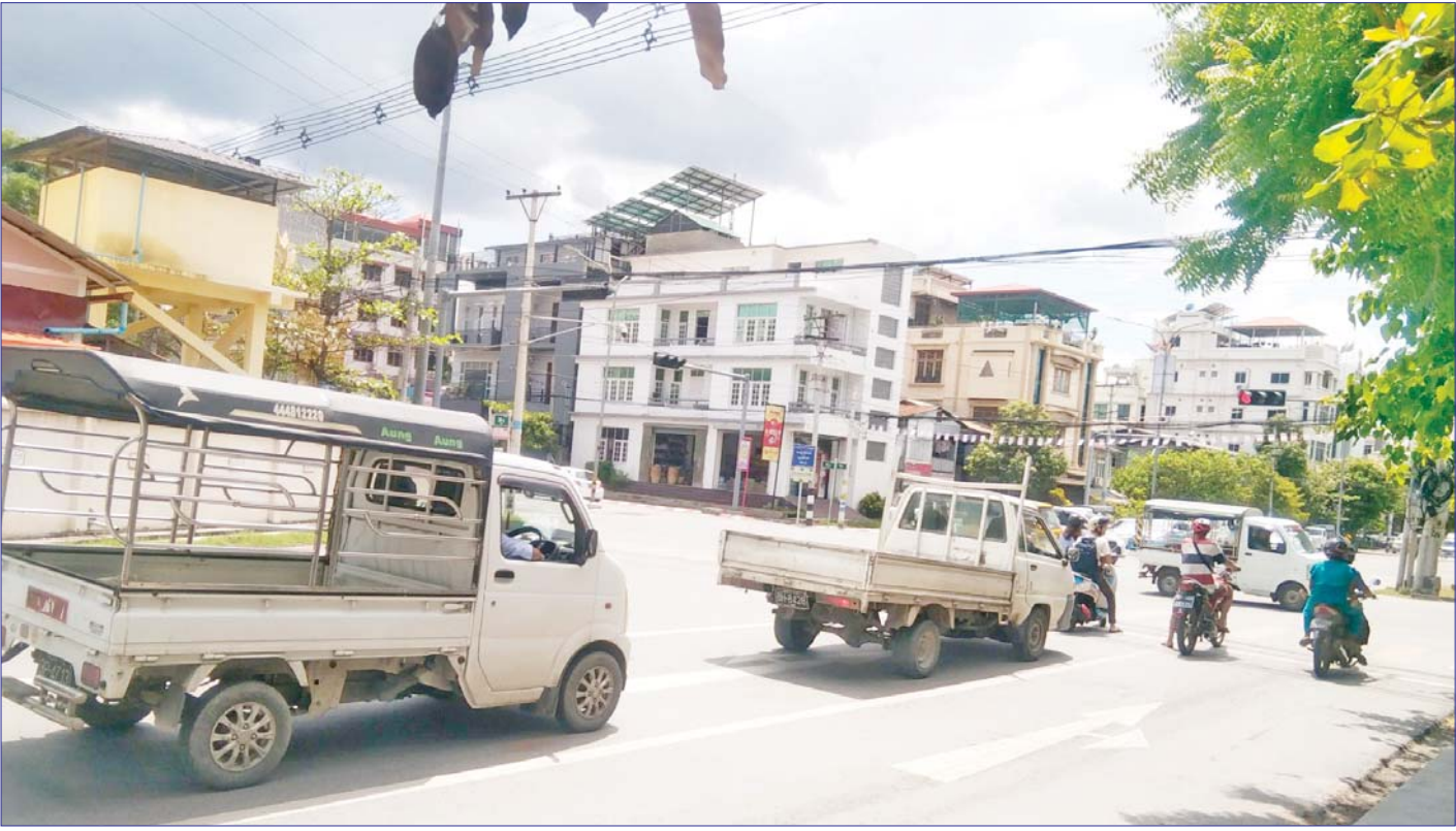
မန္တလေးမြို့ရှိ မီးပွိုင့်တစ်ခု၌ ယာဉ်များ သွားလာလျက်ရှိသည်ကို တွေ့ရစဉ်။

မန္တလေး၊ ဩဂုတ် ၂၈ မန္တလေးမြို့တော် စည်ပင်သာယာရေးကော်မတီသည် မြို့တော်အတွင်း ယာဉ်အန္တရာယ်ကင်းရှင်းစေရန်နှင့် ယာဉ်ကြောကျပ်တည်းသော လမ်းများတွင် မီးပွိုင့်ပေါင်း ၁၂၂ ခုတပ်ဆင်ထားရှိသည့်အနက် ဆိုလာစနစ်သုံးမီးပွိုင့်များလည်း ပါဝင်ပြီး ယခု၂၀၂၄-၂၀၂၅ ဘဏ္ဍာနှစ်တွင် ရိုးရိုး LED မီးပွိုင့်အသစ်ခြောက်ခုကို ထပ်မံတိုးချဲ့တပ်ဆင်သွားမည်ဖြစ်ကြောင်း မန္တလေးမြို့တော်ဝန် ဦးကျော်ဆန်းက ပြောသည်။ တိုးချဲ့တပ်ဆင်မည့်နေရာများ တိုးချဲ့တပ်ဆင်မည့်နေရာများမှာ မန္တလေး-မတ္တရာလမ်းနှင့် GTC လမ်းထောင့်(အောင်မြေသာစံမြို့နယ်)၊ လမ်း ၃၀ နှင့် လမ်း ၆၀ ထောင့်(ချမ်းအေးသာစံမြို့နယ်)၊ ၄၁ လမ်းနှင့် ၅၃ လမ်း၊ ၄၁လမ်းနှင့် လမ်း ၆၀(မဟာအောင်မြေမြို့နယ်)၊ လမ်း ၆၀နှင့်လမ်း ၁၁၀ (ချမ်းမြသာစည်မြို့နယ်)၊ ၆၂ လမ်းနှင့် ၁၂၅ လမ်း (ပြည်ကြီးတံခွန်မြို့နယ်) တို့ဖြစ်ကြောင်း သိရသည်။ “နံနက်ပိုင်း၊ ညနေပိုင်း ကျောင်းသွားကျောင်းပြန်အချိန်တွေမှာ ယာဉ်ကြောရှုပ်ထွေးတဲ့နေရာတွေ ရှိတယ်။ ကိုယ်ပိုင်ကျောင်းတွေမှာ ကျောင်းပို့ ကျောင်းကြိုကို စာမျက်နှာ ၃ ကော်လံ ၁ သို့ ❁