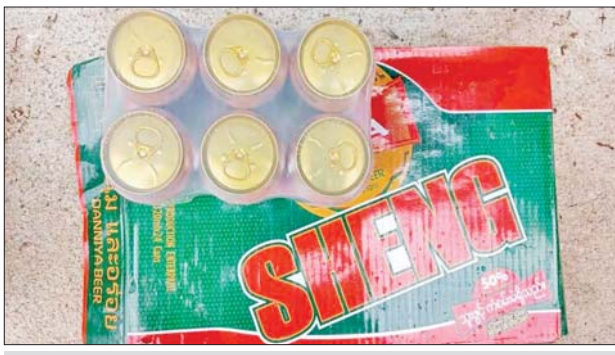
ရမ်းပြည်နယ်၌ သိမ်းဆည်းရမိမှု။

တရားမဝင်ကုန်သွယ်မှုတိုက်ဖျက်ရေး ဦးဆောင်ကော်မတီ၏ ကြီးကြပ်ကွပ်ကဲမှုဖြင့် တရားမဝင်ကုန်သွယ်မှုများကို ဥပဒေနှင့်အညီ ထိရောက်စွာ တားဆီးအရေးယူနိုင်ရေး ဆောင်ရွက်လျက်ရှိရာ ဩဂုတ် ၂၆ ရက်တွင် မန္တလေးတိုင်းဒေသကြီး တရားမဝင်ကုန်သွယ်မှု တိုက်ဖျက်ရေးအထူးအဖွဲ့၏ စီမံခန့်ခွဲမှုဖြင့် တာဝန်ကျပူးပေါင်းအဖွဲ့က စစ်ဆေးမှုများ ဆောင်ရွက်ခဲ့ရာ မြစ်ငယ်စစ်ဆေးရေးစခန်း၌ ရန်ကုန် မှ မန္တလေးသို့ မောင်းနှင်လာသော ယာဉ်တစ်စီးပေါ်မှ တရားဝင် စာရွက်စာတမ်း အထောက်အထား တင်ပြနိုင်ခြင်းမရှိသည့် လုပ်ငန်းသုံး ပစ္စည်း ၁၆ မျိုး (ခန့်မှန်းတန်ဖိုးငွေကျပ် ၂၀၀၀၇၉၁၆၅ ကျပ်)နှင့် အဆိုပါ ပစ္စည်းများ တင်ဆောင်လာသည့် Hino Proflia Truck တစ်စီး (ခန့်မှန်း တန်ဖိုးငွေကျပ် ၃၃၀၀၀၀၀) စုစုပေါင်း ခန့်မှန်းတန်ဖိုးငွေကျပ် ၂၄၃၀၇၉၁၆၅ ကျပ်ကို သိမ်းဆည်းရမိခဲ့ပြီး အကောက်ခွန်လုပ်ထုံး လုပ်နည်းများနှင့်အညီ အရေးယူဆောင်ရွက်လျက်ရှိသည်။