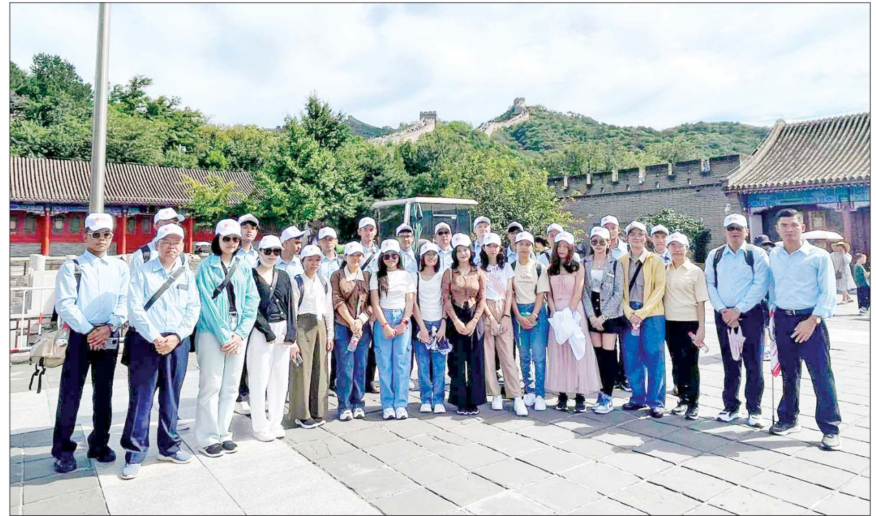
လေ့လာခြင်းများ ဆောင်ရွက်ခဲ့ကြသည့်။ ထိုသို့ သွားရောက်လေ့လာရာ တွင် နိုင်ငံတော်အဆင့် ဘက်စုံ များက သိရှိလိုသည်များ မေးမြန်း လိုက်လံရှင်းလင်း ပြသခဲ့ကြ ပညာထူးချွန်လူငယ် ရွေးချယ်ခံရ ခဲ့ကြရာ သက်ဆိုင်ရာ နေရာ ကြောင်း သိရသည်။ သတင်းစဉ်

လေဆိပ်သို့ ရောက်ရှိကြပြီး မြန်မာနိုင်ငံဆိုင်ရာ စစ်သံမှူး ဗိုလ်မှူးချုပ်ဇော်ဇော်နိုင်နှင့် တာဝန်ရှိသူများက ကြိုဆိုနှုတ်ဆက်ကြသည်။ သွားရောက်လည်ပတ် အဆိုပါ ထူးချွန်လူငယ်များ ပါဝင်သည့် လေ့လာရေးအဖွဲ့သည် ဩဂုတ် ၂၇ ရက် နံနက်ပိုင်းတွင် ပေကျင်းမြို့ရှိ Tian Tan ပန်းခြံသို့ သွားရောက် လည်ပတ်ခြင်း၊ မွန်းလွဲပိုင်းတွင် Ling Guang ဘုရားကျောင်းသို့ သွားရောက်၍ ဘုရားကျောင်းတွင် ကိန်းဝပ် စံပယ်တော်မူသော ဗုဒ္ဓမြတ်စွယ်တော်အား ဖူးမြော်ခြင်းများ ဆောင်ရွက်ခဲ့ကြသည်။ ယနေ့နံနက်ပိုင်းတွင် အဆိုပါ ထူးချွန်လူငယ်များ ပါဝင်သည့် လေ့လာရေးအဖွဲ့သည် ပေကျင်းမြို့ရှိ Great Wall သို့ သွားရောက် လေ့လာခဲ့ကြပြီး မွန်းလွဲပိုင်းတွင် နွေရာသီနန်းတော်သို့ သွားရောက်