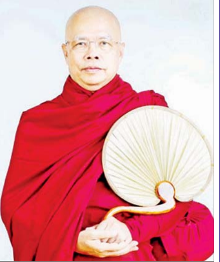
မှာကတည်းက ကိစ္စပြီးပါတယ်။ စံဝင်လို့ရနိုင်တဲ့ သီလ သမာဓိ ပညာသတ္တိတွေ အပြည့်ရှိနေခဲ့ပါတယ်။ ။ ဓမ္မဒူတ ဒေါက်တာအရှင်ဆေကိန္ဒ၏ “ဧည့်သည်” စာအုပ်မှ ဆရာတော်၏ခွင့်ပြုချက်ဖြင့် ကူးယူ ဖော်ပြပါသည်။

ထက် များလှပါတယ်။ အဲဒီလောက်ထိ ပင်ပန်းဆင်းရဲခဲပြီးတော့ ဘုရား ဖြစ်ဖို့၊ သဗ္ဗညုတဉာဏ်ရဖို့ ကျင့်ကြံကြိုးကုတ် အားထုတ်ခဲ့ရတာပါ။ ဘုရားရှင်ဟာ သုမေဓာရှင်ရသေ့ဘဝကတည်း က မိမိတစ်ဦးတည်း နိဗ္ဗာန်ကို စံဝင်ကြမြန်းသွားလို့ ရင် တစ်ကိုယ်တည်း စံဝင်ကြမြန်းသွားလို့ ရပါတယ်။ တစ်ကိုယ်တည်း နိဗ္ဗာန်ကို စံဝင်သွားတာလည်း ကောင်းပါတယ်။ ဒါပေမဲ့ အလောင်းတော်မြတ်ရဲ့ ပါရမီဓာတ်က တစ်ကိုယ်ကောင်းလုပ်ဖို့ ဆန္ဒမရှိပါ ဘူး။ တစ်ကိုယ်ကောင်း မဆန်ပါဘူး။ “နိဗ္ဗာန်တစ်ဖက် ကမ်းဆီ ငါတစ်ယောက်တည်း မကူးမြောက်လို့ ဘူး”တဲ့။ သံသရာရေယာဉ်ကြောမှာ မျောပါပြီး ဒုက္ခ ရောက်နေတဲ့ သတ္တဝါတွေကို စွမ်းနိုင်သမျှ ထုတ်ဆယ် ပြီး ကယ်တင်တော်မူလိုတဲ့ မဟာကရုဏာတော် မြတ်ကြီးနဲ့ အများအကျိုးသယ်ပိုးဖို့ ပါရမီတော် တွေကို ဖြည့်ကျင့်တော်မူခဲ့ပါတယ်။ ဘုရားရှင်အနေနဲ့ နိဗ္ဗာန်စံဝင်ဖို့ဆိုရင် သူတစ်ယောက်တည်းအတွက်ဆိုရင် သုမေဓာဘဝ