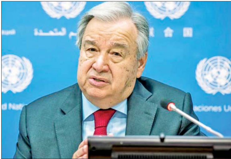
လူသားထိန်းချုပ်မှုမရှိဘဲ လုပ်ဆောင် နိုင်သော သေစေသည့် လက်နက်စနစ်များ ကို တားမြစ်ရန် အဖွဲ့ဝင်နိုင်ငံများကို ကုလသမဂ္ဂအကြီးအကဲဂူတာရက်စ်က တိုက်တွန်းခဲ့သည်။ သို့သော် အချို့သော အဖွဲ့ဝင်နိုင်ငံများ က လူထိန်းချုပ်မဲ့ လက်နက်စနစ်ဆိုင်ရာ ဥပဒေများချမှတ်ရန် အဓိပ္ပာယ်ဖွင့်ဆို ချက်ကို မသတ်မှတ်ရသေးကြောင်း ပြောကြားသည်။ ထိုကဲ့သို့သော နိုင်ငံများက အဆိုပါ လက်နက်စနစ်၏ အကျိုးကျေးဇူးများကို

သည်။ ဥပဒေမရှိသည့် လက်နက် များကို ကိုင်တွယ်ဖြေရှင်းရန် ရည်ရွယ် သည့် ကုလသမဂ္ဂဆုံးဖြတ်ချက်ကို အတည်ပြုပြီးနောက် အဖွဲ့ဝင်နိုင်ငံများနှင့် လူ့အခွင့်အရေးအဖွဲ့များ၏ သဘောထား အမြင်များပါဝင်သော အစီရင်ခံစာတစ်ရပ် ကို ကုလသမဂ္ဂအတွင်းရေးမှူးချုပ်က အချက်အလက် စုဆောင်းလျက်ရှိ သည်။ လူမဆန်သောလုပ်ရပ် လူသားများကို စက်မှုဖြင့် အလို အလျောက် ပစ်မှတ်ထားခြင်းသည် လူမဆန်သောလုပ်ရပ်အဖြစ် သုံးသပ်မိပါ ကြောင်း ဂူတာရက်စ်က ပြောသည်။ နိုင်ငံတကာ အသိုက်အဝန်းက အဆိုပါကိစ္စနှင့်ပတ်သက်ပြီး ကြိုတင် ကာကွယ်မှုများလုပ်ဆောင်ရန် ကြိုးပမ်း သင့်ကြောင်းလည်း ၎င်းက ဆက်လက် ပြောသည်။