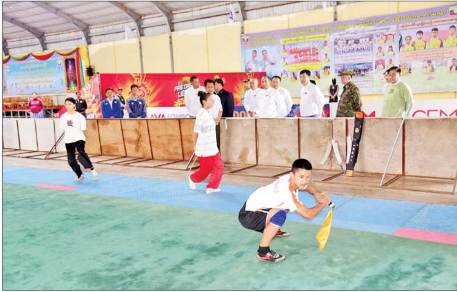
ဆက်လက်၍ ပြည်နယ်ဝန်ကြီးချုပ်နှင့်အဖွဲ့ ဘောလုံးအဖွဲ့ချုပ်နှင့် ရှမ်းပြည်နယ်ဘောလုံးအဖွဲ့ချုပ်သည် ပြည်နယ်အားကစားကွင်း၌ မြန်မာနိုင်ငံ တို့ ပူးပေါင်းဖွင့်လှစ်လျက်ရှိသည့် ဘောလုံးနည်းပြ

၂၀၂၄ ခုနှစ် ပဉ္စမအကြိမ် အမျိုးသားအားကစားပွဲတော်တွင် ရှမ်းပြည်နယ်ကိုယ်စားပြုအဖြစ် ဝူရှူးအားကစားနည်း အတန်းလိုက် ပါဝင်ယှဉ်ပြိုင်နိုင်ရန် လူရွေးချယ်နိုင်ရေးအတွက် ပြည်နယ်အားကစားလေ့ကျင့်ရုံ၌ လေ့ကျင့်နေမှုကို ဩဂုတ် ၂၇ ရက်နံနက် ၉နာရီခွဲက ပြည်နယ်ဝန်ကြီးချုပ် ဦးအောင်အောင်၊ ပြည်နယ်ဝန်ကြီးများ၊ ပြည်နယ်ဥပဒေချုပ်၊ ပြည်နယ်အစိုးရအဖွဲ့အတွင်းရေးမှူးနှင့် တာဝန်ရှိသူများက သွားရောက်ကြည့်ရှုအားပေးခဲ့သည်။