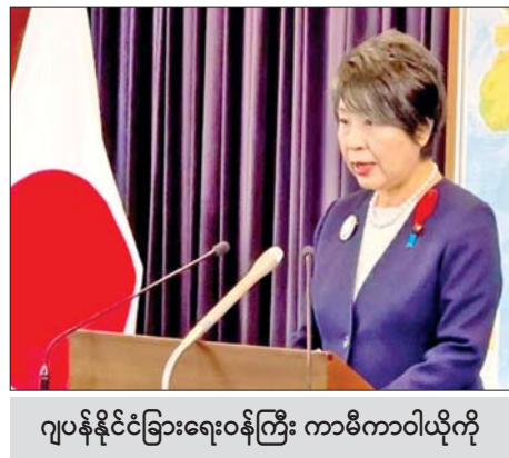
ဂျပန်နိုင်ငံခြားရေးဝန်ကြီး ကာမီကာဝါယိုကို

အရှေ့အလယ်ပိုင်းဒေသ၌ တင်းမာမှုများလျော့ချရေးအတွက် သံတမန်နည်းလမ်းဖြင့်ဆောင်ရွက်ရန် ဂျပန်နိုင်ငံခြားရေးဝန်ကြီး တိုက်တွန်း ကိုကျို ဩဂုတ် ၂၈ အရှေ့အလယ်ပိုင်းဒေသတွင် တင်းမာမှုများ လျော့ချရေးအတွက် အီရန်က သံတမန်နည်းလမ်းဖြင့် ဆောင်ရွက်ရန် ဂျပန်နိုင်ငံခြားရေးဝန်ကြီး ကာမီကာ ဝါယိုကိုက တိုက်တွန်းခဲ့ကြောင်း ယနေ့ အင်န်အိတ်ချ်ကေသတင်းအရ သိရသည်။ ၎င်းအရေးနှင့်စပ်လျဉ်း၍ ဂျပန်နိုင်ငံခြားရေး ဝန်ကြီး ကာမီကာဝါယိုကိုနှင့် အီရန်နိုင်ငံခြားရေး ဝန်ကြီး အဘတ်စ်အေရာချီတို့အကြား တယ်လီဖုန်း ဖြင့် ဆွေးနွေးမှုပြုခဲ့သည်။ အီရန်အနေဖြင့် ဟားမတ်စ် ခေါင်းဆောင်သေဆုံးခဲ့ခြင်းအတွက် အစွဲအခဲအား လက်တုံ့ပြန်လိုသော်လည်း အစွဲအခဲနှင့်ဟားမတ်စ် အကြားဆွေးနွေးပွဲ၏ တိုးတက်မှုအခြေအနေများကို သုံးသပ်ပြီး ချင့်ချိန်ဆောင်ရွက်မည်ဟု အီရန် နိုင်ငံခြားရေးဝန်ကြီးက ပြောကြားသည်။ တင်းမာမှုများဖြင့်တက်လာခြင်းဖြင့် ဒေသ တွင်း၌ မည်သူတစ်ဦးတစ်ယောက်ကိုမျှ အကျိုးမရှိ စေသောကြောင့် သံတမန်နည်းလမ်းဖြင့် ဖြေရှင်း ဆောင်ရွက်ရန် ကာမီကာဝါယိုကိုက မှတ်ချက်ပြု ပြောကြားသည်။ ထို့ပြင် ဟစ်ဇ်ဘိုလာအဖွဲ့ကိုလည်း စစ်ရေးနည်း လမ်းဖြင့်မဟုတ်ဘဲ သင့်တော်သည့်နည်းလမ်းဖြင့် ပဋိပက္ခများကို ဖြေရှင်းဆောင်ရွက်ရေးအတွက် အီရန်က ကြားဝင်တိုက်တွန်းရန် ဂျပန်နိုင်ငံခြားရေး ဝန်ကြီးက ပန်ကြားခဲ့သည်။ အရှေ့အလယ်ပိုင်းဒေသတွင် တင်းမာမှုများ လျော့ချရေးအတွက် ကြိုးပမ်းဆောင်ရွက်မည်ဟု အီရန်နိုင်ငံခြားရေးဝန်ကြီးက ပြောကြားခဲ့သည်။ ကိုးကား - အင်န်အိတ်ချ်ကေ ဘာသာပြန် - စိုးသူရ