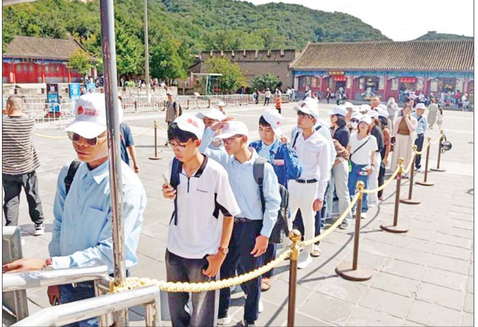
၂၀၂၃-၂၀၂၄ ပညာသင်နှစ် တက္ကသိုလ်ဝင်စာမေးပွဲတွင် ထူးချွန်စွာအောင်မြင်ခဲ့သည့် ကျောင်းသား ကျောင်းသူများနှင့် ဂုဏ်ထူးဖြင့်အောင်မြင်သည့်စစ်သည်များ ပါဝင်သော မျိုးဆက်သစ် ထူးချွန်လူငယ်မောင်မယ်များ တရုတ်ပြည်သူ့သမ္မတနိုင်ငံ ပေကျင်းမြို့ရှိ အထင်ကရနေရာများတွင် လေ့လာကြစဉ်။