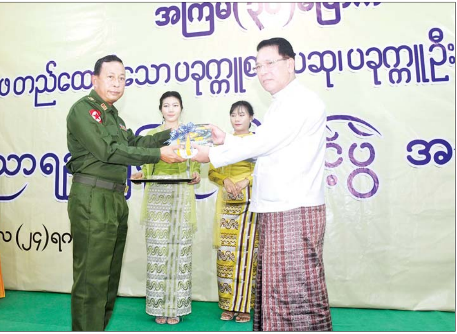
နိုင်ငံတော်စီမံအုပ်ချုပ်ရေးကောင်စီဥက္ကဋ္ဌ နိုင်ငံတော်ဝန်ကြီးချုပ် ဗိုလ်ချုပ်မှူးကြီး မင်းအောင်လှိုင်နှင့် ဇနီး ဒေါ်ကြူကြူလှမိသားစုက တပ်မတော်တပ်ရင်းတပ်ဖွဲ့များလက်အောက်ရှိ စာကြည့်တိုက်များသို့ ပေးအပ်လှူဒါန်းသည့် လူထုသိပ္ပံကျမ်းစာအတွဲ (၆) နှင့် အတွဲ (၇) တစ်မျိုးလျှင် အုပ်ရေ ၅၀၀ စီ စုစုပေါင်း အုပ်ရေ ၁၀၀၀ ကို ပြည်ထောင်စုဝန်ကြီး ဦးမောင်မောင်အုန်းက ပေးအပ်လှူဒါန်းရာ ရန်ကုန်တိုင်း စစ်ဌာနချုပ် ဒုတိယတိုင်းမှူး ဗိုလ်မှူးကြီး ထွန်းထွန်းဦး လက်ခံရယူစဉ်။

တစ်သက်တာစာပေဆု အပါအဝင် ဝတ္ထုရှည်ဆု၊ ဝတ္ထုတိုပေါင်းချုပ် ဆု၊ ကဗျာပေါင်းချုပ်ဆု၊ ကျမ်း စာပေဆုနှင့် သုတေသနစာပေဆု စုစုပေါင်း ၁၆ ဆုကို ချီးမြှင့်နိုင်ခဲ့ သည့်အတွက် ဆုရရှိသူ စာရေး ဆရာ ဆရာမကြီးများအတွက် ဂုဏ်ယူ ဝမ်းမြောက်ပါကြောင်း၊ ဘာသာရပ်တိုင်းတွင် ဆုရရှိသော စာမူလက်ရာများသည် နိုင်ငံနှင့် ပြည်သူအတွက် ရသာ၊ သုတ ဖြည့်ဆည်းပေးမည့် ဘဝလမ်းညွှန် စာမူကောင်းများ ဖြစ်ကြပါ ကြောင်း၊ ဆုရရှိသူ ဆရာ ဆရာမ ကြီးများအားလုံး မိမိတို့၏ကလောင် အစွမ်းဖြင့် နိုင်ငံတော်ဖွံ့ဖြိုး ရေးလုပ်ငန်းများကို ဆတက် ထမ်းပိုး ဆောင်ရွက်နိုင်ကြပါစေဟု ဆန္ဒပြုအပ်ပါကြောင်း၊ ထိုနည်းတူ ပညာရည်ချွန်ဆု ရရှိကြသော သားငယ်၊ သမီးငယ်လေးများကို လည်း ဂုဏ်ပြုမှတ်တမ်းတင်အပ်