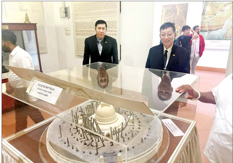
ပြည်ထောင်စုဝန်ကြီး ဦးတင်ဦးလွင် စွယ်တော်တိုက်အတွင်းရှိ နိုင်ငံအလိုက် ဗုဒ္ဓဘာသာနှင့်သက်ဆိုင်သည့် ပြခန်းများကို ကြည့်ရှုလေ့လာစဉ်။

အခမ်းအနားတွင် သီတဂူဆရာတော် ဘဒ္ဒန္တဉာဏိဿရအား ကော့တေးဗုဒ္ဓဘာသာအဖွဲ့ချုပ်က ဆက်ကပ်ချီးမြှင့်သည့် ထေရဝံသလင်္ကာရ မဟာဂဏစရိယသဒ္ဓမ္မကိတ္တိသီရိဘွဲ့တံဆိပ်အား ဆက်ကပ်ချီးမြှင့်ခဲ့ပြီး ဥပဒေပိုင်းတွင် အခမ်းအနားကို ရုပ်သိမ်းကာ ပြည်ထောင်စုဝန်ကြီးနှင့် အခမ်းအနားတက်ရောက်ကြသူများက စုပေါင်းမှတ်တမ်းတင်ဓာတ်ပုံရိုက်ကြသည်။ သတင်းစဉ်