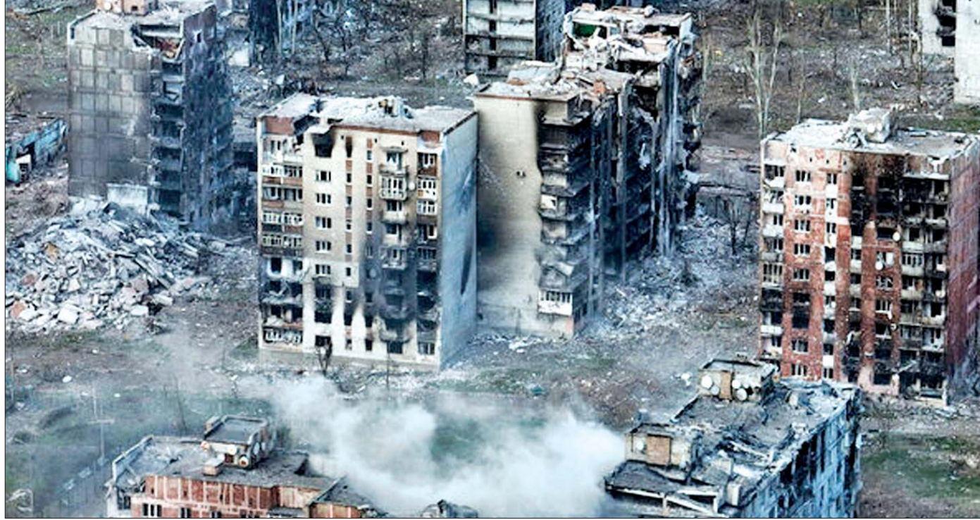
ရုရှား-ယူကရိန်းစစ်ပွဲကြောင့် ပျက်စီးဆုံးရှုံးမှုများကို တွေ့ရစဉ်။

အနောက်မီဒီယာအများအပြားက “ကိုးလီယက် လူ့ဘီလူးကြီး” ရုရှားကို “နွားကျောင်းသား ဒေသစစ်” ယူကရိန်းက လေးစွာဖြင့်ထု၍ အနိုင်ယူလိုက်လေပြီဟု သောင်းသောင်းဖြဖြ ဩဘာပေးခဲ့ကြသည်။ အမှန်တကယ်တွင်မူ ယူကရိန်းတပ်ဖွဲ့များက ရုရှားနိုင်ငံအတွင်းသို့ ထိုးဖောက်ဝင်ရောက်နိုင်သော အကူအဝေးမှာ မိုင် ၂၀ ခန့်သာဖြစ်ပြီး စုစုပေါင်း သိမ်းပိုက်ထားနိုင်သော နယ်မြေမှာလည်း စတုရန်းကီလိုမီတာ ၁၂၅၀ (စတုရန်းမိုင် ၄၈၀ ခန့်)သာ ဖြစ်၏။ ရုရှားနိုင်ငံတစ်ခုလုံး၏ ဧရိယာစတုရန်းကီလိုမီတာ ၁၇ သန်းနှင့်ဆိုပါက ၀.၀၀၇၃ ရာခိုင်နှုန်းမျှသာရှိ၏။ သို့သော်လည်း ထိုသို့စာမဖွဲ့လောက်သောသိမ်းပိုက်မှုသည်ပင်လျှင် ကမ္ဘာ့နိုင်ငံရေး၌ အဓိပ္ပာယ်များစွာ ဖော်ဆောင်နေသော ကိစ္စတစ်ရပ် ဖြစ်လာသည်။ ပထမဦးစွာ စိတ်ဝင်စားဖွယ်ကောင်းသော အချက်တစ်ရပ်မှာ ရုရှားနှင့်နိုင်ငံစာလျှင် စစ်အင်အား အဆမတန်ကွာဟနေပါလျက်၊ ဒီပရိုမြစ်ကြောင်း တစ်လျှောက် ရှည်လျားသော စစ်မျက်နှာတွင်လည်း အရေးမလှဖြစ်နေပါလျက် အဘယ်ကြောင့် ယူကရိန်းက အရဲကိုးကာ အလျော်အစားကြီးမား