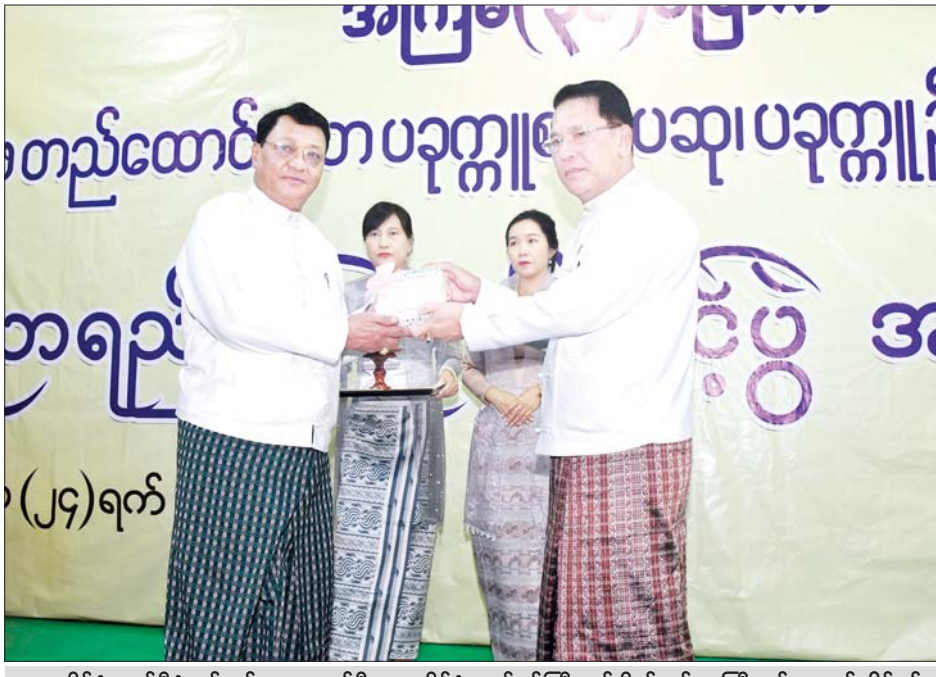
နိုင်ငံတော်စီမံအုပ်ချုပ်ရေးကောင်စီဥက္ကဋ္ဌ နိုင်ငံတော်ဝန်ကြီးချုပ် ဗိုလ်ချုပ်မှူးကြီး မင်းအောင်လှိုင်နှင့် ဇနီးဒေါ်ကြူကြူလှမိသားစုက ပခုက္ကူဦးအုံးဖေတည်ထောင်သော ပခုက္ကူစာပေဆုရန်ပုံငွေသို့ ပေးအပ် လှူဒါန်းသည့် ငွေကျပ် သိန်း ၁၀၀ ကို ပြည်ထောင်စုဝန်ကြီး ဦးမောင်မောင်အုန်းက ပေးအပ်လှူဒါန်းရာ မြန်မာနိုင်ငံစာရေးဆရာအသင်းဥက္ကဋ္ဌ ပခုက္ကူစာပေဆုရန်ပုံငွေကြီးကြပ်ရေးကော်မတီဥက္ကဋ္ဌ ဦးအုန်းမောင် (မြင်းမူမောင်နိုင်မိုး) က လက်ခံရယူစဉ်။

ပါကြောင်း။ နိုင်ငံတော် စီမံအုပ်ချုပ်ရေး ကောင်စီဥက္ကဋ္ဌ နိုင်ငံတော်ဝန်ကြီး ချုပ် ဗိုလ်ချုပ်မှူးကြီးမင်းအောင် လှိုင်က စာကြည့်တိုက်များ ဖွံ့ဖြိုး တိုးတက်ရေးကို အားပေးလျက် ရှိပါကြောင်း၊ မြန်မာနိုင်ငံတစ်ဝန်း လုံးရှိ စာကြည့်တိုက်များနှင့် တပ်မတော်ဌာနချုပ်များ/ တပ်ရင်း တပ်ဖွဲ့ စာကြည့်တိုက်များအတွက် စာအုပ် စာစောင်များကိုလည်း မကြာခဏ လှူဒါန်းပေးလျက်ရှိပါ ကြောင်း၊ ယနေ့အခမ်းအနားတွင် လည်း လူထုသိပ္ပံကျမ်း အတွဲ (၆) နှင့် အတွဲ (၇) တစ်မျိုးလျှင် အုပ်ရေ ၁၅၀၀ စီဖြင့် စုစုပေါင်း အုပ်ရေ ၃၀၀၀ ကို ထပ်မံလှူဒါန်းပါကြောင်း၊ စာကြည့်တိုက်များ၏ အခန်း ကဏ္ဍအရေးကြီးပုံနှင့် စာကြည့် တိုက်ယဉ်ကျေးမှု ထွန်းကားရေး ကို လုပ်ဆောင်ကြရန် လိုအပ်ပုံကို စာမျက်နှာ ၉ သို့ *