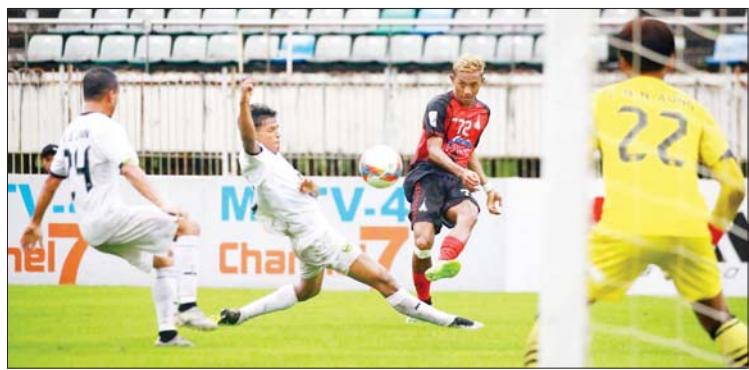
ရတနာပုံအသင်းနှင့် ဒဂုံစတားယူနိုက်တက်အသင်း ယှဉ်ပြိုင်နေစဉ်။