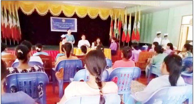
ကျန်းမာရေး စစ်ဆေးခြင်းတို့ကို များက အာဟာရဖွံ့ဖြိုးရေး ရက်သတ္တပတ် သတ်မှတ်ခဲ့ပုံများ၊ ကျန်းမာရေး ရက်သတ္တပတ်