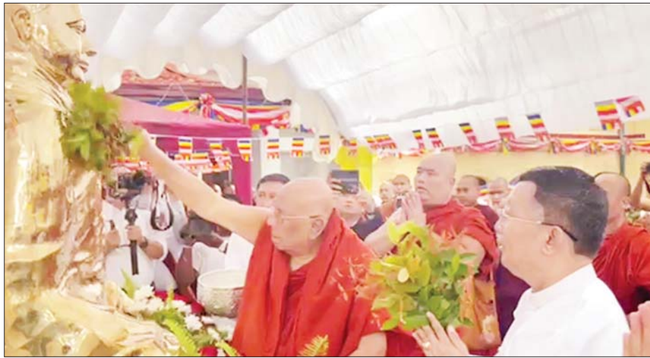
မကုဋ္ဌာရာမမြန်မာကျောင်းတိုက်အတွင်း ကျောင်းတိုက်ကိုတည်ထောင်ခဲ့သော မြန်မာဆရာတော် ဘဒ္ဒန္တဝိနယာလင်္ကာရ၏ရုပ်တုနှင့် ကမ္ဘာ့ဗုဒ္ဓတက္ကသိုလ်များ၏ အဓိပတိ သောဠသမ ရွှေကျင်သာသနာပိုင် ဒေါက်တာဘဒ္ဒန္တဉာဏိဿရက အမွှေးနံ့သာရည်များ ပက်ဖျန်းဖွင့်လှစ်ပေးစဉ်။

ဩဂုတ် ၂၀ ရက်တွင် ကျင်းပခဲ့သည့် မကုဋ္ဌာရာမ မြန်မာကျောင်းတိုက် နှစ်တစ်ရာပြည့်အထိမ်းအမှတ်ပွဲအခမ်းအနားသို့ နိုင်ငံတော်သံဃမဟာနာယကအဖွဲ့ ဒုတိယဥက္ကဋ္ဌ ဒေါက်တာ ဘဒ္ဒန္တစန္ဒနသာရ၊ သီတဂူကမ္ဘာ့ဗုဒ္ဓတက္ကသိုလ်များ၏ အဓိပတိ သောဠသမ ရွှေကျင်သာသနာပိုင် ဒေါက်တာဘဒ္ဒန္တဉာဏိဿရ၊ ရှမ်းပြည်နယ်ဗုဒ္ဓတက္ကသိုလ်ပါမောက္ခ