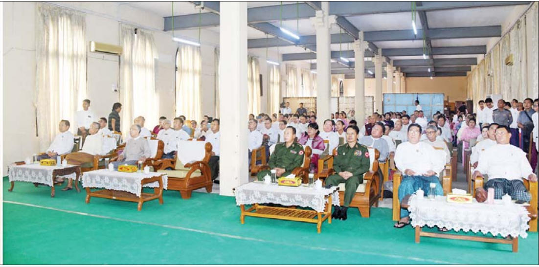
ပြည်ထောင်စုဝန်ကြီး ဦးမောင်မောင်အုန်း အကြိမ် (၃၀) မြောက် ပခုက္ကူဦးအုံးဖေ တည်ထောင်သော ပခုက္ကူစာပေဆု၊ ပခုက္ကူဦးအုံးဖေစာကြည့်တိုက်ဆုနှင့် ပညာရည်ချွန်ဆု ချီးမြှင့်ပွဲအခမ်းအနားတွင် အမှာစကားပြောကြားစဉ်။

ဖိတ်ကြားထားသော ဧည့်သည် တော်များ တက်ရောက်ကြသည်။ ဦးစွာ “စာပေကဏ္ဍအတွက် တန်ဖိုးဖြတ်မရနိုင်သော ပခုက္ကူ စာပေဆု ဗီဒီယိုကလစ်နှင့် ပါရီအိုလံပစ်ဖွင့်ပွဲ ပိတ်ပွဲအခမ်းအနား” ဗီဒီယိုကလစ်တို့ကို ပြသသည်။