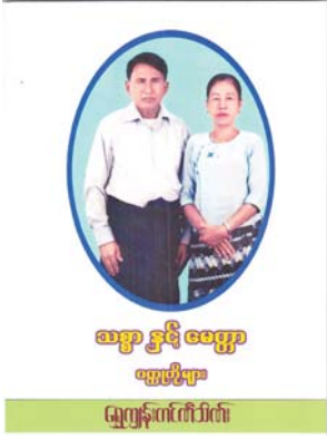
ဗမာ့ ဦးမေတ္တာ ဝတ္ထုတိုများ

ကြေးမုံစာအုပ်စင် စာအုပ်အမြင်ကဏ္ဍတွင် စာအုပ်ထုတ်ဝေသူများ၊ စာအုပ်ဖြန့်ချိသူများ၊ စာရေးဆရာများ၏ ထုတ်ဝေသောစာအုပ်များကိုစာဖတ်ပရိသတ်များ ကျယ်ကျယ်ပြန့်ပြန့် သိရှိလေ့လာဖတ်ရှုနိုင်ရန်အတွက် စုစည်းဖော်ပြပေးလိုက်ပါသည်။ (စာတည်း)