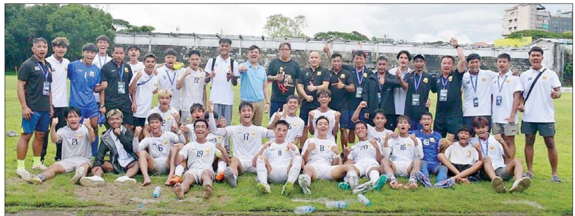
ရာသီဝက်ချန်ပီယံအဖြစ် ရပ်တည်ခဲ့သည့် ရှမ်းယူနိုက်တက်အသင်း။

အသင်း ပထမအကျော့ပြီးဆုံးရန် လက်ကျန်တစ်ပွဲအလိုတွင် ရာသီဝက်ချန်ပီယံအဖြစ် ရပ်တည်နိုင်ခဲ့သည်။ ပွဲစဉ် (၁၂)တွင် ရှမ်းယူနိုက်တက် အသင်းက Junior Lions အသင်းကို တစ်ဂိုး-ဂိုးမရှိ၊ ရန်ကုန်ယူနိုက်တက် အသင်းက ဟံသာဝတီယူနိုက်တက်အသင်းကို စာမျက်နှာ ၁၅ ကော်လံ ၅ သို့ ❖