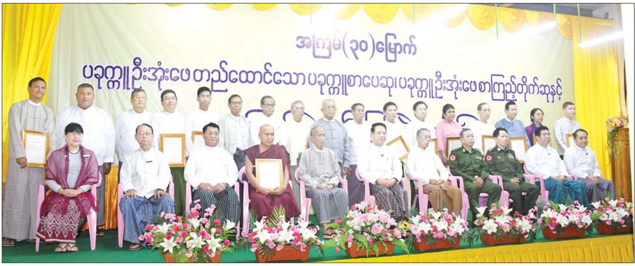
ပြည်ထောင်စုဝန်ကြီး ဦးမောင်မောင်အုန်း အကြမ်း (၃၀) မြောက် ပခုက္ကူဦးအုံးဖေတည်ထောင်သော ပခုက္ကူစာပေဆု ပခုက္ကူဦးအုံးဖေ စာကြည့်တိုက်ဆုနှင့် ပညာရည်ချွန်ဆုရရှိကြသူများနှင့်အတူ စုပေါင်းမှတ်တမ်းတင်ဓာတ်ပုံရိုက်ကြစဉ်။

ပေးအပ်လှူဒါန်း ယင်းနောက် နိုင်ငံတော်စီမံအုပ်ချုပ်ရေးကောင်စီ ဥက္ကဋ္ဌ နိုင်ငံတော်ဝန်ကြီးချုပ် ဗိုလ်ချုပ်မှူးကြီး မင်းအောင်လှိုင်နှင့် ဇနီး ဒေါ်ကြူကြူလှမိသားစုက ပခုက္ကူဦးအုံးဖေ တည်ထောင်သော ပခုက္ကူစာပေဆု ရန်ပုံငွေသို့