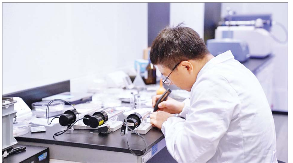
လိုအပ်သည့်ရေကို ဖန်တီးထုတ်လုပ်နိုင်ခြင်းသည် တစ်ခုဖြစ်ကြောင်း သိရသည်။ သုတေသန၏ အဓိကအကြောင်းအရင်းများအနက် ကိုးကား - ဆင်ပွာ၊ ဘာသာပြန် - အောင်ကျော်ကျော်

သိပ္ပံနည်းကျ စမ်းသပ်မှုများနှင့် အရင်းအမြစ်များ ဖွံ့ဖြိုးတိုးတက်စေရန်အတွက် လကမ္ဘာပေါ်ရှိ သုတေသနစခန်းတစ်ခုကို ၂၀၂၅ ခုနှစ်တွင် တည်ဆောက်ရန် ရည်မှန်းထားကြောင်း သိရသည်။ အောက်ဆိုင်ဂျင်နှင့် လောင်စာထုတ်လုပ်မှုအတွက်