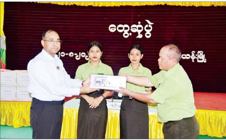
မြေနေရာရရှိရေးနှင့် ဒေသ လုပ်ငန်းကဏ္ဍအလိုက် ဖြည့်စွက် ရှင်းလင်းတင်ပြကြသည်။ ယင်းနောက် ပြည်နယ်ဝန်ကြီး ချုပ်က ခရိုင်စီမံအုပ်ချုပ်ရေးအဖွဲ့ ခေတ္တဥက္ကဋ္ဌ၊ အဖွဲ့ဝင်(၂)၊ ရပ်ကွက် အုပ်ချုပ်ရေးမှူးနှင့် ဟိုကပ် ရပ်ကွက် ရပ်မိရပ်ဖတစ်ဦးတို့က ဒေသအတွက် လိုအပ်ချက်များ တင်ပြမှုအပေါ် သက်ဆိုင်ရာ ဌာနများနှင့် ပေါင်းစပ်ညှိနှိုင်း

ဒေသဖွံ့ဖြိုးတိုးတက်ရေးအတွက် လိုအပ်ချက်များရှိပါက ဌာနဆိုင်ရာ များ၊ မြို့မိမြို့ဖများနှင့် ဒေသခံ ပြည်သူများက ပွင့်ပွင့်လင်းလင်း တင်ပြပေးကြရန်ပြောကြားသည်။ ထို့နောက် မိုင်းယန်းခရိုင်စီမံအုပ်ချုပ်ရေးအဖွဲ့၊ ခေတ္တဥက္ကဋ္ဌ အဖွဲ့ဝင်(၁) ခရိုင်ရဲတပ်ဖွဲ့မှူး၊ ဒုတိယ ရဲမှူးကြီး သီဟက မိုင်းယန်းခရိုင် စီးပွားရေး၊ လူမှုရေးနှင့် ဒေသဖွံ့ဖြိုးရေးဆိုင်ရာ အချက်အလက်များကို ရှင်းလင်းတင်ပြပြီး အဖွဲ့ဝင်(၂) ဦးစိုင်းလိုင်ခမ်းက ခရိုင်၊ မြို့မဟာ ဓာတ်အားလှိုင်းရရှိရေးနှင့် အဝီစိ တွင်း ရေရရှိရေး၊ ဟော်ကန် ရပ်ကွက် အုပ်ချုပ်ရေးမှူးက ရပ်ကွက်အတွင်း ကျောက်စီ ရေမြောင်းများ ဆောင်ရွက်ပေး ရေး၊ ဟိုကပ်ရပ်ကွက် ရပ်မိရပ်ဖ တစ်ဦးက အုပ်ချုပ်ရေးမှူးရုံး