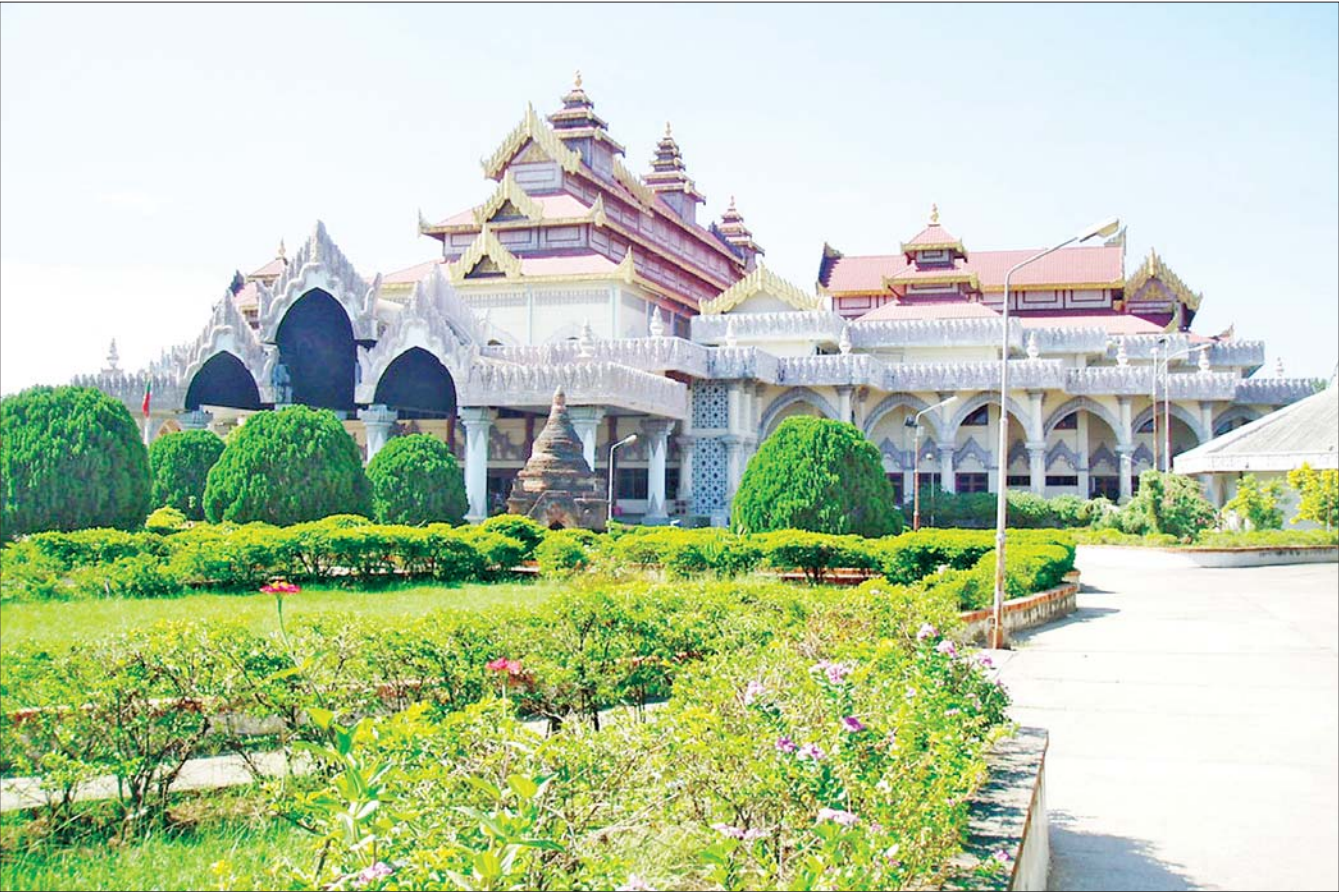
ပုဂံရှေးဟောင်း သုတေသနပြုတိုက်ကို တွေ့ရစဉ်။