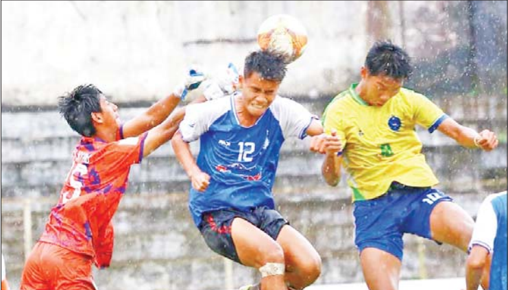
အား/ကာသိပွဲအသင်းနှင့် ရတနာပုံအသင်းတို့ ယှဉ်ပြိုင်ကစားကြစဉ်။

ရန်ကုန် ဩဂုတ် ၂၂ ၂၀၂၄ ရာသီ MNL ယူ-၂၀ လူငယ်လိဂ်ပြိုင်ပွဲပွဲစဉ်(၁၂)ကို ဩဂုတ် ၂၁ ရက်နှင့် ၂၂ ရက်က ဆက်လက်ကျင်းပရာ သစ္စာအားမာန်၊ အား/ကာသိပွဲနှင့် ရန်ကုန်ယူနိုက်တက်အသင်းတို့ နိုင်ပွဲရရှိသည်။