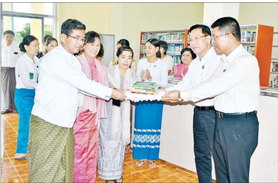
ပြည်ထောင်စုဝန်ကြီး ဦးမောင်မောင်အုန်းနှင့် ဧရာဝတီတိုင်းဒေသကြီးဝန်ကြီးချုပ် ဦးတင်မောင်ဝင်းတို့ ပုသိမ်တက္ကသိုလ်စာကြည့်တိုက်အတွက် လူထုသိပ္ပံကျမ်းများနှင့် စာအုပ်စာစောင်များ ပေးအပ်လှူဒါန်းစဉ်။

ပုသိမ် ဩဂုတ် ၂၂ မြန်မာနိုင်ငံ စာကြည့်တိုက်များ ဖွံ့ဖြိုးတိုးတက်ရေး ပူးပေါင်းဆောင်ရွက်မှု ကော်မတီဥက္ကဋ္ဌ ပြန်ကြားရေး ဝန်ကြီးဌာန ပြည်ထောင်စုဝန်ကြီး ဦးမောင်မောင်အုန်းနှင့် ဧရာဝတီတိုင်းဒေသကြီး ဝန်ကြီးချုပ် ဦးတင်မောင်ဝင်းတို့သည် ယနေ့ မွန်းလွဲပိုင်းတွင် ပုသိမ်တက္ကသိုလ် စာကြည့်တိုက်သို့ သွားရောက်၍ ကျောင်းသား ကျောင်းသူများ၏ စာအုပ်စာစောင်များ ဖတ်ရှုလေ့လာနေမှုနှင့် စာအုပ်စာစောင်များ ငှားရမ်းနေမှုအခြေအနေများကို ကြည့်ရှုအားပေးကာ စာအုပ်စာစောင်များ ပေးအပ်လှူဒါန်းသည်။