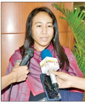
ဆောင်ရွက်ပေးလျက်ရှိသည်။ ထိုသို့ ဆောင်ရွက်ပေးလျက် ရှိရာ အီရတ်နိုင်ငံ ကာဒစ်စတန် ကိုယ်ပိုင်အုပ်ချုပ်ခွင့်ရဒေသ Erbil မြို့တွင် အခက်အခဲကြုံတွေ့နေရ

ရန်ကုန် ဩဂုတ် ၂၂ နိုင်ငံတော်အစိုးရ အနေဖြင့် ပြည်ပတွင် ရောက်ရှိနေသည့် အမိနိုင်ငံသားများ အခက်အခဲ ကြုံတွေ့ရပါက နိုင်ငံသားများ အပေါ် အလေးအနက်တန်ဖိုးထား သည့်အနေဖြင့် မည်သို့သောအခြေ အနေနှင့် တွေ့ကြုံရသည်ဖြစ်စေ မြန်မာသံရုံးနှင့် မြန်မာကောင်စစ် ဝန်ချုပ်ရုံးတို့သည် သက်ဆိုင်ရာ သံရုံးများနှင့်ချိတ်ဆက်၍ အမိ နိုင်ငံသားများ မြန်မာနိုင်ငံသို့ အမြန်ဆုံး အေးချမ်းလုံခြုံစွာ ပြန်လည်ရောက်ရှိနိုင်ရန် စီစဉ်