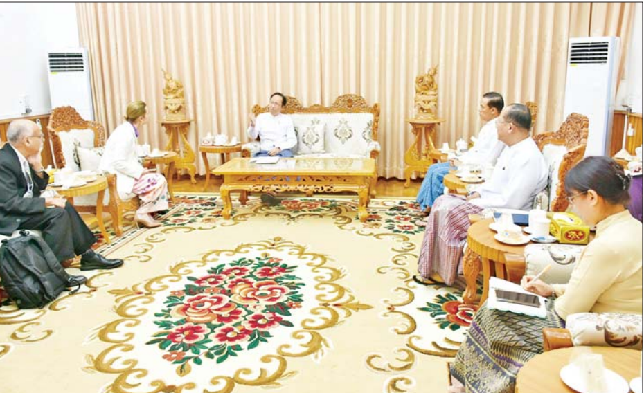
မရောက်ရှိစေရေး ပူးပေါင်းကြပ်မတ်ဆောင်ရွက်ရန် လိုအပ်သည့် ကိစ္စရပ်များကို ဆွေးနွေးပြောကြား သည်။ တွေ့ဆုံပွဲသို့ ကျန်းမာရေးဝန်ကြီးဌာန ညွှန်ကြား ရေးမှူးချုပ် (ပြည်ထောင်စုဝန်ကြီးရုံး)၊ ညွှန်ကြားရေး မှူးချုပ် (ပြည်သူ့ကျန်းမာရေးဦးစီးဌာန)၊ ညွှန်ကြား ရေးမှူးချုပ် (ကုသရေးဦးစီးဌာန) နှင့် တာဝန်ရှိသူများ တက်ရောက်ခဲ့ကြသည်။ သတင်းစဉ်