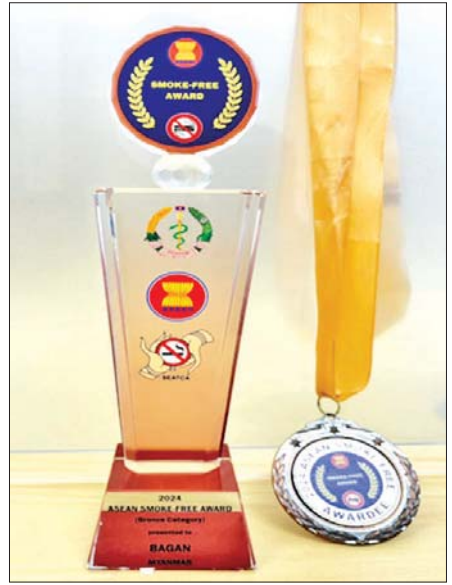
အာဆီယံ ဆေးလိပ်ငွေ့ကင်းစင်ဒေသဆု (ပုဂံ) ဆုတံဆိပ်။

၂၀၂၃ ခုနှစ်တွင် ပြီးမြောက်အောင်မြင်မှုများကို ဆက်လက်ဖော်ပြရလျှင် ၂၀၂၁ ခုနှစ် ဇွန်လ ၁၂ ရက်နေ့အထိ ဆေးလိပ်ငွေ့ကင်းစင်သောနေရာ ၉၂ ခုမှ ၂၀၂၃ ခုနှစ် မေလ ၁ ရက်နေ့တွင် ၁၀၂ နေရာသို့ တိုးချဲ့ဆောင်ရွက်နိုင်ခဲ့ပါသည်။ “မီးခိုးကင်းစင်သော အမွေအနှစ်များ အကောင်အထည်ဖော်ရေးကြီးကြပ်ရေးကော်မတီအစည်းအဝေး” “Places, Bagan” ပရောဂျက်ကို ၂၀၂၃ ခုနှစ် မေလ ၁၉ ရက်နေ့တွင် ကျင်းပခဲ့ပါသည်။ ကြီးကြပ်ရေးကော်မတီအဖွဲ့ဝင်များနှင့် ရပ်ရွာကိုယ်စားလှယ်များပူးပေါင်း၍ “မီးခိုးငွေ့ကင်းစင်သော ပုဂံရှေးဟောင်းအမွေအနှစ်များ” စီမံကိန်းအကောင်အထည်ဖော်မှုဆိုင်ရာ ပြန်လည်သုံးသပ်ခြင်းနှင့် စည်းရုံးရေးဆိုင်ရာအစည်းအဝေးကို ၂၀၂၃ ခုနှစ် မေလ ၃၀ ရက်နေ့တွင် ကျင်းပခဲ့ပါသည်။ စာမျက်နှာ ၁၁ သို့