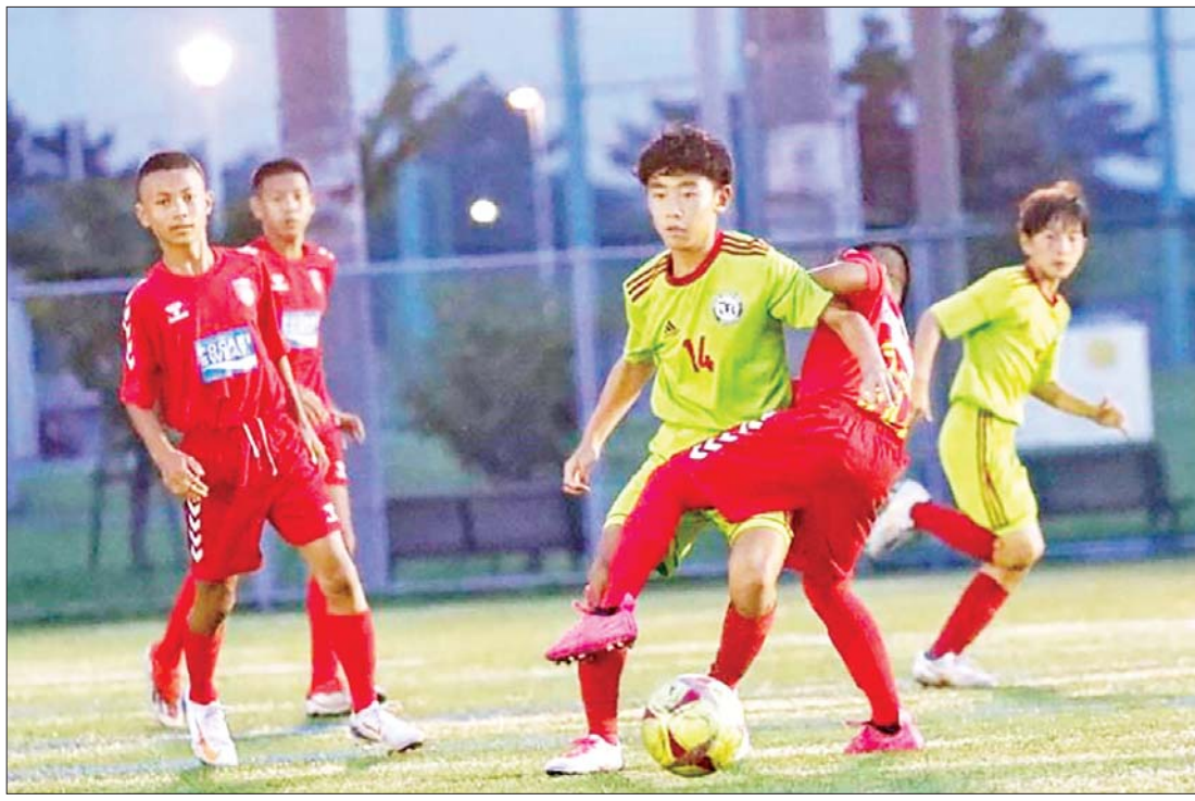
မြန်မာ ယူ-၁၂ အသင်းနှင့် ဒရာဂွန်ကာရီဝါအသင်းတို့ ယှဉ်ပြိုင်ကစားကြစဉ်။

ရန်ကုန် ဩဂုတ် ၂၂ U-12 Junior Soccer World Challenge ပြိုင်ပွဲကို ယနေ့တွင် ဆက်လက်ကျင်းပရာ မြန်မာ ယူ-၁၂ အသင်း နောက်ဆုံးပွဲတွင် အနိုင်ရရှိသည်။ မြန်မာ ယူ-၁၂ အသင်းသည် နောက်ဆုံးပွဲအဖြစ် ဂျပန်ကလပ် ဒရာဂွန်ကာရီဝါအသင်းနှင့် ယှဉ်ပြိုင်ကစားရာ တစ်ဂိုး-ဂိုးမရှိဖြင့် အနိုင်ရရှိခဲ့သည်။ မြန်မာ ယူ-၁၂ အသင်းသည် ၃၂ သင်းအဆင့်မှ ထွက်ခဲ့ရပြီးနောက် အဆင့်သတ်မှတ်ချက်အတွက် ယခုပွဲကစားရာ အနိုင်ရရှိခဲ့ခြင်းဖြစ်သည်။ မြန်မာ ယူ-၁၂ အသင်းရရှိသည့်အဆင့်ကို ပြိုင်ပွဲအားလုံး ပြီးဆုံးမှသာ အတည်ပြုနိုင်မည်ဖြစ်သည်။ မြန်မာ ယူ-၁၂ အသင်းသည် အုပ်စုပွဲများတွင် နှစ်ပွဲနိုင်၊ တစ်ပွဲသာရ၊ ရမှတ် ခုနစ်မှတ်ဖြင့် အုပ်စုပထမရယူပြီး နောက်တစ်ဆင့် တက်ရောက်နိုင်သော်လည်း ၃၂ သင်းအဆင့်တွင် အရေးနိမ့်သဖြင့် ၁၆ သင်းအဆင့် တက်ရောက်ခွင့်မရခဲ့ခြင်းဖြစ်သည်။ သတင်း-ကိုညီလေး၊ ဓာတ်ပုံ-MFF