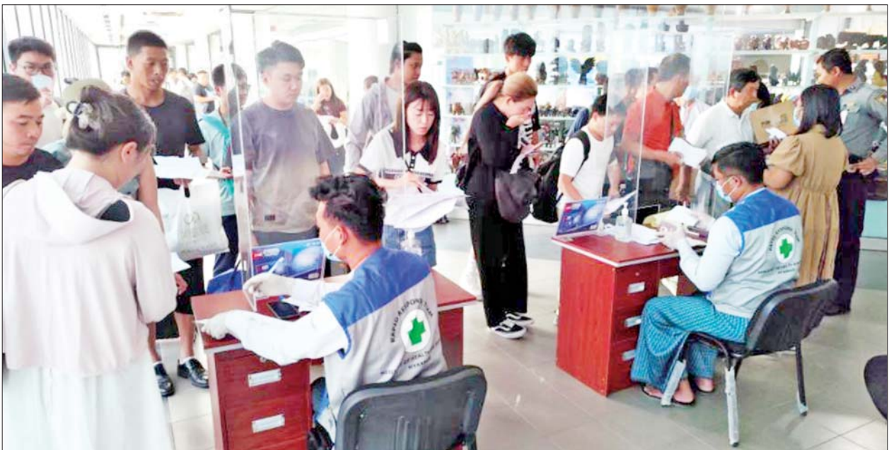
မန္တလေးအပြည်ပြည်ဆိုင်ရာလေဆိပ်တွင် ပြည်ပဆိုင်ရာဝန်ထမ်းများသည် ကျန်းမာရေးကြေညာချက် (Health Declaration Form) အား ကျန်းမာရေးတာဝန်ရှိသူများက စစ်ဆေးနေစဉ်။

နေပြည်တော် ဩဂုတ် ၂၂ ကျန်းမာရေး ဝန်ကြီးဌာန အနေဖြင့် ၂၀၂၂ ခုနှစ် မေလ အတွင်း ကမ္ဘာ့ကျန်းမာရေးအဖွဲ့က အာဖရိကဒေသပြင်ပရှိ နိုင်ငံအချို့ တွင် မျောက်ကျောက်ရောဂါ ကူးစက်ဖြစ်ပွားမှု(Multi-country outbreak)ရှိနေကြောင်း ထုတ်ပြန် ကြေညာခဲ့စဉ်ကပင် မျောက်ကျောက် ရောဂါဖြစ်ပွားမှု စောစီးစွာသိရှိ တုံ့ပြန်ဆောင်ရွက်နိုင်ရေးအတွက် ဖျားခြင်းနှင့် အနီစက်/အရည်ကြည် ဖုထွက်ခြင်း ရောဂါလက္ခဏာ စောင့်ကြပ်ကြည့်ရှုခြင်း(Fever with Vesicular Rash Surveillance)နှင့် အမျိုးသားကျန်းမာရေး ဓာတ်ခွဲမှုဆိုင်ရာဌာန(ရန်ကုန်)တွင် ဓာတ်ခွဲမှုနမူနာများအား စစ်ဆေး ခြင်းလုပ်ငန်းကို နေပြည်တော်နှင့် တိုင်းဒေသကြီး/ပြည်နယ်ပြည်သူ့ ကျန်းမာရေး ဦးစီးဌာနများနှင့် ပြည်သူ့ဆေးရုံများတွင် စဉ်ဆက် မပြတ် ဆောင်ရွက်လျက်ရှိသည်။ ကမ္ဘာ့ကျန်းမာရေးအဖွဲ့က Mpox (မျောက်ကျောက်) ရောဂါအား နိုင်ငံတကာ ပြည်သူ့ကျန်းမာရေး