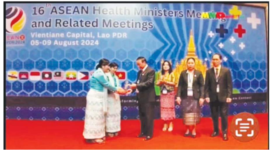
အာဆီယံဆေးလိပ်ငွေကင်းစင်ဒေသဆု (ပုဂံ)အား မြန်မာကိုယ်စားလှယ်အဖွဲ့ လက်ခံရယူစဉ်။

ဆေးလိပ်မသောက်ရ ပိုစတာများ နေရာအနှံ့တွင်ရှိ