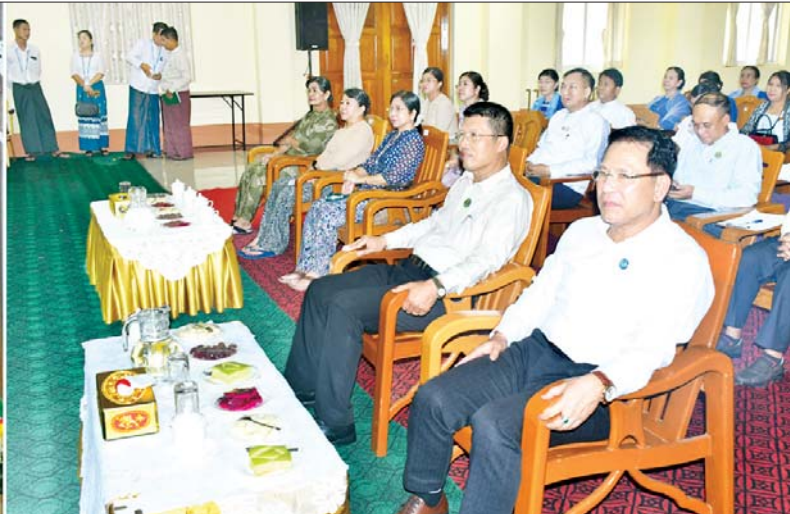
ပြည်ထောင်စုဝန်ကြီး ဦးမောင်မောင်အုန်းနှင့်တက်ရောက်လာကြသူများ ပုသိမ်တက္ကသိုလ်ဘွဲ့နှင်းသဘင်ခန်းမ၌ ကျင်းပသည့် ၂၀၂၃-၂၀၂၄ ပညာသင်နှစ် ပထဝီဝင်နှင့် ပတ်ဝန်းကျင်ဆိုင်ရာလေ့လာမှုပညာဘာသာရပ် မိသားစုများ၏ အာစရိယပူဇော်ပွဲ၊ မောင်မယ်သစ်လွင်ကြိုဆိုပွဲ၊ နှုတ်ဆက်ပွဲနှင့် ဆုပေးပွဲအခမ်းအနားတွင် သီဆိုကပြဖျော်ဖြေမှုကို ကြည့်ရှုအားပေးစဉ်။

ဇရူးဖိုးမှ ယခုဘဏ္ဍာနှစ်၏ ပထမလေးလတာကာလ ဖြစ်သည့် ဧပြီလတွင် ပုဂံရှေးဟောင်းသုတေသန ပြတိုက်သို့ ပြည်တွင်းခရီးသွား ၆၅၇၅ ဦး ဝင်ရောက်မှုမှ ငွေကျပ် ၆၅၇၅၀၀ နှင့် ပြည်ပခရီးသွား ၁၂ ဦး ဝင်ရောက်မှုမှ ငွေကျပ် ၁၂၀၀၀၀၊ မေလတွင် ပြည်တွင်းခရီးသွား ၄၁၂၂ ဦး ဝင်ရောက်မှုမှ ငွေကျပ် ၄၁၂၂၀၀ နှင့် ပြည်ပခရီးသွား ၃၅ ဦး ဝင်ရောက်မှုမှ ငွေကျပ် ၃၅၀၀၀၀၊ ဇွန်လအတွင်း ပြည်တွင်းခရီးသွား ၃၂၈၈ ဦး ဝင်ရောက်မှုမှ ငွေကျပ် ၃၂၈၈၀၀၀ နှင့် ပြည်ပခရီးသွား ၂၈ ဦး ဝင်ရောက်မှုမှ ငွေကျပ် ၂၈၀၀၀၀ နှင့် ဇူလိုင်လအတွင်း ပြည်တွင်းခရီးသွား ၂၅၅၃ ဦး ဝင်ရောက်မှုမှ ငွေကျပ် ၂၅၅၃၀၀၀ နှင့် ပြည်ပခရီးသွား ၃၁ ဦး ဝင်ရောက်မှုမှ ငွေကျပ်