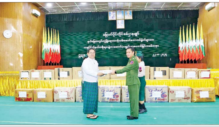
ကချင်ပြည်နယ် ဝန်ကြီးချုပ် ဦးခက်ထိန်နန် လုံခြုံရေးတပ်ဖွဲ့ဝင်များအတွက် ကချင်ပြည်နယ်အစိုးရအဖွဲ့က လှူဒါန်းသော ဂုဏ်ပြုချီးမြှင့်ငွေနှင့် စားသောက်ဖွယ်ရာများကို တိုင်းမှူး ဗိုလ်မှူးချုပ်အောင်ဇော်ထွေးထံ ပေးအပ်စဉ်။

နေပြည်တော် ဩဂုတ် ၂၂ နိုင်ငံတော်ကာကွယ်ရေးနှင့် လုံခြုံရေးတာဝန်များကို စွမ်းစွမ်းတမ်း ထမ်းဆောင်လျက်ရှိသော လုံခြုံရေးတပ်ဖွဲ့ဝင်များအတွက် စေတနာရှင် အလှူရှင်များက ဂုဏ်ပြုချီးမြှင့်ငွေများနှင့် စားသောက်ဖွယ်ရာများကို လာရောက်ဂုဏ်ပြုပေးအပ်လျက်ရှိသည်။ ထိုသို့ ပေးအပ်လျက်ရှိရာ ဩဂုတ် ၂၁ ရက် ညနေပိုင်းတွင် ပညာရေးဝန်ကြီးဌာန ဝန်ထမ်းမိသားစုများ၊ ဗိုလ်လောင်းသင်တန်းအမှတ်စဉ်(၇၂) နှင့် ဗိုလ်လောင်းသင်တန်း အမှတ်စဉ်(၇၆) ကျောင်းဆင်းအရာရှိများနှင့် မိသားစုများ၊ စေတနာရှင် အလှူရှင်များက ဂုဏ်ပြုချီးမြှင့်ငွေများနှင့် စားသောက်ဖွယ်ရာများ ဂုဏ်ပြုပေးအပ်ခြင်းကို နေပြည်တော်တိုင်းစစ်ဌာနချုပ်ရှိ ပေါင်းလောင်းရိပ်သာ၌ ပြုလုပ်ရာ ပညာရေးဝန်ကြီးဌာန ပြည်ထောင်စုဝန်ကြီး ဒေါက်တာညွန့်ဖေ၊ နေပြည်တော်တိုင်းစစ်ဌာနချုပ် တိုင်းမှူး ဗိုလ်ချုပ်စိုးမင်းနှင့် တာဝန်ရှိသူများ၊ စေတနာရှင် အလှူရှင်များ တက်ရောက်ကြသည်။ ထိုသို့ပေးအပ်လျှင်အခန်းရာတွင် ပညာရေးဝန်ကြီးဌာန ဝန်ထမ်းမိသားစုများက ဂုဏ်ပြုချီးမြှင့်ငွေကျပ်သိန်း ၁၅၀ နှင့် ငွေကျပ် ၁၅၅ သိန်းတန်ဖိုးရှိ စားသောက်ဖွယ်ရာများကို လည်းကောင်း၊ ဗိုလ်လောင်းသင်တန်းအမှတ်စဉ်(၇၂) ကျောင်းဆင်းအရာရှိများနှင့် မိသားစုများက ဂုဏ်ပြုချီးမြှင့်ငွေကျပ်သိန်း ၂၀ ကိုလည်းကောင်း၊ ဗိုလ်လောင်းသင်တန်း