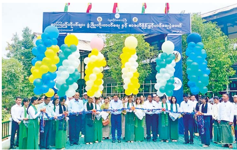
များ စာဖတ်သည့် အလေ့အထကောင်းများ ရရှိစေရန် ပြောကြားခဲ့သည်။ ထို့နောက် တိုင်းဒေသကြီး ဝန်ကြီးချုပ်က သာယာဝတီမြို့နယ်အတွင်းရှိ အခြေခံပညာကျောင်း များအတွက် စာအုပ်စာစောင်များကိုလည်းကောင်း၊ သာယာဝတီမြို့နယ် စာဖတ်ရှိန်မြှင့်တင်ရေး အခမ်း

ဦးစွာ တိုင်းဒေသကြီးဝန်ကြီးချုပ်က အမှာစကား ပြောကြားရာတွင် မိမိတို့ပုံနှိပ်တိုင်းဒေသကြီးအတွင်း စာဖတ်ရှိန်မြှင့်တင်ရေးပွဲတော်များကို မြို့နယ် ၁၄ ခုတွင် ကျင်းပပေးသွားမည်ဖြစ်ပြီး ယနေ့စာဖတ်ရှိန် မြှင့်တင်ရေးပွဲတော်သည် (၅)ကြိမ်မြောက် ကျင်းပ ပေးခြင်းဖြစ်ကာ ပဲခူးတိုင်းဒေသကြီး အစိုးရအဖွဲ့နှင့် မြန်မာနိုင်ငံစာကြည့်တိုက်များ ပူးပေါင်းဆောင်ရွက် မှုကော်မတီတို့ ပူးပေါင်း၍ ကျောင်းသား ကျောင်းသူ