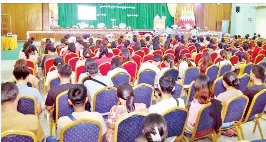
ပြောင်းလဲစေသော ဆေးဝါး ဆက်သွယ်ရေးဥပဒေ၊ လူကုန် မြန်မာ့ ဓလေ့ထုံးတမ်းဥပဒေ များဆိုင်ရာဥပဒေ၊ အကြမ်းဖက်မှု ကူးမှု တားဆီးနှိမ်နင်းရေးဥပဒေ၊ စသည်တို့ကို ဟောပြောဆွေးနွေး တိုက်ဖျက်ရေးဥပဒေ၊ အဂတိ ယာဉ်အန္တရာယ် ကင်းရှင်းရေးနှင့် ပို့ချပေးသည်။ လိုက်စားမှုတိုက်ဖျက်ရေးဥပဒေ၊ မော်တော်ယာဉ်စီမံခန့်ခွဲမှုဥပဒေ၊ ငွေဇင်ယော်(ထားဝယ်)

ထားဝယ် ဩဂုတ် ၂၂ တနင်္သာရီ တိုင်းဒေသကြီး ဥပဒေချုပ်ရုံးနှင့် ထားဝယ် တက္ကသိုလ်တို့ပူးပေါင်း၍ ဥပဒေ အသိပညာပေး ဟောပြောပွဲကို ယနေ့မွန်းလွဲ ၁ နာရီက ထားဝယ် မြို့ ထားဝယ်တက္ကသိုလ် ၌ နှင်း သဘင်ခန်းမ၌ ကျင်းပသည်။