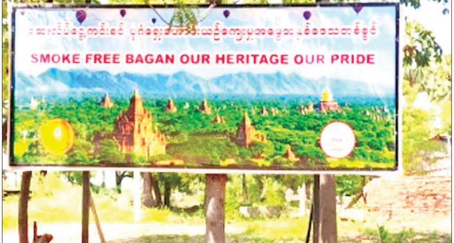
စေတီပုထိုးများရှေ့တွင် တွေ့ရသော “ဆေးလိပ်ငွေ့ကင်းစင် ပုဂံရှေးဟောင်းယဉ်ကျေးမှုအမွေအနှစ် ဒေသတစ်ခု” ဆိုင်းဘုတ်။

“အာဆီယံဆေးလိပ်ငွေ့ကင်းစင်ဒေသဆုသည် ဆေးလိပ်ငွေ့ကင်းစင်သောပတ်ဝန်းကျင် ဖန်တီးရာတွင် ထူးချွန်သော ကြိုးပမ်းအားထုတ်မှုများကို ပြသသည့် အရှေ့တောင်အာရှရှိ မြို့များနှင့် ဒေသများအတွက် ပေးအပ်သည့် ဂုဏ်သိက္ခာရှိသောဆုဖြစ်သည်။ ဤအစီအစဉ်သည် ကမ္ဘာလုံးဆိုင်ရာ ပြည်သူ့ကျန်းမာရေးပန်းတိုင်များနှင့် ကိုက်ညီပြီး လူနေမှုဘဝ အရည်အသွေးမြှင့်တင်ရာတွင် ဆေးလိပ်ငွေ့ကင်းစင်သော နေရာများ၏ အရေးပါမှုမြင့်မားလာခြင်းကို အသိအမှတ်ပြုထင်ဟပ်စေသည်။ မြန်မာ၏ပုဂံအတွက် ဤဆုကို လက်ခံရရှိခြင်းမှာ ထင်ရှားသော မှတ်တိုင်တစ်ခုဖြစ်”