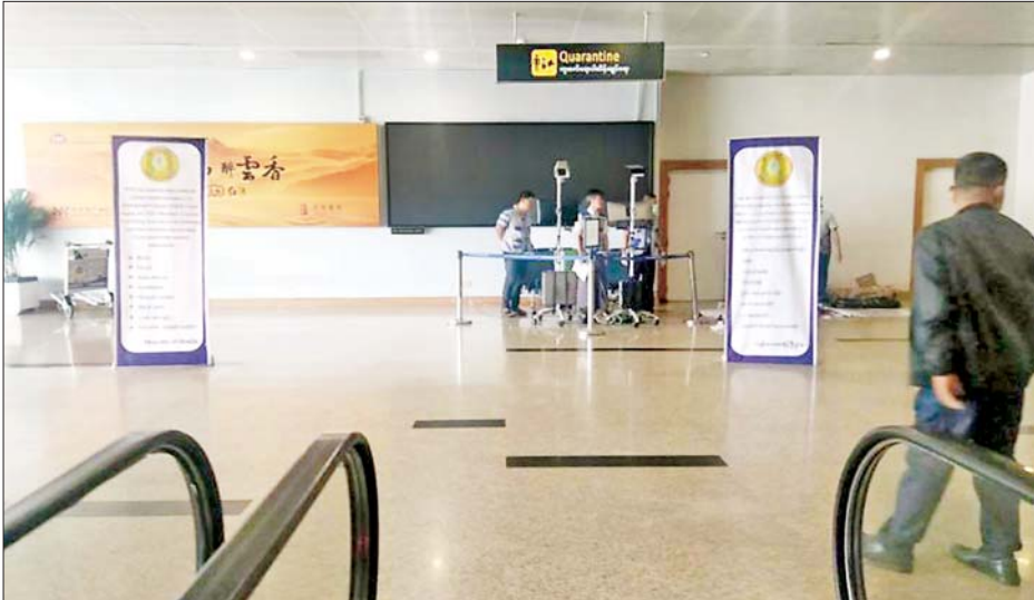
ရန်ကုန်အပြည်ပြည်ဆိုင်ရာလေဆိပ်တွင် ဆိုင်ရာဝန်ထမ်းများသည် စက်လှေကားအဆင်း၌ ကိုယ်အပူချိန် တိုင်းတာခြင်း(Mass Thermal Screening) ဆောင်ရွက်နေစဉ်။

tion Form)အား ကျန်းမာရေး တာဝန်ရှိသူများက စစ်ဆေးခြင်း၊ ခရီးသည်များအား Mpox (မျောက် ကျောက်)ရောဂါနှင့် ပတ်သက်၍ နှိုးဆော်ထားရှိခြင်း အစရှိသော ရောဂါစောင့်ကြပ်ကြည့်ရှုခြင်း လုပ်ငန်းများ အရှိန်အဟုန်ဖြင့်တင် ဆောင်ရွက်လျက်ရှိသည်။ ကမ္ဘာ့ကျန်းမာရေးအဖွဲ့က ရောဂါ ဖြစ်ပွားနိုင်ခြေ သတ်မှတ်ချက်အရ Mpox(မျောက်ကျောက်) ရောဂါ သည် မြန်မာနိုင်ငံတွင် ကူးစက် ဖြစ်ပွားနိုင်ခြေ နည်းပါးသော်လည်း အိမ်နီးချင်းနှင့် ဒေသတွင်းနိုင်ငံများ တွင် ကူးစက်ဖြစ်ပွားမှုများ ရှိနေ သဖြင့်ပြည်သူ့လူထုအနေဖြင့်ရောဂါ ကူးစက်ဖြစ်ပွားမှုမှ ကာကွယ်နိုင် ရန် ကျန်းမာရေးအသိပညာပေး ခြင်း၊ နိုင်ငံအတွင်းသို့ရောဂါကူးစက် ဝင်ရောက်မှု မရှိစေရေး ကြိုတင် ကာကွယ်ရေး လုပ်ငန်းများ ဆောင်ရွက်ခြင်း၊ ရောဂါဖြစ်ပွားမှု စောင့်ကြပ်ကြည့်ရှုခြင်း၊ ထိန်းချုပ် တုံ့ပြန်ဆောင်ရွက်ခြင်း လုပ်ငန်း များကို ဆောင်ရွက်လျက်ရှိကြောင်း သိရသည်။ သတင်းစဉ်