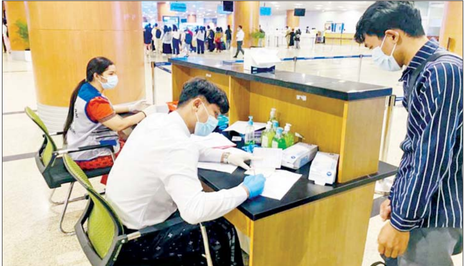
ရန်ကုန်အပြည်ပြည်ဆိုင်ရာလေဆိပ်တွင် ပြည်ပဆိုင်ရာဝန်ထမ်းများသည် ကျန်းမာရေးကြေညာချက် (Health Declaration Form)အား ကျန်းမာရေးတာဝန်ရှိသူများက စစ်ဆေးနေစဉ်။