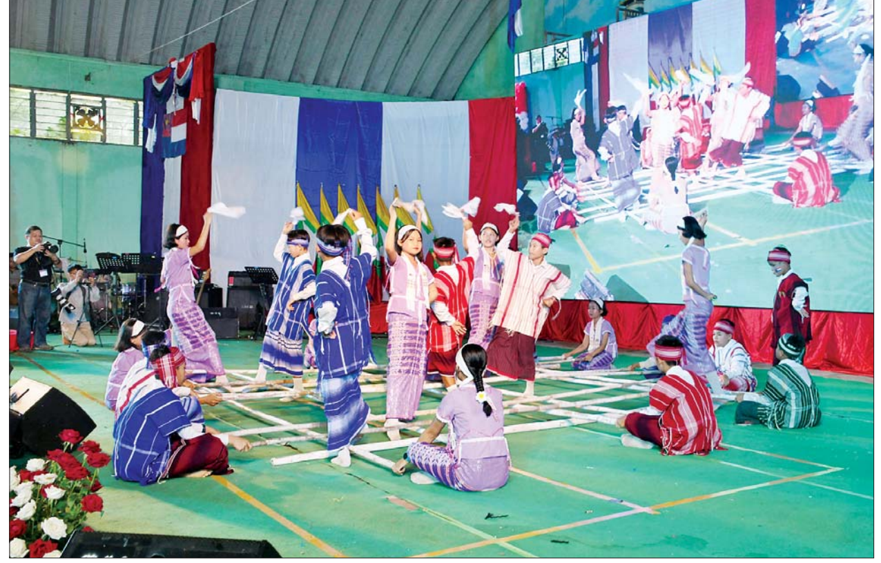
ကရင်တိုင်းရင်းသားရိုးရာ ဝါခေါင်လချည်ဖြူဖွဲ့မင်္ဂလာအခမ်းအနားတွင် ကရင်တိုင်းရင်းသားရိုးရာအကများဖြင့် ဖျော်ဖြေစဉ်။