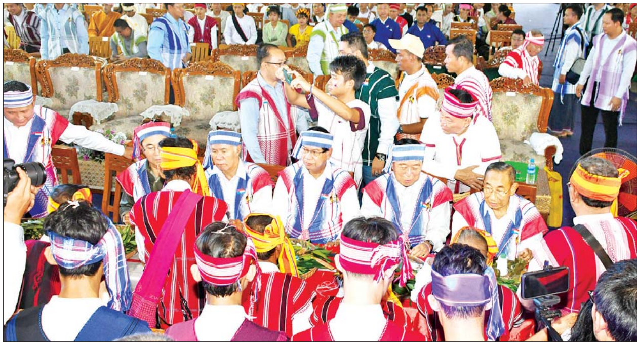
ကရင်တိုင်းရင်းသားရိုးရာ ဝါခေါင်လချည်ဖြူဖွဲ့ မင်္ဂလာအခမ်းအနား ကျင်းပစဉ်။

ဦးစောထွန်းအောင်မြင့်၊ ရန်ကုန်တိုင်းဒေသကြီး ဝန်ကြီးချုပ် ဦးစိုးသိန်း၊ နိုင်ငံတော်စီမံအုပ်ချုပ်ရေးကောင်စီ ဗဟိုအကြံပေးအဖွဲ့ဝင် စောဒန်နီရယ်၊ ဒုတိယဝန်ကြီး ဦးဇော်အေးမောင်၊ ရန်ကုန်တိုင်းဒေသကြီး တိုင်းရင်းသားရေးရာ ဝန်ကြီး ဦးစောကျော်ကော့ထူးတို့က ဖားစည်ကိုးချက်တီးကာ ကရင်လူငယ်များက ကျွဲချိုမှုတ်၍ အခမ်းအနားကို ဖွင့်လှစ်ပေးကြသည်။ ထို့နောက် နိုင်ငံတော်စီမံအုပ်ချုပ်ရေးကောင်စီ အဖွဲ့ဝင် မန်းငြိမ်းမောင်က အဖွဲ့ဝင်များ ဆက် အမှာစကားပြောကြားသည်။ ယင်းနောက် နိုင်ငံတော်စီမံအုပ်ချုပ်ရေးကောင်စီဗဟိုအကြံပေးအဖွဲ့ခေါင်းဆောင် ဦးစောထွန်းအောင်မြင့်နှင့် တိုင်းဒေသကြီး ဝန်ကြီးချုပ်တို့က နှုတ်ခွန်းဆက် အမှာစကားများ ပြောကြားကြသည်။ ဆက်လက်၍ နိုင်ငံတော်စီမံအုပ်ချုပ်ရေးကောင်စီ အဖွဲ့ဝင်နှင့် ဧည့်သည်တော်များသည် ကရင်တိုင်းရင်းသားရိုးရာ အကများ