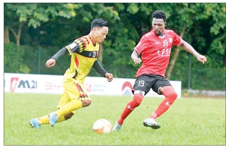
ရာမညယူနိုက်တက်နှင့် Chinland အသင်းတို့ ယှဉ်ပြိုင်ကစားကြစဉ်။

ယနေ့ ဖတ်စရာ တရားမဝင် သစ်မျိုးစုံ ဆေးဝါးများ၊ လူသုံးကုန်ပစ္စည်းများ၊ စားသောက်ကုန်ပစ္စည်းများနှင့် မော်တော်ယာဉ်များ သိမ်းဆည်းရမိ စာမျက်နှာ » ၁၄ ၂၀၂၄ ခုနှစ် ပြည်နယ်နှင့် တိုင်းဒေသကြီး ဖူဆယ် (အမျိုးသား/အမျိုးသမီး) ပြိုင်ပွဲ ကွာတားဖိုင်နယ်ပွဲစဉ်များ ဆက်လက်ကျင်းပ စာမျက်နှာ » ၁၈