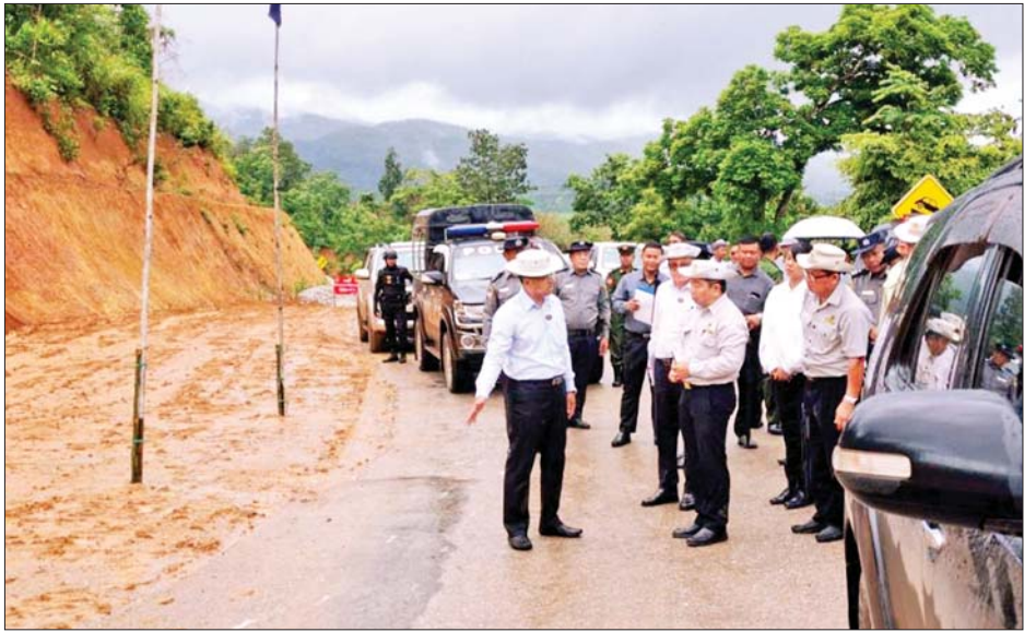
ပြည်နယ်ဝန်ကြီးချုပ်က လမ်းများ သတ်မှတ်စံချိန် သက်ဆိုင်ရာတာဝန်ရှိသူများက ဆောင်ရွက်ပေးကြရန် စံညွှန်းပြည့်မီရေး၊ သတ်မှတ်ကာလအချိန်မီပြီးစီးရေး မှာကြားခဲ့ကြောင်း သိရသည်။ မြို့နယ်(ပြန်/ဆက်)