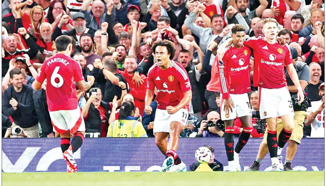
မန်ယူအသင်းကစားသမားများ ဂိုးသွင်းပြီး အောင်ပွဲခံနေစဉ်။

၂၀၂၄-၂၀၂၅ ဘောလုံးရာသီ ပရီမီယာလိဂ်ပွဲစဉ်(၁)ရဲ့ အဖွင့်ပွဲစဉ်အဖြစ် ဩဂုတ် ၁၇ ရက် နံနက်ပိုင်းက ယှဉ်ပြိုင်ကစားခဲ့တဲ့ မန်ယူအသင်းနဲ့ ဖူလ်ဟမ်အသင်းတို့ ပွဲစဉ်မှာ မန်ယူအသင်းက ဖူလ်ဟမ်အသင်းကို တစ်ဂိုး-ဂိုးမရှိနဲ့ အနိုင်ရရှိခဲ့တာကြောင့် ရာသီအစ အဖွင့်ပွဲစဉ်မှာ နိုင်ပွဲနဲ့ စတင်နိုင်ခဲ့ပြီ ဖြစ်ပါတယ်။ ရာသီအဖွင့်လှခဲ့ မန်ယူအသင်းနဲ့ ဖူလ်ဟမ်အသင်းတို့ ပွဲစဉ်မှာ ပထမပိုင်းပွဲကစားချိန်အတွင်း ဘယ်အသင်းကမှ ဂိုးသွင်းယူနိုင်ခဲ့ခြင်း မရှိခဲ့ပေမယ့် မန်ယူအသင်းက ဒုတိယပိုင်း ပွဲကစားချိန် ၈၇ မိနစ်မှာ အသစ်ခေါ်ယူထားတဲ့ ဇာဇီးရဲ့ တစ်လုံးတည်းသော သွင်းဂိုးနဲ့ ဖူလ်ဟမ်အသင်းကို အနိုင်ရရှိခဲ့ပြီး ရာသီအစအဖွင့်လှခဲ့တာ ဖြစ်ပါတယ်။ စာမျက်နှာ ၁၆ ကော်လံ ၅ သို့ ၀