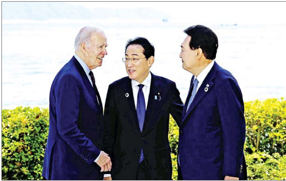
ပိုင်းတွင် ပြုလုပ်သည့် မိန့်ခွန်းတွင် သုံးနိုင်ငံပူးပေါင်း ဆောင်ရွက်မှု၏ အရေးပါမှုအကြောင်းအရင်းနှင့် စပ်လျဉ်း၍ ပြောကြားခဲ့သည်။

အိမ်ဖြူတော် အမျိုးသားလုံခြုံရေးကောင်စီ၏ အရှေ့အာရှနှင့် သမုဒ္ဒရာပိုင်းဆိုင်ရာ အကြီးတန်း ညွှန်ကြားရေးမှူး ရက်ဟုပါက ယခုသီတင်းပတ်ကုန်