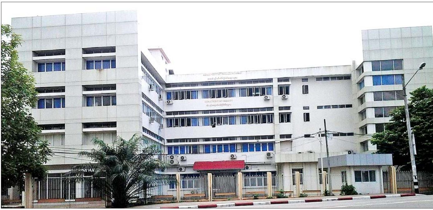
ခုတင်(၅၀၀)အထူးကုဆေးရုံကြီး(ရန်ကုန်)ကို တွေ့ရစဉ်။

ကျွန်မ ညီမဖြစ်သူကတော့ မူလက ဆီးချိုရောဂါ ဝေဒနာကို ရန်ကုန်ပြည်သူ့ဆေးရုံကြီးတွင် ပြသရာမှ ထပ်ဆောင်းကျောက်ကပ်ဝေဒနာဖြစ်ပြန်၍ ယခု ရန်ကုန်မြို့ လမ်းမတော်မြို့နယ် မင်းရဲကျော်စွာလမ်း ရှိ ခုတင် (၅၀၀) အထူးကုဆေးရုံကြီး ဆီးနှင့် ကျောက်ကပ် အထူးကုပြင်ပလူနာဌာနတွင် ဆက်လက်ပြသနေခြင်းဖြစ်သည်။ မူလက တစ်ပတ်တစ်ခါ၊ နောက်ပိုင်းနှစ်ပတ်တစ်ခါ၊ ယခု တော့ တစ်လတစ်ခါ သွားရောက်ပြသနေရပြီး ကျောက်ကပ်အားကောင်းလာစေရန် တစ်လ တစ်ကြိမ်ဆေးသွင်းနေရသည်။ ရက်ချိန်းစေ့၍ သူ့ဆေးရုံသွားပြတိုင်း ကျွန်မက အကူအဖော်အဖြစ် လိုက်ပါရစေမိ။