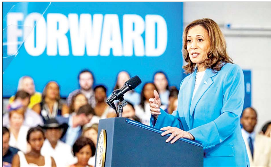
ထို့ပြင် အခြားအစီအမံများတွင် အခွန်ဖြတ်တောက်ခြင်းနှင့် ဆေးဝါး များ၏ ကုန်ကျစရိတ်ကို လျှော့ချ ခြင်းတို့ ပါဝင်ကြောင်း သိရသည်။ အလားတူ ဩဂုတ် ၁၄ ရက်တွင်

ကုန်ကျစရိတ် အနည်းငယ်ဖြင့် အိမ်တစ်လုံးပိုင်ဆိုင်ရန်နှင့် ပထမ အကြိမ် အိမ်ဝယ်ယူသူများ အနေဖြင့် အမေရိကန်ဒေါ်လာ ၂၅၀၀၀ ခန့်သာ ပေးချေရမည် ဖြစ်ပြီး အိမ်ဆောက်သူများကို လည်း အခွန်လျှော့ပေါ့ ကောက်ခံ ပေးသွားမည်ဖြစ်ကြောင်း ဟဲရစ်က ကတိပြုခဲ့သည်။