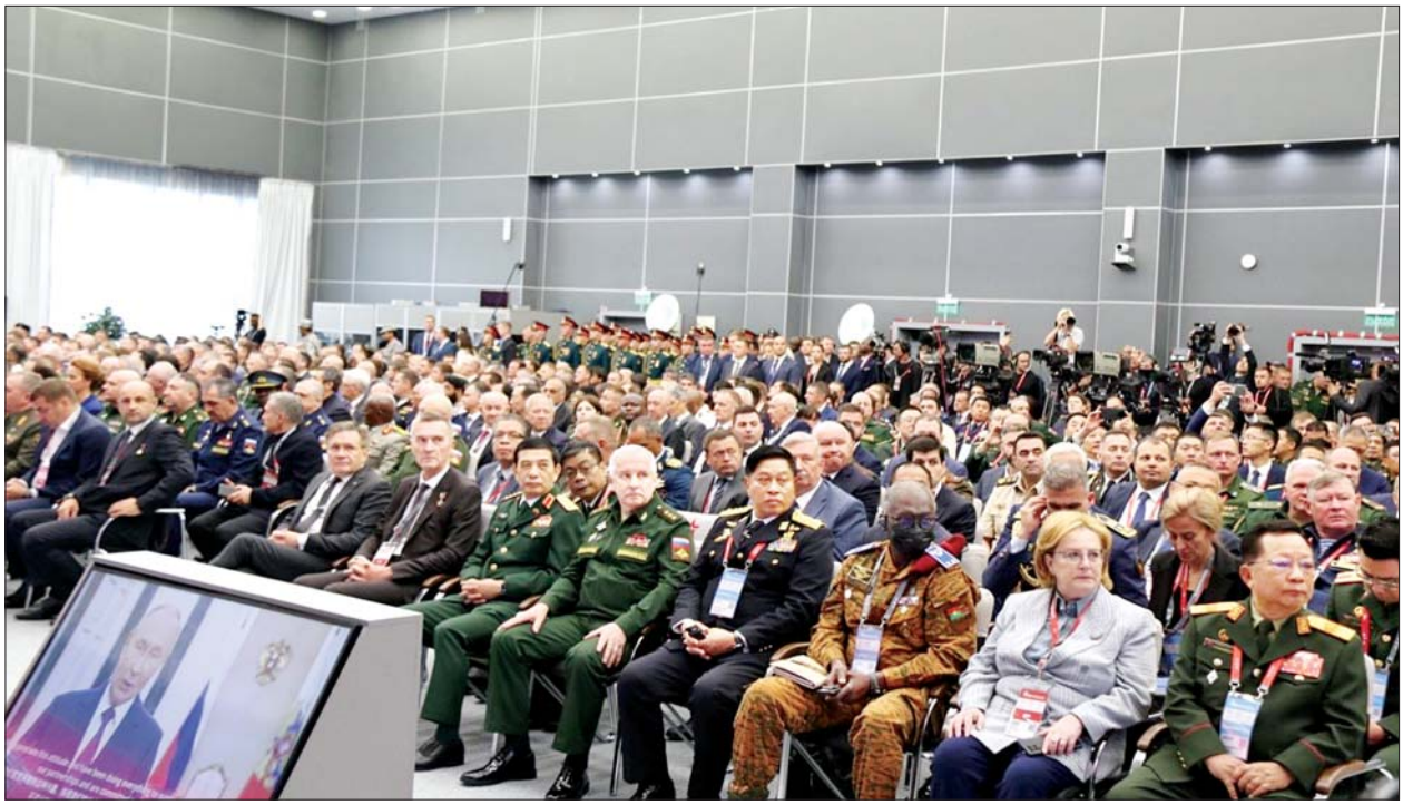
နိုင်ငံတော်စီမံအုပ်ချုပ်ရေးကောင်စီအဖွဲ့ဝင် ဒုတိယဝန်ကြီးချုပ်နှင့် ပြည်ထောင်စုဝန်ကြီး ဗိုလ်ချုပ်ကြီးတင်အောင်စန်းနှင့် ကိုယ်စားလှယ်အဖွဲ့ နိုင်ငံတကာစစ်ဘက်နည်းပညာဖိုရမ်(ARMY-2024)သို့ တက်ရောက်စဉ်။

သည့် ကိုယ်စားလှယ်အဖွဲ့သည် ဩဂုတ် ၁၂ ရက် နံနက်ပိုင်းတွင် နိုင်ငံတကာ စစ်ဘက်နည်းပညာဖိုရမ်(International Military Technical Forum) (ARMY-2024) ဖွင့်ပွဲ အခမ်းအနားနှင့် မျက်နှာစုံညီ အစည်းအဝေးသို့ တက်ရောက်ခဲ့သည်။ ဖွင့်ပွဲအခမ်းအနားတွင် ရုရှားဖက်ဒရေးရှင်းနိုင်ငံ သမ္မတ Vladimir Putin က ဗီဒီယိုကွန်ဖရင့်ဖြင့် မိန့်ခွန်းပြောကြားခဲ့ပြီး ရုရှားဖက်ဒရေးရှင်းနိုင်ငံ ကာကွယ်ရေးဝန်ကြီးက အဖွင့်အမှာစကား ပြောကြား၍ Army Forum 2024 ကို ဖွင့်လှစ်ပေးခဲ့သည်။ ယင်းနောက် ဖိတ်ကြားထားသော ကုမ္ပဏီများမှ တာဝန်ရှိသူများက သက်ဆိုင်ရာပြခန်းအသီးသီးတွင် ပြသထားသည့် စစ်လက်နက်ပစ္စည်းများ ထုတ်လုပ်မှုအခြေအနေ၊ ထုတ်လုပ်ထားရှိသည့် စစ်လက်နက်ပစ္စည်းများ၏ စွမ်းဆောင်နိုင်မှုတို့နှင့် စပ်လျဉ်း၍ ရှင်းလင်းတင်ပြခဲ့ကြပြီး ပြခန်းအတွင်း ခင်းကျင်းပြသထားသည့် စစ်လက်နက်ပစ္စည်းများ၊ စစ်သုံး