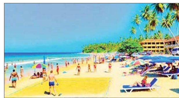
၈၈ ဘီလီယံကျော်အထိ မြင့်တက်လာပြီး တစ်နှစ်ထက်တစ်နှစ် ၇၃ ဒသမ ၃ ရာခိုင်နှုန်း တိုးလာကြောင်း သိရသည်။

ခရီးသွားလုပ်ငန်းသည် သီရိလင်္ကာနိုင်ငံ၏ ထိပ်တန်းနိုင်ငံခြား ဝင်ငွေရရှိစေသော လုပ်ငန်းတစ်ခုဖြစ်ပြီး ခရီးသွားလုပ်ငန်းမှ ဝင်ငွေ သည် ၂၀၂၄ ခုနှစ် ပထမ ခုနှစ်လအတွင်း အမေရိကန်ဒေါ်လာ ၁ ဒသမ