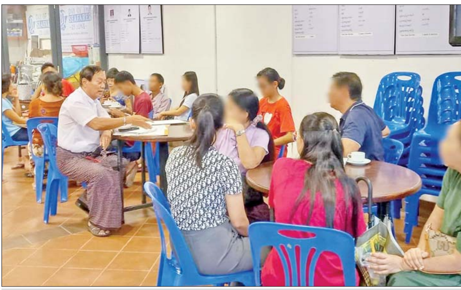
မြန်မာနိုင်ငံ ပင်လယ်ကူးသင်္ဘောသား အလုပ်သမားအဖွဲ့ချုပ် (MSF)ရုံးသို့ သင်္ဘောသားမိသားစုဝင် များ လာရောက်ဆွေးနွေးနေစဉ်။

ရန်ကုန် ဩဂုတ် ၁၄ သင်္ဘောပေါ်တွင် ထိခိုက်ဒဏ်ရာ ရသည်ဖြစ်စေ၊ အသက်သေဆုံး သည်ဖြစ်စေ လာရောက်တင်ပြ ဆွေးနွေးပါက ရပိုင်ခွင့်နှင့်ခံစား ခွင့်များအား အချိန်တိုအတွင်း ရရှိနိုင်မည်ဖြစ်ကြောင်း မြန်မာ နိုင်ငံ ပင်လယ်ကူးသင်္ဘောသား အလုပ်သမားအဖွဲ့ချုပ် (MSF)က ဖိတ်ခေါ်ထားသည်။ သင်္ဘောပေါ်တွင် တာဝန် ထမ်းဆောင်ရင်း ထိခိုက်ဒဏ်ရာ ရရှိခဲ့သည့် မြန်မာသင်္ဘောသား တစ်ဦးအတွက် ပြည်ပတွင် ကျန်းမာရေးစောင့်ရှောက်မှု ရရှိ ရန်၊ မြန်မာပြည်သို့ ပြန်ရောက်ပြီး ဆေးကုသမှု ဆက်လက်ခံယူနိုင် ရန်၊ လစာရရှိရန်၊ ခွင့်လစာရရှိရန်၊ လျော်ကြေးရရှိရန် ကိစ္စရပ်များ ကို ပံ့ပိုးဆောင်ရွက်ပေးခဲ့ ကြောင်း မြန်မာနိုင်ငံပင်လယ်ကူး သင်္ဘောသားအလုပ်သမားအဖွဲ့ ချုပ်(MSF)က ထုတ်ပြန်ထားသည်။ MSF ထံ ချက်ချင်းအကူအညီ တောင်းခံလာသည့်အတွက် ယခု ကဲ့သို့ ဆောင်ရွက်ပေးခဲ့ခြင်းဖြစ် ကာ လအနည်းငယ်အကြာ ကျန်းမာရေးစောင့်ရှောက်မှုများ လုပ်ကိုင် ဆောင်ရွက်ပြီးသည့် အချိန်တွင် ဆေးကုသမှုစရိတ် များနှင့် လျော်ကြေးများကို များနှင့် လျော်ကြေးများကို ရရှိခဲ့ကြောင်းလည်း သိရသည်။