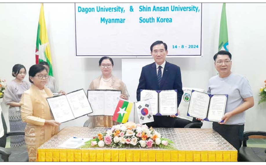
ဆောင်ရွက်ခြင်းတို့ကို လုပ်ဆောင် နိုင်မည်ဖြစ်ပြီး တက္ကသိုလ်နှင့် နိုင်ငံတော်အတွက် လူ့စွမ်းအား အရင်းအမြစ်များ မွေးထုတ်ပေးနိုင် မည်ဖြစ်ကြောင်း ပြောကြားသည်။ ဆက်လက်၍ ကိုရီးယားသမ္မတ နိုင်ငံ SHIN ANSAN UNIVERSITY မှ President Dr. Ji Ui Sang က တက္ကသိုလ်ဆိုင်ရာ အကြောင်း အရာများနှင့် နှစ်နိုင်ငံပညာရေး ဖွံ့ဖြိုးတိုးတက်ရေး ပူးပေါင်း ဆောင်ရွက်မည့် အစီအစဉ်များကို ရှင်းလင်းပြောကြားသည်။ ထို့နောက် နှစ်ဖက်တက္ကသိုလ် အကြား ပူးပေါင်းဆောင်ရွက်မည့် နားလည်မှုစာချုပ်လွှာကို ပါမောက္ခ ချုပ်များနှင့် အသိသက်သေများက လက်မှတ်ရေးထိုးခဲ့ပြီး အမှတ်တရ လက်ဆောင်များ အပြန်အလှန် ပေးအပ်ခဲ့ကြကြောင်း သိရသည်။ ဇွဲမင်းထက်(ပြန်/ဆက်)

ရန်ကုန်တိုင်းဒေသကြီး ဒဂုံ မြို့သစ်(အရှေ့ပိုင်း)မြို့နယ်တွင် ဒဂုံတက္ကသိုလ်နှင့် ကိုရီးယား သမ္မတနိုင်ငံ SHIN ANSAN UNIVERSITY တို့ ပညာရပ်ဆိုင်ရာ နှင့် ပညာရေးဆိုင်ရာ နားလည်မှု စာချုပ်လွှာလက်မှတ်ရေးထိုးခြင်း ကို ယနေ့ညနေ ၄ နာရီက ဒဂုံတက္ကသိုလ် ဘွဲ့နှင်းသဘင် ခန်းမ၌ ပြုလုပ်ခဲ့သည်။ ဦးစွာ ဒဂုံတက္ကသိုလ်ပါမောက္ခ ချုပ် ဒေါက်တာ ဝင်းဝင်းသန်းက တက္ကသိုလ်နှစ်ခုကြား ပညာရပ် ဆိုင်ရာနှင့် ပညာရေးဆိုင်ရာ ဖလှယ်ရေး ပြုလုပ်နိုင်ရန် နားလည်မှုစာချုပ်လွှာလက်မှတ် ရေးထိုးရခြင်းဖြစ်ကြောင်း၊ ယခု ကဲ့သို့ ဆောင်ရွက်ခြင်းကြောင့် ကျောင်းသား ကျောင်းသူ ဖလှယ် ရေး၊ ဆရာ ဆရာမနှင့် ဝန်ထမ်း ဖလှယ်ရေး၊ သုတေသနများပူးပေါင်း