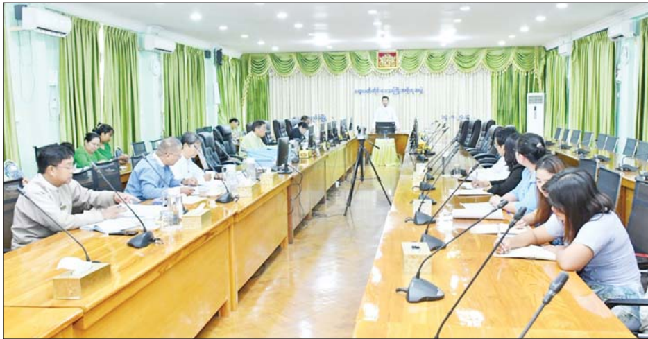
သွားရန်လိုကြောင်း၊ ရင်းနှီးမြှုပ်နှံမှုများနှင့် ထိုနောက် တိုင်းဒေသကြီးရင်းနှီးမြှုပ်နှံမှု ကော်မတီအတွင်းရေးမှူးနှင့် ကုမ္ပဏီများမှ တာဝန်ရှိသူများက ဖက်စပ်နိုင်ခြားရင်းနှီးမြှုပ်နှံမှု ဖြင့် ဆန်နှင့် ဆန်ထွက်ပစ္စည်းများ ကြိုတင်ခွဲသန့်စင် ထုတ်လုပ် တင်ပို့ရောင်းချခြင်းလုပ်ငန်းကို ဆောင်ရွက်

ဧရာဝတီတိုင်းဒေသကြီး ရင်းနှီးမြှုပ်နှံမှုကော်မတီ (၄/၂၀၂၄)ကြိမ်မြောက်အစည်းအဝေးကိုတိုင်းဒေသကြီး အစိုးရအဖွဲ့ရုံး အစည်းအဝေးခန်းမ(၁)တွင် ယနေ့ နံနက်ပိုင်းကပြုလုပ်ရာ ဧရာဝတီတိုင်းဒေသကြီး ရင်းနှီးမြှုပ်နှံမှုကော်မတီဥက္ကဋ္ဌ တိုင်းဒေသကြီး ဝန်ကြီးချုပ် ဦးတင်မောင်ဝင်း၊ အစိုးရအဖွဲ့ဝင်များနှင့် တိုင်းဒေသကြီးရင်းနှီးမြှုပ်နှံမှု ကော်မတီဝင်များ တက်ရောက်ခဲ့ကြသည်။