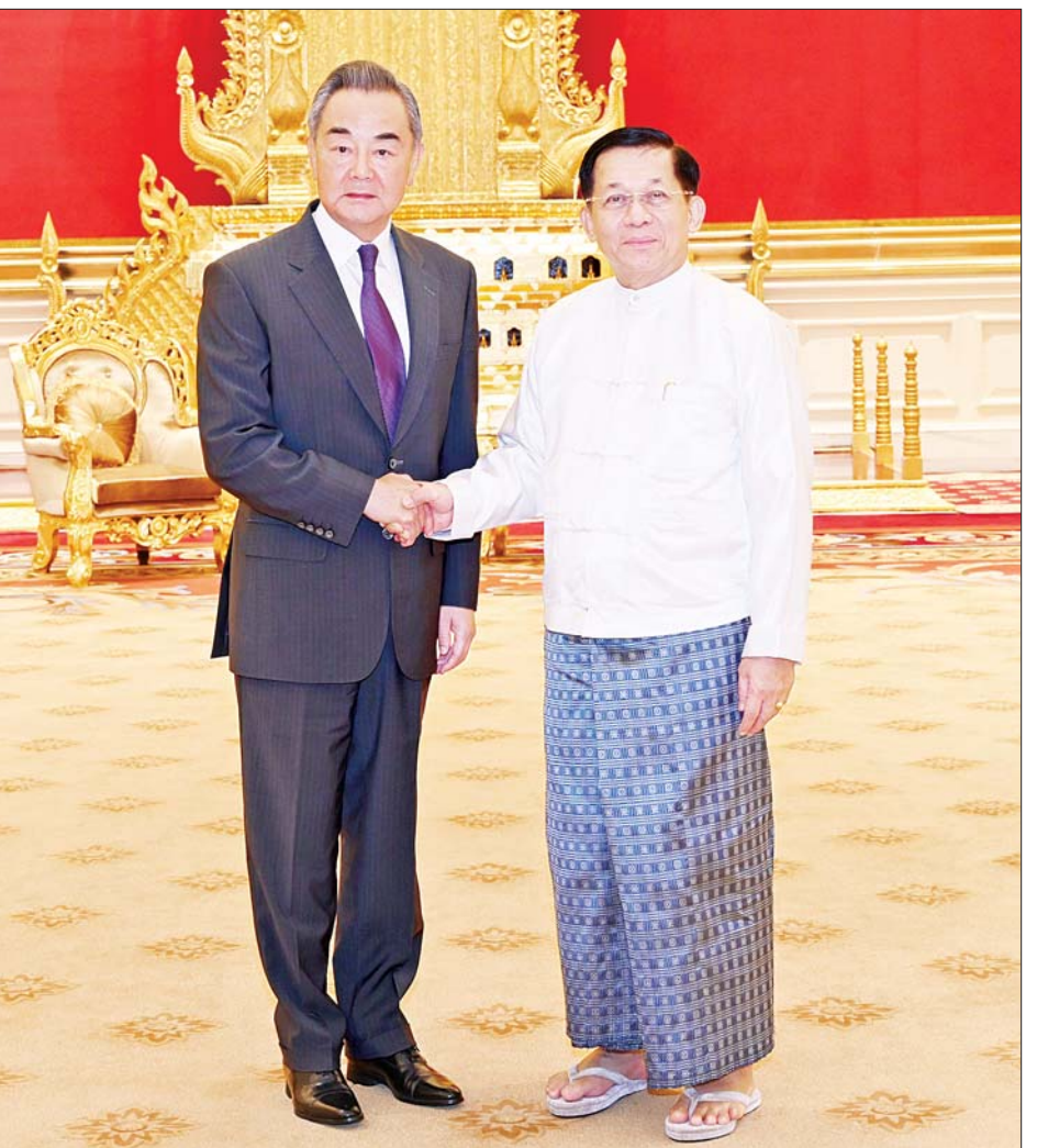
နိုင်ငံတော်စီမံအုပ်ချုပ်ရေးကောင်စီဥက္ကဋ္ဌ နိုင်ငံတော်ဝန်ကြီးချုပ် ဗိုလ်ချုပ်မှူးကြီး မင်းအောင်လှိုင် တရုတ်ကွန်မြူနစ်ပါတီဗဟိုကော်မတီ၊ နိုင်ငံရေးရာဇဝတ်ဗဟိုအဖွဲ့ဝင်နှင့် နိုင်ငံခြားရေးဝန်ကြီး H. E. Mr. Wang Yi အား ရင်းရင်းနှီးနှီးနှုတ်ဆက်စဉ်။

ဆောင်ရွက်လျက် ရှိပါကြောင်း၊ ရှမ်းပြည်နယ် မြောက်ပိုင်းတွင် EAO အဖွဲ့များ၏ မြို့ရွာများအပေါ် တိုက်ခိုက်မှု ဖြစ်စဉ်များနှင့် ပတ်သက်၍လည်း တရုတ်နိုင်ငံ အနေဖြင့် ဆန့်ကျင်ပါကြောင်း ပြောကြားသည်။ ဆွေးနွေး ယင်းနောက် နှစ်နိုင်ငံအကြား ချစ်ကြည်ရင်းနှီးမှုနှင့် ပူးပေါင်းဆောင်ရွက်ရေးဆိုင်ရာ ကိစ္စရပ်များ၊ ကာကွယ်ရေးဆိုင်ရာပူးပေါင်းဆောင်ရွက်မှုကိစ္စရပ်များ၊ မြန်မာနိုင်ငံ၏ ပြည်တွင်းငြိမ်းချမ်းရေးဆိုင်ရာ ကိစ္စရပ်များနှင့် နယ်စပ်ဒေသ တည်ငြိမ်အေးချမ်းရေးဆိုင်ရာ ကိစ္စရပ်များ၊ အွန်လိုင်းလောင်းကစားမှုများ၊ အွန်လိုင်းလိမ်လည်မှုများ၊ အခြားငွေကြေးလိမ်လည်မှုနှင့် တရားမဝင်လုပ်ငန်းများ ပပျောက်စေရေး နှစ်နိုင်ငံဆက်လက်ပူးပေါင်းဆောင်ရွက်သွားမည့် ကိစ္စရပ်များ၊ လွတ်လပ်ပြီး တရားမျှတသည့် ပါတီစုံဒီမိုကရေစီ အထွေထွေရွေးကောက်ပွဲ ကျင်းပနိုင်ရေး ကြိုတင်ပြင်ဆင်ဆောင်ရွက်လျက်ရှိသည့် အခြေအနေများနှင့်ပတ်သက်၍ ရင်းနှီးပွင့်လင်းစွာ အမြင်ချင်းဖလှယ်ဆွေးနွေးခဲ့ကြသည်။ တွေ့ဆုံပွဲအပြီးတွင် နိုင်ငံတော်