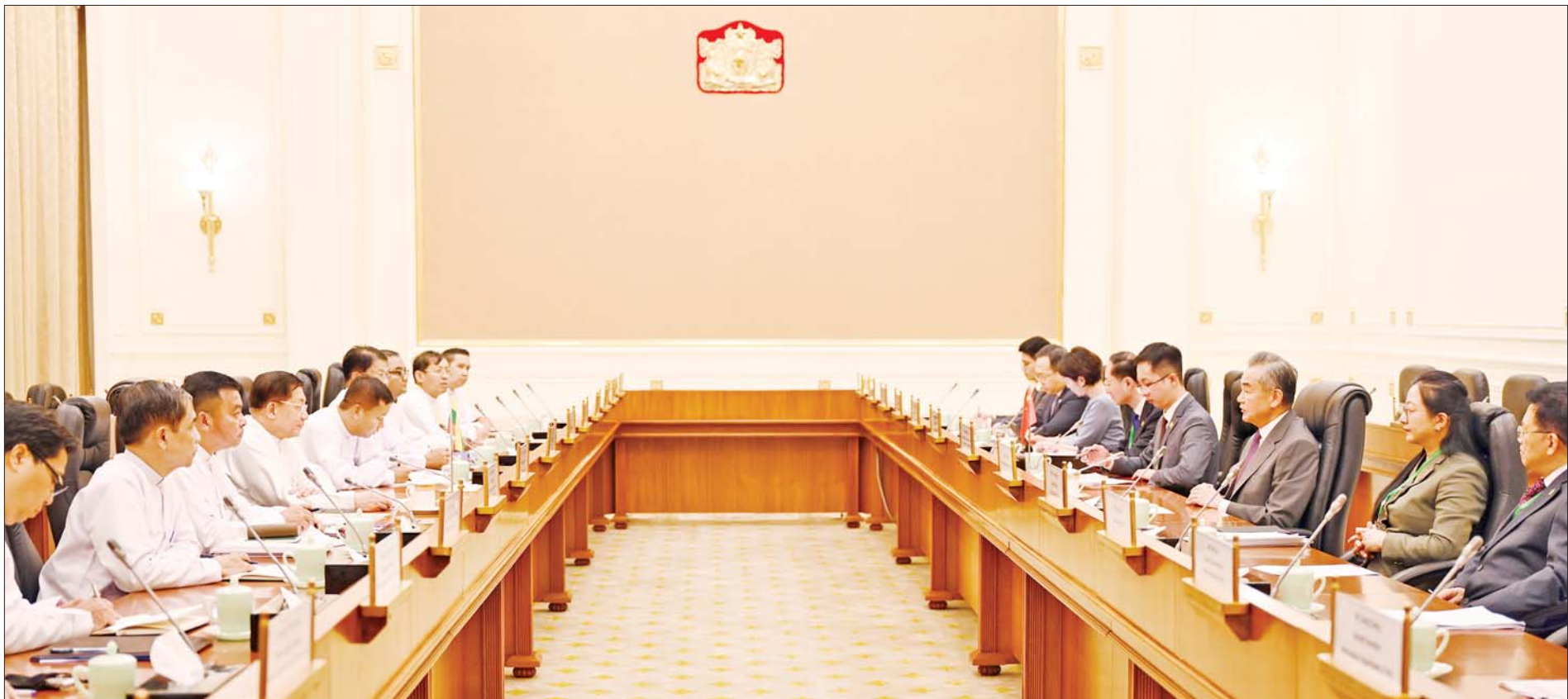
မြန်မာနိုင်ငံနှင့် တရုတ်နိုင်ငံ နှစ်နိုင်ငံတွေ့ဆုံဆွေးနွေးပွဲ ကျင်းပစဉ်။