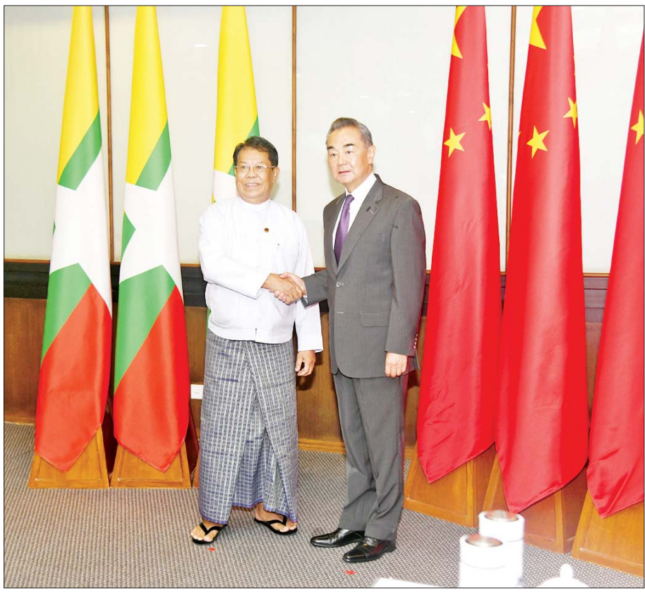
ဒုတိယဝန်ကြီးချုပ်နှင့် ပြည်ထောင်စုဝန်ကြီး ဦးသန်းဆွေနှင့် တရုတ်ကွန်မြူနစ်ပါတီဗဟိုကော်မတီ၊ နိုင်ငံရေးရာဇဝန်အဖွဲ့ဝင်နှင့် နိုင်ငံခြားရေးဝန်ကြီး မစ္စတာဝမ်ယိ တို့ ရင်းရင်းနှီးနှီး နှုတ်ဆက်စဉ်။