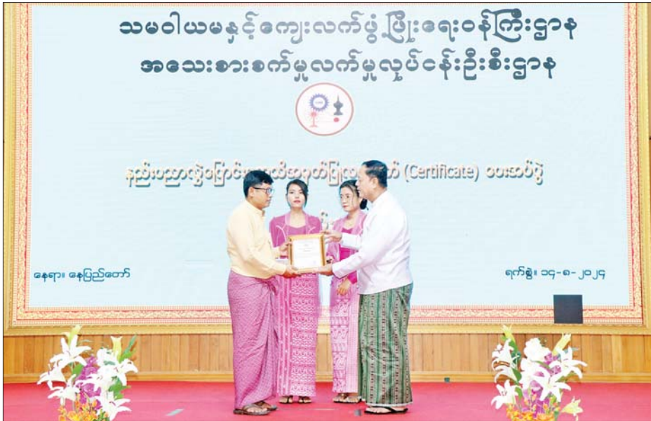
ကိစ္စရပ်များနှင့် စပ်လျဉ်း၍ ရှင်းလင်းတင်ပြသည်။ ယင်းနောက် ပြည်ထောင်စုဝန်ကြီး၊ ဒုတိယဝန်ကြီး၊ အမြဲတမ်းအတွင်းဝန်နှင့် ညွှန်ကြားရေးမှူးချုပ်များက နည်းပညာလွှဲပြောင်းမှုအသိအမှတ်ပြုလက်မှတ်များ ပေးအပ်ချီးမြှင့်ကြပြီး ဌာနက ပံ့ပိုးပေးလိုက်သည့် နည်းပညာများဖြင့် ထုတ်လုပ်ထားသော စားသောက်ကုန်နှင့် လူသုံးကုန်ပစ္စည်းများ၊ သုတေသနစာတမ်းများကို ကြည့်ရှုအားပေးပြီး ပြည်ထောင်စုဝန်ကြီးက လိုအပ်သည်များ ပေါင်းစပ်ညှိနှိုင်းဆောင်ရွက်ပေးခဲ့သည်။ သတင်းစဉ်

နည်းပညာများသည် အဆင့်အတန်းမီသော နည်းပညာများဖြစ်မှသာ ကုန်ထုတ်လုပ်မှုများသည် ခေတ်နှင့်အညီ တိုးတက်ထုတ်လုပ်နိုင်မည်ဖြစ်ကြောင်း၊ အဆင့်မြင့်နည်းပညာများပေးအပ်နိုင်ရန် နိုင်ငံတကာ သုတေသနပြုမှုများ၊ စံချိန်စံညွှန်းများနှင့် ဖြစ်ပေါ်တိုးတက်မှုများကို စဉ်ဆက်မပြတ်လေ့လာဆောင်ရွက်ရန်လိုအပ်ကြောင်း၊ နိုင်ငံတကာအခြေအနေ၊ ဈေးကွက်အခြေအနေ၊ စားသုံးသူ၏လိုအပ်ချက်နှင့် ကိုက်ညီအောင် သုတေသနပြုဆောင်ရွက်ကြရန် အရေးကြီးပါကြောင်း၊ နိုင်ငံတော်၏လိုအပ်ချက်နှင့် ကိုက်ညီမှုရှိစေရန်၊ နောင်လာနောက်သားများအတွက် ယူနိုင်စေရန်နှင့် တွေ့ရှိလာသည့်သုတေသနရလဒ်များကို လက်တွေ့အသုံးချနိုင်အောင် ကြိုးပမ်းဆောင်ရွက်ကြရန် မှာကြားလိုကြောင်း ပြောကြားသည်။ ထို့နောက် အသေးစားစက်မှုလက်မှုလုပ်ငန်းဦးစီးဌာန ညွှန်ကြားရေးမှူးချုပ်က နည်းပညာလွှဲပြောင်းခြင်း၊ သုတေသနပြုစမ်းသပ်ဆောင်ရွက်ခြင်း