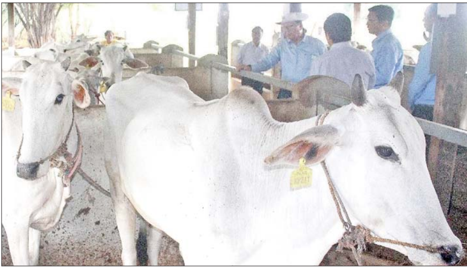
အဆိုပါ သုတေသနစခန်း၌ Multi-nutrient Block, UMMB) မျိုးဖြင့် ဖော်စပ်ကျွေးမွေးခြင်းနှင့် ၂၀၂၄-၂၀၂၅ ဘဏ္ဍာနှစ်အတွင်း သန်ချဆေး (Fenbendazole) ရောနှော ကျွေးမွေးခြင်းတို့၏