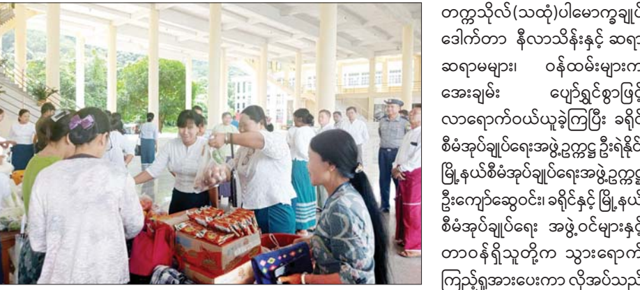
ပေါ်ဆန်းမွေးဆန် တစ်ပြည် ၆၄၀၀ နှင့် ကြက်သား၊ ဝက်သား၊ ငွေကျပ် ၅၅၀၀၊ ဧည့်မထဆန် အမဲသား၊ ငါး၊ ကြက်ဥ၊ ဘဲဥ တစ်ပြည် ငွေကျပ် ၃၀၀၀၊ ဟင်းသီးဟင်းရွက်၊ ကုန်စိမ်း၊ စားအုန်းဆီ တစ်ပိဿာ ငွေကျပ် ကုန်ခြောက် စသည့် အခြေခံ

မွန်ပြည်နယ် သထုံမြို့နယ် ဂျေကျေးရွာရှိ ကွန်ပျူတာ တက္ကသိုလ်(သထုံ)တွင် ပြည်နယ် အစိုးရအဖွဲ့၏စီမံမှုဖြင့် ယနေ့ နံနက်ပိုင်းက ဆန်၊ ဆီ၊ အသားငါး၊ ဟင်းသီးဟင်းရွက်စသည့် အခြေခံ စားသောက်ကုန်များကို သတ်မှတ် ထားသည့်သက်သာသောဈေးနှုန်း တို့ဖြင့် မြို့နယ်အဆင့် အခြေခံ စားသောက်ကုန် ပစ္စည်းများ ကုန်ဈေးနှုန်း တည်ငြိမ်ရေး ကော်မတီမှ တာဝန်ရှိသူတို့က ရောင်းချပေးခဲ့ကြောင်း သိရသည်။ ထိုသို့ ရောင်းချပေးရာတွင်