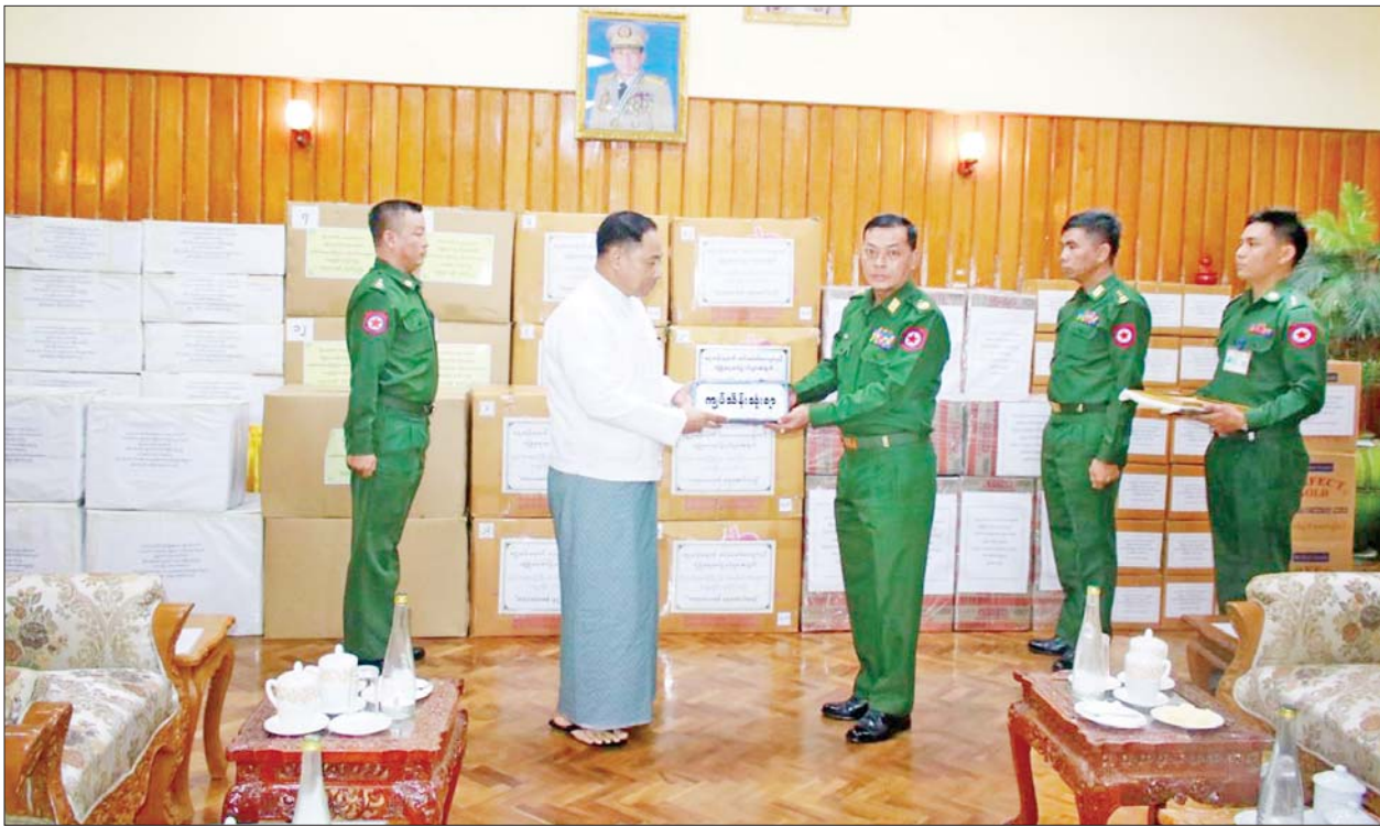
နိုင်ငံတော်စီမံအုပ်ချုပ်ရေးကောင်စီအဖွဲ့ဝင် ပြည်ထောင်စုဝန်ကြီး ဒုတိယဗိုလ်ချုပ်ကြီး ရာပြည့် နိုင်ငံတော်ကာကွယ်ရေးနှင့် လုံခြုံရေး တာဝန်များကို စွမ်းစွမ်းတမ်းထမ်းဆောင်လျက်ရှိသော လုံခြုံရေးတပ်ဖွဲ့ဝင်များအတွက် ဂုဏ်ပြုချီးမြှင့်ငွေနှင့် စားသောက်ဖွယ်ရာများ ဂုဏ်ပြုပေးအပ်စဉ်။

နေပြည်တော် ဩဂုတ် ၁၄ နိုင်ငံတော် ကာကွယ်ရေးနှင့် လုံခြုံရေးတာဝန်များကို စွမ်းစွမ်းတမ်း ထမ်းဆောင်လျက်ရှိသော လုံခြုံရေး တပ်ဖွဲ့ဝင်များအတွက် စေတနာရှင် အလှူရှင်များက စားသောက်ဖွယ်ရာများ လာရောက် ဂုဏ်ပြုပေးအပ်လျက် ရှိသည်။