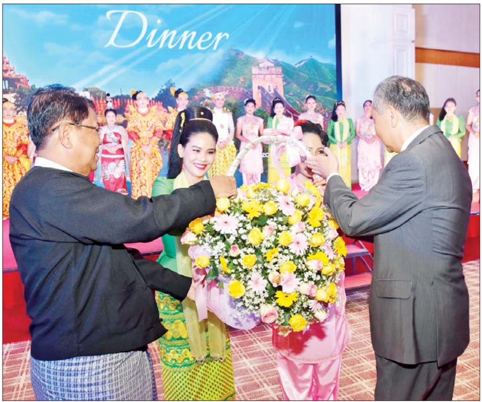
ဒုတိယဝန်ကြီးချုပ်နှင့် ပြည်ထောင်စုဝန်ကြီး ဦးသန်းဆွေနှင့် တရုတ်ကွန်မြူနစ်ပါတီဗဟိုကော်မတီ၊ နိုင်ငံရေးရာဇဝန်အဖွဲ့ဝင်နှင့် နိုင်ငံခြားရေးဝန်ကြီး မစ္စတာဝမ်ယိ တို့ ဖျော်ဖြေတင်ဆက်ခဲ့ကြသည့် အနုပညာရှင်များအား ဂုဏ်ပြုပန်းခြင်း ပေးအပ်စဉ်။

သတင်းစဉ် ဒုတိယဝန်ကြီးချုပ်နှင့် ပြည်ထောင်စုဝန်ကြီး ဦးသန်းဆွေက တရုတ်ကွန်မြူနစ်ပါတီ ဗဟိုကော်မတီ၊ နိုင်ငံရေးရာဇဝန်အဖွဲ့ဝင်နှင့် နိုင်ငံခြားရေးဝန်ကြီး မစ္စတာဝမ်ယိ ဦးဆောင်သည့် တရုတ်ကိုယ်စားလှယ်အဖွဲ့အား ညစာဖြင့် တည်ခင်းစဉ်ခံခဲ့ရသည်။