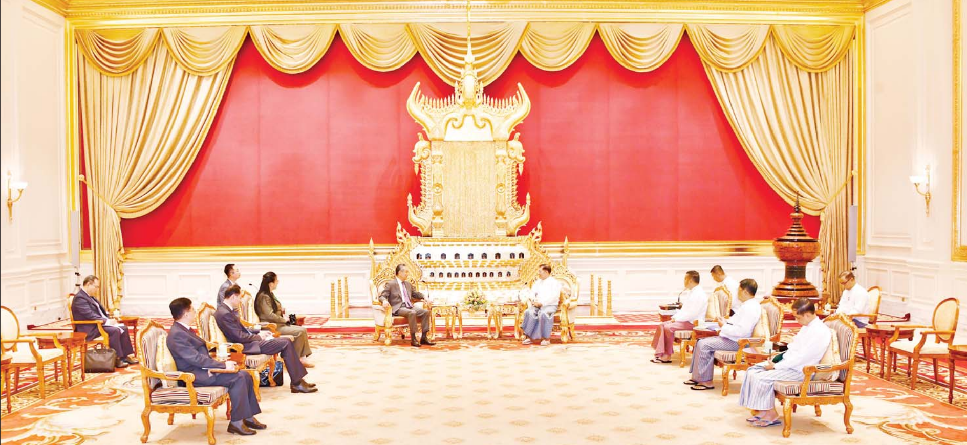
နိုင်ငံတော်စီမံအုပ်ချုပ်ရေးကောင်စီဥက္ကဋ္ဌ နိုင်ငံတော်ဝန်ကြီးချုပ် ဗိုလ်ချုပ်မှူးကြီး မင်းအောင်လှိုင် တရုတ်ကွန်မြူနစ်ပါတီဗဟိုကော်မတီ၊ နိုင်ငံရေးရာဇဝတ်အဖွဲ့ဝင်နှင့် နိုင်ငံခြားရေးဝန်ကြီး H. E. Mr. Wang Yi ဦးဆောင်သည့် ကိုယ်စားလှယ်အဖွဲ့အား လက်ခံတွေ့ဆုံ