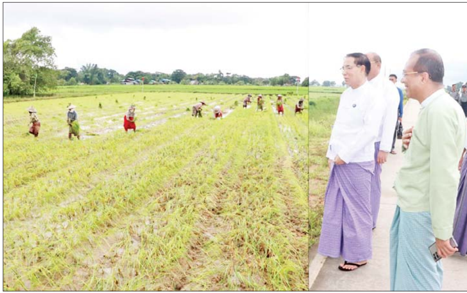
ရန် တာဝန်ရှိသူများအား လမ်းညွှန်မှာကြားခဲ့သည်။ ဆောင်ရွက်လျက်ရှိသော “လရောင်ခြယ်”ဝမ်းဘဲလေး ဓာတ်ဖောက်ဆိုင်သို့ သွားရောက်ကြည့်ရှုအားပေးပြီး ဒေသတွင်း အသားနှင့်ဥစားသုံးမှု ဖူလုံပိုလျှံစေရေး၊ သက်သာသောနှုန်းထားဖြင့် ရောင်းချနိုင်ရေး

ဦးစွာ တိုင်းဒေသကြီးဝန်ကြီးချုပ် ဦးမျိုးဆွေဝင်းသည် သနပ်ပင်မြို့နယ် ဖရဲကွင်း၌ ရေကြီးနစ်မြုပ်ခဲ့သည့် လယ်မြေများတွင် တိုင်းဒေသကြီးအစိုးရအဖွဲ့၏ ပံ့ပိုးကူညီမှုဖြင့် သက်တမ်းတူ မျိုးတူ စပါးပျိုးပင်များ ကောက်စိုက်လုံမေများဖြင့် ပြန်လည်အစားထိုးစိုက်ပျိုးနေမှုကို ကွင်းဆင်းကြည့်ရှုပြီး လိုအပ်သည်များ ဖြည့်ဆည်းဆောင်ရွက်ပေးခဲ့သည်။ ယင်းနောက် တိုင်းဒေသကြီးအစိုးရအဖွဲ့၏ လမ်းညွှန်မှုဖြင့် ဖရဲကွေးရွာ ကုန်ထုတ်လမ်းတစ်လျှောက် အရိပ်ရ သီးပင်စားပင်များ စိုက်ပျိုးထားရှိမှုကို လှည့်လည်ကြည့်ရှုပြီး ကြီးထွားရှင်သန်နိုင်ရေး ပြုစုထိန်းသိမ်း