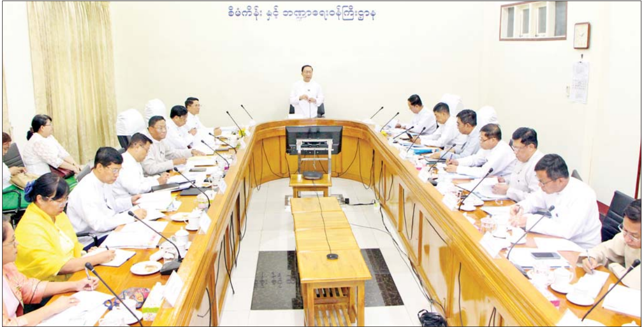
စီမံကိန်း နှင့် ဘဏ္ဍာရေးဝန်ကြီးဌာန

ထို့နောက် ကော်မတီဝင်များဖြစ်ကြသည့် ပြည်ထောင်စုဝန်ကြီးများက ၂၀၂၃-၂၀၂၄ ခုနှစ်အတွင်း နေ့စပေါ့စီမံကိန်း၊ မိုးစပါးစီမံကိန်း၊ ဆီထွက်သီးနှံ (မြေပဲ၊ နှမ်း၊ နေကြာ) စီမံကိန်းအကောင်အထည်ဖော်