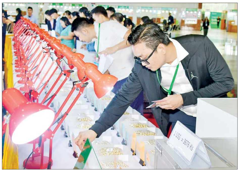
ပြည်တွင်း၊ ပြည်ပရတနာကုန်သည်များ ရောင်းချရန် ခင်းကျင်းပြသထားသည့် ပုလဲအတွဲများကို စိတ်ကြိုက်လေ့လာကြည့်ရှုကြစဉ်။

မြန်မာ့ပုလဲရောင်းချပွဲများကို ၁၉၆၄ ခုနှစ်မှ စတင်၍ မြန်မာ့ကျောက်မျက်ရတနာပြပွဲများနှင့်အတူ ပူးပေါင်း၍လည်းကောင်း၊ မြန်မာ့ပုလဲသီးသန့်ဖြင့်လည်းကောင်း အောင်မြင်စွာကျင်းပပေးခဲ့ရာ ယခုကျင်းပပြုလုပ်သည့် ၂၀၂၄ခုနှစ် (၁၄၂)ကြိမ်မြောက် မြန်မာ့တောင်ပင်လယ်ပုလဲရောင်းချပွဲကို