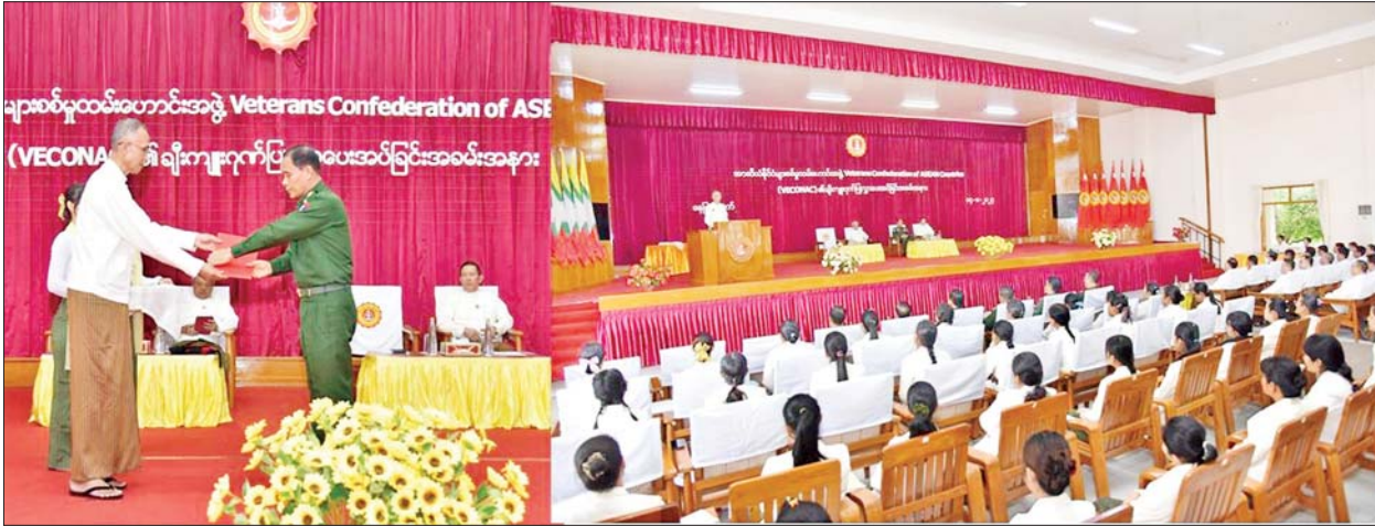
နေပြည်တော် ဩဂုတ် ၁၄ အာဆီယံနိုင်ငံများစစ်မှုထမ်းဟောင်းအဖွဲ့ Veterans Confederation of ASEAN Countries (VECONAC) ၏ ချီးကျူးဂုဏ်ပြုလွှာပေးအပ်ပွဲ အခမ်းအနားကို ယနေ့ နံနက် ၁၀ နာရီတွင်