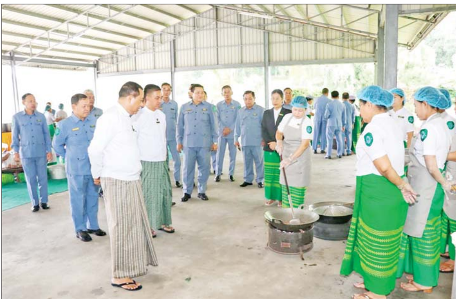
ပြည်ထောင်စုဝန်ကြီး ဒုတိယဗိုလ်ချုပ်ကြီး ထွန်းထွန်းနောင် ရှေ့တန်းရောက်တပ်မတော်သားများ နှင့် လုံခြုံရေးတပ်ဖွဲ့ဝင်များအတွက် စားသောက်ဖွယ်ရာများ ချက်ပြုတ်ကြော်လှော် ပြင်ဆင်နေမှုများကို ကြည့်ရှုအားပေးစဉ်။

နေပြည်တော် ဩဂုတ် ၁၃ ပြည်သူ့လူထု၏ အသက် အိုးအိမ်စည်းစိမ်များကို ကာကွယ် စောင့်ရှောက်ရန်အတွက် နိုင်ငံ တော်ကာကွယ်ရေးနှင့် လုံခြုံရေး တာဝန်များကို ရဲရဲဝံ့ဝံ့ သက်စွန့် ဆံ့ဖျား ထမ်းဆောင်လျက်ရှိသည့် ရှေ့တန်းရောက် တပ်မတော်သား များနှင့် လုံခြုံရေးတပ်ဖွဲ့ဝင်များ အတွက် ပြည်ထောင်စုဝန်ကြီးဌာန များ၊ တိုင်းဒေသကြီးနှင့် ပြည်နယ် အစိုးရအဖွဲ့များမှ ဝန်ထမ်းများနှင့် မိသားစုများသာမက နိုင်ငံအတွင်း မှ အသင်းအဖွဲ့များ၊ စေတနာရှင် အလှူရှင်များကလည်း အလှူငွေ များနှင့် စားသောက်ဖွယ်ရာများကို ပေးပို့လှူဒါန်းလျက်ရှိသည်။