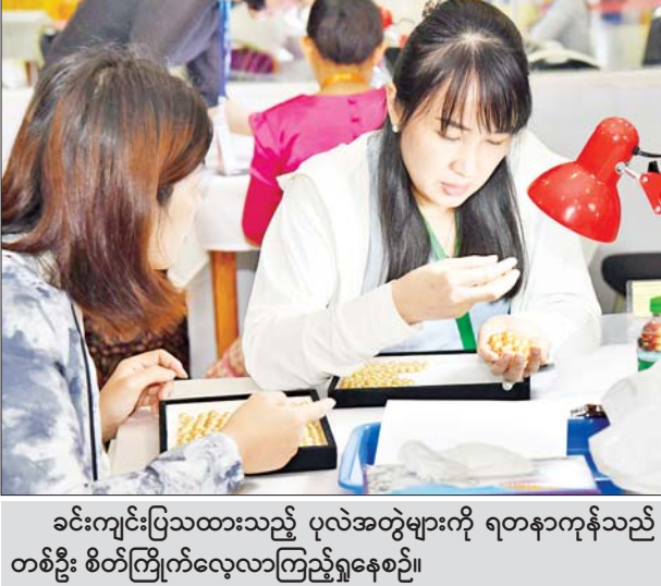
ခင်းကျင်းပြသထားသည့် ပုလဲအတွဲများကို ရတနာကုန်သည် တစ်ဦး စိတ်ကြိုက်လေ့လာကြည့်ရှုနေစဉ်။

နေပြည်တော် ဩဂုတ် ၁၃ ၂၀၂၄ ခုနှစ် (၁၄၂) ကြိမ်မြောက် မြန်မာ့တောင်ပင်လယ်ပုလဲ ရောင်းချပွဲ ဒုတိယနေ့ကို ယနေ့နံနက်ပိုင်းတွင် နေပြည်တော်ရှိ မဏိ ရတနာကျောက်စိမ်းခန်းမ၌ ဆက်လက်ကျင်းပရာ ပြည်တွင်း ပြည်ပ ရတနာကုန်သည်များက မဏိရတနာကျောက်စိမ်းခန်းမအတွင်း၌ ရောင်းချရန် ခင်းကျင်းပြသထားသည့် ပုလဲအတွဲများကို စိတ်ကြိုက် လေ့လာကြည့်ရှုကြသည်။ ကြည့်ရှုစစ်ဆေး ထို့နောက် တင်ဒါအမှတ်(၁)ဖြစ်သည့် ပုလဲအတွဲအမှတ်(၁)မှ အတွဲ အမှတ် (၁၁၅) အထိနှင့် တင်ဒါအမှတ်(၂) ဖြစ်သည့် ပုလဲအတွဲအမှတ် (၁၁၆)မှ ပုလဲအတွဲ အမှတ် (၂၃၀) အထိကို ရတနာကုန်သည်များက ကြည့်ရှုစစ်ဆေးကြကာ ဈေးနှုန်းတင်သွင်းလွှာများကို သက်ဆိုင်ရာ တင်ဒါပုံးများအတွင်းသို့ ထည့်သွင်းကြသည်။ စာမျက်နှာ ၃ ကော်လံ ၁ သို့ *