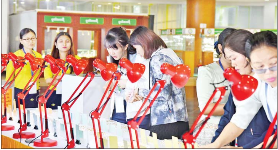
ခင်းကျင်းပြသထားသည့် ပုလဲအတွဲများကို ပြည်တွင်းပြည်ပရတနာကုန်သည်များက စိတ်ကြိုက် လေ့လာ ကြည့်ရှုကြစဉ်။