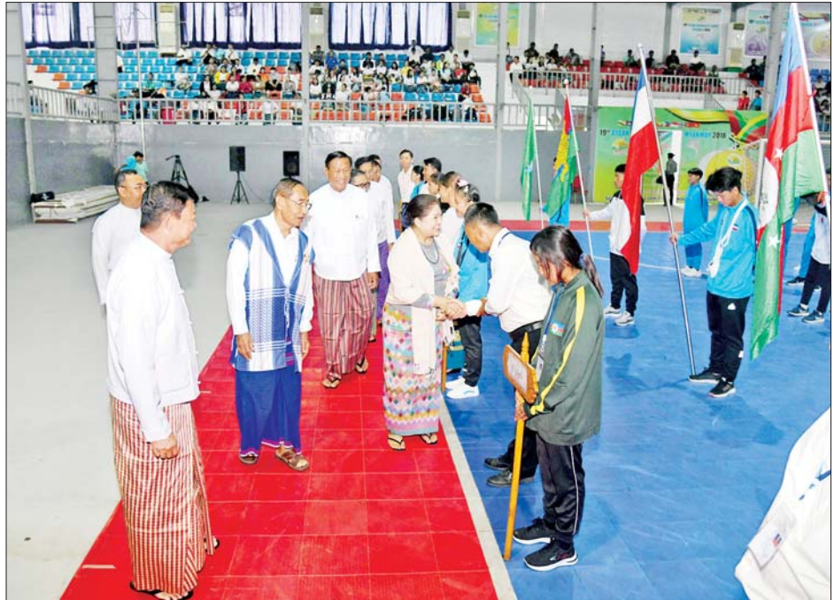
နိုင်ငံတော်စီမံအုပ်ချုပ်ရေးကောင်စီအဖွဲ့ဝင်များ၊ ပြည်ထောင်စုဝန်ကြီး ဦးမင်းသိန်းဇံနှင့် တာဝန်ရှိသူ များ ၂၀၂၄ ခုနှစ် ပြည်နယ်နှင့်တိုင်းဒေသကြီး ဖူဆယ်ပြိုင်ပွဲ ပြိုင်ပွဲဝင်အားကစားသမားများကို ရင်းရင်းနှီးနှီး နှုတ်ဆက်စဉ်။

ရင်းရင်းနှီးနှီး လိုက်လံနှုတ်ဆက် ကြပြီး ပြိုင်ပွဲယှဉ်ပြိုင်ကစားနေမှု များကို ကြည့်ရှုအားပေးကြသည်။