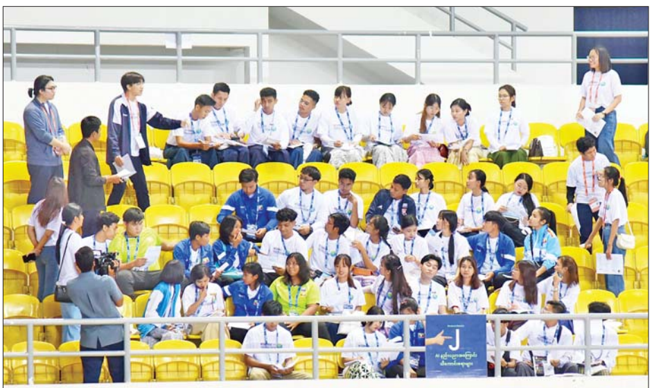
လူငယ်ဖိုရမ်သို့ တက်ရောက်လာကြသည့် လူငယ်ကိုယ်စားလှယ်များအုပ်စုအလိုက်ဆွေးနွေးကြစဉ်။