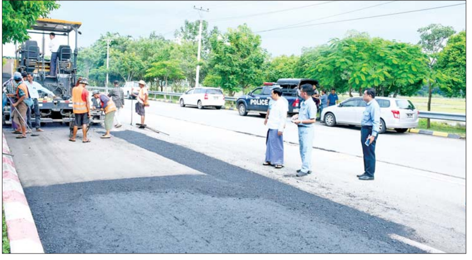
လမ်းများပေါ်တွင် ရေတင်ရေဝင်ခြင်းမရှိစေရေး လေဆိပ်မုခ်ဦးအနီး လမ်းဘေးဝဲ/ယာတွင် သာယာ အထူးဂရုပြုဆောင်ရွက်ရန်တို့ကို တာဝန်ရှိသူများ လှပရေးလုပ်ငန်း ဆောင်ရွက်ထားရှိမှုအခြေအနေကို အား မှာကြားသည်။ လိုအပ်သည်များ မှာကြားခဲ့ ထို့နောက် မြို့တော်ဝန်နှင့် တာဝန်ရှိသူများသည် ကြောင်း သိရသည်။ သတင်းစဉ်

ရန် မှာကြားသည်။ ဆက်လက်၍ ရာသေဓာတ်လမ်းနှင့် နေပြည်တော် အပြည်ပြည်ဆိုင်ရာလေဆိပ် လမ်းတစ်လျှောက် ရေတင်ရေဝင်သောနေရာများတွင် နိုင်လွန်ကတ္တရာ ထပ်ပိုးလွှာခင်း ပြန်လည်ပြုပြင်ခြင်း လုပ်ငန်းဆောင် ရွက်နေမှု၊ လမ်းလယ်ကျွန်းအတွင်းနှင့် လမ်းဘေး တို့တွင် ရေဆင်းမြောင်းများ ဖောက်လုပ်ထားရှိမှုနှင့် ပန်းနှင်းဆီအိုင်အနီး သာယာလှပစေရေးအတွက် ပန်းအလှပင် ငါးမျိုး စိုက်ပျိုးခြင်းလုပ်ငန်းဆောင်ရွက် ထားရှိမှုအခြေအနေများကို သွားရောက်ကြည့်ရှု စစ်ဆေးပြီး မြို့တော်ဝန်က သဲကောကြီးကျေးရွာအနီး လမ်းလယ်ကျွန်းတွင် ပန်းအလှပင်များ ထပ်မံဖြည့်တင်း စိုက်ပျိုးထားရှိရန်၊ မိုးရွာသွန်းမှုများပြားခြင်းကြောင့်