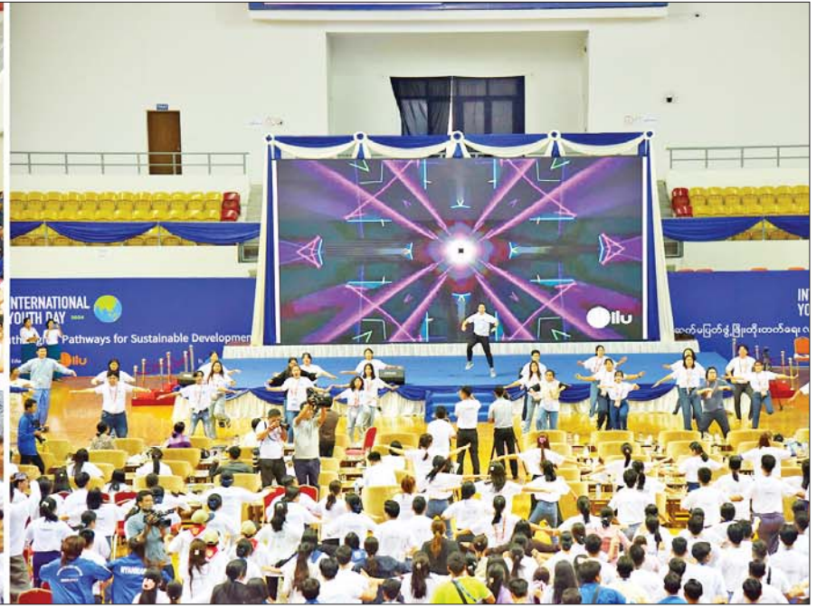
လူငယ်ဖိုရမ်သို့ တက်ရောက်လာကြသည့် လူငယ်ကိုယ်စားလှယ်များက Zumba အကဖြင့် အတူတကွ ကပြကြစဉ်။