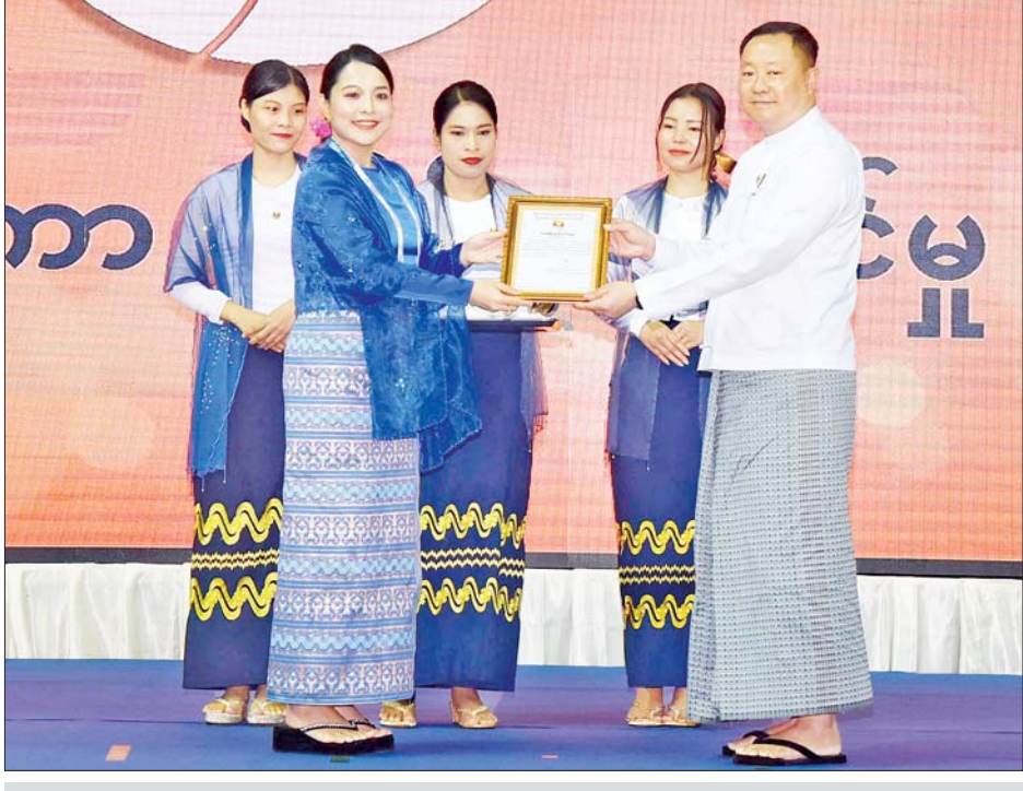
ဒုတိယဝန်ကြီး ဦးဇင်မင်းထက် အပြည်ပြည်ဆိုင်ရာလူငယ်များနေ့အထိမ်းအမှတ်အခမ်းအနား၊ လူငယ်ဖိုရမ်၊ လူငယ်လေ့လာရေးခရီးစဉ်နှင့် လူမှုအကျိုးပြုလုပ်ငန်းများအတွက် အလှူငွေလှူဒါန်းခဲ့သည့် အလှူရှင်တစ်ဦးအား ဂုဏ်ပြုမှတ်တမ်းလွှာပေးအပ်စဉ်။