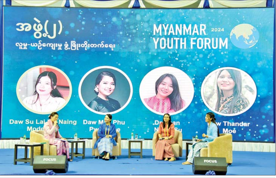
လူငယ်ဖိုရမ်တွင် လူမှု-ယဉ်ကျေးမှုဖွံ့ဖြိုးတိုးတက်ရေးကဏ္ဍခေါင်းစဉ်ဖြင့် ဆွေးနွေးကြသည်။

မည့် ကိစ္စရပ်များကို ဖော်ထုတ်ရာတွင် အဓိကကျပြီး လူငယ်များ၏ နေ့စဉ်လူမှုဘဝဖြတ်သန်းမှုများတွင် ပုံစံအမျိုးမျိုးဖြင့် ဆက်စပ်နေသော ကဏ္ဍများနှင့် စပ်လျဉ်း၍လည်းကောင်း၊ ဒစ်ဂျစ်တယ်အသွင်ကူးပြောင်းမှုလုပ်ငန်းစဉ်၏ အဓိကအခန်းကဏ္ဍမှ ပါဝင်လျက်ရှိသည့် ဉာဏ်ရည်တူ AI နှင့် ပတ်သက်သည့် သိမှတ်ဖွယ် ဗဟုသုတများ၊ ဆောင်ရန်ရောင်ရန် ကိစ္စရပ်များ၊ လုပ်ဆောင်နိုင်စွမ်း နယ်ပယ်များနှင့် စိန်ခေါ်မှုများ၊ ကျော်လွှားနိုင်မည့် နည်းလမ်းများ၊