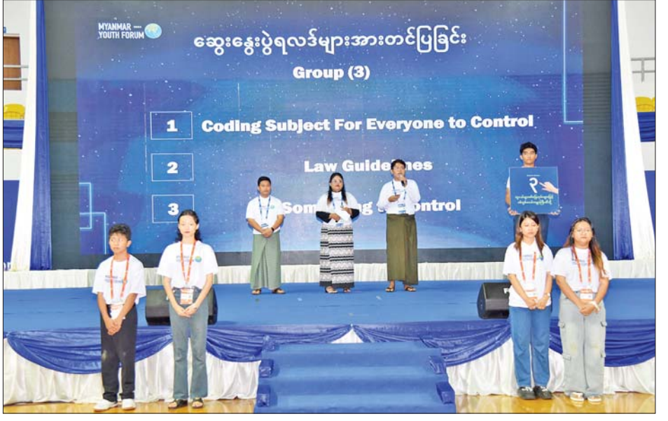
လူငယ်ဖိုရမ်သို့ တက်ရောက်လာကြသည့် လူငယ်ကိုယ်စားလှယ်များက အုပ်စုကိုးခုခွဲ၍ ဆွေးနွေးကြပြီး အုပ်စုခေါင်းဆောင်များက ဆွေးနွေးပွဲရလဒ်များကို ဖတ်ကြားတင်ပြစဉ်။