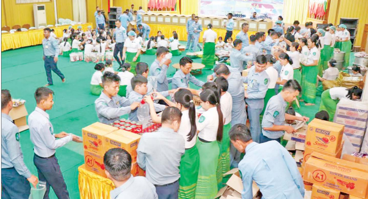
နယ်စပ်ရေးရာဝန်ကြီးဌာန ဝန်ထမ်းမိသားစုများက ရှေ့တန်းရောက်တပ်မတော်သားများနှင့် လုံခြုံရေးတပ်ဖွဲ့ဝင်များအတွက် စားသောက် ဖွယ်ရာများ ပြင်ဆင်ထုပ်ပိုးနေမှုများကို တွေ့ရစဉ်။

သားများနှင့် လုံခြုံရေးတပ်ဖွဲ့ဝင် များအတွက် ရန်ကုန်တိုင်းဒေသ ကြီးအစိုးရအဖွဲ့နှင့် ဌာနဆိုင်ရာ ဝန်ထမ်းမိသားစုများ စုပေါင်း၍ စားသောက်ဖွယ်ရာများ ပေးပို့ လှူဒါန်းနိုင်ရေး စိတ်အားထက်သန် စွာ ပြင်ဆင်ဆောင်ရွက်နေမှုကို တိုင်းဒေသကြီးဝန်ကြီးချုပ် ဦးစိုး သိန်းနှင့် တာဝန်ရှိသူများက လိုက်လံကြည့်ရှုအားပေးခဲ့သည်။ ရန်ကုန်တိုင်းဒေသကြီး အစိုးရ အဖွဲ့နှင့် ဌာနဆိုင်ရာဝန်ထမ်း မိသားစုများက ရှေ့တန်းရောက် တပ်မတော်သားများနှင့် လုံခြုံရေး တပ်ဖွဲ့ဝင်များအတွက် ခေါက်ဆွဲ ခြောက် ၁၄၈၄၆ ထုပ်၊ ကြာဆံ ခြောက်အထုပ် ၉၀၀၊ ငါးသေတ္တာ ဘူး ၂၁၀၊ ကော်ဖီမစ် ၁၃၇ ပါကင်၊ ကွေကာအုပ် ၁၀ ပါကင်၊ ငါးပိ ထောင်းဘူး ၅၀၊ ငါးပိကြော်ထုပ် ၆၀၊ အမွှေးဆပ်ပြာ ၁၆၈ တုံး၊ ဓာတ်ဆားထုပ် ၂၅၀၊ ဆေးလိပ် ၁၀၆၀၀၊ ဂက်စီမီးခြစ် အလုံးရေ ၁၀၀၊ သွားတိုက်ဆေးဘူး ၂၂၀၊ လက်ဖက်အသား နှစ်ပိဿာ၊ နှစ်ပြန်ကြော် သုံးပိဿာ၊ ကိတ်