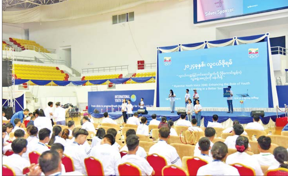
လူငယ်ဖိုရမ်သို့ တက်ရောက်လာကြသည့် လူငယ်ကိုယ်စားလှယ်များက အုပ်စုကိုးစုခွဲ၍ ဆွေးနွေးကြပြီး အုပ်စုခေါင်းဆောင်များက ဆွေးနွေးပွဲရလဒ်များကို ဖတ်ကြားတင်ပြစဉ်။

နိုင်ငံတော်၏ အနာဂတ်ခေါင်းဆောင်များဖြစ်သော လူငယ်များအတွက် နိုင်ငံသားကျင့်ဝတ်များ၊ ခေါင်းဆောင်မှုဆိုင်ရာ အရည်အသွေးများနှင့်စပ်လျဉ်း၍လည်းကောင်း၊ စိတ်ပိုင်းဆိုင်ရာ၊ ရုပ်ပိုင်းဆိုင်ရာ ကျန်းမာကြံ့ခိုင်ရေးများနှင့် ပတ်သက်သော အလေ့အကျင့်ကောင်းများကို မည်သည့်နည်းလမ်းများဖြင့် ဆောင်ရွက်သင့်သည်များနှင့် စပ်လျဉ်း၍လည်းကောင်း၊ ၂၁ ရာစုတွင် လူငယ်များအတွက် ကျွမ်းကျင်မှုများဖြစ်သော Digital Literacy၊ Communication Skills၊ Critical Thinking၊ Global and Cultural Awareness၊ Financial Literacy စသည့် ဘာသာရပ်များနှင့် စပ်လျဉ်း၍လည်းကောင်း၊ အနာဂတ်ခေါင်းဆောင်များဖြစ်လာမည့် လူငယ်များအနေဖြင့် မဖြစ်မနေတတ်ကျွမ်းသင့်သည့် (hard skill & Softskill) အသိပညာ၊ အတတ်ပညာများ၊ မြန်မာနိုင်ငံ၏ လူမှု-ယဉ်ကျေးမှုဖွံ့ဖြိုးတိုးတက်ရေးကို အတူတကွဖော်ဆောင်နိုင်ရန် နည်းလမ်းများ၊ ရုပ်ပိုင်းဆိုင်ရာကျန်းမာရေးနှင့် စိတ်ပိုင်းဆိုင်ရာ ထိလွယ်လွယ် ဖြစ်ပေါ်ခြင်းကို ကာကွယ်တားဆီးနိုင်ရန်နည်းလမ်းများနှင့် စပ်လျဉ်း၍လည်းကောင်း၊ လူငယ်များအနေဖြင့် ရုပ်ပိုင်းဆိုင်ရာကျန်းမာကြံ့ခိုင်ရေးကိုမြှင့်တင်ရန်အတွက် အထောက်အပံ့များ၊ ၂၁ ရာစုကာလတွင် အတတ်ပညာများနှင့် ပတ်သက်၍ ဘဝအတွက် အထောက်အကူပြုနိုင်မည့် နည်းလမ်းများနှင့် စပ်လျဉ်း၍လည်းကောင်း ဆွေးနွေးကြသည်။