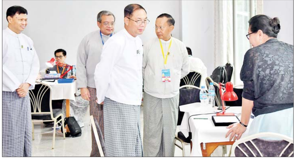
ပြည်ထောင်စုဝန်ကြီး ဦးခင်မောင်ရီ အိတ်ဖွင့်တင်ဒါစနစ်ဖြင့် ပုလဲအတွဲများ ရောင်းချနေမှုကို လိုက်လံကြည့်ရှုအားပေးစဉ်။

ရတနာကုန်သည်များအား ဆက်လက်ရောင်းချပေးသွားမည်ဖြစ် သည်။ ယခုကျင်းပသည့် ၂၀၂၄ ခုနှစ် (၁၄၂) ကြိမ်မြောက် မြန်မာ့ တောင်ပင်လယ်ပုလဲရောင်းချပွဲကို မဏိရတနာကျောက်စိမ်းခန်းမ၌ ဩဂုတ် ၁၂ ရက်မှ ၁၅ ရက်အထိ ကျင်းပနေခြင်းဖြစ်ပြီး ပြပွဲတွင် ပုလဲ အတွဲပေါင်း ၇၀၀ ၊ ပုလဲအလုံးပေါင်း ၁၇၅၀၀၀ ကို ပြည်တွင်း ပြည်ပ ရတနာကုန်သည်များအား အိတ်ဖွင့်တင်ဒါစနစ်ဖြင့် ဆက်လက် ရောင်းချပေးသွားမည်ဖြစ်ကြောင်း သိရသည်။ သတင်းစဉ်