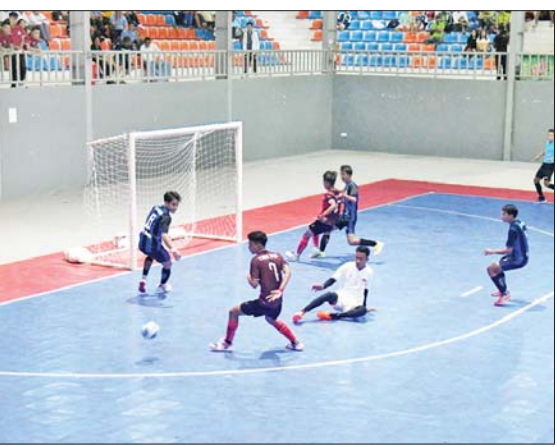
နိုင်ငံတော်စီမံအုပ်ချုပ်ရေးကောင်စီအဖွဲ့ဝင်များ၊ ပြည်ထောင်စုဝန်ကြီးများ၊ ဒုတိယဝန်ကြီးများ၊ ဌာနဆိုင်ရာတာဝန်ရှိသူများ ၂၀၂၄ ခုနှစ် ပြည်နယ်နှင့်တိုင်းဒေသကြီး ဖူဆယ်ပြိုင်ပွဲကို ကြည့်ရှုအားပေးစဉ်။

တက်ရောက် အခမ်းအနားသို့ နိုင်ငံတော်စီမံ အုပ်ချုပ်ရေးကောင်စီ အဖွဲ့ဝင်များ ဖြစ်ကြသည့် ဒေါ်ခွဲကျွဲ၊ ပိုးရယ် အောင်သိန်း၊ မန်းငြိမ်းမောင်၊ ဒေါက်တာမူထန်၊ ဒေါက်တာ ဘရွှေ၊ ခွန်စံလွင်၊ ဦးရွှေကြိမ်းနှင့် ဦးရန်ကျော်၊ ပြည်ထောင်စုဝန်ကြီး