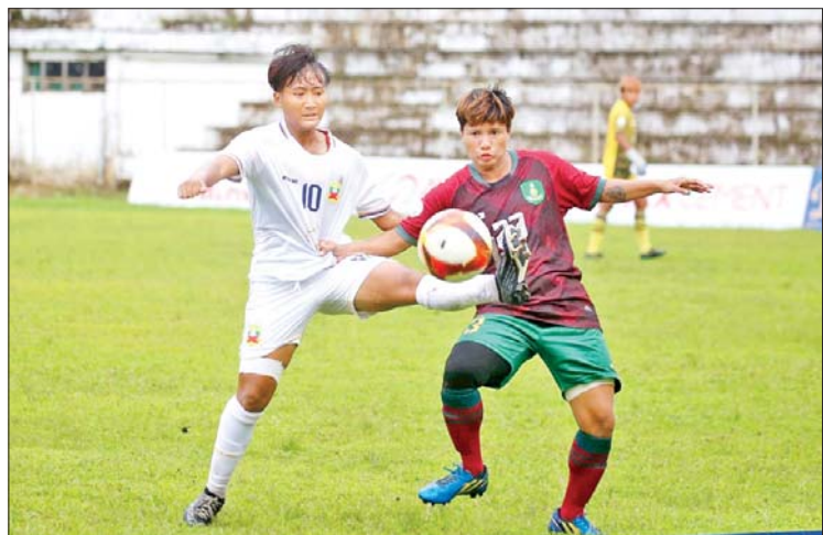
မြဝတီအသင်းနှင့် ရှမ်းယူနိုက်တက်အသင်းတို့ ယှဉ်ပြိုင်ကစားကြစဉ်။