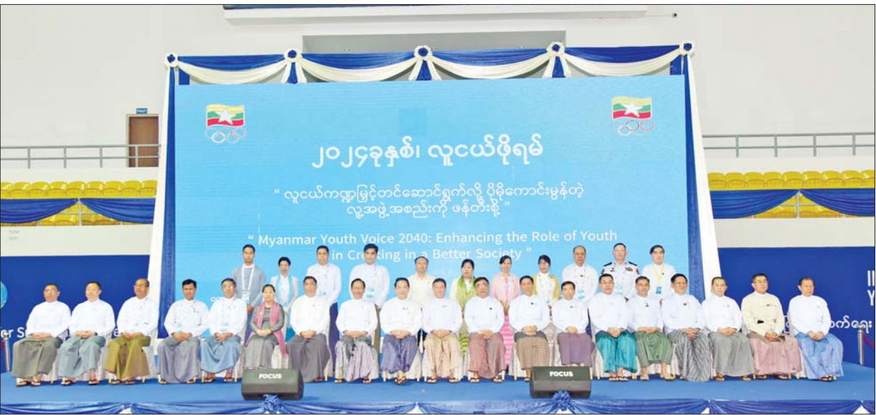
ပြည်ထောင်စုဝန်ကြီးများ၊ နေပြည်တော်ကောင်စီဥက္ကဋ္ဌ၊ ဒုတိယဝန်ကြီးများနှင့် တာဝန်ရှိသူများ အခမ်းအနားသို့ တက်ရောက်လာကြသည့် လူငယ်ကိုယ်စားလှယ်များနှင့်အတူ စုပေါင်းမှတ်တမ်းတင် ဓာတ်ပုံရိုက်ကြသည်။

ပြည်ထောင်စုဝန်ကြီးများ၊ နေပြည်တော်ကောင်စီဥက္ကဋ္ဌ၊ ဒုတိယဝန်ကြီးများနှင့် တာဝန်ရှိသူများ အခမ်းအနားသို့ တက်ရောက်လာကြသည့် လူငယ်ကိုယ်စားလှယ်များနှင့်အတူ စုပေါင်းမှတ်တမ်းတင် ဓာတ်ပုံရိုက်ကြသည်။ ပြသခြင်း၊ စစ်တမ်းကောက်များ ကောက်ယူခြင်း၊ ဉာဏ်စမ်းမေးခွန်းများ မေးမြန်းခြင်း၊ ဆုလက်ဆောင်များ ပေးအပ်ခြင်းနှင့် စုပေါင်းဂိမ်းကစားခြင်း စသည့် အစီအစဉ်များကိုလည်း ထည့်သွင်းကျင်းပခဲ့သည်။ လူငယ်ဖိုရမ်မှ သက်ဆိုင်ရာ ခေါင်းစဉ်အလိုက် ဆွေးနွေး၍ ထွက်ပေါ်လာသည့် ရလဒ်များ၊