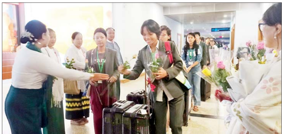
ထူးချွန်ကျောင်းသား ကျောင်းသူများအား တာဝန်ရှိသူများနှင့် ကျောင်းအုပ်ကြီးများ၊ ဆရာ ဆရာမများ၊ ကျောင်းသားမိဘများက ရန်ကုန်အပြည်ပြည်ဆိုင်ရာလေဆိပ်၌ ကြိုဆိုနှုတ်ဆက်ကြစဉ်။