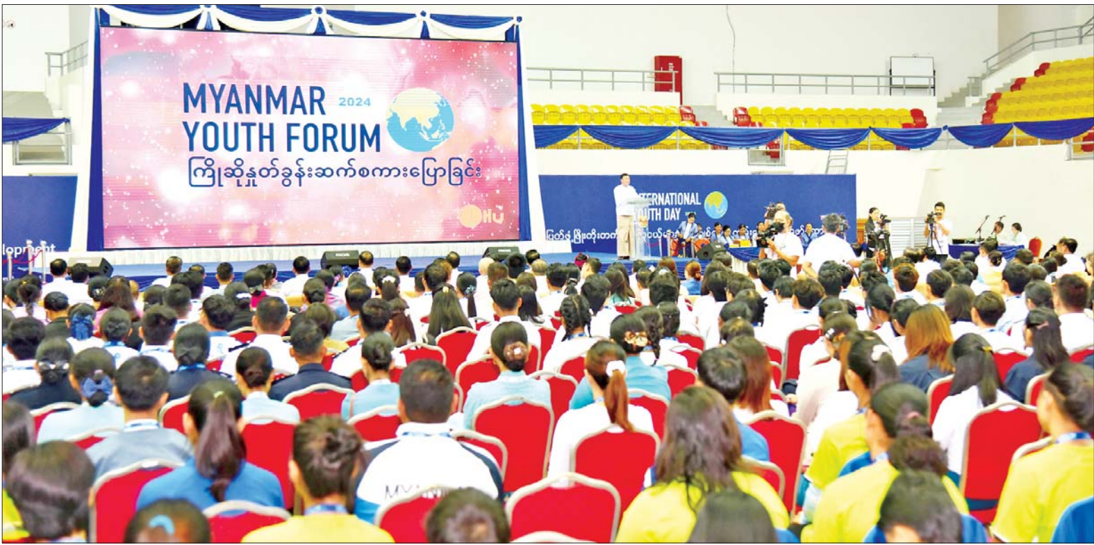
ပြည်ထောင်စုဝန်ကြီး ဦးမင်းသိန်းဇံ ၂၀၂၄ ခုနှစ် လူငယ်ဖိုရမ်အခမ်းအနားတွင် အမှာစကားပြောကြားစဉ်။

နေပြည်တော် ဩဂုတ် ၁၃ “လူငယ်ကဏ္ဍမြှင့်တင်ရေး ပိုမို ကောင်းမွန်တဲ့ လူ့အဖွဲ့အစည်း ဖန်တီးစို့” ဆောင်ပုဒ်ဖြင့် ၂၀၂၄ ခုနှစ် လူငယ်ဖိုရမ်အခမ်းအနားကို ယနေ့နံနက်ပိုင်းတွင် နေပြည်တော်ရှိ ဝဏ္ဏသိဒ္ဓိ အားကစားရုံ(C)၌ ကျင်းပသည်။ အခမ်းအနားသို့ ပြည်ထောင်စု ဝန်ကြီးများ ဖြစ်ကြသည့် ဦးမောင်မောင်အုန်း၊ ဒေါက်တာ ညွန့်ဖေ၊ ဒေါက်တာမျိုးသိန်းကျော်၊ ဒေါက်တာသက်ခိုင်ဝင်း၊ ဦးမင်း သိန်းဇံနှင့် ဒေါက်တာစိုးဝင်း၊ နေပြည်တော်ကောင်စီ ဥက္ကဋ္ဌ၊ ဒုတိယဝန်ကြီးများ၊ နေပြည်တော် ကောင်စီဝင်၊ ပြည်နယ်နှင့် တိုင်းဒေသကြီးမှ လူမှုရေးဝန်ကြီး များ၊ ဌာနဆိုင်ရာအကြီးအကဲများ၊ အသင်းအဖွဲ့များမှ တာဝန်ရှိသူ များ၊ အလှူရှင်များ၊ ဝန်ကြီးဌာန များမှ ဝန်ထမ်းလူငယ်များ၊ နေပြည်တော်ကောင်စီ၊ ပြည်နယ် နှင့် တိုင်းဒေသကြီးများမှ လူငယ် ကိုယ်စားလှယ်များ၊ ရေကြောင်း နှင့် လေကြောင်းလူငယ်များ၊ ကြက်ခြေနီနှင့် ကင်းထောက် လူငယ်များ၊ စေတနာ့ဝန်ထမ်း