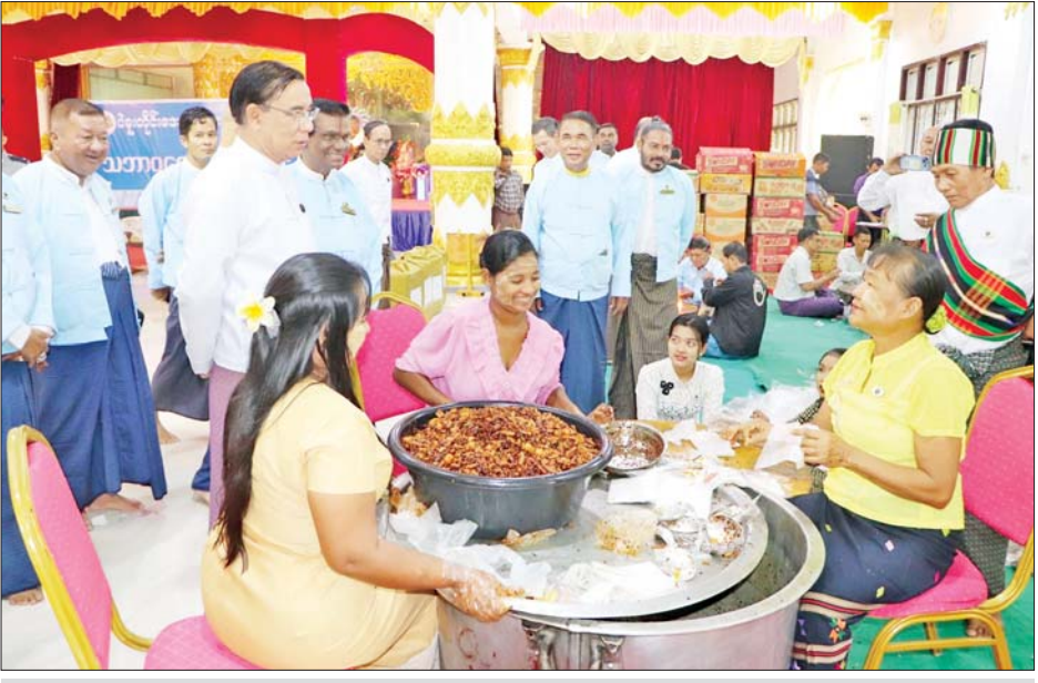
ပဲခူးတိုင်းဒေသကြီးဝန်ကြီးချုပ် ဦးမျိုးဆွေဝင်းနှင့် တာဝန်ရှိသူများ ရှေ့တန်းရောက်တပ်မတော်သား များနှင့် လုံခြုံရေးတပ်ဖွဲ့ဝင်များအတွက် စားသောက်ဖွယ်ရာများ ပြင်ဆင်ထုပ်ပိုးနေမှုများကို ကြည့်ရှု အားပေးစဉ်။

ထမ်းများက “တရားသောစစ် မုချ အောင်ရမည်၊ အမောင်စစ်သည်တို့ နှင့်အတူ တစ်သွေးတည်းတစ်သား တည်း အတူရပ်တည်နေသည်ကို ခြွင်းချက်မရှိ ယုံကြည်၍ ပေးအပ် သည့် အမိန့်နှင့် တာဝန်များကို ကျေပွန်စွာ ထမ်းဆောင်ပြီး အောင်ပွဲများနှင့်အတူ ပြန်လာချိန် ကို သပြေပန်းနှင့်ကြိုဆိုရန်အသင့် စောင့်မျှော်နေမည်” အစရှိသည့် ဆုတောင်းမေတ္တာ စာလွှာများကို လည်း ထည့်သွင်းပေးပို့ခဲ့ကြသည်။ ထို့အတူ ပဲခူးတိုင်းဒေသကြီး အစိုးရအဖွဲ့နှင့် ဘာသာပေါင်းစုံ ချစ်ကြည်ညီညွတ်ရေး အဖွဲ့တို့မှ ပြည်သူများက ဩဂုတ် ၁၁ ရက်တွင် ပဲခူးမြို့ ဗုဒ္ဓအသံဓမ္မဗိမာန်တော်ကြီး ၌ စားသောက်ဖွယ်ရာများ စုပေါင်း ကြော်လှော်ချက်ပြုတ်ကြပြီး ပေးပို့ လှူဒါန်းနိုင်ရေး ပြင်ဆင်ထုပ်ပိုးနေ