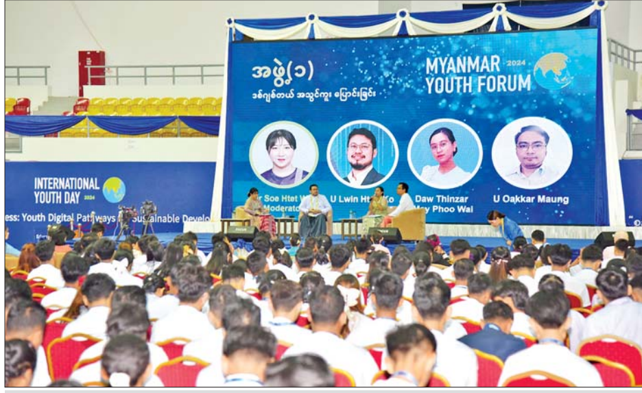
လူငယ်ဖိုရမ်တွင် ဒစ်ဂျစ်တယ်အသွင်ကူးပြောင်းခြင်းနှင့် ပြောင်းလဲဆန်းစစ်ခြင်းကဏ္ဍခေါင်းစဉ်ဖြင့် ဆွေးနွေးကြသည်။

အကြံပြုချက်များကို စုစည်းကာ လူငယ်များဘက်စုံဖွံ့ဖြိုးတိုးတက်ရေးအတွက် မဟာဗျူဟာ လုပ်ငန်းစီမံချက်များတွင် ထည့်သွင်းထွက်ပေါ်လာသည့် ရလဒ်များ၊ ရေးဆွဲဆောင်ရွက်နိုင်ရေး မူဝါဒ သတင်းစဉ်