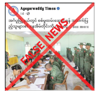
ထမ်းဆောင်ရန်အတွက် ဆင့်ခေါ်ရာတွင် ပြဋ္ဌာန်းထားသည့် ဥပဒေနှင့်အညီသာ ဆောင်ရွက်လျက်ရှိကြောင်း၊ မည်သည့်အကြောင်းနှင့်မျှ ငွေကြေးတစ်စုံတစ်ရာကောက်ခံရန် ညွှန်ကြား

ဧရာဝတီတိုင်းဒေသကြီး အင်္ဂပူမြို့နယ် သပြေကျေးရွာအုပ်စုတွင် အသက် ၁၈ နှစ်မှ ၃၅ နှစ်အတွင်း စစ်မှုထမ်းဆောင်ရန် အသက်ပြည့်သူများ၏ နေအိမ်တိုင်းကို ငွေကျပ်တစ်သိန်းခွဲအထိ အုပ်ချုပ်ရေးမှူးက တောင်းယူနေကြောင်းကို တရားမဝင် ပြည်ဖျက်မီဒီယာများက မဟုတ်မမှန်သတင်းများ ရေးသားဖြန့်ဝေ နေလျက်ရှိသည်ကို တွေ့ရှိရသည်။ အဆိုပါသတင်းနှင့် ပတ်သက်၍ မှန်ကန်မှုမရှိကြောင်းနှင့် စစ်မှု