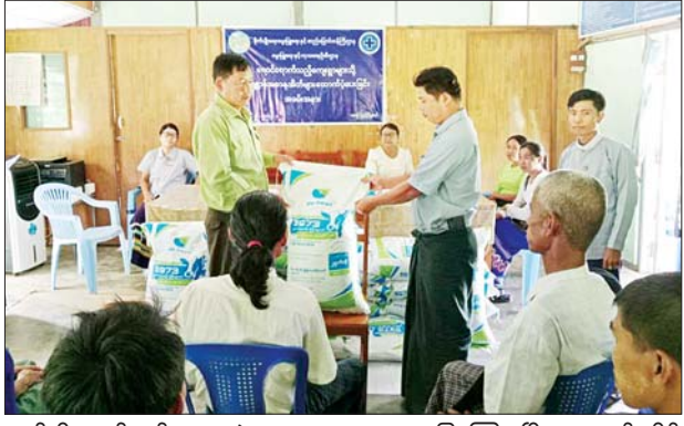
နယ် စီမံအုပ်ချုပ်ရေးအဖွဲ့ ဥက္ကဋ္ဌ စကားပြောကြားပြီး ကျျပျော်ခရိုင် ဦးသန်းချစ်အေးက အဖွင့်အမှာ မွေးမြူရေးနှင့် ကုသရေးဦးစီးဌာန

စိုက်ပျိုးရေး၊ မွေးမြူရေးနှင့် ဆည်မြောင်းဝန်ကြီးဌာန မွေးမြူ ရေးနှင့် ကုသရေးဦးစီးဌာန တိုင်း ဒေသကြီး ဦးစီးမှူးရုံးက ရေကြည် မြို့နယ်အတွင်း ရေဝင်သည့်ကျေးရွာ များသို့ ခွဲဝေပေးသည့် တိရစ္ဆာန် အစာအိတ်များ ထောက်ပံ့ပေးအပ် ပွဲကို ယနေ့နံနက်ပိုင်းက ရေကြည် မြို့ မွေးမြူရေးနှင့် ကုသရေးဦးစီး ဌာန ရုံးခန်းမ၌ ကျင်းပသည်။ အခမ်းအနားတွင် ရေကြည်မြို့