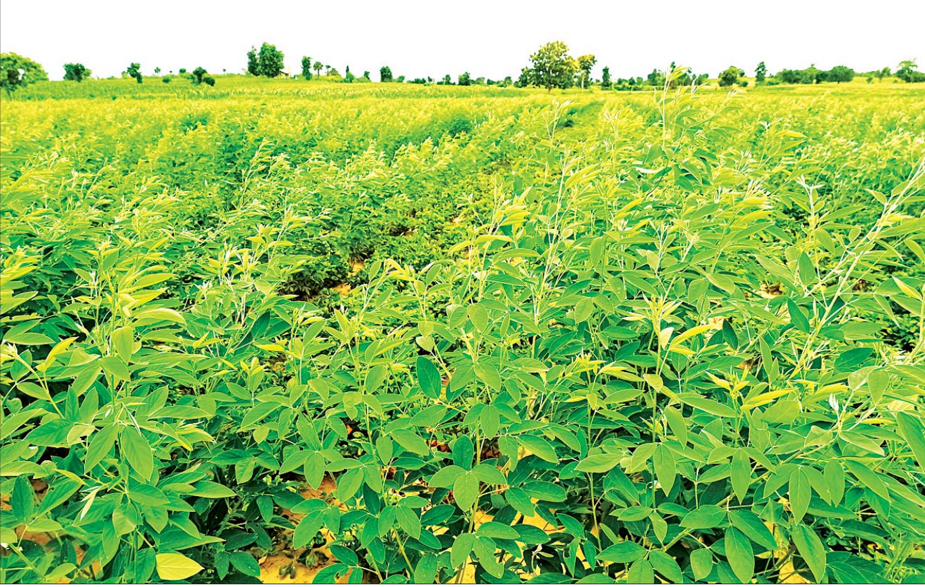
ကျွန်းလှမြို့နယ်၌ ယခုနှစ် မိုးရာသီစိုက်ပျိုးသော ပဲစင်းငုံစိုက်ခင်းများ အောင်မြင်ဖြစ်ထွန်းနေမှုကို တွေ့ရစဉ်။