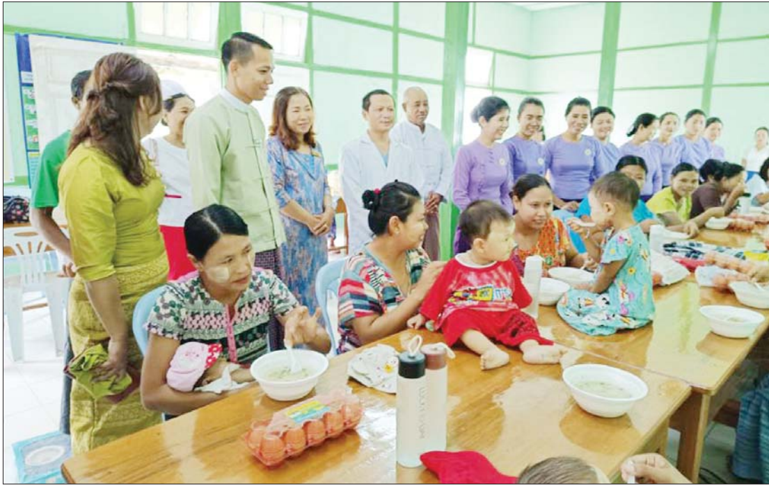
ပဲခူးတိုင်းဒေသကြီး သနပ်ပင်မြို့နယ်၌ မိခင်နို့တိုက်ကျွေးရေးနှင့် အာဟာရဖွံ့ဖြိုးရေး ရက်သတ္တပတ်လှုပ်ရှားမှုအခမ်းအနား ပြုလုပ်စဉ်။

တန်ဖိုးမြင့်နိုင်သောမိခင်နို့ရည် မိခင်နို့ရည်သည် ကလေးငယ် ကျန်းမာစွာကြီးထွားပြီး ဖွံ့ဖြိုးမှုအတွက် အကောင်းဆုံး အာဟာရပင်ဖြစ်ပါသည်။ မိခင်နို့ရည်သည် မွေးဖွားပြီး ပထမခြောက်လအတွင်း ကလေးငယ် လိုအပ်သော တစ်ခုတည်းသောအာဟာရ ဖြစ်ပါသည်။ ကလေးငယ်အတွက် အစာကြေလွယ်ပြီး ကလေးငယ်ကို အာဟာရ ဓာတ်များ လျင်မြန်စွာပေးနိုင်ပါသည်။ ထို့ကြောင့် အာဟာရကြွယ်ဝပြီး ရောဂါ ကာကွယ်ပေးသည့် ဓာတ်များပါဝင်သော