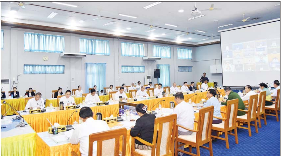
အမျိုးသားယာဉ်အန္တရာယ်၊ လမ်းအန္တရာယ်ကင်းရှင်းရေးကောင်စီဥက္ကဋ္ဌ နိုင်ငံတော်စီမံအုပ်ချုပ်ရေးကောင်စီအဖွဲ့ဝင် ဒုတိယဝန်ကြီးချုပ်နှင့် ပြည်ထောင်စုဝန်ကြီး ဗိုလ်ချုပ်ကြီး မြထွန်းဦး အမျိုးသားယာဉ်အန္တရာယ်၊ လမ်းအန္တရာယ်ကင်းရှင်းရေးကောင်စီ တတိယအကြိမ် ညှိနှိုင်းအစည်းအဝေးတွင် အမှာစကားပြောကြားစဉ်။

တက်ရောက် အစည်းအဝေးသို့ အမျိုးသား ယာဉ်အန္တရာယ်၊ လမ်းအန္တရာယ် ကင်းရှင်းရေးကောင်စီ ဒုတိယ ဥက္ကဋ္ဌများနှင့် အဖွဲ့ဝင်များ ဖြစ်ကြသည့် ပြည်ထောင်စု ဝန်ကြီးများ၊ နေပြည်တော် ကောင်စီဥက္ကဋ္ဌ၊ ဒုတိယဝန်ကြီး များ၊ ဌာနဆိုင်ရာအကြီးအကဲ များနှင့် တာဝန်ရှိသူများတက် ရောက်ကြပြီး ကောင်စီအဖွဲ့ဝင် အသင်းအဖွဲ့များမှ ဥက္ကဋ္ဌများ၊ တိုင်းဒေသကြီးနှင့် ပြည်နယ် ယာဉ်အန္တရာယ်၊ လမ်းအန္တရာယ် ကင်းရှင်းရေးကောင်စီ ဥက္ကဋ္ဌများ ဖြစ်ကြသည့် တိုင်းဒေသကြီးနှင့် ပြည်နယ် ဝန်ကြီးချုပ်များ၊ မြို့တော်ဝန်များနှင့် တာဝန်ရှိသူ များက ဝိဒိယာကွန်ဖရင့်စနစ်ဖြင့် တက်ရောက်ကြသည်။ ဦးစွာ အမျိုးသားယာဉ် အန္တရာယ်၊ လမ်းအန္တရာယ် ကင်းရှင်းရေးကောင်စီ ဥက္ကဋ္ဌ နိုင်ငံတော် စီမံအုပ်ချုပ်ရေး ကောင်စီအဖွဲ့ဝင် ဒုတိယဝန်ကြီး ချုပ်နှင့် ပြည်ထောင်စုဝန်ကြီး ဗိုလ်ချုပ်ကြီး မြထွန်းဦးက ယနေ့ ကျင်းပသည့် အစည်းအဝေးသည် အမျိုးသား ယာဉ်အန္တရာယ်၊ လမ်းအန္တရာယ် ကင်းရှင်းရေး ကောင်စီကို ပြင်ဆင်ဖွဲ့စည်း တာဝန် ပေးအပ်ခဲ့ပြီးနောက် တတိယအကြိမ် ကျင်းပသည့် အစည်းအဝေးဖြစ်ကြောင်း၊ ယခင် နှစ် ၂၀၂၃ ခုနှစ်အတွင်း နိုင်ငံ တစ်ဝန်းဖြစ်ပေါ်ခဲ့သည့် ယာဉ်တိုက် မှုအခြေအနေများကို သုံးသပ် ဆွေးနွေးပြီး ယခုနှစ်စီမံ