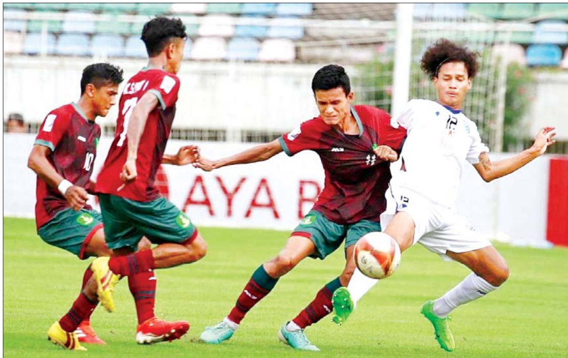
Dagon Port အသင်းနှင့် မြဝတီအသင်းတို့ ယှဉ်ပြိုင်ကစားကြစဉ်။

ရန်ကုန် ဩဂုတ် ၉ ၂၀၂၄-၂၀၂၅ ရာသီ MNL အမှတ်ပေး ပြိုင်ပွဲ ပွဲစဉ် (၆) ပထမနေ့ကို ဩဂုတ် ၉ ရက်က သုဝဏ္ဏကွင်း၌ ဆက်လက်ကျင်းပရာ Dagon Port အသင်းက မြဝတီအသင်းကို နှစ်ဂိုး-တစ်ဂိုးဖြင့် အနိုင်ရခဲ့သည်။ ရှုံးပွဲနှင့်ရင်ဆိုင်ခဲ့ရ ရမှတ်လေးမှတ်စီဖြင့် ဇယားအောက်ပိုင်းရောက်ရှိနေသည့် အသင်းနှစ်သင်း တွေ့ဆုံခြင်းဖြစ်ပြီး Dagon Port အသင်းက နောက်ကျိုးဖြင့် နိုင်ပွဲရယူကာ ဒုတိယမြောက် နိုင်ပွဲရရှိခဲ့သည်။ မြဝတီအသင်းသည် ဦးဆောင်ဂိုးစတင် ရရှိသော်လည်း အနိုင်ရလဒ်ကို မထိန်းနိုင်သဖြင့် ရှုံးပွဲနှင့် ရင်ဆိုင်ခဲ့ရခြင်းဖြစ်သည်။ ပထမပိုင်းတွင် နှစ်သင်းစလုံး ဂိုးသွင်းယူနိုင်ခြင်းမရှိဘဲ ၅၃ မိနစ်တွင် ရဲမိုးယံက မြဝတီအသင်းအတွက် ဂိုးစတင် သွင်းယူခဲ့သည်။ စာမျက်နှာ ၁၆ ကော်လံ ၅ သို့ ၀