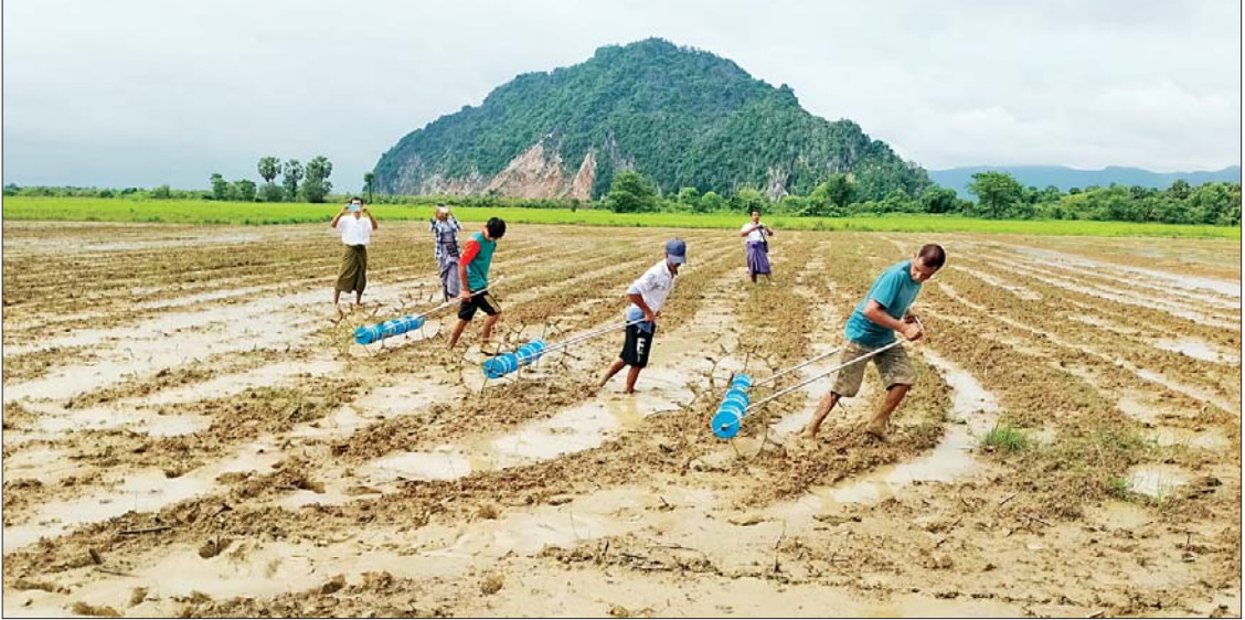
ကျိုက်မရောမြို့နယ်၌ မျိုးစေ့ချက်ရိယာဖြင့် မိုးစပါးစိုက်ပျိုးနေမှုကို တွေ့ရစဉ်။

ကျွန်းလှ ဩဂုတ် ၉ စစ်ကိုင်းတိုင်းဒေသကြီး ကျွန်းလှမြို့နယ်၌ ယခုနှစ် မိုးသီးနှံစိုက်ပျိုးရာသီတွင် ပဲမျိုးစုံစိုက်ပျိုးရန် ၁၆၉၅၃ ဧက လျာထားပြီး လက်ရှိအချိန်ထိ ပဲစင်းငုံ ၁၁၅၃၅ ဧကနှင့် ပဲတီစိမ်း ၅၄၁၅ ဧက စုစုပေါင်း ဧက ၁၆၉၅၀ စိုက်ပျိုးပြီးဖြစ်ကြောင်း မြို့နယ်စိုက်ပျိုးရေးဦးစီးဌာနမှ သိရသည်။ စာမျက်နှာ ၃ ကော်လံ ၁ သို့ *