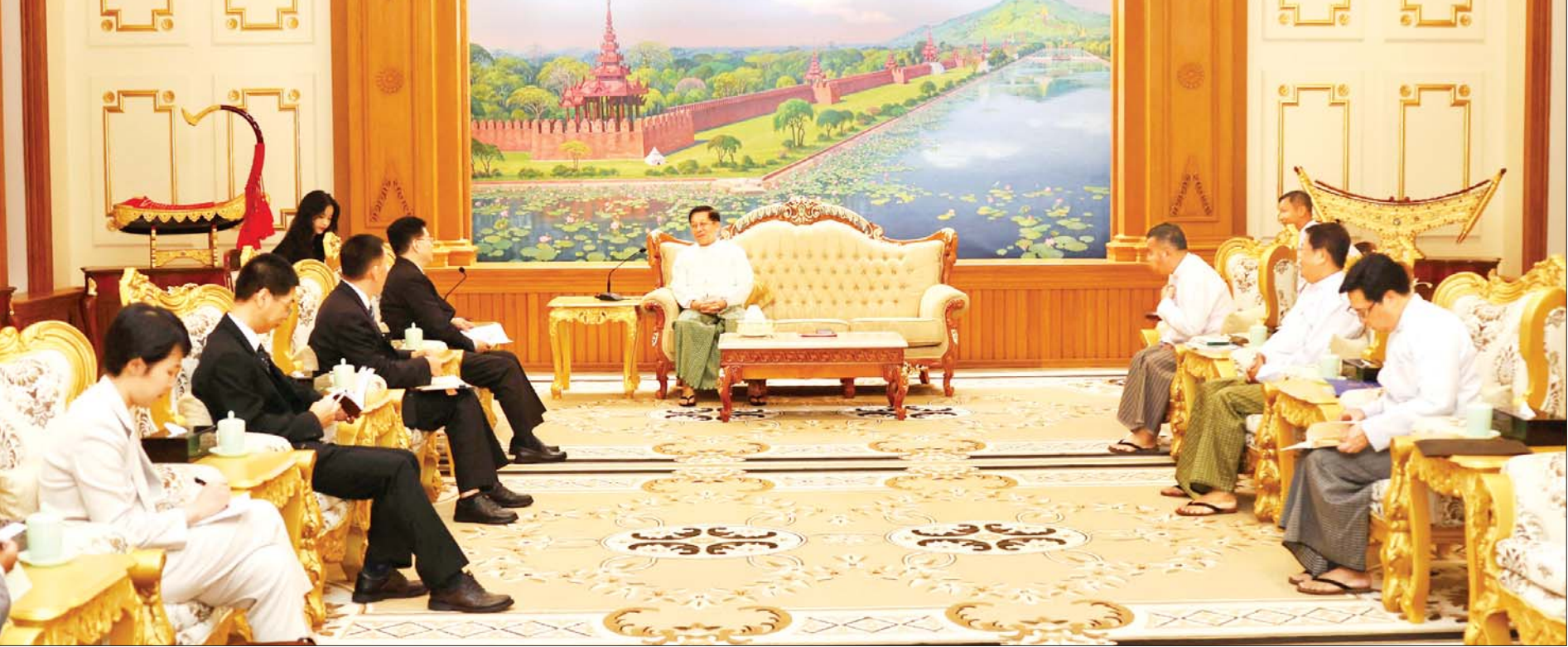
နိုင်ငံတော်စီမံအုပ်ချုပ်ရေးကောင်စီဥက္ကဋ္ဌ နိုင်ငံတော်ဝန်ကြီးချုပ် ဗိုလ်ချုပ်မှူးကြီး မင်းအောင်လှိုင် တရုတ်နိုင်ငံခြားရေးဝန်ကြီးဌာန အာရှရေးရာအထူးကိုယ်စားလှယ် H. E. Mr. Deng Xijun အား လက်ခံတွေ့ဆုံစဉ်။