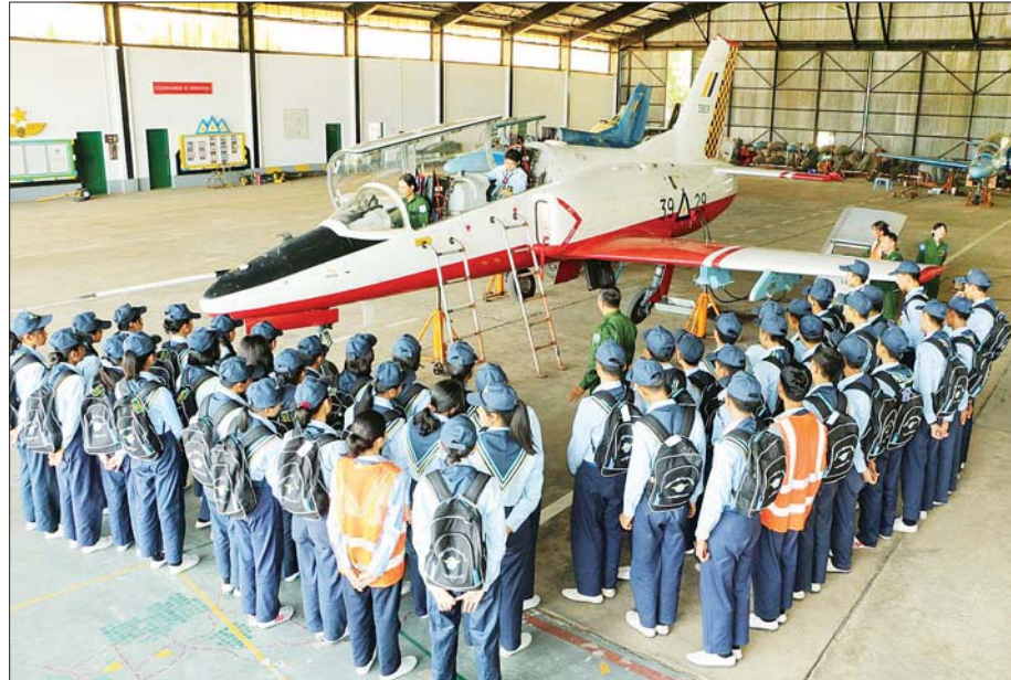
၂၀၂၄ ခုနှစ် လေကြောင်းလူငယ်အခြေခံနှင့် တန်းမြင့်သင်တန်းသားများ လေယာဉ်ပျံသန်းမှု အခြေခံသဘောတရားဘာသာရပ်ကို ကွင်းဆင်းလေ့လာစဉ်။

“ယနေ့ကမ္ဘာပေါ်မှာ သဘာဝဘေးအန္တရာယ်၊ ကပ်ရောဂါ စတဲ့ ကမ္ဘာရေးရာပြဿနာတွေ ပေါ်ပေါက်နေပါတယ်။ ဒါ့ပြင် လူသားတို့ ကြောင့် ရာသီဥတုမညီမျှမှု၊ အစွန်းရောက်မှု၊ သဟဇာတပျက်ပြားမှု တွေကလည်း ကမ္ဘာ့အန္တရာယ်အဖြစ် တွန်းပို့နေပါတယ်။ လူငယ် စွမ်းအားဟာ မျက်မှောက်ကာလအခက်အခဲတွေ ဖြေရှင်းရာမှာ အရေးပါပါတယ်။ လူငယ်တွေဟာ အနာဂတ်နိုင်ငံတော်တာဝန်ကို ပခုံးပြောင်းထမ်းဆောင်ကြရပါမယ်။ နိုင်ငံတစ်ခုတိုးတက်ပြောင်းလဲ ဖို့ ဖော်ဆောင်ရာမှာ လူငယ်တွေရဲ့ စည်းလုံးမှု၊ ဦးဆောင်နိုင်မှုတို့နဲ့ ပူးပေါင်းတည်ဆောက်”