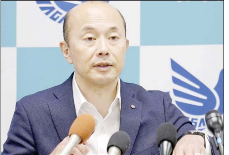
အဆိုပါနိုင်ငံများမှ သံတမန်များနှင့် တွေ့ဆုံပြီး ၎င်း၏ရည်ရွယ်ချက်အမှန်ကို ထုတ်ဖော်ပြောကြားကာ ဆက်ဆံရေးကောင်းမွန်မှုကို ဆက်လက်ထိန်းသိမ်း ထားရန် ဆန္ဒရှိကြောင်းလည်း ဆူရူကီးက ပြောသည်။ ကိုးကား - အင်န်အိတ်ချီကေ ဘာသာပြန် - အောင်ကျော်ကျော်

ဂျပန်နိုင်ငံဆိုင်ရာ အစွဲရေးသံအမတ်ကြီးကို မဖိတ်ကြားရန် ဆုံးဖြတ်ခဲ့သည့် အတွက် နာဂါဆာကီမြို့၌ ကျင်းပမည့် ငြိမ်းချမ်းရေး အခမ်းအနားသို့ အမေရိကန်၊ ဗြိတိန်နှင့် နိုင်ငံအချို့မှ သံတမန်များလည်း တက်ရောက်မည်မဟုတ်ကြောင်း သိရသည်။ ယခုနှစ်အတွက် ၎င်း၏ဆုံးဖြတ်ချက်ကြောင့် နိုင်ငံအချို့မှ သံတမန်များ တက်ရောက်နိုင်ဖွယ်မရှိသော်လည်း လာမည့်နှစ်များတွင် ပြန်လည်တက်ရောက်နိုင်မည်ဟု မျှော်လင့်ကြောင်း ဆူရူကီးက သတင်းထောက်များကို ပြောကြားသည်။ အမေရိကန်နှင့် ဗြိတိန်တို့သည် နာဂါဆာကီနှင့် ဂျပန်နိုင်ငံတို့အတွက် အရေးပါသည့် နိုင်ငံများဖြစ်ကြောင်းလည်း ၎င်းက ဆက်လက်ပြောသည်။