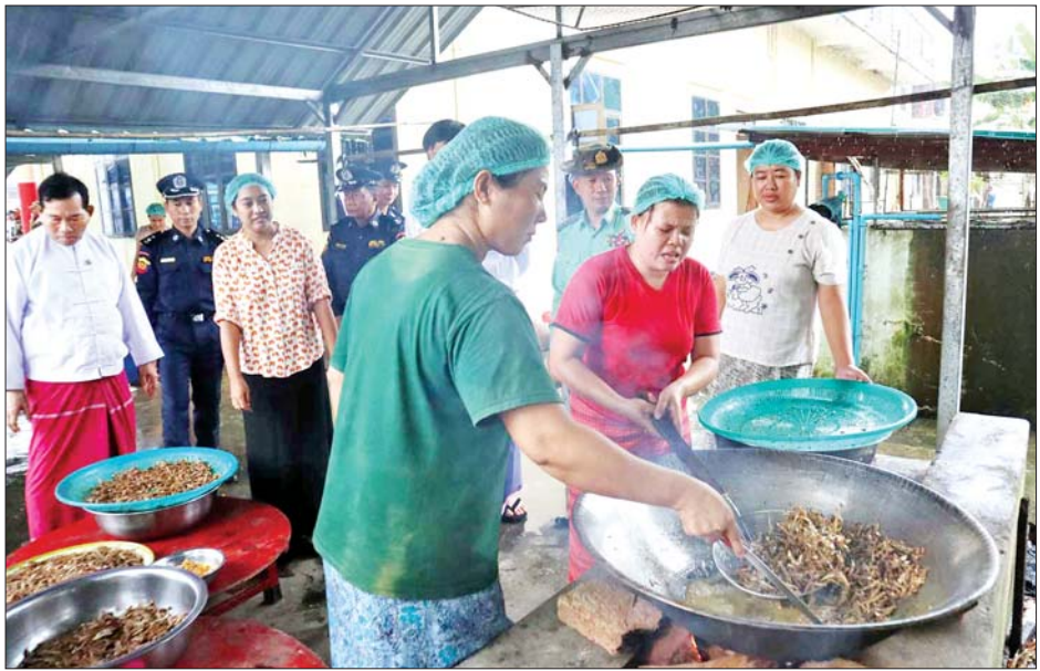
ရှေ့တန်းရောက် တပ်မတော်သားများနှင့် လုံခြုံရေးတပ်ဖွဲ့ဝင်များအတွက် စားသောက်ဖွယ်ရာများ ပေးပို့လှူဒါန်းရန် တနင်္သာရီတိုင်းဒေသကြီးအစိုးရအဖွဲ့နှင့် ဌာနဆိုင်ရာဝန်ထမ်းမိသားစုများက ကိုယ်တိုင်ချက်ပြုတ်ကြော်လှော်နေမှုကို တွေ့ရစဉ်။

တပ်မတော်သားများနှင့် လုံခြုံရေးတပ်ဖွဲ့ဝင်များ အတွက် စောတနာရှင် အလှူရှင်များက ဂုဏ်ပြုပေးအပ်သည့် အသင့်စားခေါက်ဆွဲထုပ်၊ လက်ဖက်ထုပ်၊ စာမျက်နှာ ၉ သို့