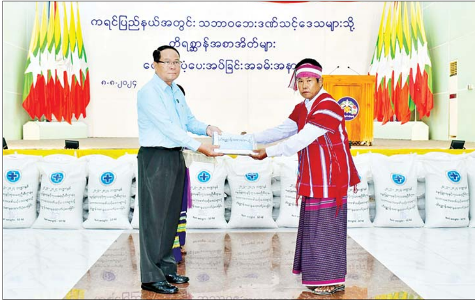
အနေဖြင့် အထောက်အကူဖြစ်မည်ဟု ယုံကြည်ကာ အလေအလွင့်မရှိအောင် စနစ်တကျအသုံးပြုပေးကြစေလိုကြောင်း ပြောကြားသည်။ ထို့နောက် ပြည်နယ်ဝန်ကြီးချုပ်၊ ပြည်နယ်

ကရင်ပြည်နယ်အတွင်း ရေကြီးရေလျှံမှုဖြစ်စဉ်များကြောင့် သဘာဝဘေးဒဏ်သင့်ဒေသများရှိ တိရစ္ဆာန်များအတွက် မွေးမြူရေးနှင့် ကုသရေးဦးစီးဌာနမှ တိရစ္ဆာန်အစာများ ထောက်ပံ့ပေးအပ်သည့် အခမ်းအနားကို ဩဂုတ် ၈ ရက် နံနက် ၁၀ နာရီက ဘားအံမြို့၊ ဇွဲကပင်ခန်းမ၌ ကျင်းပသည်။ ဦးစွာ ပြည်နယ်ဝန်ကြီးချုပ်က ပြည်နယ်အတွင်း ဧရိယာ ၂၅ ရက်မှစ၍ မိုးသည်ထန်စွာအဆက်မပြတ်ရွာသွန်းမှုကြောင့် မြစ်ရေကြီးခြင်းနှင့်အတူ ဘားအံမြို့တွင် သံလွင်မြစ်ရေသည် စိုးရိမ်ရေမှတ်အထက် ခုနစ်ပေခန့်ပေး မြင့်တက်ခဲ့ပြီး ယခုထက်တိုင် စိုးရိမ်ရေမှတ်အထက် ငါးပေ မြင့်တက်နေသေးသည့်အတွက် မြစ်ကမ်းဘေးဒေသများတွင် နေထိုင်သည့် လူနှင့် တိရစ္ဆာန်များပါ ရေဘေးဒဏ်ကိုထိခိုက်ခံစားခဲ့ရကြောင်း၊ ယခုဖြစ်ပေါ်ပေါက်သည့် အစာအိတ်များသည် မွေးမြူသူများအတွက် လိုအပ်ချက်အားလုံးကို မဖြည့်ဆည်းပေးနိုင်သော်လည်း တစ်စိတ်တစ်ပိုင်းအနေဖြင့် အထောက်အကူဖြစ်မည်ဟု ယုံကြည်ကာ အလေအလွင့်မရှိအောင် စနစ်တကျအသုံးပြုပေးကြစေလိုကြောင်း ပြောကြားသည်။ ထို့နောက် ပြည်နယ်ဝန်ကြီးချုပ်၊ ပြည်နယ်