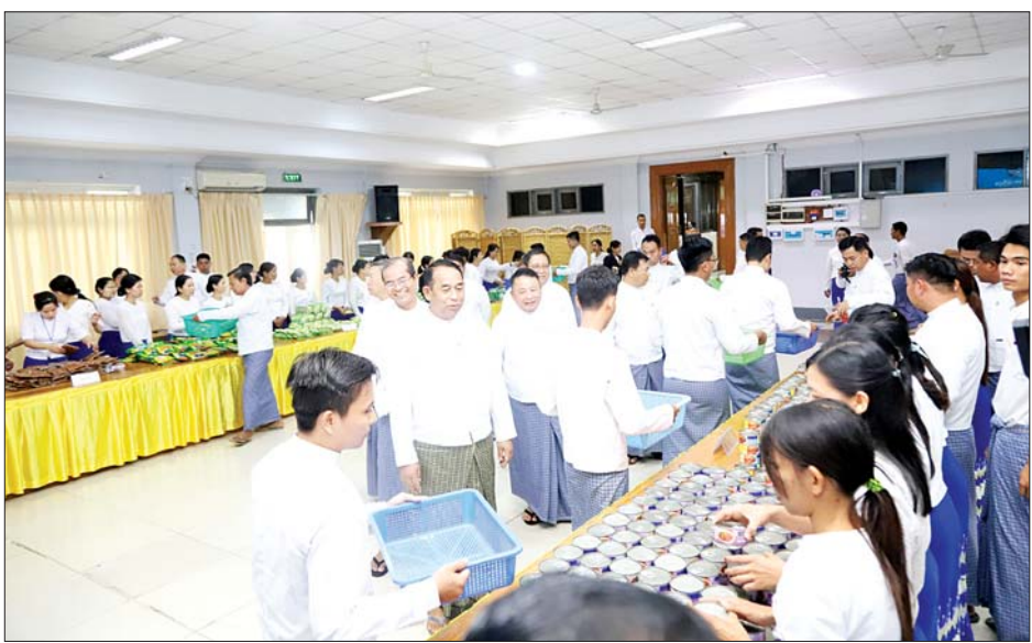
ပြည်ထောင်စုဝန်ကြီး ဦးမြင့်နောင် အလုပ်သမားဝန်ကြီးဌာနမှ ဝန်ထမ်းမိသားစုများက ရှေ့တန်းရောက်တပ်မတော်သားများနှင့် လုံခြုံရေးတပ်ဖွဲ့ဝင်များအတွက် အလှူငွေနှင့် စားသောက်ဖွယ်ရာများ ပေးပို့လှူဒါန်းရန် ပြင်ဆင်ထုပ်ပိုးနေမှုကို ကြည့်ရှုအားပေးစဉ်။

ဦးဝင်းရှိန်တို့က လိုက်လံကြည့်ရှုအားပေးကြသည်။ အလုပ်သမား ဝန်ကြီးဌာနမှ ဝန်ထမ်းမိသားစုများက ရှေ့တန်းရောက် တပ်မတော်သားများနှင့် လုံခြုံရေးတပ်ဖွဲ့ဝင်များ အတွက် စည်သူတံဘူး (ငါးကြင်းပဲငါးပိပေါင်း၊ ငါးဆုပ်ဟင်း၊ ဆိတ်သားဟင်း)ဘူး ၂၅၀၊ ဆားခင်းငါးသေတ္တာဘူး ၄၀၊ ငါးရုံ/ ကြက်သားဆန်ပြုတ်အထုပ် ၈၀၀၊ ရှူးရုံလက်ဖက်ထုပ် ၈၀၀၊ ကိုယ်တိုက်ဆပ်ပြာတုံး ၄၀၀၊ ဝှေးသီးငါးပိချက်ထုပ် ၄၀၀၊ ငါးပိရည် ၄၀၈ ထုပ်၊ ပုစွန်ငါးပိထောင်းဘူး ၄၀၀၊ အာပဲ့ခြောက်ကြော်ထုပ် ၄၀၀၊ ရုံးရည်ကြီးထုပ် ၄၀၀၊ ချိုချည်ထုပ် ၄၀၀၊ ဆေးလိပ်ဆေး ပိဿာ ၃၀၊ သွားတိုက်ဆေး/သွားတိုက်တံအစုံ ၄၀၀၊ တစ်ခါသုံး မုတ်ဆိတ်ရိတ်ခား ၁၆၀၀၊ ကြယ်နီ ဆေးလိပ် ၈၀၀၀ နှင့် ဝန်ထမ်းမိသားစုများ ကိုယ်တိုင်ချက်ပြုတ် ကြော်လှော်ထားသည့် ဗာလချောင်ကြော် ပိဿာ ၄၀ စုစုပေါင်းငွေကျပ် သိန်း ၁၃၀ ခန့် တန်ဖိုးရှိပစ္စည်းများကို ပေးပို့