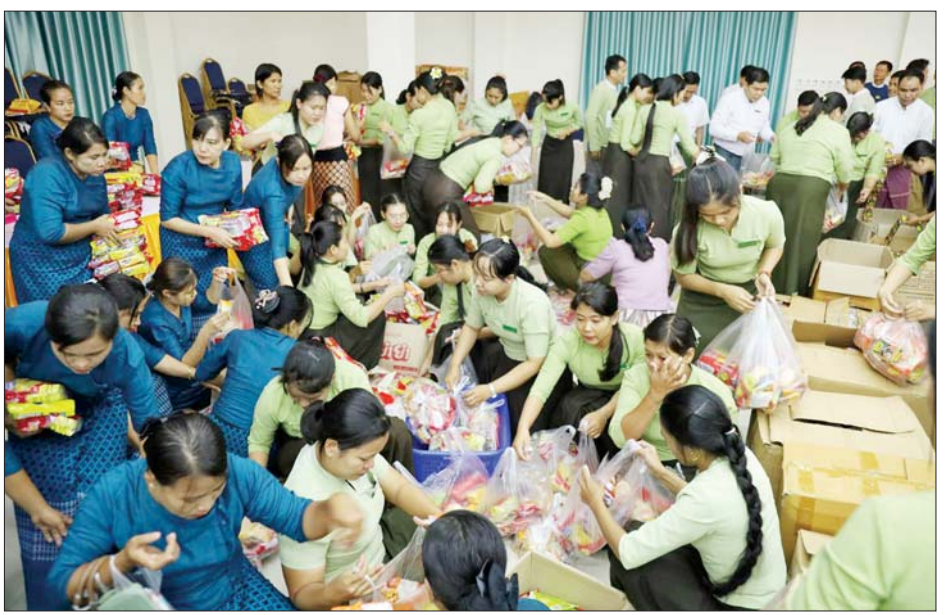
မွန်ပြည်နယ်အတွင်းမှ ဌာနဆိုင်ရာ ဝန်ထမ်းမိသားစုများက ရှေ့တန်းရောက် တပ်မတော်သားများနှင့် လုံခြုံရေးတပ်ဖွဲ့ဝင်များအတွက် စားသောက်ဖွယ်ရာများ ပေးပို့လှူဒါန်းရန် ပြင်ဆင်ထုပ်ပိုးနေမှုကို တွေ့ရစဉ်။

ချက်ပြုတ်ကြော်လှော်ပြီး ပြင်ဆင်ထုပ်ပိုးနေမှုများကို ပြည်ထောင်စုဝန်ကြီး ဦးမင်းသိန်းဇံနှင့် ဒုတိယဝန်ကြီးများက လိုက်လံကြည့်ရှုအားပေးကြသည်။ အားကစားနှင့် လူငယ်ရေးရာဝန်ကြီးဌာန ဝန်ထမ်းမိသားစုများက ရှေ့တန်းရောက် တပ်မတော်သားများနှင့် လုံခြုံရေးတပ်ဖွဲ့ဝင်များအတွက် ငါးခြောက်ကြော်ဘူး ၁၅၀၀၊ ပုစွန်ခြောက်ကြော် ဘူး ၁၅၀၀၊ ငါးပိထောင်းဘူး ၁၅၀၀၊ အသင့်စား ခေါက်ဆွဲခြောက်အထုပ် ၃၀၀၀၊ ကော်ဖီမစ် အထုပ် ၃၀၀၀၊ ချိုချည်အလုံး ၁၅၀၀ နှင့် ကြယ်နီဆေးပေါ့လိပ် အလိပ် ၁၀၀၀၀ စုစုပေါင်းငွေကျပ် ၁၁၂ သိန်း တန်ဖိုးရှိပစ္စည်းများကို ပေးပို့