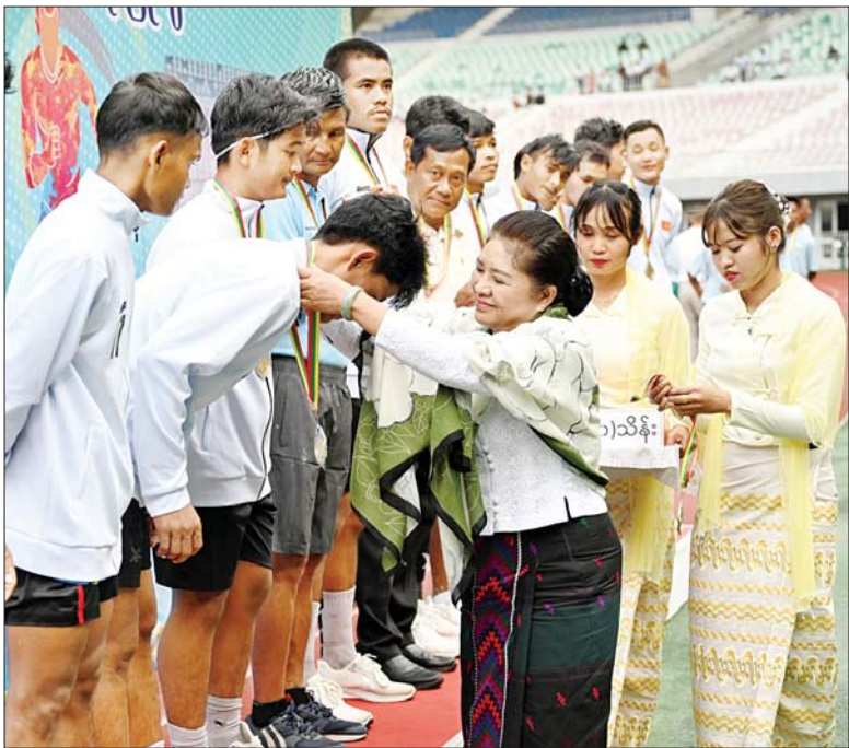
နိုင်ငံတော်စီမံအုပ်ချုပ်ရေးကောင်စီအဖွဲ့ဝင် ဒေါ်ခွဲဘူ ဒုတိယဆုရရှိသည့် မွန်ပြည်နယ်အသင်းအား တစ်ဦးချင်း ဂုဏ်ပြုဆုတံဆိပ်နှင့် ဂုဏ်ပြုဆုငွေ ပေးအပ် ချီးမြှင့်စဉ်။

ပေးအပ်ချီးမြှင့် ထို့နောက် ကောင်စီဝင် ဒေါက်တာမူထွန်းက စတုတ္ထဆုရရှိ သည့် ပြည်ထောင်စုနယ်မြေ နေပြည်တော်အသင်းကို လည်း ကောင်း၊ ကောင်စီဝင် ဝိုးရယ် အောင်သိန်းက တတိယဆုရရှိ သည့် ရန်ကုန်တိုင်းဒေသကြီး အသင်းကို လည်းကောင်း၊ ကောင်စီဝင် ဒေါ်ခွဲဘူက ဒုတိယ ဆုရရှိသည့် မွန်ပြည်နယ်အသင်း ကိုလည်းကောင်း တစ်ဦးချင်း ဂုဏ်ပြုဆုတံဆိပ်နှင့် ဂုဏ်ပြု ဆုငွေများကို ပေးအပ်ချီးမြှင့်ကြ သည်။ ယင်းနောက် နိုင်ငံတော်စီမံ