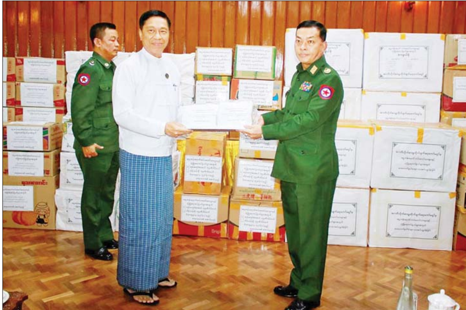
ပြည်ထောင်စုဝန်ကြီး ဒေါက်တာစိုးဝင်း လူမှုဝန်ထမ်း၊ ကယ်ဆယ်ရေးနှင့်ပြန်လည်နေရာချထားရေး ဝန်ကြီးဌာနမှ ဝန်ထမ်းမိသားစုများက လှူဒါန်းသည့် အလှူငွေနှင့် စားသောက်ဖွယ်ရာများ ပေးအပ်စဉ်။

ထိုသို့ပေးအပ်လှူဒါန်းရာတွင် လူမှုဝန်ထမ်း၊ ကယ်ဆယ်ရေးနှင့်ပြန်လည်နေရာချထားရေးဝန်ကြီး