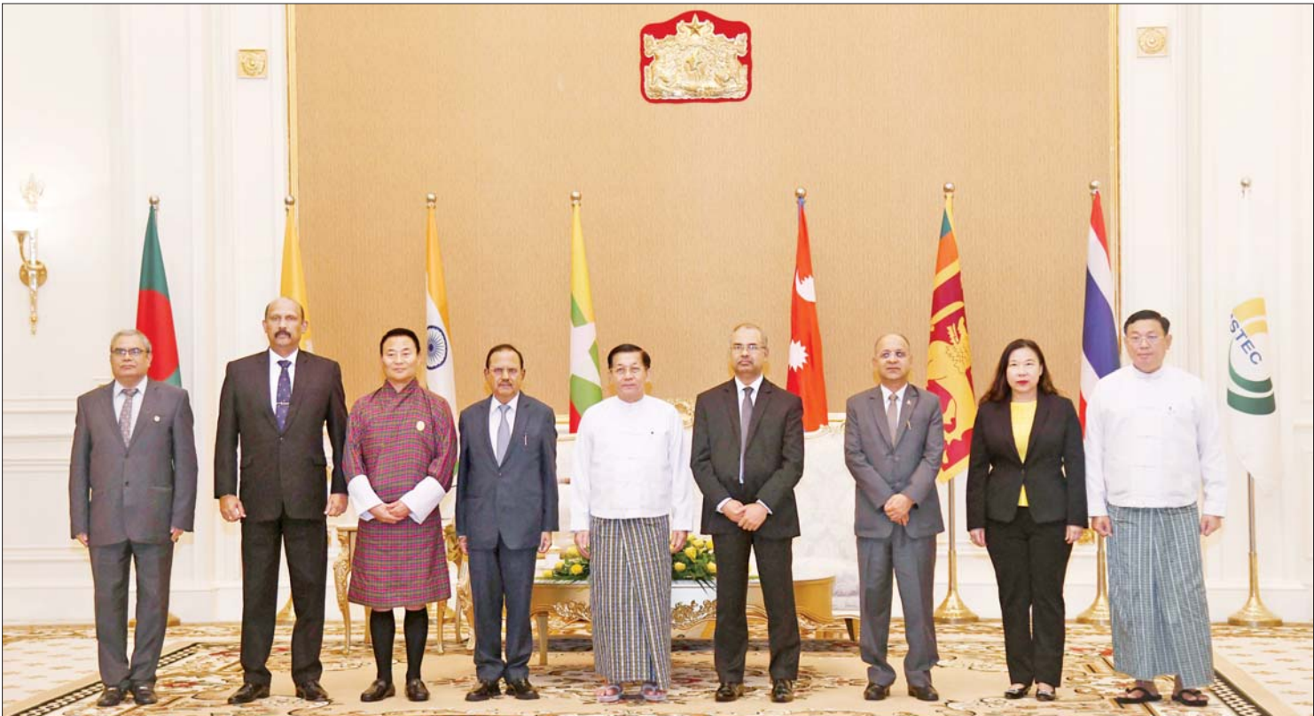
နိုင်ငံတော်စီမံအုပ်ချုပ်ရေးကောင်စီဥက္ကဋ္ဌ နိုင်ငံတော်ဝန်ကြီးချုပ် ဗိုလ်ချုပ်မှူးကြီးမင်းအောင်လှိုင် ဘင်းမိစတက်အဖွဲ့ဝင်နိုင်ငံများမှ အမျိုးသားလုံခြုံရေးဆိုင်ရာ အကြီးအကဲများ၊ ကိုယ်စားလှယ်များ၊ ဘင်းမိစတက်အတွင်းရေးမှူးချုပ်တို့နှင့်အတူ ဇူလိုင် ၂၅ ရက်က စုပေါင်းမှတ်တမ်းတင်ဓာတ်ပုံရိုက်စဉ်။

ဒီအစည်းအဝေးကို အဖွဲ့ဝင်နိုင်ငံတွေ ဖြစ်တဲ့ ဘင်္ဂလားဒေ့ရှ်၊ ဘူတန်၊ အိန္ဒိယ၊ နီပေါ၊ မြန်မာ၊ သီရိလင်္ကာ၊ ထိုင်းနိုင်ငံ တွေက အမျိုးသားလုံခြုံရေးဆိုင်ရာ အကြီးအကဲတွေ တက်ရောက်ခဲ့ကြပြီး အကြမ်းဖက်မှုတိုက်ဖျက်ရေးနှင့် မူးယစ်ဆေးဝါး တိုက်ဖျက်ရေးလုပ်ငန်းစဉ်တွေ၊ ရေကြောင်း လုံခြုံရေးဆိုင်ရာတွေနဲ့ ဆိုက်ဘာလုံခြုံရေးဆိုင်ရာ စီနီခေါ်မူတွေ၊ သက်ဆိုင်ရာ လုံခြုံရေးကဏ္ဍအလိုက် ထိရောက်သည့် သတင်းအချက်အလက် တွေ ပိုမိုပူးပေါင်းမျှဝေနိုင်ရေး၊ ဒေသတွင်း လက်ရှိဖြစ်ပေါ်နေတဲ့ လုံခြုံရေးဆိုင်ရာ အခြေအနေ၊ ကြုံတွေ့လာနိုင်တဲ့ လုံခြုံရေးဆိုင်ရာ စီနီခေါ်မူတွေအတွက် ကြိုတင်ပြင်ဆင်ထားရှိရမည့် အခြေအနေနဲ့ အကောင်အထည်ဖော်ဆောင်ရွက် ကြရမယ့် နည်းလမ်းတွေကို ရင်းနှီးပွင့်လင်းစွာ ဆွေးနွေးတင်ပြခဲ့ကြပါတယ်။