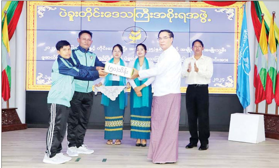
ဖူဆယ်အသင်းအနေဖြင့် သည်းခံနိုင်မှု၊ ကျွမ်းကျင်မှု၊ စိတ်ဓာတ်ကြံ့ခိုင်မှု၊ စည်းလုံးညီညွတ်မှု၊ စည်းကမ်း ရိုသေလိုက်နာမှု စသည့်အခြေခံကောင်းများကို အစွမ်းကုန်ဖော်ထုတ်ရင်း အနိုင်ရရှိရေးအတွက်

လူတစ်စု အားကစားမှ လူထုအားကစား ဦးစွာ တိုင်းဒေသကြီး ဝန်ကြီးချုပ် ဦးမျိုးဆွေဝင်း က မျိုးဆက်သစ် အားကစားသမားကောင်းများ ပေါ်ထွက်လာစေရေးအတွက် ရေရှည်အောင်မြင်မှုများ ဆက်လက်ထိန်းသိမ်းနိုင်ရေး အားကစားနည်း အလိုက် မြို့ပြနှင့် ကျေးလက်ဒေသမကျန် လူတစ်စု အားကစားမှ လူထုအားကစားအဖြစ် ဖော်ဆောင်သွား ရမည်ဖြစ်ကြောင်း၊ တိုင်းဒေသကြီးကိုယ်စားပြု