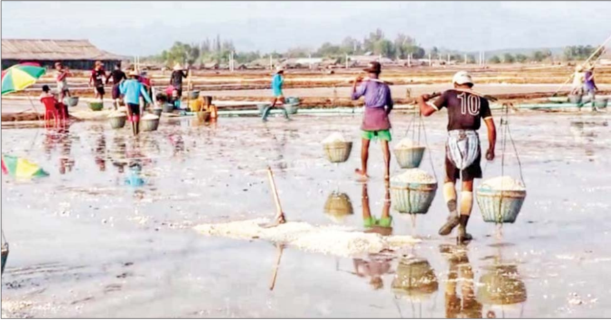
မွန်ပြည်နယ်ရှိ ဆားလုပ်ငန်းခွင်တစ်ခုကို တွေ့ရစဉ်။

မွန်ပြည်နယ်တွင် ၂၀၂၃-၂၀၂၄ ခုနှစ်၌ ဆားထုတ်လုပ်မှုကေ ၄၇၀၀ မှ ဆားတန်ချိန် ၄၅၀၀၀ ကျော်ထွက်ရှိကာ ပြည်တွင်းဆား စားသုံးမှု လုံလောက်စွာရရှိသည့်အပြင် ပြည်ပနိုင်ငံများသို့ တင်ပို့ရောင်းချနိုင်ရန် ကြိုးပမ်းဆောင်ရွက်လျက်ရှိသည်။ စာမျက်နှာ ၃ ကော်လံ ၁ သို့ ။