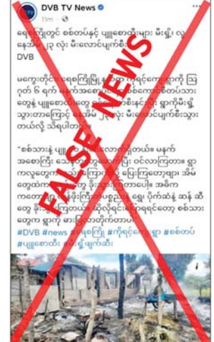
နေခြင်းသာဖြစ်ကြောင်း သိရသည်။

အတွင်း နေအိမ်များကို မီးရှို့ထွက်ပြေးသွားခဲ့ကြောင်း လုံခြုံရေးတာဝန်ရှိသူ တစ်ဦး၏ ပြောကြားချက်အရ သိရသည်။