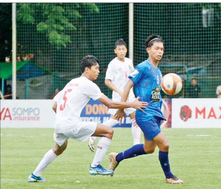
Junior Lions အသင်းနှင့် ဟံသာဝတီအသင်းတို့ ယှဉ်ပြိုင်ကစားကြစဉ်။