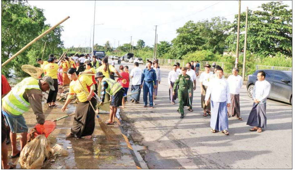
သယ်ဇာတအရင်းအမြစ်များ ရေရှည်တည်တံ့စေရန် ဖြစ်ပြီး တစ်လလျှင် နှစ်ကြိမ် လစဉ်ကျင်းပဆောင်ရွက်ရည်ရွယ်၍ စုပေါင်းသန့်ရှင်းရေးကို ဆောင်ရွက်ခြင်း သွားမည်ဖြစ်ကြောင်း သိရသည်။ ခရိုင်(ပြန်/ဆက်)

အားပေးသည်။ ထို့နောက် ပြည်နယ်ဝန်ကြီးချုပ်က ကမ်းနားလမ်းတစ်လျှောက် သန့်ရှင်းသာယာလှပရေး၊ အမှိုက်များ စည်းကမ်းမဲ့စွန့်ပစ်နေမှုများ မရှိစေရေး အထူးအလေးထားဆောင်ရွက်ပေးကြရန် လမ်းညွှန်မှာကြားပြီး ကမ်းနားလမ်းတစ်လျှောက် လှည့်လည်ကြည့်ရှုစစ်ဆေးရာ ပြည်နယ်ဝန်ကြီးချုပ်က မော်လမြိုင်မြို့ ကမ်းနားလမ်း သန့်ရှင်းသာယာလှပစေရေး တာဝန်ရှိသူများနှင့် တွေ့ဆုံ၍ လိုအပ်သည်များ ပေါင်းစပ်ညှိနှိုင်းဆောင်ရွက်ပေးသည်။ မွန်ပြည်နယ်အတွင်း ပင်လယ်ကမ်းရိုးတန်းဒေသများ သန့်ရှင်းသာယာလှပရေးနှင့် ကမ်းရိုးတန်း