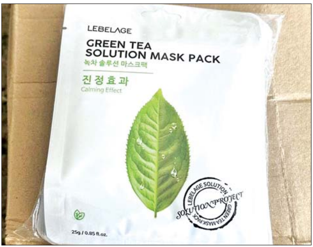
မွန်ပြည်နယ်၌ သိမ်းဆည်းရမိမှုကို တွေ့ရစဉ်။

နေပြည်တော် ဩဂုတ် ၇ တရားမဝင် ကုန်သွယ်မှု တိုက်ဖျက်ရေး ဦးဆောင် ကော်မတီ၏ ကြီးကြပ်ကွပ်ကဲမှု ဖြင့် တရားမဝင် ကုန်သွယ်မှုများကို ဥပဒေနှင့်အညီ ထိရောက်စွာ တားဆီး အရေးယူနိုင်ရေး ဆောင်ရွက်လျက်ရှိရာ ဩဂုတ် ၅ ရက်တွင် အကောက်ခွန်ဦးစီးဌာန ၏ စီမံခန့်ခွဲမှုဖြင့် တာဝန်ကျ ပူးပေါင်းအဖွဲ့က စစ်ဆေးမှုများ ဆောင်ရွက်ရာတွင် ရွာသာကြီး Dry Port ၌ ဘားအံမြို့မှ ရန်ကုန် မြို့သို့ မောင်းနှင်လာသည့် ယာဉ် တစ်စီးပေါ်မှ သွင်းကုန်ကြေညာ လွှာတွင် ကြေညာထားခြင်း မရှိ သည့် Gospower Lithium Battery အလုံး ၂၀ အပါအဝင် ကုန်ပစ္စည်းလေးမျိုး (ခန့်မှန်း တန်ဖိုးငွေကျပ် ၇၀၅၅၀၀၀)နှင့် အဆိုပါ ပစ္စည်းများတင်ဆောင် လာသည့် Hino Tractor Head တစ်စီးနှင့် နောက်တွဲယာဉ် တစ်စီး (ခန့်မှန်းတန်ဖိုး ငွေကျပ် ၉၀၀၀၀၀၀) စုစုပေါင်း ခန့်မှန်း တန်ဖိုးငွေကျပ် ၁၆၀၇၅၀၀၀ ကို သိမ်းဆည်းရမိခဲ့ပြီး အကောက်ခွန် လုပ်ထုံးလုပ်နည်းများနှင့်အညီ အရေးယူဆောင်ရွက်လျက်ရှိပါသည်။ ထို့အတူ ဩဂုတ် ၅ ရက်တွင် မွန်ပြည်နယ် တရားမဝင် ကုန်သွယ်မှုတိုက်ဖျက်ရေး အထူး အဖွဲ့၏ စီမံခန့်ခွဲမှုဖြင့် မော်လမြိုင် မြို့နယ် မန္တလေးရပ်ကွက် ဟင်္သာ အပိုင်အနီး၌ ယာဉ်တစ်စီးပေါ်မှ တရားဝင် စာရွက်စာတမ်း အထောက်အထား တင်ပြနိုင်ခြင်း မရှိသည့် ကိုရီးယားနိုင်ငံထုတ် အလှူကုန်ပစ္စည်း LEBELAGE Green Tea Solution Mask Pack ဘူး ၃၆၀ အပါအဝင် ကုန်ပစ္စည်း