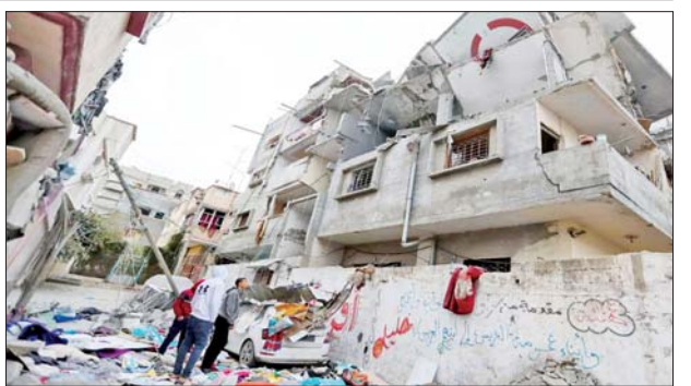
ဆောင်ရွက်ပေးရန် လုပ်ဆောင်လျက်ရှိသည်။ အစွဲအမိတ်သည် ဂါဇာကမ်းမြောက်တွင် ဟားမတ်စ်အဖွဲ့ကို ပြင်းပြင်း ထန်ထန် ထိုးစစ်ဆင်ခဲ့ရာ ၂၀၂၃ ခုနှစ် အောက်တိုဘာ ၇ ရက်မှ စတင်ကာ အစွဲအမိတ်တိုက်ခိုက်မှုများကြောင့် ပါလက်စတိုင်း ၃၉၀၀၀ ကျော် သေဆုံးပြီး အခြား ၉၀၀၀၀ ကျော် ဒဏ်ရာရရှိခဲ့ကြောင်း သိရသည်။ ကိုးကား - ဆင်ဟွာ ဘာသာပြန် - အလင်းသစ်

တီဘီရောဂါခံစားနေရသည်။ ကလေးငယ်များ သေဆုံးမှုသည် အိန္ဒိယမြို့တော်ရှိ ပြည်သူများကို တုန်လှုပ်ချောက်ချားစေခဲ့သည်။ စိတ်ပိုင်းဆိုင်ရာ အားနည်းချက်များရှိသည့် ကလေးများအတွက် ရည်ရွယ်ဖွင့်လှစ်သည့် ကလေး ထိန်းဂေဟာ "Asha Kiran" ကို ရိုဟ်နီဒေသရှိ ဒေလီ အစိုးရက တိုက်ရိုက်စီမံဆောင်ရွက်လျက်ရှိ သည်။ ကလေးငယ်များ သေဆုံးမှုဖြစ်ပွားပြီးနောက် ကလေးထိန်းဂေဟာ "Asha Kiran" ၏ လုပ်ဆောင် ချက်များကို ဒေသတွင်းမီဒီယာများက အနီးကပ် စောင့်ကြည့်လျက်ရှိကြောင်း သိရသည်။ ကိုးကား - ဆင်ဟွာ ဘာသာပြန် - အောင်ကျော်ကျော်