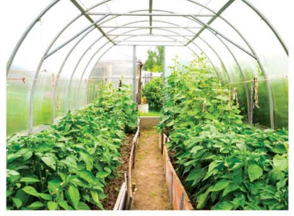
Figure 1.8 Horticulture