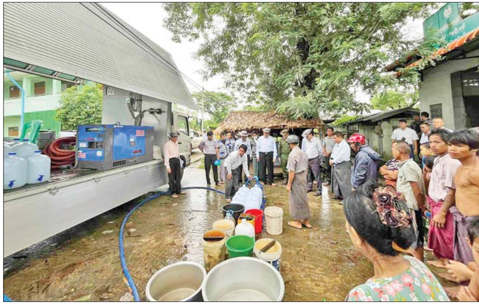
အသင်းမှ တာဝန်ရှိသူများ၊ ဆရာ ဆရာမများ စုပေါင်း၍ သန့်ရှင်းရေးပြုလုပ်နေမှုများကို ကွင်းဆင်းကြည့်ရှုစစ်ဆေးသည်။ ယင်းနောက် ကျောင်းဘေးရှိ ကျိုးရေထွက်ပေါက်အား ကြည့်ရှုစစ်ဆေးခဲ့ပြီး ရေစီးယင်းနောက် တိုင်းဒေသကြီးဝန်ကြီးချုပ်နှင့်

ထို့နောက် တိုင်းဒေသကြီးဝန်ကြီးချုပ်နှင့် အဖွဲ့သည် အမှတ် (၃) အခြေခံပညာအထက်တန်းကျောင်း၌ မီးသတ်တပ်ဖွဲ့ဝင်များ၊ ကျောင်းသား မိဘဆရာ