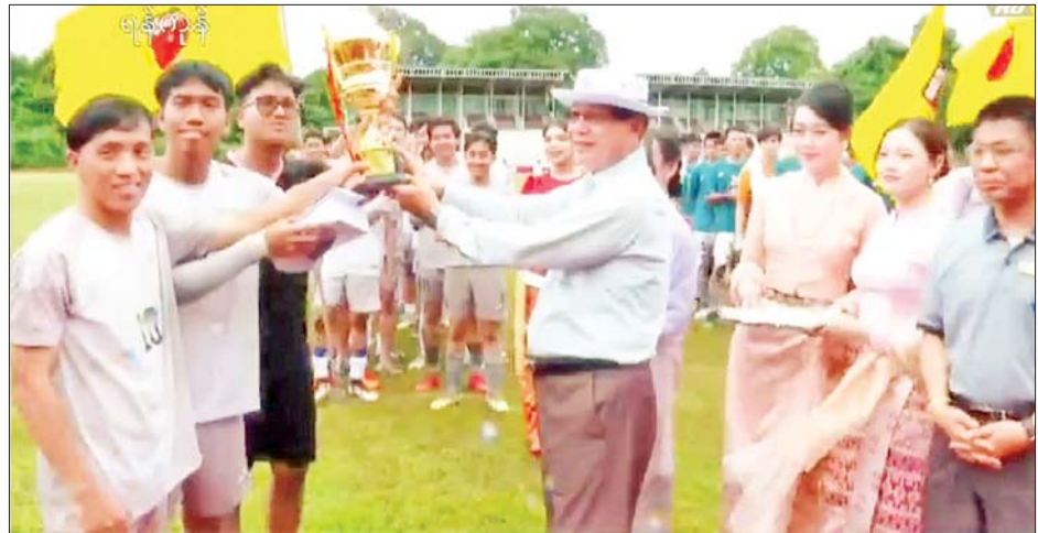
Tempest FC အသင်းအား ကြေးတံဆိပ်ဖလားနှင့် ငွေသားဆုကိုလည်းကောင်း၊ ဒုတိယဆုရရှိသော Royal Lion FC အသင်းအား ငွေတံဆိပ်ဖလား၊ တစ်ဦးချင်းငွေတံဆိပ်ဆုနှင့် ငွေသားဆုကိုလည်း ကောင်း၊ ပထမဆုရရှိသော Myriad FC အသင်းအား ပါမောက္ခချုပ်ဖလား၊ တစ်ဦးချင်းရွှေတံဆိပ်ဆုနှင့်

ဆက်လက်၍ ဆုချီးမြှင့်ပွဲကိုကျင်းပရာ ပွဲစဉ်များ တစ်လျှောက် အကောင်းဆုံးကစားသမားဆု၊ ဂိုးသွင်း အများဆုံးဆု၊ ရှေ့တန်းအကောင်းဆုံးကစားသမားဆု၊ အလယ်တန်း အကောင်းဆုံးကစားသမားဆု၊ နောက်တန်းအကောင်းဆုံးကစားသမားဆု၊ အကောင်း ဆုံးဂိုးသမားဆု၊ အသန်ရှင်းဆုံးအသင်း ဆုဖလားတို့ ကိုလည်းကောင်း၊ နှစ်သိမ့်ဆုရရှိသော Vanilla Muffin FC အသင်းအား နှစ်သိမ့်ဆုဖလားနှင့် ငွေသားဆုကိုလည်းကောင်း၊ တတိယဆုရရှိသော