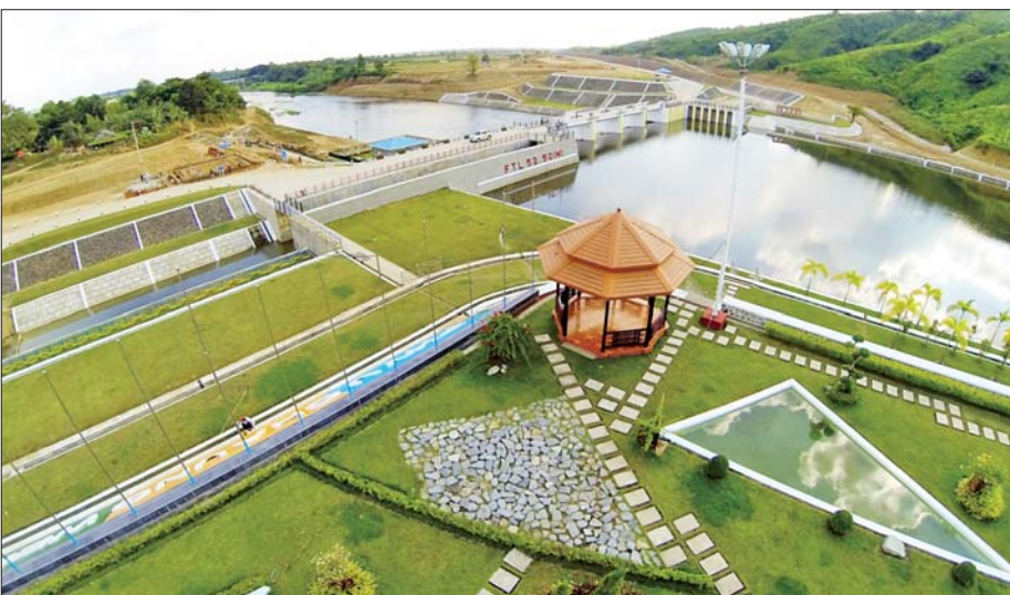
စိုက်ပျိုးရေးနှင့် ရေအားလျှပ်စစ်ထုတ်လုပ်မှုအတွက် အကျိုးပြုနေသည့် ဖြူးချောင်းရေလှောင်တံခံကို တွေ့ရစဉ်။

အေးမြသည့် ရေငွေ့တို့တိုးဝေမှုကြောင့် ကား အတွင်း အပူရှိန်လျော့ပါးလျက်ရှိရာ ခရီးသွားရသည် မှာ စိတ်အေးသက်သာရှိလှသည်။ မျက်စိတစ်ဆုံး မြင်တွေ့နေရသည့် အမြန်လမ်းမကြီးပေါ်တွင် ယာဉ် များသွားလာလျက်ရှိပြီး ဟိုတစ်ကွက် သည် တစ်ကွက် တိမ်ညိုတို့အုံ့ဆိုင်လျက် မိုးဖွံ့ရွာသွန်း နေသည့်အလှသည် မိုးရာသီ၏အရပ်ကို ပေါ်လွင်စေ လျက်ရှိသည်။ ယခုရက်ပိုင်း ရန်ကုန်မြို့တွင် မိုးမပြတ် ရွာသွန်းလျက်ရှိပြီး ပဲခူးတိုင်းဒေသကြီးတွင်လည်း ထိုနည်းတူပင်ဖြစ်သည်။ အမြန်လမ်းမကြီး တစ်လျှောက် ကားလမ်းဝဲ/ယာ သစ်ပင်တန်းများမှာ မိုးဖွံ့တို့ဆွတ်ဖျန်းထားမှုကြောင့် စိမ်းစိုလျက်ရှိပြီး သစ်ပင်အချို့အောက်တွင် ခရီးသွားယာဉ်အချို့ ရပ်တန့်၍ ခေတ္တအနားယူကြလျက်ရှိသည်။