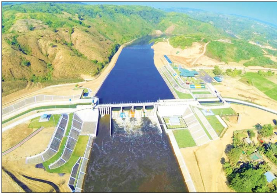
စိုက်ပျိုးရေးနှင့် ရေအားလျှပ်စစ်ထုတ်လုပ်မှုအတွက် အကျိုးပြုနေသည့် ဖြူးချောင်းရေလှောင်တံခံကို တွေ့ရစဉ်။

ဖြူးချောင်းရေလှောင်တံခံစီမံကိန်းတွင် လက်ရှိ လုပ်ငန်းပြီးစီးမှုအရ လယ်မြေဧက ၃၀၀၀၀ ကို ရေပေး ဝေလျက်ရှိပြီး လုပ်ငန်းအားလုံးပြီးစီးသွားပါက လယ်ဧက ၉၀၀၀၀ ကို ရေပေးဝေနိုင်မည်ဖြစ်သည်။ ဆည်ရေသောက်စနစ် တည်ဆောက်ခြင်းလုပ်ငန်း တွင် တူးမြောင်းမကြီး နှစ်ခု၊ မြောင်းခွဲတစ်ခု၊ လက်တံ မြောင်း ၂၄ ခု၊ လက်တံမြောင်းခွဲ ၂၀၆ ခုဖြင့် စုစုပေါင်း ၄၇၂ မိုင်နှင့် တူးမြောင်းအဆောက်အအုံ ၃၅၉၅ ခု ကိုလည်း အကောင်အထည်ဖော်တည်ဆောက်သွား မည်ဖြစ်ရာ လုပ်ငန်းပြီးစီးပါက ရာသီမပြတ်စိုက်ပျိုး ထုတ်လုပ်နိုင်သည့် အစိမ်းရောင်စီးပွားရေးမြို့တော် အဖြစ် တွေ့မြင်လာရမည်ဖြစ်သည်။