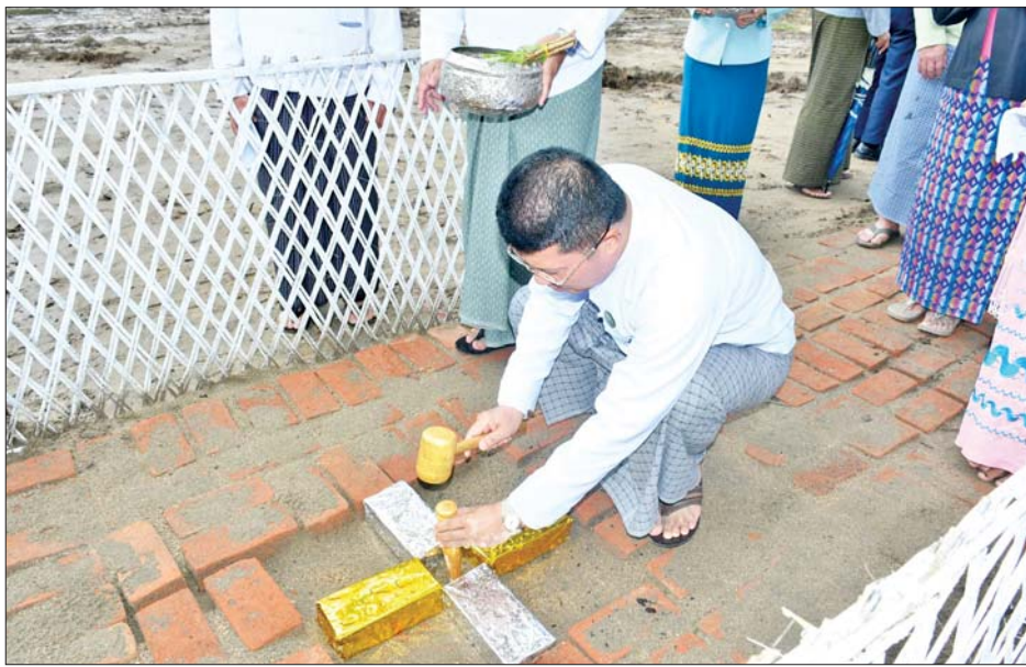
အဆောက်အအုံမြေနေရာကို ကြည့်ရှုစစ်ဆေးကာ လိုအပ်သည်များမှာကြားသည်။

အားကစားနှင့် လူငယ်ရေးရာဝန်ကြီးဌာန အားကစားနှင့်ကာယပညာသိပ္ပံ(ပုသိမ်) မိုးလုံလေလုံအားကစားရုံ ပေ(၁၂၀x၉၀) ပန္နက်တင်မင်္ဂလာအခမ်းအနားကို ယနေ့နံနက်ပိုင်းက ရာဝတီတိုင်းဒေသကြီး ပုသိမ်မြို့ ကြခတ်ချောင်ကျေးရွာရှိ အဆိုပါအဆောက်အအုံ ဆောက်လုပ်မည့်မြေနေရာ၌ ကျင်းပရာ ရာဝတီ တိုင်းဒေသကြီးဝန်ကြီးချုပ် ဦးတင်မောင်ဝင်း တက်ရောက်သည်။