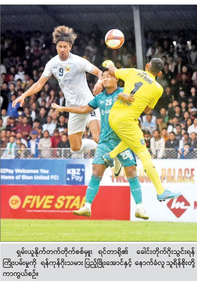
ရှမ်းယူနိုက်တက်တိုက်စစ်မှူး ရင်တာရီ၏ ခေါင်းတိုက်ဂိုးသွင်းရန် ကြိုးပမ်းမှုကို ရန်ကုန်ဂိုးသမား ပြည့်ဖြိုးအောင်နှင့် နောက်ခံလူ သူရိန်စိုးတို့ ကာကွယ်စဉ်။