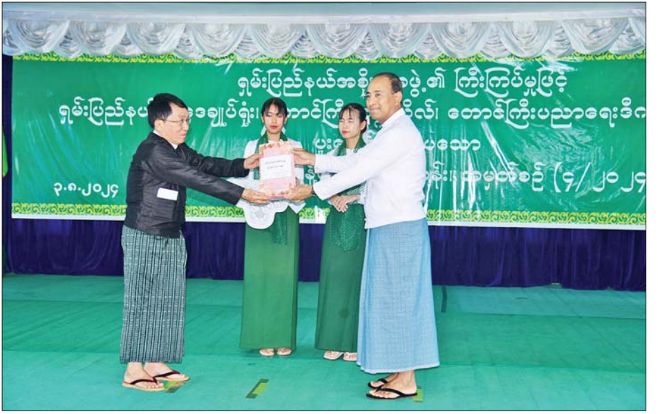
လူကုန်ကူးမှုတားဆီးနှိမ်နင်းရေးဥပဒေ၊ ရွေးကောက်ပွဲဆိုင်ရာသင်တန်းစာအုပ်များ၊ အဂတိလိုက်စားမှုတိုက်ဖျက်ရေးဥပဒေ၊ ရာဇသတ်ကြီးဘာသာရပ်များကို ဩဂုတ် ၃ ရက်မှ ၁၀ ရက်အထိ သင်ကြားပို့ချသွားမည် ဖြစ်ကြောင်း သိရသည်။ ပြည်နယ်(ပြန်/ဆက်)