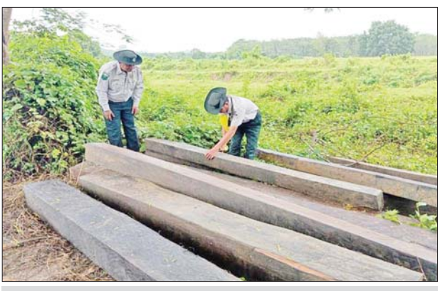
ပဲခူးတိုင်းဒေသကြီးမှ သိမ်းဆည်းရမိမှု။

နေပြည်တော် ဩဂုတ် ၄ တရားမဝင် ကုန်သွယ်မှု တိုက်ဖျက်ရေး ဦးဆောင် ကော်မတီ၏ ကြီးကြပ်ကွပ်ကဲမှု ဖြင့် တရားမဝင်ကုန်သွယ်မှုများ ကို ဥပဒေနှင့်အညီ ထိရောက်စွာ တားဆီးရေးယူနိုင်ရေး ဆောင်ရွက်လျက်ရှိရာ ပဲခူးတိုင်းဒေသကြီး တရားမဝင် ကုန်သွယ်မှု တိုက်ဖျက်ရေးအဖွဲ့၏ စီမံခန့်ခွဲမှုဖြင့် တာဝန်ကျပူးပေါင်း အဖွဲ့များက စစ်ဆေးမှုများ ဆောင်ရွက်ခဲ့ရာ ဩဂုတ် ၁ ရက်တွင် ပြည်ခရိုင်အတွင်း၌ တရားမဝင် ကျွန်းသစ် ၁၅ ဒသမ ၇၅၆ တန်နှင့် သစ်မာ သုည ဒသမ ၁၉၀ တန် (ခန့်မှန်းတန်ဖိုး ငွေကျပ် ၇၃၄၈၀၀) ကိုလည်းကောင်း၊ ဩဂုတ် ၂ ရက်တွင် ပဲခူးခရိုင်နှင့် တောင်ငူခရိုင်အတွင်း၌ တရားမဝင်ကျွန်းသစ် ၃ ဒသမ ၇၂၁ တန်၊ အခြားသစ် ၂ ဒသမ ၈၄၉ တန် (ခန့်မှန်းတန်ဖိုးငွေ ၂၁၁၃၆၅၃ ကျပ်) ကိုလည်းကောင်း စုစုပေါင်း ခန့်မှန်းတန်ဖိုးငွေ ၉၂၄၈၄၅၃ ကျပ်ကို သိမ်းဆည်းရမိခဲ့ပြီး သစ်တောဥပဒေနှင့်အညီ အရေးယူ ဆောင်ရွက်လျက်ရှိသည်။ ထို့အတူ ဩဂုတ် ၂ ရက်တွင် စစ်ကိုင်းတိုင်းဒေသကြီး တရားမဝင် ကုန်သွယ်မှုတိုက်ဖျက်ရေး အဖွဲ့၏ စီမံခန့်ခွဲမှုဖြင့် တာဝန်ကျ ပူးပေါင်းအဖွဲ့များက စစ်ဆေးမှုများ ဆောင်ရွက်ခဲ့ရာ ရတနာပုံတံတား ပူးပေါင်းစစ်ဆေး