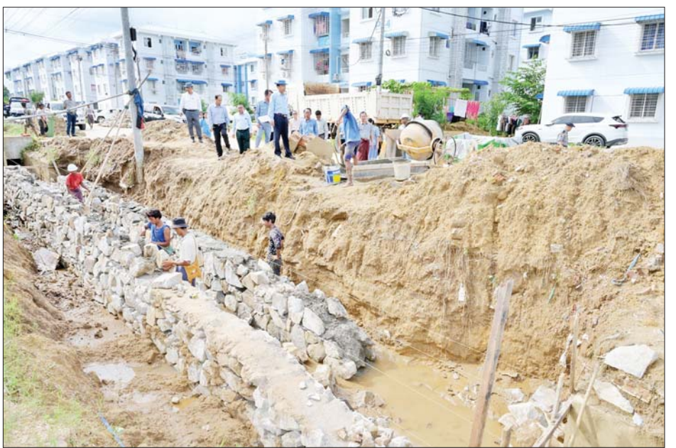
သွယ်တန်းထားရှိမှုနှင့် ဆက်လက်ဆောင်ရွက်မည့် လုပ်ငန်းများကို တာဝန်ရှိသူများက ရှင်းလင်းတင်ပြ ရာ မြို့တော်ဝန်က သုခတော်ဝင်အိမ်ရာအတွင်း ရေပြတ်လပ်မှုမရှိစေရေးနှင့် ရေရရှိမှုအခက်အခဲများမဖြစ်ပေါ်စေရေး စနစ်တကျစီမံဆောင်ရွက်ရန် မှာကြားခဲ့ကြောင်း သိရသည်။ သတင်းစဉ်

ရန်နှင့် စိုက်ပျိုးပြီးအပင်များ အမြန်ဆုံးရှင်သန်ကြီးထွားစေရေး ပေါင်းသင်၊ မြေဆွ၊ မြေဆွေးထည့်ခြင်း လုပ်ငန်းများကို စနစ်တကျဆောင်ရွက်ပြီး အပင်များရှင်သန်ကြီးထွားရေး အလေးထားဆောင်ရွက်ရန် မှာကြားသည်။ ဆက်လက်၍ ဇေယျာသီရိမြို့နယ် သုခသိဒ္ဓိရပ်ကွက် ပျဉ်းမနား-တောင်ညို လမ်းဘေးရှိ သုခတော်ဝင်အိမ်ရာ အပိုင်း(၁)အတွင်း ကျောက်စီရေမြောင်း ဆောင်ရွက်နေမှု အခြေအနေများကို ကြည့်ရှုစစ်ဆေးသည်။ ထို့နောက်သုခတော်ဝင်အိမ်ရာအတွင်းရှိ ရေပေးဝေရေးစက်ရုံသို့ သွားရောက်ကြည့်ရှုစစ်ဆေးရာ သုခတော်ဝင်အိမ်ရာအပိုင်း(၁)ရှိ ရေပေးဝေရေးစက်ရုံနှင့် အပိုင်း(၂)သို့ ရေပေးဝေရေး ဆောင်ရွက်ရန်အတွက် ပင်မပိုက်လိုင်း