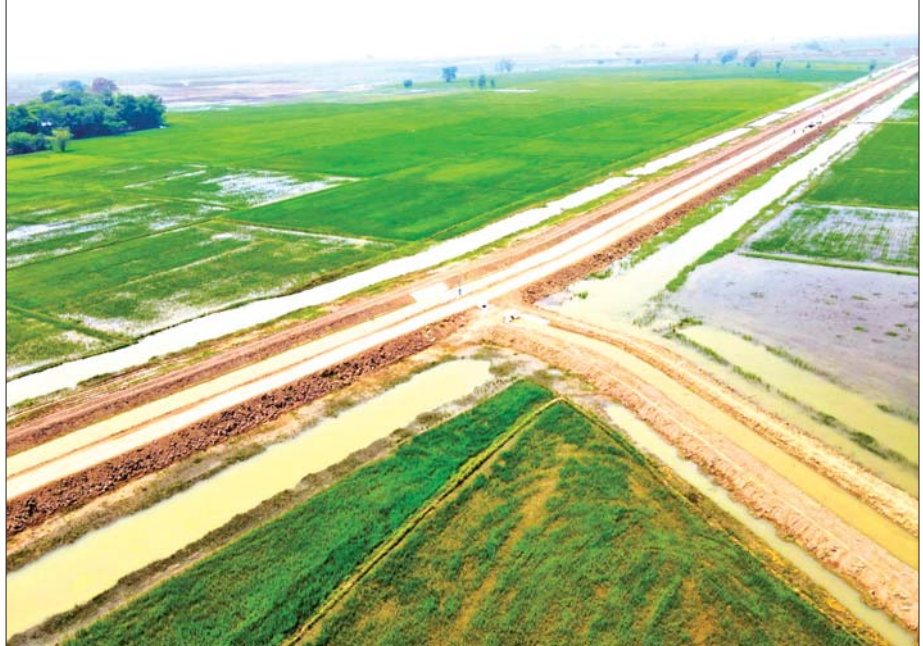
ဖြူးမြို့နယ်၌ မိုးရာသီစိုက်ပျိုးထားသည့် စပါးခင်းများကိုတွေ့ရစဉ်။

ဆည်ရေသောက်စနစ်အပြင် ရေအားလျှပ်စစ် ဓာတ်အားပေးစက်ရုံ တည်ဆောက်ခြင်းကို ၂၀၀၁ ခုနှစ်တွင် စတင်ဆောင်ရွက်ခဲ့ပြီး ၂၀၁၄ ခုနှစ် ဩဂုတ် လတွင် လုပ်ငန်းများ ရာနှုန်းပြည့်ပြီးစီးသည့်အတွက် ဩဂုတ်လ ၂၉ ရက်နေ့၌ ၂၀ မဂ္ဂါဝပ် နှစ်လုံးဖြင့် လျှပ်စစ်ဓာတ်အား စတင်ပို့လွှတ်နိုင်ခဲ့သည်။ ဖြူးချောင်းရေလှောင်တံခံသည် အလယ်ရိုးမမှ စီးဆင်းလာသောရေကို သိုလှောင်ထိန်းညှိပေးနိုင် မှုဖြင့် ဖြူးမြို့နယ်နှင့် အုတ်တွင်းမြို့နယ်တို့၏ စိုက်ပျိုးရေးနှင့်မွေးမြူရေးကဏ္ဍသာမက လျှပ်စစ် ဓာတ်အားထုတ်လုပ်ပေးရာ ရေလှောင်တံခံတစ်ခု အဖြစ် နိုင်ငံနှင့်ပြည်သူကို အကျိုးပြုလျက်ရှိသည်။ စာမျက်နှာ ၇ သို့ □