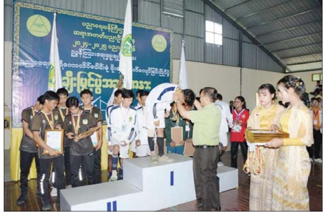
ဆုနှင့် ညွှန်ကြားရေးမှူးချုပ်ဖလား ပိုက်ကျော်ခြင်း တံခွန်စိုက်ဆုရရှိသည့် မြောင်းမြအသင်းတို့ကို အသီးသီးပေးအပ်ခဲ့ကြောင်း သိရသည်။ ခရိုင်(ပြန်/ဆက်)