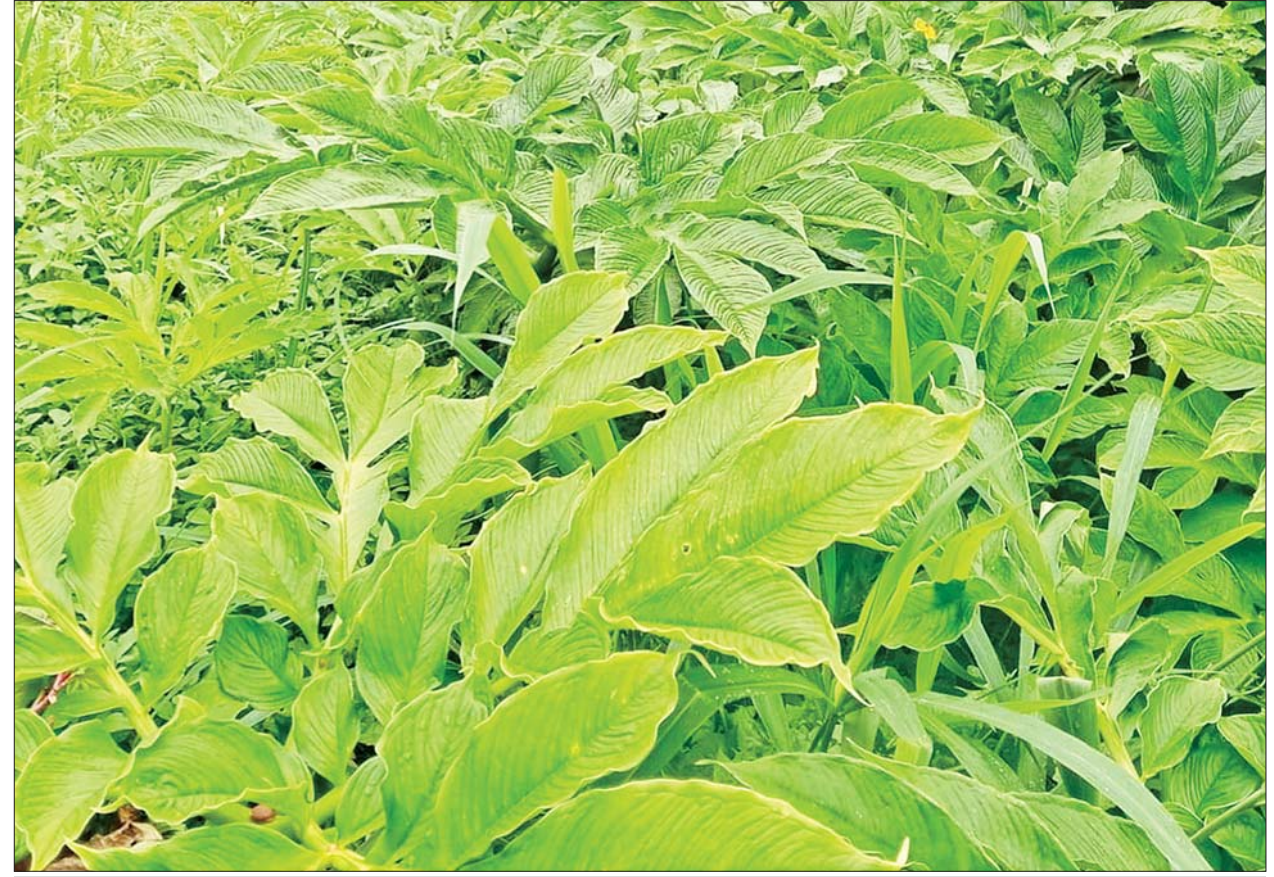
ငမဲမြို့နယ် တောင်ပေါ်ဒေသ လင်းတဲကျေးရွာတွင် စိုက်ပျိုးအောင်မြင်ဖြစ်ထွန်းလျက်ရှိသည့် ဝဥပင်များကို တွေ့ရစဉ်။