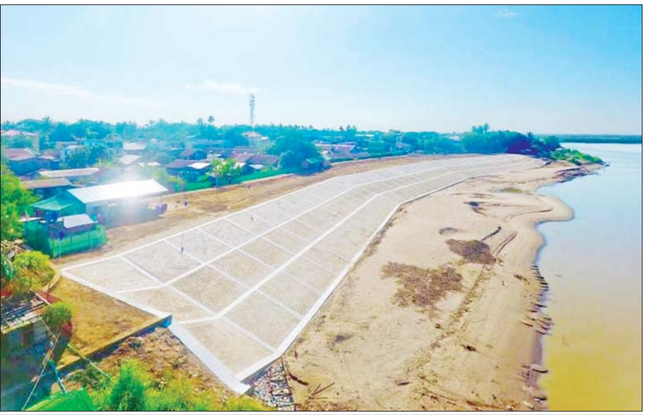
ဇလွန်မြို့၌ မြစ်ရေတိုက်စားမှုကြောင့် ကမ်းပြိုကာကွယ်ရေး ကျောက်စီတံဆံ ဆောင်ရွက်ထားမှုကို တွေ့ရစဉ်။

ရေ၏အကျိုးစီးပွားသည် မကုန်နိုင်များပြားသကဲ့သို့ နူးညံ့ပျော့ပျောင်းသည်ထင်ရသော ရေ၏ အဖျက်စွမ်းအားသည်လည်း လွန်စွာကြီးမားပါသည်။ တွေ့ရှိမှုများအရ အလွန်လျင်မြန်စွာ စီးဆင်းလာသော ရေအနက် ခြောက်လက်မခန့်သည် လူတစ်ဦးအား လဲကျမျောပါသွားစေနိုင်သကဲ့သို့ ထိုရေအနက် နှစ်ပေခန့်သည် ကားတစ်စီးကို မျောပါသွားစေနိုင်ပါသည်။ ရေကြီးမှုဖြစ်ပွားပါက လူ၊ တိရစ္ဆာန်နှင့် အဆောက်အအုံများပျက်စီးခြင်း၊ သီးနှံရိက္ခာများ ပျက်စီးခြင်း၊ လမ်းပန်းဆက်သွယ်ရေး ပြတ်တောက်ခြင်း၊ အခြေခံစားသောက်ကုန်များ ဈေးတက်ခြင်း၊ အလုပ်အကိုင်ဆုံးရှုံးခြင်း၊ ကူးစက်ရောဂါများ ဖြစ်ပွားခြင်း စသည်ဖြင့် ဆိုးကျိုးများစွာတွေ့ကြုံရပါသည်။