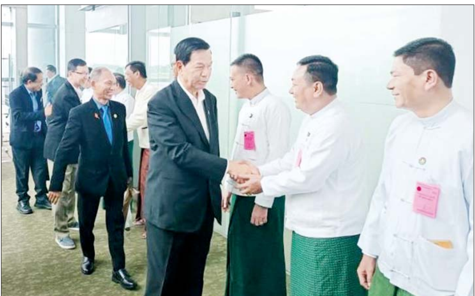
လေ့လာရေးခရီးခွဲကြပြီး တရုတ် မူလေ့ထုံးစံများ အပါအဝင် ရောက် လေ့လာခဲ့ကြကြောင်း ပြည်သူ့သမ္မတနိုင်ငံ၏ ယဉ်ကျေး အထင်ကရနေရာများသို့ သွား သိရသည်။ သတင်းစဉ်

တိုးတက်ရေး ဆောင်ရွက်နေမှု၊ တရုတ်-တောင်အာရှ ကုန်စည်ပြပွဲ၊ တရုတ်-ကုမင်း သွင်းကုန်၊ ပို့ကုန် ကုန်စည်ပြပွဲ၊ တိုင်းရင်းသား လူမျိုးများနှင့် မျိုးနွယ်စုဆိုင်ရာ မူဝါဒချမှတ်မှုဆိုင်ရာ ဆွေးနွေးပွဲ၊ ယူနက်ပြည်နယ် မဟာလျှပ်စစ်ဓာတ်အားလိုင်း ကွန်ရက်တည်ဆောက်မှု အခြေအနေများနှင့် တရုတ်ကွန်မြူနစ်ပါတီ ပြတိုက်တို့သို့ သွားရောက်ကြည့်ရှု