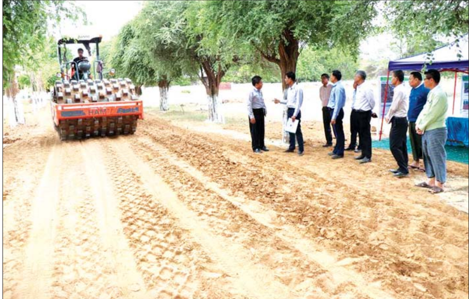
အရှေ့ဖွားစောကျေးရွာ အဝင်လမ်းအား နှစ်ပေ မြေသားဒုတင်နေသည့်လုပ်ငန်းကို ကြည့်ရှုစစ်ဆေးစဉ်။

သင်တန်းပို့ချပေးမည် ပုဂံမှပြန်လာချိန် ပြည်ထောင်စုဝန်ကြီးထံ သတင်းပို့ပြီး သင်တန်းဖွင့်လှစ်ပေးနိုင်ရေး စီစဉ် ဆောင်ရွက်ခဲ့သည်။ ဝန်ကြီးက အိတ်ပိတ်စက်ပါ ထောက်ပံ့ပေးရန် မှာကြားပါသည်။ အသေးစား စက်မှုလက်မှုလုပ်ငန်းဦးစီးဌာန၏ ရည်ရွယ်ချက်များ အတိုင်း မဇ္ဈသကနတ်ပန်း အခြေခံတန်ဖိုးမြှင့် ထုတ်ကုန်များ ထုတ်လုပ်နိုင်စေရန်၊ ကျန်းမာရေးနှင့် ညီညွတ်ပြီး ဘေးကင်းသော ထုတ်ကုန်ပစ္စည်း ဖြစ်စေရန်၊ အလုပ်အကိုင်အခွင့်အလမ်း ပေါများစေ ရေးနှင့် မိသားစုဝင်ငွေတိုးရေး အစရှိသော ရည်ရွယ် ချက်များဖြင့် လောကနန္ဒာစွယ်တော်မြတ်စေတီ၏ အရိပ်အာဝါသအောက်တွင် နေရာတစ်ခုစီစဉ်၍ မဇ္ဈသကနတ်ပန်း အခြေခံတန်ဖိုးမြှင့် ထုတ်ကုန်ပစ္စည်း များထုတ်လုပ်မှု နည်းပညာသင်တန်းတစ်ခု ဖွင့်လှစ် ပေးပါမည်။ မျက်နှာသစ်ဆပ်ပြာခဲ၊ ဆံသားအားဖြည့် ဆီ၊ ခေါင်းလျှော်ရည်၊ စာမျက်နှာ ၁၁ သို့ ၀