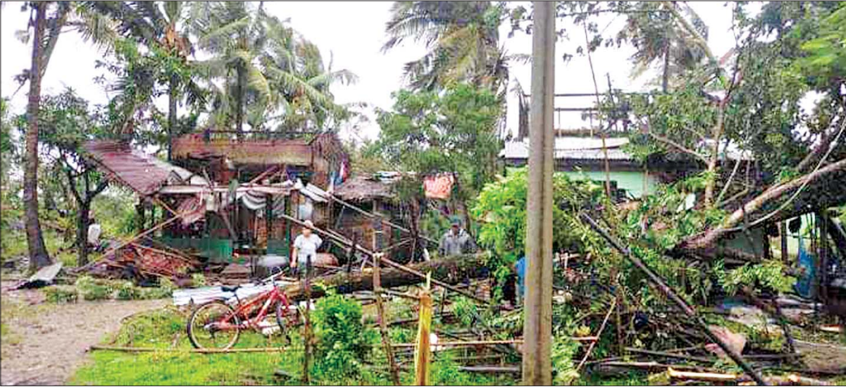
ကွမ်းခြံကုန်းမြို့နယ်၌ လေဆင်နှာမောင်းကြောင့် ထိခိုက်ပျက်စီးသွားသည့် နေအိမ်အချို့ကို တွေ့ရစဉ်။