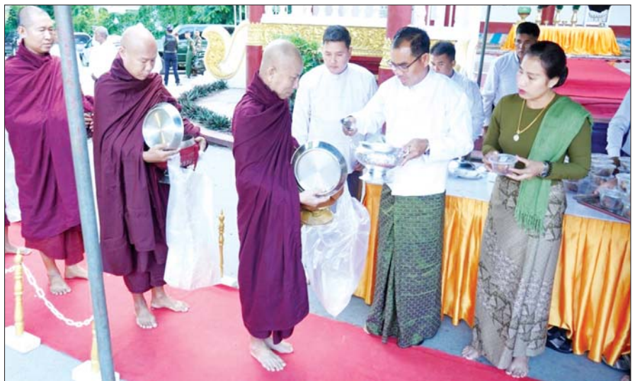
ဒုတိယတိုင်းမှူးနှင့် ဌာနဆိုင်ရာဝန်ထမ်းများ၊ ဆွမ်းဆန်တော်၊ လှူဖွယ်ပစ္စည်းများ၊ ဝတ္ထုငွေများ လောင်းလှူခဲ့ကြကြောင်း သိရသည်။ သတင်းစဉ်

နေပြည်တော် ဇူလိုင် ၂၇ ရှမ်းပြည်နယ်(အရှေ့ပိုင်း) ကျိုင်းတုံမြို့ ခေမရဋ္ဌဗျာဒိတ်တော်ပေး ရပ်တော်မူဘုရားကြီး၌ ဌာနဆိုင်ရာများစုပေါင်း၍ သံဃာတော်များနှင့် သာသနာ့နွယ်ဝင်သီလရှင်များအား ဝါတွင်းကာလ ဆွမ်းဆန်တော်လောင်းလှူပွဲကို ယနေ့နံနက်ပိုင်းတွင် အဆိုပါရပ်တော်မူဘုရားကြီး၌ ပြုလုပ်ရာ တြိဂံဒေသတိုင်းစစ်ဌာနချုပ် ဒုတိယတိုင်းမှူးနှင့် ဌာနဆိုင်ရာဝန်ထမ်းများ၊ ဒေသခံတိုင်းရင်းသား ပြည်သူများ တက်ရောက်ကြသည်။ အပါး ၃၀၀ ကြွရောက်တော်မူ အဆိုပါဝါတွင်းကာလ ဆွမ်းဆန်တော်လောင်း လှူပွဲသို့ ကျိုင်းတုံမြို့ရှိ ဘုန်းတော်ကြီးကျောင်း ၄၀ နှင့် သီလရှင်ကျောင်း တစ်ကျောင်းတို့မှ သံဃာတော်များနှင့် သာသနာ့နွယ်ဝင်သီလရှင် စုစုပေါင်းအပါး ၃၀၀ ကြွရောက်တော်မူကြပြီး