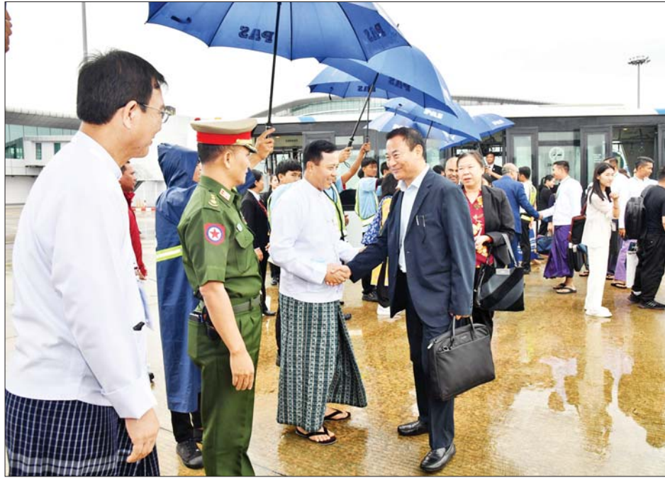
ဘူတန်နိုင်ငံမှ အမျိုးသားလုံခြုံရေးဆိုင်ရာ အကြီးအကဲနှင့်အဖွဲ့ နေပြည်တော်မှ ပြန်လည်ထွက်ခွာစဉ်။

၂၆ ရက် မွန်းလွဲပိုင်းတွင် ဟန့်ရှင်း မြို့ရှိ အမျိုးသားဈာပနခန်းမ၌ ကျင်းပပြုလုပ်သည့် အောက်မေ့ ဖွယ်အခမ်းအနားသို့ တက်ရောက် ခဲ့ပြီး အဆိုပါ အခမ်းအနားတွင် ဗီယက်နမ် ဆိုရှယ်လစ်သမ္မတ နိုင်ငံ သမ္မတ H. E. Mr. To Lam က ကွယ်လွန်သူ သက်ရှိထင်ရှား