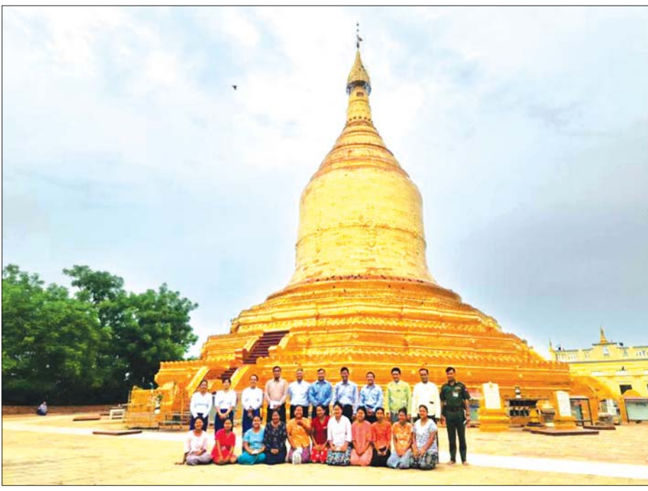
လောကနန္ဒာစွယ်တော်မြတ်စေတီအား ဖူးမြော်၍ အမှတ်တရဓာတ်ပုံရိုက်စဉ်။

“ကျေးဇူးတင်တယ် သမီးရေ၊ အဘ အိမ်ပြန် ရောက်တော့ အထုပ်မှာပါတဲ့ အညွှန်းအတိုင်း နှလုံး အားကောင်းအောင် မျက်စိကြည့်အောင်၊ အမောပြေ ခြင်း၊ ခန္ဓာကိုယ်နုပျိုခြင်းတို့နဲ့ ပြည့်စုံအောင် ပျားရည်နဲ့ရောပြီး စားလိုက်တာပေါ့ကွယ်။ စားလို့ ကောင်းပါတယ်။ အဘတို့ ငယ်ငယ်တုန်းကလည်း မဇ္ဈသကနတ်ပန်းပွင့်လေးတွေ ကောက်ပြီး စားဖူး နေလို့ ချိုအိအိအရသာလေးကို မှတ်မိနေတယ်။