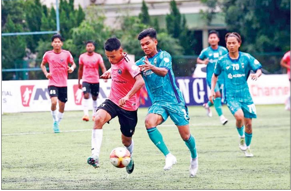
ရန်ကုန်ယူနိုက်တက်အသင်းနှင့် မဟာယူနိုက်တက်အသင်းတို့ ယှဉ်ပြိုင်ကစားကြစဉ်။

YUSC ကွင်း၌ ကျင်းပသည့် ပွဲတွင် ရန်ကုန်ယူနိုက်တက်အသင်းက မဟာယူနိုက်တက်အသင်းကို တစ်ဂိုး-ဂိုးမရှိဖြင့် အနိုင်ရခဲ့သည်။ ရန်ကုန်ယူနိုက်တက်အသင်းသည် ဒုတိယပိုင်းတွင် သွင်းယူသည့် ပင်နယ်တီဂိုးဖြင့် နိုင်ပွဲပြန်လည်ရယူနိုင်ခဲ့ခြင်းဖြစ်သည်။ ရန်ကုန်ယူနိုက်တက်အသင်းသည် ယခု နိုင်ပွဲကြောင့် လက်ရှိချန်ပီယံ စာမျက်နှာ ၂၅ ကော်လံ ၁ သို့ ■