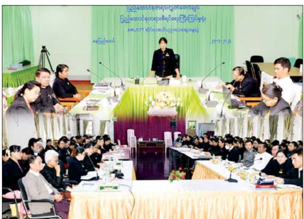
ညွှန်ကြားရေးမှူးချုပ်နှင့် တာဝန် ဆွေးနွေးသည်။ ရှိသူများက ပြန်လည်ရှင်းလင်း အောင်မြင်(ပြန်/ဆက်)

နေပြည်တော် ဇူလိုင် ၂၇ ချုပ် ဒေါ်တင်နွယ်စိုးက အမှာ AML/CFT ဆိုင်ရာ အသိပညာ ပေး ဆွေးနွေးပွဲကို ပြည်ထောင်စု အဆိုပါဆွေးနွေးပွဲတွင် ရှေ့နေ တရားစီရင်ရေး ကြီးကြပ်မှုရုံး ကျွေးရပ်များ လိုက်နာရမည့် ညွှန်ကြားရေးမှူးချုပ် အစည်းအဝေးခန်းမ၌ ယနေ့နံနက် ၉ နာရီ တွင် ပူးတွဲစနစ်(In-person/ Virtual)ဖြင့် ကျင်းပရာ ပြည်ထောင်စု တရားလွှတ်တော် ချုပ် ပြည်ထောင်စုတရားစီရင်ရေး ကြီးကြပ်မှုရုံး ညွှန်ကြားရေးမှူးချုပ် များ သတင်းပေးပို့ခြင်းတို့ကို