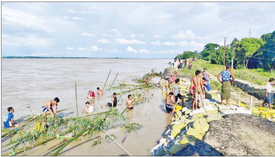
ဇူလိုင် ၂၂ ရက်က ဧရာဝတီမြစ်ရေမြင့်တက်လာမှုကြောင့် မြန်အောင်မြို့ မကျီးစုတာ ကမ်းခြေ ကာကွယ်ရေးလုပ်ငန်း ဆောင်ရွက်စဉ်။

မြစ်ရေမှတ်သည် တာဝန်တစ်ခုချင်းအလိုက် သတ်မှတ်ထားသော စိုးရိမ်ရေမှတ်သို့ရောက်ရှိခြင်း၊ တာဝန်ကိုယ်ထည်၏ အောက်ဘက် (Downstream) ပိုင်းမှ ရေစိမ့်ထွက်ခြင်းနှင့် ရေပေါက် (ထူးပေါက်)များဖြစ်ပေါ်ခြင်း၊ သဲဗွတ်များဖြစ်ပေါ်လာခြင်း၊ တာဝန်ကိုယ်ထည်တွင် ရေစိမ့်ထွက်မှု