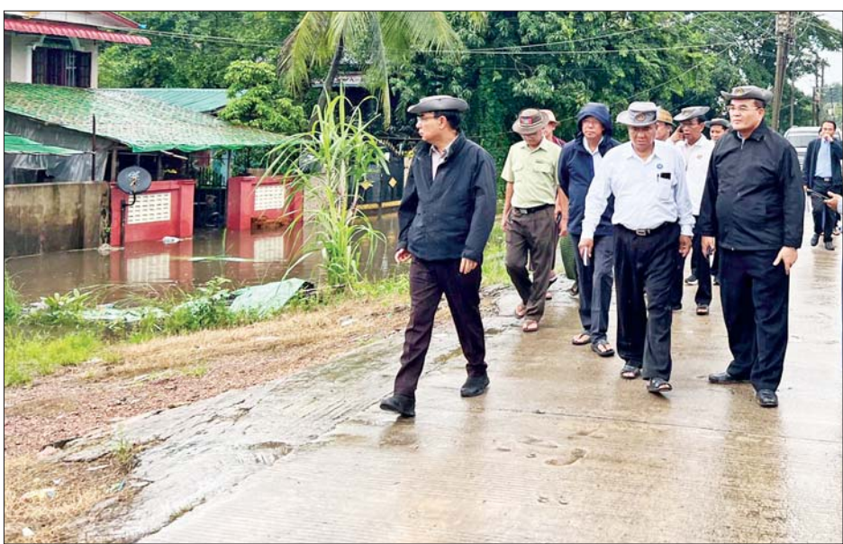
ယင်းနောက် တိုင်းဒေသကြီးဝန်ကြီးချုပ် အခြေအနေအား ကြည့်ရှုစစ်ဆေးခဲ့ကြောင်း သိရဦးမျိုးဆွေဝင်းသည် ပဲခူးမြစ်ရေ ဝင်ရောက်နေမှု သည်။ တိုင်းဒေသကြီး(ပြန်/ဆက်)

ထို့နောက် တိုင်းဒေသကြီးဝန်ကြီးချုပ်နှင့်အဖွဲ့သည် ပဲခူးမြစ် ရေဘေးကာကွယ်ရေးတာဝန်များဖြစ်သည့် ကျောက်ကြီးရပ်ကွက်ရှိ ကျောက်ကြီးစုတာနှင့် ညောင်ပိုင်းရပ်ကွက်ရှိ ညောင်ပိုင်းတာဝန်များ၏ ရေဘေးကြိုတင်ကာကွယ်ရေး ပြင်ဆင်ထားရှိမှုနှင့် တာဝန်ခံမှုအား လှည့်လည်ကြည့်ရှုစစ်ဆေးခဲ့ပြီး ရေဝင်ရောက်လာသည့် ရပ်ကွက်များအတွင်းနေထိုင်သည့် ပြည်သူများအတွက် လိုအပ်သည်များ ပံ့ပိုးကူညီပေးရန်နှင့် လိုအပ်လာပါက အမြန်ဆုံးစုဖွဲ့နေထိုင်ရမည့်နေရာသို့ သွားရောက်နိုင်ရေး ကြိုတင်အသိပေးခြင်းများ ဆောင်ရွက်ရန်နှင့် လိုအပ်သည့် ရေဘေးကာကွယ်ရေးစခန်းများ ဖွင့်လှစ်နိုင်ရေး ပြင်ဆင်ထားရန် တာဝန်ရှိသူများအား လမ်းညွှန်မှာကြားခဲ့သည်။