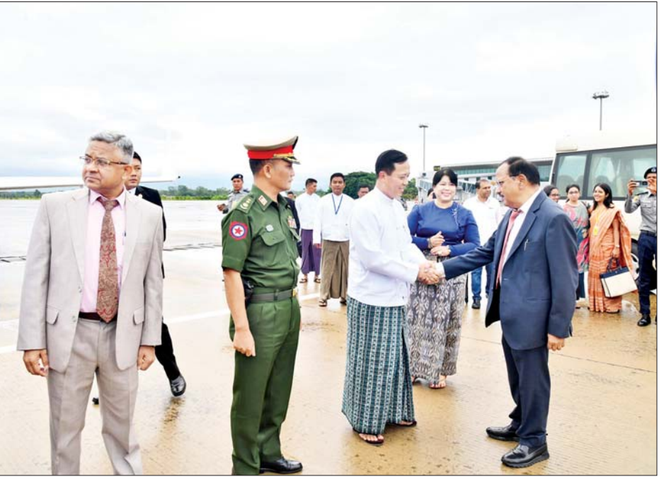
အိန္ဒိယနိုင်ငံမှ အမျိုးသားလုံခြုံရေးဆိုင်ရာ အကြီးအကဲနှင့်အဖွဲ့ နေပြည်တော်မှ ပြန်လည်ထွက်ခွာစဉ်။