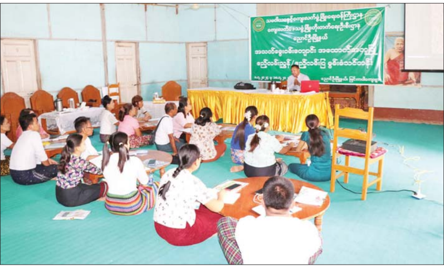
မြင်းကပါစံပြကျေးရွာ(Smart Village)၌ ဧည့်လမ်းညွှန်/ဧည့်လမ်းပြသင်တန်း ဖွင့်လှစ်သင်ကြားပေးစဉ်။