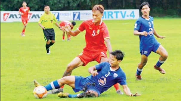
ရှမ်းယူနိုက်တက်အသင်းနှင့် Dagon Port အသင်းတို့ ယှဉ်ပြိုင်ကစားကြစဉ်။

ရန်ကုန် ဇူလိုင် ၂၇ ၂၀၂၄ ရာသီ MNL ယူ-၂၀ လိဂ်ပြိုင်ပွဲတွင် (၈) ပထမနေနှင့် ဒုတိယနေ့ကို ဇူလိုင် ၂၆ ရက်၊ ၂၇ ရက်က ကျင်းပရာ ဇယားထိပ်ဆုံးတွင် ဦးဆောင်နေသည့် ရှမ်းယူနိုက်တက်အသင်းအပါအဝင် ရန်ကုန်ယူနိုက်တက်၊ ဟံသာဝတီယူနိုက်တက်၊ စာမျက်နှာ ၂၂ ကော်လံ ၁ သို့ *