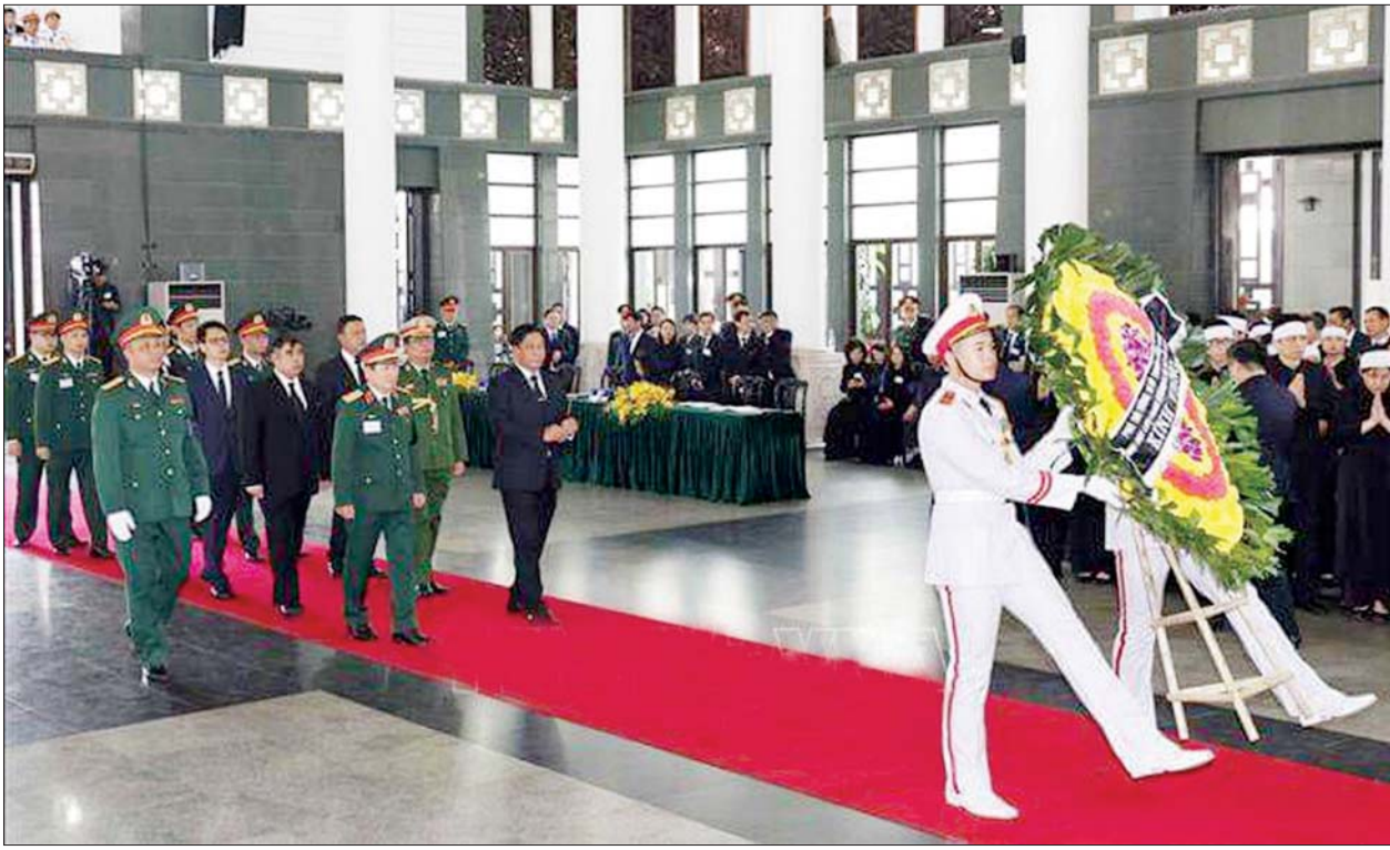
နိုင်ငံတော်စီမံအုပ်ချုပ်ရေးကောင်စီအဖွဲ့ဝင် ဒုတိယဝန်ကြီးချုပ်နှင့် ပြည်ထောင်စုဝန်ကြီး ဗိုလ်ချုပ်ကြီးတင်အောင်စန်း ဗီယက်နမ်ကွန်မြူနစ်ပါတီ အထွေထွေအတွင်းရေးမှူးနှင့် သမ္မတဟောင်း ငုယင်ဖုကျောက်၏ နိုင်ငံတော်ဈာပနအခမ်းအနား တက်ရောက်စဉ်။

နေပြည်တော် ဇူလိုင် ၂၇ နိုင်ငံတော် စီမံအုပ်ချုပ်ရေး ကောင်စီအဖွဲ့ဝင် ဒုတိယဝန်ကြီး ချုပ်နှင့် ကာကွယ်ရေးဝန်ကြီးဌာန ပြည်ထောင်စုဝန်ကြီး ဗိုလ်ချုပ်ကြီး တင်အောင်စန်း ဦးဆောင်သော ကိုယ်စားလှယ် အဖွဲ့သည် ဗီယက်နမ် ကွန်မြူနစ်ပါတီ အထွေထွေ အတွင်းရေးမှူးနှင့် သမ္မတဟောင်း ငုယင်ဖုကျောက် ၏ နိုင်ငံတော် ဈာပနအခမ်းအနား သို့ တက်ရောက်ခဲ့ပြီး ယမန်နေ့ ညပိုင်းတွင် ရန်ကုန်မြို့သို့ လေကြောင်းခရီးဖြင့် ပြန်လည် ရောက်ရှိရာ ရန်ကုန်တိုင်းဒေသကြီး ဝန်ကြီးချုပ်၊ ရန်ကုန်တိုင်းစစ်ဌာန ချုပ် တိုင်းမှူး၊ မြန်မာနိုင်ငံဆိုင်ရာ ဗီယက်နမ်ဆိုင်ရာလက်သမ္မတနိုင်ငံ စစ်သံမှူးနှင့် သံရုံးမှ တာဝန်ရှိသူများ၊ တပ်မတော် အရာရှိကြီးများက ရန်ကုန်အပြည်ပြည်ဆိုင်ရာလေဆိပ် ၌ ကြိုဆိုနှုတ်ဆက်ကြသည်။