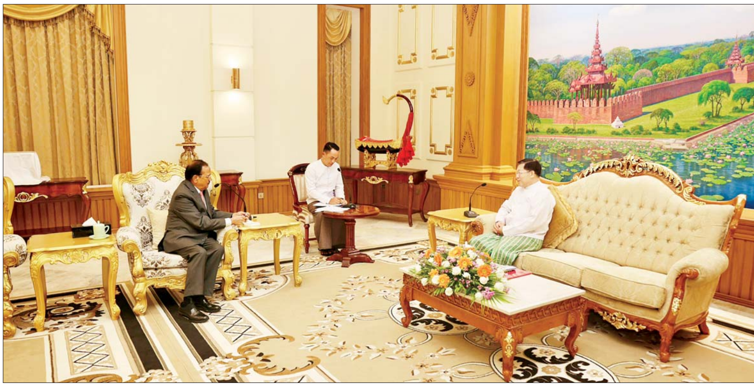
ဝန်ကြီးချုပ်နှင့် အိန္ဒိယနိုင်ငံ အမျိုးသား အပြန်အလှန်ပေးအပ်ကြပြီး မှတ်တမ်းတင်စာတိုပုံရိပ်ခွဲကြကြောင်း သိရသည်။ သတင်းစဉ် နိုင်ငံတော်စီမံအုပ်ချုပ်ရေးကောင်စီဥက္ကဋ္ဌ နိုင်ငံတော်ဝန်ကြီးချုပ် ဗိုလ်ချုပ်မှူးကြီး မင်းအောင်လှိုင် အိန္ဒိယနိုင်ငံ အမျိုးသားလုံခြုံရေးဆိုင်ရာ အကြံပေးပုဂ္ဂိုလ် H.E. Shri Ajit Doval အား လက်ခံတွေ့ဆုံစဉ်။

တွေ့ဆုံပွဲအပြီးတွင် နိုင်ငံတော်စီမံအုပ်ချုပ်ရေးကောင်စီဥက္ကဋ္ဌ နိုင်ငံတော်