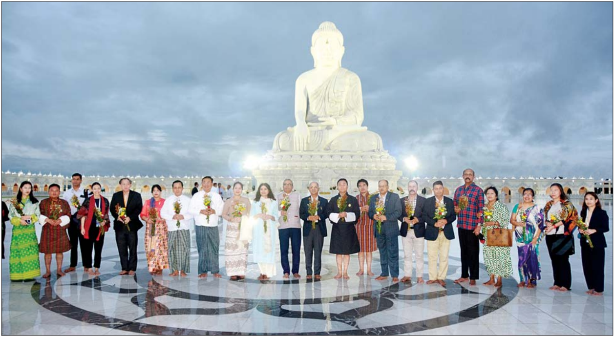
ပြည်ထောင်စုဝန်ကြီး ဗိုလ်ချုပ်ကြီးမိုးအောင်၊ ဘင်းမိစတက် အမျိုးသားလုံခြုံရေးဆိုင်ရာ အကြီးအကဲများ၊ ဇနီးများနှင့် တာဝန်ရှိသူများ မာရဝိဇယ ဗုဒ္ဓရုပ်ပွားတော်မြတ်ကြီးတွင် ဖူးမြော်ကြည်ညိုကြစဉ်။

နေပြည်တော် ဇူလိုင် ၂၆ အမျိုးသား လုံခြုံရေးဆိုင်ရာ အကြံပေးပုဂ္ဂိုလ် နိုင်ငံတော်စီမံ အုပ်ချုပ်ရေးကောင်စီ ဥက္ကဋ္ဌရုံး ဝန်ကြီးဌာန (၁) ပြည်ထောင်စု ဝန်ကြီး ဗိုလ်ချုပ်ကြီးမိုးအောင်နှင့် ဇနီးတို့သည် ဘင်းမိစတက် အမျိုးသား လုံခြုံရေးဆိုင်ရာ အကြီးအကဲများ၊ ဇနီးများ၊ အဖွဲ့ဝင်များ၊ ဘင်းမိစတက် အတွင်းရေးမှူးချုပ်တို့နှင့် အတူ ယနေ့တွင် နေပြည်တော်ရှိ မာရဝိဇယ ဗုဒ္ဓရုပ်ပွားတော်မြတ်ကြီး နှင့် ဥပ္ပါတသန္တိစေတီတော်မြတ် ကြီးတို့ကို သွားရောက်ဖူးမြော် ကြည်ညိုကြသည်။