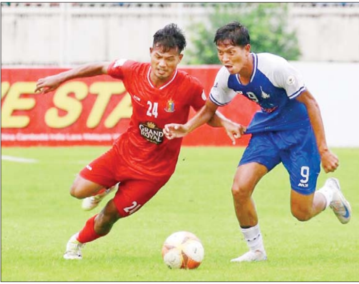
ဟံသာဝတီယူနိုက်တက်အသင်းနှင့် ရတနာပုံအသင်းတို့ ယှဉ်ပြိုင်ကစားကြစဉ်။

ရန်ကုန် ဇူလိုင် ၂၆ ၂၀၂၄-၂၀၂၅ ရာသီ MNL အမှတ်ပေးပြိုင်ပွဲ ပွဲစဉ် (၄) ပထမနေ့ကို ဇူလိုင် ၂၆ ရက်ကကျင်းပရာဟံသာဝတီယူနိုက်တက် အသင်းနှင့် ဒဂုံစတားယူနိုက်တက်အသင်း အနိုင်ရရှိသည်။ သုဝဏ္ဏကွင်း၌ ကျင်းပသည့်ပွဲတွင် ဟံသာဝတီယူနိုက်တက် အသင်းက ရတနာပုံအသင်းကို တစ်ဂိုး-ဂိုးမရှိဖြင့် အနိုင်ရခဲ့သည်။ ရာသီအစ သုံးပွဲတွင် ရှုံးပွဲမရှိဘဲ ခုနစ်မှတ်ရရှိပြီး ဇယားထိပ်ပိုင်းတွင် ရပ်တည်နေသည့် အသင်းနှစ်သင်း တွေ့ဆုံခြင်းဖြစ်ပြီး ဟံသာဝတီအသင်းက ပွဲပြီးခါနီးတွင် သွင်းယူသည့် တစ်လုံးတည်းသောဂိုးဖြင့် အနိုင်ရခဲ့သည်။ ရတနာပုံအသင်းမှာမူ ပထမဆုံးရှုံးပွဲနှင့် စာမျက်နှာ ၂၀ ကော်လံ ၁ သို့ ❖