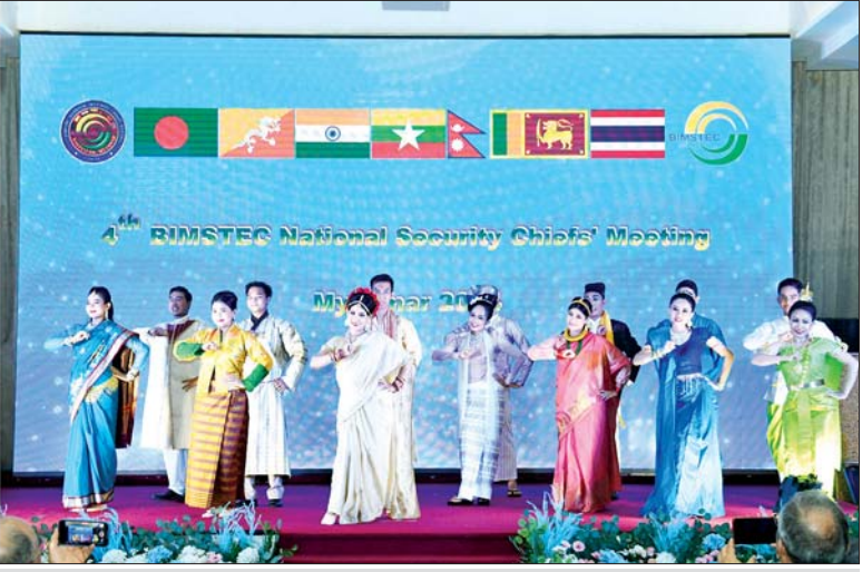
အမျိုးသားလုံခြုံရေးဆိုင်ရာအကြံပေးပုဂ္ဂိုလ် နိုင်ငံတော်စီမံအုပ်ချုပ်ရေးကောင်စီဥက္ကဋ္ဌရုံးဝန်ကြီးဌာန(၁) ပြည်ထောင်စုဝန်ကြီး ဗိုလ်ချုပ်ကြီး မိုးအောင် ဘင်းမိစတက် အမျိုးသား လုံခြုံရေးဆိုင်ရာအကြီးအကဲများ၊ ဘင်းမိစတက်အတွင်းရေးမှူးချုပ်နှင့် ၎င်းတို့၏ဇနီးများအား ညစာစားပွဲဖြင့် တည်ခင်းဧည့်ခံစဉ်။