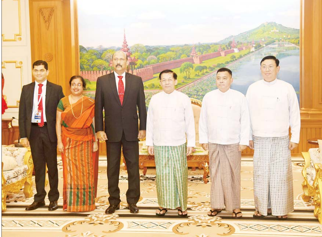
နိုင်ငံတော်စီမံအုပ်ချုပ်ရေးကောင်စီဥက္ကဋ္ဌ နိုင်ငံတော်ဝန်ကြီးချုပ် ဗိုလ်ချုပ်မှူးကြီး မင်းအောင်လှိုင်နှင့် အဖွဲ့ဝင်များ သီရိလင်္ကာနိုင်ငံ ကာကွယ်ရေးဝန်ကြီးဌာန၏ အတွင်းဝန် General Kamal Gunaratne (Retd) ဦးဆောင်သော အဖွဲ့ဝင်များနှင့်အတူ စုပေါင်းမှတ်တမ်းတင် စာတိုက်ပုံရိုက်စဉ်။

နှစ်နိုင်ငံအကြား စီးပွားရေးဖွံ့ဖြိုးတိုးတက်မှုအတွက် ပူးပေါင်းဆောင်ရွက်မှုများ မြှင့်တင်ရေးဆိုင်ရာကိစ္စရပ်များ၊ ဘင်းမိစတက်အမျိုးသားလုံခြုံရေးဆိုင်ရာ အကြီးအကဲများ အစည်းအဝေးကျင်းပခဲ့မှုအခြေအနေများ အမြင်ချင်းဖလှယ်ဆွေးနွေး