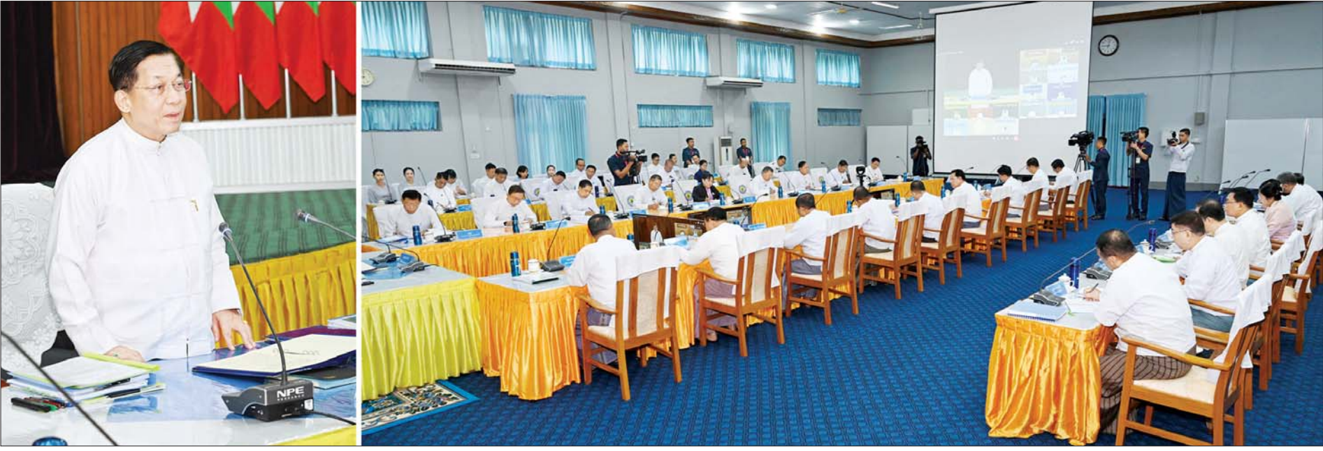
e-Government ဦးဆောင်ကော်မတီနာယက နိုင်ငံတော်စီမံအုပ်ချုပ်ရေးကောင်စီဥက္ကဋ္ဌ နိုင်ငံတော်ဝန်ကြီးချုပ် ဗိုလ်ချုပ်မှူးကြီး မင်းအောင်လှိုင် e-Government ဦးဆောင်ကော်မတီ၏ (၁/၂၀၂၄) လုပ်ငန်းညှိနှိုင်းအစည်းအဝေးတွင် အမှာစကားပြောကြားစဉ်။

နိုင်ငံတစ်ခု၏ စီးပွားရေးဖွံ့ဖြိုးတိုးတက်မှုသည် ပိုမိုကျယ်ပြန့်ပြီး လုံခြုံစိတ်ချရသော ဒစ်ဂျစ်တယ်ဝန်ဆောင်မှုများပေးနိုင်သည့် အချက်ပေါ်တွင် မှီတည်နေ မိမိတို့ မျှော်မှန်းသည့် ဒစ်ဂျစ်တယ်အခွင့်အလမ်းများကို အမိအရဆုပ်ကိုင်နိုင်ရန် ဒစ်ဂျစ်တယ်နည်းပညာများ၏ ခြိမ်းခြောက်မှုနှင့် အန္တရာယ်များလျော့ပါးလာစေရေးနှင့် ပြည်သူ့ဗဟိုပြုသည့် e-Government ဝန်ဆောင်မှုများ ဖွံ့ဖြိုးတိုးတက်လာစေရေး ကြိုးပမ်း