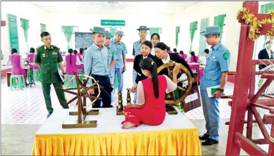
အား လက်တွေ့လေ့ကျင့်သင်ကြားနေမှုနှင့် သင်တန်း ထားရှိမှုကို လိုက်လံကြည့်ရှုစစ်ဆေးသည်။

နယ်စပ်ရေးရာဝန်ကြီးဌာန ဒုတိယဝန်ကြီး ဗိုလ်ချုပ်ဖြိုးသန့်သည် တာဝန်ရှိသူများနှင့်အတူ ယနေ့ နံနက်ပိုင်းတွင် မွန်ပြည်နယ် မုဒုံမြို့ရှိ အမျိုးသမီး အိမ်တွင်းမှုသက်မွေးလုပ်ငန်း ပညာသင်တန်းကျောင်း သို့ သွားရောက်ကြည့်ရှုစစ်ဆေးပြီး လိုအပ်သည်များ ဖြည့်ဆည်းဆောင်ရွက်ပေးသည်။