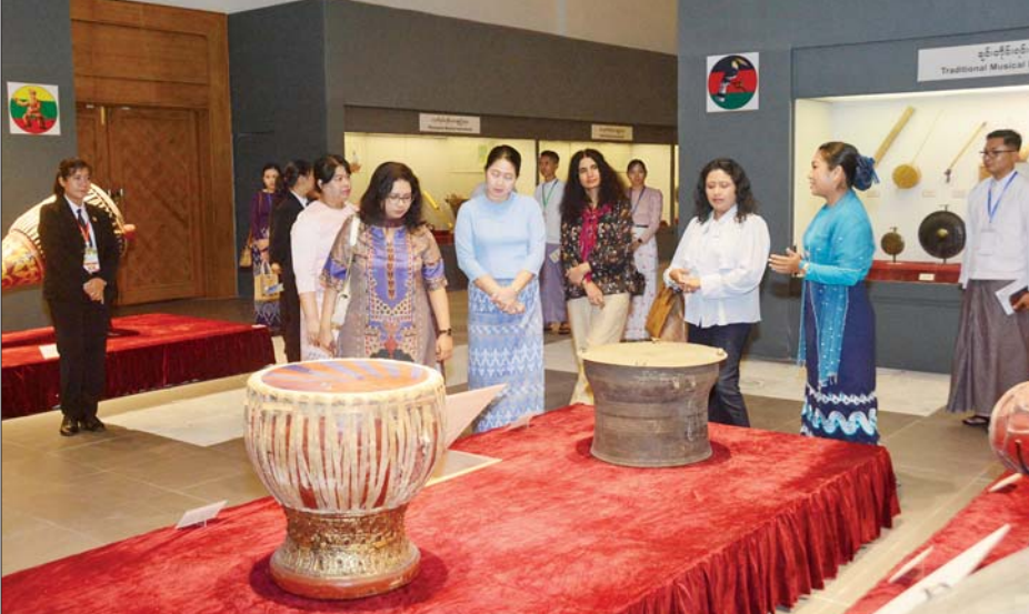
ဘင်းမိစတက် အမျိုးသားလုံခြုံရေးဆိုင်ရာ အကြီးအကဲများ၏ ဇနီးများနှင့် တာဝန်ရှိသူများ အမျိုးသားပြတိုက်တွင် ခင်းကျင်းပြသထားသည့် ပြကွင်းပြကွက်များကို လိုက်လံကြည့်ရှုကြစဉ်။

ဝန်ကြီးနှင့်အဖွဲ့သည် မာရဝိဇယ ဗုဒ္ဓ ရုပ်ပွားတော်မြတ်ကြီးအား ပန်း၊ ဆီမီး၊ ရေချမ်းတို့ကို ကပ်လှူ ပူဇော်၍ ဖူးမြော်ကြည်ညိုကာ စုပေါင်း မှတ်တမ်းတင်ဓာတ်ပုံ ရိုက်ကြသည်။