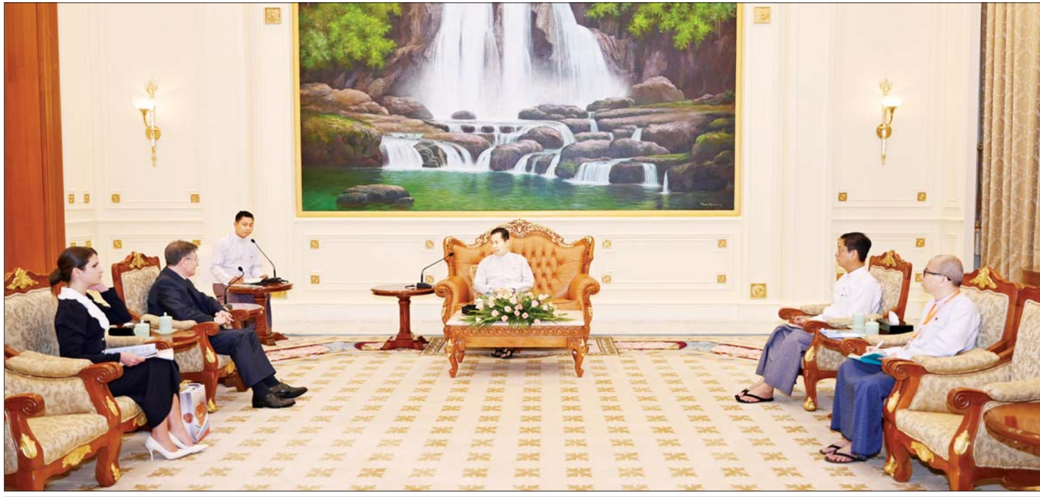
နိုင်ငံတော်စီမံအုပ်ချုပ်ရေးကောင်စီ ဒုတိယဥက္ကဋ္ဌ ဒုတိယဝန်ကြီးချုပ် ဒုတိယဗိုလ်ချုပ်မှူးကြီး စိုးဝင်း မြန်မာနိုင်ငံဆိုင်ရာ ရုရှားဖက်ဒရေးရှင်းနိုင်ငံ သံအမတ်ကြီး H.E.Mr. Is-kander Azizov အား လက်ခံတွေ့ဆုံသည်။

နေပြည်တော် ဇူလိုင် ၂၆ နိုင်ငံတော်စီမံအုပ်ချုပ်ရေးကောင်စီ ဒုတိယဥက္ကဋ္ဌ ဒုတိယဝန်ကြီးချုပ် ဒုတိယဗိုလ်ချုပ်မှူးကြီး စိုးဝင်းသည် မြန်မာနိုင်ငံဆိုင်ရာရုရှားဖက်ဒရေးရှင်းနိုင်ငံ သံအမတ်ကြီး H.E.Mr. Is-kander Azizov အား ယနေ့မွန်းလွဲပိုင်းတွင် နေပြည်တော်ရှိ နိုင်ငံတော်စီမံ အုပ်ချုပ်ရေးကောင်စီ ဥက္ကဋ္ဌရုံး သံတမန်ဆောင်ရွက်ခန်းမ၌ လက်ခံတွေ့ဆုံသည်။ အမြင်ချင်းဖလှယ်ဆွေးနွေး ထိုသို့တွေ့ဆုံစဉ် အထူးစီးပွားရေးဇုန်၌ ဆောင်ရွက်ရမည့် လုပ်ငန်းစဉ်များ၊ လျှပ်စစ်ဓာတ်အားထုတ်လုပ်နိုင်ရေး ကိစ္စရပ်များနှင့် မြန်မာနိုင်ငံအတွင်း ဖြစ်ထွန်းတိုးတက်မှုများအပေါ် ရုရှားနိုင်ငံသတင်းမီဒီယာများမှ ပိုမိုဖော်ပြပေးလိုမှု အပါအဝင် နိုင်ငံရေး၊ စီးပွားရေး၊ ကာကွယ်ရေးဆိုင်ရာ ကိစ္စရပ်များအား အမြင်ချင်းဖလှယ် ဆွေးနွေးခြင်းနှင့် သံအမတ်ကြီး၏ စာမျက်နှာ ၆ ကော်လံ ၁ သို့ ❖