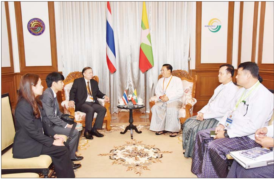
ပြည်ထောင်စုဝန်ကြီး ဗိုလ်ချုပ်ကြီး မိုးအောင် ထိုင်းနိုင်ငံမှ H.E. Mr. Ruchakorn NAPAPORNPIPAT ကို လက်ခံတွေ့ဆုံစဉ်။

ဘင်းမိစတက်လုံခြုံရေးဆိုင်ရာ နိုင်ငံများအချင်းချင်း ပူးပေါင်းဆောင်ရွက်မှုများမှတစ်ဆင့် တွေ့ကြုံနေ ရသည့် စိန်ခေါ်မှုများကို ဖြေရှင်းဆောင်ရွက်နိုင်မည့် အခြေအနေ၊ မြန်မာနိုင်ငံ၏ နိုင်ငံရေးဖြစ်ပေါ်တိုးတက် ပြောင်းလဲလာမှုအခြေအနေနှင့် လွတ်လပ်ပြီး တရားမျှတသည့် ပါတီစုံဒီမိုကရေစီအထွေထွေ ရွေးကောက်ပွဲ အောင်မြင်စွာကျင်းပနိုင်ရေး ကြိုတင် ပြင်ဆင်ဆောင်ရွက်လျက်ရှိသည့် အခြေအနေများနှင့် စပ်လျဉ်း၍ ရင်းနှီးပွင့်လင်းစွာ အမြင်ချင်းဖလှယ် ဆွေးနွေးကြသည်။ တွေ့ဆုံပွဲသို့ နိုင်ငံတော်စီမံအုပ်ချုပ်ရေး ကောင်စီဥက္ကဋ္ဌရုံးဝန်ကြီးဌာန(၁) ဒုတိယဝန်ကြီး ဗိုလ်ချုပ် ခွန်သန့်ဇော်ထူးနှင့် တာဝန်ရှိသူများ တက်ရောက်ကြသည်။