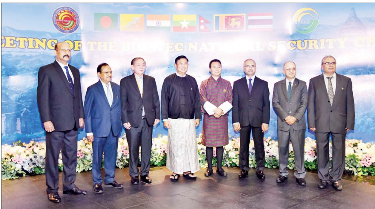
အမျိုးသားလုံခြုံရေးဆိုင်ရာအကြံပေးပုဂ္ဂိုလ် ပြည်ထောင်စုဝန်ကြီး ဗိုလ်ချုပ်ကြီး မိုးအောင် ဘင်းမိစတက် အမျိုးသားလုံခြုံရေးဆိုင်ရာ အကြီးအကဲများနှင့်အတူ မှတ်တမ်းတင်ဓာတ်ပုံရိုက်စဉ်။

General Kamal Gunaratne (Retd) WWV RWP RSP USP Ndc psc MPhil၊ ထိုင်းနိုင်ငံမှ H.E. Mr. Ruchakorn NAPAPORNPIPAT၊ ဘင်းမိစတက် အတွင်းရေးမှူးချုပ် H.E. Mr. Indra Mani Pandey နှင့် ၎င်းတို့၏ဇနီးများ၊ စတုတ္ထ အကြိမ်မြောက် ဘင်းမိစတက် အမျိုးသားလုံခြုံရေး ဆိုင်ရာ အကြီးအကဲများ အစည်းအဝေး အောင်မြင်စွာကျင်းပနိုင်ရေး ဦးစီး ကော်မတီအဖွဲ့ဝင်များဖြစ်သည့် ဒုတိယဝန်ကြီးများနှင့် ဇနီးများ၊ လုပ်ငန်းကော်မတီအဖွဲ့ဝင်များ တက်ရောက်ကြသည်။ ဦးစွာ ပြည်ထောင်စုဝန်ကြီး ဗိုလ်ချုပ်ကြီး မိုးအောင်နှင့် ဘင်းမိ စတက် အမျိုးသားလုံခြုံရေး ဆိုင်ရာ အကြီးအကဲများနှင့် ဇနီး များသည် M Gallery ဟိုတယ်၌ ခင်းကျင်းပြသထားသည့် မြန်မာ့ ရိုးရာလက်မှုပစ္စည်းများ၊ ရိုးရာ အထိမ်းအမှတ် ပစ္စည်းများနှင့် အမှတ်တရလက်ဆောင်ပစ္စည်း အရောင်းဆိုင်များကို လှည့်လည် ကြည့်ရှုအားပေးကြသည်။