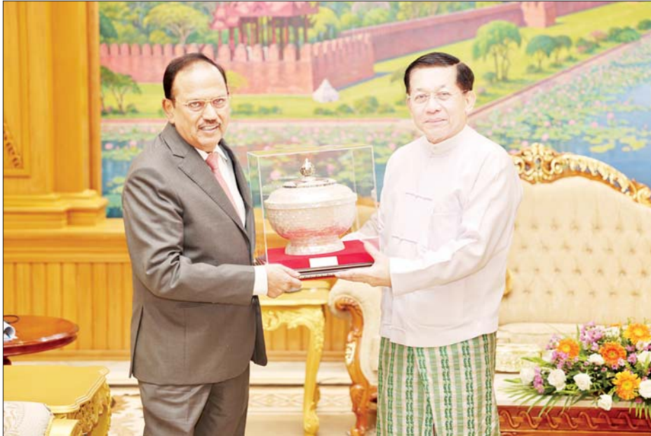
နိုင်ငံတော်စီမံအုပ်ချုပ်ရေးကောင်စီဥက္ကဋ္ဌ နိုင်ငံတော်ဝန်ကြီးချုပ် ဗိုလ်ချုပ်မှူးကြီးမင်းအောင်လှိုင်နှင့် အိန္ဒိယနိုင်ငံ အမျိုးသားလုံခြုံရေးဆိုင်ရာ အကြံပေးပုဂ္ဂိုလ် H.E. Shri Ajit Doval တို့ အမှတ်တရလက်ဆောင်ပစ္စည်းများ အပြန်အလှန်ပေးအပ်စဉ်။

✦ စာမျက်နှာ ၃ မှ ယနေ့ကမ္ဘာတွင် ဒစ်ဂျစ်တယ်အသွင်ကို အောင်မြင်စွာကူးပြောင်းနိုင်သည့် နိုင်ငံများသည် လျင်မြန်စွာဖွံ့ဖြိုးတိုးတက်လာနေသည်ကို အထင်အရှားတွေ့မြင်ရကြောင်း၊ နိုင်ငံတစ်ခု၏ စီးပွားရေးဖွံ့ဖြိုးတိုးတက်မှုသည် နိုင်ငံ၏ပိုမိုကျယ်ပြန့်ပြီး ပိုမိုလုံခြုံစိတ်ချရသည့် ဒစ်ဂျစ်တယ်ဝန်ဆောင်မှုများ ပေးနိုင်ခြင်းဆိုသည့် အချက်ပေါ်တွင် မှီတည်နေကြောင်း၊ ဒစ်ဂျစ်တယ်အစိုးရဆိုသည်မှာ ဒစ်ဂျစ်တယ်စွမ်းရည်နှင့် ဒစ်ဂျစ်တယ် ရင့်ကျက်ပြည့်စုံမှုများဆီကို ဦးတည်ရမည်ဖြစ်ခြင်းကြောင့် ယခင်ဆယ်စုနှစ်များက ကြိုးပမ်းအကောင်အထည် ဖော်ခဲ့သည့် e-Government ၏ ပုံရိပ်ကို တိုးမြှင့်ပြီး နိုင်ငံတကာနှင့် ရင်ပေါင်တန်းနိုင်အောင် ဆောင်ရွက်သွားကြရန် လိုအပ်ကြောင်း၊ ထို့ကြောင့်မိမိတို့မျှော်မှန်းသည့်ဒစ်ဂျစ်တယ်အခွင့်အလမ်းများကို အမိအရဆုပိုင်နိုင်ရန်အတွက် လူတစ်ဦးချင်းစီနှင့်