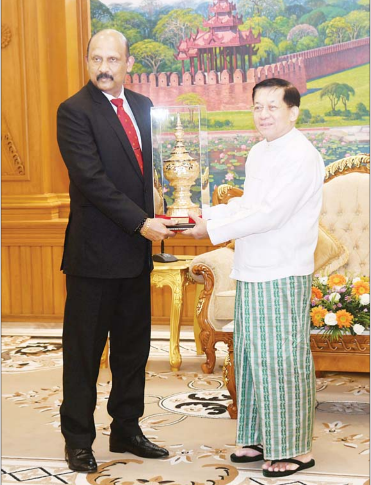
နိုင်ငံတော်စီမံအုပ်ချုပ်ရေးကောင်စီဥက္ကဋ္ဌ နိုင်ငံတော်ဝန်ကြီးချုပ် ဗိုလ်ချုပ်မှူးကြီး မင်းအောင်လှိုင်နှင့် သီရိလင်္ကာနိုင်ငံ ကာကွယ်ရေးဝန်ကြီးဌာန၏ အတွင်းဝန် General Kamal Gunaratne (Retd) တို့ အမှတ်တရလက်ဆောင်ပစ္စည်းများ အပြန်အလှန်ပေးအပ်စဉ်။