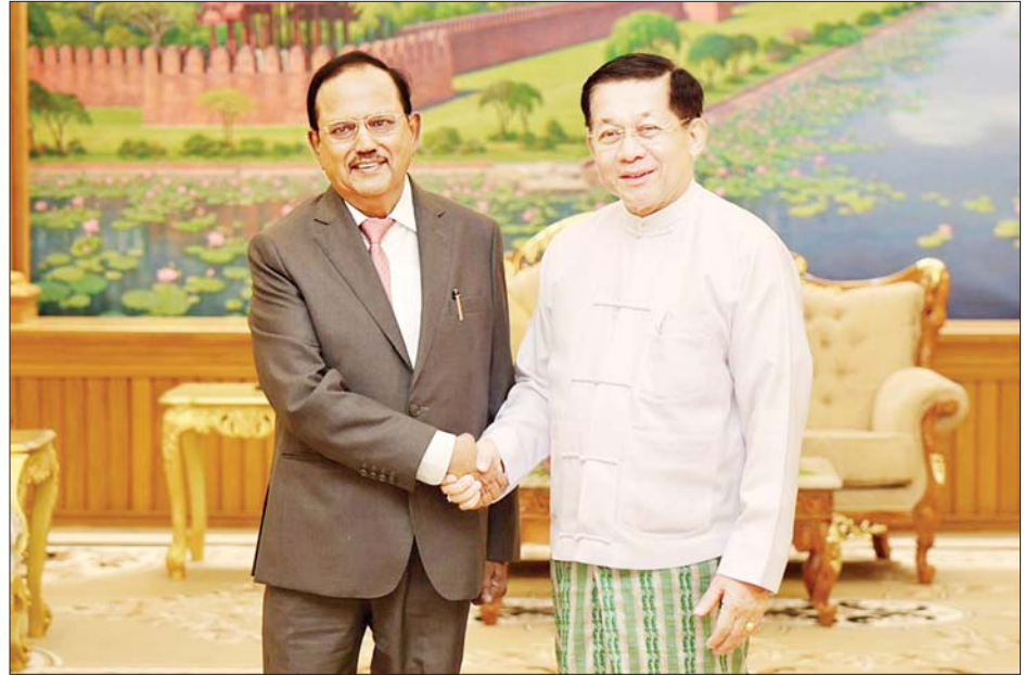
နိုင်ငံတော်စီမံအုပ်ချုပ်ရေးကောင်စီဥက္ကဋ္ဌ နိုင်ငံတော်ဝန်ကြီးချုပ် ဗိုလ်ချုပ်မှူးကြီးမင်းအောင်လှိုင်နှင့် အိန္ဒိယနိုင်ငံ အမျိုးသားလုံခြုံရေးဆိုင်ရာ အကြံပေးပုဂ္ဂိုလ် H.E. Shri Ajit Doval တို့ ရင်းရင်းနှီးနှီး နှုတ်ဆက်စဉ်။