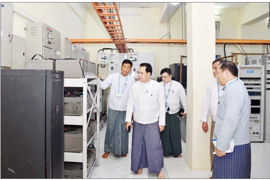
ပြည်ထောင်စုဝန်ကြီး ဦးမောင်မောင်အုန်း ပျဉ်းမနား-သပြေတောင်ထပ်ဆင့်လွှင့်စက်ရုံတွင် လှည့်လည်ကြည့်ရှုစစ်ဆေးစဉ်။

ဆောင်ရွက်မှု၊ ဝန်ထမ်းများ သွား/ လာ ပို့ဆောင်ရေးနှင့် အုပ်ချုပ်မှု ကိစ္စရပ်များ ဆောင်ရွက်ပေးမှု၊ ဝန်ထမ်းများအတွက် သက်သာ ချောင်ချိရေး ဆောင်ရွက်ပေးနေမှု၊ လုံခြုံရေးနှင့် မီးဘေးအန္တရာယ် ကာကွယ်ရေး ဆောင်ရွက်ထားရှိမှု အခြေအနေများကိုလည်းကောင်း၊ ဆောက်လုပ်ရေး ဝန်ကြီးဌာနမှ တာဝန်ရှိသူက ပျဉ်းမနား-သပြေ တောင် ထပ်ဆင့်လွှင့်စက်ရုံတွင် လေးခန်းတွဲ နှစ်ထပ် ဝန်ထမ်း အိမ်ရာ တစ်လုံး ဆောက်လုပ်မည့် အစီအစဉ်ကို လည်းကောင်း ရှင်းလင်းတင်ပြကြသည်။ ရှင်းလင်းတင်ပြချက်များအပေါ် ပြည်ထောင်စုဝန်ကြီးက ရုပ်သံ ရိုက်ကူးထုတ်လွှင့်မှုလုပ်ငန်းများ ဆောင်ရွက်ရာတွင် လုံခြုံရေး၊ လျှပ်စစ်မီး ဦးစားပေးရရှိရေးတို့ကို သက်ဆိုင်ရာ ကဏ္ဍအလိုက် ပေါင်းစပ်ညှိနှိုင်းဆောင်ရွက်ရန်နှင့် ပြည်သူလူထုထံ မှန်ကန်သည့် သတင်း အချက်အလက်များ အချိန်နှင့်တစ်ပြေးညီ ပေးပို့နိုင် ရေးကြိုးပမ်းဆောင်ရွက်ကြရန်နှင့် ဆောက်လုပ်ရေး လုပ်ငန်းများ ဆောင်ရွက်ရာတွင် အရည်အသွေး ပြည့်မီစွာဖြင့် သတ်မှတ်ကာလ အတွင်း အချိန်မီပြီးစီးအောင် ကြိုးစားဆောင်ရွက်ရေး မှာကြား သည်။ ထို့နောက် ပျဉ်းမနား-သပြေ