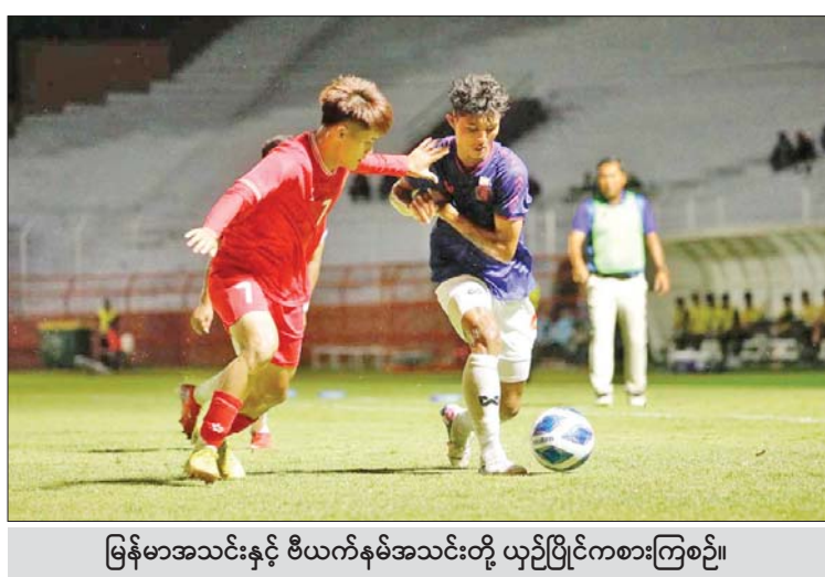
မြန်မာအသင်းနှင့် ဗီယက်နမ်အသင်းတို့ ယှဉ်ပြိုင်ကစားကြစဉ်။