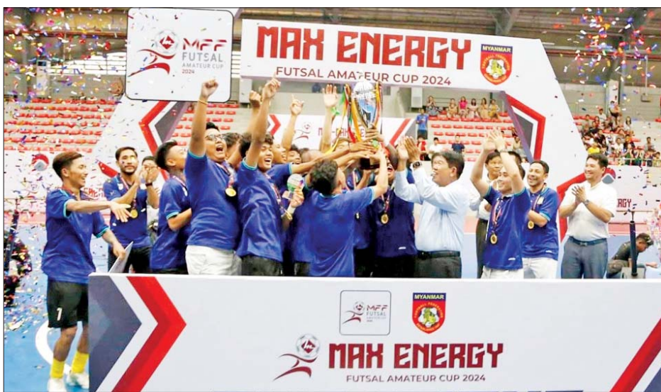
ချန်ပီယံဆုရရှိသည့် RPG အသင်း အောင်ပွဲခံနေစဉ်။

ရန်ကုန် ဇူလိုင် ၁၈ ၂၀၂၄ MFF အပျော်တမ်းဖူဆယ်ပြိုင်ပွဲ တတိယနေရာလုပွဲနှင့် ဗိုလ်လုပွဲကို ဇူလိုင် ၁၈ ရက်က ရန်ကုန်မြို့ သုဝဏ္ဏဘောလုံးကွင်းရှိ MFF ဖူဆယ်အားကစားရုံ၌ ကျင်းပရာ RPG အသင်း ဗိုလ်စွဲခဲ့သည်။