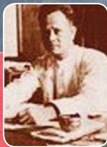
မန်းဘခိုင်