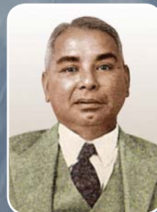
ဦးရာဇော်