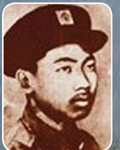
ရဲဘော်ကိုထွေး

အာဇာနည်ခေါင်းဆောင်ကြီးများကို ဦးညွှတ်အလေးပြုပါ။