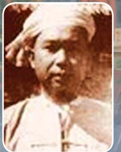
စစ်စံထွန်း