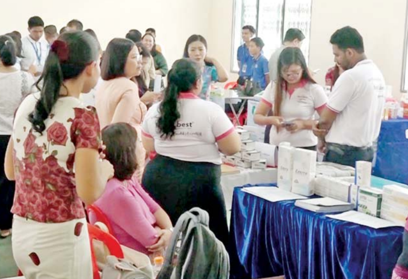
ရန်ကုန်တိုင်းဒေသကြီးရှိ မြန်မာကုန်သွယ်မှုမြှင့်တင်ရေးအဖွဲ့ရုံးတွင် ပြုလုပ်သည့် ဆေးရောင်းပွဲတွင် လာရောက်ဝယ်ယူနေသည့် ပြည်သူများကို တွေ့ရစဉ်။