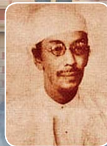
ဒီးဒုတ်ဦးဘချို