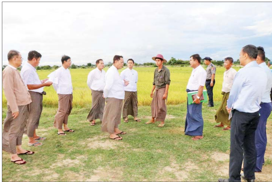
ရှိသူများအနေဖြင့်လည်း ဈေးနှုန်းသက်သာပြီး ပိုးသတ်ဆေး၊ ပေါင်းသတ်ဆေးများကို တောင်သူများ အရည်အသွေးမှန်ကန်သောမျိုးနှင့် သွင်းအားစု လက်ဝယ်စိုက်ပျိုးချိန်အမီရရှိရေး ပေါင်းစပ်ဆောင်

နေပြည်တော် ဇူလိုင် ၁၈ သမဝါယမနှင့် ကျေးလက်ဖွံ့ဖြိုးရေးဝန်ကြီးဌာန ပြည်ထောင်စုဝန်ကြီး ဦးလှမိုးသည် ဒုတိယဝန်ကြီး ဦးမြင့်စိုး၊ အမြဲတမ်းအတွင်းဝန်၊ တာဝန်ရှိသူများနှင့် အတူ ယနေ့မွန်းလွဲပိုင်းတွင် နေပြည်တော်ကောင်စီ နယ်မြေ လယ်ဝေးမြို့နယ် ရုံးတောကျေးရွာသို့ သွားရောက်ပြီး ရွှေဝါထွန်း(၂) စိုက်ပျိုးထုတ်လုပ်ရေး သမဝါယမအသင်းနှင့် ရိုင်းဘိုးသမဝါယမအသင်းတို့မှ အသင်းသားတောင်သူများ၊ မြန်မာ Uni Seimer ကုမ္ပဏီမှ တာဝန်ရှိသူများ၊ ဌာနဆိုင်ရာဝန်ထမ်းများ နှင့်တွေ့ဆုံရာ မြန်မာ Uni Seimer ကုမ္ပဏီမှ တာဝန် ရှိသူတစ်ဦးက ရွှေဝါထွန်း(၂) သမဝါယမအသင်းနှင့် မြန်မာ Uni Seimer ကုမ္ပဏီတို့ အကျိုးတူပူးပေါင်း စိုက်ပျိုးဆောင်ရွက်နေမှုများကို ရှင်းလင်းတင်ပြ သည်။