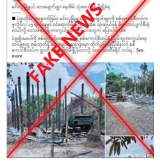
ရင်းလင်းခဲ့ရာ ဆားချောင်းကျေးရွာ ၏အရှေ့ဘက် မိတာ ၃၀၀ ခန့် တွင် အကြမ်းဖက်သမားများ ခိုအောင်း နေထိုင်ခဲ့သည့် တောင်ယာတဲတစ်လုံးအား တွေ့ရှိ ခဲ့ပြီး ယင်းတောင်ယာတဲအတွင်းမှ လက်လုပ်၂၂ ခု သေဆုံးတစ်လက်၊

နေပြည်တော် ဇူလိုင် ၁၇ ပဲခူးတိုင်းဒေသကြီး မင်းလှ မြို့နယ် ဆားချောင်းကျေးရွာနှင့် စမ်းဘတ်ကျေးရွာ ကြားတွင် တိုက်ပွဲဖြစ်ပွားခဲ့ပြီးနောက် လုံခြုံ ရေးတပ်ဖွဲ့ဝင်များက ဆားချောင်း ကျေးရွာကို ဝင်ရောက်မီးရှို့ခဲ့ ကြောင်း၊ အဆိုပါမီးရှို့မှုကြောင့် နေအိမ် ၃၀ ခန့် မီးလောင်ပျက်စီး ခဲ့သည်ဟု သတင်းတု၊ သတင်း အမှားများကို တရားမဝင်ပြည်ပျက် မီဒီယာများက လူမှုကွန်ရက် စာမျက်နှာများတွင် လုပ်ကြံ ရေးသားဖြန့်ဝေနေသည်ကို တွေ့ရှိ ရသည်။