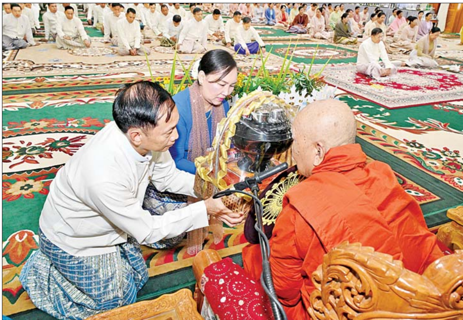
ကာကွယ်ရေးဦးစီးချုပ်(လေ)နှင့်ဇနီးတို့က ဆရာတော်ထံ ဝါဆိုသင်္ကန်းနှင့် လှူဖွယ်ပစ္စည်းများဆက်ကပ် လှူဒါန်းစဉ်။

စာမျက်နှာ ၃ မှ သံဃမဟာနာယကအဖွဲ့ အကျိုးတော်ဆောင် မစိုးရိမ်တို့က သစ်ဆရာတော်ကြီးထံ ဝါဆိုသင်္ကန်းနှင့် လှူဖွယ်ပစ္စည်းများ ဆက်ကပ်လှူဒါန်းသည်။