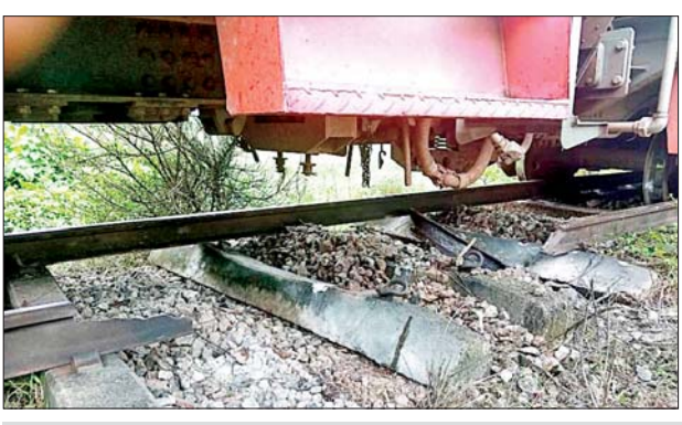
ပဲခူး-မော်လမြိုင်လမ်းပိုင်း သိမ်ဆိပ်ဘူတာနှင့် ဒုံဝန်းဘူတာအကြား အမှတ်(၈၂)အစုန် လူစီးအမြန်ရထား လမ်းချော်ကျမှုအခြေအနေ။

နေပြည်တော် ဇူလိုင် ၁၇ ယနေ့ မော်လမြိုင်မှထွက်ခွာ လာသည့် အမှတ်(၈၂)အစုန် မော်လမြိုင်-ရန်ကုန် လူစီးအမြန် ရထားသည် မွန်ပြည်နယ် သထုံ မြို့နယ် သိမ်ဆိပ်ဘူတာနှင့် ဒုံဝန်း ဘူတာအကြား မိုင်တိုင်အမှတ် ၁၂၃/၁၇-၁၅ သို့ နံနက် ၁၁ နာရီ ၁၀ မိနစ်အချိန် ရထားရောက်ရှိ ဖြတ်သန်းစဉ် အဆိုပါနေရာ၌ ရထားလမ်း မိုင်းပေါက်ကွဲထား ခြင်းကြောင့် သံလမ်းတစ်ပေခွဲခန့် ပြတ်တောက်နေသဖြင့် စက်ခေါင်း နှင့်အတူ ရထားတွဲဆိုင်းတွင် ပါရှိ သော လူစီးတွဲနှစ်တွဲ လမ်းချော်ကျမှု ဖြစ်ပွားခဲ့သည်။ ရထားလမ်းချော် ကျမှုကြောင့် ခရီးသည်နှင့် ဝန်ထမ်း ထိခိုက်မှုမရှိဘဲ သိမ်ဆိပ်-ဒုံဝန်း လမ်းပိုင်းအား နံနက် ၁၁ နာရီ ၁၃ မိနစ်တွင် ယာယီပိတ်ထားခဲ့ရသည်။ လမ်းပိုင်း ပိတ်ဆို့မှုကြောင့် ယနေ့နံနက်ပိုင်းတွင် ရန်ကုန်မှ ပုံမှန်ထွက်ခွာလာသော အမှတ် (၈၁)အဆန် လူစီးရထားသည် နံနက် ၁၁ နာရီ ၄၄ မိနစ် အချိန် တွင် ကျိုက်ထိုသို့ ရောက်ရှိနေပြီး အဆိုပါရထားတွင် ရိုးရိုးတန်းခရီး သည် ၂၃၅ ဦး စုစုပေါင်း ၆၉၅ ဦး ပါရှိကြောင်း သိရသည်။ လမ်းချော်ကျသည့် မော်လမြိုင်