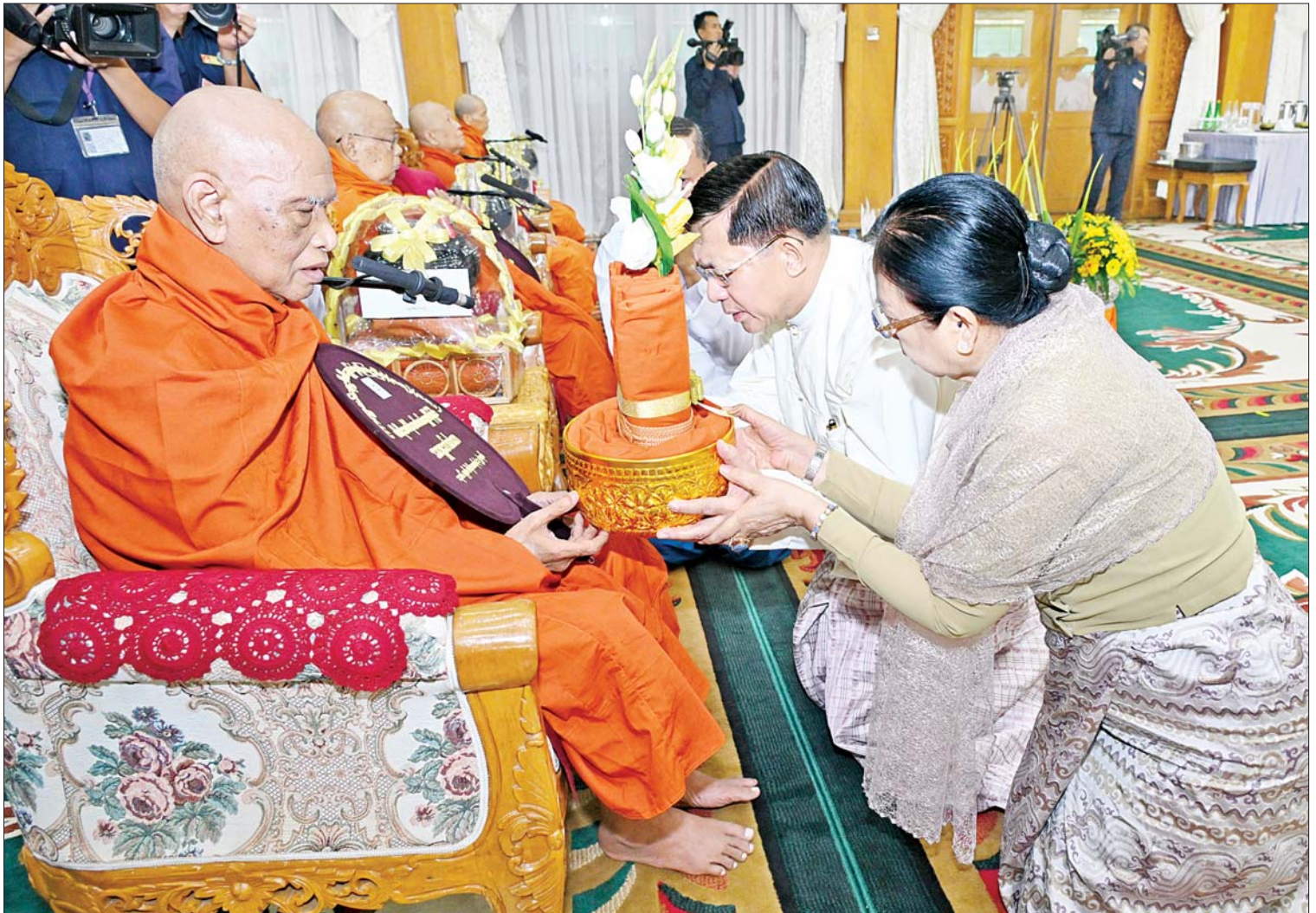
နိုင်ငံတော် စီမံအုပ်ချုပ်ရေးကောင်စီဥက္ကဋ္ဌ တပ်မတော်ကာကွယ်ရေးဦးစီးချုပ် ဗိုလ်ချုပ်မှူးကြီးမင်းအောင်လှိုင်နှင့်ဇနီး ဒေါ်ကြူကြူလှတို့ နိုင်ငံတော်သံဃမဟာနာယက အဖွဲ့ဥက္ကဋ္ဌ သန်လျင်မင်းကျောင်း ဆရာတော်ကြီး ဒေါက်တာဘဒ္ဒန္တ စန္ဒိမာဘိဝံသထံ ဝါဆိုသင်္ကန်း ဆက်ကပ်လှူဒါန်းစဉ်။

နေပြည်တော် ဇူလိုင် ၁၇ ၂၀၂၄ ခုနှစ် ကာကွယ်ရေးဦးစီးချုပ် ရုံး(ကြည်း၊ ရေ၊ လေ) မိသားစုများ ဝါဆို သင်္ကန်းဆက်ကပ်လှူဒါန်းပွဲ မဟာမင်္ဂလာ အခမ်းအနားကို ယနေ့နံနက်ပိုင်း တွင် ကာကွယ်ရေးဦးစီးချုပ်ရုံး(ကြည်း) အနော်ရထာခန်းမ၌ ကျင်းပပြုလုပ်ရာ နိုင်ငံတော်စီမံအုပ်ချုပ်ရေးကောင်စီဥက္ကဋ္ဌ တပ်မတော် ကာကွယ်ရေးဦးစီးချုပ် ဗိုလ်ချုပ်မှူးကြီး မင်းအောင်လှိုင်နှင့်ဇနီး ဒေါ်ကြူကြူလှတို့ တက်ရောက်ကြည့်ညှိ ၍ ဝါဆိုသင်္ကန်း၊ လှူဖွယ်ပစ္စည်းများနှင့် နေ့ဆွမ်းတို့ကို ဆက်ကပ်လှူဒါန်း သည်။