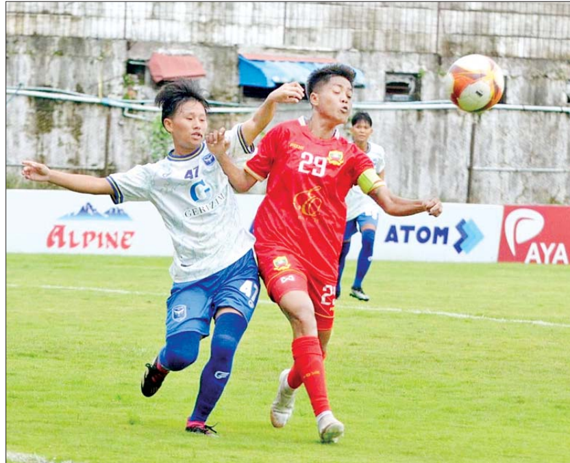
ဧရာဝတီအသင်းနှင့် ရှမ်းယူနိုက်တက်အသင်းတို့ ယှဉ်ပြိုင်နေစဉ်။

၂၀၂၄ ခုနှစ် (၇၇)နှစ်မြောက် အာဇာနည်နေ့ အခမ်းအနား MRTV မှ တိုက်ရိုက်ထုတ်လွှင့်မည် နေပြည်တော် ဇူလိုင် ၁၇ ဇူလိုင် ၁၉ ရက်တွင် ရောက်ရှိမည့် (၇၇)နှစ်မြောက် အာဇာနည်နေ့ အခမ်းအနားကို ဇူလိုင် ၁၉ ရက် နံနက် ၈ နာရီတွင် ရန်ကုန်မြို့ ဗဟန်းမြို့နယ်ရှိ အာဇာနည်ဗိမာန်၌ ကျင်းပမည်ဖြစ်သည်။ ထုတ်လွှင့်သွားမည့် အဆိုပါအခမ်းအနားကျင်းပပုံများကို ဇူလိုင် ၁၉ ရက် နံနက် ၇ နာရီ ၄၅ မိနစ် မှစတင်ပြီး မြန်မာ့အသံနှင့် ရုပ်မြင်သံကြား၏ MRTV - HD၊ MRTV News၊ MRTV Parliament၊ MRTV NRC၊ MWD - HD၊ MWD Variety HD၊ MITV၊ MOI Website၊ MRTV Website နှင့် မြန်မာ့အသံရေဒီယို၊ သင်္ဃန်း FM၊ Star FM၊ ပတ္တမြား FM၊ FM ပုဂံ၊ ပဉ္စဝတီ FM၊ မန္တလေး FM၊ ချယ်ရီ FM၊ ရွှေ FM နှင့် MRTV App အပါအဝင် Online တို့မှ တိုက်ရိုက်(LIVE) ထုတ်လွှင့်သွားမည် ဖြစ်သည်။ သတင်းစဉ်