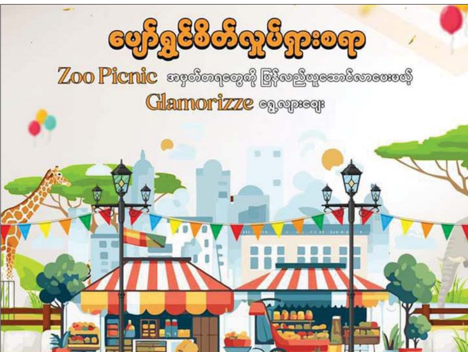
တိရစ္ဆာန်ဥယျာဉ်(ရန်ကုန်)တွင် ပြုလုပ်မည့် ရွှေလျားဈေးရောင်းပွဲတော်ကြော်ငြာပုံ။

ရန်ကုန် ဇူလိုင် ၁၇ လူဦးရေ ၁၀၀၀၀ ခန့် ပါဝင်ဆင်နွှဲမည့် Glamorizze ၏ ပထမဦးဆုံးသော ရွှေလျားဈေးရောင်းပွဲတော်ကြီးကို တိရစ္ဆာန်ဥယျာဉ်(ရန်ကုန်)တွင် သုံးရက်ကြာပြုလုပ်သွားမည်ဖြစ်ကြောင်း သိရသည်။ တိရစ္ဆာန်ဥယျာဉ်(ရန်ကုန်)တွင် ရွှေလျား ဈေးရောင်းပွဲတော်ကို ဇူလိုင် ၁၉ ရက်မှ ၂၁ ရက် အထိ သုံးရက်တိုင်တိုင် ကျင်းပသွားမည်ဖြစ်ကြောင်း တိရစ္ဆာန်ဥယျာဉ်(ရန်ကုန်)က အသိပေးထားသည်။ ပွဲတော် ပထမရက်ဖြစ်သည့် ဇူလိုင် ၁၉ ရက်တွင် JOY BAND ၏ တေးဂီတဖျော်ဖြေတင်ဆက်မှုများ၊ Junior Azalea Star အဖွဲ့၏ Baby Talent Show၊ Rose Mary ၏ ဖျော်ဖြေတင်ဆက်မှုများအပြင် စာမျက်နှာ ၁၆ ကော်လံ ၅ သို့ ၀