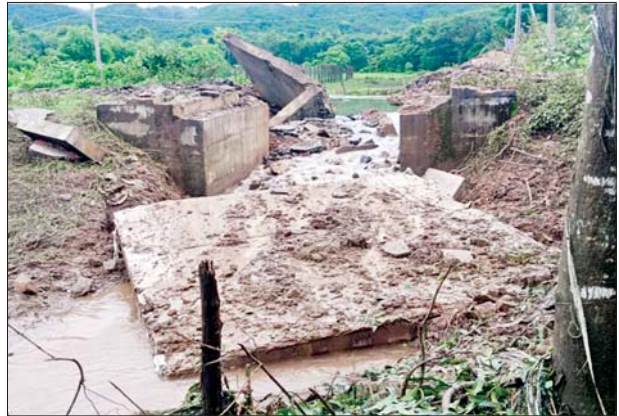
KNLA အဖွဲ့မှ အကြမ်းဖက်မှုကို လိုလားသူများနှင့် PDF အမည်ခံ အကြမ်းဖက်ပူးပေါင်းအဖွဲ့တို့မှ မိုင်းထောင်ဖောက်ခွဲဖျက်ဆီး မှုကြောင့် ပျက်စီးခဲ့သည့် တံတားအားတွေ့မြင်ရစဉ်။