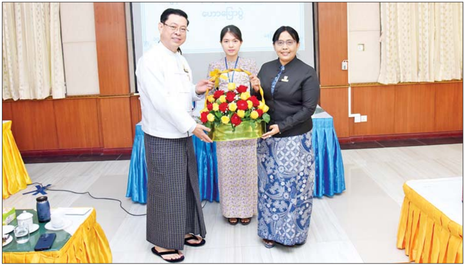
ခင်မောင်ဦးဆောင်သောအဖွဲ့က ဥပဒေရေးရာဝန်ကြီး ဌာနရှိ အရာထမ်း/အမှုထမ်းများ၏ သွားနှင့်ခံတွင်း ဆိုင်ရာရောဂါများ စစ်ဆေးကုသပေးခြင်းနှင့် နေပြည်တော် ပြည်သူ့ဆေးရုံကြီး (ခုတင်-၁၀၀၀)မှ တွဲဖက်ပါမောက္ခ ဒေါက်တာခင်စန္ဒာ ဦးဆောင် သောအဖွဲ့က ဆီးချို၊ သွေးချို စစ်ဆေးပေးခြင်းတို့ကို ဆောင်ရွက်ပေးခဲ့ကြောင်း သိရသည်။ သတင်းစဉ်

လည်းကောင်း ဆွေးနွေးကြပြီး ဆီးချို၊ သွေးချိုနှင့် သွေးတိုးရောဂါဆိုင်ရာ ကြိုတင်ကာကွယ်ရေး နည်းလမ်းများ သတိပြုလိုက်နာဆင်ခြင်ရမည့် ဆောင်ရန်၊ ရောင်ရန်များ၊ ရာသီအပြောင်းအလဲ ကြောင့်ကျန်းမာရေးအပေါ်တွင်သက်ရောက်နိုင်သည့် အချက်များကို ရှင်းလင်းကြရာ ဆွေးနွေးပွဲသို့ တက်ရောက်လာသူများက သိရှိလိုသည်များကို မေးမြန်းဆွေးနွေးကြသည်။ ထို့နောက် ပြည်ထောင်စုဝန်ကြီးနှင့် ပြည် ထောင်စုရှေ့နေချုပ်က ကျေးဇူးတင်စကား ပြောကြား သည်။ ထို့ပြင် ဥပဒေရေးရာဝန်ကြီးဌာနရှိ သတ်မှတ် နေရာများ၌ နေပြည်တော် သွားနှင့်ခံတွင်း အထူးကု ဆေးရုံကြီးမှ ဆေးရုံအုပ်ကြီး ပါမောက္ခ ဒေါက်တာ