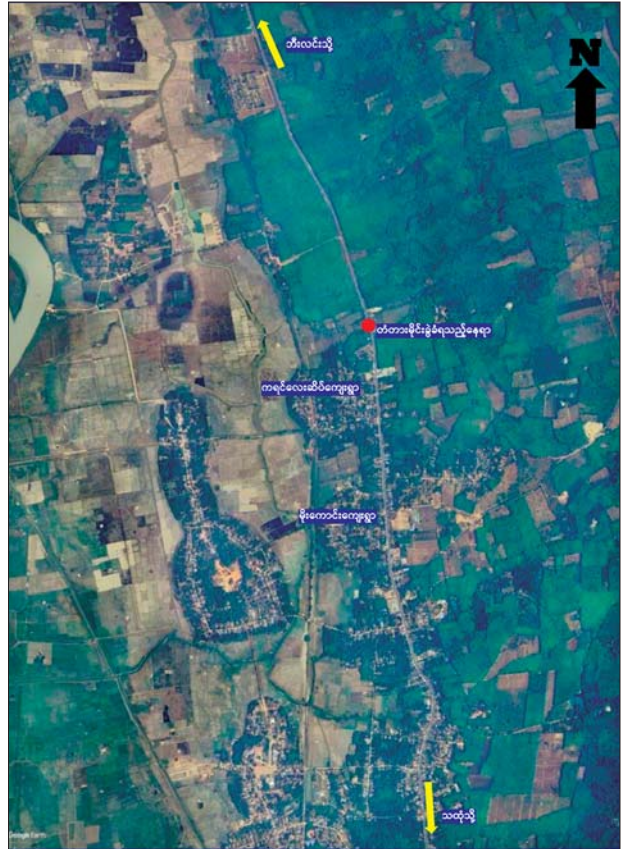
မွန်ပြည်နယ် သထုံမြို့နယ် ကရင်လေးဆိပ်ကျေးရွာအနီးရှိ တံတားအား KNLA အဖွဲ့မှ အကြမ်းဖက်မှုကို လိုလားသူများနှင့် PDF အကြမ်းဖက်ပူးပေါင်းအဖွဲ့မှ မိုင်းထောင်ဖောက်ခွဲ ဖျက်ဆီးခဲ့သည့် ဖြစ်စဉ်ပြပုံ။

သွားသည့် တံတားအား အမြန်ဆုံးပြန်လည်ပြုပြင်နိုင်ရေး ဆက်လက် ဆောင်ရွက်လျက်ရှိကြောင်း သိရသည်။ သတင်းစဉ်