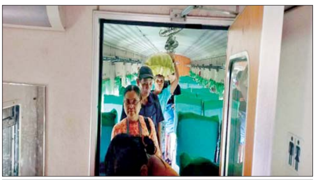
ပဲခူး-မော်လမြိုင်လမ်းပိုင်း သိမ်ဆိပ်ဘူတာနှင့် ဒုံဝန်းဘူတာအကြား ရထားလမ်းချော်ကျသည့် အမှတ်(၈၂)အစုန် ရထားပေါ်မှ ခရီးသည်များ ရထားကူးပြောင်းနေစဉ်။

မှထွက်ခွာလာသော အမှတ်(၈၂) အစုန် လူစီးအမြန်ရထားပေါ်တွင် လိုက်ပါလာသည့် ရိုးရိုးတန်းခရီး သည် ၃၁၃ ဦးနှင့် အထက်တန်းခရီး သည် ၁၄၆ ဦး စုစုပေါင်း ၄၅၉ ဦး အား ဆက်လက်ထွက်ခွာနိုင်ရေး အတွက် ကျိုက်ထိုတွင် ရောက်ရှိ နေသော အမှတ်(၈၁)အဆန် လူစီး အမြန်ရထားသည် ရထားလမ်း ချော်ကျသည့် နေရာသို့ ရောက်ရှိ ပြီး ညနေ ၄ နာရီခွဲတွင် ခရီးသည် များအားရထားကူးပြောင်းပြီးစီး၍ ညနေ ၅ နာရီခွဲတွင် အမှတ်(၈၂) အစုန် လူစီးအမြန်ရထားအဖြစ် ရန်ကုန်မြို့သို့ ဆက်လက်ပို့ဆောင် ပေးနိုင်ခဲ့သည်။ အမှတ်(၈၁)အဆန်လူစီးအမြန် ရထားမှ ခရီးသည်များ ဆက်လက် ထွက်ခွာနိုင်ရေးအတွက် လမ်းချော်