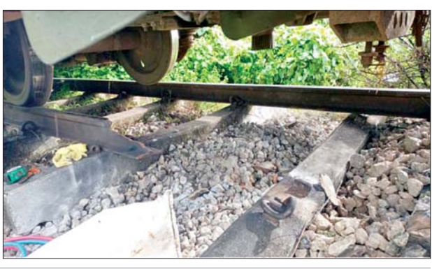
ပဲခူး-မော်လမြိုင်လမ်းပိုင်း သိမ်ဆိပ်ဘူတာနှင့် ဒုံဝန်းဘူတာအကြား အမှတ်(၈၂)အစုန် လူစီးအမြန်ရထား လမ်းချော်ကျမှုအခြေအနေ။

မှထွက်ခွာလာသော အမှတ်(၈၂) အစုန် လူစီးအမြန်ရထားပေါ်တွင် လိုက်ပါလာသည့် ရိုးရိုးတန်းခရီး သည် ၃၁၃ ဦးနှင့် အထက်တန်းခရီး သည် ၁၄၆ ဦး စုစုပေါင်း ၄၅၉ ဦး အား ဆက်လက်ထွက်ခွာနိုင်ရေး အတွက် ကျိုက်ထိုတွင် ရောက်ရှိ နေသော အမှတ်(၈၁)အဆန် လူစီး အမြန်ရထားသည် ရထားလမ်း ချော်ကျသည့် နေရာသို့ ရောက်ရှိ ပြီး ညနေ ၄ နာရီခွဲတွင် ခရီးသည် များအားရထားကူးပြောင်းပြီးစီး၍ ညနေ ၅ နာရီခွဲတွင် အမှတ်(၈၂) အစုန် လူစီးအမြန်ရထားအဖြစ် ရန်ကုန်မြို့သို့ ဆက်လက်ပို့ဆောင် ပေးနိုင်ခဲ့သည်။ အမှတ်(၈၁)အဆန်လူစီးအမြန် ရထားမှ ခရီးသည်များ ဆက်လက် ထွက်ခွာနိုင်ရေးအတွက် လမ်းချော်