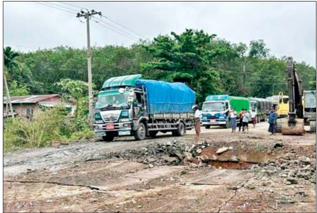
မွန်ပြည်နယ် သထုံမြို့နယ် ကရင်လေးဆိပ်ကျေးရွာအနီးရှိ တံတားအား မော်တော်ယာဉ်များ ဖြတ်သန်းသွားလာနိုင်ရေး ယာယီ တံတား ဆောင်ရွက်ပေးထားမှုအား တွေ့မြင်ရစဉ်။