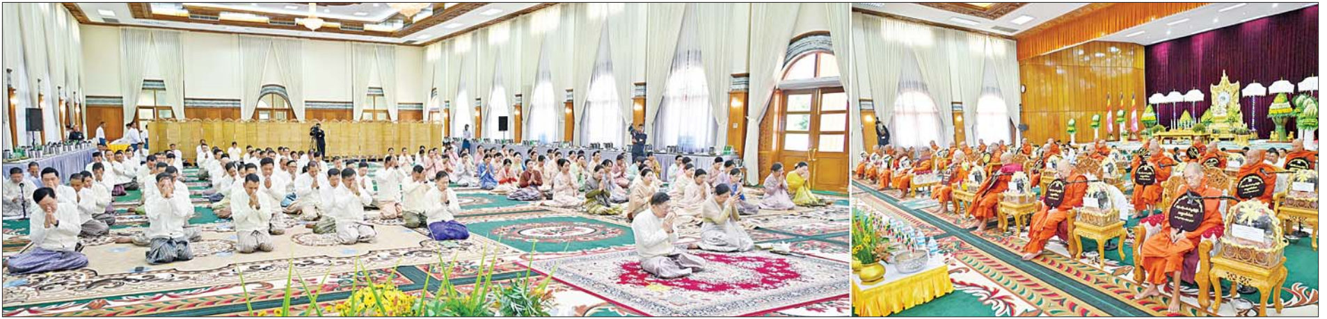
နိုင်ငံတော်စီမံအုပ်ချုပ်ရေးကောင်စီဥက္ကဋ္ဌ တပ်မတော်ကာကွယ်ရေးဦးစီးချုပ် ဗိုလ်ချုပ်မှူးကြီးမင်းအောင်လှိုင်နှင့် ဇနီး ဒေါ်ကြူကြူလှ၊ အခမ်းအနား တက်ရောက်လာကြသူများ နိုင်ငံတော်သံဃမဟာနာယက အဖွဲ့ဥက္ကဋ္ဌ သန်လျင်မင်းကျောင်းဆရာတော်ကြီး ဒေါက်တာဘဒ္ဒန္တ စန္ဒိမာဘိဝံသထံမှ ကိုးပါးသီလ ခံယူဆောက်တည်ကြစဉ်။

၀ ရှေ့ဖုံးမှ ဆရာတော်ကြီးများ အပါအဝင် ပင့်ဖိတ်ထားသည့် ဆရာတော်ကြီး ၂၇ ပါး ကြွရောက်ချီးမြှင့်တော်မူ ကြပြီး နိုင်ငံတော်စီမံအုပ်ချုပ်ရေး ကောင်စီဥက္ကဋ္ဌ တပ်မတော် ကာကွယ်ရေးဦးစီးချုပ်နှင့် ဇနီးတို့ နှင့်အတူ နိုင်ငံတော်စီမံအုပ်ချုပ်ရေး ကောင်စီ ဒုတိယဥက္ကဋ္ဌ ဒုတိယ တပ်မတော်ကာကွယ်ရေး ဦးစီး ချုပ် ကာကွယ်ရေးဦးစီးချုပ် (ကြည်း) ဒုတိယဗိုလ်ချုပ်မှူးကြီး စိုးဝင်း၊ ညှိနှိုင်းကွပ်ကဲရေးမှူး (ကြည်း) ရှေ့ (လေ) ဗိုလ်ချုပ်ကြီး မောင်မောင်အေးနှင့် ဇနီး၊ ကာကွယ်ရေးဦးစီးချုပ်(ရေ) နှင့် ဇနီး၊ ကာကွယ်ရေးဦးစီးချုပ်(လေ) နှင့် ဇနီး၊ ပြည်ထောင်စုအဆင့် ပုဂ္ဂိုလ်များနှင့် ဇနီးများ၊ ကာကွယ် ရေးဦးစီးချုပ်ရုံးမှ အဆင့်မြင့် တပ်မတော် အရာရှိကြီးများနှင့် ဇနီးများ၊ တာဝန်ရှိသူများ