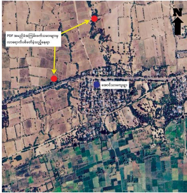
PDF အမည်ခံအကြမ်းဖက်သမားများက ပခုက္ကူမြို့ အောင်သာ ကျေးရွာအတွင်းသို့ လက်နက်ကြီး၊ လက်နက်ငယ်များ၊ Drop Bomb များဖြင့် ပစ်ခတ်တိုက်ခိုက်ခဲ့သည့် ဖြစ်စဉ်ပြပုံ။

ထိုသို့ ဒေသခံပြည်သူများ အေးချမ်းစွာနေထိုင်လျက်ရှိသော မြို့၊ ရွာများအတွင်းသို့ လက်နက်ကြီး၊ လက်နက်ငယ်များ၊ Drop Bomb များ ကြုံချတိုက်ခိုက်ခြင်းကြောင့် ပြည်သူ့လူထု၏ အသက်အိုးအိမ်၊ စည်းစိမ်များ ပျက်စီးဆုံးရှုံးခဲ့ရပြီး ထိုသို့ အကြမ်းဖက်သမားများ၏ လုပ်ရပ်များကို ဒေသခံပြည်သူလူထုမှ လုံးဝလက်ခံနိုင်ခြင်းမရှိဘဲ