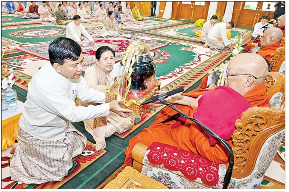
ညှိနှိုင်းကွပ်ကဲရေးမှူး (ကြည်း) ရှေ့ (လေ) ဗိုလ်ချုပ်ကြီးမောင်မောင်အေးနှင့် ဇနီးတို့က ဆရာတော်ထံ ဝါဆိုသင်္ကန်းနှင့် လှူဖွယ်ပစ္စည်းများ ဆက်ကပ်လှူဒါန်းစဉ်။