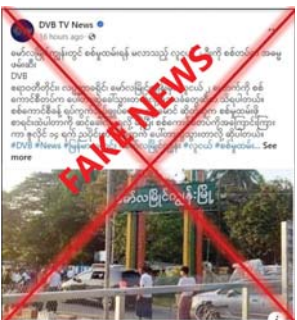
ဖြန့်ဝေနေသည်ကို တွေ့ရှိရသည်။ အဆိုပါသတင်းနှင့်ပတ်သက်၍

နေပြည်တော် ဇူလိုင် ၁၇ ဧရာဝတီတိုင်း ဒေသကြီး မော်လမြိုင်ကျွန်းမြို့တွင် စစ်မှု ထမ်းဆောင်ရန်အမည်စာရင်းတွင် ပါဝင်ပြီး လာရောက်သတင်းပို့ခြင်း မရှိသည့် လူငယ်နှစ်ဦးကို လုံခြုံရေး တပ်ဖွဲ့ဝင်များက ဇူလိုင် ၁၄ ရက် တွင် အဓမ္မဖမ်းဆီးခေါ်ဆောင် သွားကြောင်း သတင်းတု၊ သတင်း အမှားများကို တရားမဝင်ပြည်ပျက် မီဒီယာများက လုပ်ကြံရေးသား