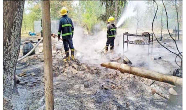
PDF အမည်ခံအကြမ်းဖက်သမားများက ပခုက္ကူမြို့ အောင်သာ ကျေးရွာအတွင်းရှိ နေအိမ်များအား မီးရှို့ဖျက်ဆီးခဲ့မှုကြောင့် မီးလောင် ပျက်စီးခဲ့ရသည့် နေအိမ်များအား တွေ့မြင်ရစဉ်။