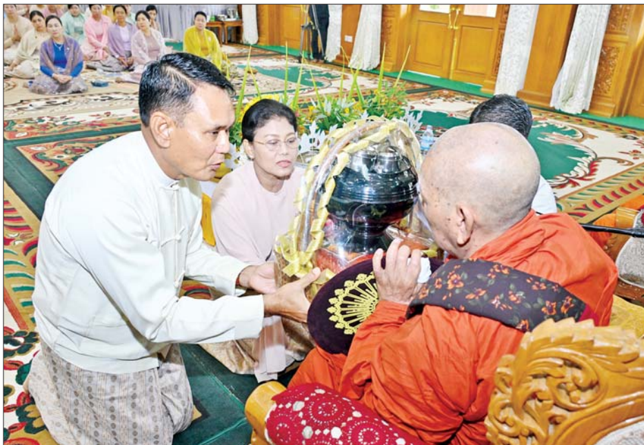
ကာကွယ်ရေးဦးစီးချုပ်(ရေ)နှင့်ဇနီးတို့က ဆရာတော်ထံ ဝါဆိုသင်္ကန်းနှင့် လှူဖွယ်ပစ္စည်းများဆက်ကပ် လှူဒါန်းစဉ်။