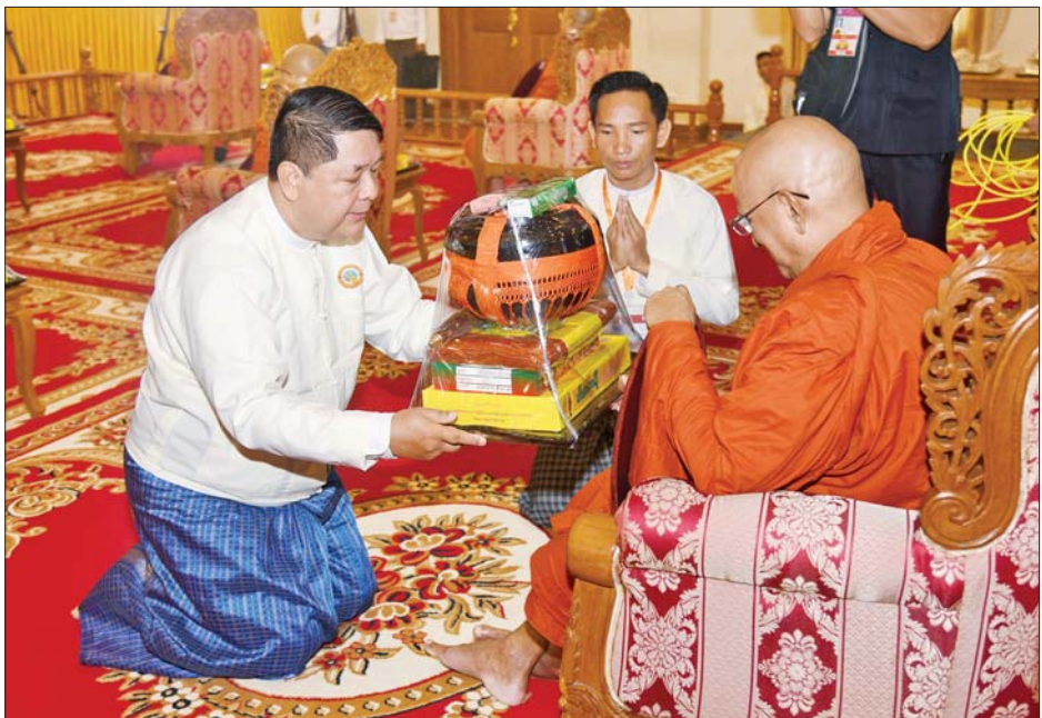
ပြည်ထောင်စုတရားသူကြီးချုပ် ဦးသာဌေး ဆရာတော်ကြီးထံ ဝါဆိုသင်္ကန်းနှင့် လှူဖွယ်ပစ္စည်းများ ဆက်ကပ်လှူဒါန်းစဉ်။