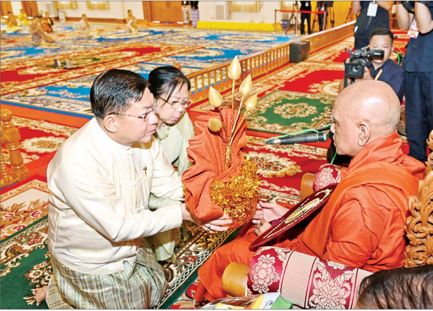
နိုင်ငံတော်စီမံအုပ်ချုပ်ရေးကောင်စီဥက္ကဋ္ဌ နိုင်ငံတော်ဝန်ကြီးချုပ် ဗိုလ်ချုပ်မှူးကြီး မင်းအောင်လှိုင်နှင့် ဇနီး ဒေါ်ကြူကြူလှ နိုင်ငံတော်သံဃမဟာနာယက အဖွဲ့ဥက္ကဋ္ဌ သန့်လျင်မင်းကျောင်းဆရာတော်ကြီးထံ ဝါဆိုသင်္ကန်းနှင့် လှူဖွယ်ပစ္စည်းများ ဆက်ကပ်လှူဒါန်းစဉ်။

နေပြည်တော် ဇူလိုင် ၁၆ ပြည်ထောင်စုသမ္မတ မြန်မာနိုင်ငံတော် နိုင်ငံတော်စီမံအုပ်ချုပ်ရေးကောင်စီ၏ ၂၀၂၄ ခုနှစ် ဝါဆိုသင်္ကန်းဆက်ကပ်လှူဒါန်းပွဲ မဟာမင်္ဂလာအခမ်းအနားကို ယနေ့နံနက်ပိုင်းတွင် နေပြည်တော်ကောင်စီ နယ်မြေ ဥပုတသန္တိစေတီတော်မြတ်ကြီး ပရိဝုဏ်တော်အတွင်းရှိ သာသနာ့မဟာဗိမာန်တော်ကြီး၌ ကျင်းပပြုလုပ်ရာ နိုင်ငံတော်စီမံအုပ်ချုပ်ရေးကောင်စီ ဥက္ကဋ္ဌ နိုင်ငံတော်ဝန်ကြီးချုပ် ဗိုလ်ချုပ်မှူးကြီး မင်းအောင်လှိုင်နှင့် ဇနီး ဒေါ်ကြူကြူလှတို့ တက်ရောက်ကြည့်ညှိပြီး ဝါဆိုသင်္ကန်းနှင့် လှူဖွယ်ပစ္စည်းများ ဆက်ကပ်လှူဒါန်းကြသည်။ ကြွရောက်ချီးမြှင့်တော်မူ အဆိုပါ အခမ်းအနားသို့ နိုင်ငံတော်သံဃမဟာနာယကအဖွဲ့ဥက္ကဋ္ဌ ရန်ကုန်တိုင်းဒေသကြီး သန့်လျင်မြို့ မင်းကျောင်းပထမပြန်စာသင်တိုက် ပဓာနနာယကအဂ္ဂမဟာပဏ္ဍိတအဂ္ဂမဟာသဒ္ဓမ္မဇောတိက ဓဇ ဒေါက်တာဘဒ္ဒန္တ စန္ဒိမာဘိဝံသနှင့် နိုင်ငံတော်သံဃမဟာနာယကအဖွဲ့အကျိုးတော်ဆောင်မန္တလေးမြို့ မစိုးရိမ်တိုက်သစ် မဟာနာယက ဓမ္မသမိဒ္ဓိကျောင်းဆရာတော် အဂ္ဂမဟာပဏ္ဍိတ အဂ္ဂမဟာသဒ္ဓမ္မဇောတိကဓဇ မဟာဓမ္မကထိက ဗဟုဇနဟိတ ဓရဘဒ္ဒန္တ ဝါသေဋ္ဌဘိဝံသတို့ အမှူးပြုသော ဥပုတသန္တိစေတီတော်ဂေါပကအဖွဲ့၏ ဩဝါဒါစရိယဆရာတော်ကြီးများအပါအဝင် ပင့်ဖိတ်ထားသည့် ဆရာတော်ကြီး ၂၇ ပါး ကြွရောက်ချီးမြှင့်တော်မူကြပြီး နိုင်ငံတော်စီမံအုပ်ချုပ်ရေးကောင်စီဥက္ကဋ္ဌ နိုင်ငံတော်ဝန်ကြီးချုပ်နှင့် ဇနီး၊ စာမျက်နှာ ၃ ကော်လံ ၁ သို့ ။