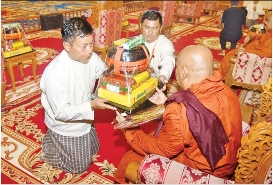
နိုင်ငံတော်စီမံအုပ်ချုပ်ရေးကောင်စီအဖွဲ့ဝင် ခွန်စံလွင် ဆရာတော်ကြီးထံ ဝါဆိုသင်္ကန်းနှင့် လှူဖွယ်ပစ္စည်းများ ဆက်ကပ်လှူဒါန်းစဉ်။

နေ့ဆွမ်း ဆက်ကပ်လှူဒါန်း နိုင်ငံတော်စီမံအုပ်ချုပ်ရေးကောင်စီဥက္ကဋ္ဌ နိုင်ငံတော်ဝန်ကြီးချုပ် ဗိုလ်ချုပ်မှူးကြီး မင်းအောင်လှိုင်နှင့် ဇနီး ဒေါ်ကြူကြူလှတို့ ဆရာတော်၊ သံဃာတော်များအား နေ့ဆွမ်းဆက်ကပ်လှူဒါန်းစဉ်။