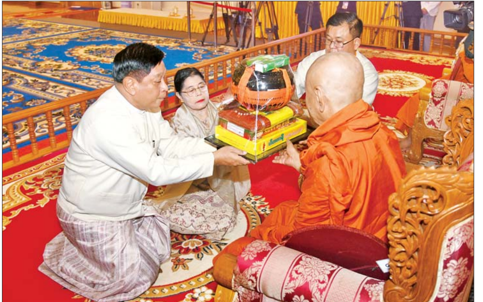
နိုင်ငံတော်စီမံအုပ်ချုပ်ရေးကောင်စီ အဖွဲ့ဝင် ဗိုလ်ချုပ်ကြီး တင်အောင်စန်းနှင့်ဇနီးတို့က ဝဲကြီးကျောင်း ဆရာတော်ကြီးထံ ဝါဆိုသင်္ကန်းနှင့် လှူဖွယ်ပစ္စည်းများ ဆက်ကပ်လှူဒါန်းစဉ်။