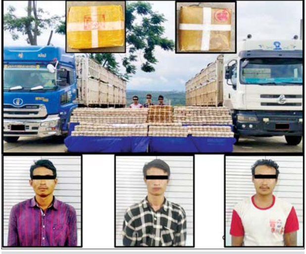
သိမ်းဆည်းရမိသည့် စိတ်ကြွေးသွပ်ဆေးပြားများနှင့်အတူ တွေ့ရစဉ်။ ပြား ၁၁ ဒသမ ၂ သန်း သိမ်းဆည်းရမိခဲ့ပြီး စစ်ဆေးဖော်ထုတ်ချက်အရ ယင်းနေ့နံနက် ၁၀ နာရီခွဲတွင် ပြင်ဦးလွင်မြို့ ရပ်ကွက်ကြီး(၁၄) မြို့ရှောင်လမ်း၌ မောင်းငယ်(ခ) ကျော်ကြီးကို ၁၈ ဘီးတွဲယာဉ်

နေပြည်တော် ဇူလိုင် ၁၆ မန္တလေးတိုင်းဒေသကြီး ပြင်ဦးလွင်မြို့နယ်တွင် ငွေကျပ် ၁၆ ဒသမ ၈ ဘီလီယံတန်ဖိုးရှိ စိတ်ကြွေးသွပ်ဆေးပြား ၁၁ ဒသမ ၂ သန်း သိမ်းဆည်းရမိခဲ့ကြောင်း မြန်မာနိုင်ငံရဲတပ်ဖွဲ့မှ သိရသည်။ ဖြစ်စဉ်မှာ မူးယစ်ဆေးဝါးတားဆီးနှိမ်နင်းရေးရဲတပ်ဖွဲ့မှ တပ်ဖွဲ့ဝင်များပါဝင်သော ပူးပေါင်းအဖွဲ့သည် ဇူလိုင် ၁၄ ရက် နံနက် ၆ နာရီခွဲတွင် မန္တလေးတိုင်းဒေသကြီး ပြင်ဦးလွင်မြို့နယ် ဝက်ဝံကျေးရွာအနီးတွင် နေထိုင်သူမှ မန္တလေးသို့ မင်းဇော် မောင်းနှင်ပြီး မင်းကို လိုက်ပါသည့် ၂၂ ဘီးတွဲ ယာဉ်ကို သတင်းအရရှိရာမှ ရှာဖွေရယူ ယာဉ်ပေါ်မှ စိတ်ကြွေးသွပ်ဆေး