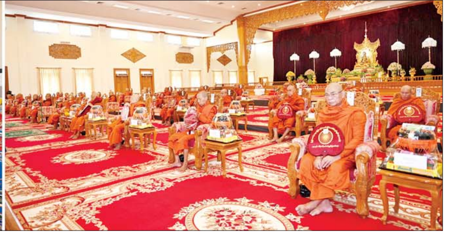
နိုင်ငံတော်စီမံအုပ်ချုပ်ရေးကောင်စီဥက္ကဋ္ဌ နိုင်ငံတော်ဝန်ကြီးချုပ် ဗိုလ်ချုပ်မှူးကြီး မင်းအောင်လှိုင်နှင့်ဇနီး ဒေါ်ကြူကြူလှနှင့် အခမ်းအနား တက်ရောက်လာကြသူများ ဆရာတော်ကြီးများ ရွတ်ပွားချီးမြှင့်တော်မူသည့် မေတ္တာသုတ်ပရိတ်တရားတော်များကို နာယူကြည်ညိုကြစဉ်။

✦ စာမျက်နှာ ၃ မှ ထို့နောက် နိုင်ငံတော်စီမံအုပ်ချုပ်ရေးကောင်စီ ဥက္ကဋ္ဌ နိုင်ငံတော်ဝန်ကြီးချုပ်နှင့် ဇနီးတို့က နိုင်ငံတော်သံဃမဟာနာယကအဖွဲ့ဥက္ကဋ္ဌ သန့်လှိုင်မင်းကျောင်း ဆရာတော်ကြီးထံ ဝါဆိုသင်္ကန်းနှင့် လှူဖွယ်ပစ္စည်းများကို ဆက်ကပ်လှူဒါန်းသည်။