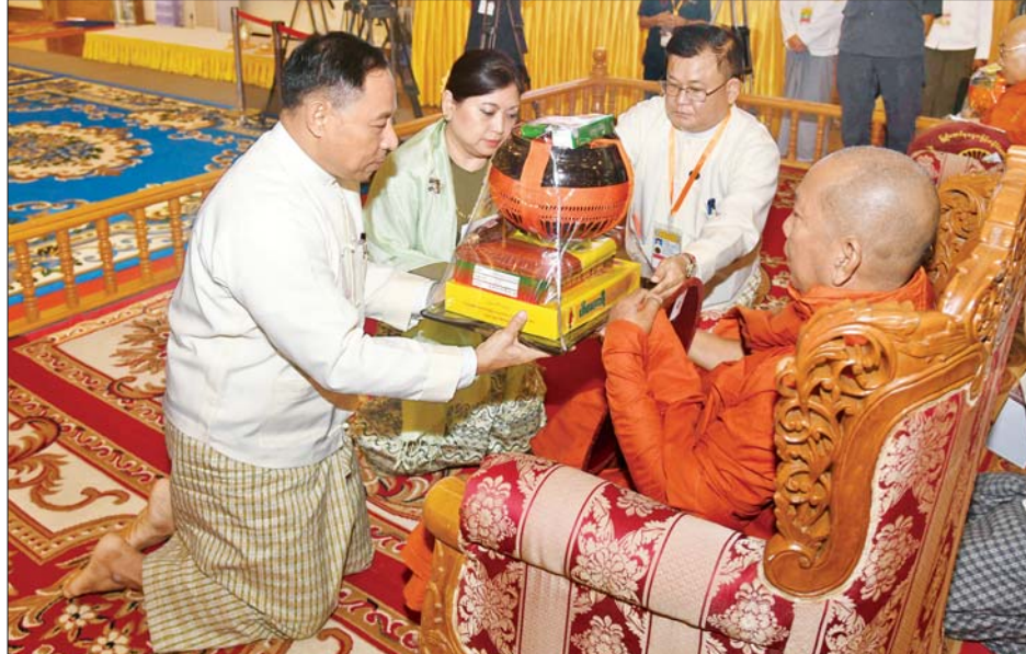
နိုင်ငံတော်စီမံအုပ်ချုပ်ရေးကောင်စီ အဖွဲ့ဝင် ဗိုလ်ချုပ်ကြီး ရာပြည့်နှင့်ဇနီးတို့က အောင်စည်သာကျောင်း ဆရာတော်ကြီးထံ ဝါဆိုသင်္ကန်းနှင့် လှူဖွယ်ပစ္စည်းများ ဆက်ကပ်လှူဒါန်းစဉ်။