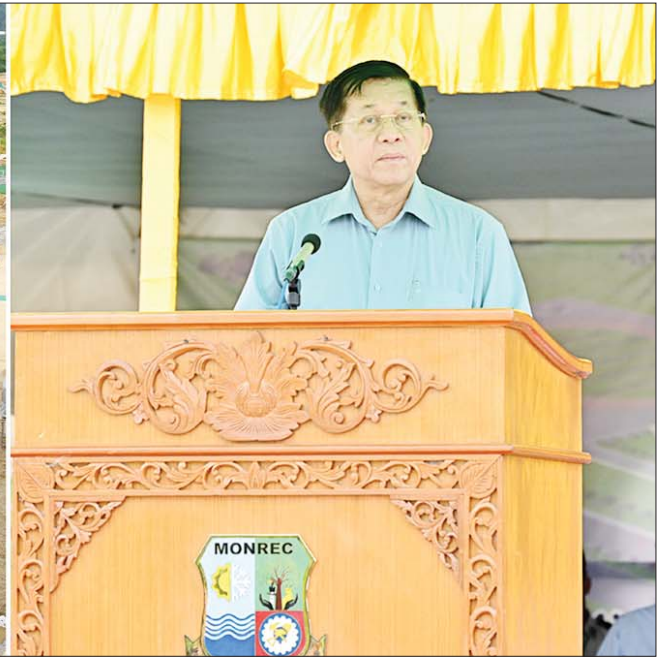
နိုင်ငံတော်စီမံအုပ်ချုပ်ရေးကောင်စီဥက္ကဋ္ဌ နိုင်ငံတော်ဝန်ကြီးချုပ် ဗိုလ်ချုပ်မှူးကြီး မင်းအောင်လှိုင် ပြည်ထောင်စုနယ်မြေ နေပြည်တော် ၂၀၂၄ ခုနှစ် ဒုတိယအကြိမ် မိုးရာသီသစ်ပင်စိုက်ပျိုးပွဲတွင် အမှာစကား ပြောကြားစဉ်။

★ ရှေ့ဖိုးမှ အမှုထမ်းများ၊ ပါမောက္ခချုပ်၊ ဒုတိယ ပါမောက္ခချုပ်၊ ကထိက ဆရာ ဆရာမ ကြီးများ၊ ကျောင်းသား ကျောင်းသူများ နှင့်တာဝန်ရှိသူများတက်ရောက်ကြသည်။