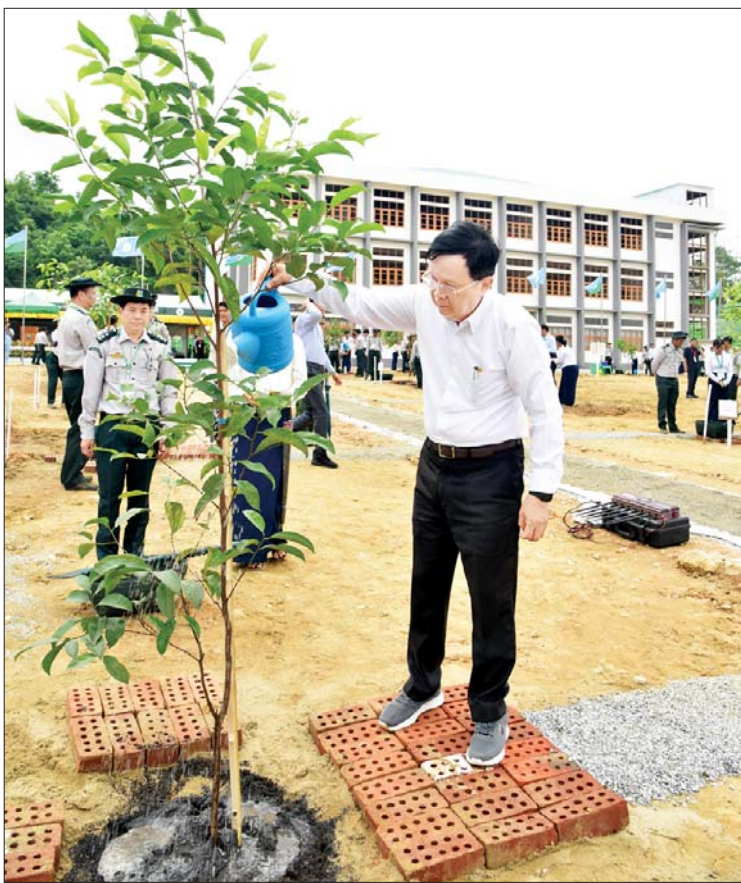
နိုင်ငံတော်စီမံအုပ်ချုပ်ရေးကောင်စီအတွင်းရေးမှူး ဒုတိယဗိုလ်ချုပ်ကြီး အောင်လင်းဒွေး ပျိုးပင်ကိုစိုက်ပျိုးပေးစဉ်။

နေပြည်တော်နည်းပညာတက္ကသိုလ် တစ်ခုတည်းဖြင့် ပြည့်စုံလုံလောက်မှု မရှိဟု ယူဆသည့်အတွက် Naypyitaw State Polytechnic University အသစ် တည်ဆောက်ဖွင့်လှစ်ရန် စီမံဆောင်ရွက် ခဲ့ခြင်းဖြစ်ကြောင်း၊ မြင်တွေ့ရသည့်အတိုင်း လာမည့်ပညာသင်နှစ်တွင် Naypyitaw State Polytechnic University အဖြစ် အင်ဂျင်နီယာ ဘာသာရပ်များအပြင် ကွန်ပျူတာသိပ္ပံနှင့် ကွန်ပျူတာနည်းပညာ ဘာသာရပ်များကိုပါ တိုးချဲ့သင်ကြားနိုင် ရေး လိုအပ်သည်များကို ကြိုတင်ပြင်ဆင်