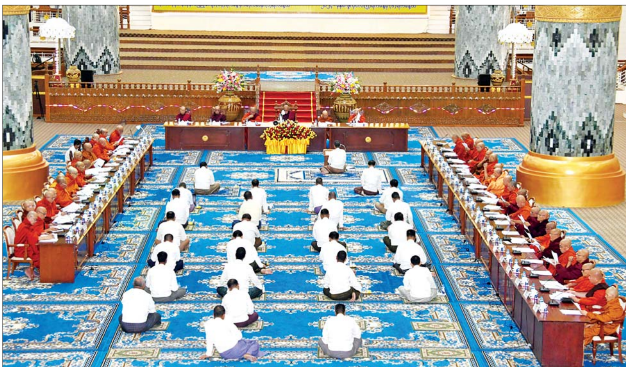
အဋ္ဌမအကြိမ် နိုင်ငံတော်သံဃမဟာနာယကအဖွဲ့ ၄၇ ပါးစုံညီ သတ္တရသမအစည်းအဝေး ပထမနေ့ ကျင်းပစဉ်။

ရန်ကုန် ဇူလိုင် ၅ အဋ္ဌမအကြိမ် နိုင်ငံတော်သံဃမဟာနာယကအဖွဲ့ ၄၇ ပါးစုံညီ သတ္တရသမအစည်းအဝေး ပထမနေ့ကို ယနေ့နံနက် ၈ နာရီတွင် ရန်ကုန်မြို့ သီရိမင်္ဂလာကမ္ဘာအေး ကုန်းမြေ မဟာပါသာဏလိုဏ်ဂူ တော်၌ ကျင်းပသည်။