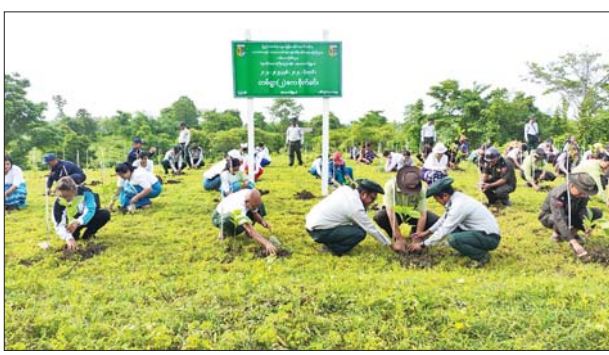
ပြည်သူများ စုစုပေါင်းအင်အား ၃၁၀ က သတ်မှတ်နေရာများတွင် စုပေါင်း စိုက်ပျိုးခဲ့ကြောင်း သိရသည်။