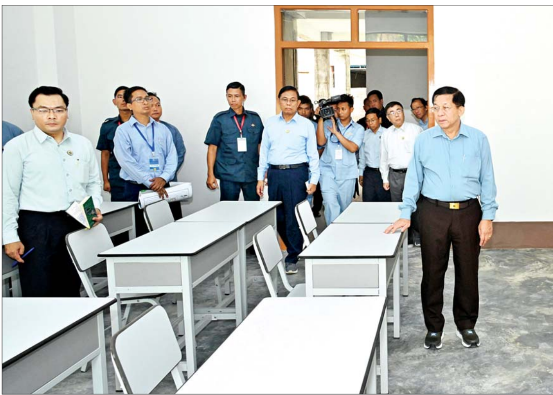
နိုင်ငံတော်စီမံအုပ်ချုပ်ရေးကောင်စီဥက္ကဋ္ဌ နိုင်ငံတော်ဝန်ကြီးချုပ် ဗိုလ်ချုပ်မှူးကြီးမင်းအောင်လှိုင် Naypyitaw State Polytechnic University အတွင်း ကြည့်ရှုစစ်ဆေးစဉ်။

အာဆီယံလမ်းမကြီးများ ဘေးဝဲယာ၊ အမြန်လမ်းမကြီး ဘေးဝဲယာနှင့် ရထားလမ်းများ ဘေးဝဲယာများတွင်လည်း သစ်ပင်များ စဉ်ဆက်မပြတ် စိုက်ပျိုးပြုစု ထိန်းသိမ်းကြရမည်ဖြစ်ကြောင်း၊ မြစ်၊ ချောင်း၊ အင်းအိုင်နှင့် ဆည်မြောင်းတာဝန်များ ရေရှည်တည်တံ့ရန်နှင့် မြေအောက်ရေ ထိန်းသိမ်းနိုင်ရန်အတွက် ရေဝေရေလဲ သစ်တောများကို ထိန်းသိမ်းကာကွယ်ကြရမည်ဖြစ်ကြောင်း၊ အဆိုပါလုပ်ငန်းများ