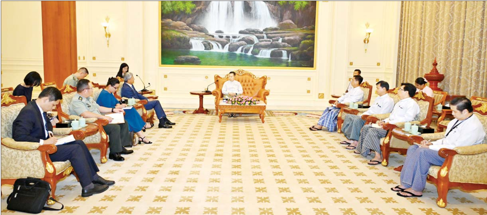
နိုင်ငံတော်စီမံအုပ်ချုပ်ရေးကောင်စီဒုတိယဥက္ကဋ္ဌ ဒုတိယဝန်ကြီးချုပ် ဒုတိယဗိုလ်ချုပ်မှူးကြီးစိုးဝင်း မြန်မာနိုင်ငံဆိုင်ရာ တရုတ်ပြည်သူ့သမ္မတနိုင်ငံ သံအမတ်ကြီး H.E. Mr. Chen Hai အား လက်ခံတွေ့ဆုံစဉ်။

နေပြည်တော် ဇူလိုင် ၅ နိုင်ငံတော် စီမံအုပ်ချုပ်ရေးကောင်စီဒုတိယဥက္ကဋ္ဌ ဒုတိယဝန်ကြီးချုပ် ဒုတိယဗိုလ်ချုပ်မှူးကြီး စိုးဝင်းသည် တာဝန်ပြီးဆုံး၍ ပြန်လည်ထွက်ခွာမည့် မြန်မာနိုင်ငံဆိုင်ရာ တရုတ်ပြည်သူ့သမ္မတနိုင်ငံ သံအမတ်ကြီး H.E. Mr. Chen Hai အား ယနေ့မွန်းလွဲပိုင်းတွင် နေပြည်တော်ရှိ နိုင်ငံတော်စီမံအုပ်ချုပ်ရေးကောင်စီဥက္ကဋ္ဌရုံး သံတမန်ဆောင် ဧည့်ခန်းမ၌ လက်ခံတွေ့ဆုံသည်။ အမြင်ချင်းဖလှယ်ဆွေးနွေးထိုသို့တွေ့ဆုံရာတွင် မြန်မာ-တရုတ် နှစ်နိုင်ငံအကြား ချစ်ကြည်ရင်းနှီးမှု တိုးတက်ကောင်းမွန်လျက်ရှိမှုနှင့် အေးအတူပူအမျှ ပူးပေါင်းဆောင်ရွက်မှုကဏ္ဍ အပါအဝင် ဘက်စုံမဟာဗျူဟာမြောက် စာမျက်နှာ ၇ ကော်လံ ၁ သို့