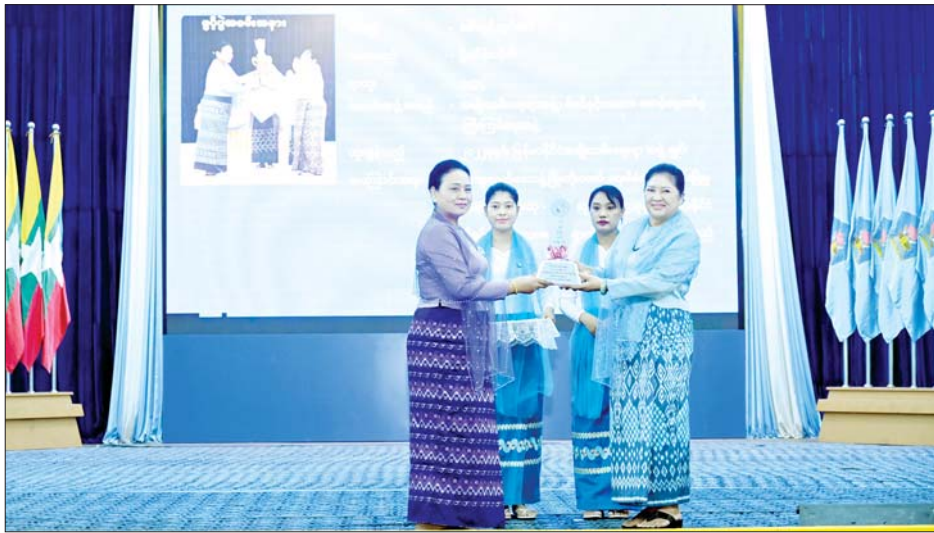
နိုင်ငံတော်စီမံအုပ်ချုပ်ရေးကောင်စီအဖွဲ့ဝင် ဒေါ်ဒွဲဘူ မြန်မာနိုင်ငံမိခင်နှင့်ကလေးစောင့်ရှောက်ရေး အသင်း နှစ်ပတ်လည်အစည်းအဝေးတွင် ထူးချွန်ဆုရရှိသူတစ်ဦးအား ဂုဏ်ပြုချီးမြှင့်ငွေနှင့် ဂုဏ်ပြု မှတ်တမ်းလွှာ ပေးအပ်ချီးမြှင့်စဉ်။

ထို့နောက် နိုင်ငံတော်စီမံအုပ်ချုပ်ရေးကောင်စီ