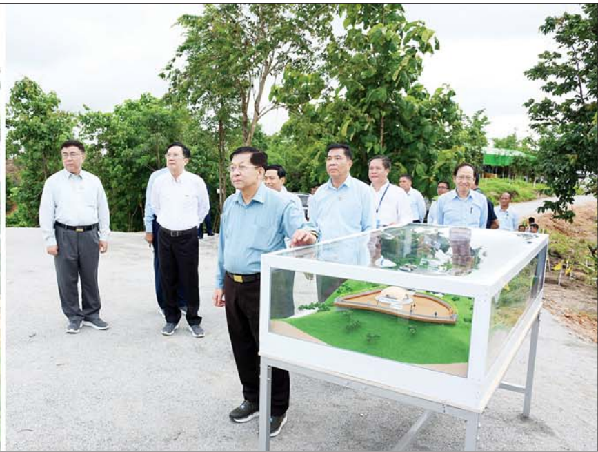
နိုင်ငံတော်စီမံအုပ်ချုပ်ရေးကောင်စီဥက္ကဋ္ဌ နိုင်ငံတော်ဝန်ကြီးချုပ် ဗိုလ်ချုပ်မှူးကြီးမင်းအောင်လှိုင် Naypyitaw State Polytechnic University ပရိဝုဏ်အတွင်းရှိ ရှုခင်းသာရင်ပြင်နေရာ ဆောင်ရွက်ထားရှိမှုကို ကြည့်ရှုစစ်ဆေးစဉ်။