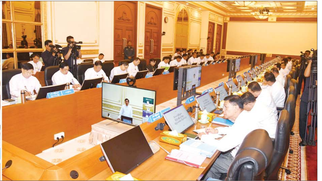
နိုင်ငံတော်စီမံအုပ်ချုပ်ရေးကောင်စီဥက္ကဋ္ဌ နိုင်ငံတော်ဝန်ကြီးချုပ် ဗိုလ်ချုပ်မှူးကြီး မင်းအောင်လှိုင် ပြည်ထောင်စုအစိုးရအဖွဲ့အစည်းအဝေးအမှတ်စဉ်(၅/၂၀၂၄) တွင် အမှာစကားပြောကြားစဉ်။