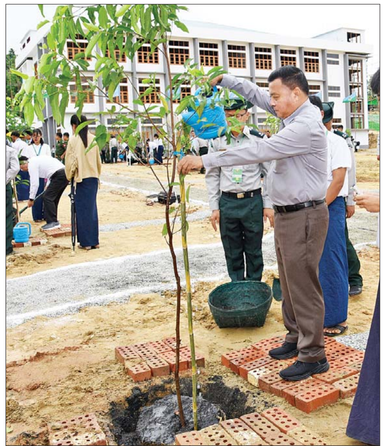
နိုင်ငံတော်စီမံအုပ်ချုပ်ရေးကောင်စီတွဲဖက်အတွင်းရေးမှူး ဒုတိယဗိုလ်ချုပ်ကြီး ရဲဝင်းဦး ပျိုးပင်ကိုစိုက်ပျိုးပေးစဉ်။

ဆောင်ရွက်လျက်ရှိကြောင်း။ ထို့ကြောင့်လည်း ယခုကဲ့သို့ဂုဏ်ယူ ဝင့်ကြားဖွယ်ရာ တက္ကသိုလ်ကြီးတွင် တက္ကသိုလ်များ၏ အင်ဂျင်နီယာ ဘာသာရပ်များအပြင် ကွန်ပျူတာသိပ္ပံနှင့် ကွန်ပျူတာနည်းပညာ ဘာသာရပ်များကိုပါ တိုးချဲ့သင်ကြားနိုင် ရေး လိုအပ်သည်များကို ကြိုတင်ပြင်ဆင် ဆောင်ရွက်လျက်ရှိကြောင်း။