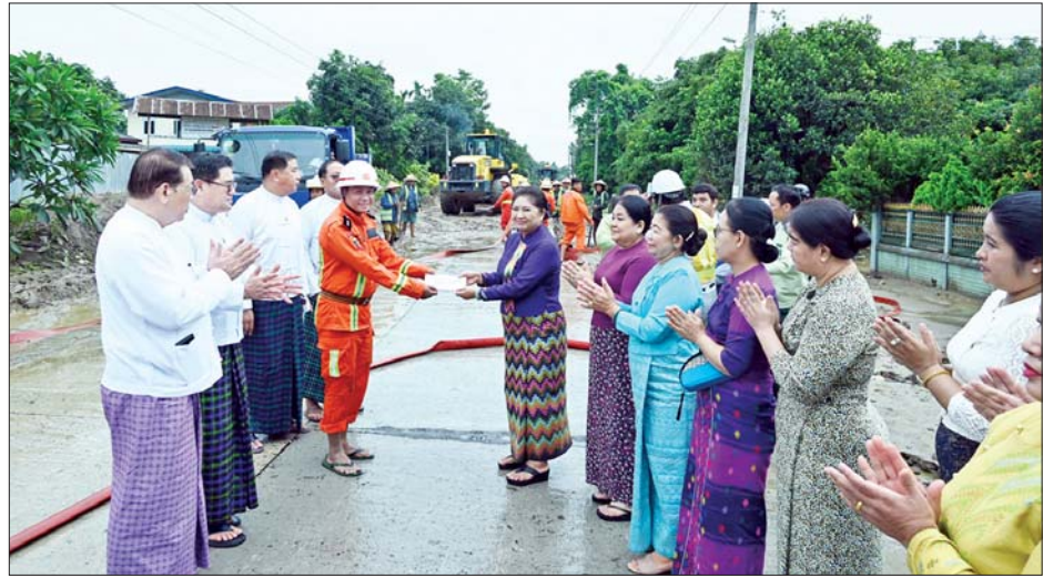
နိုင်ငံတော်စီမံအုပ်ချုပ်ရေးကောင်စီအဖွဲ့ဝင် ဒေါ်ဒွဲဘူ မီးသတ်တပ်ဖွဲ့ဝင်များအတွက် ထောက်ပံ့ချီးမြှင့် ငွေများ ပေးအပ်ချီးမြှင့်စဉ်။

ထို့နောက် နိုင်ငံတော်စီမံအုပ်ချုပ်ရေးကောင်စီ အဖွဲ့ဝင်၊ ပြည်နယ်ဝန်ကြီးချုပ်နှင့် တာဝန်ရှိသူများ သည် မြစ်ကြီးနားမြို့ လယ်ကုန်းရပ်ကွက်အတွင်း မြစ်ရေမြင့်တက်မှုကြောင့် နန်းမြေများ တင်ကျန်နေ မှုကို လမ်းဦးစီးဌာန စည်ပင်သာယာရေးအဖွဲ့ဝင်များ နှင့် မီးသတ်တပ်ဖွဲ့ဝင်များ စုပေါင်း၍ စက်ယန္တရား များဖြင့် နန်းမြေများ ဖယ်ရှားရှင်းလင်းနေမှု အခြေ အနေများကို သွားရောက်ကြည့်ရှုအားပေးကြပြီး ဝန်ထမ်းများအတွက် ထောက်ပံ့ချီးမြှင့်ငွေများ ပေးအပ်ချီးမြှင့်ခဲ့ကြောင်း သိရသည်။ သတင်းစဉ်