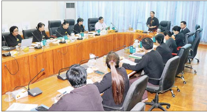
ပြင်ဆင်သည့် ဥပဒေ(မူကြမ်း) ကို လိုက်လျောညီထွေမှု ရှိစေရေး အဆိုပါဥပဒေ(မူကြမ်း)ကို ပြဋ္ဌာန်း FATF ၏ Recommendation 25 အတွက် ပြဋ္ဌာန်းရန် လိုအပ် နိုင်ရေးအပြီးသတ်ညှိနှိုင်းဆွေးနွေး အရ လက်ရှိအခြေအနေများနှင့် ကြောင်း သုံးသပ်တွေ့ရှိရသဖြင့် ခွဲကြောင်း သိရသည်။ သတင်းစဉ်

တက်ရောက် များ၊ ဥပဒေမူကြမ်းစိစစ်ရေးဦးစီး အကြံပြုချက်အမှတ် (၂၅) အရ အစည်းအဝေးသို့ ဥပဒေ ဌာနမှ ညွှန်ကြားရေးမှူးချုပ် ငွေကြေးဝါးချမှုနှင့် အကြမ်း ရေးရာဝန်ကြီးဌာနမှ ပြည် ခေါက်တာ သီတာစန်းနှင့် တာဝန် ဖက်မှုကို ငွေကြေးထောက်ပံ့မှု ထောင်စုဝန်ကြီးနှင့် ပြည်ထောင်စု ရှိသူများ တက်ရောက်ကြသည်။ အပြီးသတ်ညှိနှိုင်းဆွေးနွေး အထည်ဖော် ဆောင်ရွက်ရေး ပြည်ထောင်စု တရားလွှတ်တော် အစည်းအဝေးတွင် ပြည် ခေါက်တာ သီတာစန်း၊ ဦးမျိုးမောင်၊ ထောင်စုတရားလွှတ်တော်ချုပ် ဒုတိယဝန်ကြီးနှင့် ဒုတိယရှေ့နေ ချုပ် ခေါက်တာ ထိန်လင်းဦး၊ တရားသူကြီးက The Trust Act (ယုံမှတ်အပ်နှံမှုအက်ဥပဒေ)သည် ပြည်ထောင်စု တရားလွှတ်တော် ပြည်ထောင်စု တရားလွှတ်တော် ချုပ်ရုံး ညွှန်ကြားရေးမှူးချုပ် ချုပ်က စီမံခန့်ခွဲသည့် ဥပဒေ ခေါ်တင်နှုတ်ဖျက်ခြင်းနှင့် တာဝန်ရှိသူ (၅) မျိုးတွင်ပါဝင်ပြီး FATF ၏