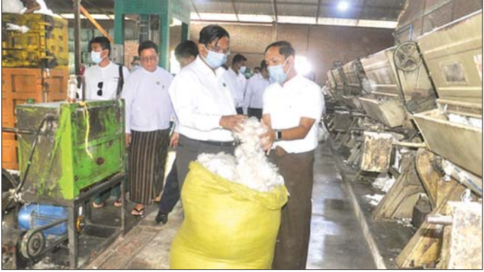
တိုးတက်ရေးအတွက် လုပ်ငန်းရှင်များ ရင်ဆိုင် ကြုံတွေ့နေရသည့် အခြေအနေများကို သိရှိပြီး လိုအပ်သည်များ ပံ့ပိုးပေးနိုင်ရေးရည်ရွယ်၍ လုပ်ငန်း ရှင်များနှင့် ရင်းရင်းနှီးနှီးဖြင့် စကားပိုင်းဆွေးနွေးပွဲ ပုံစံဖြင့် တွေ့ဆုံဆွေးနွေးလိုခြင်းဖြစ်ကြောင်း၊ စားသုံးဆီထုတ်လုပ်မှု Supply Chain တစ်လျှောက် ကို လေ့လာကြည့်ရှု၍ ဆီထွက်သီးနှံများဖြစ်သည့် မြေပဲ၊ နှမ်း၊ နေကြာတို့၏ စိုက်စကား တိုးချဲ့ရေး၊ ပန်းတိုင်အထွက်နှုန်းရရှိရေး၊ အရည်အသွေးပြည့်မီ ဝန်ထောက်သီးနှံများ ထွက်ရှိရေးစသည်တို့ကို စိုက်ပျိုးရေး၊ မွေးမြူရေးနှင့် ဆည်မြောင်းဝန်ကြီး ဌာနမှ တာဝန်ယူဆောင်ရွက်လျက်ရှိကြောင်း၊ ထွက်ရှိလာသော ဆီထွက်သီးနှံများကို အရည်အသွေး မြှင့်မားသည့်စားသုံးဆီများ ထုတ်လုပ်နိုင်ရေးအတွက် စက်မှုဝန်ကြီးဌာနအနေဖြင့် ဆီစက်လုပ်ငန်းရှင်များ နှင့် ပူးပေါင်းဆောင်ရွက်သွားမည်ဖြစ်ကြောင်း၊

စက်မှုဝန်ကြီးဌာန ပြည်ထောင်စုဝန်ကြီး ခေါက်တာ ချာလီသန်းသည် မကွေးတိုင်းဒေသကြီး စီးပွားရေးရာ ဝန်ကြီး ဦးအောင်ချိန်နှင့်အတူ ယနေ့ နံနက်ပိုင်းတွင် မကွေးတိုင်းဒေသကြီး တောင်တွင်းကြီးမြို့ရှိ စန်းသိရီ ဝါကြိတ်စက်ရုံနှင့် ဝါစေ့ဆီ ထုတ်လုပ်သည့်လုပ်ငန်း သို့ရောက်ရှိပြီး ဝါများကြိတ်ခွဲနေမှု၊ ဝါစေ့ဆီ ထုတ်လုပ်နေမှု အခြေအနေကို လှည့်လည်ကြည့်ရှု စစ်ဆေးသည်။