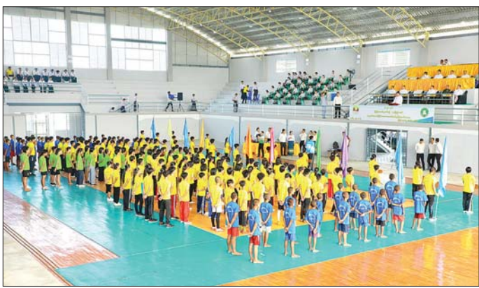
လေ့ကျင့်ရေးစခန်း(Gold Camp) ရှိ Gold Medal Hall ၌ ကျင်းပသည်။

ထို့ပြင် ပြည်ထောင်စုဝန်ကြီးနှင့် ၂၀၂၄ ခုနှစ်တွင် ထိုင်းနိုင်ငံမှ အိမ်ရှင်အဖြစ် လက်ခံကျင်းပမည့် (၃၃) ကြိမ်မြောက် အရှေ့တောင်အာရှအားကစားပြိုင်ပွဲ ဝင်ရောက်ယှဉ်ပြိုင်ရန်အတွက် နေပြည်တော် အားကစားလေ့ကျင့်ရေးစခန်း (Gold Camp) တွင် စခန်းဝင်လေ့ကျင့်လျက်ရှိသည့် ပဏာမမြန်မာ့ လက်ရွေးစင်အားကစားသမားများနှင့် လူငယ် အားကစားသမားများ တွေ့ဆုံပွဲအခမ်းအနားကို မွန်တည် ၁၂ နာရီတွင် နေပြည်တော်အားကစား