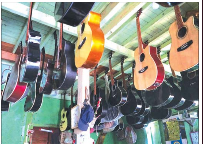
ဆိုင်အတွင်း ချိတ်ဆွဲထားသည့် လက်မှုအတတ်ပညာ ဂစ်တာအမျိုးမျိုးကို တွေ့ရစဉ်။