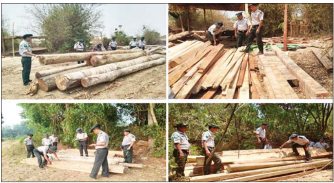
ရန်ကုန်တိုင်းဒေသကြီး၌ ဖမ်းဆီးရမိမှု

နေပြည်တော် ဧပြီ ၂၅ တရားမဝင်ကုန်သွယ်မှုတိုက်ဖျက်ရေး ဦးဆောင်ကော်မတီ၏ ကြီးကြပ်ကွပ်ကဲမှုဖြင့် တရားမဝင်ကုန်သွယ်မှုများကို ဥပဒေနည်းအညီ ထိရောက်စွာ တားဆီးအရေးယူနိုင်ရေး ဆောင်ရွက်လျက်ရှိရာ ရန်ကုန်တိုင်းဒေသကြီး တရားမဝင်ကုန်သွယ်မှုတိုက်ဖျက်ရေးအထူးအဖွဲ့၏ စီမံခန့်ခွဲမှုဖြင့် တာဝန်ကျ ပူးပေါင်းအဖွဲ့များက စစ်ဆေးမှုများဆောင်ရွက်ရာတွင် ဧပြီ ၂၄ ရက်တွင် လှည်းကူးမြို့နယ်နှင့် တိုက်ကြီးမြို့နယ်တို့အတွင်း၌ တရားမဝင် အခြားသစ် ၁၈ ဒဿမ ၈၈၃ တန် (ခန့်မှန်းတန်ဖိုးငွေကျပ် ၁၈၆၆၀၀၀) ကို သစ်တောဥပဒေအရလည်းကောင်း၊ ဧပြီ ၂၄ ရက်တွင် တောင်ဥက္ကလာပမြို့နယ်၌ Toyota Mark II မော်တော်ယာဉ်နှစ်စီး (ခန့်မှန်းတန်ဖိုးငွေကျပ် ၆၅၀၀၀၀) နှင့် ဒဂုံမြို့သစ်(အရှေ့ပိုင်း) မြို့နယ်၌ Toyota Noah မော်တော်ယာဉ် တစ်စီး (ခန့်မှန်းတန်ဖိုးငွေကျပ် ၄၀၀၀၀၀) တို့ကို ဝှိုက်ကုန်သွင်းကုန် ဥပဒေအရလည်းကောင်း၊ ရွာသာကြီး Dry Port ၌ မန္တလေးမြို့မှ ရန်ကုန်မြို့သို့ မောင်းနှင်လာသော မော်တော်ယာဉ် တစ်စီးပေါ်မှ တရားဝင်စာရွက်စာတမ်း အထောက်အထားတင်ပြနိုင်ခြင်းမရှိသည့် တရုတ်နိုင်ငံထုတ် GI Pipe ကိုလိုင်ဂရမ် ၁၄၀၀၀ ခန့်မှန်းတန်ဖိုးငွေကျပ် ၂၀၆၈၀၀၀) နှင့် အဆိုပါပစ္စည်းများ တင်ဆောင်လာသည့် MAN Tractor Head တစ်စီးနှင့် နောက်တွဲယာဉ် တစ်စီး (ခန့်မှန်း