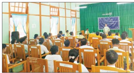
စီမံအုပ်ချုပ်ရေး ကောင်စီဥက္ကဋ္ဌများအား စီမံကိန်းရည်မှန်းချက်တာဝန်များ ပေးအပ်ရာတွင်

ဘားအံ ဧပြီ ၂၅ ကရင်ပြည်နယ် ဘားအံခရိုင်၏ ၂၀၂၄-၂၀၂၅ ဘဏ္ဍာရေးနှစ် ဒေသန္တရစီမံကိန်း ရည်မှန်းချက်များ တာဝန်ပေးအပ်ပွဲ အခမ်းအနားကို ဧပြီ ၂၃ ရက်က ဘားအံခရိုင် အထွေထွေအုပ်ချုပ်ရေးဦးစီးဌာနအစည်းအဝေးခန်းမ၌ ကျင်းပသည်။