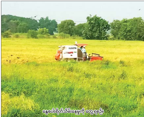
နွေစပါးရိတ်သိမ်းနေမှုကို တွေ့ရစဉ်။

ရန်ကုန် ဧပြီ ၂၅ မြန်မာနိုင်ငံ၏ စီးပွားရေး မြှင့်တင်မှုဖြစ်သည့် ရန်ကုန်မြို့တွင် စက်မှုကဏ္ဍနှင့် ကုန်ထုတ်လုပ်မှု သာမက ဆန်စပါးစိုက်ပျိုးမှုတွင် တစ်နှစ်ထက်တစ်နှစ် တိုးချဲ့စိုက်ပျိုး အောင်မြင်လျက်ရှိရာ တိုက်ကြီးမြို့နယ်အတွင်း စပါးစိုက်တောင်သူများ အထူးအားထားသည့် နွေစပါးကို ဆည်ရေသောက်စနစ်ဖြင့် စိုက်ပျိုးနိုင်ခဲ့ရာ နွေစပါး လျာထားချက် ၂၉၈၆၄ ဧကထက် ၂၉၁၇၄ ဧကအထိ တိုးချဲ့စိုက်ပျိုးနိုင်ခဲ့ကြောင်း သိရသည်။