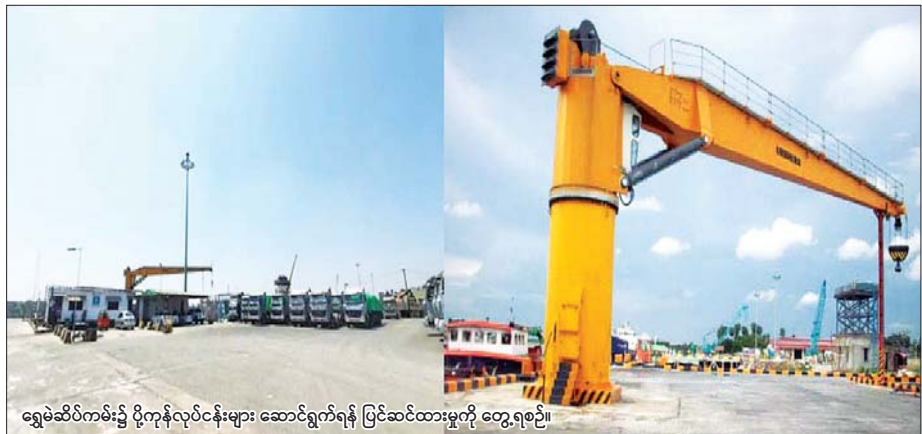
ရွှေခဲဆိပ်ကမ်း၌ ပို့ကုန်လုပ်ငန်းများ ဆောင်ရွက်ရန် ပြင်ဆင်ထားမှုကို တွေ့ရစဉ်။