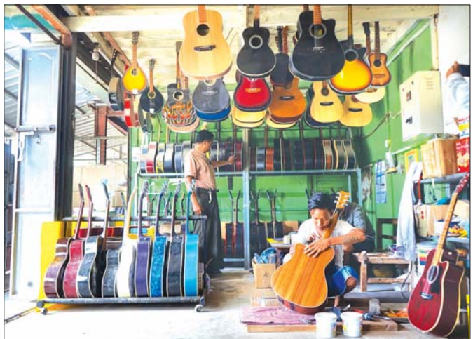
ဂီတာတစ်လက်ကို ကျွမ်းကျင်ဝန်ထမ်းတစ်ဦးက အချောသပ်နေစဉ်။

ဖြေ။ ။ ချေးငွေအနေနဲ့တော့ အရင်က ကိုဗစ်ချေးငွေကျပ်သိန်း ၅၀ ရရှိပါတယ်။ အဲဒီချေးငွေက ယခုထိတော့ မကောက်သေးဘူး။ ဒါပေမယ့် သတ်မှတ်စည်းကမ်းအတိုင်း တစ်နှစ်ကို တစ်ကျပ်အတိုးနှုန်းနဲ့ အတိုးသွင်းရတာတော့ ရှိပါတယ်။ MSME လုပ်ငန်းချေးငွေကျတော့ အဆင်မပြေသေးဘူး။ ဘာလို့လဲဆိုတော့ အာမခံတွေပေးရတာ၊ ပိုင်ဆိုင်မှုတွေပြုရတာ၊ နောက်ဂရုန်နီမှ ဦးပိုင်ဖြစ်မှဆိုတော့ ကျွန်တော်တို့အတွက်ကျတော့ သိပ်အဆင်မပြေဘူး။ ကျွန်တော်တို့အနေနဲ့အကြံပြုချင်တာလေးကတော့ ဂရုန်နီတွေ၊ ပိုင်ဆိုင်မှုတွေမပြင်ဘဲ လုပ်ငန်းခွင်အရောက် ကွင်းဆင်းလေ့လာပြီး ခိုင်မာမှုရှိတယ်ဆိုရင် ချေးငွေထုတ်ချေးပေးဖို့ အကြံပြုချင်ပါတယ်။ အဲဒီချေးငွေလေးတွေရတော့ ကျွန်တော်တို့ လုပ်ငန်းလုပ်ကိုင်လေ့ကျင့်အနေနဲ့ ဆက်လက်ပြီး လုပ်ငန်းတိုးချဲ့လုပ်ကိုင်လို့ရတာပေါ့။ ဒါမှလည်း ကျွန်တော်တို့ လုပ်ငန်းရှင်ရော အလုပ်သမားတွေပါ အလုပ်အကိုင်အခွင့်အလမ်းတွေ ပိုမိုရရှိပြီး မိသားစုစားဝတ်နေရေးပိုမိုအဆင်ပြေလာကြမှာ ဖြစ်ပါတယ်ဟု ဖြေကြားခဲ့ပါတယ်။ ။