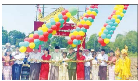
မျက်နှာပြင်အရ ညီညာသည့် မြေသားရှိသကဲ့သို့ ချောက်များကို ဖြတ်ဆင်းဖြတ်တက် သွားရတာ ကြောင့် အရေးပေါ်ကျန်းမာရေး ကိစ္စအပါအဝင် လူမှုရေး၊ ပညာ ရေးကိစ္စများတွင် လမ်းမကောင်း သည့်အတွက် အဆင်ပြေသလို သွားလာနေကြ ရသောကြောင့် မြို့နယ် စီမံအုပ်ချုပ်ရေးအဖွဲ့က ဦးဆောင်၍ မြေသားလမ်းတွေ ဖောက်လုပ်ပေးခြင်းဖြစ်ကြောင်း ပြောကြားသည်။ ခရိုင်(ပြန်/ဆက်)

အုပ်ချုပ်ရေးအဖွဲ့နှင့် ကျေးရွာ ပြည်သူများ၊ အဝေးရောက်အလှူ ရှင်များ၏ ထည့်ဝင်ငွေကျပ် ၁၂၆ သိန်းဖြင့် ဖောက်လုပ်ပြီးစီးခဲ့ ကြောင်း သိရသည်။ အခမ်းအနားတွင် မြို့နယ် စီမံအုပ်ချုပ်ရေးအဖွဲ့ ဥက္ကဋ္ဌက ကိုယ်အားကိုယ်ကိုး ကျေးရွာချင်း ဆက်မြေသားလမ်း ဖောက်ခြင်း သည် ကိုယ့်ဒေသ လမ်းပန်းဆက် သွယ်ရေး ကောင်းမွန်လာရေး အတွက် ဖောက်လုပ်ခဲ့ခြင်းဖြစ် ကြောင်း၊ တစ်ရွာနှင့် တစ်ရွာ သွားလာရာတွင် နွားလှည်းလမ်း ကိုပဲ အသုံးပြုရကြောင်း၊ ပထဝီဝင်