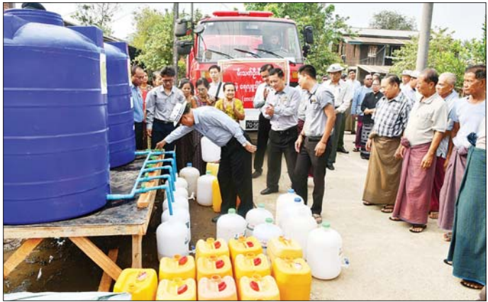
များအား အမျိုးသားသဘာဝဘေးအန္တရာယ်ဆိုင်ရာ စီမံခန့်ခွဲမှုကော်မတီမှ ဆန်ရိက္ခာများထောက်ပံ့ပေးအပ် ခဲ့သည့်အခမ်းအနားသို့ တက်ရောက်သည်။ အခမ်းအနားတွင် ပြည်နယ်ဝန်ကြီးချုပ်၊ ပြည်နယ် တရားလွှတ်တော်တရားသူကြီးချုပ် ဒေါ်ခင်ဆွေထွန်း၊ ပြည်နယ်အစိုးရအဖွဲ့ဝင်များက တရုတ်လှူ (ကော့လှိုင်)၊ ဝင်းကျန်၊ ဖအံ၊ နောင်ထလုံး၊ ရွှေတော၊ တော်ပုံ၊ ရဲသား၊ ကော့ထမ္မလိန်းကျေးရွာအုပ်စုများမှ ယာယီ ပြောင်းရွှေ့နေထိုင်သူ အိမ်ထောင်စု ၂၂၃ စု၊ လူဦးရေ ၆၈၆ ဦးအတွက် အမျိုးသားသဘာဝဘေးအန္တရာယ် ဆိုင်ရာစီမံခန့်ခွဲမှုကော်မတီမှထောက်ပံ့သည့် ဆန် အိတ် ၆၀၉ အိတ်ကို ထောက်ပံ့ပေးအပ်ခဲ့ကြောင်း သိရသည်။

များအား မှာကြားသည်။ ယနေ့ ကော့လှိုင်ကျေးရွာတွင် စုစုပေါင်းရေဂါလန် ၉၆၀၀ ကျော်ကို ပေးဝေလှူဒါန်းခဲ့ပြီး သတ္တမအကြိမ် မြောက်ပေးဝေလှူဒါန်းခြင်းဖြစ်ကာ ရေရှားပါးသော ကျေးရွာတစ်ရွာလျှင် ရက်သတ္တပတ်တစ်ပတ် နှစ်ကြိမ် နှုန်းဖြင့် ပေးဝေလှူဒါန်းလျက်ရှိကြောင်းနှင့် သောက်သုံးရေရှားပါးသော ရပ်ကွက်/ ကျေးရွာများ အနေဖြင့်လည်း ကျေးလက်ဒေသဖွံ့ဖြိုးတိုးတက်ရေး ဦးစီးဌာနသို့ ဆက်သွယ်အကြောင်းကြားနိုင်ကြောင်း သိရသည်။ ယင်းနောက် ပြည်နယ်ဝန်ကြီးချုပ်နှင့်အဖွဲ့ သည် ကရင်ပြည်နယ်အတွင်း နေရာဒေသအချို့တွင် နယ်မြေတည်ငြိမ်အေးချမ်းမှုအားနည်း သည့်အတွက် ဘားအံမြို့နယ်အတွင်း ရပ်ကွက်/ကျေးရွာအုပ်စုများ ရှိ နီးစပ်ရာဆွေမျိုးများနေအိမ်နှင့် ဘာသာရေး အဆောက်အအုံများတွင် ယာယီပြောင်းရွှေ့နေထိုင်သူ