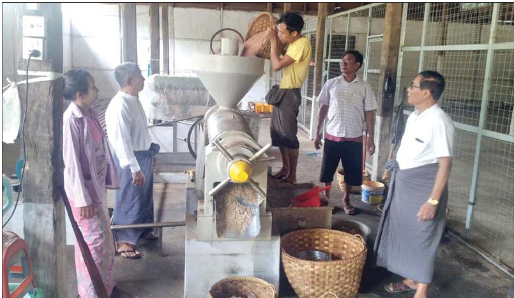
မြန်မာနိုင်ငံမှာတော့ မြေပဲဆီ၊ နှမ်းဆီ၊ နေကြာဆီနဲ့ နိုင်ငံခြားကနေ တင်သွင်းလာတဲ့ စားအုန်းဆီတွေကို အဓိကထားပြီး စားသုံးနေကြပါတယ်။

ဆီကို ဓာတ်ခွဲစမ်းသပ်မယ်ဆိုရင် မပြည့်ဝဆီနဲ့ ပြည့်ဝဆီတွေနဲ့ ဖွဲ့စည်းထားပါတယ်။ မပြည့်ဝဆီက ကျန်းမာရေးနဲ့ညီညွတ်ပြီး ပြည့်ဝဆီကတော့ ကျန်းမာရေးကို ထိခိုက်နိုင်တဲ့အတွက် ဆီရွေးချယ် တဲ့အခါ ပြည့်ဝဆီနည်းနည်းသာ အနည်းဆုံးနဲ့ မပြည့်ဝဆီ များများပါတဲ့ဆီတွေကို ရွေးချယ် စားသုံးသင့်ပါတယ်။ ဆီကို ဆီထွက်သီးနှံတွေကနေ ရရှိသလို တိရစ္ဆာန်တွေဆီကနေလည်း ရရှိပါတယ်။ ပုံမှန်အားဖြင့်တော့ သီးနှံတွေကနေ ရရှိတဲ့ဆီတွေ က မပြည့်ဝဆီ ပိုမိုပါဝင်နေတတ်ပါတယ်။ ကမ္ဘာပေါ် မှာ စားသုံးဆီထုတ်လုပ်တဲ့ ဆီထွက်သီးနှံအမျိုးမျိုး အနက် အဓိကအားဖြင့် လေးမျိုးရှိပါတယ်။ ပဲပုပ်ဆီ၊ နေကြာဆီ၊ မုန့်ညင်းဆီနဲ့ စားအုန်းဆီတို့ဖြစ်ပြီး