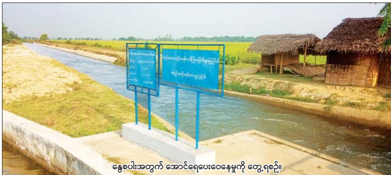
နွေစပါးအတွက် အောင်ရေပေးဝေနေမှုကို တွေ့ရစဉ်။