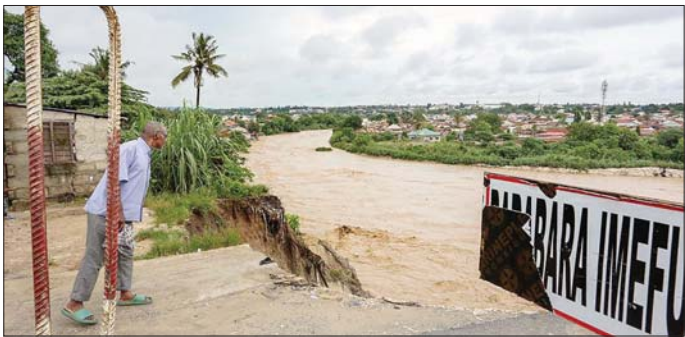
တန်ဇန်နီးယားနိုင်ငံ၌ ရေကြီးရေလျှံဖြစ်ပွားနေမှုကို ဧပြီ ၂၄ ရက်က တွေ့ရစဉ်။

တန်ဇန်နီးယားနိုင်ငံ၌ ရုတ်တရက် ရေကြီးခြင်းကြောင့် ၁၅၅ ဦး သေဆုံးပြီး ၂၃၆ ဦး ဒဏ်ရာရရှိခဲ့သည်ဟု ဝန်ကြီးချုပ် ကက်စ်ဆင်မာကျာလီဝါက ဧပြီ ၂၅ ရက်က လွှတ်တော်တွင် ပြောကြားခဲ့သည်။ တန်ဇန်နီးယားနိုင်ငံ ဒေသကြီး ၂၆ ခုအနက် ၁၄ ခုတွင် ရေကြီးမှုဖြစ်ပေါ်ခဲ့ပြီး လူပေါင်း ၂၀၀၀၀၀ ရေကြီးမှုဒဏ် သက်ရောက်မှု ခံစားခဲ့ရကာ နေအိမ်ပေါင်း ၁၀၀၀၀ ပျက်စီးခဲ့ရသည်ဟု ဝန်ကြီးချုပ်က ပြောသည်။