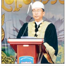
နေပြည်တော်မြို့တော်ဝန် ဦးသန်းထွန်းဦး နှစ်သစ်ကူး နှုတ်ခွန်းဆက်စကား ပြောကြားစဉ်။

ရေကစားမဏ္ဍပ်၊ အလုပ်သမားဝန်ကြီး ဌာန ရေကစားမဏ္ဍပ်၊ လူဝင်မှုကြီးကြပ် ရေးနှင့် ပြည်သူ့အင်အားဝန်ကြီးဌာန ရေကစားမဏ္ဍပ်၊ စွမ်းအင်ဝန်ကြီးဌာန ရေကစားမဏ္ဍပ်၊ လမ်းလျှောက်သင်္ကြန် ဗဟိုမဏ္ဍပ်တို့၌ ဝန်ကြီးဌာနယိမ်းအဖွဲ့ များ၊ နိုင်ငံကျော် အနုပညာရှင်များနှင့် ကိုရီးယားနိုင်ငံမှ သရုပ်ဆောင် K-Pop အဆိုတော်များက တေးသီချင်းများဖြင့် သီဆိုကပြဖျော်ဖြေနေမှု၊ ဝန်ထမ်းများ၊ ပြည်သူများ စိတ်ပျော်ရွှင်ချမ်းမြေ့စွာ ရေပတ်ကစားနေမှု၊ မဏ္ဍပ်များအလိုက် စတုဒိသာအကျွေးအမွှေးများဖြင့် ဧည့်ခံ ကျွေးမွေးနေမှုတို့ကို လှည့်လည်ကြည့်ရှု အားပေးကြပြီး ဝန်ထမ်းများ၊ ဝန်ထမ်း မိသားစုများ၊ ပြည်သူများနှင့်အတူ အတာ ရေသဘင်ပွဲကို ပျော်ရွှင်စွာဆင်နွှဲကြသည်။ သီဆိုကပြဖျော်ဖြေတင်ဆက် နေပြည်တော်မြို့တော်ဝန် မဟာ သင်္ကြန်မဏ္ဍပ်တွင် မြန်မာအသံခေတ်ပေါ် တေးဂီတအဖွဲ့နှင့် တွဲဖက်၍ နိုင်ငံကျော် အနုပညာရှင်များနှင့် တေးသံရှင်များ၊ ဝန်ကြီးဌာနများ၊ ခရိုင်/ မြို့နယ်များမှ သင်္ကြန်ယိမ်းအကအဖွဲ့များ၏ ယိမ်းအက အလှူများဖြင့် သီဆိုကပြဖျော်ဖြေတင်ဆက် သွားကြမည်ဖြစ်ကြောင်း သိရသည်။ နေပြည်တော် လမ်းလျှောက်သင်္ကြန် ကို ၂၀၂၄ ခုနှစ် မြန်မာ့ရိုးရာ အတာသင်္ကြန် ပွဲတော်ကာလအတွင်း နေပြည်တော်ရှိ ဝန်ထမ်းများနှင့် ဝန်ထမ်းမိသားစုများ၊ ပြည်သူများ စုပေါင်းပျော်ရွှင်စွာဆင်နွှဲနိုင် စေရန် ဝန်ထမ်းများ၏ စည်းလုံးညီညွတ် မှု ပြည်သူနှင့် အစိုးရ၏ ပေါင်းစည်းမှု နှင့် တစ်သားတည်းဖြစ်မှုတို့ကို ဖော်ဆောင် သည့် ပွဲတော်တစ်ခုအဖြစ် ပြသရန် ရည်ရွယ်၍ ပျဉ်းမနား - တောင်ညို လမ်းပေါ်ရှိ နေပြည်တော် မြို့တော်ဝန် မဏ္ဍပ်အနီးမှ စည်ပင်စည်ရိပ်သာ လမ်းဆုံ ဧရိယာအထိ သင်္ကြန်အကြိုနေ့ (ယနေ့) မှ ဧပြီ ၁၆ ရက်အထိ စည်ကားသိုက် မြိုက်စွာ ကျင်းပသွားမည်ဖြစ်ကြောင်း သိရသည်။