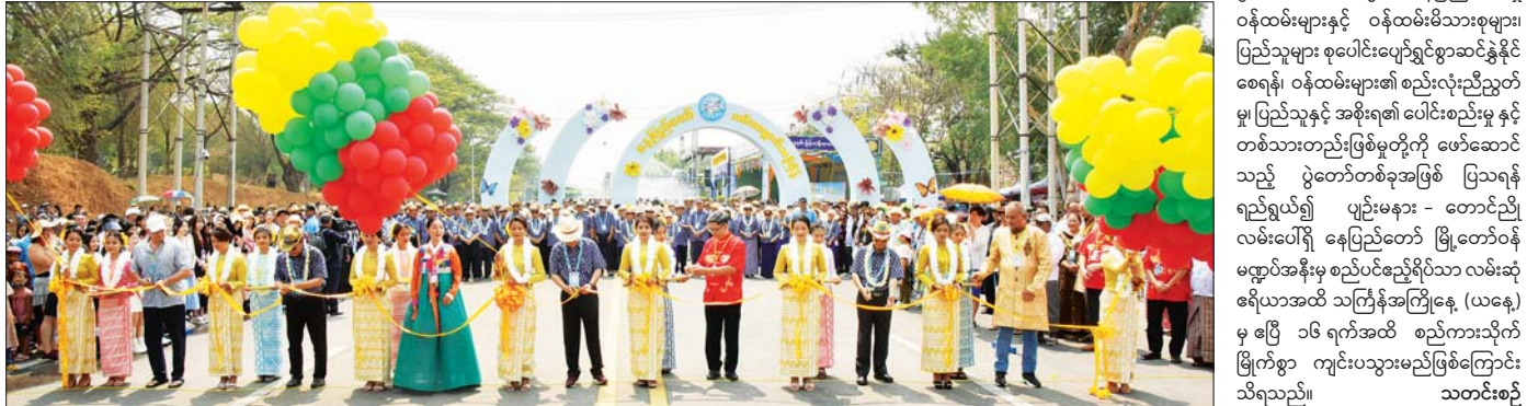
နေပြည်တော်မြို့တော်ဝန် မဟာသင်္ကြန်မဏ္ဍပ် ဖွင့်ပွဲအခမ်းအနားကျင်းပ တက်ရောက်လာကြသော ပြည်သူများ အတားရသဘင်ပွဲ ပျော်ရွှင်စွာပါဝင်ဆင်နွှဲ

နှုတ်ခွန်းဆက်စကားပြောကြား ဦးစွာ သာသနာရေးနှင့် ယဉ်ကျေးမှု ဝန်ကြီးဌာန အနုပညာဦးစီးဌာနမှ လက်ထောက်ဥက္ကဋ္ဌကြီးရေးမှူးဦးဥက္ကဋ္ဌက က ၁၃၈၅ ခုနှစ် နေပြည်တော်မြို့တော်ဝန် မဟာသင်္ကြန်ပွဲတော် နှစ်သစ်မင်္ဂလာပိုင်းစုံ ရတုကို ဖတ်ကြားပြီး နေပြည်တော် မြို့တော်ဝန် ဦးသန်းထွန်းဦးက နှစ်သစ်ကူး နှုတ်ခွန်းဆက်စကား ပြောကြားသည်။ ထို့နောက် နိုင်ငံတော်စီမံအုပ်ချုပ်ရေး ကောင်စီ အတွင်းရေးမှူး ဒုတိယဝန်ထောက် ကြီး အောင်လင်းဒွေး၊ နိုင်ငံတော်စီမံ အုပ်ချုပ်ရေးကောင်စီဝင် ဒုတိယဝန်ကြီး