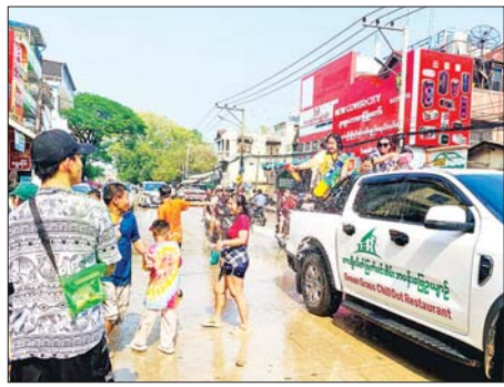
မြန်မာ့မဟာသကြံနိပွဲတော်ကို ဧပြီ ၁၃ ရက်က တာချီလိတ်မြို့၌ ကျင်းပလျက်ရှိရာ ပြည်သူများ ပျော်ရွှင်စွာ ရောစားနေကြစဉ်။ မောင်ယဉ်ကျေး