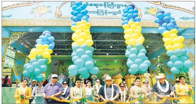
ပြည်ထောင်စုဝန်ကြီးနှင့် ဇနီး ဦးဆောင် ရေဖြင့် ပက်ဖျန်းပေးပြီး တပ်ဖွဲ့/ဦးစီးဌာန ပျော်ရွှင်စွာ ပါဝင်ဆင်နွှဲခဲ့ကြကြောင်း သောအဖွဲ့က ယိမ်းအကအဖွဲ့များနှင့် များမှ ဝန်ထမ်းနှင့်ဝန်ထမ်းမိသားစုများ သိရသည်။ တက်ရောက်လာသူများကို အတာသကြီးက မြန်မာ့ရိုးရာယဉ်ကျေးမှုနှင့်အညီ သတင်းစဉ်

ညွှန်ကြားရေးမှူးချုပ်များ၊ အရာရှိကြီးများနှင့် ဇနီးများ၊ တာဝန်ရှိသူများ၊ ဝန်ထမ်းများနှင့် ဝန်ထမ်းမိသားစုဝင်များ တပ်ဖွဲ့/ဦးစီးဌာနများမှ ယိမ်းအကအဖွဲ့များနှင့် Dancer အကအဖွဲ့များ တက်ရောက်ခဲ့ကြသည်။ ဦးစွာ နိုင်ငံတော်စီမံအုပ်ချုပ်ရေးကောင်စီအဖွဲ့ဝင်၊ ပြည်ထောင်စုဝန်ကြီး ဒုတိယဗိုလ်ချုပ်ကြီးရာပြည့်က နှစ်သစ်ကူးနှုတ်ခွန်းဆက် အမှာစကားပြောကြားသည်။ ယင်းနောက် ပြည်ထောင်စုဝန်ကြီး ဒုတိယဗိုလ်ချုပ်ကြီးရာပြည့်၊ ပြည်ထောင်စုဝန်ကြီး ဦးမြင့်နောင်နှင့် ဒုတိယဝန်ကြီး ဗိုလ်ချုပ်တိုးရီတို့က မြန်မာ့ရိုးရာမဟာသကြီးပွဲတော်ကို ဖဲကြိုးဖြတ်ဖွင့်လှစ်ပေးသည်။ (သာပုံ) ထို့နောက် နိုင်ငံတော်စီမံအုပ်ချုပ်ရေးကောင်စီအဖွဲ့ဝင် ပြည်ထဲရေးဝန်ကြီးဌာန