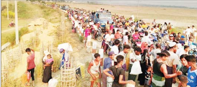
ရခိုင်ပြည်နယ် ဘူးသီးတောင်မြို့နယ်ရှိ ဘင်္ဂါလီကျေးရွာများအား AA အကြမ်းဖက်သောင်းကျန်းသူအဖွဲ့က အကြောင်းမဲ့ပစ်ခတ်ကြီးဖြင့် ပစ်ခတ်မှုကြောင့် ဘင်္ဂါလီလူမျိုးများ ထွက်ပြေးတိမ်းရှောင်နေရသည့် မှတ်တမ်းဓာတ်ပုံ။

နေပြည်တော် ဧပြီ ၁၃ ရခိုင်ပြည်နယ် ဘူးသီးတောင် မြို့နယ်အတွင်းရှိ ဘင်္ဂါလီကျေးရွာ များဖြစ်သည့် ကွန်တိုင်ရွာကြီး၊ ရွှင်ညိုတောင်ကျေးရွာနှင့် ဦးလှ ဖေကျေးရွာများအတွင်းသို့ AA အကြမ်းဖက်သောင်းကျန်းသူများ က လက်နက်ကြီးများ၊ လက်နက် ငယ်များဖြင့် အကြောင်းမဲ့ပစ်ခတ် ခဲ့မှုကြောင့် ဘင်္ဂါလီလူမျိုး ကျေးရွာ သူ၊ ကျေးရွာသားအချို့ သေဆုံး ခဲ့ပြီး ဘာသာရေးအဆောက်အဦ များနှင့် လူနေအိမ်များ မီးလောင် ပျက်စီးဆုံးရှုံးခဲ့ကြောင်း သိရှိရ သည်။