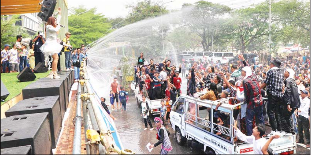
မင်္ဂလာမန္တလေးလမ်းလျှောက်သင်္ကြန်ရေကစားမဏ္ဍပ်၌ အနုပညာရှင်များ၏ သီဆိုဖျော်ဖြေမှုနှင့် ရေပက်ခံထွက်သူများ ပျော်ရွှင်စွာရေကစားကြသူများကို တွေ့ရစဉ်။

မန္တလေး ဧပြီ ၁၃ ယနေ့ကျရောက်သည့် မြန်မာ့ရိုးရာမဟာသင်္ကြန် (အကြိုနေ့)တွင် မန္တလေးမြို့အတွင်းရှိ ဘုရားစေတီပုထိုးများတွင် ဘုရားဖူးလာပြည်သူများ၊ ရေကစားမဏ္ဍပ်များတွင် ပျော်ရွှင်စွာ ရေကစားကြသူများ၊ ရေပက်ခံထွက်ကြသူများနှင့် စတုဒိသာကျွေးမွေးသူများဖြင့် သင်္ကြန်ပွဲတော်ကို ပျော်ရွှင်စွာဆင်နွှဲကြသည်။ နံနက်ပိုင်းမှစတင်၍ မဟာမုနိဘုရားကြီး၊ အောင်တော်မူမြတ်စွာဘုရား၊ ရွှေကျုံးမြင်ဘုရား၊ ဘုရားနီဘုရား၊ မန္တလေးတောင်၊ ကုသိုလ်တော်၊ စန္ဒာမုနိဘုရား၊ ကျောက်တော်ကြီးဘုရား စသည့် ဘုရားတို့တွင် တရားဘာဝနာအားထုတ်ကြသူများ၊ ဥပုသ်သီလဆောက်တည်ကြသူများနှင့် စတုဒိသာကျွေးမွေးလှူဒါန်းကြသူများဖြင့် စည်ကားလှက်ရှိုရှိသည်။ ထို့ပြင် မန္တလေးမြို့တော်မဟာသင်္ကြန်မဏ္ဍပ်အပါအဝင် ကျုံးပတ်လည်ရှိ သင်္ကြန်မဏ္ဍပ်များ၌ လာရောက်ရေကစားကြသူများဖြင့် အထူးစည်ကားလှက်ရှိုပြီး တေးသံရှင်များနှင့် အနုပညာရှင်များက စာမျက်နှာ ၁၅ ကော်လံ ၅ ❖