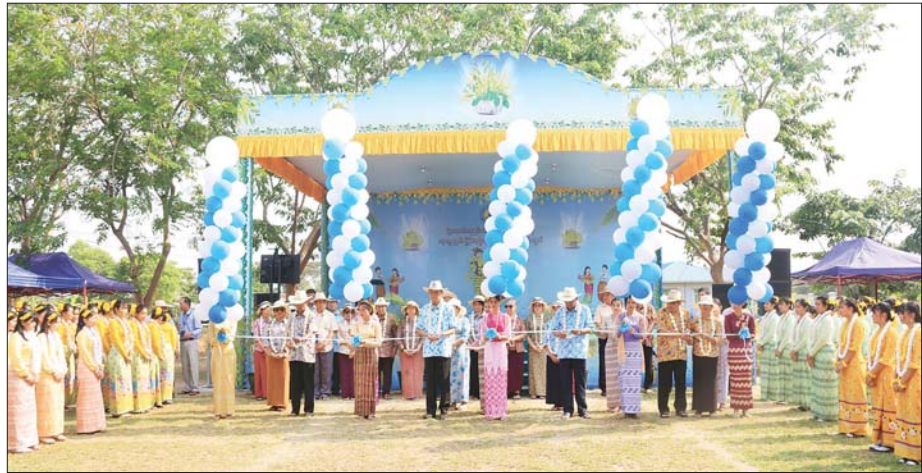
ခွန်အားသစ်များ ပြည့်ဝလန်းဆန်းစေရန် ယခုကဲ့သို့ အတာရေသဘင်ပွဲကို နိုင်ငံတစ်ဝန်း နှစ်စဉ်ကျင်းပခြင်းဖြစ်ကြောင်း၊ ဝန်ထမ်းများအားလုံး ကျန်းမာရွှင်လန်းကြပါစေကြောင်း ပြောကြားသည်။ အကများဖြင့်ဖျော်ဖြေ ထိုးနောက် မြန်မာ့ရိုးရာ ယဉ်ကျေးမှု မဟာသင်္ကြန် ရေကစားမဏ္ဍပ်ဖွင့်ပွဲကို ဖဲကြိုးဖြတ်ဖွင့်လှစ်၍(အပေါ်ပုံ) ဝန်ကြီးဌာနအောက်ရှိ ဌာနအဖွဲ့အစည်းများ၏ ယိမ်းအဖွဲ့များက သင်္ကြန်ယိမ်းအကများဖြင့် ဖျော်ဖြေခဲ့ကြောင်း သိရသည်။ သတင်းစဉ်

ကောင်စီအဖွဲ့ဝင် ဒုတိယဝန်ကြီးချုပ်နှင့် ပြည်ထောင်စုဝန်ကြီးက မြန်မာနိုင်ငံ၏ ၁၂ လရာသီ ပွဲတော်များအနက် သင်္ကြန်ပွဲတော်သည် ပြည်သူများအားလုံး လွတ်လပ်စွာ ပါဝင်ဆင်နွှဲသော ထူးခြားသည့် ရိုးရာပွဲတော်ဖြစ်ကြောင်း၊ ပုဂံခေတ်မှ ယနေ့ခေတ်အထိ နှစ်စဉ်နှစ်တိုင်း စည်ကားသိုက်မြိုက်စွာ ကျင်းပလာကြပါကြောင်း၊ တစ်ဦးနှင့်တစ်ဦး သင်္ကြန်ရေပက်ဖျန်းခြင်းသည် နှစ်ဟောင်းတွင် ကိုရီးအောင်းနေသည့် ဘေးဥပဒ်အန္တရာယ်များ၊ စိတ်ဆိုးစိတ်ညစ်များ ပပျောက်ကင်းစင်ပြီး သန့်ရှင်းစေရန်ရည်သန်၍ ဆောင်ရွက်ခြင်းဖြစ်ကြောင်း၊ ဘိုး/ဘွားတို့၏ ကောင်းမြတ်သော ရိုးရာယဉ်ကျေးမှု အစဉ်အလာကို လက်ဆင့်ကမ်းထိန်းသိမ်းနိုင်ရန်နှင့် နှစ်သစ်တွင် ဝန်ထမ်းများ