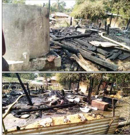
ရခိုင်ပြည်နယ် ဘူးသီးတောင်မြို့နယ်ရှိ ဘင်္ဂါလီကျေးရွာများအား AA အကြမ်းဖက်သောင်းကျန်းသူအဖွဲ့က အကြောင်းမဲ့ပစ်ခတ်ကြီးဖြင့် ပစ်ခတ်မှုကြောင့် နေအိမ်များပျက်စီးခဲ့သည့် မှတ်တမ်း ဓာတ်ပုံများ။

ဖြစ်စဉ်မှာ AA အကြမ်းဖက် သောင်းကျန်းသူများသည် ဧပြီ ၁၂ ရက် ညနေ ၃ နာရီခွဲခန့်တွင် ဘင်္ဂါလီကျေးရွာများဖြစ်သည့် ကွန်တိုင်ရွာကြီး၊ ရွှင်ညိုတောင်