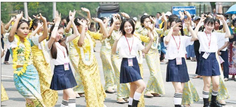
လမ်းလျှောက်သင်္ကြန်သို့ လာ

ထိုပြင် နေပြည်တော်ရှိ အများပြည်သူများ အနားယူအပန်းဖြေနိုင်သည့် နေပြည်တော်တီရစ္ဆာန်ဥယျာဉ်၊ နေပြည်တော်တီရစ္ဆာန်ဥယျာဉ်၊ ဆာဗာရီဥယျာဉ်နှင့် အမျိုးသားအထိမ်းအမှတ်ဥယျာဉ် စသည့်နေရာများကို လှည့်လည်ကြည့်ရှု အနားယူအပန်းဖြေ ရေကစားနိုင်ရန်အပြင် မာရစ်ဇယဗုဒ္ဓရုပ်ပွားတော်မြတ်ကြီး၊ ဥပ္ပါတသန္တိ စေတီတော်မြတ်ကြီး၊ သံဇေဇနိယလေးဌာန၊ မဟာသကျရံသီ ရုပ်ရှင်တော်မြတ်ကြီး၊ ဓာတုဇယဇာတိပေါင်းစု စေတီတော်၊ ရန်အောင်မြင်ရွှေလက်လှတေတော် စသည့်တန်ခိုးကြီးဘုရားများကိုလည်း သွားရောက်ဖူးမြော်နိုင်ကြောင်း သိရသည်။ လူလင်းယံဇာတ်ပုံ-ကိုကျော်ကြီး