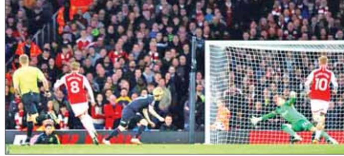
အာဆင်နယ်အသင်းနှင့်လူတန်အသင်းတို့ ယှဉ်ပြိုင်ကစားစဉ်။

အမှတ်ပေးဇယားရပ်တည်မှု အရ အမှားခံ၍ မရသော အာဆင်နယ် အသင်းသည် အားထားရသည့် ကစားသမား အများစုဖြင့် လူတန်အသင်းကို ရင်ဆိုင်လာခဲ့ပြီး အရေးပါသည့် နိုင်ပွဲကို ဖော်ဆောင်နိုင်ခဲ့သည်။ အာဆင်နယ်အသင်းသည် ယခုပွဲစဉ် နိုင်ပွဲရရှိခဲ့သည့် အတွက်ဒုတိယနေရာမှ လီဇာယားအသင်းထက် တစ်ပွဲပိုကစားပြီး