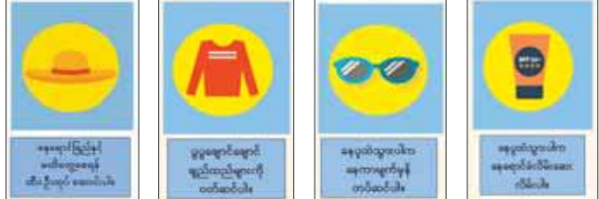
ပြည်သူ့ကျန်းမာရေးဦးစီးဌာန ကျန်းမာရေးအသိပညာမြှင့်တင်ရေးဌာန

၃။ အဝတ်ကင်းလွတ်နေသော လက်၊ လည်ပင်းနှင့် ပခုံးစသည်နေရာများကို သနပ်ခါးထုထု(သို့မဟုတ်) SPF ၁၅+ ပါဝင်သော နေရောင်ခံလိမ်းဆေးကို နေရောင်ခြည်ထိထွက်မီ (၁၅)မိနစ်ခန့် ကြိုလိမ်းပါ။ နေရောင်ခံလိမ်းဆေး တစ်ခါလိမ်းပြီး (၂)နာရီကြာပြီးတိုင်း တစ်ခါထပ်၍ လိမ်းပေးပါ။ ၄။ ကလေးငယ်များနှင့် သက်ကြီးဘွားများသည် ခရမ်းလွန်ရောင်ခြည်အန္တရာယ်ကို ပိုမိုခံစားရနိုင်သဖြင့် အထူးဂရုပြုဆိုင်ခြင်းနှင့် လိုအပ်ပါသည်။ အသက်တစ်နှစ်အထက် ကလေးငယ်များကို နေထုထဲသို့ ခေါ်ဆောင်ခြင်း မပြုပါနှင့်။ ကလေးများကို အရိပ်ထဲတွင်သာ ကစားစေပါ။