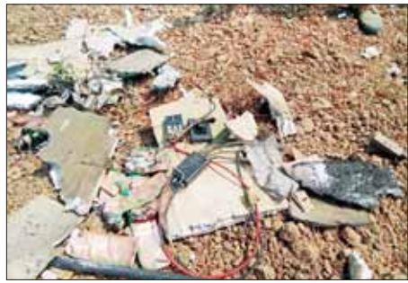
ဖောက်ခွဲဖျက်ဆီးရေးပစ္စည်းများပါရှိသည့် fixed Wing များအား ဖောက်ခွဲဖျက်ဆီးထားရှိမှုအား တွေ့မြင်ရစဉ်။

ကာကွယ်ရေး တပ်ဖွဲ့များက လေကြောင်းရန်ကာကွယ်ရေးစနစ်များဖြင့် ထောက်လှမ်းသိရှိခဲ့ရပြီး အဆိုပါ Fixed Wing များ အားလုံးကို လက်ဦးမှရယူ ဟုတ်တားနိုင်ခဲ့သည်။ ထိုသို့ လက်ဦးမှရယူ ဟုတ်တားနိုင်ခဲ့မှုကြောင့် နှစ်စင်းမှာ သတ်မှတ်နေရာမရောက်မီ လေထဲတွင် ပေါက်ကွဲပျက်စီးခဲ့ပြီး အခြား Fixed Wing အားလုံး ကိုလည်း ပစ်ချဟုတ်တားနိုင်ခဲ့သည်။ အဆိုပါ ပစ်ချဟုတ်တားခဲ့မှုကြောင့် မြေပြင်ပေါ်သို့ ပျက်ကျခဲ့ရသည့် Fixed Wing များအနက် ၁၃ စင်းအား