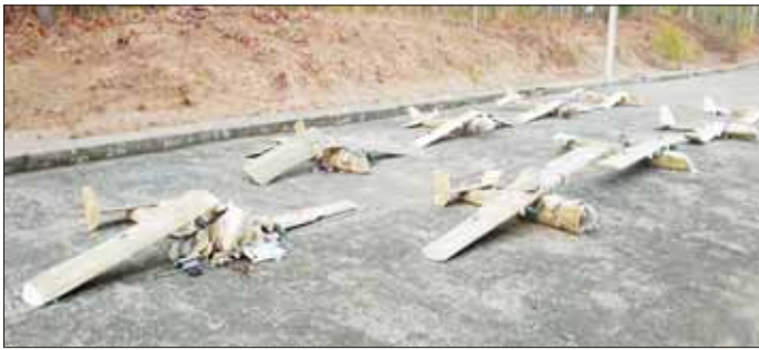
အကြမ်းဖက်သမားများလွှတ်တင်ခဲ့သည့် fixed Wing များအား ပစ်ချဟုတ်တားနိုင်ခဲ့ပြီး သိမ်းဆည်းရမိမှုအား တွေ့မြင်ရစဉ်။

နေပြည်တော် ဧပြီ ၄ နေပြည်တော်ကောင်စီနယ်မြေ၊ ဇေယျာသီရိမြို့နယ်နှင့် အေလာမြို့နယ်တို့ရှိ အရေးကြီးအဆောက်အအုံများနှင့် နေရာဌာနများအား ဖောက်ခွဲဖျက်ဆီးရန်နှင့် ပြည်သူများ အထိတ်တလန့်ဖြစ်စေရန် ယုတ်မာကောက်ကျစ်သည့်အကြံအစည်များဖြင့် အကြမ်းဖက်သမားများသည် ယနေ့နံနက် ၁၀ နာရီခွဲခန့်တွင် အေလာမြို့နယ်နှင့် ဇေယျာသီရိမြို့နယ်အနီးတို့မှ Fixed Wing များ လွှတ်တင်ခဲ့ပြီး အကြမ်းဖက်ဖောက်ခွဲရေး လုပ်ရပ်များ လုပ်ဆောင်နိုင်ရန် ကြံစည်ကြပြီးပစ်ခတ်ခဲ့သည်။ ထိုသို့ ကြံစည်ကြပြီးပစ်ခတ်မှုအား နေပြည်တော်ကောင်စီနယ်မြေအတွင်း လေကြောင်း လုံခြုံရေးတာဝန်များထမ်းဆောင်လျက်ရှိသည့် လေကြောင်းရန်