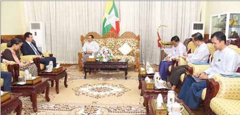
ကျော်ဇေယျ၊ မြန်မာနိုင်ငံအတွင်း ဘေးအန္တရာယ်ကင်းရှင်းရေးနှင့် လုံခြုံရေးဌာနမှ Mr. Marcoluigi Corsi၊ မြန်မာနိုင်ငံဆိုင်ရာ ကုလသမဂ္ဂ ဘေးအန္တရာယ်ကင်းရှင်းရေးနှင့် လုံခြုံရေးဌာနမှ Mr. Marco Smoliner တို့ တက်ရောက်ခဲ့ကြကြောင်း သိရသည်။ သတင်းစဉ်

နေပြည်တော် ဧပြီ ၄ နိုင်ငံတော်စီမံအုပ်ချုပ်ရေးကောင်စီ အဖွဲ့ဝင်၊ ပြည်ထောင်စုဝန်ကြီးဌာန ပြည်ထောင်စုဝန်ကြီး ဒုတိယဗိုလ်ချုပ်ကြီး ရာပြည့်သည် ကုလသမဂ္ဂဘေးအန္တရာယ်ကင်းရှင်းရေးနှင့်လုံခြုံရေးဌာန(United Nations Department of Safety and Security-UNDSS) ၏ အကြီးအကဲ Under-Secretary-General Mr. Gilles Michaud ဦးဆောင်သည့် ကိုယ်စားလှယ်အဖွဲ့ကို ယနေ့နံနက် ၁၀ နာရီတွင် နေပြည်တော်ရှိ ရုံးအမှတ်(၁၀) ပြည်ထောင်စုဝန်ကြီးဌာန ပြည်ထောင်စုဝန်ကြီး၏ ဧည့်ခန်းမ၌ လက်ခံတွေ့ဆုံသည်။ (ယာဝု) တွေ့ဆုံစဉ် မြန်မာနိုင်ငံအတွင်း တာဝန်ထမ်းဆောင်လျက်ရှိသော ကုလသမဂ္ဂဝန်ထမ်းများ၏ ဘေးကင်းလုံခြုံရေးဆိုင်ရာ ကိစ္စရပ်များ၊ ကုလသမဂ္ဂဝန်ထမ်းများ ခရီးသွားလာခွင့်နှင့် စစ်လျဉ်းသည့် ကိစ္စရပ်များ၊ မြန်မာနိုင်ငံအတွက် လူသားချင်းစာနာထောက်ထားမှုဆိုင်ရာ အကူအညီပေးရေးဆိုင်ရာ ကိစ္စရပ်များ၊ ပြည်ထောင်စုဝန်ကြီးဌာနနှင့် ကုလသမဂ္ဂဘေးအန္တရာယ်ကင်းရှင်းရေးနှင့် လုံခြုံရေးဌာနတို့အကြား ပူးပေါင်း ဆောင်ရွက်ရေးဆိုင်ရာ ကိစ္စရပ်များကို ရင်းနှီးပွင့်လင်းစွာ ဆွေးနွေးခဲ့ကြသည်။ တွေ့ဆုံပွဲသို့ ပြည်ထောင်စုဝန်ကြီးဌာန အမြဲတမ်းအတွင်းဝန် ဦးခိုင်ထွန်းဦး၊ မြန်မာနိုင်ငံရဲတပ်ဖွဲ့ နိုင်ငံပြုတ်ကျော် မှုခင်းဌာနကြီး၊ ဌာနကြီးမှူး ယာယီရုံးမှူးချုပ်