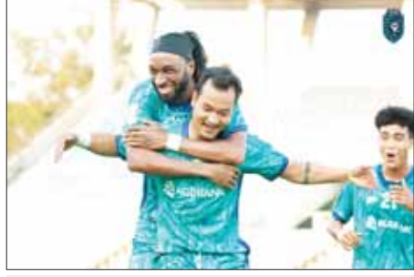
အုပ်စု (က) တွင် ဦးဆောင်နေသည့် ရန်ကုန်ယူနိုက်တက်အသင်း။

၁၆ ရက်နေ့အထိ လူစီးအမြန်ရထားအချို့ ပြေးဆွဲမှု ခေတ္တရပ်နားထားမည်ဖြစ်ပါသည်။ လက်ရှိပြေးဆွဲပေးနေသော ရန်ကုန်-မန္တလေးလမ်းပိုင်းအတွင်း အမှတ်(၁၁)အဆန်၊ အမှတ်(၁၂)အစုန်ရထားနှင့် ရန်ကုန်-မော်လမြိုင်လမ်းပိုင်းအတွင်း အမှတ်(၈၁)အဆန်၊ အမှတ်(၈၂)အစုန်ရထားများကို ပုံမှန်အတိုင်း ပြေးဆွဲပေးသွားမည်ဖြစ်ပြီး ရန်ကုန်-မန္တလေး-ရန်ကုန် စာမျက်နှာ ၉ ကော်လံ ၁ ❖