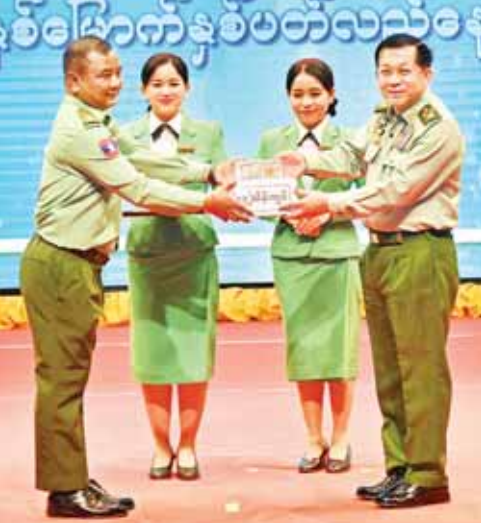
နိုင်ငံတော်စီမံအုပ်ချုပ်ရေးကောင်စီဥက္ကဋ္ဌ တပ်မတော်ကာကွယ်ရေးဦးစီးချုပ် ဗိုလ်ချုပ်မှူးကြီး မင်းအောင်လှိုင် (၇၇) နှစ်မြောက် နှစ်ပတ်လည်နေ့ အထိမ်းအမှတ် ဂုဏ်ပြုချီးမြှင့်ငွေပေးအပ်ရာ ပြည်သူ့ဆက်ဆံရေးနှင့် စိတ်ဓာတ်စစ်ဆင်ရေးညွှန်ကြားရေးမှူးရုံး ညွှန်ကြားရေးမှူးကြီး လက်ခံရယူစဉ်။

ပြည်သူ့ဆက်ဆံရေးနှင့် စိတ်ဓာတ်စစ်ဆင်ရေး တပ်များသည် စာပေ၊ ဂီတ၊ မီဒီယာ စသည့်အသိ