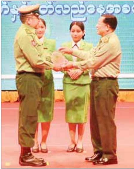
နိုင်ငံတော်စီမံအုပ်ချုပ်ရေးကောင်စီဥက္ကဋ္ဌ တပ်မတော်ကာကွယ်ရေးဦးစီးချုပ် ဗိုလ်ချုပ်မှူးကြီး မင်းအောင်လှိုင် ၂၀၂၃ ခုနှစ်၊ မြန်မာ့ရုပ်ရှင် ထူးချွန်ဆုချီးမြှင့်ပွဲ အခမ်းအနားတွင် “စောင်နီလေး တစ်ထည်” စာတိုကားဖြင့် အကောင်းဆုံးရုပ်ရှင် ဒါရိုက်တာဆု ရရှိခဲ့သည့် ဗိုလ်မှူး တင်အောင်စိုး အား ဆုပေးအပ်ချီးမြှင့်စဉ်။