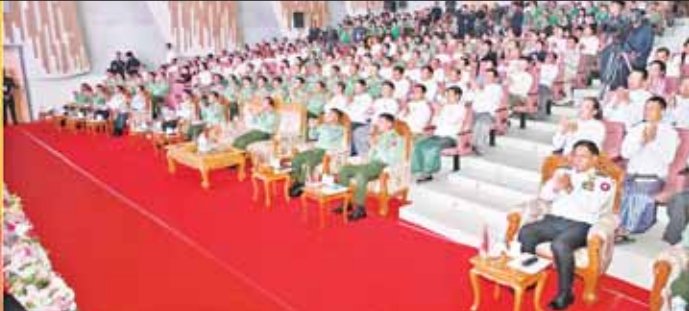
နိုင်ငံတော်စီမံအုပ်ချုပ်ရေးကောင်စီဥက္ကဋ္ဌ တပ်မတော်ကာကွယ်ရေးဦးစီးချုပ် ဗိုလ်ချုပ်မှူးကြီး မင်းအောင်လှိုင်နှင့် အဖွဲ့ဝင်များ ပြည်သူ့ဆက်ဆံရေးနှင့် စိတ်ဓာတ်စစ်ဆင်ရေးညွှန်ကြားရေးမှူးရုံး (၇၇) နှစ်မြောက် နှစ်ပတ်လည်နေ့ အထိမ်းအမှတ်အဖြစ် ဂုဏ်ပြုဖျော်ဖြေတင်ဆက်မှုများကို ကြည့်ရှုအားပေးစဉ်။