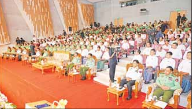
နိုင်ငံတော်စီမံအုပ်ချုပ်ရေးကောင်စီဥက္ကဋ္ဌ တပ်မတော်ကာကွယ်ရေးဦးစီးချုပ် ဗိုလ်ချုပ်မှူးကြီး မင်းအောင်လှိုင် ကာကွယ်ရေးဦးစီးချုပ်ရုံး(ကြည်း)၊ ပြည်သူ့ဆက်ဆံရေးနှင့် စိတ်ဓာတ်စစ်ဆင်ရေးညွှန်ကြားရေးမှူးရုံး (၇၇) နှစ်မြောက် နှစ်ပတ်လည်နေ့အခမ်းအနားတွင် ဂုဏ်ပြုအမှာစကားပြောကြားစဉ်။

လှိုက်လှဲနေ့ထွေးစွာကြိုဆို ဦးစွာ နိုင်ငံတော်စီမံအုပ်ချုပ်ရေးကောင်စီဥက္ကဋ္ဌ တပ်မတော်ကာကွယ်ရေးဦးစီးချုပ်နှင့် အဖွဲ့ဝင်များသည် အခမ်းအနားကျင်းပပြုလုပ်မည့် အမှတ်(၂) တပ်မတော်ရပ်ခြင်သံကြား ထုတ်လွှင့်ရေးတပ်သို့ ရောက်ရှိကြရာ ပြည်သူ့ဆက်ဆံရေးနှင့် စိတ်ဓာတ်စစ်ဆင်ရေး ညွှန်ကြားရေးမှူးရုံး ညွှန်ကြားရေးမှူး ဗိုလ်ချုပ် ဇော်မင်းထွန်းနှင့် အဖွဲ့ဝင်များ၊ မြဝတီရပ်ခြင်သံကြားမှဝန်ထမ်းများ၊ တာဝန်ရှိသူများက လှိုက်လှဲနေ့ထွေးစွာ ကြိုဆိုနှုတ်ဆက်ကြသည်။ ယင်းနောက် ကာကွယ်ရေးဦးစီးချုပ်ရုံး(ကြည်း)၊ ပြည်သူ့ဆက်ဆံရေးနှင့် စိတ်ဓာတ်စစ်ဆင်ရေး ညွှန်ကြားရေးမှူးရုံး (၇၇) နှစ်မြောက် နှစ်ပတ်လည်နေ့ အခမ်းအနားကို စတင်ကျင်းပရာ နိုင်ငံတော်စီမံအုပ်ချုပ်ရေးကောင်စီဥက္ကဋ္ဌ တပ်မတော်ကာကွယ်ရေးဦးစီးချုပ်က နှစ်ပတ်လည်နေ့အခမ်းအနားနှင့် မြဝတီစာပေတိုက်မှ ထုတ်ဝေလျက်ရှိသည့် တေဇရပ်စုံစာစောင်နှင့် မိုးသောက်ပန်းဂျာနယ်တို့အား Amuze Webtoon Application တွင်ထည့်သွင်းခြင်းတို့ကို Digital နည်းပညာအသုံးပြု၍ ဖွင့်လှစ်ပေးပြီး Amuze Webtoon Application တွင်ထည့်သွင်းခြင်း Video