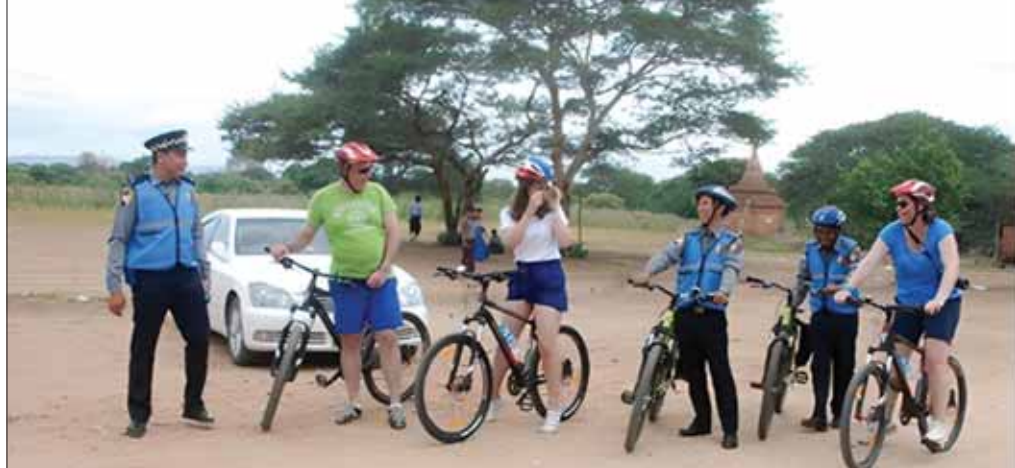
ပုဂံဒေသသို့လာရောက်သည့် နိုင်ငံခြားသားများအား ကူညီစောင့်ရှောက်ပေးနေသော ခရီးသွားလုပ်ငန်းလုံခြုံရေးရတပ်ဖွဲ့ဝင်များ။

ဒုတိယအချက်ဖြစ်သော နိုင်ငံခြားသားကမ္ဘာ လှည့်ခရီးသွားများကို ကြီးကြပ်စောင့်ရှောက် ဆောင်ရွက်နေမှုများအနေဖြင့် နိုင်ငံခြားသားများ ကြီးကြပ်စောင့်ရှောက်ရေးဆိုင်ရာ အသိပညာပေး ရေးလုပ်ငန်းကော်မတီဥက္ကဋ္ဌ၊ ဟိုတယ်နှင့် ခရီး သွားလာရေးဝန်ကြီးဌာနအနေဖြင့်လည်း ဝန်ကြီး ဌာန၏ ဝက်ဘ်ဆိုက်တွင် ပြောင်းလဲလာသော ကမ္ဘာလှည့်ခရီးစဉ် ကိုဗစ်-၁၉ ကပ်ရောဂါ ဖြေလျှော့မှု အခြေအနေများနည်းတူ နိုင်ငံခြားသား ကမ္ဘာလှည့် ခရီးသွားများ မြန်မာနိုင်ငံသို့ အဆက်မပြတ် လာရောက်လည်ပတ်နိုင်ရေးအတွက် ၂၀၂၂ ခုနှစ် ဧပြီလမှစ၍ လေကြောင်းလိုင်းများ စတင်ပျံသန်း ပြေးဆွဲစေခြင်း၊ ခရီးသွားဈေးကွက် ဖြင့်တင်ရေး အကောင်အထည်ဖော် ဆောင်ရွက်ချက်အနေဖြင့် အာဆီယံဒေသအတွင်း တစ်နိုင်ငံနှင့် တစ်နိုင်ငံ ခရီး သွားမြင်တင်ရေးအလုပ်ရုံဆွေးနွေးပွဲများ၊ စာတမ်း ဖတ်ပွဲများ ကျင်းပပြုလုပ်ခြင်း၊ ဆိုရှယ်မီဒီယာ၊ ဒစ်ဂျစ်တယ်ပလက်ဖောင်းများမှ ဆွဲဆောင်မှုရှိသော ခရီးစဉ်ဒေသများအား ရိုက်ကူးတင်ဆက်ကြော်ငြာ ခြင်း၊ ခရီးသွားဆိုင်ရာ သတင်းအချက်အလက်များ၊ ပြည်ဝင်နှင့် ပြည်တွင်းခရီးသွား စစ်တမ်းများ ကောက်ခံ၍ စောင့်ကြည့်စစ်ဆေးခြင်း၊ ခရီးသွား စည်းမျဉ်းများ၊ စာမျက်နှာ ၁၇ သို့