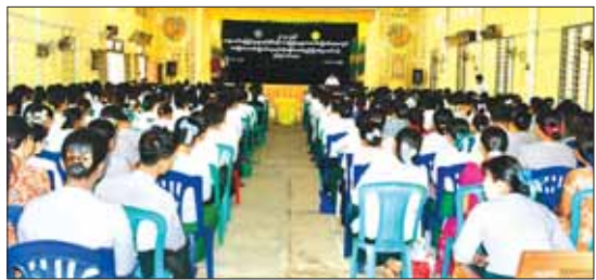
အဆိုပါ သင်တန်းတွင် ပဲခူးခရိုင် ဧပြီ ၁ ရက်မှ ၃ ရက်အထိ ပို့ချမည်အတွင်း မြို့နယ်များမှ သင်တန်းသား ဖြစ်ကြောင်း သိရသည်။ သင်တန်းသူ ၃၁၃ ဦး တက်ရောက်ပြီး သက်ကြီးကြိုင့် (ပြန်/ဆက်)

သန်းခေါင်စာရင်းအရ စာမတတ်သူ ကျေးလက်ဒေသနေ ပြည်သူများနှင့် တိုင်းရင်းသားပြည်သူများ စာတတ်မြောက်ပြီး နိုင်ငံသားများ၏ လူမှုဘဝ ဖြင့်မားလာစေရန်၊ နိုင်ငံသားကောင်းများ၏ အခြေခံအလေ့အကျင့်များ ပိုမိုရရှိလာစေရန် နိုင်ငံသူ နိုင်ငံသားများအတွက် ပညာရယူရန် ကိုရိယာတစ်ခု ဖြစ်သည့် အရေး၊ အဖတ်၊ အတွက် အခြေပြု တတ်မြောက်သွားအောင် သင်ကြားပေးကြစေလိုကြောင်း အမှာစကားပြောကြားသည်။(ယာဝု)