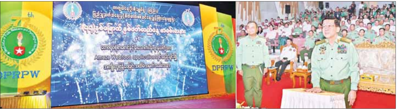
နိုင်ငံတော်စီမံအုပ်ချုပ်ရေးကောင်စီဥက္ကဋ္ဌ တပ်မတော်ကာကွယ်ရေးဦးစီးချုပ် ဗိုလ်ချုပ်မှူးကြီး မင်းအောင်လှိုင် နှစ်ပတ်လည်နေ့အခမ်းအနားနှင့် မြဝတီစာပေတိုက်မှ ထုတ်ဝေလျက်ရှိသည့် တေဇရပ်စုံစာစောင်နှင့် မိုးသောက်ပန်းဂျာနယ်တို့အား Amuze Webtoon Application တွင်ထည့်သွင်းခြင်းတို့ကို Digital နည်းပညာအသုံးပြု၍ ဖွင့်လှစ်ပေးစဉ်။