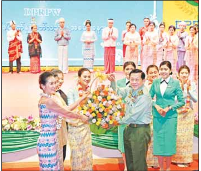
နိုင်ငံတော်စီမံအုပ်ချုပ်ရေးကောင်စီဥက္ကဋ္ဌ တပ်မတော်ကာကွယ်ရေးဦးစီးချုပ် ဗိုလ်ချုပ်မှူးကြီး မင်းအောင်လှိုင် ဖျော်ဖြေတင်ဆက်ခဲ့ကြသည့် အနုပညာရှင်များနှင့် ဖျော်ဖြေရေးအဖွဲ့များအား ဂုဏ်ပြု ပန်းခြင်းပေးအပ်စဉ်။

ယင်းနောက် နိုင်ငံတော်စီမံအုပ်ချုပ်ရေးကောင်စီ ဥက္ကဋ္ဌ တပ်မတော်ကာကွယ်ရေးဦးစီးချုပ်နှင့် အဖွဲ့ဝင် များသည် ပြည်သူ့ဆက်ဆံရေးနှင့် စိတ်ဓာတ်စစ်ဆင် ရေးညွှန်ကြားရေးများရုံး (၇၇) နှစ်မြောက် နှစ်ပတ် လည်နေ့ အထိမ်းအမှတ်အဖြစ် မြဝတီတေးဂီတ