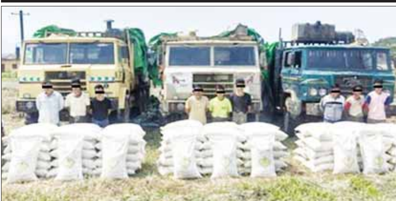
ဖြစ်မှုကျူးလွန်သူများကို သိမ်းဆည်းရမိသည့် ထိန်းချုပ်ဓာတုပစ္စည်း AMMONIUM NITRATE များနှင့်အတူ တွေ့ရစဉ်။

နေပြည်တော် ဧပြီ ၁ ကချင်ပြည်နယ် မိုးညှင်းမြို့နယ်၌ ထိန်းချုပ်ဓာတုပစ္စည်း AMMONIUM NITRATE ၃၆ ဒဿမ ၈၂ တန် ဖမ်းဆီးရမိကြောင်း မြန်မာနိုင်ငံရဲတပ်ဖွဲ့မှ သိရသည်။ မူးယစ်ဆေးဝါး တားဆီးနှိမ်နင်းရေး ရဲတပ်ဖွဲ့မှ တပ်ဖွဲ့ဝင်များ ပါဝင်သော ပူးပေါင်းအဖွဲ့သည် မတ် ၂၉ ရက် နံနက် ၇ နာရီခွဲတွင် မိုးညှင်းမြို့နယ် ကြာကြီးကွင်းကျေးရွာအနီးတွင် သတင်းအရ စောင့်ဆိုင်းနေစဉ် နန်ရင်းကျေးရွာ ဘေးလမ်းအတိုင်း မောင်းနှင်လာသည့် ဆိုင်ကယ်စာမျက်နှာ ၁၅ ကော်လံ ၅ ခု