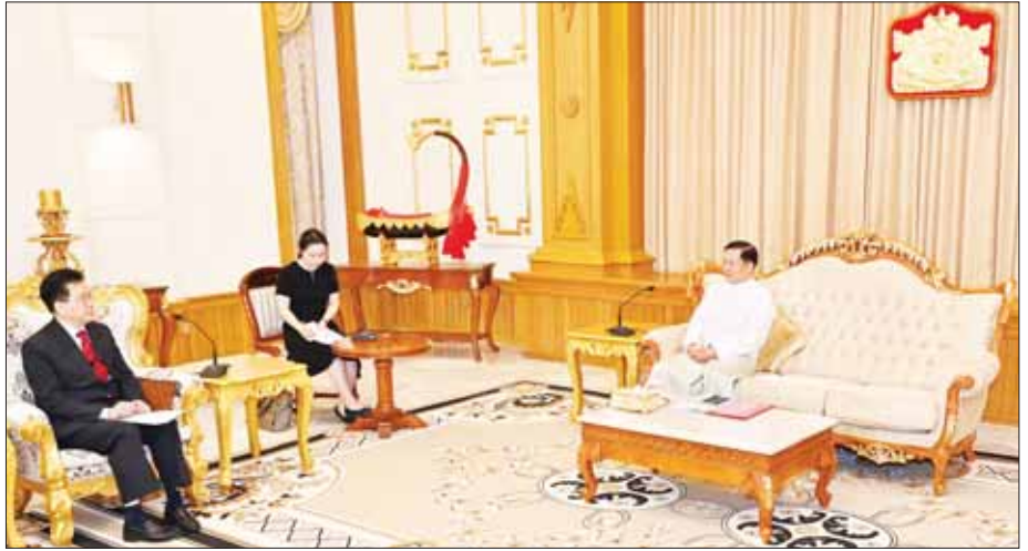
နိုင်ငံတော်စီမံအုပ်ချုပ်ရေးကောင်စီဥက္ကဋ္ဌ နိုင်ငံတော်ဝန်ကြီးချုပ် ဗိုလ်ချုပ်မှူးကြီး မင်းအောင်လှိုင် တရုတ်နိုင်ငံခြားရေးဝန်ကြီးဌာန အာရှရေးရာအထူးကိုယ်စားလှယ် H. E. Mr. Deng Xijun အား လက်ခံတွေ့ဆုံစဉ်။