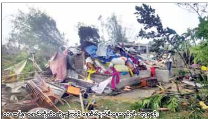
လေဆင်နှာမောင်းတိုက်ခတ်မှုကြောင့် နေအိမ်ပျက်စီးနေသည့်တိုက်ကြွေရပ်။

ရာခိုင်နှုန်းတိုးလာကြောင်းနှင့် တူနာငါးတင်ပို့မှု၏ ဝင်ငွေမှာ ဒေါ်လာ သန်း ၂၂၀ ကျော်ရှိသဖြင့် တစ်နှစ် ထက်တစ်နှစ် ၂၂ ဒသမ ၅ ရာခိုင်နှုန်းတိုးလာကြောင်း အဆိုပါအသင်းက ပြောကြားသည်။ အမေရိကန်၊ ဂျပန်နှင့် တရုတ်နိုင်ငံတို့သည် ယင်းကာလအတွင်း ပီယက်နမ်ပင်လယ်စာ ထုတ်ကုန်များကို အများ ဆုံးတင်သွင်းသည့်နိုင်ငံများဖြစ်ကြောင်း အသင်း၏ ဆက်သွယ်ရေး ဒါရိုက်တာလီဟန်က ပြောကြား သည်။ ပီယက်နမ်နိုင်ငံသည် ၂၀၂၄ ခုနှစ်အတွင်း ပင်လယ်စာတင်ပို့မှုမှာ ဒေါ်လာ ၉ ဒသမ ၅ ဘီလီယံ ရရှိရန် မျှော်မှန်းထားကြောင်း ဒေသတွင်း မီဒီယာ များက ဖော်ပြထားသည်။ ဆင်ဟွာ