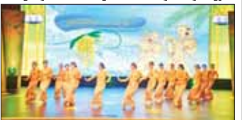
ပြည်တွင်းသတင်း ၈၁ ၁၄

နေပြည်တော်တွင် ဌာနဆိုင်ရာ သင်္ကြန်ယိမ်းအဖွဲ့များ သင်္ကြန်အက အလှများ ဇာတ်တိုက်လေ့ကျင့်လျက်ရှိ