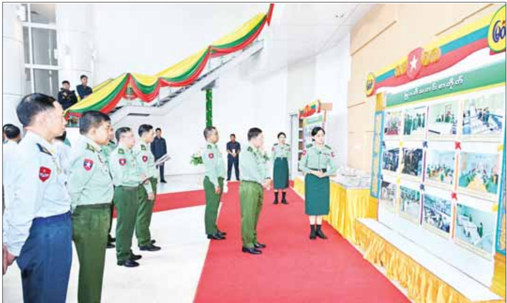
နိုင်ငံတော်စီမံအုပ်ချုပ်ရေးကောင်စီဥက္ကဋ္ဌ တပ်မတော်ကာကွယ်ရေးဦးစီးချုပ် ဗိုလ်ချုပ်မှူးကြီး မင်းအောင်လှိုင်နှင့်အဖွဲ့ဝင်များ ပြည်သူ့ဆက်ဆံရေးနှင့် စိတ်ဓာတ် စစ်ဆင်ရေး ညွှန်ကြားရေးများရုံး (၇၇) နှစ်မြောက် နှစ်ပတ်လည်နေ့အခမ်းအနားအဖြစ် ခင်းကျင်းပြသထားသည့်ပြခန်းများကို လှည့်လည်ကြည့်ရှုစဉ်။