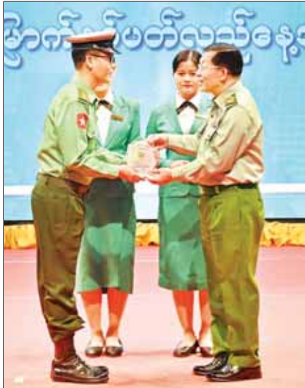
နိုင်ငံတော်စီမံအုပ်ချုပ်ရေးကောင်စီဥက္ကဋ္ဌ တပ်မတော်ကာကွယ်ရေးဦးစီးချုပ် ဗိုလ်ချုပ်မှူးကြီး မင်းအောင်လှိုင် ၂၀၂၂ ခုနှစ်၊ စာပေဗိမာန်စာမူဆု စာပဒေသာ (ပထမဆု) ရရှိသည့် ဗိုလ်ကြီး နေထွဋ်အောင် အား ဆုပေးအပ်ချီးမြှင့်စဉ်။