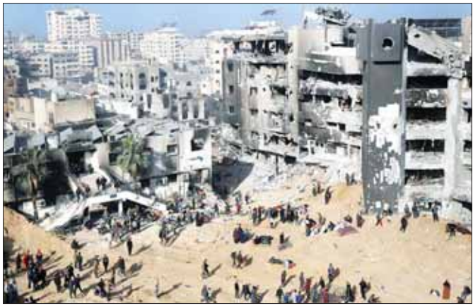
အစွဲရေးတပ်ဖွဲ့များရုပ်သိမ်းလိုက်သည့် ဂါဇာရှိ အယ်ဂျီပာဆေးရုံ၌ ထိခိုက်ပျက်စီးမှုများကို တွေ့ရစဉ်။

တက်ဒရ်စ်အက်ဟာနွန် ဂီဘရီယက်ဆက် ဝင်ရောက်စီးနင်းမှု စတင်ဖြစ်ပွားပြီးနောက်ပိုင်း အယ်ဂျီပာဆေးရုံ၌ လူနာ ၂၁ ဦးထက်မနည်း သေဆုံးမှုဖြစ်ပွားခဲ့ကြောင်း ပြောသည်။ ဆေးရုံအနီး တစ်ပိုက်တွင် စစ်ရေးဆောင်ရွက်မှုများ ဆက်လက် လုပ်ဆောင်လျက်ရှိကြောင်း ဆိုရှယ်မီဒီယာ ပလက်ဖောင်းတွင် ၎င်းက ရေးသားဖော်ပြထားသည်။ ထို့အပြင် ကလေးငယ် လေးဦးနှင့် အရေးကြီး လူနာ ၂၈ ဦးအပါအဝင် လူနာ ၁၀၇ ဦးထက်မနည်းမှာ သေဆုံးခဲ့ကြောင်း ပီတီမီနေကြောင်း၊ လိုအပ်သော ကျန်းမာရေးစောင့်ရှောက်မှုများ မရရှိကြောင်းနှင့် အများစုမှာ ရောဂါပိုးကူးစက်ခံနေရပြီး ဓေရာဝတ်ခန်းခြောက်နေကြောင်း ၎င်းက ဆက်ပြောသည်။ ဆင်ဟွာ