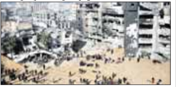
နိုင်ငံတကာသတင်း ၈၁ ၁၃

ဂါဇာ၏အကြီးဆုံးအယ်ရီဟဆေးရုံမှ တပ်ဖွဲ့များ အစွဲရေးရုပ်သိမ်း