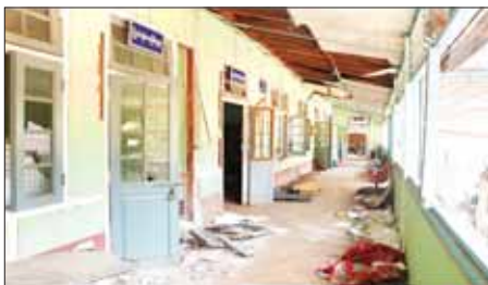
PNLO၊ KNDFI PDF အကြမ်းဖက်သောင်းကျန်းသူများက ဆီဆိုင်မြို့အတွင်းရှိ မြို့နယ်ကျန်းမာရေးဦးစီးဌာနမှူးရုံးအား ဖျက်ဆီးထားရှိမှုကို တွေ့ရစဉ်။

သားများနှင့်အတူ ပြန်လည်ထူထောင်ရေး လုပ်ငန်းများနှင့် စုပေါင်းသန့်ရှင်းရေးလုပ်ငန်းများကို ပိုင်းဝန်းကူညီ ဆောင်ရွက်ပေးပြီး သက်ဆိုင်ရာ တာဝန်ရှိသူများက ထောက်ပံ့ပစ္စည်းများနှင့် ထောက်ပံ့ငွေများ ပေးအပ်လျက်ရှိသည်။