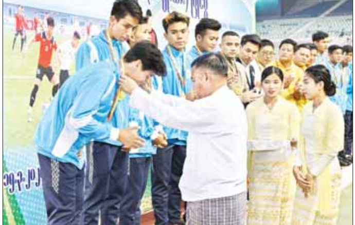
နိုင်ငံတော်စီမံအုပ်ချုပ်ရေးကောင်စီ တွဲဖက်အတွင်းရေးမှူး ဒုတိယဗိုလ်ချုပ်ကြီး ရဲဝင်းဦး ပထမဆုရရှိသည့် ရန်ကုန်တိုင်းဒေသကြီးအသင်းကို တစ်ဦးချင်း ဆုတံဆိပ်များ ပေးအပ်ချီးမြှင့်စဉ်။

ရင်းရင်းနှီးနှီးနှုတ်ဆက်ထို့နောက် နိုင်ငံတော်စီမံအုပ်ချုပ်ရေးကောင်စီ ဥက္ကဋ္ဌ နိုင်ငံတော်ဝန်ကြီးချုပ် ဗိုလ်ချုပ်မှူးကြီး မင်းအောင်လှိုင်က ပထမဆုရရှိသည့် ရန်ကုန်တိုင်းဒေသကြီးအသင်းအား ဂုဏ်ပြုချီးမြှင့် တံခွန်စိုက်ဖလားတို့ကို ပေးအပ်ချီးမြှင့်ပြီး အားကစားသမားများကို ရင်းရင်းနှီးနှီးနှုတ်ဆက်ခဲ့သည်။ မြန်မာ့ဘောလုံးအားကစားဖွံ့ဖြိုးတိုးတက်စေရန်နှင့် မြန်မာ့လက်ရွေးစင် ထူးချွန်အားကစားသမားများ ထွက်ပေါ်လာစေရန် ရည်ရွယ်၍ ပြည်နယ်နှင့်တိုင်းဒေသကြီး U-25 ဘောလုံးပြိုင်ပွဲကို မတ် ၁၅ ရက်မှ စတင်၍ ယှဉ်ပြိုင်ကစားခဲ့ခြင်း ဖြစ်ကြောင်း သတင်းရရှိသည်။