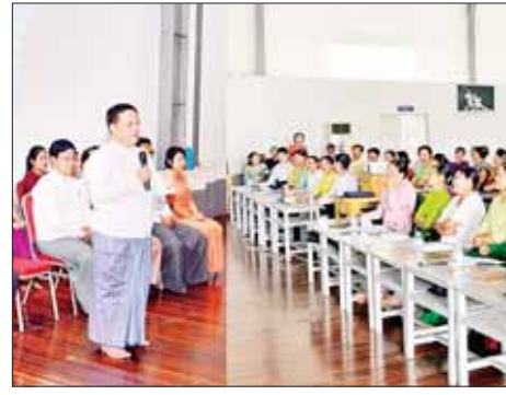
သင်တန်းသား သင်တန်းသူများ တက်ရောက်ကြသည်။ အခမ်းအနား မစတင်မီ နေပြည်တော်၊ တိုင်းဒေသကြီးနှင့် ပြည်နယ်များမှ တက်ရောက်လာ သော အဆင့်မြင့်ပညာဦးစီးဌာန၊

နေပြည်တော် မတ် ၂၉ ကျေးလက်နေ ပြည်သူများနှင့် တိုင်းရင်းသားပြည်သူများ စာ တတ်မြောက်ရေး၏ ကဏ္ဍတစ်ခု ဖြစ်သည့် အခြေခံစာတတ်မြောက် ရေးလုပ်ငန်း ဗဟိုအဆင့်နည်းပြ သင်တန်းဆင်းပွဲကို ယမန်နေ့ ညနေပိုင်းက နေပြည်တော် လယ်ဝေမြို့နယ် သုခုမလမ်းရှိ အားကစားလေ့ကျင့်ရေးစခန်း၌ ကျင်းပသည်။ သင်တန်းဆင်းပွဲသို့ ပညာရေး ဝန်ကြီးဌာန ကျောင်းပြင်ပနှင့် တစ်သက်တာ ပညာရေးဦးစီးဌာန ညွှန်ကြားရေးမှူးချုပ် ဦးကျော် ဝင်း၊ ဒုတိယညွှန်ကြားရေးမှူးချုပ် များနှင့်တာဝန်ရှိသူများ၊ လယ်ဝေ မြို့နယ်ပညာရေးမှူး၊ သင်တန်း နည်းပြများနှင့် ဗဟိုအဆင့်နည်းပြ