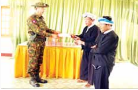
ကာကွယ်ရေးဦးစီးချုပ်ရုံး(ကြည်း)မှ ဗိုလ်ချုပ်နိုင်နိုင်ဦးက ဌာနဆိုင်ရာ ဝန်ထမ်းများနှင့် ဒေသခံပြည်သူများအတွက် ထောက်ပံ့ငွေများ ပေးအပ်စဉ်။

PNLO အဖွဲ့သည် အဆိုပါ အဖွဲ့များနှင့်အတူ အင်အားစုစည်း၍ ဒေသတည်ငြိမ်အေးချမ်းမှု ပျက်ပြားစေရန်အတွက် ဖေဖော်ဝါရီလ ၁၆ ရက်မှစ၍ ကျေးရွာသူကျေးရွာသားများ အသွင်ဖြင့် စိမ့်ဝင်ပုံဖျက်ဝင်ရောက်ပြီးနောက် ဒေသအချို့ရှိ တပ်မတော် တပ်စခန်းများ၊ လုံခြုံရေးတပ်ဖွဲ့များ၏ တပ်ဌာနချုပ်များအား ဝင်ရောက်တိုက်ခိုက်ခြင်း၊ ကျေးရွာများအတွင်းရှိ နေအိမ်များအား မီးရှို့ဖျက်ဆီးခြင်း၊ ပြည်သူများအား လက်နက်အားကိုးဖြင့် အနိုင်ကျင့်သတ်ဖြတ်ခြင်း၊ ဒေသခံတိုင်းရင်းသားများ ပိုင်ဆိုင်သည့် ပစ္စည်းများအား အတင်းအဓမ္မ လုယက် ယူဆောင်ခြင်းစသည့် အဖျက်အမှောင် လုပ်ငန်းများ လုပ်ဆောင်ခဲ့ရာ လုံခြုံရေးတပ်ဖွဲ့ဝင်များနှင့် ထိတွေ့တိုက်ပွဲများ ဖြစ်ပွားခဲ့ပြီး ဒေသခံတိုင်းရင်းသားများအနေဖြင့် ဘေးလွတ်ရာနေရာများသို့ ယာယီနေရပ်စွန့်ခွာနေထိုင်ခဲ့ကြရသည်။