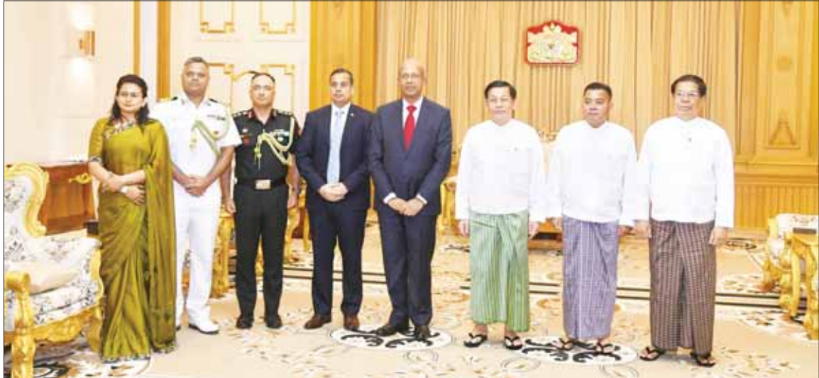
နိုင်ငံတော် စီမံအုပ်ချုပ်ရေးကောင်စီဥက္ကဋ္ဌ နိုင်ငံတော်ဝန်ကြီးချုပ် ဗိုလ်ချုပ်မှူးကြီး မင်းအောင်လှိုင်နှင့် အဖွဲ့ဝင်များ မြန်မာနိုင်ငံဆိုင်ရာ အိန္ဒိယနိုင်ငံသံအမတ်ကြီး H.E. Mr. Vinay Kumar အား ရင်းနှီးနှီး နှုတ်ဆက်စဉ်။