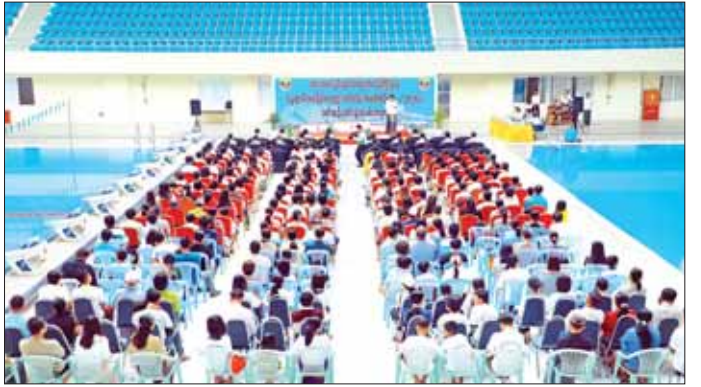
ရရှိခဲ့သူများကို တစ်ဦးချင်း ဆုတံဆိပ်၊ ငွေသားဆုများနှင့် ပထမဆုရရှိသည့်သင်တန်းသား/ သင်တန်းသူများကို ဝဏ္ဏသိဒ္ဓိ ရေကူးကန်၌ အခမဲ့ Member

နှစ်အထက် (အမျိုးသား/အမျိုး သမီး) နေရာသီရေကူးသင်တန်း ပြိုင်ပွဲတွင် ပထမ၊ ဒုတိယနှင့် တတိယဆုရရှိခဲ့သူများကို တစ်ဦးချင်းဆုတံဆိပ်၊ ငွေသားဆုများနှင့် သင်တန်းဆင်း လက်မှတ်များ ကို ပြည်ထောင်စုဝန်ကြီးကလည်း ကောင်း၊ အသက် ၁၂ နှစ်အထက် (အမျိုးသား/အမျိုးသမီး) နေရာသီ ရေကူးသင်တန်းပြိုင်ပွဲတွင် ပထမ၊ ဒုတိယနှင့်တတိယဆုရရှိခဲ့သူများ ကို တစ်ဦးချင်းဆုတံဆိပ်၊ ငွေသား ဆုများနှင့် သင်တန်းနည်းပြဆရာ များအတွက် ချီးမြှင့်ငွေများကို ဒုတိယဝန်ကြီး ဦးထိန်လင်းက လည်းကောင်း၊ အသက် ၁၂ နှစ် အောက် (အမျိုးသား/အမျိုးသမီး) နေရာသီ ရေကူးသင်တန်းပြိုင်ပွဲ တွင် ပထမ၊ ဒုတိယနှင့် တတိယဆု