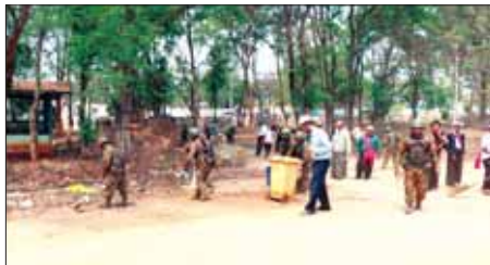
တပ်မတော်သားများ၊ မြန်မာနိုင်ငံရဲတပ်ဖွဲ့ဝင်များ၊ ဌာနဆိုင်ရာ ဝန်ထမ်းများ၊ ပြည်သူ့စစ်(ဌာန)တပ်ဖွဲ့ဝင်များ၊ ဒေသခံတိုင်းရင်းသား ပြည်သူများ ဆီဆိုင်မြို့တွင်း စုပေါင်းသန့်ရှင်းရေး ဆောင်ရွက်စဉ်။