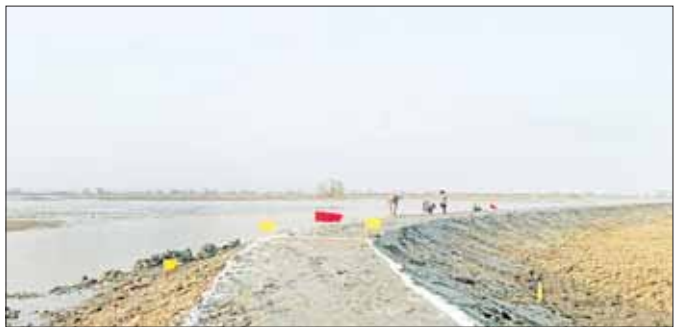
မြေပုံမြို့နယ် ငမန်းရဲကျွန်းရေငန်တားတာ အပိုင်း(၁) ပြန်လည်ပြုပြင်ရေးလုပ်ငန်း ဆောင်ရွက်ပြီးစီးမှု အခြေအနေကို တွေ့ရစဉ်။ (၂-၆-၂၀၂၃ ရက်)

နိုင်ငံတော်အစိုးရနဲ့ မြန်မာပြည်သူတစ်ရပ်လုံးက မြေပုံမြို့နယ် အပါအဝင် ရခိုင်ပြည်နယ်အတွင်းမှာရှိကြတဲ့ မြို့နယ်တွေအားလုံး ဖွံ့ဖြိုးတိုးတက်စေချင်တယ်။ တည်ငြိမ်စေချင်တယ်။ အေးချမ်းစေ ချင်တယ်။ လုပ်စီးပွား ကိုင်စီးပွားတွေ တိုးစေချင်တယ်ဆိုတာ မိုခါက သက်သေပဲ။ မုန့်တိုင်းကျရောက်တော့မယ်ဆိုတာသိတာနဲ့ မိဘက သားသမီးတွေအပေါ် စိတ်ပူသလိုပဲ နိုင်ငံတော်အကြီးအကဲ တွေကိုယ်တိုင် စစ်တွေမြို့ကို အမြန်ဆုံးသွားရောက်တယ်။ စီမံ ကွပ်ကဲတယ်။ လိုအပ်တဲ့အထောက်အပံ့တွေ အချိန်မီရအောင် လုပ်ပေးတယ်။ အခြားပြည်နယ်နဲ့ တိုင်းဒေသကြီးတွေနဲ့တစ်ပြေးညီ ကျောင်းတွေအချိန်မီ ဖွင့်နိုင်အောင် ဆောင်ရွက်ပေးတယ်။