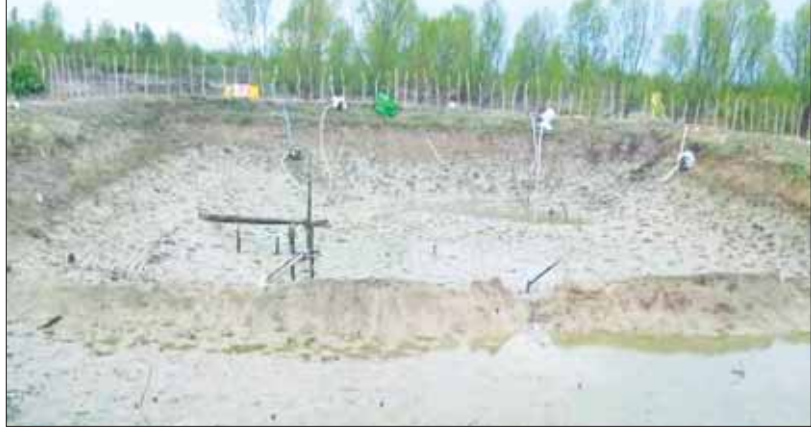
မြေပုံမြို့နယ် လွန်းလုံးပိုက်ကျေးရွာ မြေသားရေကန်အတွင်း ဆားငန်ရေဝင်ရောက်မှုကို ရေစုပ်စက်ဖြင့် စုပ်ထုတ်အပြီး တွေ့ရစဉ်။

ကျောင်းတွေအချိန်မီ ဖွင့်နိုင်အောင် ဆောင်ရွက်ပေးတယ်။ အမိုးအကာအအောက် အမြန်ဆုံး အေးအေးချမ်းချမ်း သာသာယာယာ နေနိုင်အောင် ဆောင်ရွက်ပေးတယ်။ ဒါတွေအားလုံးဟာ စိတ်ကောင်းစေတာနာ မပါဘဲ လုပ်နိုင်မှာမဟုတ်ပါဘူး။ တကယ် ကိုပဲ ကောင်းမွန်တဲ့ စေတနာ၊ ချစ်ခင်တဲ့ စိတ်ဓာတ်အပြည့်အဝနဲ့ ကူညီဆောင်ရွက် ပေးခဲ့တာဆိုတာ မိုခါမုန့်တိုင်း ကူညီကယ်ဆယ်ရေး လုပ်ငန်းတွေက သက်သေပြနေတာဆိုတာ အသေအချာ ပါပဲခင်ဗျား။ ။