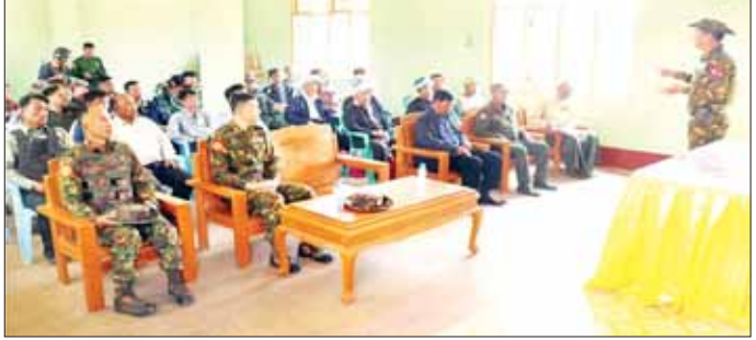
ကာကွယ်ရေးဦးစီးချုပ်ရုံး(ကြည်း)မှ ဗိုလ်ချုပ်နိုင်နိုင်ဦးက ဆီဆိုင်မြို့ရှိ ဌာနဆိုင်ရာဝန်ထမ်းများ၊ လုံခြုံရေးတပ်ဖွဲ့ဝင်များနှင့် တွေ့ဆုံအမှာစကားပြောကြားပြီး လိုအပ်သည်များ ညှိနှိုင်းဆောင်ရွက်ပေးစဉ်။

အား ကြိုးပမ်းဆောင်ရွက်ခဲ့ရာ အေးချမ်းလာပြီ ဖြစ်သည့်အတွက် ယာယီနေရပ်စွန့်ခွာ ဒေသခံတိုင်းရင်းသားများသည် ၎င်းတို့၏ သက်ဆိုင်ရာ ကျေးရွာများသို့ ပြန်လည်အခြေချ ဝင်ရောက်နေထိုင်လျက်ရှိရာ နယ်မြေခံ တပ်မတော်သားများက အကြမ်းဖက်သမားများ ဖျက်ဆီးသွားခဲ့