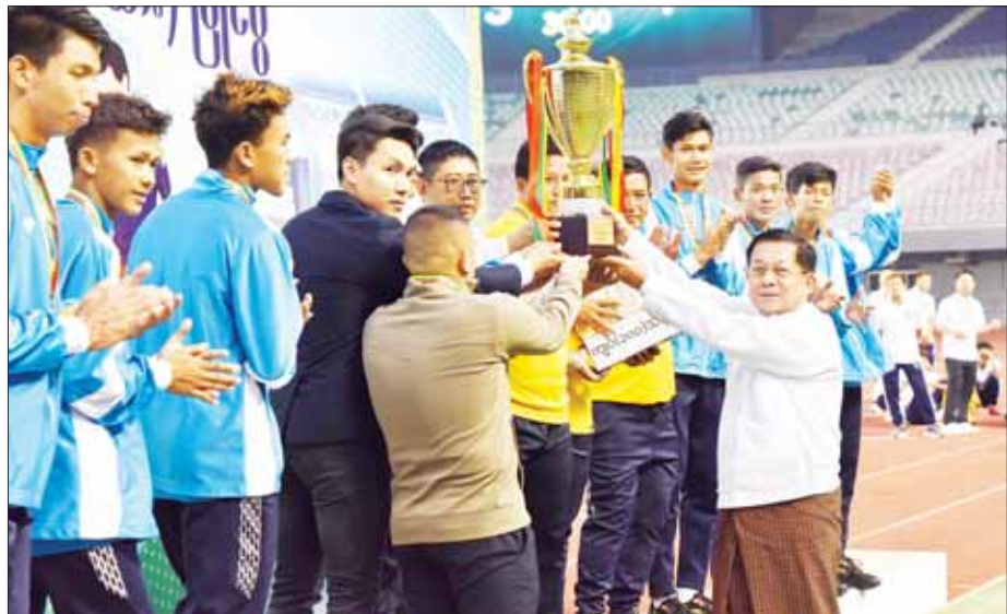
နိုင်ငံတော်စီမံအုပ်ချုပ်ရေးကောင်စီဥက္ကဋ္ဌ နိုင်ငံတော်ဝန်ကြီးချုပ် ဗိုလ်ချုပ်မှူးကြီး မင်းအောင်လှိုင် ပထမဆုရရှိသည့် ရန်ကုန်တိုင်းဒေသကြီးအသင်းအား ဂုဏ်ပြုချီးမြှင့်ငွေနှင့် တံခွန်စိုက်ဖလား ပေးအပ်ချီးမြှင့်စဉ်။

အခမ်းအနားသို့ နိုင်ငံတော်စီမံအုပ်ချုပ်ရေးကောင်စီ တွဲဖက်အတွင်းရေးမှူး ဒုတိယဗိုလ်ချုပ်ကြီး ရဲဝင်းဦး၊ ကောင်စီဝင်များ ပြည်ထောင်စု ဝန်ကြီးများ၊ နေပြည်တော်ကောင်စီ ဥက္ကဋ္ဌ တပ်မတော် အရာရှိကြီးများ၊ နေပြည်တော်တိုင်း စစ်ဌာနချုပ်တိုင်းမှူး၊ ဒုတိယဝန်ကြီးများ၊ တိုင်းဒေသကြီးနှင့် ပြည်နယ်အသီးသီးမှအားကစားအသင်းများ အလိုက် အုပ်ချုပ်သူများ၊ နည်းပြများနှင့် အားကစားသမားများ၊ ဝန်ကြီးဌာနများမှ တာဝန်ရှိသူများနှင့် ဝန်ထမ်းများ၊ မြန်မာနိုင်ငံဘောလုံးအဖွဲ့ချုပ်မှ တာဝန်ရှိသူများ၊ အားကစားဝါသနာရှင်များ တက်ရောက်ကြည့်ရှု အားပေးကြသည်။