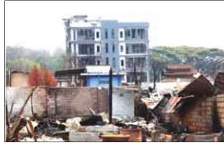
PNLO၊ KNDF၊ PDF အကြမ်းဖက်သောင်းကျန်းသူများက ဆီဆိုင် မြို့အတွင်းရှိ အဆောက်အဦများအား မီးရှို့ဖျက်ဆီးထားမှုကို တွေ့ရစဉ်။