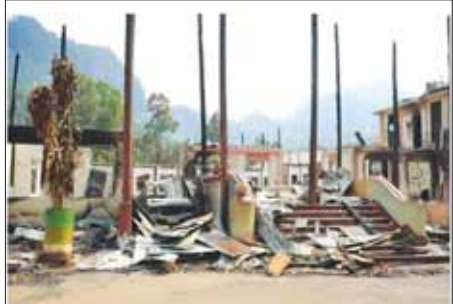
ရှမ်းပြည်နယ်(တောင်ပိုင်း) ဟိုပုံးမြို့နယ် မဲနယ်တောင်ဒေသရှိ ပအိုဝ်း တိုင်းရင်းသားများနေထိုင်သည့်ကျေးရွာများအား PNLO၊ KNDF၊ PDF အကြမ်းဖက်သောင်းကျန်းသူများက နေအိမ်အဆောက်အဦ များအား မီးရှို့ဖျက်ဆီးထားမှုကို တွေ့ရစဉ်။