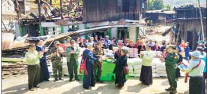
ရှမ်းပြည်နယ်(တောင်ပိုင်း) ဟိုပုံးမြို့နယ် ကျောက်ကချားကျေးရွာအတွင်းနေထိုင်သည့် ဒေသခံတိုင်းရင်းသားပြည်သူများအား တာဝန်ရှိသူများက ထောက်ပံ့ပစ္စည်းများပေးအပ်စဉ်။