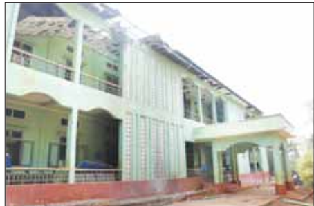
PNLO၊ KNDF၊ PDF အကြမ်းဖက်သောင်းကျန်းသူများက ဆီဆိုင် မြို့နယ်ပြည်သူ့ဆေးရုံကြီးအား ဖျက်ဆီးထားမှုကို တွေ့ရစဉ်။