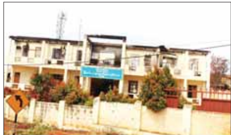
PNLO၊ KNDF၊ PDF အကြမ်းဖက်သောင်းကျန်းသူများက ဆီဆိုင် မြို့အတွင်းရှိ အထွေထွေအုပ်ချုပ်ရေးဦးစီးဌာနရုံးအား ဖျက်ဆီးထားမှု ကို တွေ့ရစဉ်။

စက်သုံးဆီတင်သွင်းသို့လှောင်ဖြန့်ဖြူးခြင်းလုပ်ငန်းကြီးကြပ်ရေးကော်မတီ