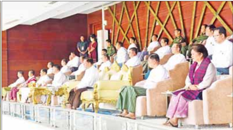
နိုင်ငံတော်စီမံအုပ်ချုပ်ရေးကောင်စီဥက္ကဋ္ဌ နိုင်ငံတော်ဝန်ကြီးချုပ် ဗိုလ်ချုပ်မှူးကြီး မင်းအောင်လှိုင်နှင့်အဖွဲ့ဝင်များ ပြည်နယ်နှင့် တိုင်းဒေသကြီး U-25 ဘောလုံးပြိုင်ပွဲ(အမျိုးသား)ပြိုင်ပွဲ ဗိုလ်လုပွဲစဉ်အဖြစ် ကချင်ပြည်နယ်အသင်းနှင့် ရန်ကုန်တိုင်းဒေသကြီးအသင်းတို့ ယှဉ်ပြိုင်ကစားနေမှုကို ကြည့်ရှုအားပေးစဉ်။