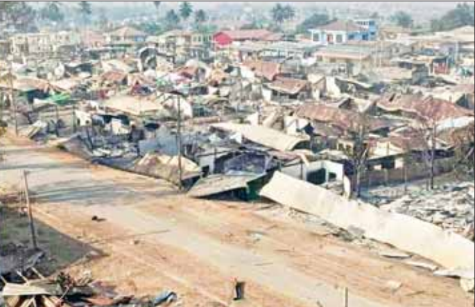
အကြမ်းဖက်သောင်းကျန်းသူများ ခိုင်းထောင်ဖောက်ခွဲခံရပြီး ပျက်စီးခဲ့သည့် ဆီဆိုင်မြို့ မှတ်တမ်းဓာတ်ပုံ။