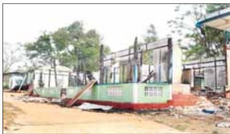
PNLO၊ KNDFI PDF အကြမ်းဖက်သောင်းကျန်းသူများက ဆီဆိုင်မြို့အတွင်းရှိ မြို့နယ်ကျန်းမာရေးဦးစီးဌာနမှူးရုံးအား ဖျက်ဆီးထားရှိမှုကို တွေ့ရစဉ်။