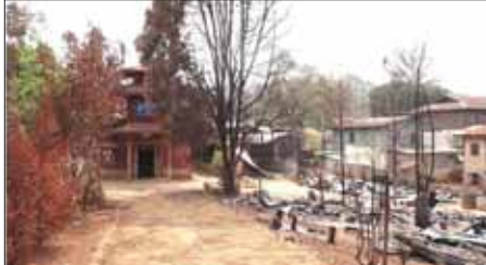
PNLO၊ KNDFI PDF အကြမ်းဖက်သောင်းကျန်းသူများက ဆီဆိုင်မြို့အတွင်းရှိ ခရစ်ယာန်ဘုရားရှိခိုးကျောင်းအား ဖျက်ဆီးထားရှိမှုကို တွေ့ရစဉ်။