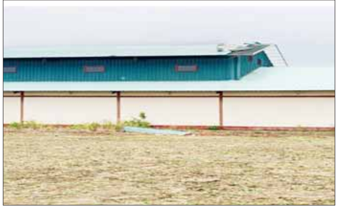
မိုခါမုန်တိုင်းကြောင့် မြေပုံမြို့နယ် အားကစားခန်းမခေါင်မိုး ပျက်စီးမှုအခြေအနေကို တွေ့ရစဉ်။

လေကြမ်းလို အမြစ်မကျတံသော်လည်း အချို့အပင်တွေဟာ တောမီးလောင်ထားသလို သစ်ရွက်တွေမရှိတော့။ နေအိမ်အဆောက်အအုံတွေဆိုတာလည်း ပြိုတဲ့အိမ်တွေကပြီ။ အမိုးလန့်တဲ့အိမ်တွေက လန့်ကျနဲ့ တကယ့်ကို စိတ်ချောက်ချားစရာ မြို့ပျက်ကြီးတွေ ဖြစ်နေပါလား။ ဒီအထဲ သစ်ပင်ပင်လို့၊ အိမ်ပေါ်က ပြုတ်ကျလို့၊ ရေနစ်လို့စတဲ့ ထိခိုက်မှုတွေဆိုတာတွေလည်းရှိတော့ ငိုကြွေးအော်ဟစ်သူတွေဆိုတာလည်း နေရာအနှံ့ မြင်ရ တွေ့ရ ကြားရတော့ တကယ့်အနိဋ္ဌာရုံမြင်ကွင်းတွေပါပဲ။ ဒီကြားထဲ နေရာအနှံ့မှာ မရှိ၊ စားစရာဆိုတာ နုတ္တိဆိုတော့ ခိုင်မာတဲ့တိုက်အိမ်သွားနားခိုခိုလို့ တိုက်ပြိုအုတ်နံရံပိတ်သူတွေဆိုလည်းရှိသေး။ မုန်တိုင်းရဲ့ ရက်စက်ကြမ်းကြုတ်မှုကတော့ ပြောမကုန်အောင်ပါပဲ။ စာမျက်နှာ ၁၅ သို့