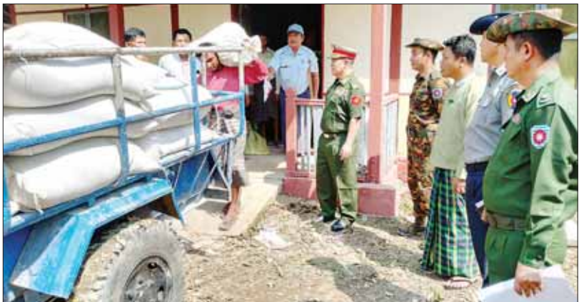
မိုခါမုန်တိုင်းကြောင့် မြေပုံမြို့နယ်မှ လေဘေးသင့်ပြည်သူများအား အခြေခံစားသောက်ကုန်(ဆန်)များ ထောက်ပံ့ပေးအပ်နိုင်ရန် ဆောင်ရွက်နေမှုကို ဗိုလ်မှူးချုပ် ကျော်ကျော်စိုး ဦးဆောင်သော သဘာဝဘေး ပြန်လည်ထူထောင်ရေး ကော်မတီဝင်များက ကြီးကြပ်ဆောင်ရွက်စဉ်။

မြေပုံမြို့နယ်ရဲ့ ပြန်လည်ထူထောင်ရေးလုပ်ငန်းကို ထိထိရောက်ရောက်လုပ်ကိုင်နိုင်ဖို့ ရောက်ရှိလာသူကတော့ ဗိုလ်မှူးချုပ် ကျော်ကျော်စိုးပဲဖြစ်ပါတယ်။ ဗိုလ်မှူးချုပ်