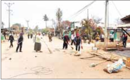
တပ်မတော်သားများ၊ မြန်မာနိုင်ငံရဲတပ်ဖွဲ့ဝင်များ၊ ဌာနဆိုင်ရာ ဝန်ထမ်းများ၊ ပြည်သူ့စစ်(ဌာန)တပ်ဖွဲ့ဝင်များ၊ ဒေသခံတိုင်းရင်းသားပြည်သူများ ဆီဆိုင်မြို့တွင်း စုပေါင်းသန့်ရှင်းရေးဆောင်ရွက်စဉ်။

အား ကြိုးပမ်းဆောင်ရွက်ခဲ့ရာ အေးချမ်းလာပြီ ဖြစ်သည့်အတွက် ယာယီနေရပ်စွန့်ခွာ ဒေသခံတိုင်းရင်းသားများသည် ၎င်းတို့၏ သက်ဆိုင်ရာ ကျေးရွာများသို့ ပြန်လည်အခြေချ ဝင်ရောက်နေထိုင်လျက်ရှိရာ နယ်မြေခံ တပ်မတော်သားများက အကြမ်းဖက်သမားများ ဖျက်ဆီးသွားခဲ့