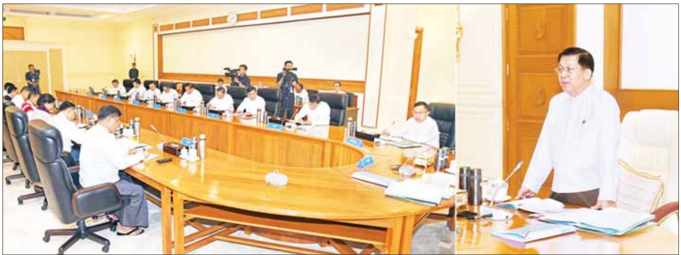
နိုင်ငံတော်စီမံအုပ်ချုပ်ရေးကောင်စီဥက္ကဋ္ဌ နိုင်ငံတော်ဝန်ကြီးချုပ် ဗိုလ်ချုပ်မှူးကြီး မင်းအောင်လှိုင် နိုင်ငံတော်စီမံအုပ်ချုပ်ရေးကောင်စီအစည်းအဝေး (၂/၂၀၂၄)တွင် အမှာစကားပြောကြားစဉ်။