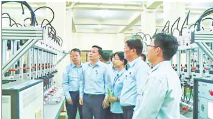
လုပ်ငန်းများဆောင်ရွက်ရန် လုပ်ငန်းသုံးပစ္စည်းများ ဖြန့်ဖြူးနေရာချထားမှုအခြေအနေတို့ကို လှည့်လည်ကြည့်ရှုစစ်ဆေးသည်။

နေပြည်တော် မတ် ၂၉ ပြည်ထောင်စုဝန်ကြီး ဦးဉာဏ်ထွန်းသည် ဌာနဆိုင်ရာ တာဝန်ရှိသူများနှင့်အတူ ယနေ့နံနက်ပိုင်းတွင် ရန်ကုန်တိုင်းဒေသကြီး အလုံမြို့နယ်ရှိ လျှပ်စစ်ဓာတ်အားပို့လွှတ်ရေးနှင့် ကွပ်ကဲရေးဦးစီးဌာန လျှပ်စစ်ဓာတ်အားထုတ်လုပ်ရေးလုပ်ငန်း၊ လျှပ်စစ်ဓာတ်အားဖြန့်ဖြူးရေးလုပ်ငန်းနှင့် ရန်ကုန်လျှပ်စစ်ဓာတ်အားပေးရေးကော်ပိုရေးရှင်းတို့၏ ပစ္စည်းသိုလှောင်ရေးစတိုးများကို ကြည့်ရှုစစ်ဆေးသည်။