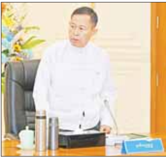
နိုင်ငံတော်စီမံအုပ်ချုပ်ရေးကောင်စီ ဒုတိယဥက္ကဋ္ဌ ဒုတိယဝန်ကြီးချုပ် ဒုတိယ ဗိုလ်ချုပ်မှူးကြီး စိုးဝင်း ဆွေးနွေးတင်ပြစဉ်။

ကမ္ဘာစားနပ်ရိက္ခာလုံခြုံရေးအဖွဲ့ချုပ်အဖွဲ့ဝင်များ (Food Security)ကမ္ဘာတွင် ထိုက်ထိုက်တန်တန်နေရာရရှိ မည့် စိုက်ပျိုးထုတ်လုပ်ရေးစွမ်းအားရှိသည့်နိုင်ငံ (Agriculture Power Country) အဖြစ် ရပ်တည်နိုင် (နိုင်ငံ)အဖြစ် တောင်းဆိုထားပြီး အလားတူ စီးပွားရေး (MSME) လုပ်ငန်းများကို ဆောင်ရွက်နေကြကြောင်း၊ ထိုသို့ဆောင်ရွက်ရာတွင် မိမိတို့နိုင်ငံသည် စိုက်ပျိုးရေးနှင့် မွေးမြူရေးလုပ်ငန်း ကို အခြေခံသည့် ကုန်ထုတ်လုပ်မှုများကို ဆောင်ရွက် နေခြင်းဖြစ်သဖြင့် စိုက်ပျိုးရေးမြှင့်တင်ရေးထွက်ကုန်များ ကို အခြေခံသည့် စက်မှုကုန်ထုတ်လုပ်ငန်းများ (Agro Based Industry)ကို တန်ဖိုးမြှင့် ကုန်ပစ္စည်းအထိ ထုတ်လုပ်ဆောင်ရွက်နိုင်ရန်လိုကြောင်း၊ ရှိပြီးဖြစ် သည့် ရေနံမြေခံကောင်းများနှင့် လူသားအရင်းအမြစ် များကို အသုံးချ၍ စိုက်ပျိုးရေးမြှင့်တင်ရေးလုပ်ငန်းများ တိုးတက်အောင် ဆောင်ရွက်နိုင်မည်ဆိုပါက ကုန်ထုတ်လုပ်မှုများ တိုးတက်ပြောင်းလဲလာမည်ဖြစ် ကြောင်း၊ အလားတူ မွေးမြူရေးလုပ်ငန်းများကို လည်း တိုးတက်အောင် ဆောင်ရွက်ရန်လိုကြောင်း၊ Quick Win ဖြစ်သည့် စိုက်ပျိုးရေးမြှင့်တင်ရေးလုပ်ငန်းများ တိုးတက်လာခြင်းဖြင့် ကုန်ထုတ်လုပ်မှုများ တိုးတက် လာမည်ဖြစ်ကြောင်း။