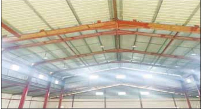
မြေပုံမြို့နယ် အားကစားခန်းမ ခေါင်မိုးပြုပြင်ခြင်း ရာနန်းပြည့် ဆောင်ရွက်ပြီးစီးမှုကို တွေ့ရစဉ်။