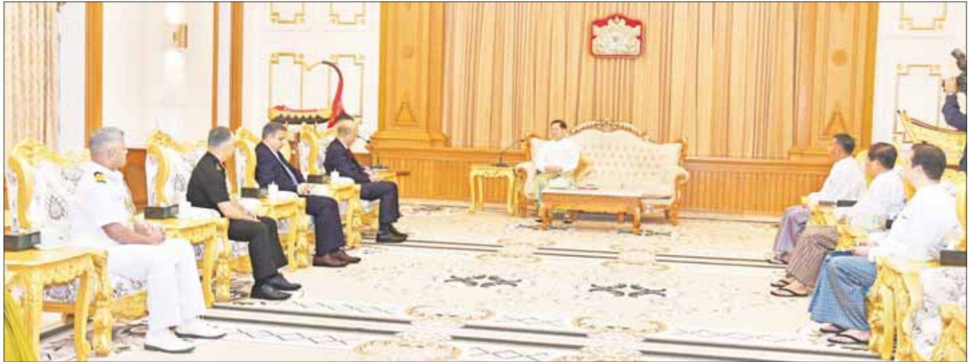
နိုင်ငံတော်စီမံအုပ်ချုပ်ရေးကောင်စီဥက္ကဋ္ဌ နိုင်ငံတော်ဝန်ကြီးချုပ် ဗိုလ်ချုပ်မှူးကြီး မင်းအောင်လှိုင် မြန်မာနိုင်ငံဆိုင်ရာ အိန္ဒိယနိုင်ငံသံအမတ်ကြီး H.E. Mr. Vinay Kumar အား လက်ခံတွေ့ဆုံစဉ်။