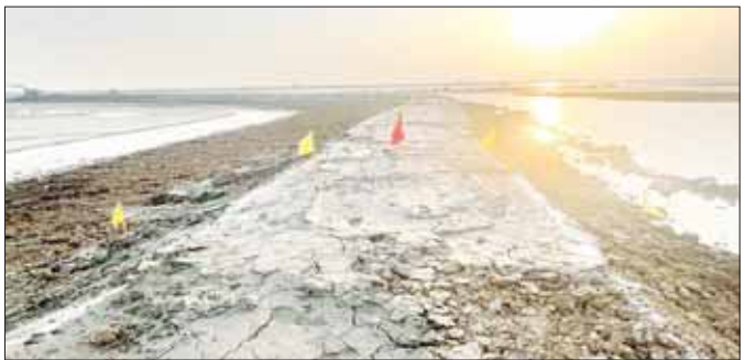
မြေပုံမြို့နယ် ငမန်းရဲကျွန်းရေငန်တားတာ အပိုင်း(၂) ပြန်လည်ပြုပြင်ရေးလုပ်ငန်း ဆောင်ရွက်ပြီးစီးမှု အခြေအနေကို တွေ့ရစဉ်။ (၂-၆-၂၀၂၃ ရက်)