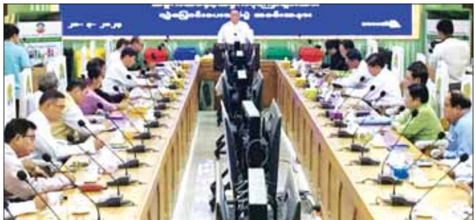
အဆိုပါ အခမ်းအနားတွင် ပြည်နယ်ဝန်ကြီး ချုပ်၊ ပြည်နယ်တရားလွှတ်တော်တရားသူကြီးချုပ်၊ ပြည်နယ်ဝန်ကြီးများက ပလတ်စတစ်အမှိုက်များ စနစ်တကျစွန့်ပစ်နိုင်ရေးအတွက် ခရီးစဉ်စီမံခန့်ခွဲမှု ကော်မတီ ခုနစ်ခုကို အမှိုက်အိတ်နှင့် အမှိုက်ပုံးများ ပေးအပ်ခဲ့ကြောင်း သိရသည်။ ခရိုင်(ပြန်/ဆက်)

ရေးဦးစွာ ကရင်ပြည်နယ်ဝန်ကြီးချုပ် ဦးစောမြင့်ဦးက ကရင်ပြည်နယ်တွင် ခရီးသွား ဧည့်သည်များ စိတ်ချမ်းသာစွာ လည်ပတ်နိုင်ရေးအတွက် ခရီးစဉ်ဒေသများမှ စွန့်ပစ်ပစ္စည်းများအား