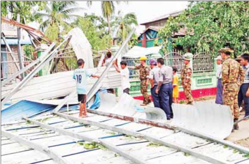
ထိခိုက်ပျက်စီးမှုများကို ပူးပေါင်းအင်အားဖြင့် ရှင်းလင်းဖယ်ရှား

အပျက်စွမ်းအားကြီးမားတဲ့ မိုခါမုန်တိုင်း ရခိုင်ပြည်နယ်အတွင်း ဝင်ရောက်တိုက်ခတ်ခဲ့တာ လာမယ့် မေလ ၁၄ နေ့ရက်ဆိုရင် တစ်နှစ်တင်းတင်းပြည့်ပြီ။ မိုခါကို အန်တုဖို့ မြန်မာနိုင်ငံသူ၊ နိုင်ငံသားတွေ ဟာ သွေးချင်းညီအစ်ကိုတွေဖြစ်တဲ့ ရခိုင်ပြည်နယ်သူ ပြည်နယ်သားတွေ အပေါ် ကျရောက်လာမယ့် သဘာဝဘေးဆိုးကြီးကို စည်းလုံးညီညွတ်မှု စွမ်းပကားနဲ့ ဝိုင်းဝန်းကာကွယ်ကူညီခဲ့ကြတယ်။ မုန်တိုင်းကျရောက်စဉ် ငွေအား၊ လူအား၊ ပစ္စည်းအားပါမကျန် အစွမ်းကုန် ထောက်ပံ့ပေးခဲ့ကြတယ်။ ပြန်လည်ထူထောင်ရေးလုပ်ငန်းတွေ အမြန်ဆုံး ပြီးမြောက်အောင် ဝိုင်းဝန်းကြိုးပမ်း ဆောင်ရွက်ချက်တွေဟာ ကျွန်တော်တို့အားလုံး “အရေးကြီးရင် သွေးနီ၊ အရေးကြုံရင်သွေးဆုံ” တယ်ဆိုတဲ့ စကားကို သက်သေပြုလိုက်ခြင်းပဲဖြစ်ပါတယ်။