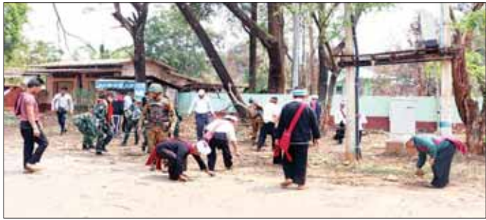
တပ်မတော်သားများ၊ မြန်မာနိုင်ငံရဲတပ်ဖွဲ့ဝင်များ၊ ဌာနဆိုင်ရာဝန်ထမ်းများ၊ ပြည်သူ့စစ်(ဌာန)တပ်ဖွဲ့ဝင် များနှင့် ဒေသခံတိုင်းရင်းသားပြည်သူများ ဆီဆိုင်မြို့အတွင်း စုပေါင်းသင်တန်းရေးဆောင်ရွက်စဉ်။

သူချေမှုန်းရေးနှင့် နယ်မြေစိုးမိုး ရေးလုပ်ငန်းများ ဆောင်ရွက်ခဲ့ရ သည်။ လုံခြုံရေးတပ်ဖွဲ့ဝင်များ အနေဖြင့် အဆိုပါအကြမ်းဖက် အဖွဲ့များနှင့် ထိတွေ့တိုက်ပွဲ ၁၆ ကြိမ်ဖြစ်ပွားခဲ့ပြီးနောက် ဖေဖော် ဝါရီလ ၂၉ ရက်တွင် ပြည်ထောင်စု လမ်းမကြီး တစ်လျှောက်အား အပြည့်အဝ ပြန်လည်ထိန်းချုပ် နိုင်ခဲ့ပြီး မတ်လ ၁ ရက်နေ့တွင် ယာယီရပ်တန့်ခဲ့သည့် ခရီးသွား ယာဉ်များနှင့် ကုန်တင်ယာဉ်များ ပုံမှန်အတိုင်း သွားလာနိုင်ခဲ့သည်။ အဆိုပါဖြစ်စဉ်များတွင်လည်း အပိုင်းတိုင်းရင်းသားကျေးရွာတိုင်း ပုဂ္ဂိုလ်တိုင်းရင်းသားကျေးရွာတိုင်း မှ ကျေးရွာလူထု အားလုံးနီးပါးက လုံခြုံရေးတပ်ဖွဲ့ဝင်များ၊ ပြည်သူ့ စစ်(ဌာန) တပ်ဖွဲ့ဝင်များနှင့်