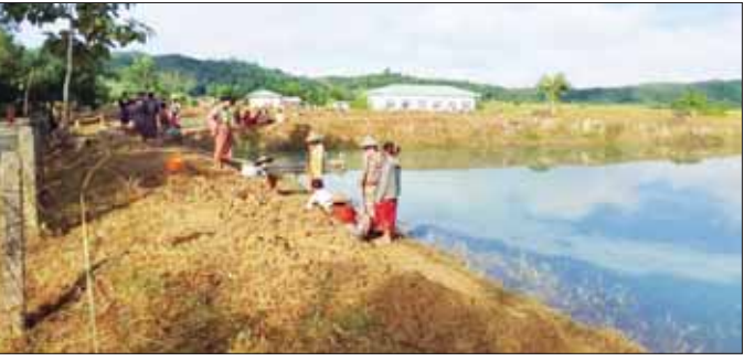
လက်ဝါးခတ်ကျေးရွာ မြေသားရေကန်တာပေါင်မြင့်တင်

မင်းပြားမြို့နယ် လက်ဝါးခတ်ကျေးရွာ မြေသားရေကန်တာပေါင်မြင့်တင်ခြင်းလုပ်ငန်း မဆောင်ရွက်မီ တွေ့ရစဉ်။