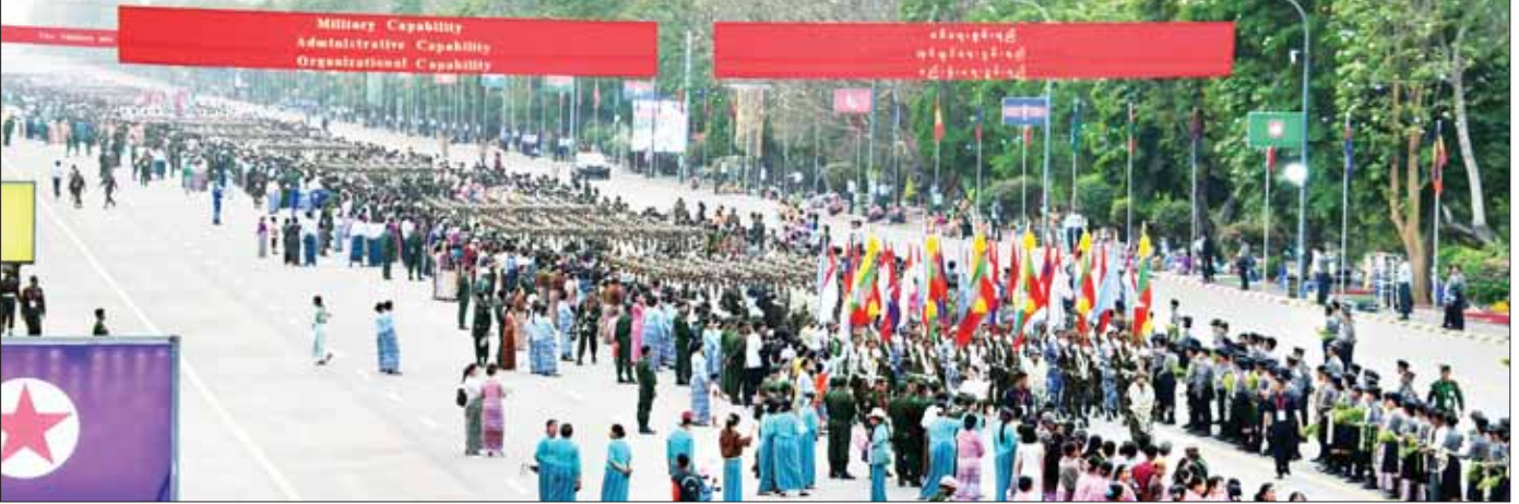
စစ်ရေးပြစစ်ကြောင်းကြီးများ ချီတက်ရာလမ်းတစ်လျှောက်၌ မိဘပြည်သူများ သောင်းသောင်းဖြူဖြူဆိုကြစဉ်။

စာမျက်နှာ ၇ မှ Echelon Formation ပုံစံဖြင့်လည်းကောင်း၊ Eurocopter နှစ်စင်းက Echelon Formation ပုံစံဖြင့်လည်းကောင်း၊ BEECH 1900D အမျိုးအစား သယ်ယူပို့ဆောင်ရေးလေယာဉ် တစ်စင်းက ရှုရပ်၏ အရှေ့ဘက် ၄၅ ဒီဂရီ မြင်ကွင်းမှ ၂၉၅ ဒီဂရီ လမ်းကြောင်းအတိုင်း ပျံသန်း၍လည်းကောင်း၊ BEECH 1900D အမျိုးအစား သယ်ယူပို့ဆောင်ရေး လေယာဉ်တစ်စင်းက ရှုရပ်၏ အရှေ့ဘက် ၄၅ ဒီဂရီ မြင်ကွင်းမှ ၂၅ ဒီဂရီလမ်းကြောင်းအတိုင်း ပျံသန်း၍ လည်းကောင်း။ မီးကျည်များထုတ်လွှတ် Su-30 SME စတုတ္ထမျိုးဆက်လွန်ဘက်စုံသုံး အကြီးစားတိုက်လေယာဉ် နှစ်စင်းက Echelon Formation ပုံစံဖြင့် နှစ်ကြိမ်ပျံသန်း၍လည်းကောင်း၊ MIG-29 ဘက်စုံသုံး တိုက်လေယာဉ်တစ်စင်းက ရှုရပ် ရှေ့တည့်တည့်မှ မီးကျည်များထုတ်လွှတ်၍ လည်းကောင်း အသီးသီးသရုပ်ပြပျံသန်းကြပြီး နိုင်ငံတော် စီမံအုပ်ချုပ်ရေးကောင်စီဥက္ကဋ္ဌ တပ်မတော်ကာကွယ် ရေးဦးစီးချုပ်အား အလေးပြုကြသည်။