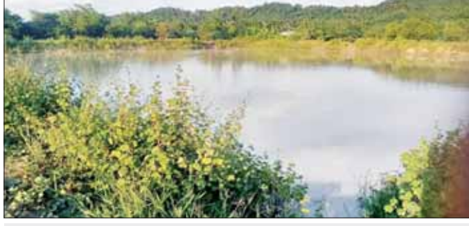
ချော်ချောင်းကျေးရွာ သောက်သုံးရေကန်

မင်းပြားမြို့နယ် လက်ဝါးခတ်ကျေးရွာ မြေသားရေကန်တာပေါင်မြင့်တင်ခြင်းလုပ်ငန်း ဆောင်ရွက်မှုကို တွေ့ရစဉ်။