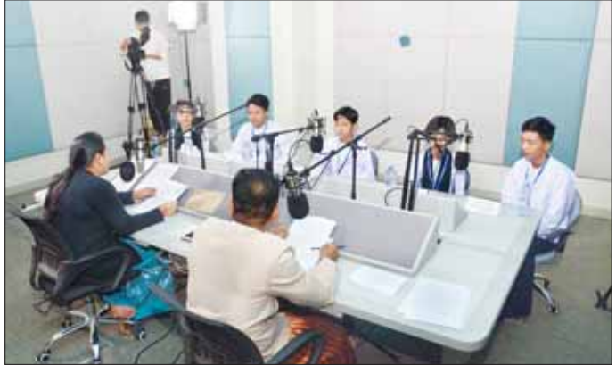
လာနိုင်စေရေး အသိပညာပေးလေ့လာဆောင်ရွက်ခြင်းဖြင့် လူထုလှုပ်ရှားမှု ရယူအားဖြည့်ပေးနိုင်ရေး ရည်ရွယ် ချက်များဖြင့် လူဝင်မှုကြီးကြပ်ရေးနှင့် ပြည်သူ့ အင်အားဝန်ကြီးဌာန ပြည်သူ့အင်အားဦးစီးဌာနက ပြန်ကြားရေးဝန်ကြီးဌာန၊ မြန်မာ့အသံနှင့် ရုပ်မြင် သံကြားနှင့် ပညာရေးဝန်ကြီးဌာန၊ အခြေခံပညာဦးစီး ဌာနတို့နှင့် ပူးပေါင်း၍ ပြိုင်ပွဲ ငါးကြိမ်ကျင်းပမည်ဖြစ်