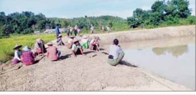
ချော်ချောင်းကျေးရွာ သောက်သုံးရေကန်တာပေါင်မြင့်တင်

မင်းပြားမြို့နယ် ချော်ချောင်းကျေးရွာ သောက်သုံးရေကန်တာပေါင်မြင့်တင်ခြင်း မဆောင်ရွက်မီ တွေ့ရစဉ်။