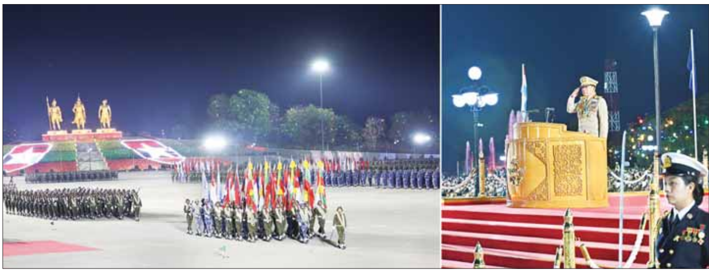
နိုင်ငံတော်စီမံအုပ်ချုပ်ရေးကောင်စီဥက္ကဋ္ဌ တပ်မတော်ကာကွယ်ရေးဦးစီးချုပ် ဗိုလ်ချုပ်မှူးကြီး သတိုးမဟာသရေစည်သူ သတိုးသီရိသုဓမ္မ မင်းအောင်လှိုင်အား စစ်ရေးပြစစ်ကြောင်းကြီးများက ချီတက်အလေးပြုကြစဉ်။