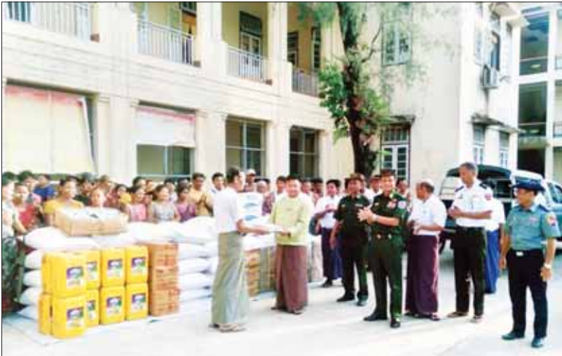
ထောက်ပံ့ပစ္စည်းများ ပေးအပ် မင်းပြားမြို့၌ အလွန်အလွန်အားကောင်းသော မိုခါဆိုင်ကလုန်းမုန်တိုင်းကြောင့် မုန်တိုင်းရောင်ဒေသခံပြည်သူများအား တာဝန်ရှိသူများက ထောက်ပံ့ပစ္စည်းများ ပေးအပ်စဉ်။

အလွန်အလွန် အားကောင်းသော ဆိုင်ကလုန်းမုန်တိုင်း (Extremely Severe Cyclonic Storm) “မိုခါ” က ဘင်္ဂလားပင်လယ်အော် အရှေ့တောင်ပိုင်း၊ ယင်းနှင့်ဆက်စပ်နေသည့် ကပ္ပလီပင်လယ်ပိုင်းတိုင်းဒေသကြီး မကြီးမားကြီးမား ပြင်းထန်လှသော အင်အားဖြင့် မြန်မာနိုင်ငံကို ခြိမ်းခြောက်နေချိန်၊ ၂၀၂၃ ခုနှစ် မေလ ၁၄ ရက် နံနက်ပိုင်းတွင် နိုင်ငံတော် စီမံအုပ်ချုပ်ရေးကောင်စီဥက္ကဋ္ဌ နိုင်ငံတော်ဝန်ကြီးချုပ် ဗိုလ်ချုပ်မှူးကြီး မင်းအောင်လှိုင် ဦးဆောင်၍ သဘာဝဘေးအန္တရာယ်ဆိုင်ရာ စီမံခန့်ခွဲရေး အရေးပေါ်အစည်းအဝေးကို နေပြည်တော်ရှိ ကာကွယ်ရေးဦးစီးချုပ်ရုံး စုဝေးခန်းမ၌ ကျင်းပခဲ့သည်။ မုန်တိုင်းမကျရောက်မီနှင့် ကျရောက်ပြီးချိန်များတွင် လိုအပ်သည့် အရေးပေါ်စီမံခန့်ခွဲခြင်း၊ တုံ့ပြန်ခြင်း၊ ကယ်ဆယ်ရေးနှင့် ပူးပေါင်းဆောင်ရွက်ခြင်း၊ အသင့်ပြင်ဆင်မှုပစ္စည်းများ ရရှိခြင်းနှင့် ပြန်လည်ထူထောင်ရေးဆိုင်ရာ ကိုယ်စီလုပ်ငန်းတာဝန်များ ပြုလုပ်ခြင်း တို့ကို ဆောင်ရွက်ပေးနိုင်ရေးအတွက် ကျင်းပပြုလုပ်သည့် အဆိုပါအရေးပေါ်အစည်းအဝေးတွင် နိုင်ငံတော်အကြီးအကဲ ဤဆောင်းပါးအစတွင် ဖော်ပြခဲ့သည့်အတိုင်း အမာကြားပြုခဲ့သည့် အပြင် “ထိခိုက်မှုအနည်းဆုံးဖြင့် မုန်တိုင်းအန္တရာယ်ကို အောင်မြင်စွာ ကျော်လွှားနိုင်ရေး မိမိကိုယ်တိုင် မျက်နှာပြင်မပြတ်စောင့်ကြည့်ပြီး အချိန်နှင့်တစ်ပြေးညီ လိုအပ်ချက်များကို ဖြည့်ဆည်းပေးနိုင်ရေး ဆောင်ရွက်လျက်ရှိကြောင်း” ကိုလည်း ပြောကြားခဲ့သည်။