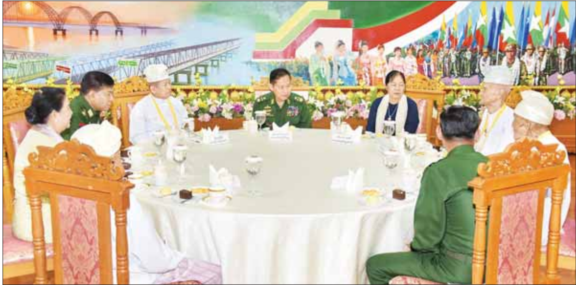
အတူတကွသုံးဆောင် နိုင်ငံတော် စီမံအုပ်ချုပ်ရေး ကောင်စီဒုတိယဥက္ကဋ္ဌ ဒုတိယ တပ်မတော် ကာကွယ်ရေးဦးစီး ချုပ် ကာကွယ်ရေးဦးစီးချုပ် (ကြည်း) ဒုတိယ ဗိုလ်ချုပ် မျိုးကြီး စိုးဝင်းနှင့် ဇနီး ဒေါ်သန်းသန်းနွယ်တို့ လွတ်လပ် ရေး မော်ကွန်းဝင်ပုဂ္ဂိုလ်များ နှင့်အတူ လက်ဖက်ရည်နှင့် စားသောက်ဖွယ်ရာ များကို အတူတကွ သုံးဆောင်ကြစဉ်။

ထို့နောက် နိုင်ငံတော်စီမံအုပ်ချုပ်ရေး ကောင်စီဥက္ကဋ္ဌ တပ်မတော်ကာကွယ်ရေး ဦးစီးချုပ်နှင့် တပ်မတော်အရာရှိကြီးများ သည် အငြိမ်းစားတပ်မတော်အရာရှိကြီး များ၊ ဇနီးများနှင့်အတူ အမှတ်တရ စုပေါင်းဓာတ်ပုံရိုက်ကြသည်။ ယင်းနောက် နိုင်ငံတော်စီမံအုပ်ချုပ် ရေးကောင်စီဥက္ကဋ္ဌ တပ်မတော်ကာကွယ် ရေးဦးစီးချုပ်နှင့် ဇနီးတို့သည် အခမ်း အနားတက်ရောက်လာကြသည့် အငြိမ်း စား တပ်မတော်အရာရှိကြီးများနှင့် ဇနီး များအား ရင်းရင်းနှီးနှီး နှုတ်ဆက်ခဲ့ ကြောင်း သတင်းရရှိသည်။ သတင်းစဉ်