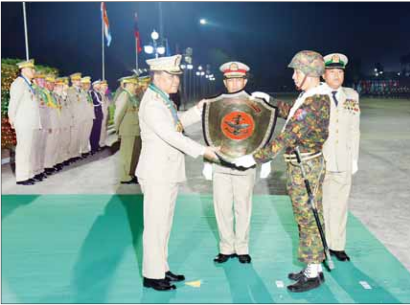
ညှိနှိုင်းကွပ်ကဲရေးမှူး (ကြည်း၊ ရေ၊ လေ) ဗိုလ်ချုပ်ကြီး မောင်မောင်အေး စံပြတပ်ခွဲ ပထမဆုရရှိသည့် အမြောက်တပ်ဖွဲ့ ညွှန်ကြားရေးမှူးမှူးကိုယ်စားပြု စစ်ရေးပြဂုဏ်ပြုတပ်ခွဲအား ခိုင်းဆုပေးအပ်ချီးမြှင့်စဉ်။

နေပြည်တော် မတ် ၂၇ (၇၉)နှစ်မြောက်တပ်မတော်နေ့ စစ်ရေးပြ အခမ်းအနားတွင် ဆုရရှိကြသော စစ်ရေးပြတပ်ခွဲများအား ဂုဏ်ပြုဆုချီးမြှင့်ပွဲကို ယနေ့ညပိုင်းတွင် နေပြည်တော်ရှိ စုရပ်သစ်တပ်စစ်ရေးပြကွင်း၌ ကျင်းပပြုလုပ်ရာ ညှိနှိုင်းကွပ်ကဲရေးမှူး (ကြည်း၊ ရေ၊ လေ) ဗိုလ်ချုပ်ကြီး မောင်မောင်အေး တက်ရောက်၍ ဆုများကို ပေးအပ်ချီးမြှင့်သည်။ ဦးစွာ ဆုချီးမြှင့်ပွဲသို့ တက်ရောက်လာသည့် ညှိနှိုင်းကွပ်ကဲရေးမှူး (ကြည်း၊ ရေ၊ လေ) ဗိုလ်ချုပ်ကြီး မောင်မောင်အေး အား စစ်ရေးပြမှူးကြီး ဗိုလ်ချုပ်သိန်းဇော်ဦးဆောင်သည့် စစ်ရေးပြစစ်ကြောင်းများက အလေးပြုကြသည်။