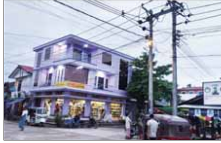
ဓာတ်အားပြန်လည်ဖြန့်ဖြူးပေး

မင်းပြားမြို့နယ် ရွှေတမာရွာအတွင်းရှိ ၁၁ ကေစီ ဓာတ်အားလိုင်းနှင့် ၄၀၀ ဗီလိုင်း ပြုပြင်ခြင်းလုပ်ငန်းများ ဆောင်ရွက်ပေးစဉ်။