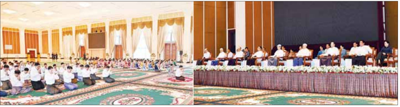
နိုင်ငံတော်စီမံအုပ်ချုပ်ရေးကောင်စီဥက္ကဋ္ဌ တပ်မတော်ကာကွယ်ရေးဦးစီးချုပ် ဗိုလ်ချုပ်မှူးကြီး မင်းအောင်လှိုင်နှင့်ဇနီး ဒေါ်ကြူကြူလှ၊ တပ်မတော်(ကြည်း၊ ရေ၊ လေ) မိသားစုများက (၇၉) နှစ်မြောက် တပ်မတော်နေ့၊ စစ်ရေးပြအခမ်းအနားသို့ တက်ရောက်ကြသည့် တပ်မတော်တွင် တာဝန်ထမ်းဆောင်ခဲ့သည့် အငြိမ်းစားတပ်မတော်အရာရှိကြီးများအား ဂါရဝပြုကန်တော့စဉ်။