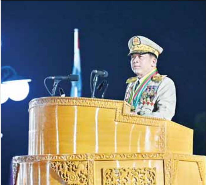
တပ်မတော် ကာကွယ်ရေးဦးစီးချုပ် ဗိုလ်ချုပ်မှူးကြီး သတိုးမဟာသရေစည်သူ သတိုးသီရိသုဓမ္မ မင်းအောင်လှိုင် (၇၉)နှစ်မြောက် တပ်မတော်နေ့ စစ်ရေးပြအခမ်းအနားတွင် မိန့်ခွန်းပြောကြားစဉ်။

ဆုံးရှုံးသွားတဲ့ နိုင်ငံ့လွတ်လပ်ရေးပြန်ရဖို့ နယ်ချဲ့အင်္ဂလိပ်တွေကို တိုက်ယှဉ်ပစ်ခတ်ဖို့ ယုံကြည်တဲ့အတွက် ဗိုလ်ချုပ်အောင်ဆန်း ဦးဆောင်တဲ့ ရဲဘော်သုံးကျိပ်ဟာ ဂျပန်မှာ ခေတ်မီစစ်ပညာများ သင်ကြားခဲ့တယ်။ ဂျပန်တို့နဲ့လက်တွဲပြီး နယ်ချဲ့အင်္ဂလိပ်တွေကို တိုက်ထုတ်ခဲ့သလို ဆိုးရွားလှတဲ့ ဂျပန်တို့ရဲ့ အုပ်ချုပ် ဆက်ဆံရေးတွေကြောင့် ပြည်သူတို့နဲ့အတူလက်တွဲပြီး ဖက်ဆစ်ဂျပန်ကို ၁၉၄၅ ခုနှစ်၊ မတ်လ ၂၇ ရက်နေ့ကစပြီး ပြန်လည်တိုက်ထုတ်ခဲ့ရတယ်။ တို့တပ်မတော်ဟာ ပြည်သူ့အတူလက်တွဲပြီး နိုင်ငံကို လွတ်လပ်ရေး ရရှိအောင် ဆောင်ရွက်ပေးခဲ့သလို လွတ်လပ်ရေးနဲ့ အချုပ်အခြာ အာဏာပြန်လည်မဆုံးရှုံးစေဖို့အတွက် ပြည်သူ့ရွေးကနဲ မားမား မတ်မတ် ရပ်တည်ကာကွယ်ပေးခဲ့တယ်။ တို့နိုင်ငံကို နယ်ချဲ့ဗြိတိသျှတို့ရဲ့ သွေးခွဲသပ်လျှို့အုပ်ချုပ်ခဲ့မှု၊ ဒုတိယကမ္ဘာစစ်အတွင်း စစ်တလင်း ဖြစ်ခဲ့ရတဲ့အတွက် စစ်ကျွန်လက်နက်တွေ များပြားမှု၊ နိုင်ငံရေး အယူအဆကြီးမှုတို့ကြောင့် ဗမာပြည်ကွန်မြူနစ်ပါတီ(ဗကပ)အနေနဲ့ ၁၉၄၈ ခုနှစ်၊ မတ်လမှာ တောဒိုခဲရဲကစပြီး “ရောင်စုံသောင်းကျန်းသူများ” လို့ ခေါ်ဆိုရတဲ့အထိ နိုင်ငံအနှံ့မှာ လက်နက်ကိုင်သောင်းကျန်းသူ အဖွဲ့အစည်းအများအပြား ပေါ်ပေါက်လာခဲ့တယ်။ ဒါပေမယ့်လည်း