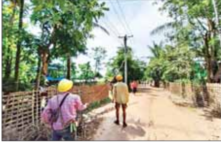
ဓာတ်အားလိုင်းပြုပြင်

မိုခါမုန်တိုင်းကြောင့် အားအင်အသစ်ဖြင့် ပြန်လည်နိုးထလာနိုင်ရန် နိုင်ငံတော်နှင့် ပြည်သူတို့၏ တွဲလက်များဖြင့် ကြိုးပမ်းဆောင်ရွက်ခဲ့သည့် ကျန်းမာရေးစောင့်ရှောက်ရေး ချောချောမြစ်ကမ်းမှ မြို့ကလေး၊ ပညာလိုလားသည့် ကလေးငယ်များ ရာနှုန်းပြည့် ပညာသင်ယူခဲ့ကြရာ ဒေသ၊ မြေစီဩဇာ ထက်သန်မှုကြောင့် စပါးဆန်ရေ ကြွယ်ဝသည့် မင်းပြားမြေ အမြန်ဆုံး ငြိမ်းချမ်းလှပစေကြောင်း။ ။