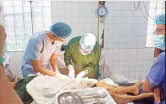
ကျန်းမာရေးစောင့်ရှောက်မှုပေး

၂၀၂၃ ခုနှစ် မေလ ၂၃ ရက်တွင် ရန်ကုန်ဆေးတက္ကသိုလ် (၂) အထူးကုဆရာဝန်ကြီးများ ပါဝင်သော နယ်လှည့်အထူးကုဆေးအဖွဲ့က မင်းပြားမြို့တွင် အခြေပြုကာ ဆေးကုသမှုများ ဆောင်ရွက်ပေးခဲ့ရာ ခွဲစိတ်လူနာ ၁၈ ဦး၊ အထွေထွေရောဂါလူနာ ၂၇ ဦး၊ အရိုးရောဂါလူနာ ၂၂ ဦး၊ ကလေးလူနာ ၄၆ ဦး၊ စုစုပေါင်း ၇၂ ဦးတို့ကို လိုအပ်သော ဆေးဝါးကုသမှုများ ပြုလုပ်ပေးနိုင်ခဲ့သည်။ မေလ ၂၄ ရက်တွင် ဦးဥက္ကဋ္ဌမန်ခြံနှင့် အထက ၂ တို့ကို မြို့နယ်ရှိ ကူညီကယ်ဆယ်ရေးအဖွဲ့များက စုပေါင်းသန့်ရှင်းရေးဆောင်ရွက်ကြပြီး ဇေယျသုခပရိယတ္တိစာသင်တိုက်အတွင်း နယ်လှည့်ဆေးကုသရေးအဖွဲ့က ဆေးကုသမှုများ ပြုလုပ်ပေးကြသည်။ ကျေးရွာအချို့တွင် မြေသားရေစုကန်များမှ ကန်ရေကို သုံးစွဲနေကြရခြင်းကြောင့် သန့်ရှင်းသော သောက်သုံးရေရရှိရန် သမဝါယမနှင့် ကျေးလက်ဖွံ့ဖြိုးရေး ဝန်ကြီးဌာနက ဆိုလာစနစ်သုံး ရွေ့လျားရေသန့်စက်များဖြင့် သန့်စင်ဖြန့်ဝေပေးခဲ့ပြီး Life Straw ခေါ် ရေနေောက်မှ ရေကြည်ရအောင် သန့်စင်ပေးသော စက်များကိုလည်း ဖြန့်ဝေပေးခဲ့သည်။ မင်းပြားမြို့ပေါ်ရှိ အမျိုးသမီးအိမ်တွင်းမူ သက်မွေးလုပ်ငန်းပညာသင်တန်းကျောင်း၊ နယ်စပ်ဒေသ တိုင်းရင်းသားလူငယ်များ ဖွံ့ဖြိုးရေးသင်တန်းကျောင်း၊ အမှတ် (၂) အခြေခံပညာအထက်တန်းကျောင်းတို့တွင် မြို့နယ်ရှိ ကူညီကယ်ဆယ်ရေးအဖွဲ့များက စုပေါင်းသန့်ရှင်းရေးနှင့် ပြန်လည်ထူထောင်ရေး