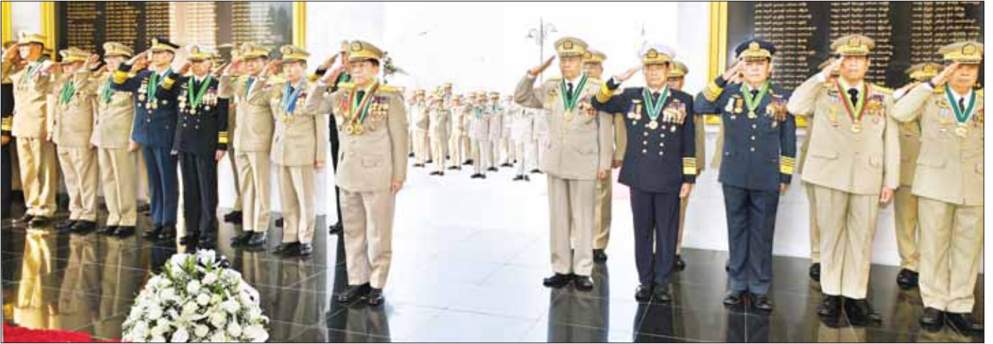
နိုင်ငံတော်စီမံအုပ်ချုပ်ရေးကောင်စီဥက္ကဋ္ဌ တပ်မတော်ကာကွယ်ရေးဦးစီးချုပ် ဗိုလ်ချုပ်မှူးကြီး သတိုးမဟာသရေစည်သူ သတိုးသီရိသုဓမ္မ မင်းအောင်လှိုင်နှင့် တပ်မတော်အရာရှိကြီးများ သူရဲကောင်းဗိမာန်(နေပြည်တော်)၌ သူရဲကောင်းစစ်သည်များအား အလေးပြုစဉ်။