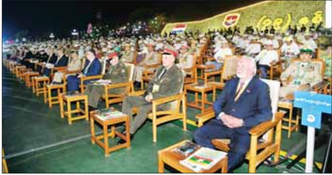
(၇၉)နှစ်မြောက် တပ်မတော်နေ့စစ်ရေးပြအခမ်းအနားသို့ တက်ရောက်လာကြသူများအား တွေ့ရစဉ်။