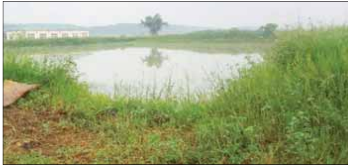
လက်ဝါးခတ်ကျေးရွာ မြေသားရေကန်

ဆောင်ရွက်ခြင်း၊ ပြည်နယ်အစိုးရအဖွဲ့က တပ်မတော်သားများ၊ ရဲတပ်ဖွဲ့ဝင်များနှင့် ပေးပို့သော ဆန်နှင့် စားသောက်ဖွယ်ရာ ဌာနဆိုင်ရာဝန်ထမ်းများက သယ်ယူခြင်းများ သယ်ဆောင်လာသည့် ကုလားတန်တို့ကို မေ ၂၅ ရက်တွင် ဆောင်ရွက်ကြပြီး ရေယာဉ်မှ ပစ္စည်းများကို နယ်မြေခံစာမျက်နှာ ၁၅ သို့