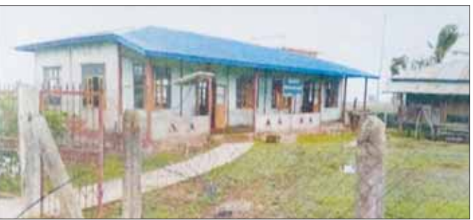
ပြုပြင်ဆောင်ရွက်ပြီး

မင်းပြားမြို့နယ် အမက- ထောင့်ချောင်းကြီး ပျက်စီးသည့် (၆၀x၃၀) ပေ၊ RCC တစ်ထပ်ကျောင်းဆောင်ကို တွေ့ရစဉ်။