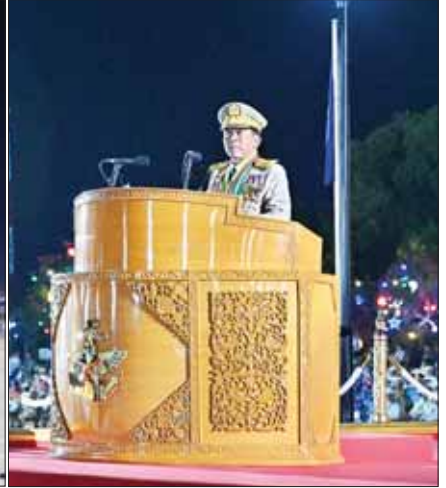
နိုင်ငံတော်စီမံအုပ်ချုပ်ရေးကောင်စီဥက္ကဋ္ဌ တပ်မတော်ကာကွယ်ရေးဦးစီးချုပ် ဗိုလ်ချုပ်မှူးကြီး သတိုးမဟာသရေစည်သူ သတိုးသီရိသုဓမ္မ မင်းအောင်လှိုင် (၇၉)နှစ်မြောက် တပ်မတော်နေ့ စစ်ရေးပြအခမ်းအနားတွင် မိန့်ခွန်းပြောကြားစဉ်။