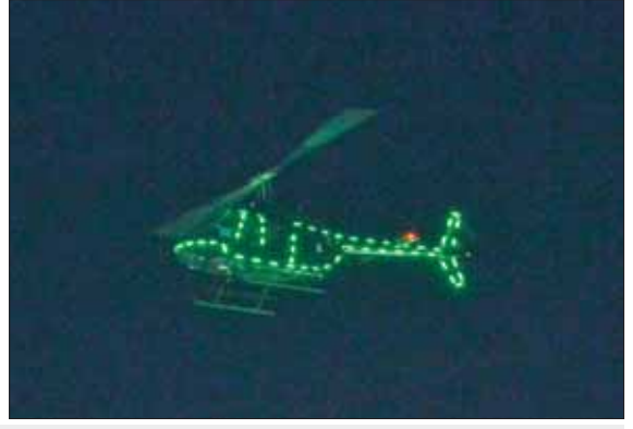
(၇၉)နှစ်မြောက် တပ်မတော်နေ့ကို ဂုဏ်ပြုသောအားဖြင့် လေယာဉ်များက မီးအလှများတပ်ဆင်၍ ပျံသန်းကြစဉ်။