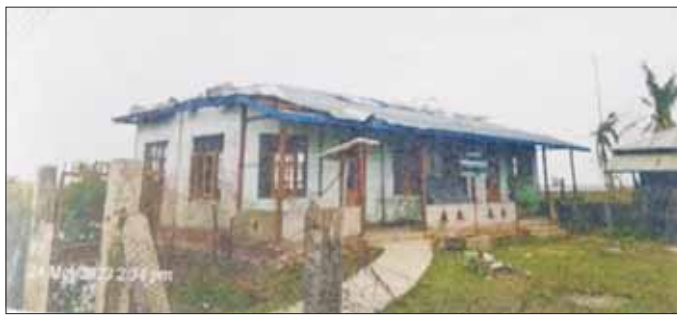
အမက- ထောင့်ချောင်းကြီး ကျောင်း ပျက်စီးမှု

မုန်တိုင်း၏ပမာဏနှင့် နှိုင်းယှဉ်ပါက ထိခိုက်ဆုံးရှုံးမှု များစွာနည်းပါးခဲ့သည်။ မုန်တိုင်းကြောင့် လူဦးရေ ၂ ဒသမ ၉ သန်းခန့် ဘေးသင့်ခဲ့ရာတွင် ၁၅၆ ဦး အသက်ဆုံးရှုံးခဲ့သည့်အနက် ရခိုင်ပြည်နယ်မှ ၁၄၈ ဦးဖြင့် အများဆုံးဖြစ်သည်။ မုန်တိုင်းကြောင့် ပျက်စီးဆုံးရှုံးမှုတွင်လည်း ရခိုင်ပြည်နယ်က ၉၇ ဒသမ ၇၃ ရာခိုင်နှုန်းဖြင့် ပမာဏအများဆုံးဖြစ်ပြီး တန်ဖိုးအားဖြင့် ကျပ် ၅၂၂ ဒသမ ၀၀၂ ဘီလီယံ ဖြစ်သည်။ မုန်တိုင်းအပြီး ပြန်လည်ထူထောင်ရေးလုပ်ငန်းများ ဆောင်ရွက်ရန်အတွက် စာမျက်နှာ ၁၃ သို့