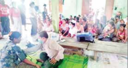
ဒေသခံပြည်သူများအား ကျန်းမာရေးစောင့်ရှောက်မှု ဆောင်ရွက်ပေးစဉ်။

ဒေသခံပြည်သူများအား ကျန်းမာရေးစောင့်ရှောက်မှုအနေဖြင့် ဆေးတက္ကသိုလ်(၂) ရန်ကုန်မှ အထူးကုဆေးအဖွဲ့ မင်းပြားမြို့ ပြည်သူ့ဆေးရုံ၌ ခွဲစိတ်ကုသမှု ဆောင်ရွက်ပေးစဉ်။