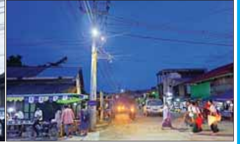
ဓာတ်အားပြန်လည်ဖြန့်ဖြူးပေး

မိုခါမုန်တိုင်း တိုက်ခတ်ပြီးနောက် လျှပ်စစ်ဓာတ်အားဖြန့်ဖြူးမှု ပြန်လည်ရရှိရန်အတွက် တာဝန်ရှိသူများ၏ ကြိုးပမ်းဆောင်ရွက်မှုကြောင့် မင်းပြားမြို့ပေါ်ရပ်ကွက်များ၌ လျှပ်စစ်ဓာတ်အားပြန်လည်ဖြန့်ဖြူးပေးထားမှုကို တွေ့ရစဉ်။ (၂၃-၆-၂၀၂၄ ရက်)