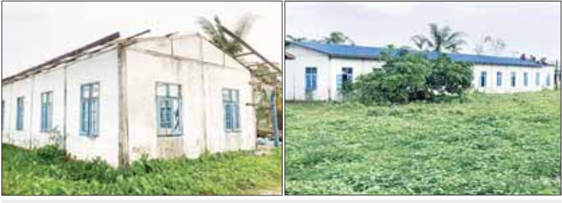
မင်းပြားမြို့နယ် အ.ထ.က (၂) ပျက်စီးမှုနှင့် ပြုပြင်ပြီးစီးမှု

မိုခါမုန်တိုင်းကြောင့် မင်းပြားမြို့နယ် အ.ထ.က (၂) ပျက်စီးမှုကို ပြုပြင်မှုမဆောင်ရွက်မီနှင့် ပြုပြင်ပြီးစီးမှုကို တွေ့ရစဉ်။