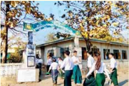
ကျိန္တလီမြို့ အထက ကျိန္တလီစာစစ်ဌာနသို့ တက္ကသိုလ်ဝင်စာမေးပွဲ ဒုတိယနေ့ အင်္ဂလိပ်စာဘာသာရပ် လာရောက်ဖြေဆိုကြသည့် ကျောင်းသား ကျောင်းသူများကို တွေ့ရစဉ်။ ကျိန္တလီ(ပြန်/ဆက်)