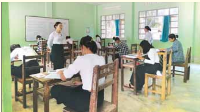
ရွှေသောင်ယံစာစစ်ဌာန၌ တက္ကသိုလ်ဝင်စာမေးပွဲ ဒုတိယနေ့ အင်္ဂလိပ်စာဘာသာရပ်ကို ကျောင်းသား ကျောင်းသူ ၃၂ ဦး လာရောက်ဖြေဆိုကြစဉ်။ ရွှေသောင်ယံ(ပြန်/ဆက်)