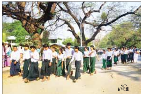
မင်းမြို့