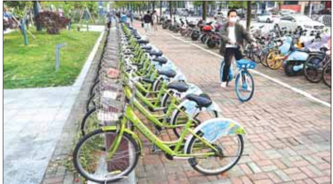
တရုတ်နိုင်ငံမြို့တော်များရှိ လမ်းဘေးပလက်ဖောင်းစရိယာတွင် အများပြည်သူ့အသုံးပြုနိုင် သည့် စက်ဘီးများကို တွေ့ရစဉ်။

ပျင်းသူ သက်လတ်ပိုင်းအမျိုးသမီး အသိမိတ်ဆွေ တစ်ဦးလည်း ရှိသေးသည်။ သူကား ရံဖန်ရံခါ သွေးတိုးသည်မှလွဲ၍ မောခြင်းပန်းခြင်းမရှိ။ လမ်းလျှောက်ပျင်းမိခြင်း သက်သက်သာဖြစ်သည်။ ဗိုလ်ချုပ်လမ်းထိပ်နှင့် ပုဇွန်တောင်ဈေးသို့ပင်လျှင် ဈေးသွားဈေးပြန်ဆိုက်ကားစီးလေ့ရှိသည်။