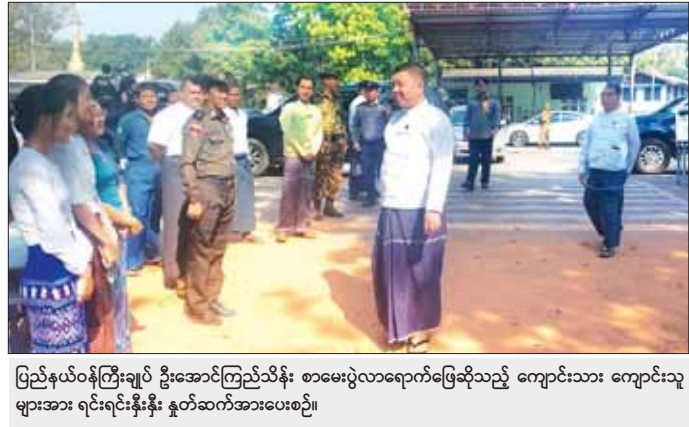
ပြည်နယ်ဝန်ကြီးချုပ် ဦးအောင်ကြည်သိန်း စာမေးပွဲလားရောက်ဖြေဆိုသည့် ကျောင်းသား ကျောင်းသူများအား ရင်းရင်းနှီးနှီး နှုတ်ဆက်အားပေးစဉ်။

ဝင်စာမေးပွဲတွင် ကျန်းမာရေးစောင့်ရှောက်မှုပေးထားမှုများ၊ မီးဘေးအန္တရာယ် ကြိုတင်ကာကွယ်ရေးဆောင်ရွက်ထားရှိမှုများနှင့် လုံခြုံရေးလုပ်ငန်းများ ဆောင်ရွက်ထားရှိမှုများကို ကြည့်ရှုစစ်ဆေးခဲ့ကြပြီး တက္ကသိုလ်ဝင်စာမေးပွဲ အောင်မြင်စွာ ကျင်းပပြီးစီးရေးတို့ကို တာဝန်ရှိသူများနှင့် ပေါင်းစပ်ဖြည့်ဆည်းဆောင်ရွက်ပေးသည်။ စစ်ကိုင်းတိုင်းဒေသကြီးအတွင်း ခရိုင် / မြို့နယ် စာစစ်ဌာနပေါင်း ၃၈ ခု၊ ဖြေဆိုသူ ကျောင်းသား ၂၂၀၈ ဦး၊ ကျောင်းသူ ၃၄၆၅ ဦး စုစုပေါင်း ၅၆၇၃ ဦး ဖြေဆိုသည့် ရာခိုင်နှုန်း ၉၂ ဒသမ ၈၆ ရာခိုင်နှုန်းဖြစ်ကြောင်း သိရသည်။ တိုင်းဒေသကြီး(ပြန်/ဆက်)