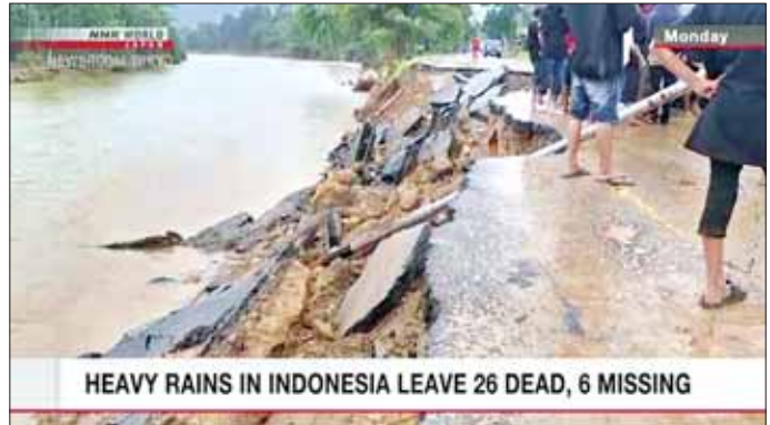
HEAVY RAINS IN INDONESIA LEAVE 26 DEAD, 6 MISSING