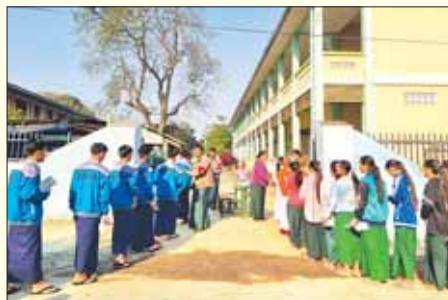
နောင်ချိုမြို့နယ် အမှတ်(၁) အခြေခံပညာအထက်တန်း ကျောင်းစာစစ် ဌာန၌ တက္ကသိုလ်ဝင်စာမေးပွဲ ဒုတိယနေ့တွင် ဖြေဆိုသူ ၄၉၄ ဦးရှိရာ အင်္ဂလိပ်စာဘာသာရပ် လာရောက်ဖြေဆိုကြသည့် ကျောင်းသား ကျောင်းသူများကို တွေ့ရစဉ်။