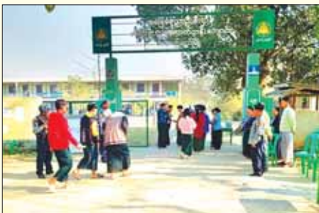
မောက်မယ်မြို့နယ်၌ တက္ကသိုလ်ဝင်စာမေးပွဲကို စာစစ်ဌာနနှစ်ခု ဖွင့်လှစ်ကျင်းပလျက်ရှိရာ ဒုတိယနေ့ အင်္ဂလိပ်စာဘာသာရပ်ကို လာရောက်ဖြေဆိုကြသည့် ကျောင်းသား ကျောင်းသူများကို တွေ့ရစဉ်။ စိုင်းမျိုးသန့်(မောက်မယ်)