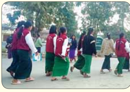
ကချင်ပြည်နယ် တနိုင်းမြို့၌ ဒုတိယနေ့ အင်္ဂလိပ်စာဘာသာရပ် လာရောက်ဖြေဆိုကြသည့် ကျောင်းသား ကျောင်းသူများကို တွေ့ရစဉ်။ မနောမြေ (တနိုင်း)