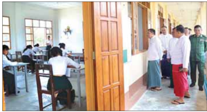
တိုင်းဒေသကြီးဝန်ကြီးချုပ် ဦးမြတ်ကို တက္ကသိုလ်ဝင်စာမေးပွဲ ဒုတိယနေ့တွင် ကျောင်းသား ကျောင်းသူများ အေးချမ်းစွာ ဖြေဆိုနေမှုကို ကြည့်ရှုအားပေးစဉ်။

ဖြေဆိုနိုင်ရေးအတွက် လိုအပ်သည်များ ဖြည့်ဆည်းဆောင်ရွက်ပေးကြရန်၊ စာမေးပွဲဖြေဆိုနေသည့် ကာလအတွင်း စာဖြေခန်း အတွင်း အပြင် သန့်ရှင်းရေး၊ လေဝင်လေထွက်ကောင်းမွန်ရေးနှင့် အလင်းရောင် လုံလောက်စွာ ရရှိရေးဆောင်ရွက်ပေးကြရန် လိုအပ်ကြောင်း၊ စာမေးပွဲကို စည်းမျဉ်းစည်းကမ်းများနှင့်အညီ အောင်မြင်စွာ ကျင်းပနိုင်ရေး ပိုင်းဝန်းကူညီ ဆောင်ရွက်ပေးရန်လိုအပ်ကြောင်း မှာကြားသည်။ တနင်္သာရီတိုင်းဒေသကြီးအတွင်း ၂၀၂၃-၂၀၂၄ ပညာသင်နှစ် တက္ကသိုလ်ဝင်စာမေးပွဲ သက်ဆိုင်ရာ စာစစ်ဌာန ၁၇ ခု၌ အင်္ဂလိပ်စာ ဘာသာရပ်ဖြေဆိုသည့် ကျောင်းသား ၉၂၂ ဦး၊ ကျောင်းသူ ၁၅၇၃ ဦး စုစုပေါင်း ၂၄၉၅ ဦး၊ ဖြေဆိုမှုရာခိုင်နှုန်းအားဖြင့် ၉၄ ဒသမ ၆၉ ဝင်ရောက်ဖြေဆိုကြောင်း သိရသည်။ တိုင်းဒေသကြီး(ပြန်/ဆက်)