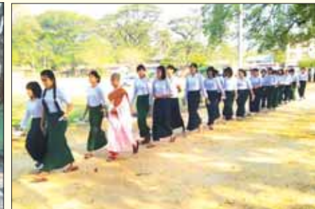
နေပြည်တော် ပုဗ္ဗသီရိမြို့နယ်ရှိ စာစစ်ဌာနငါးခုတွင် စာမေးပွဲ ဖြေဆိုသူ ၁၀၉၀ ရှိရာ ဒုတိယနေ့ အင်္ဂလိပ်စာဘာသာရပ်ကို လာရောက်ဖြေဆိုကြသည့် ကျောင်းသား ကျောင်းသူများကို တွေ့ရစဉ်။ သန်းသန်းနွယ်(ပုဗ္ဗ)