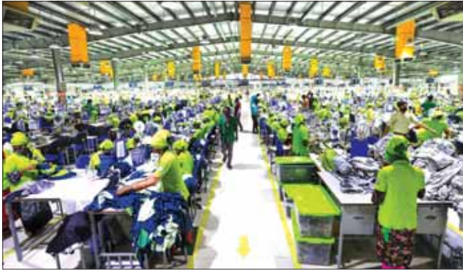
ဘင်္ဂလားဒေ့ရှ်နိုင်ငံ အထည်ချုပ်စက်ရုံတစ်ခုရှိ အလုပ်သမားများကို တွေ့ရစဉ်။

နိုင်ငံတကာကုန်သွယ်ရေးကို ထူထောင်ထောင်ဖြစ်အောင် လုပ်နိုင်ခြင်းကပင် မိမိတို့ နိုင်ငံသားများကို အလုပ်အကိုင် အခွင့်အလမ်းများစွာ ဖော်ဆောင်ပေးခြင်းဖြစ်သည်။ နိုင်ငံသားများ စဉ်ဆက်မပြတ် ဝင်ငွေတိုးနေအောင် ဖန်တီးပေးနိုင်ခြင်းက ကုန်သွယ်မှုမှရလာသော ရလဒ်ကောင်းတစ်ခုဟု ဆိုရမည်ဖြစ်သည်။ လူသားအရင်းအမြစ် မလွဲ၍ သယံဇာတအရင်းအမြစ်ပိုင်ဆိုင်မှုတွင် ချို့တဲ့လှသည့်ဘင်္ဂလားဒေ့ရှ် ကမ္ဘာ့ငမိမှာ အဋ္ဌမမြောက် လူဦးရေအများဆုံး သန်းပေါင်း ၁၇၀ ခန့်ဖြင့် လူဦးရေသိပ်သည်းဆများသည့် နိုင်ငံငယ်လေးတစ်ခုက စီးပွားရေးစနစ်ကြီးတစ်ခုလုံးနှင့် အကျိုးဝင်သည့် မက်ခရိုစီးပွားရေးကို ၂၀၁၀ ပြည့်နှစ်ကတည်းက တည်ငြိမ်အောင် ထိန်းသိမ်းလာနိုင်သည်မှာ နိုင်ငံတကာနှင့် ကုန်သွယ်ရေးကို အဓိကအားထားပြီး ပို့ကုန်ကဏ္ဍကို အကောင်းဆုံးမြှင့်တင်နိုင်ခဲ့သည့်အတွက်ကြောင့်ဟု ဆိုရမည်ဖြစ်သည်။ အစိုးရကချမှတ်သော ရေတိုရှေ့ညီစီးပွားရေးစီမံချက်များကို အောင်အောင်မြင်မြင် အကောင်အထည်ဖော်နိုင်ခဲ့ကြသည်ကို တွေ့ရသည်။