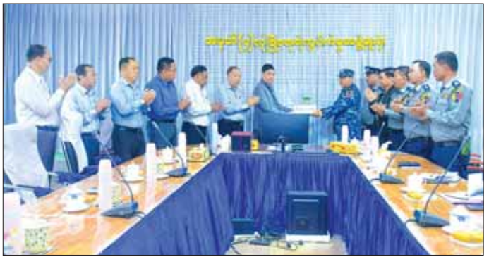
ရခိုင်ပြည်နယ်ဝန်ကြီးချုပ် ဦးထိန်လင်း နယ်ခြားစောင့်ရဲတပ်ဖွဲ့ဝင်များအတွက် ထောက်ပံ့ငွေ ပေးအပ်ပုံ။

ကာကွယ်စောင့်ရှောက်နေကြခြင်း ဖြစ်ကြောင်း၊ အဆိုပါအဖွဲ့များသည် မိမိတို့ပြည်နယ်အတွက် များစွာအထောက်အပံ့ဖြစ်ပြီး နယ်စပ်ကုန်သွယ်ရေး ကိစ္စရပ်များအပြင် နယ်စပ်တွင်ရှိသော ကိစ္စအဝဝကို စီမံဆောင်ရွက်ပေးနေသည့် တပ်ဖွဲ့ဖြစ်ခြင်းကြောင့် မိမိတို့ အစိုးရအဖွဲ့အနေဖြင့် အသိအမှတ်ပြုကြောင်း၊ သို့အတွက်ကြောင့် လိုအပ်သော အထောက်အပံ့များ ပေးအပ်ခြင်းဖြစ်ကြောင်း ပြောကြားသည်။ ဆက်လက်၍ ရခိုင်ပြည်နယ်အစိုးရအဖွဲ့က ထောက်ပံ့ငွေများကို ပြည်နယ်ဝန်ကြီးချုပ်နှင့် ပြည်နယ်အစိုးရအဖွဲ့ဝင်များက ပေးအပ်ရာ တပ်ဖွဲ့ဝင်တစ်ဦးက လက်ခံယူသည်။ ထို့နောက် မြန်မာနိုင်ငံရဲတပ်ဖွဲ့ဌာနချုပ် ဒုတိယရဲချုပ် ရဲဇော်လှိုင် အောင်အောင်က ကျေးဇူးတင်စကား ပြောကြားကြောင်း သိရသည်။ တင်ထွန်း(ပြန်/ဆက်)