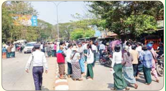
စစ်ကိုင်းတိုင်းဒေသကြီး ကသာမြို့၌ ဒုတိယနေ့ အင်္ဂလိပ်စာဘာသာရပ် လာရောက်ဖြေဆိုကြသည့် ကျောင်းသား ကျောင်းသူများကို တွေ့ရစဉ်။