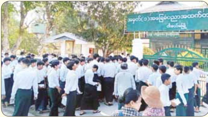
ရော့ဝတီတိုင်းဒေသကြီး ဝါးခယ်မြို့နယ်တွင် ဒုတိယနေ့ အင်္ဂလိပ်စာဘာသာရပ် လာရောက်ဖြေဆိုကြသည့် ကျောင်းသား ကျောင်းသူများကို တွေ့ရစဉ်။ ဟိန်းထက်လင်း (ပြန်/ဆက်)