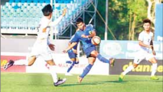
တက္ကသိုလ်အသင်းနှင့် GFA အသင်းတို့ ယှဉ်ပြိုင်ကစားစဉ်။

ရန်ကုန် မတ် ၁၂ ၂၀၂၄ MNL Cup ပြိုင်ပွဲ အုပ်စု (က)မှ ကြိုကန်ပွဲဖြစ်သည့် တက္ကသိုလ်အသင်းနှင့် GFA အသင်းပွဲကို မတ် ၁၂ ရက်က YUSC ကွင်း၌ ကျင်းပရာ GFA အသင်းက နှစ်ဂိုး-ဂိုးမရှိဖြင့် အနိုင်ရခဲ့သည်။ GFA အသင်းသည် ကြိုကန်ပွဲတွင် အနိုင်ရခဲ့သဖြင့် ရမှတ် မြောက်မှတ်ရရှိထားပြီး ရန်ကုန်နှင့် မဟာယူနိုက်တက်တို့ကို ဖိအားပေးနိုင်ခဲ့သည်။ တက္ကသိုလ်အသင်းမှာမူ ပထမအကျော့ လေးပွဲစလုံး ကစားထားပြီး တစ်ပွဲသာအနိုင်ရထားသဖြင့် နောက်တစ်ဆင့်တက်ရန် အခွင့်အရေးနည်းသွားပြီဖြစ်သည်။