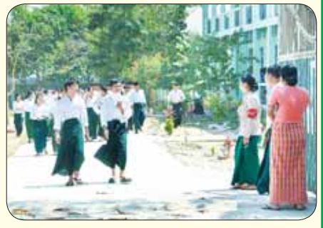
နေပြည်တော် ဇေယျာသီရိမြို့နယ်၌ ဒုတိယနေ့ အင်္ဂလိပ်စာဘာသာရပ် လာရောက်ဖြေဆိုကြသည့် ကျောင်းသား ကျောင်းသူများကို တွေ့ရစဉ်။