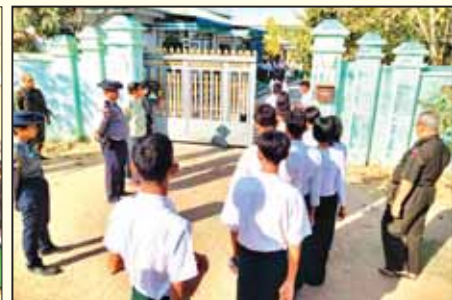
နတ်မောက်မြို့ အခြေခံပညာ အထက်တန်းကျောင်း(အောင်ဆန်း)၌ တက္ကသိုလ်ဝင်စာမေးပွဲ ဒုတိယနေ့ အင်္ဂလိပ်စာဘာသာရပ်ကို ကျောင်းသား ကျောင်းသူ ၁၄၇ ဦး လာရောက်ဖြေဆိုကြစဉ်။