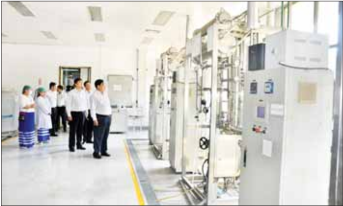
နည်းစဉ်၊ အရည်အသွေးအာမခံမှုနှင့် အရည်အသွေးထိန်းသိမ်းခြင်း စသည်တို့ကို အသေးစိတ်ချက်ချင်း အစီအမံများကို လက်တွေ့ကျကျ ရေးဆွဲဆောင်ရွက်ရန်၊ ထို့ပြင် စက်ပစ္စည်းများ စဉ်ဆက်မပြတ် လည်ပတ်ထုတ်လုပ်နိုင်ရေးအတွက် ကြိုတင်စစ်ဆေး၍ ပြုပြင်ထိန်းသိမ်းရေးလုပ်ငန်းများကို စဉ်ဆက်မပြတ် ဆောင်ရွက်ရန်၊ ဈေးကွက်လိုအပ်ချက်အတိုင်း ထုတ်လုပ်နိုင်ရေးအတွက် လူ၊ ကုန်ကြမ်း၊ စက်ပစ္စည်း၊

ထို့နောက် စက်ရုံမှူးက ၂၀၂၃-၂၀၂၄ ခု ဘဏ္ဍာရေးနှစ်တွင် ကျန်းမာရေးဝန်ကြီးဌာနမှ မှာယူထားသည့် ဆေးဝါးများထုတ်လုပ်ပေးခဲ့မှုနှင့် ထုတ်လုပ်ပေးရန် ကျန်ရှိနေမှုအခြေအနေကို ရှင်းလင်း