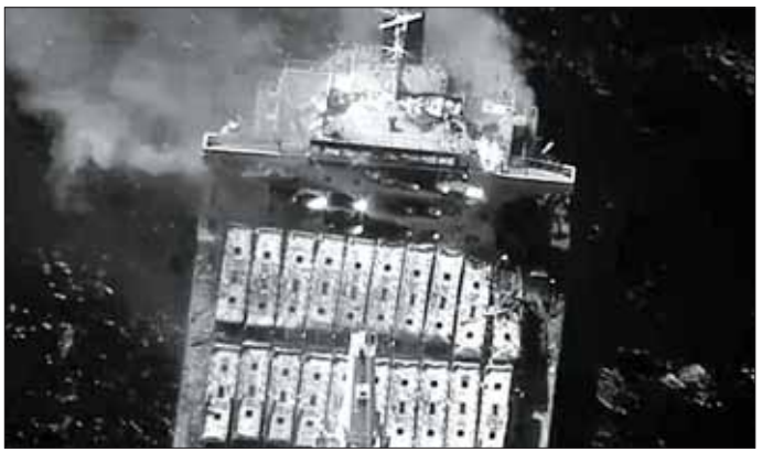
ပြီးခဲ့သည့် သီတင်းပတ်က ဟူသီသူပုန်အဖွဲ့၏ ပစ်ခတ်တိုက်ခိုက်မှုကြောင့် ကုန်တင်သင်္ဘော True Confidence ထိခိုက်ပျက်စီးမှု။