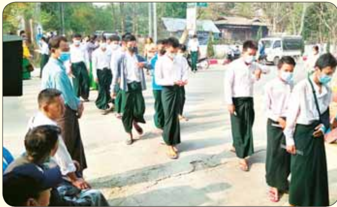
ရှမ်းပြည်နယ် ညောင်ရွှေမြို့၌ ဒုတိယနေ့ အင်္ဂလိပ်စာဘာသာရပ် လာရောက်ဖြေဆိုကြသည့် ကျောင်းသား ကျောင်းသူများကို တွေ့ရစဉ်။ စိုင်းအယ်ဘဲ