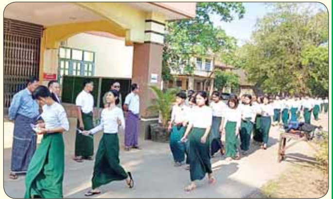
မွန်ပြည်နယ် ကျိုက်တော်မြို့၌ ဒုတိယနေ့ အင်္ဂလိပ်စာဘာသာရပ် လာရောက်ဖြေဆိုကြသည့် ကျောင်းသား ကျောင်းသူများကို တွေ့ရစဉ်။ မြို့နယ် (ပြန်/ဆက်)