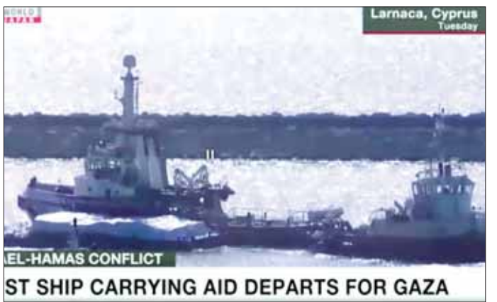
ST SHIP CARRYING AID DEPARTS FOR GAZA

ပူးပေါင်းပြီး အစားအသောက်နှင့် ထောက်ပံ့ရေးပစ္စည်းများ ဂါဇာသို့ သင်္ဘောဖြင့် ပို့ဆောင်ရန် အစီအစဉ်တစ်ခုကို ကြေညာခဲ့သည်။ သင်္ဘောသည် ဂါဇာသို့ ရောက်ရှိရန် နာရီပေါင်း ၆၀ ခန့် ကြာမြင့်မည်ဖြစ်ကြောင်း ဆိုက်ပရက်စ်နိုင်ငံခြားရေးဝန်ကြီးဌာန ပြောရေးဆိုခွင့်ရှိသူက ပြောကြားသည်။ အဆိုပါ သင်္ဘောပေါ်တွင် အစားအစာနှင့် ဆေးဝါးများအပါအဝင် ထောက်ပံ့ရေးပစ္စည်း တန်ချိန် ၁၅၀ ပါရှိသည်။ အစ္စရေးတပ်ဖွဲ့များ ဆက်လက်ထိုးစစ်ဆင်နွှဲနေချိန်တွင် ဂါဇာ၌ အစားအစာပြတ်လပ်ခြင်းသည် စိုးရိမ်ဖွယ် ပြဿနာတစ်ရပ်ဖြစ်သည်။ ဂါဇာမြောက်ပိုင်း၌ အာဟာရချို့တဲ့ခြင်းနှင့် ရေဓာတ်ခန်းခြောက်ခြင်းကြောင့် သေဆုံးသူများရှိကြောင်း ဖော်ပြထားသည်။ အင်န်အိတ်ချီက