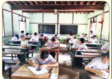
မွန်ပြည်နယ် သံဖြူဇရပ်မြို့၌ ဒုတိယနေ့ အင်္ဂလိပ်စာဘာသာရပ် ကျောင်းသား ကျောင်းသူများ အေးချမ်းစွာဖြေဆိုကြစဉ်။ မြို့နယ်(ပြန်/ဆက်)