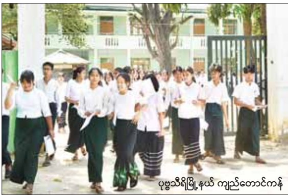
ပုဗ္ဗသီရိမြို့နယ် ကျည်တောင်ကန်

ထိုသို့ကျောင်းသား ကျောင်းသူများ ၂၀၂၃-၂၀၂၄ ပညာသင်နှစ် တက္ကသိုလ်ဝင်စာမေးပွဲ မြေဆိုနေမှုများကို နေပြည်တော်ကောင်စီဥက္ကဋ္ဌ၊ သက်ဆိုင်ရာ တိုင်းဒေသကြီးနှင့် ပြည်နယ်များမှ တာဝန်ရှိသူများက သွားရောက်ကြည့်ရှုအားပေးခဲ့ကြကြောင်း သတင်းရရှိသည်။ သတင်းစဉ်