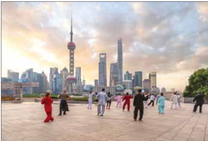
ရန်ကင်းမြို့ အများပြည်သူအပန်းဖြေနေရာတစ်ခု၌ ထိုက်ကျိုအားကစားနည်းဖြင့် နံနက်ခင်းကိုယ်လက် လှုပ်ရှားလေ့ကျင့်ခန်း ပြုလုပ်နေကြသူများ။

“လေကောင်းတွေရှုရှုကြည့်သဘာဝကိုခိုခိုကြည့် ဒီနေ့သစ်ဟာ။ တို့ကိုအောင်မြင်မှုအသစ်တွေ၊ ပေးလာမယ်” နိုင်ငံကျော်တေးသံရှင် စိုင်းထီးဆိုင်း၏ “နေ့သစ်” သီချင်းကို ဖျတ်ခနဲသတိရလိုက်သည်။ နံနက်ခင်းလေကောင်းလေသန့်တွေကို ရှုရှုကြည့်ခြင်း၊ ရန်ကုန်မြို့ကြီးမနီးထခင်၊ ကားသံ၊ လူသံများကင်း ဆိတ်ချိန်၊ ကျေးဇူးတော်တော်တော်အတွင်း ပင်ကို ပြုကတော့ သဘာဝကို သူ့သဘာဝအတိုင်း ရှုမြင် ခံစားလိုက်ရသည့်အခိုက်တွင် နေ့သစ်သည် ကျန်တော်တို့ကို အောင်မြင်မှုအသစ်များ မွေးဖွား ပေးခဲ့ပါသည်။