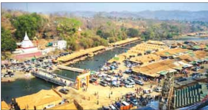
ကာလတွင် အငြိမ့်ပွဲ၊ စာတ်ပွဲနှင့် လည်း နေ့စဉ်လာရောက်ဖူးမြော် လျက်ရှိသည်။ တေးသီချင်း ဖျော်ဖြေပွဲများ ကြည့်ညိုကြည့်ညို ဘုရားဖူး မင်းဘူးမြို့တွင် ရှင်ပင် ထည့်သွင်းကျင်းပခြင်းမရှိသော် ညွှတ်သည့်များဖြင့် အမြဲစည်ကား စက္ကနီးတဲဘုရား၊ နဂါးပွက်တောင်