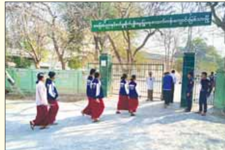
မြစ်သားမြို့နယ်ရှိ စာစစ်ဌာနသုံးခု၌ တက္ကသိုလ်ဝင်စာမေးပွဲ ဝင်ရောက်ဖြေဆိုသူ ၄၃၃ ဦးရှိရာ ဒုတိယနေ့အင်္ဂလိပ်စာဘာသာရပ်တွင် လာရောက်ဖြေဆိုကြသည့် ကျောင်းသား ကျောင်းသူများကို ဝါဝါမြင့်(မြစ်သား)