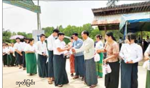
ဘုတ်ပြင်း