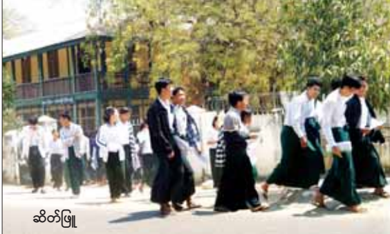
ဆိတ်မြို့