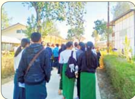
ချင်းပြည်နယ် တီးတိန်မြို့၌ ဒုတိယနေ့ အင်္ဂလိပ်စာဘာသာရပ် လာရောက်ဖြေဆိုကြသည့် ကျောင်းသား ကျောင်းသူများကို တွေ့ရစဉ်။ မိုးမိုး